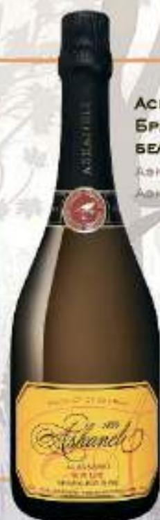
АСКАНЕЛИ БРЮТ БРАТЬЯ АСКАНЕЛИ БЕЛОЕ БРЮТ ASCANELLI BRUT ASCANELLI BROTHERS