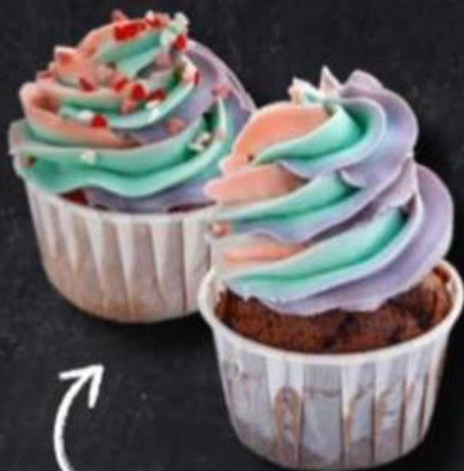
КАПКЕЙКИ В АССОРТИМЕНТЕ ( уточняйте у официанта ) 130г 170₽