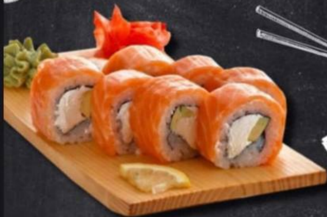
ФИЛАДЕЛЬФИЯ ЛЮКС 385₽