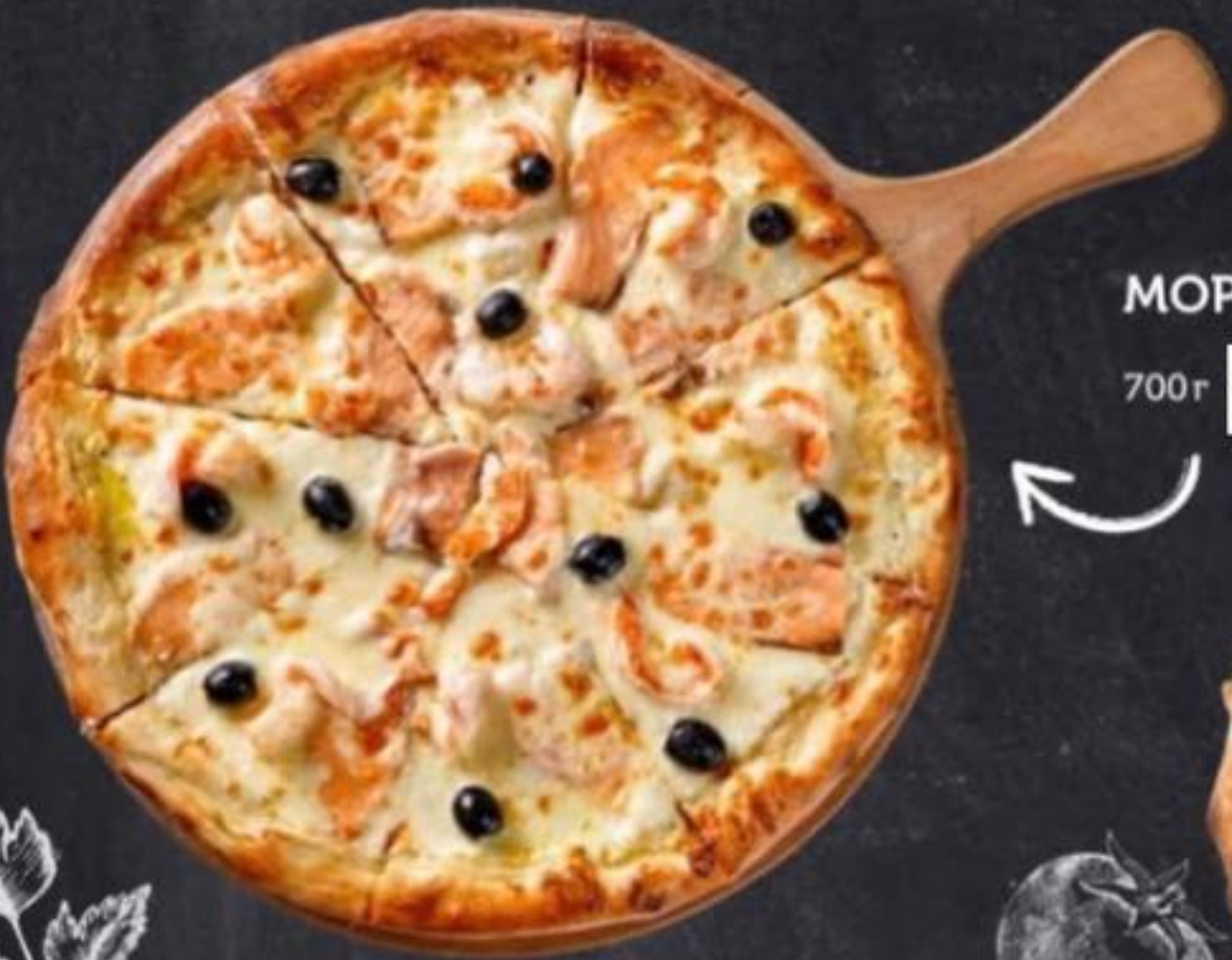
МОРСКАЯ 700г 635₽