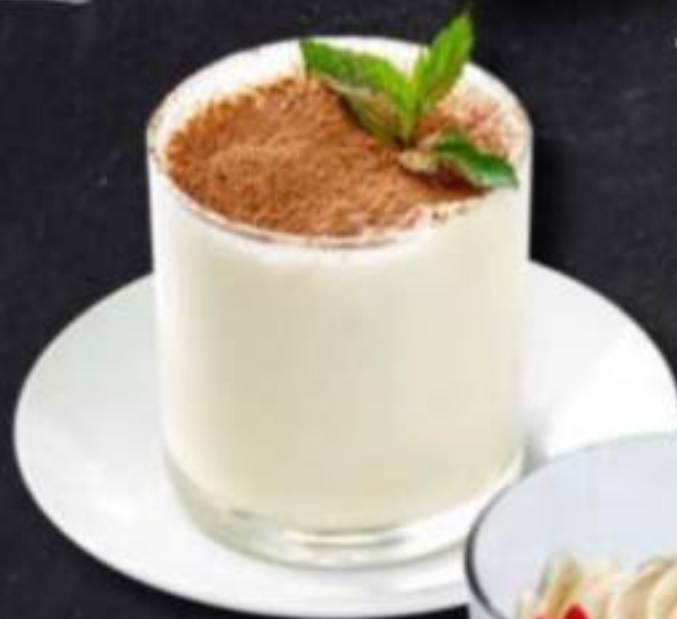
ТИРАМИСУ 240г 265₽