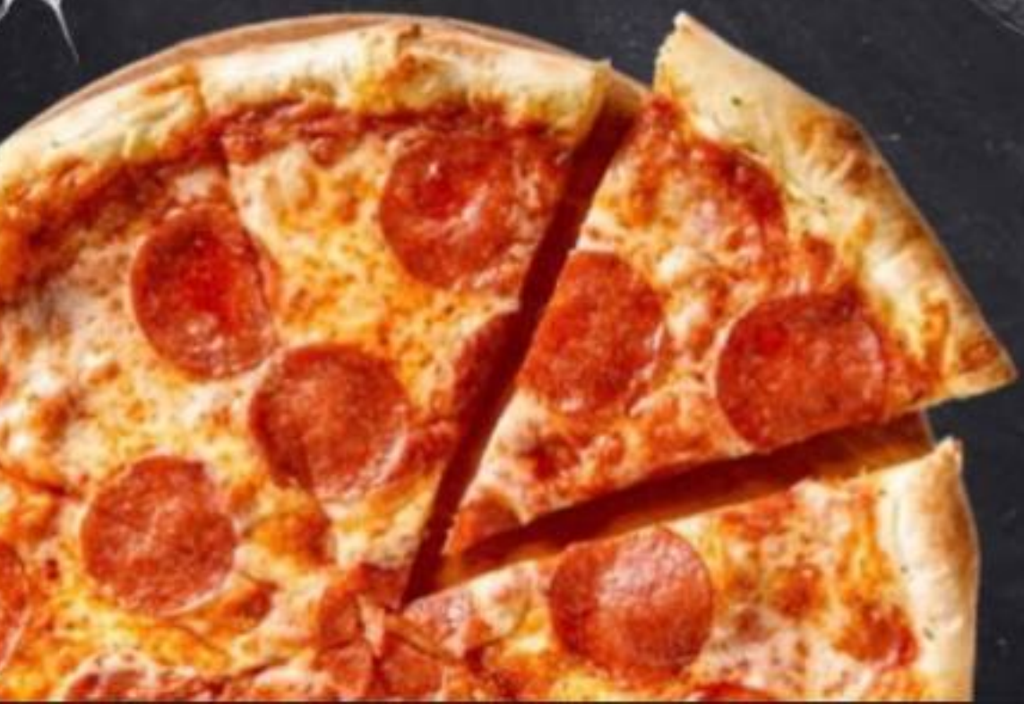
ПЕППЕРОНИ 680г 535₽