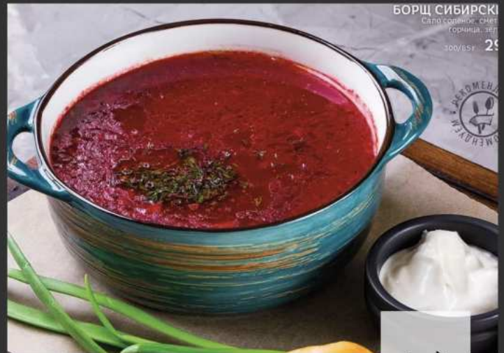
БОРЩ СИБИРСКИЙ Сало свиное, сметана, горчица, лимон 300/65г 290