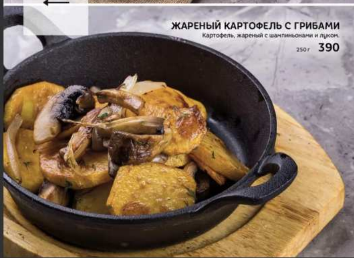
ЖАРЕННЫЙ КАРТОФЕЛЬ С ГРИБАМИ Картофель, жареный с шампиньонами и луком 250г 390