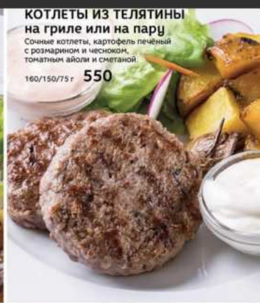
КОТЛЕТЫ ИЗ ТЕЛЯТИНЫ на гриле или на пару

Сочные котлеты, картофель печёный с розмарином и чесноком, томатным айюли и сметаной. 150/75г 490