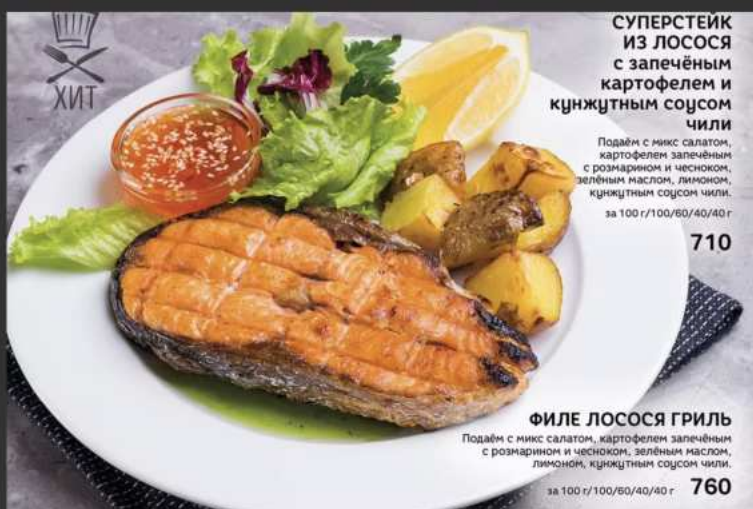
СУПЕРСТЕЙК ИЗ ЛОСОСЯ с запечённым картофелем и кунжутным соусом чили

Подаём с микс салатом, картофелем запечённым с розмарином и чесноком, зелёным маслом, лимоном, кунжутным соусом чили. за 100 г/100/60/40/40 г 710 ФИЛЕ ЛОСОСЯ ГРИЛЬ Подаём с микс салатом, картофелем запечённым с розмарином и чесноком, зелёным маслом, лимоном, кунжутным соусом чили. за 100 г/100/60/40/40 г 760