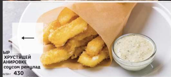
РЫБ ХРУСТЯЩЕЙ АНИРОВКЕ соусом ремулад