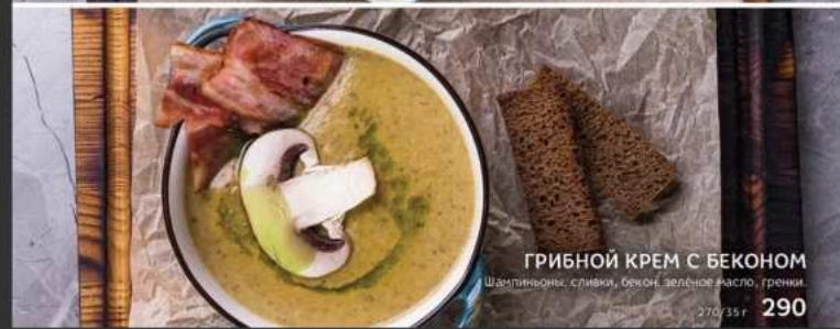
ГРИБНОЙ КРЕМ С БЕКОНОМ Шампиньоны, сливки, бекон, зеленое масло, гречки 270/35г 290