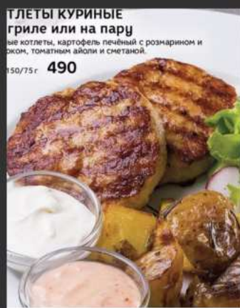
КОТЛЕТЫ КУРИНЫЕ на гриле или на пару

Сочные котлеты, картофель печёный с розмарином и чесноком, томатным айюли и сметаной. 150/75г 490