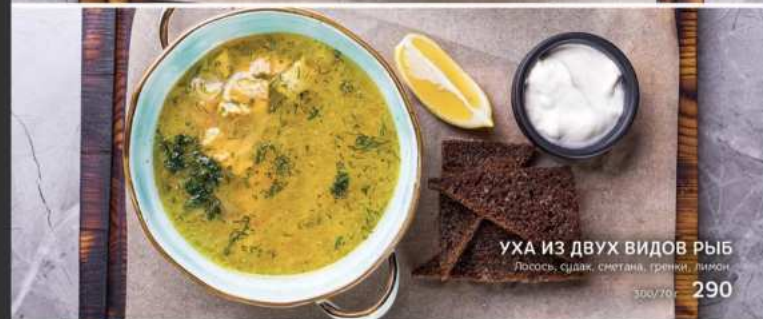
УХА ИЗ ДВУХ ВИДОВ РЫБ Лосось, судак, сметана, гречки, лимон 300/70г 290