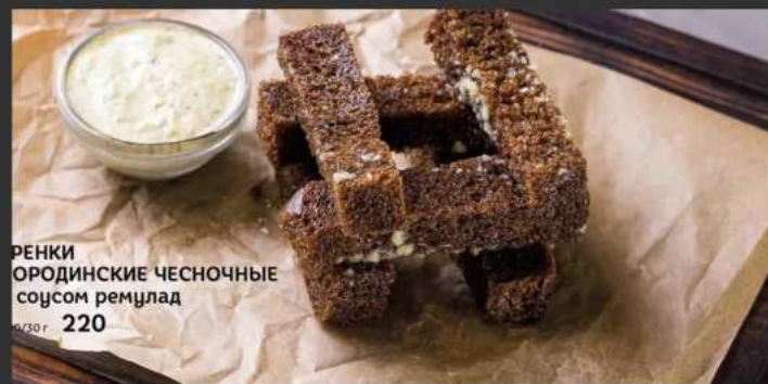
РЕНКИ ОРОСИНСКИЕ ЧЕСНОЧНЫЕ соусом ремулад