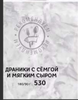
ДРАНИКИ С СЁМГОЙ И МЯГКИМ СЫРОМ