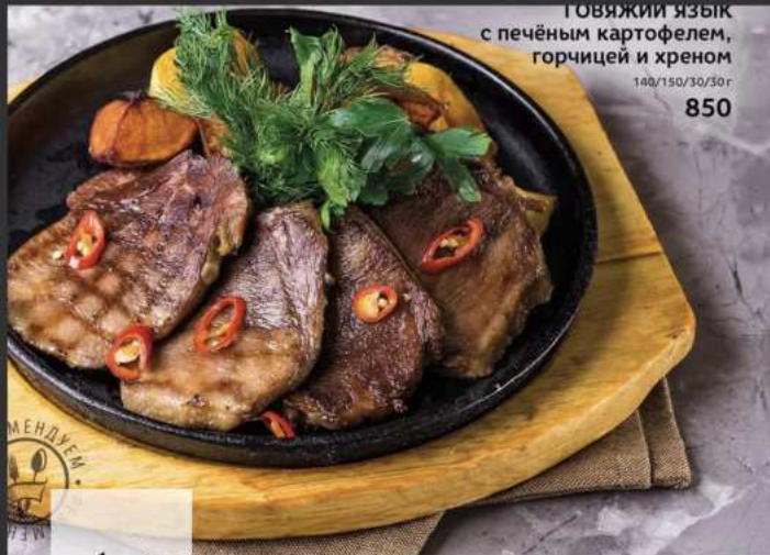
ГОВЯЖИЙ ЯЗЫК с печёным картофелем, горчицей и хреном 140/150/30/30г 850