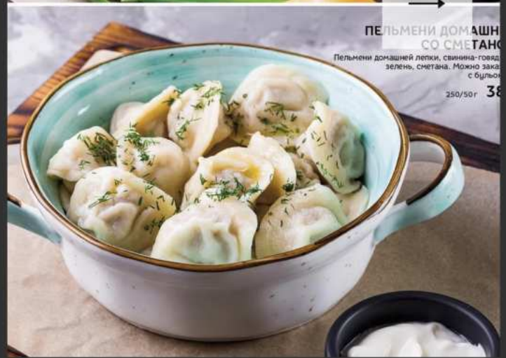
ПЕЛЬМЕНИ ДОМАШНИЕ СО СМЕТАНОЙ Пельмени домашней лепки, свинина-говядина, зелень, сметана. Можно заказать с бульоном 250/50г 380