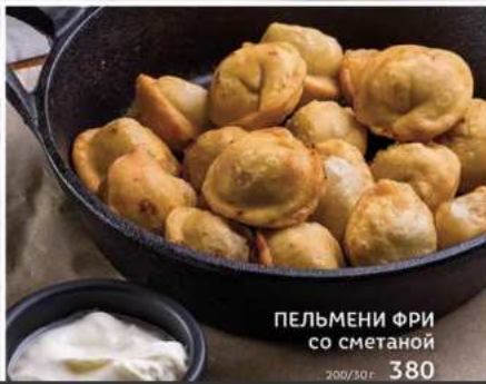
ПЕЛЬМЕНИ ФРИ со сметаной