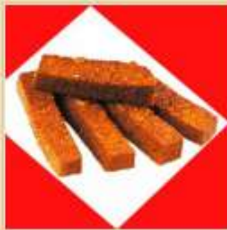
Гренки с чесноком