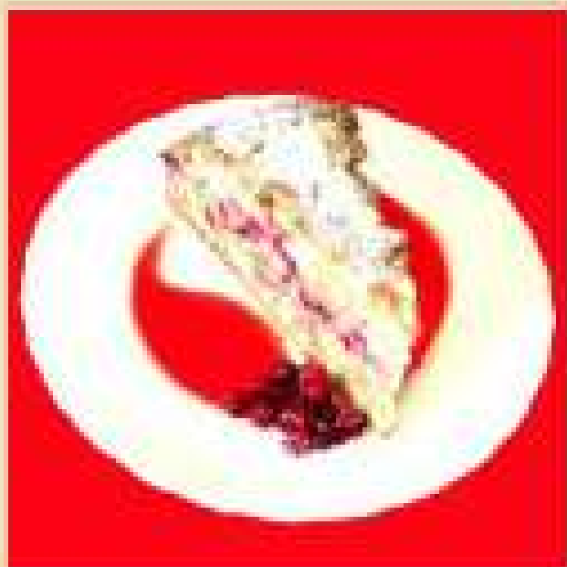
Шарлотка с яблоками и брусникой