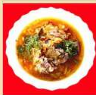
Мастава из говядины