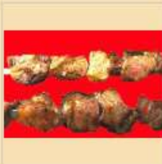
Шашлык, жареный на углях