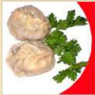
Манты из говядины