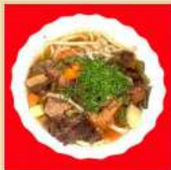
Лагман из говядины