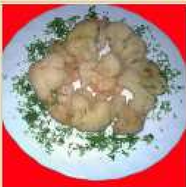
Калуста цветная с сыром