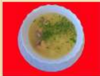
Уха из двух видов рыб