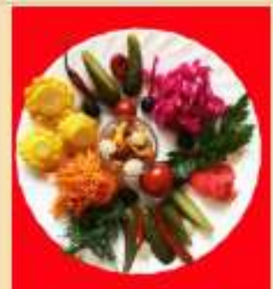
"Разносол из погребка"