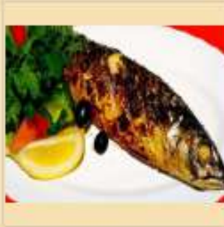
Скумбрия на гриле