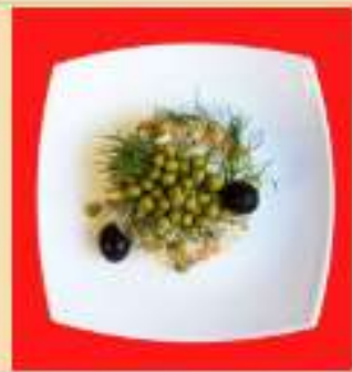
Салат "Мастроо Оливье"