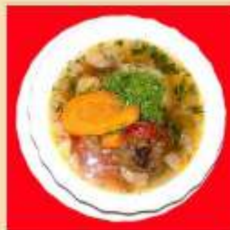
Шурпа из говядины