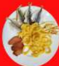
"Ассорти к пиву"