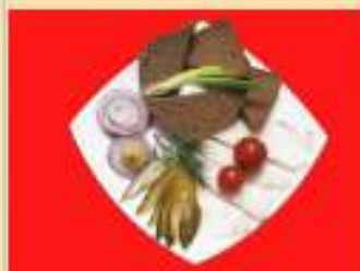
"Сало под водочку"