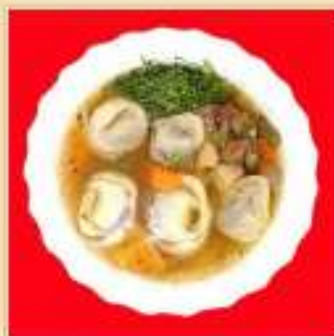
Чучвара из говядины