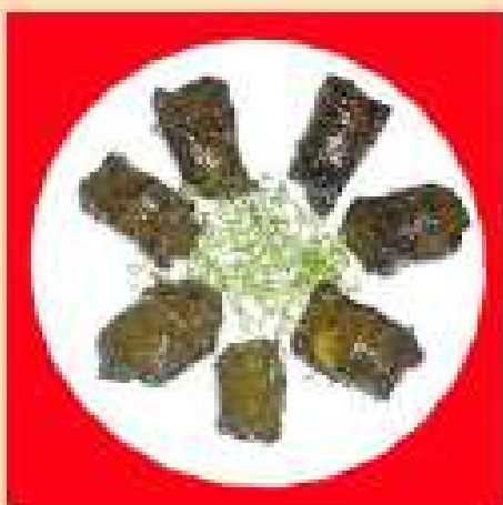
Долма из говядины