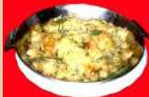
Картофель запеченный с сыром