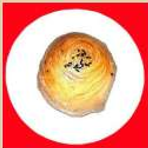
Самса из говядины