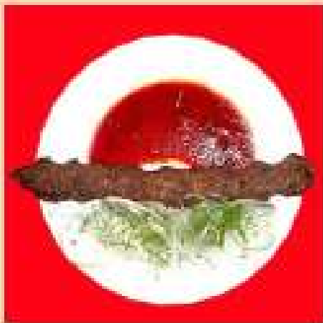
Люля-Кебаб из баранины