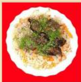
Плов из говядины