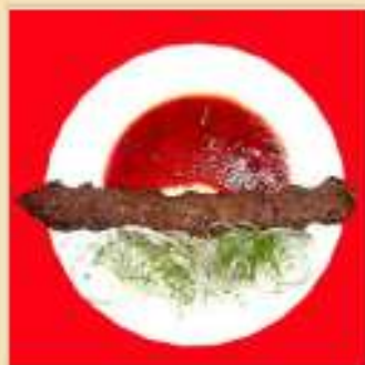
Люля-Кебаб из курицы