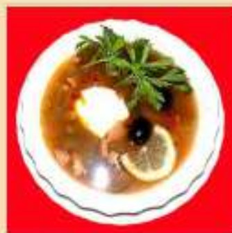
Солянка сборная мясная