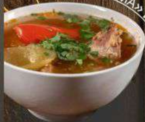
«ХАШЛАМА» ИЗ ГОВЯДИНЫ