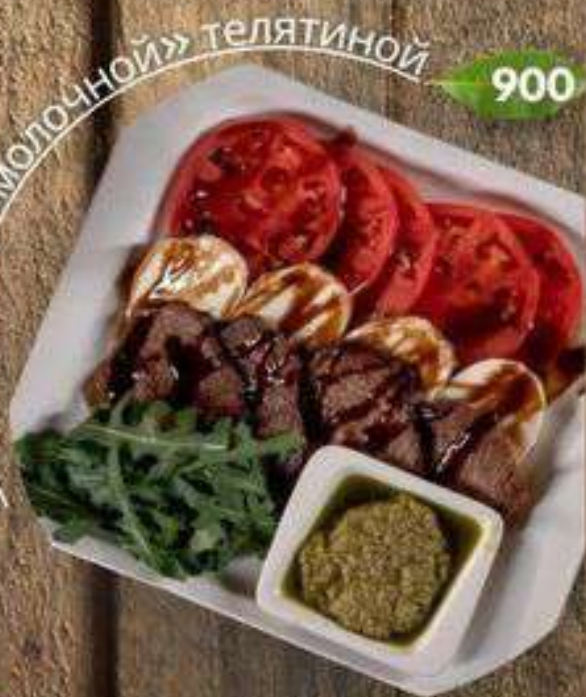
«КАПРЕЗЕ» С «МОЛОЧНОЙ» ТЕЛЯТИНОЙ