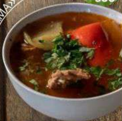
«ХАШЛАМА» ИЗ БАРАНИНЫ