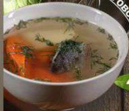
«УХА» ИЗ ФОРЕЛИ С ОВОЩАМИ