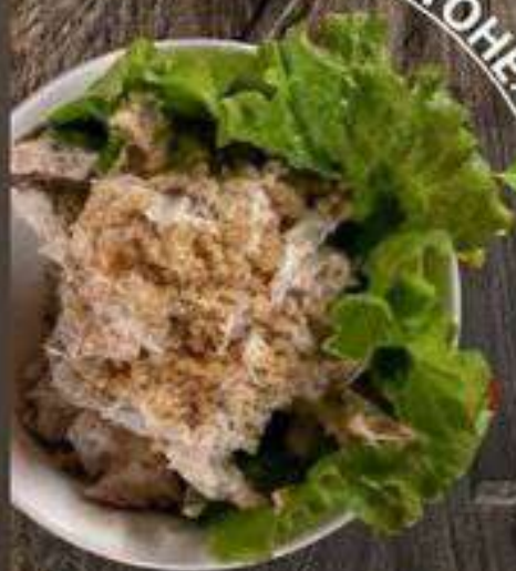
«ЯЗЫК В ЦЕХТОНЕ»