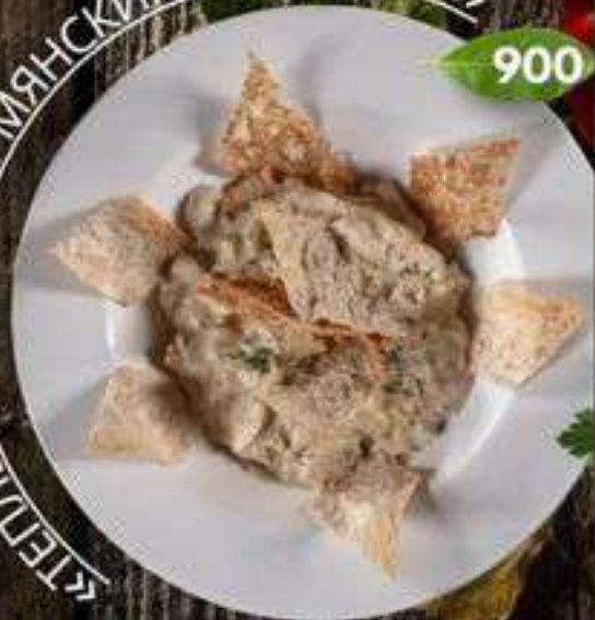
«ТЕПЛЫЙ САЛАТ С АРМЯНСКИМ ПАВАШОМ»