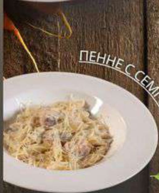
ПЕННЕ С СЕМГОЙ