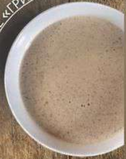
«ФИНСКИЙ РЫБНЫЙ СУП»