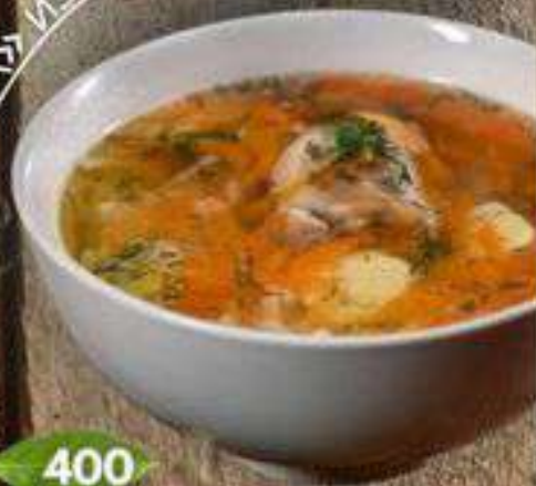
«СУП-ЛАПША» ИЗ ДОМАШНЕЙ КУРИЦЫ