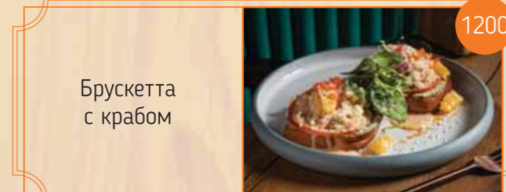
Брускетта с крабом