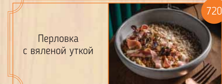
Перловка с вяленой уткой