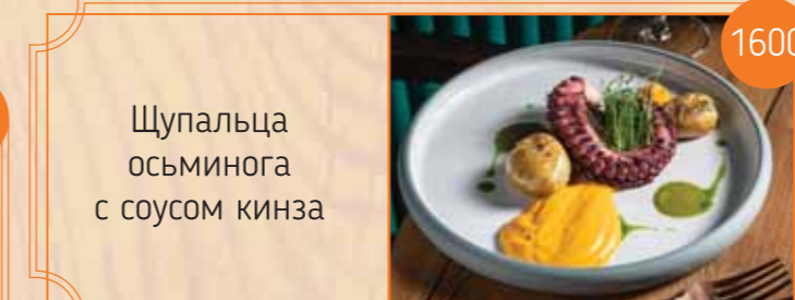
Щупальца осьминога с соусом кинза