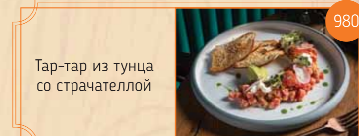
Тар-тар из тунца со страчателлой