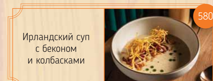
Ирландский суп с беконом и колбасками