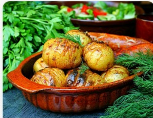
Картофель молодой на мангале

Картофель молодой приготовленный на углях.