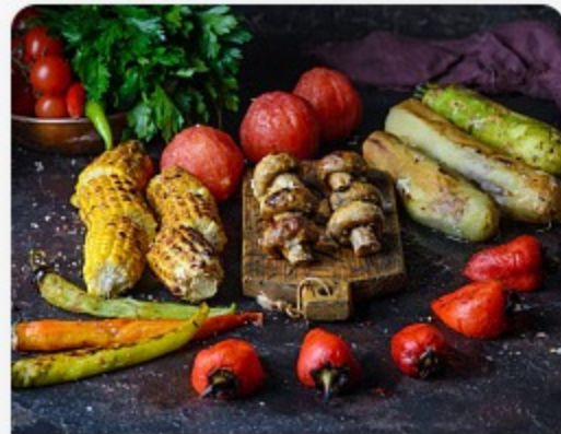
Овощи на мангале