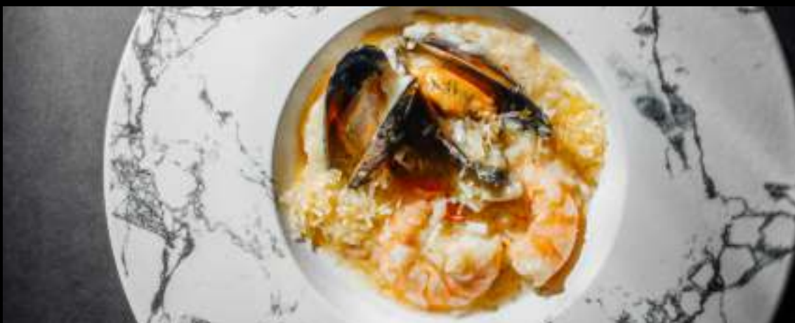
РИЗОТТО С МОРЕПРОДУКТАМИ