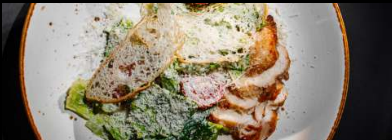
ЦЕЗАРЬ С КУРИЦЕЙ