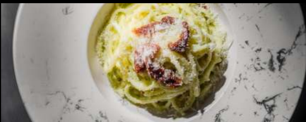
ПАСТА С СОУСОМ ПЕСТО