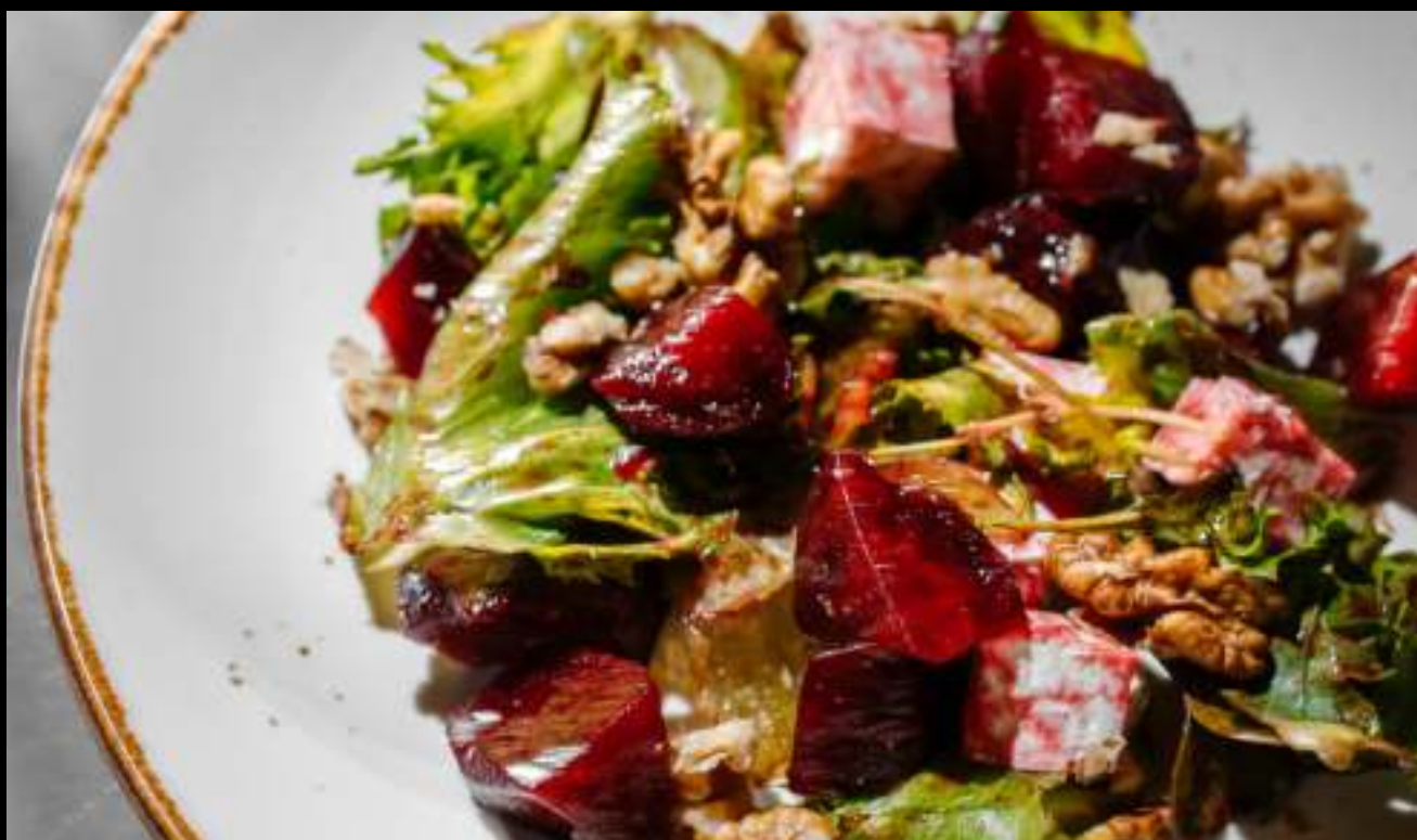
САЛАТ СО СВЕКЛОЙ, ФЕТОЙ И ГРЕЦКИМ ОРЕХОМ