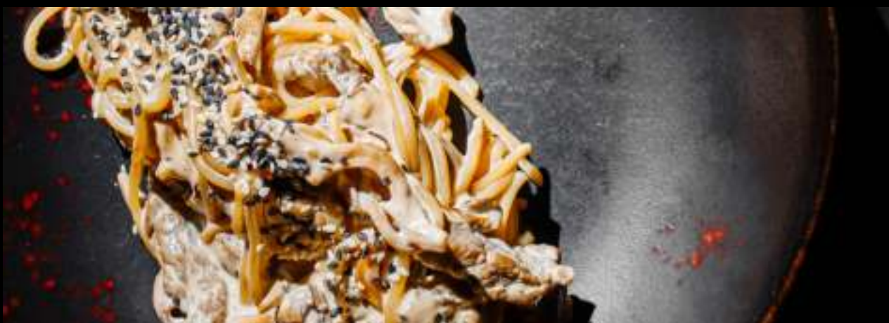
ПЕРЕЧНАЯ ПАСТА С ГОВЯДИНОЙ