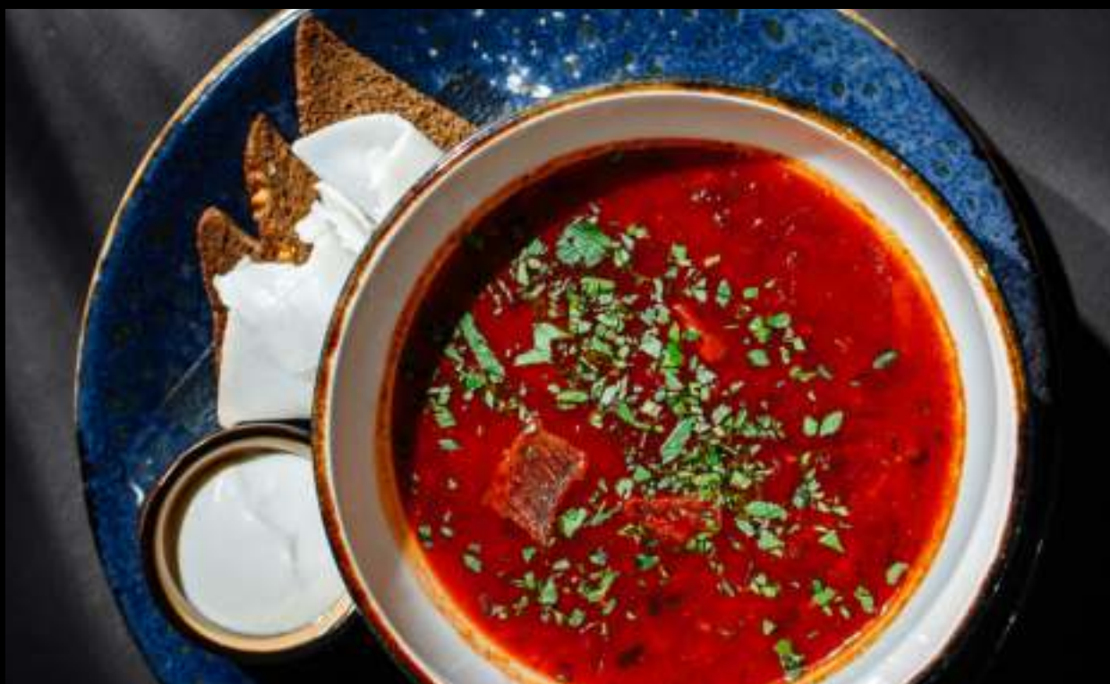
БОРЩ С ЩЕЧКАМИ, ДОМАШНИМ САЛОМ И СМЕТАНОЙ