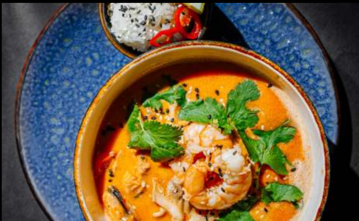
ТОМ ЯМ С МОРЕПРОДУКТАМИ