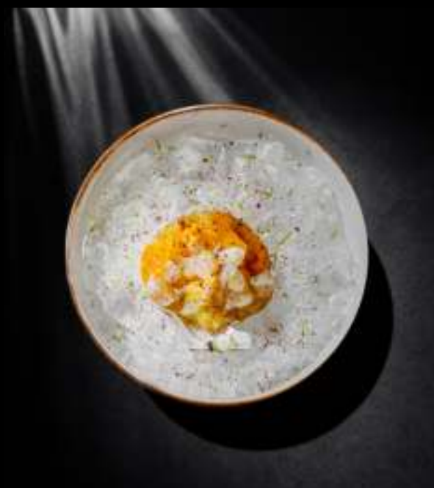
ТАРТАР ИЗ МУРМАНСКОГО ГРЕБЕШКА 560 ₺