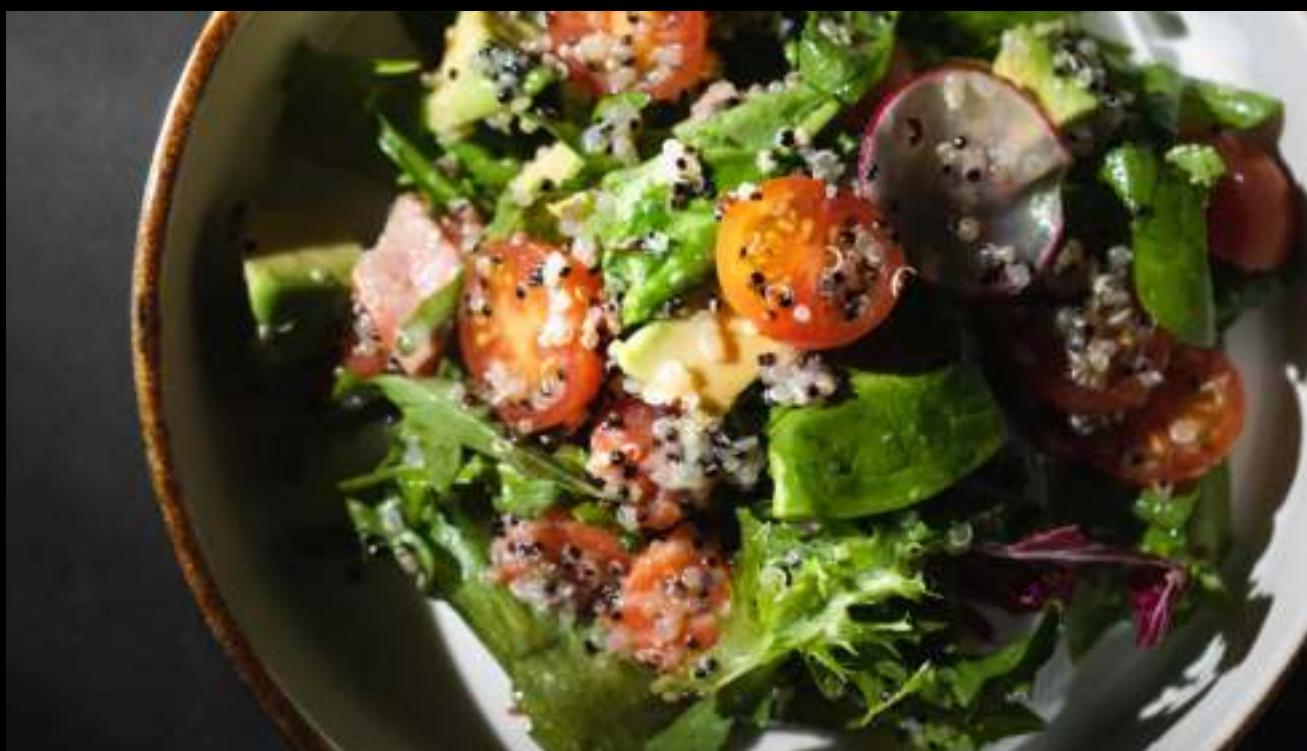
САЛАТ С ЛОСОСЕМ, КИНОА И ЦИТРУСОВОЙ ЗАПРАВКОЙ