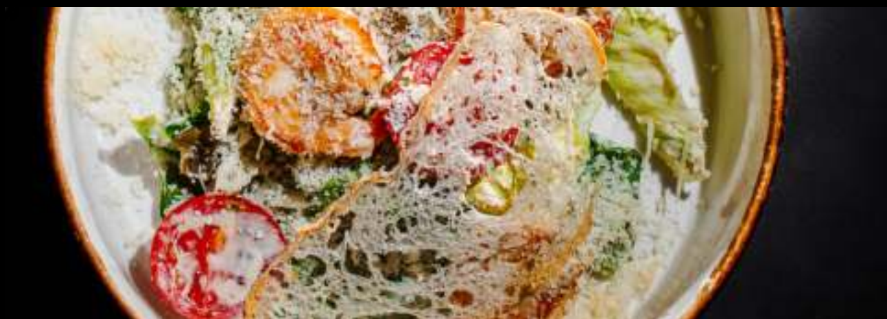
ЦЕЗАРЬ С КРЕВЕТКОЙ