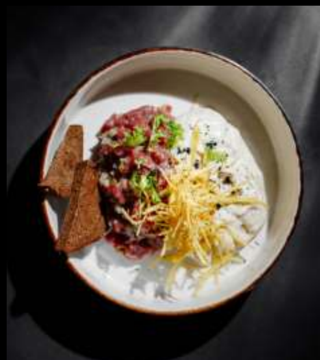
ТАРТАР ИЗ ГОВЯДИНЫ 690 ₺