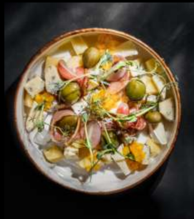
ВИННЫЙ СЕТ 1 370 ₺

хлеб, свежий огурец, ростбиф, лук фри и соус унаги