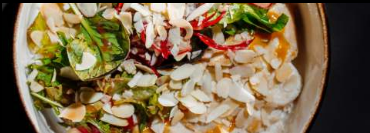
САЛАТ С КУРИЦЕЙ СУ-ВИД И МАНГО