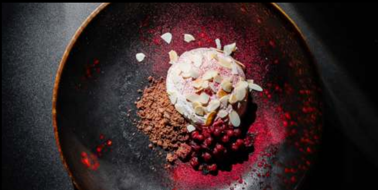
ШОКОЛАДНЫЙ ГАНАШ С КАРАМЕЛЬНЫМ МУССОМ И БРУСНИКОЙ