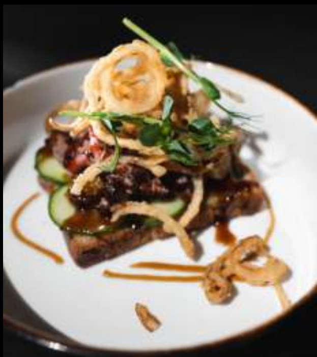
БРУСКЕТТА С РОСТБИФОМ И ЛУКОМ ФРИ 350 ₺

хлеб, свежий огурец, ростбиф, лук фри и соус унаги