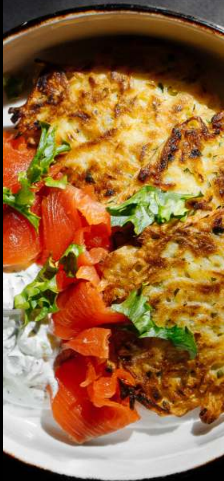
ДРАНИКИ С ЛОСОСЕМ И СОУСОМ ТАРТАР