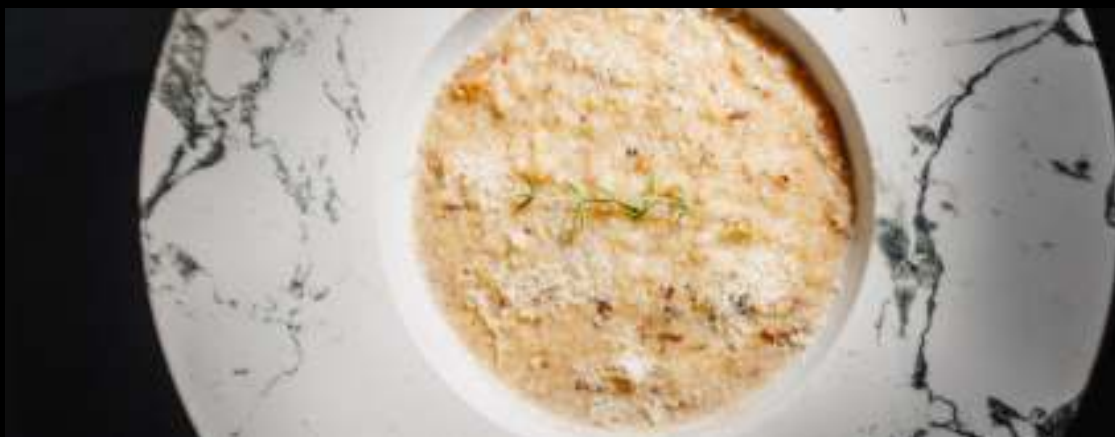
РИЗОТТО С БЕЛЫМИ ГРИБАМИ