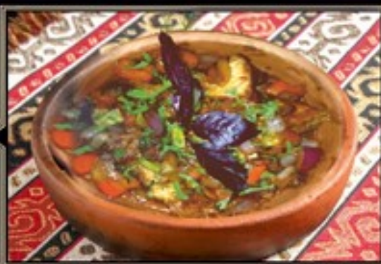
КРОЛИК ТУШЕНЫЙ С ОВОЩАМИ 300 г 750 руб.