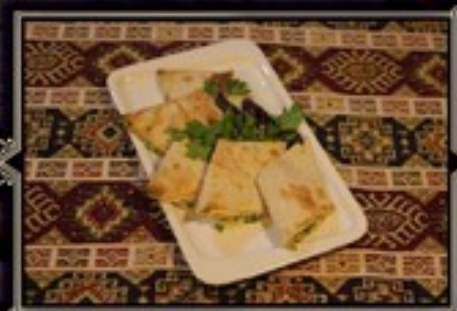
ПЕЧЕНЫЙ ЛАВАШ С СУЛУГУНИ И КИНЗОЙ 200 г 310 руб.