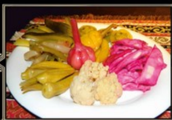
АССОРТИ «ДАРЫ АРМЕНИИ» 400 г 470 руб. Мариннованные чеснок, бутень, огурцы, перец цизак, капуста по-грузински, соленые зеленые помидоры, цветная капуста