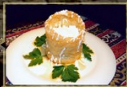
САЛАТ «КАВКАЗСКАЯ ПЛЕННИЦА» 220 г 450 руб.

Лобно с отварной говядиной и овощами с масляной заправкой