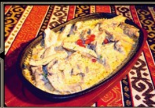
ЯЗЫК ПО-АРМЯНСКИ 250 гр 690 руб. с картофелем