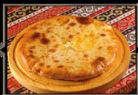
ХАЧАПУРИ ИМЕРЕТИНСКИЙ 350 г 390 руб. 700 г 750 руб.