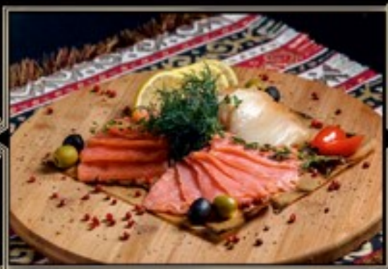
АССОРТИ РЫБНОЕ 150/60 г 950 руб.

Отварной говяжий язык, нежный рулет из мяса птицы, ростбиф из телячьей вырезки, буженина в пряных травах собственного приготовления