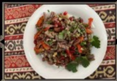
САЛАТ ТБИЛИСИ 200 390 руб.

Лобно с курицей и овощами с масляной заправкой и грецким орехом