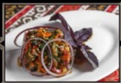
МАНГАЛ САЛАТ 200 гр 330 руб.

Салат из свежих овощей с эксклюзивной масляной заправкой