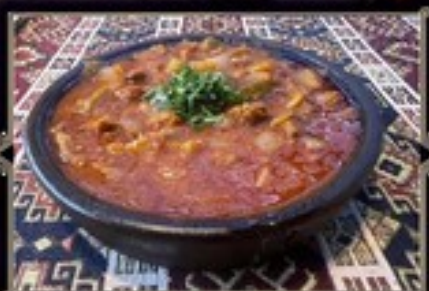
СОЛЯНКА 500 г 900 руб. ПО АРМЯНСКИ 250 г 450 руб.