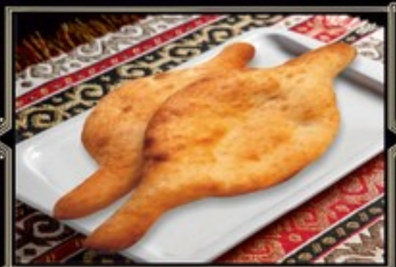
ХЛЕБ ШОТИ 1 шт. 90 руб.