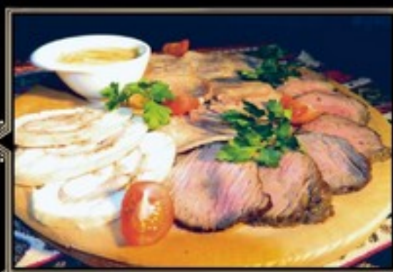
АССОРТИ МЯСНОЕ ПО-РУССКИ 240/30 г 950 руб.

Отварной говяжий язык, нежный рулет из мяса птицы, ростбиф из телячьей вырезки, буженина в пряных травах собственного приготовления