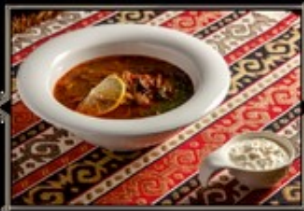
СОЛЯНКА МЯСНАЯ СО СМЕТАНОЙ 300/30 г 330 руб.