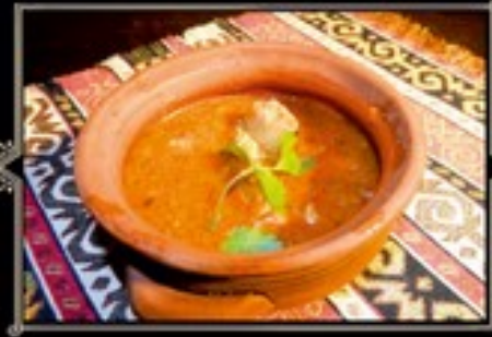
НАВАРИСТЫЙ ХАРЧО С ГОВЯДИНОЙ 300 гр 330 руб.