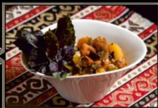
АДЖАПСАНДАЛ 300 г 390 руб.

Тушеные в собственном соку по традиционному рецепту баклажаны, болгарский перец, картофель и томаты с луком и с грузинскими пряностями