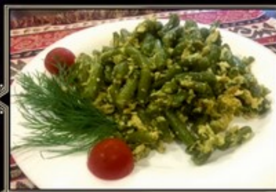
ФАСОЛЬ СТРУЧКОВАЯ 150 г 220 руб. обжаренная с яйцом и соусом мацони