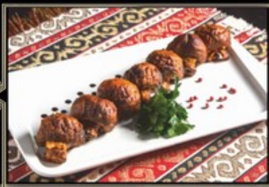
ШАМПИНЬОНЫ ЗАПЕЧЕННЫЕ НА УГЛЯХ 150 г 300 руб.