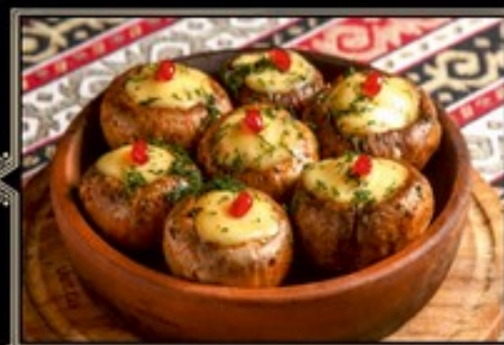
ШАМПИньОНЫ, ЗАПЕЧЕННЫЕ С СЫРОМ В КЕЦИ 180 г 420 руб.

Тушеные в собственном соку по традиционному рецепту баклажаны, болгарский перец, картофель и томаты с луком и с грузинскими пряностями