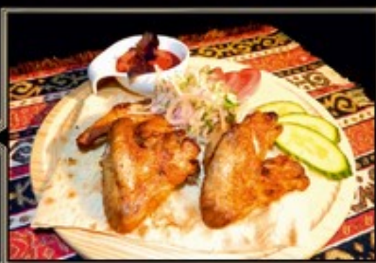
ШАШЛЫК ИЗ КУРИНЫХ КРЫЛЫШЕК 260/110/40 г 550 руб.