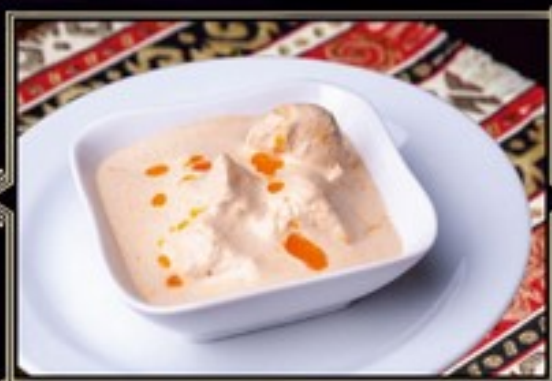
САЦИВИ 210 г 330 руб. Ореховый соус с отварной курицей