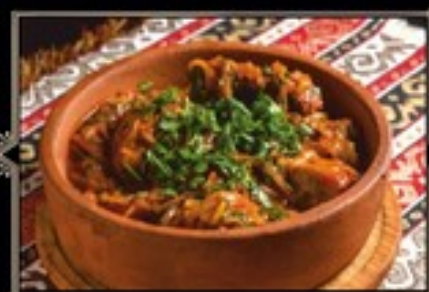
ЧАХОХБИЛИ 330 г 450 руб. Тушеная курица с грузинскими специями, томатами и луком