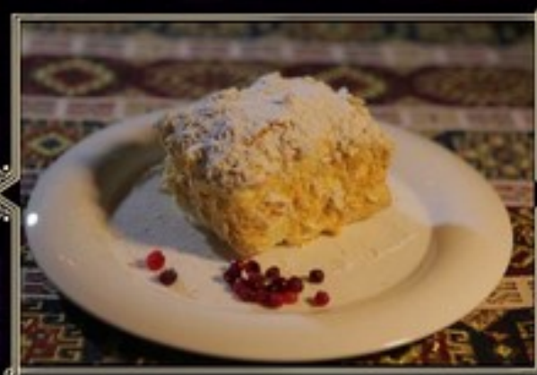
НАПОЛЕОН 150 г 250 руб.