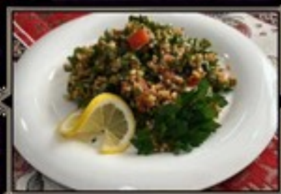
САЛАТ ТАБУЛЕ 220 350 руб.

Телячий язык с обжаренным куриным филе под сметанно-горчичным соусом с добавлением болгарского перца и маринованного огурца. Подается с тостами