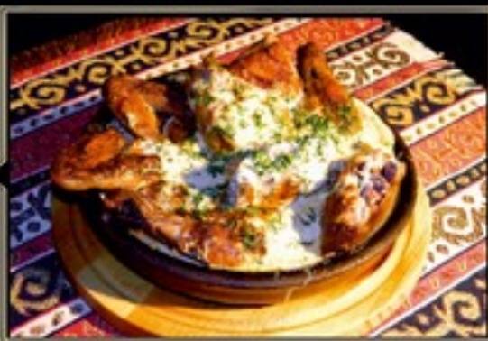
ЦЫПЛЕНОК ЧКЕМУРУЛИ 500 г 720 руб. в сливочно-чесночном соусе