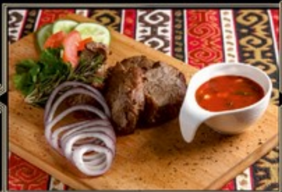
ШАШЛЫК 180/110/40 г 780 руб. ИЗ ТЕЛЯТИНЫ