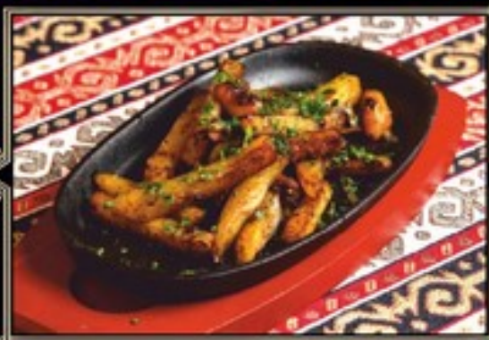
КАРТОФЕЛЬ ЖАРЕНый 150 г 170 руб.