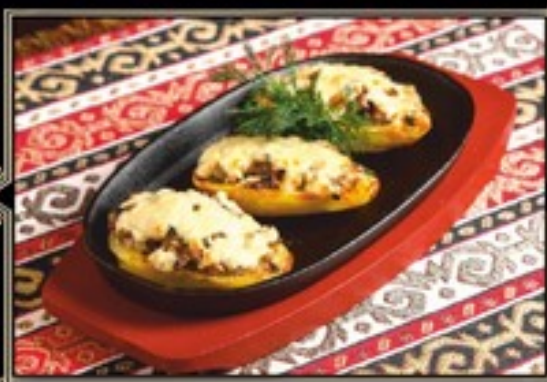
КАРТОФЕЛЬ ЗАПЕЧЕННЫЙ С ГРИБАМИ И СЫРОМ 200 г 300 руб.