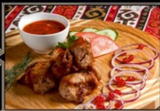
ШАШЛЫК 180/110/40 г 580 руб. ИЗ СВИНОЙ ШЕИ