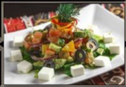
САЛАТ ГРЕЧЕСКИЙ 250 г 370 руб. легкий овощной салат с сыром фета, заправленный соусом песто