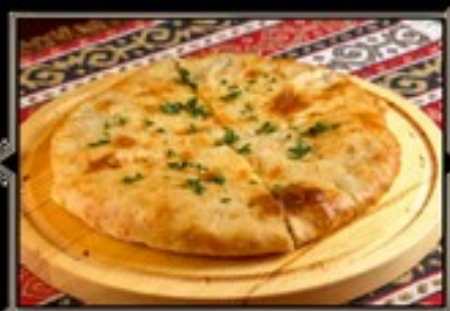
ХАЧАПУРИ С БАРАНИНОЙ 350 г 480 руб.