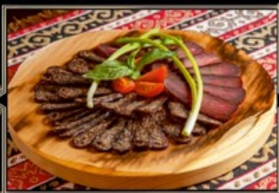
АССОРТИ МЯСНОЕ «АРМЕНИЯ» 100/40 г 630 руб.