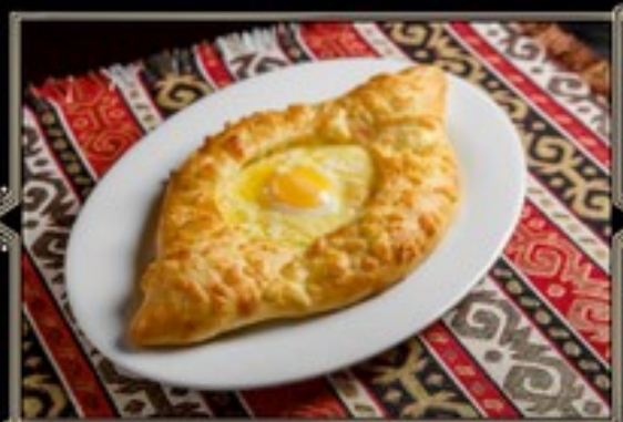
ХАЧАПУРИ АДЖАРСКИЙ 300 г 390 руб.