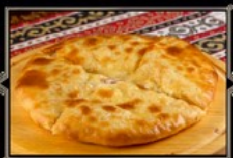
ХАЧАПУРИ С ЛОСОСЕМ 350 г 600 руб.