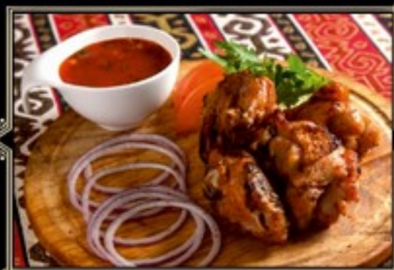
ШАШЛЫК ИЗ КУРИНОГО БЕДРА НА КОСТОЧКЕ 250/110/40 г 550 руб.