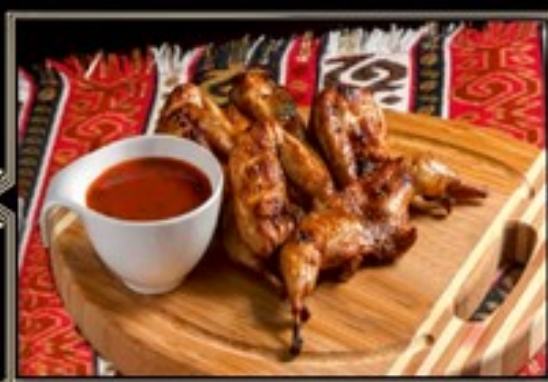
ПЕРЕПЕЛКА НА УГЛЯХ 1 шт/110/40 г 450 руб.