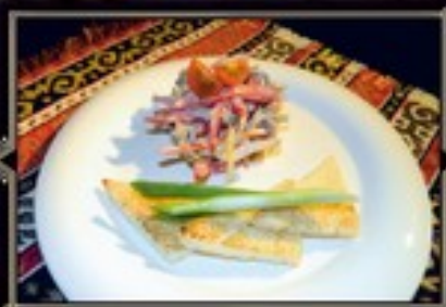
САЛАТ «ОГНИ КАВКАЗА» 200г 420 руб.

Обжаренные овощи с курицей под сметанным соусом в хрустящем лаваше