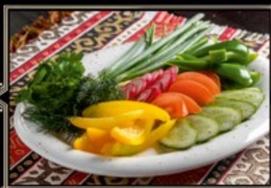
АССОРТИ СВЕЖИХ ФЕРМЕРСКИХ ОВОЩЕЙ 350г 380 руб.