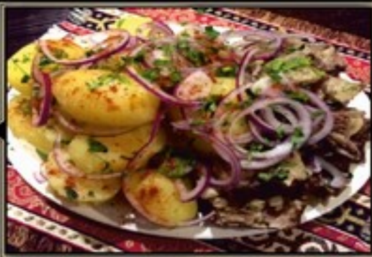
ХАШЛАМА Заказ от 4-х порций из говядины 500 г 780 руб. из баранины 500 г 850 руб. Время приготовления от 2-х часов