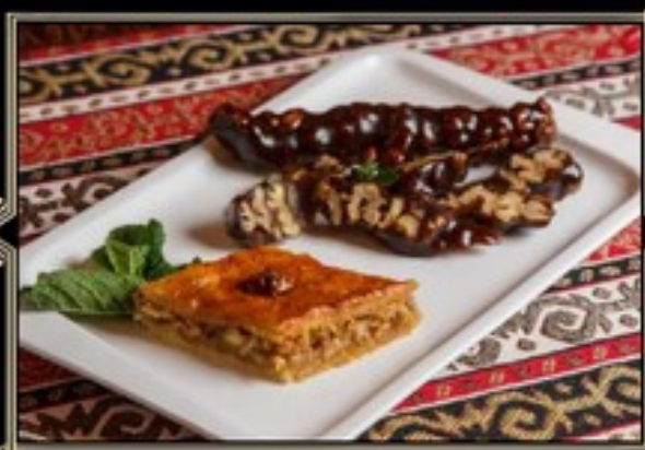
ПАХЛАВА ДОМАШНЯЯ 100 г 250 руб. ЧУРЧХЕЛЛА 100 г 250 руб.