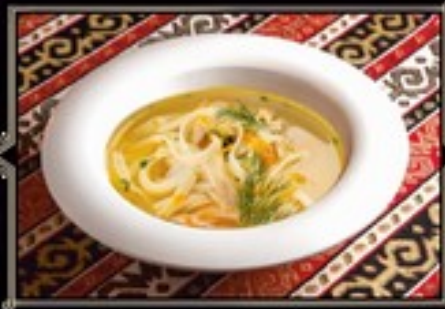
СУП КУРИНЫЙ С ДОМАШНЕЙ ЛАПШОЙ 300 г 220 руб.