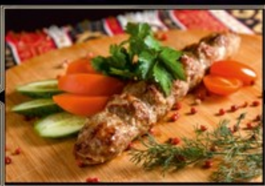
ЛЮЛЯ КЕБАБ ИЗ БАРАННЫ 150/110/40 г 550 руб.