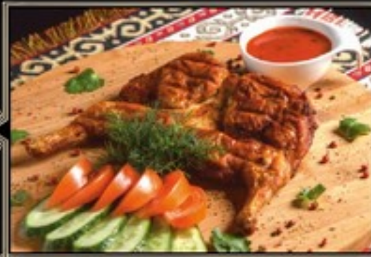
ЦЫПЛЕНОК ТАПАКА 500/110/40 г 680 руб. Маринованный цыпленок запеченный на гриле. Подается со свежими овощами