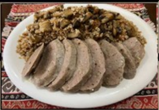
КЮФТА ТРАДИЦИОННАЯ 750 г 1200 руб. С КРУПОЙ АЧАР