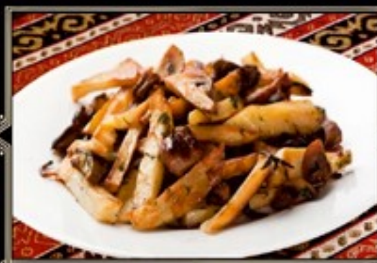
КАРТОФЕЛЬ ЖАРЕНый С ГРИБАМИ 150 г 200 руб.