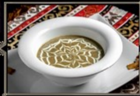
КРЕМ СУП ГРИБНОЙ 300/20 г 330 руб. С пшеничными гренками