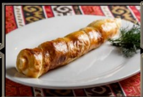
ХАЧАПУРИ НА ШАМПУРЕ 200 г 350 руб.