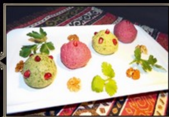
ПХАЛИ Ассорти 200 г 350 руб. Нежный мусс из грецких орехов со свеклой и шпинатом