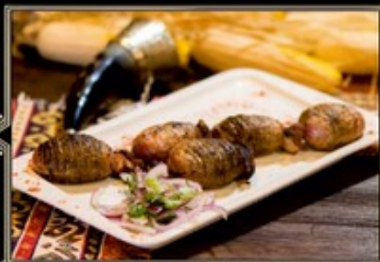
КАРТОФЕЛЬ ЗАПЕЧЕННЫЙ НА УГЛЯХ С САЛОМ 250 г. 210 руб.