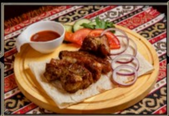
ШАШЛЫК 180/110/40 г 580 руб. ИЗ СВИННЫХ РЕБЕР