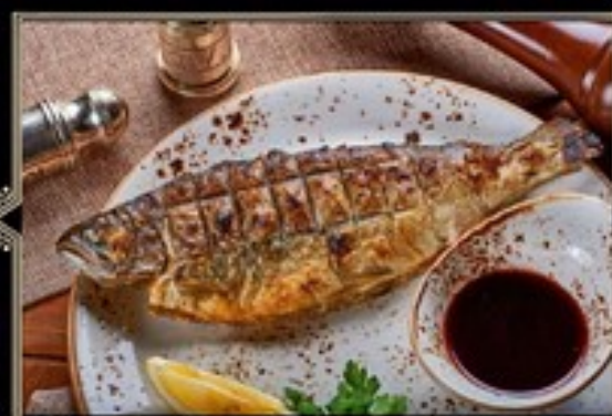
ФОРЕЛЬ РАДУЖНАЯ НА УГЛЯХ 200 г 790 руб. НА ПАРУ 200 г 790 руб.