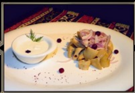
ГРУЗДИ В СМЕТАНЕ 100/40/30 г 550 руб. Хрустящие грибочки пряного посола