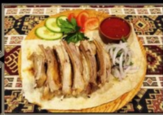
ШАШЛЫК-СЕМЕЧКИ 180/120 гр 680 руб. ИЗ БАРАНИНЫ