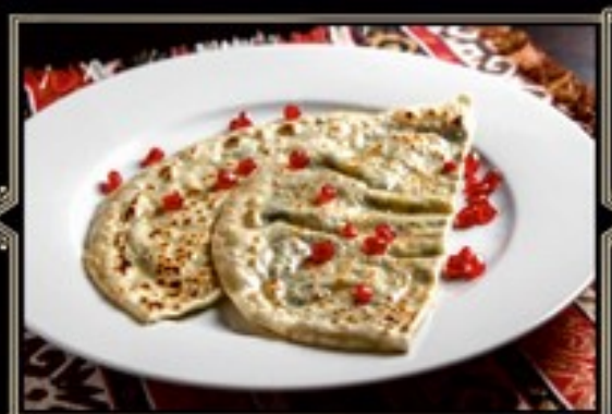
КУТАБЫ С сыром и зеленью 200 г 290 руб. С бараньей 200 г 320 руб. С говяжьей 200 г 320 руб.