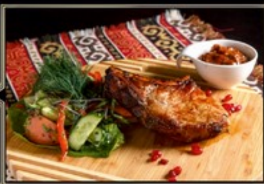
СВИНАЯ КОРЕЙКА НА УГЛЯХ за 100 г 300 руб.