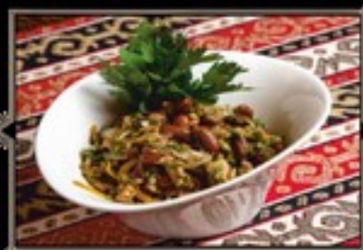
САЛАТ «ПЕСКИ» 210 гр 330 руб.

Обжаренные на углях баклажаны, сладкий болгарский перец, томаты, заправленные зеленью и маслом