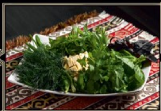
АССОРТИ СВЕЖЕЙ ЗЕЛЕНИ 150/100 г 530 руб. с домашней брынзой и сыром чечил