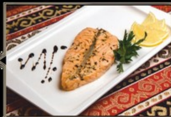
СТЕЙК ЛОСОСЯ на углях 100 г 600 руб. на пару 100 г 600 руб.