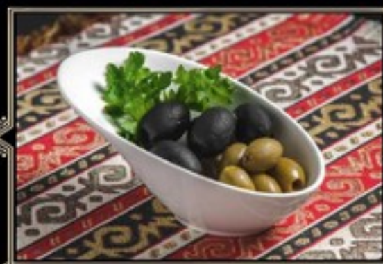
ГРЕЧЕСКИЕ МАСЛИНЫ, ОЛИВКИ 200 г 370 руб.