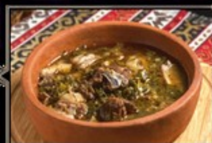
ЧАКАПУЛИ 300 г 560 руб. Томленое в белом вине мясо молодого барашка со свежими травами