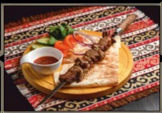
ШАШЛЫК 180/110/40 г 810 руб. ИЗ БАРАНИНЫ