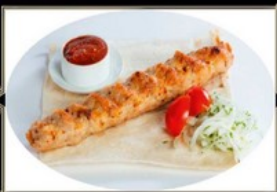
ЛЮЛЯ КЕБАБ ИЗ КУРИЦЫ 180/110/40 г 500 руб.