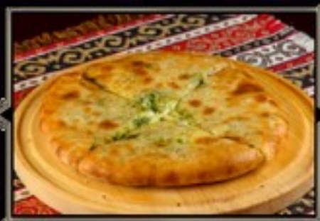
ХАЧАПУРИ С СЫРОМ И ШПИНАТОМ 350 г 390 руб.