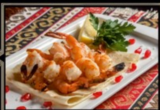
ТИГРОВЫЕ КРЕВЕТКИ ГРИЛЬ 100/45 г 650 руб.