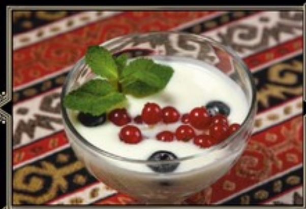
МАЦОНИ С ЯГОДАМИ 170 г 200 руб.