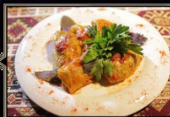
ГОЛУБЦЫ 300 г 390 руб. Классические голубцы из свежей капусты с фаршем из говядины и свинины.