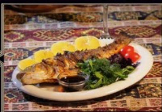
СИБАС НА УГЛЯХ 1 шт. 790 руб. СИБАС НА ПАРУ 1 шт. 790 руб.