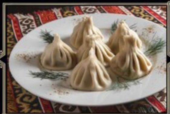
ХИНКАЛИ (Минимальный заказ от 3шт) С телятиной и свиной 1 шт 110 руб. С телятиной 1 шт 110 руб. С сыром и зеленью 1 шт 110 руб. С бараньей 1 шт 130 руб.