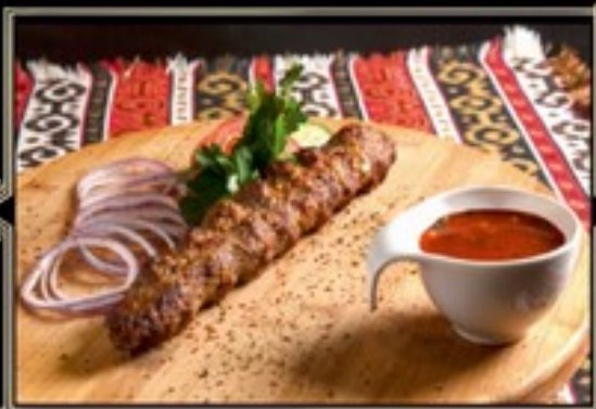
ЛЮЛЯ КЕБАБ ИЗ ТЕЛЯТИНЫ 180/110/40 г 500 руб.