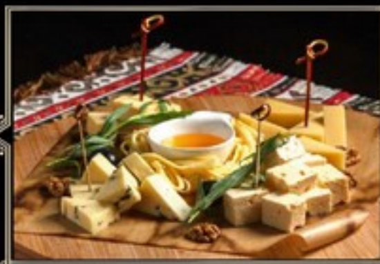
АССОРТИ СЫРНОЕ 300 г 750 руб.

Масляная рыба, лосось х/к, лосось собственного посола