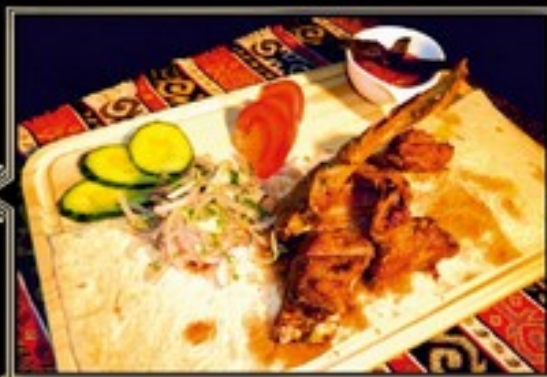
ШАШЛЫК 180/110/40 г 810 руб. ИЗ БАРАНИНЫ НА КОСТОЧКЕ