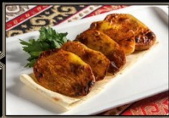
КАРТОФЕЛЬ ЗАПЕЧЕННЫЙ НА УГЛЯХ 150 г 170 руб.