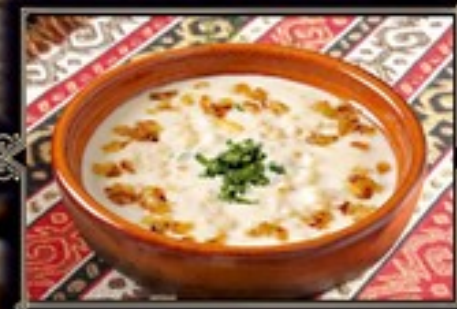
СПАС ПО-АРМЯНСКИ 300 г 200 руб. Кисломолочный суп на основе мацони