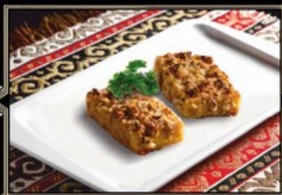
ЖАРЕННЫЙ СЫР СУЛУГУНИ С СОУСОМ НАРШАРАБ 150 гр 330 руб.