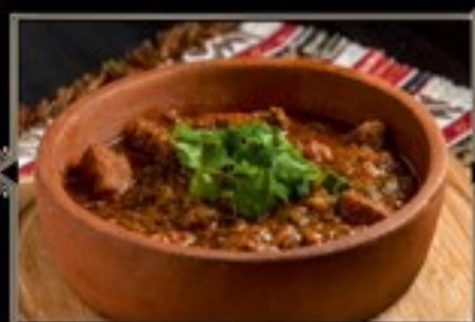
ЧАШУШУЛИ 270 г 480 руб. Национальное грузинское блюдо, приготовленное из говядины с тушеными овощами