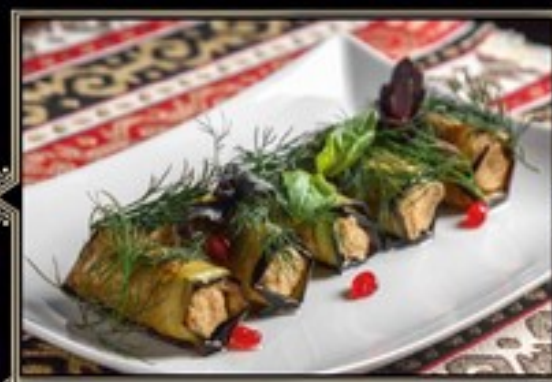
НЕЖНЫЕ РУЛЕТКИ ИЗ БАКЛАЖАНОВ 200 г 450 руб. с ореховой пастой