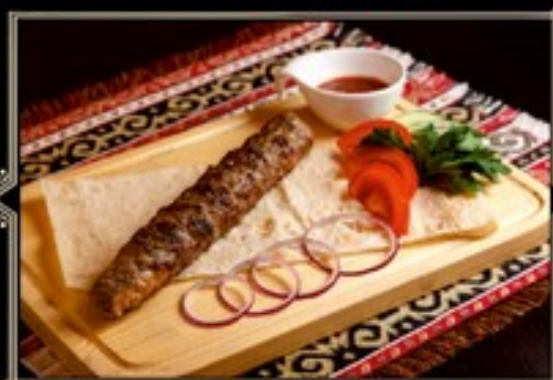
ЛЮЛЯ КЕБАБ ФИРМЕННЫЙ «КАВКАЗСКАЯ ПЛЕННИЦА» 180/110/40 г 500 руб.