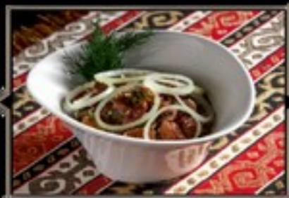
ЛОБИО 200 г 250 руб.

История появления блюда уходит корнями в глубокую древность. Существует великое множество приготовления Лобно. Предлагает оценить один из них.