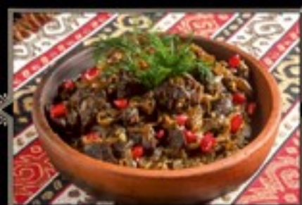
ТЖВЖИК 300 г 450 руб. Говяжий сердцев и печень, тушеные с кинзой и луком. Считается одним из любимых армянских блюд