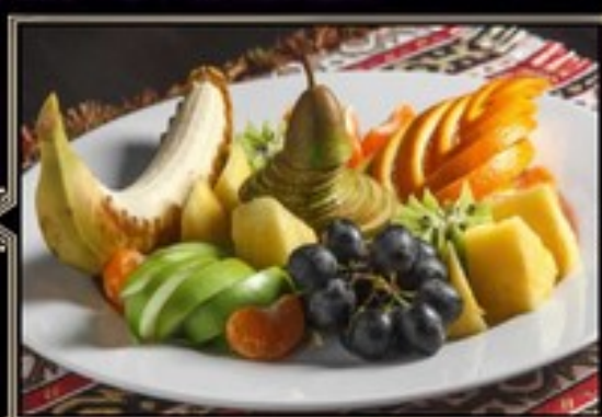
АССОРТИ ФРУКТОВОЕ 500 г 550 руб.