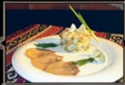
ОЛИВЬЕ ПО-ДОМАШНЕМУ с куриным рулетом 200 г 350 руб. с говяжьим языком 200 г 390 руб.