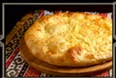
ХАЧАПУРИ МЕГРЕЛЬСКИЙ 350 г 390 руб. 700 г 750 руб.