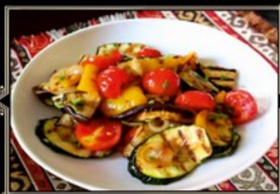
ОВОЩИ НА УГЛЯХ 220 г 350 руб. Баклажаны, цуккини, болгарский перец, томаты, красный лук