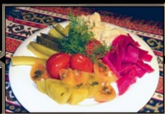
АССОРТИ ДОМАШНИХ СОЛЕНИЙ 500 г 470 руб.