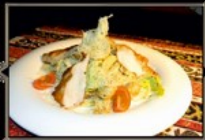
ЦЕЗАРЬ с куриной грудкой 200 г 420 руб. с тигровыми креветками 200 г 520 руб.