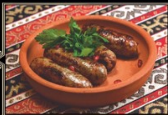
КУПАТЫ СВИНИНА-ГОВЯДИНА 270 г 550 руб.