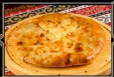
ХАЧАПУРИ С ТЕЛЯТНОЙ 350 г 430 руб.