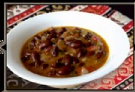
ЛОБИО 300/10 г 200 руб. Суп из красной фасоли с кинзой и чесноком