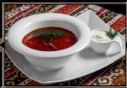
БОРЩ СО СМЕТАНОЙ 300/20 г 330 руб.