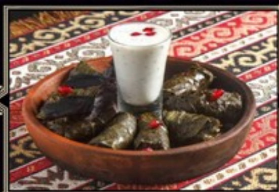
ДОЛМА 200 /40 г 420 руб. Фарш из говядины и свинины, завернутый в виноградные листья, подается с соусом «Мацони»