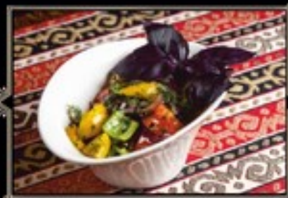
САЛАТ АРМЯНСКИЙ 250 г 300 руб.

История появления блюда уходит корнями в глубокую древность. Существует великое множество приготовления Лобно. Предлагает оценить один из них.