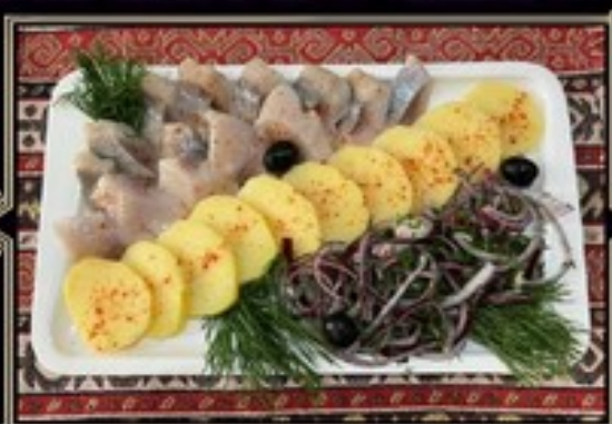
СЕЛЬДЬ С КАРТОФЕЛЕМ 300 г 350 руб.

сыр с голубой плесенью, пармезан, маасдам, сулугуни, брынза, мед, виноград, грецкий орех