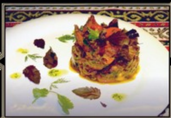
АДЖАПСАНДАЛ 200 г 350 руб. Обжаренные баклажаны с овощами и специями