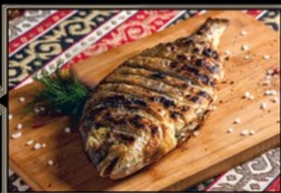
ДОРАДО НА УГЛЯХ 300 г 790 руб.