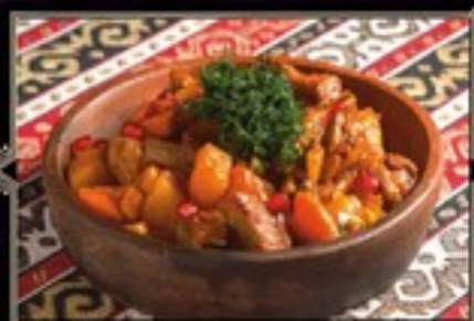
ОДЖАХУРИ 350 г 440 руб. Обжаренная маринованная свинина с картофелем и овощами с добавлением аджикки