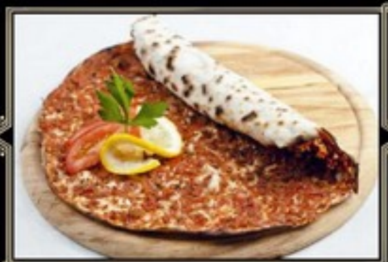
ЛАМАДЖИО с курицей 180/15 г 230 руб. с телятиной 180/15 г 230 руб. с бараньей 180/15 г 250 руб.