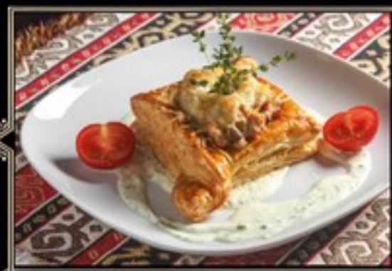
ЖЮЛЬЕН С МЯСОМ КУРЫ И ГРИБАМИ НА ВАЛОВАНЕ 220/30 г 440 руб. Мясо кури и шампиньоны тушеные в сливках под хрустящей корочкой сыра