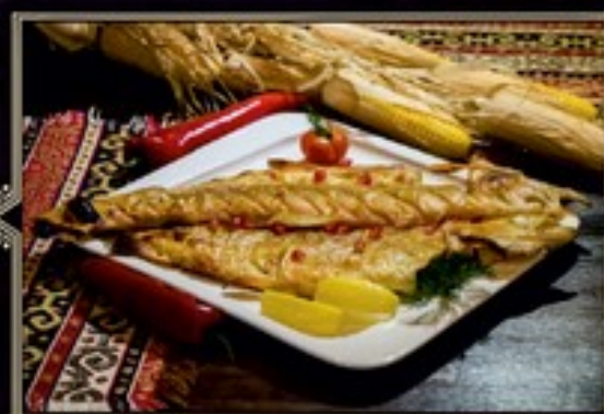
ФОРЕЛЬ ЗОЛОТАЯ 100 г. 490 руб. НА УГЛЯХ