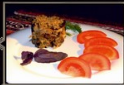
САЛАТ ГРУЗИНСКИЙ 200 гр 390 руб. Обжаренные баклажаны с курицей, свежими томатами и ореховым соусом