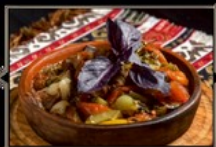
ЧАНАХ 300 г 650 руб. Томленая баранина с овощами