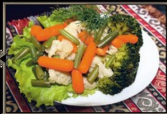
ОВОЩИ НА ПАРУ 200 г 210 руб. Цветная капуста, брокколи, морковь мннн, стручковая фасоль