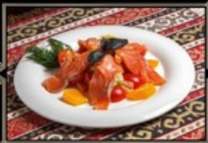
САЛАТ С ЛОСОСЕМ 200 г 590 руб. СОБСТВЕННОГО ПОСОЛА на подушке из листьев салата с томатами черри и заправкой из тархуна