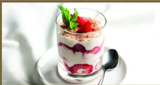
СЫРНОЕ ПАРФЕ 225 150 Нежный сырно-сливочный десерт с сезонными фруктами или ягодами