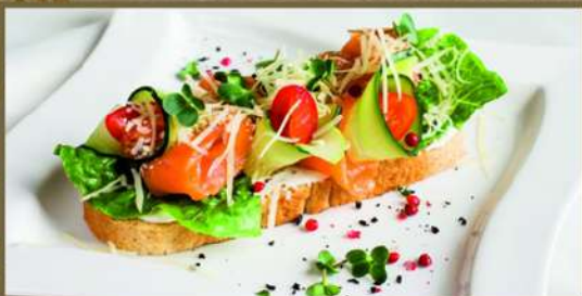
С ЛОСОСЕМ С/С

Особенно рекомендуем к белому или красному вину