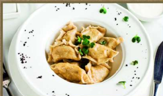
ВАРЕНИКИ С АДЫГЕЙСКИМ СЫРОМ И ГРИБАМИ 250 250/30

Все пельмени подаются со сметаной, сливочным маслом, горчицей или хреном (на выбор)