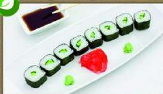
С ОГУРЦОМ 120/50/20/5