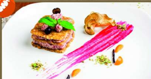
«ЮЖНОЕ СИЯНИЕ» 225 100 Сыроедческий десерт из сухофруктов с прослойкой из кокосово-клубничного соуса