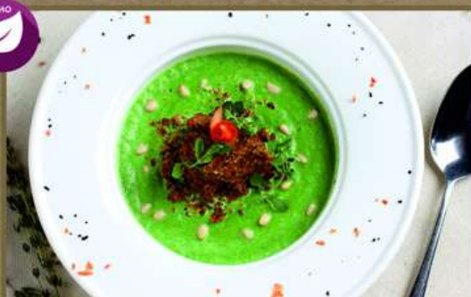
СУП-ПЮРЕ ИЗ БРОККОЛИ С КЕДРОВЫМИ ОРЕШКАМИ 220 290 Со шпинатом, кокосовым маслом. Подается со сливками или кокосовым молоком