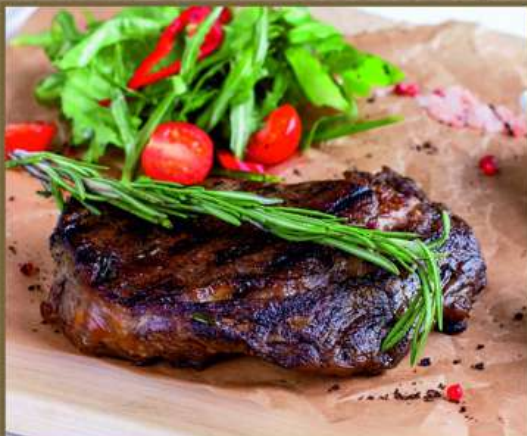
СТЕЙК ИЗ ГОВЯДИНЫ