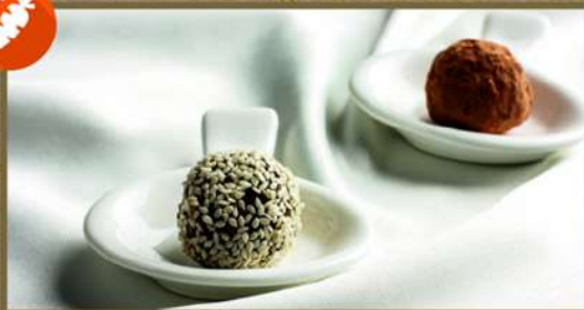
КОНФЕТА ИЗ СУХОФРУКТОВ «САТУРН» 60 20 В кунжуте или какао