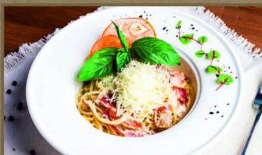
СПАГЕТТИ КАРБОНАРА С БЕКОНОМ 290 250