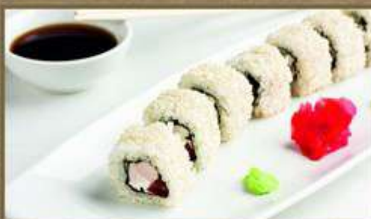
С КОПЧЁНОЙ КУРИЦЕЙ 200/50/20/5