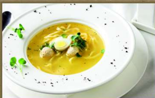
КУРИНЫЙ С ДОМАШНЕЙ ЛАПШОЙ 195 300 С фрикадельками, домашней лапшой из цельнозерновой муки и перепелиным яйцом