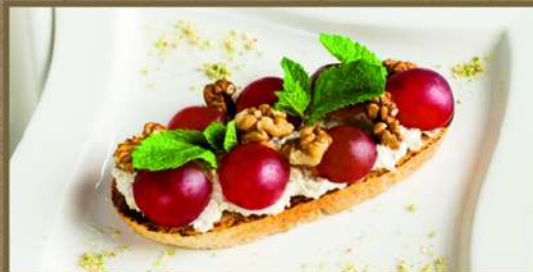
С ПАШТЕТОМ ИЗ СЫРА

С вялеными томатами, базиликом и сыром Креметто