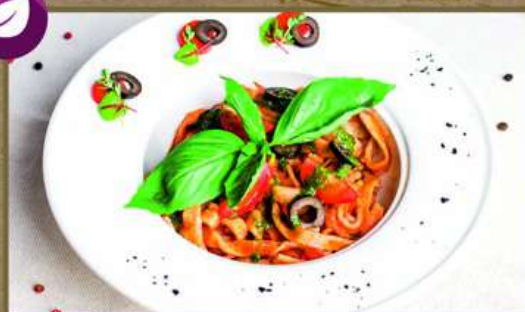
ПАСТА С ОВОЦАМИ 250 250 Вегетарианский вариант - со спагетти