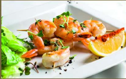
ТИГРОВЫЕ КРЕВЕТКИ ГРИЛЬ НА ШПАЖКАХ 415 90/30 С микс салатом, чесночком и дольками лимона