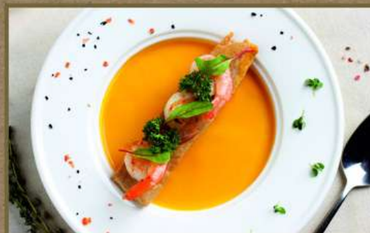
СУП-КРЕМ ИЗ ТЫКВЫ 320 220/40 Суп-крем из тыквы с добавлением кокосового молока. Подается с обжаренными тигровыми креветками