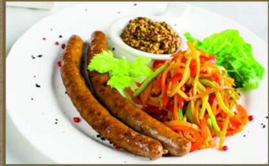
КОЛБАСКИ 255 120/70/30 С овощами по-тайски и дижонской горчицей