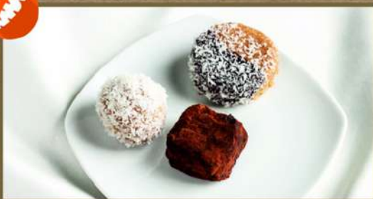
ПЕЧЕНЬЕ «СОЛНЕЧНОЕ ЗАТМЕНИЕ» 30 60 КОНФЕТА СЫРОЕДНАЯ «РАФАЭЛКА» 20 60 ТРЮФЕЛЬ ШОКОЛАДНЫЙ 20 60