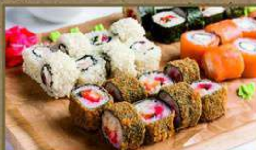
СЕТ «НА ЛЮБОЙ ВКУС»