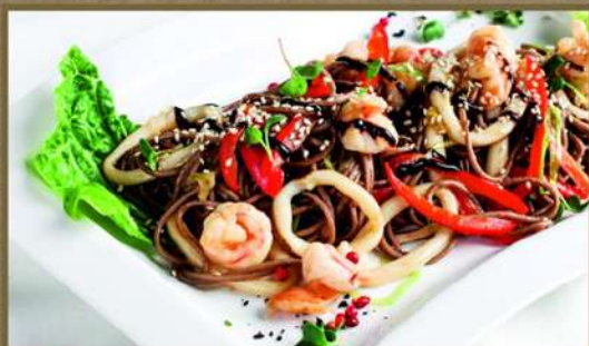
СОБА С КРЕВЕТКАМИ И КАЛЬМАРАМИ 345 250 С имбирным соусом