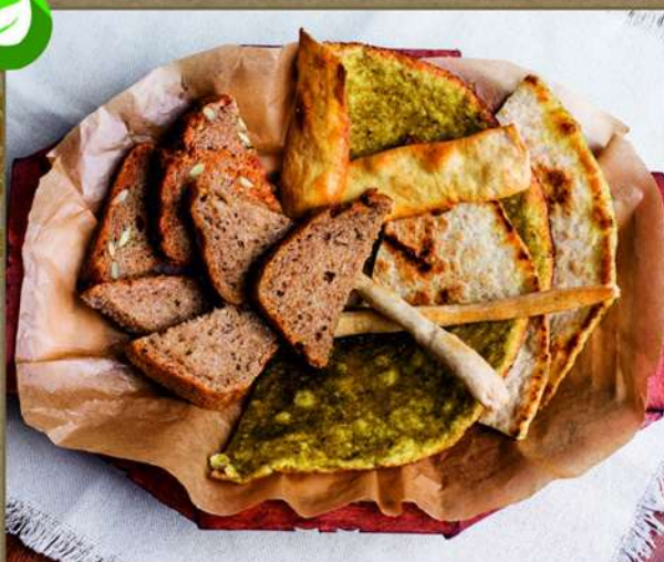
ХЛЕБНАЯ КОРЗИНА 240