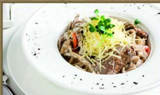
ФЕТТУЧИНИ С ГОВЯДИНОЙ 450 250