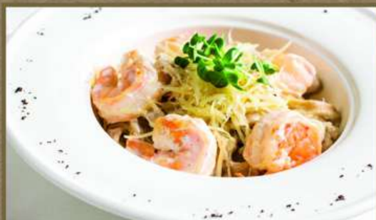
ФЕТТУЧИНИ С ТИГРОВЫМИ КРЕВЕТКАМИ 450 250