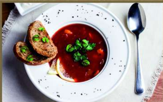
СОЛЯНКА КЛАССИЧЕСКАЯ МЯСНАЯ 310 250/30 Густой мясной суп. Подается со сметаной и печёным хлебом