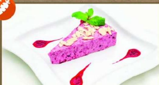
ТОРТ «БРУСНИЧНЫЙ РАССВЕТ»