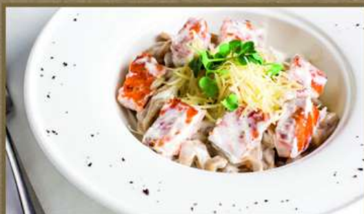
ФЕТТУЧИНИ С ЛОСОСЕМ 450 250