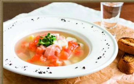
УХА ИЗ СУДАКА И ЛОСОСЯ 350 250/50 Подается со стопкой водки и печёным хлебом