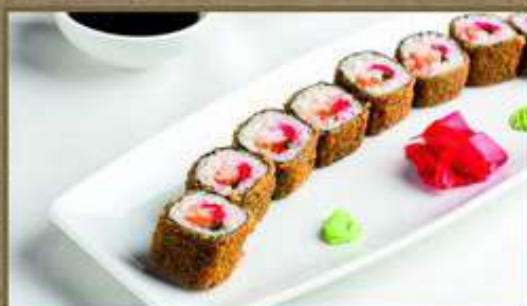
ГОРЯЧИЙ РОЛЛ «ТЕМПУРА»