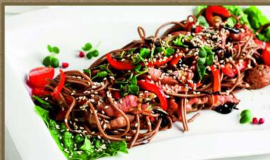
СОБА С УТКОЙ 325 250 С соево-устричным соусом