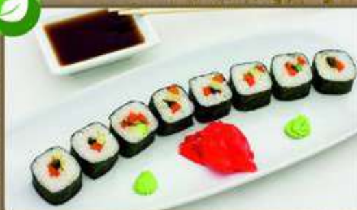
С ОВОЩАМИ ГРИЛЬ 140/50/20/5