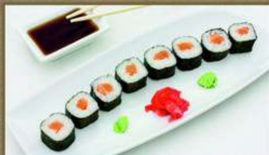
С ЛОСОСЕМ 120/50/20/5