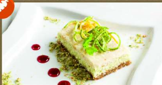
ПИРОЖНОЕ «ОСВЕЖАЮЩИЙ ЛАЙМ» 225 120 Кокосовое пирожное с лёгкой лаймовой кислинкой