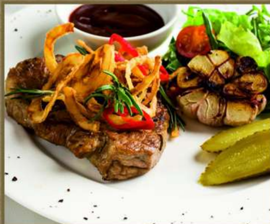
СТЕЙК ИЗ СВИНИНЫ