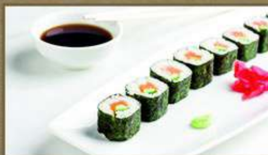
С ЛОСОСЕМ И ОГУРЦОМ 120/50/20/5