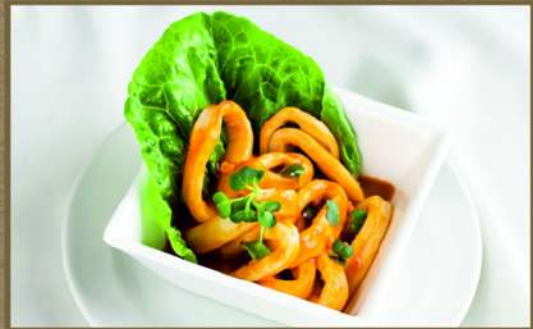
КАЛЬМАР ПИКАНТНЫЙ 255 90/30 С микс салатом в остром соусе