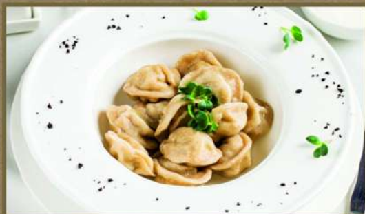
ПЕЛЬМЕНИ С МЯСОМ 360 250/30