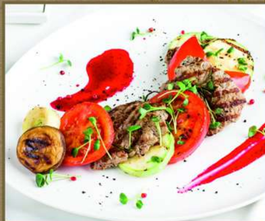
СОТЕ ИЗ НЕЖНОЙ ГОВЯДИНЫ И ОВОЩЕЙ ГРИЛЬ