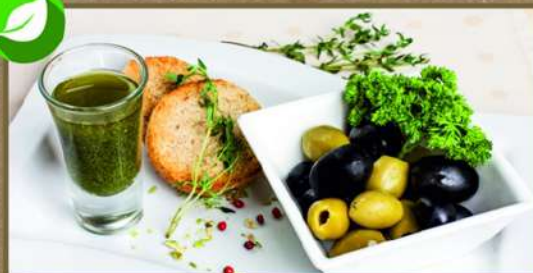
АССОРТИ ИЗ ОЛИВОК И МАСЛИН