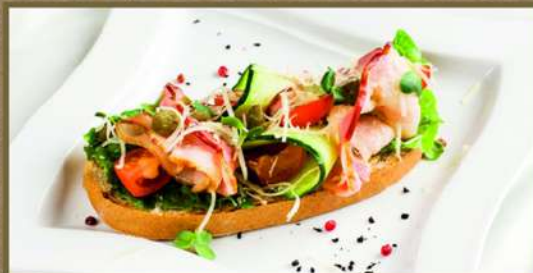
С БЕКОНОМ И ОВОЩАМИ

С сыром Креметто, свежим огурцом, черри и зеленью