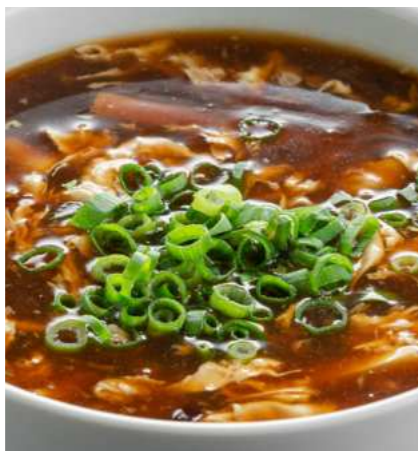
Кисло-острый суп с курицей 470 ₽ SOUR-SPICY SOUP WITH CHICKEN 酸辣鸡肉汤