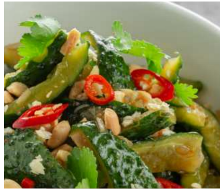
Битые огурцы с арахисом и кинзой 350 ₽ BROKEN CUCUMBERS WITH PEANUTS AND CILANTRO 碎黄瓜与PEANOC和SILANTRO