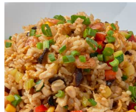
Жареный рис с курицей и креветками 520 ₽ FRIED RICE WITH CHICKEN AND SHRIMP 鸡肉大虾炒饭