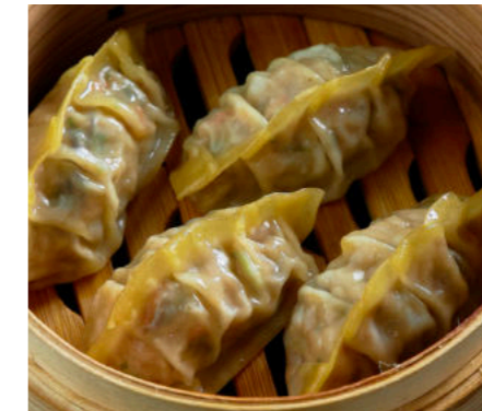
Дим Самы с курицей DIM SUM WITH CHICKEN 鸡肉点心