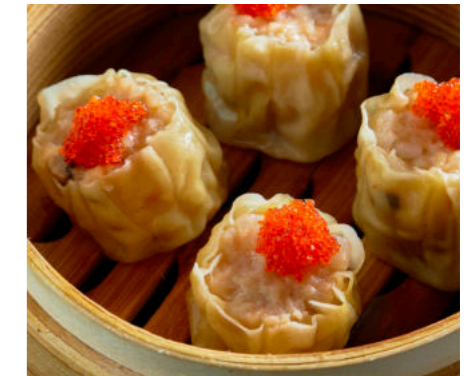
Сюмай со свиной и креветкой XIUMAI WITH PORK AND SHRIMP 秀麦配猪肉和虾