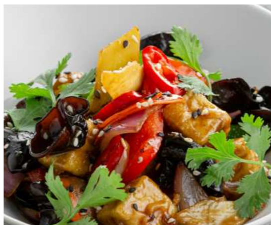
Тофу с овощами в соево медовом соусе 450 ₽ TOFU WITH VEGETABLES IN SOY HONEY SAUCE 豆腐配蔬菜 酱油