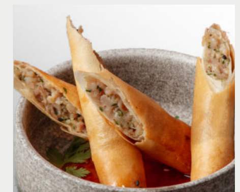
Спринг ролл с пряной свиной SPRING ROLL WITH SPICY PORK 春捲配辣猪肉