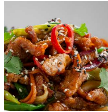
Свинина стир-фрай с лапшой/с рисом 550 ₽ STIR-FRY PORK WITH NOODLES/ WITH RICE 炒猪肉配面条/配米饭