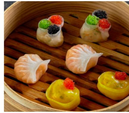
Ассорти крахмальных Дим Сам ASSORTED STARCH DIM SUM 什锦淀粉点心