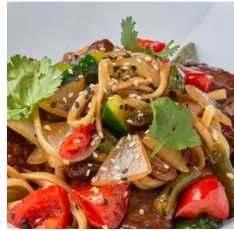
Говядина в устричном соусе с рисом/с лапшой 610 ₽ BEEF IN OYSTER SAUCE WITH RICE/NOODLES 蚝油牛肉配米饭/面条