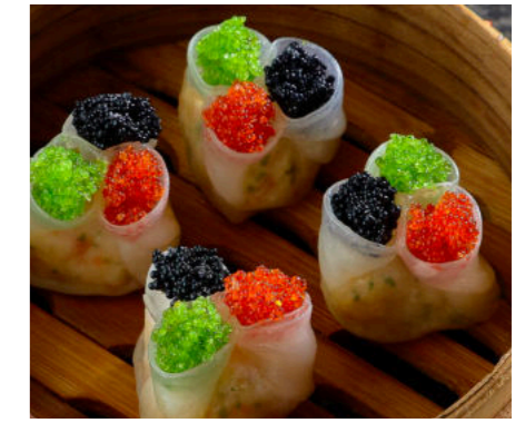
Дим Самы с морепродуктами DIM SUM WITH SEAFOOD 海鲜点心