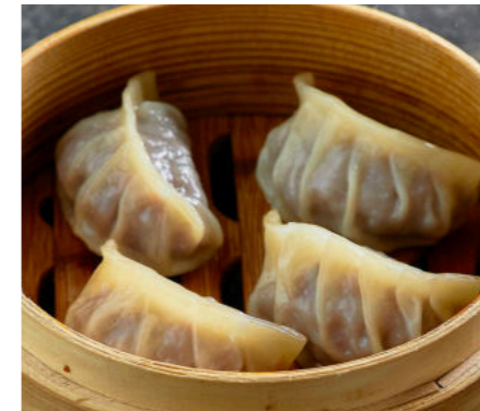
Дим Самы с говядиной, имбирем и зеленым луком DIM SUM WITH BEEF, GINGER AND GREEN ONION 牛肉点心,姜和葱