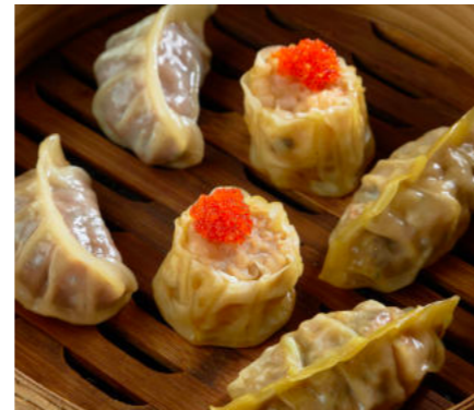
Ассорти пшеничных Дим Сам ASSORTED WHEAT DIM SUM 什锦小麦点心