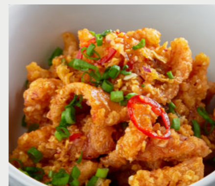
Кальмары с чесноком, 13-ю специями в Sweet Chili Sauce SQUID WITH GARLIC, 13 SPICES IN SWEET CHILI SAUCE 鱿鱼配大蒜,甜辣椒酱中的13种香料