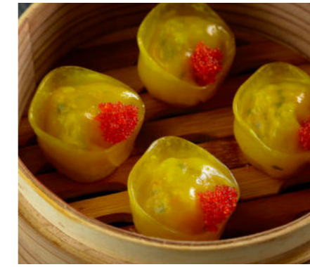
Дим Самы с креветкой и морским гребешком DIM SUM WITH SHRIMP AND SCALLOP 虾仁点和扇贝