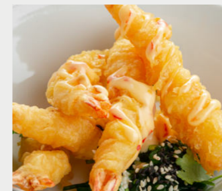
Креветки темпура TEMPURA SHRIMP 天妇罗虾