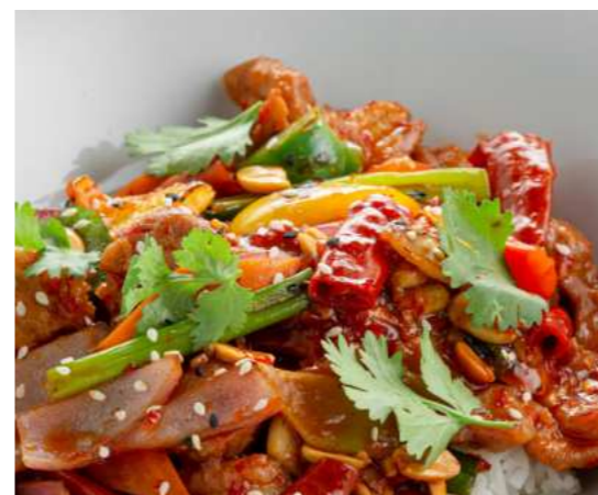
Курица Кунг-Пао 550 ₽ KUNG PAO CHICKEN 宫保鸡丁