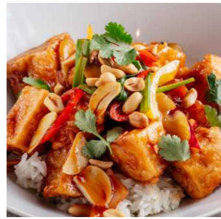
Баклажаны в кисло-сладком соусе 450 ₽ EGGPLANT IN SWEET AND SOUR SAUCE 茄子糖醋酱