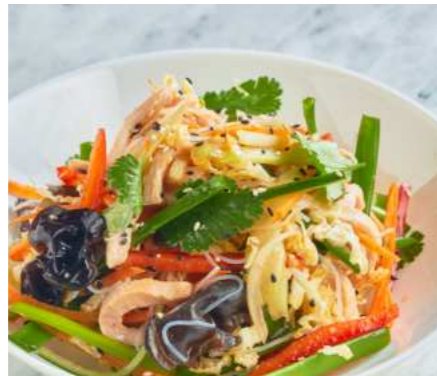
Салат Харбин с индейкой 400 ₽ HARBIN SALAD WITH TURKEY 哈尔滨火鸡沙拉