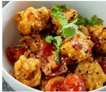
Салат с томатами и баклажанами в китайской темпуре и Sweet Chili Sauce 470 ₽ SALAD WITH TOMATOES AND EGGPLANT IN CHINESE TEMPURA AND SWEET CHILI SAUCE 西红柿和茄子沙拉在中国天妇罗和甜辣椒酱