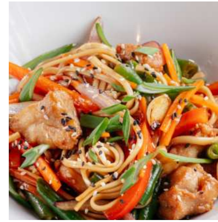
Лапша удон с курицей/с овощами 500/390 ₽ UDON NOODLES WITH CHICKEN/ WITH VEGETABLES 乌冬面鸡肉/蔬菜