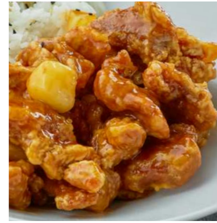
Свинина в кисло-сладком соусе с рисом/без риса 550/500 ₽ PORK IN SWEET AND SOUR SAUCE WITH RICE/ WITHOUT RICE 糖醋猪肉米饭酱/不含米饭