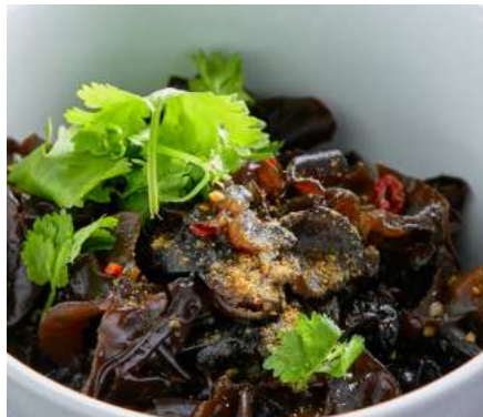
Древесные грибы в 13 специях 300 ₽ WOOD MUSHROOMS IN 13 SPICES 木蘑菇在13香料