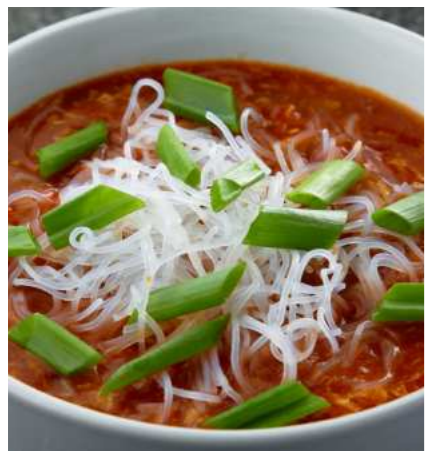
Томатный суп с яйцом 390 ₽ TOMATO SOUP WITH EGG 鸡蛋番茄汤