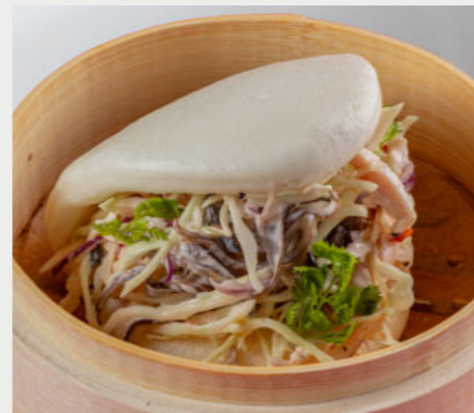
Бао с индейкой BAO WITH TURKEY 火雞包

ЕСЛИ У ВАС ЕСТЬ АЛЛЕРГИЯ НА ОПРЕДЕЛЕННЫЕ ПРОДУКТЫ, ОБЯЗАТЕЛЬНО СООБЩИТЕ ОБ ЭТОМ. VE ALLERGIES TO CERTAIN FOODS, PLEASE REPORT IT.