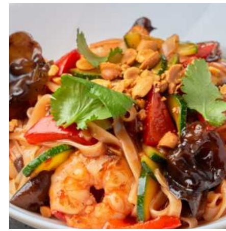
Рисовая лапша с креветками 610 ₽ RICE NOODLES WITH SHRIMP 虾米面