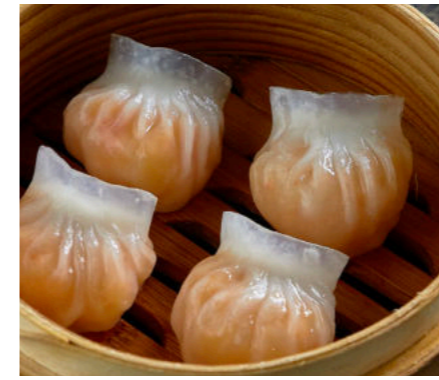
Хагао с креветкой HAGAO WITH SHRIMP 海高虾