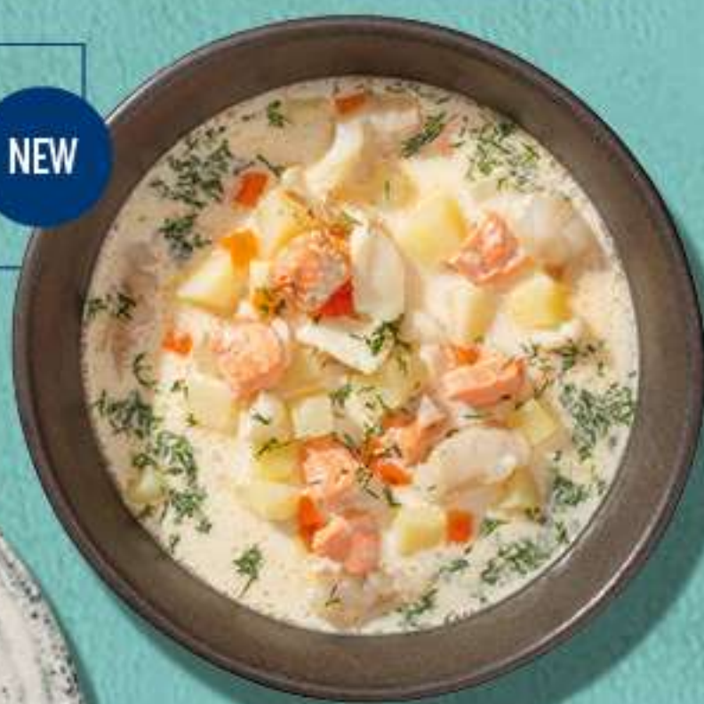
Марсельский Буйабес с морепродуктами 1/2 389.- 629.-