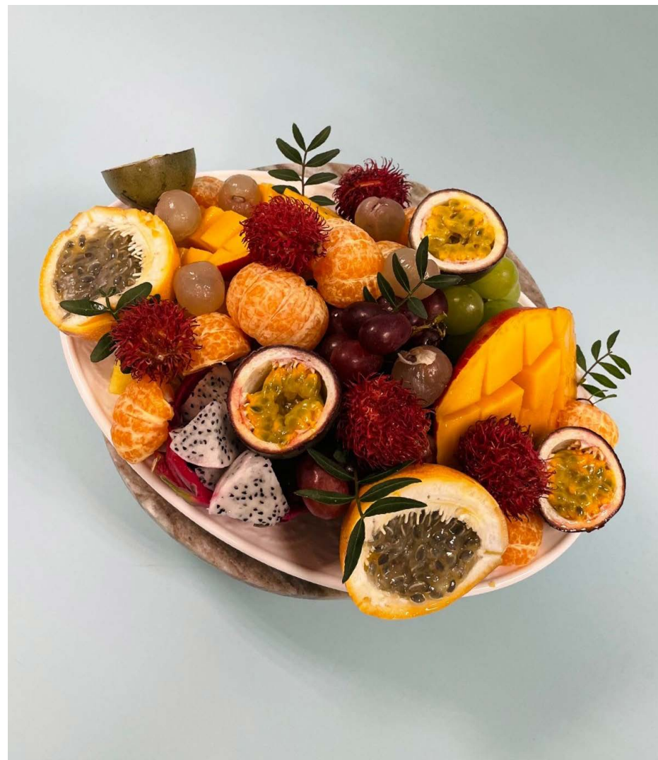
Ваза с экзотическими фруктами (маракуйя, питахайя, гранадила, лонган, виноград, ананас, рамбутан, манго) 4200 ₺ (1500 г)