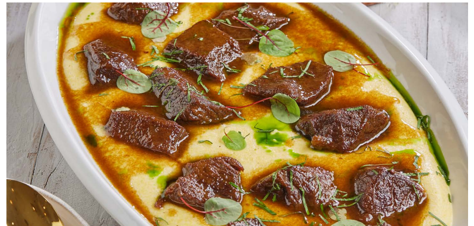
Томленая говядина с кремом полента, на 6-8 персон 12000 ₽ (1900 г)