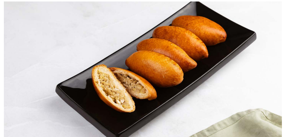
Пирожок с молодой капустой и яйцом 150 ₹ (40 г)