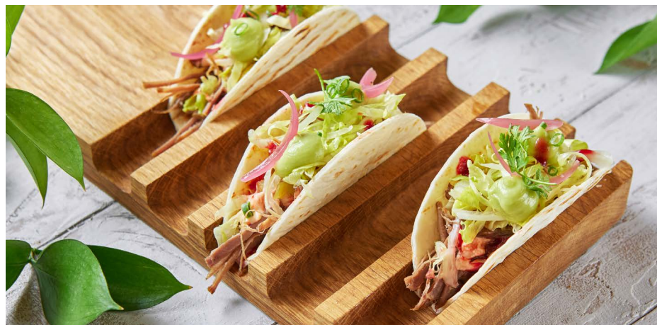
Тако с говядиной и вишневым BBQ (цена указана за 3 шт) 980 ₺ (220 г)