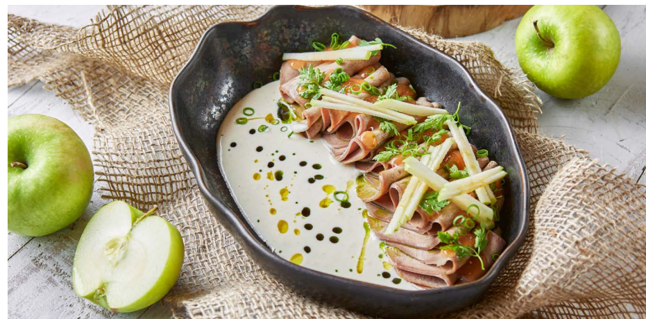
Говяжий язык с кремом из сливочного хрена 1200 ₺ (240 г)