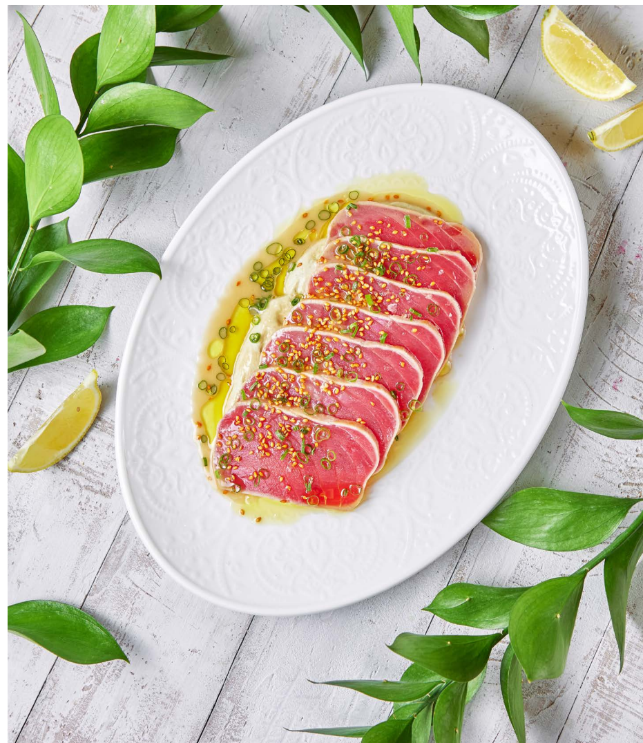
Татаки из тунца с кремом из баклажанов 2400 ₺ (270 г)