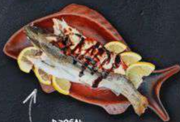
ФОРЕЛЬ КРАСА ГРУЗИИ