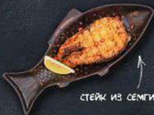
СТЕЙК ИЗ СЕМГИ