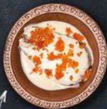
СЕМГА ПОД ИКОРНЫМ СОУСОМ