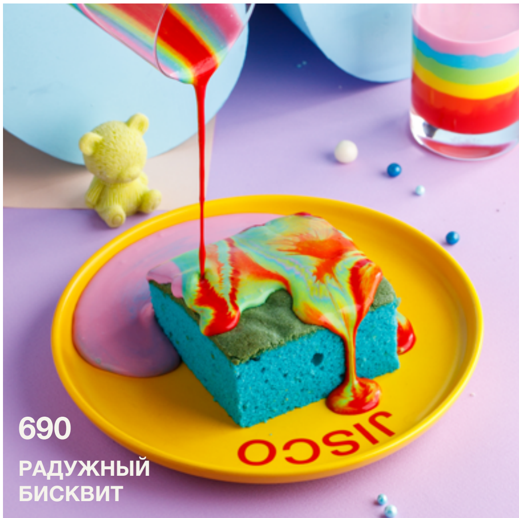
690 РАДУЖНЫЙ БИСКВИТ