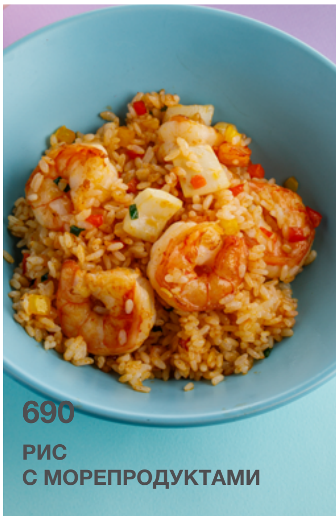
РИС С МОРЕПРОДУКТАМИ