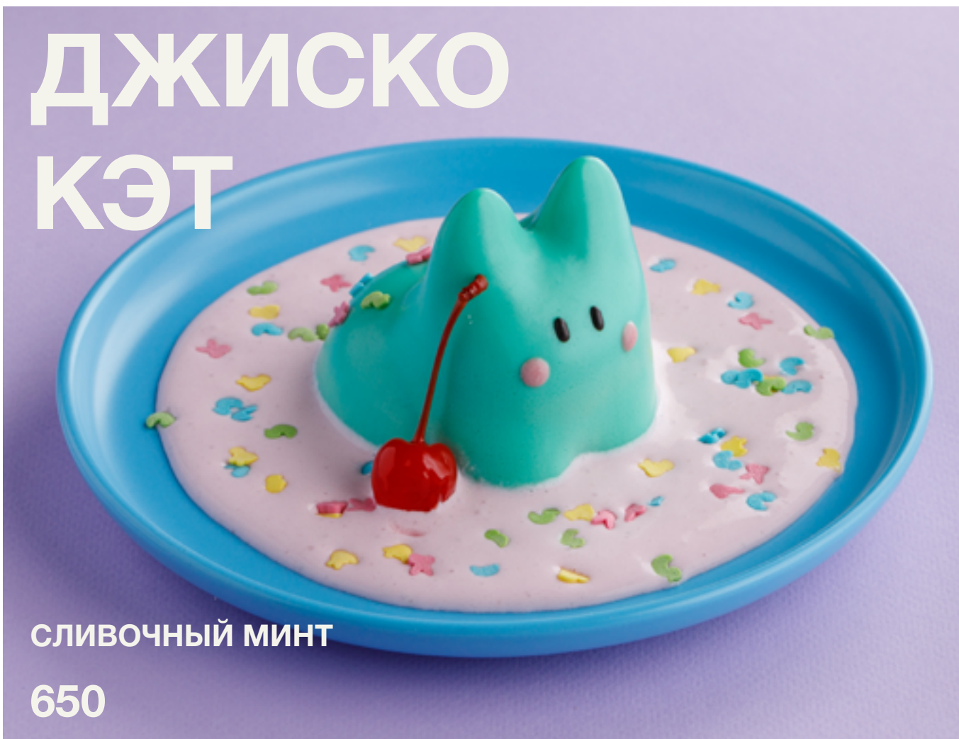
СЛИВОЧНЫЙ МИНТ 650