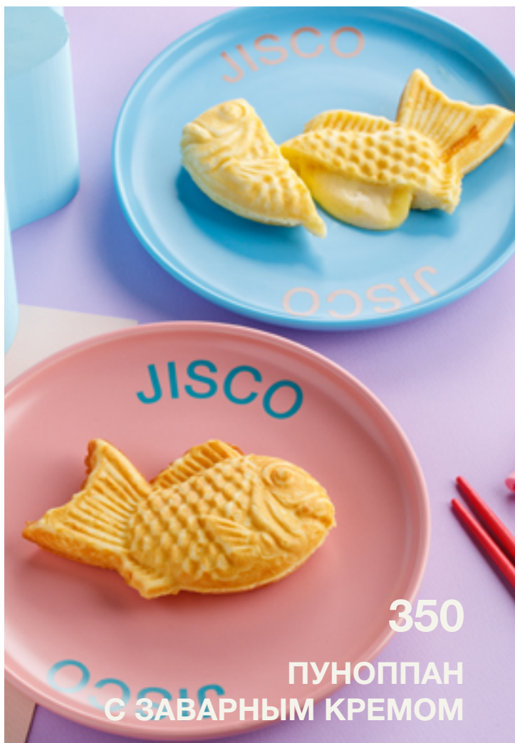
350 ПУНОППАН С ЗАВАРНЫМ КРЕМОМ