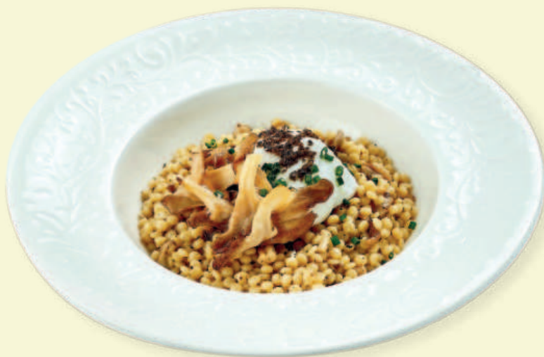
Птитим с вёшенками, трюфельным соусом и яйцом пашот Ptitim with Oyster Mushrooms, Truffle Sauce, and Poached Egg