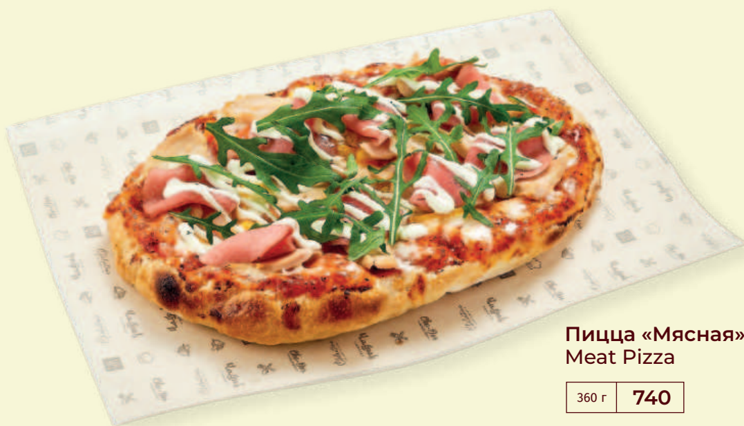
Пицца «Мясная» Meat Pizza