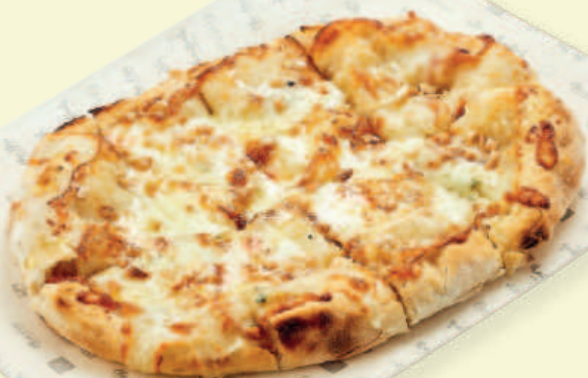
Пицца «Четыре сыра» Four Cheese Pizza