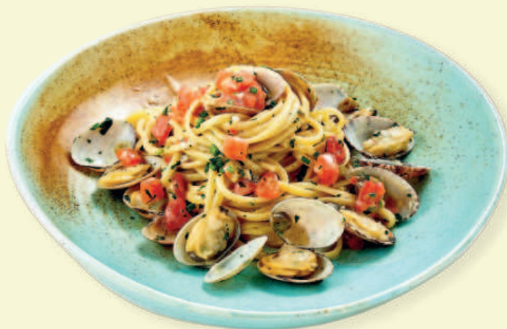
Лингвини с вонголе и каперсами Linguine with Vongole and Capers