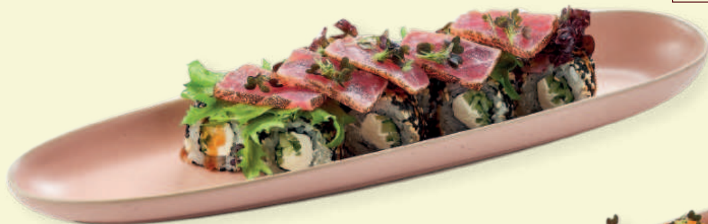
Татаки-ролл с лососем и соусом понзу Tataki Roll with Salmon and Ponzu Sauce