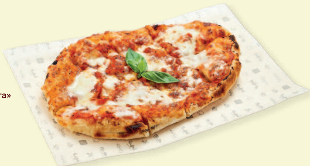
Пицца «Маргарита» Margherita Pizza