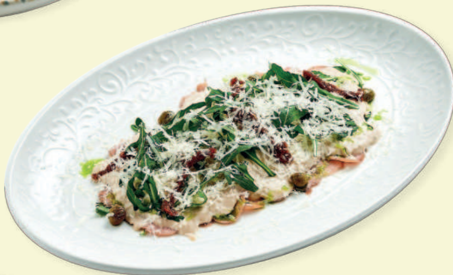
Вителло тоннато Vitello Tonnato