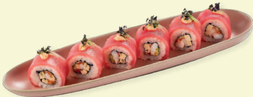
Ролл с тунцом и креветкой Roll with Tuna and Shrimp