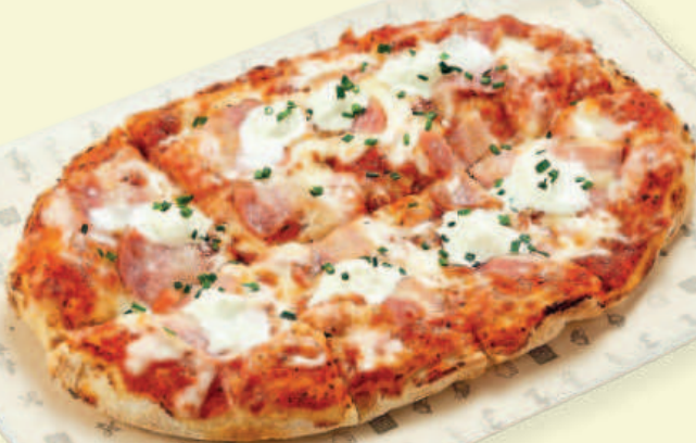
Пицца «Бекон-маскарпоне» Bacon-Mascarpone Pizza