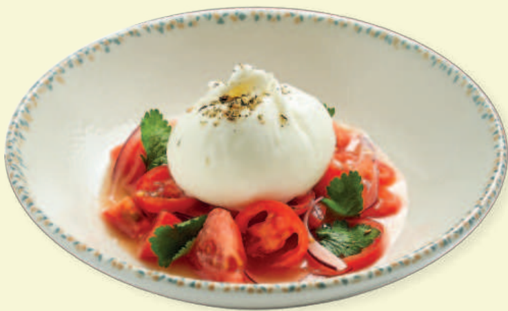
Севиче из томатов с бурратой Tomato Ceviche with Burrata