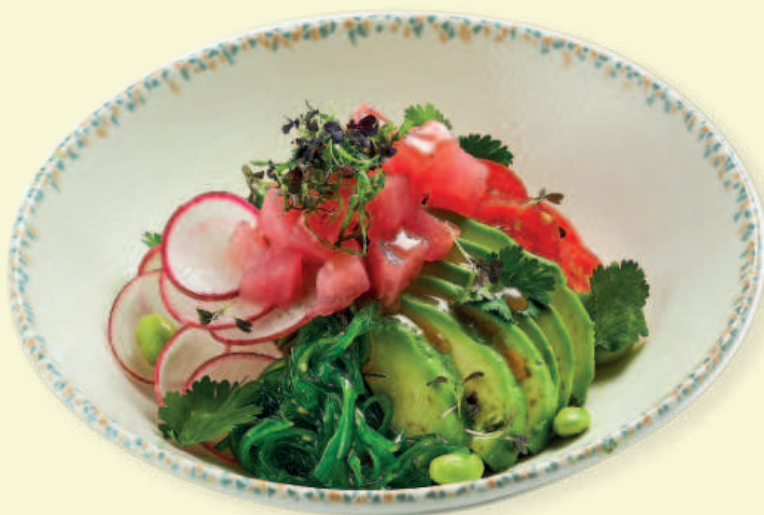
Поке с лососем Salmon Poke