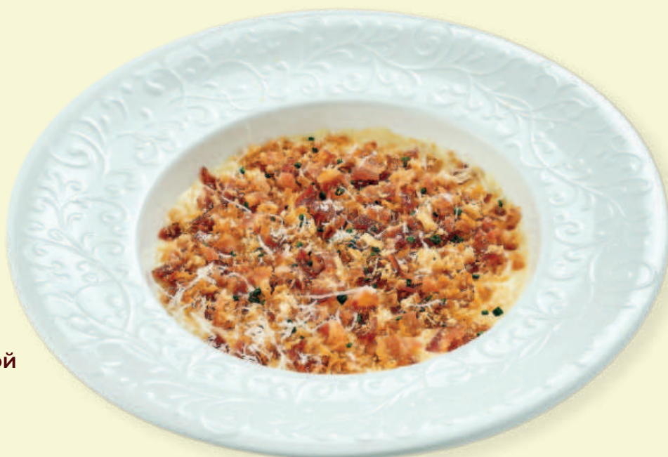
Сырный суп с пшеничной гранолой и беконом Cheese Soup with Granola and Bacon