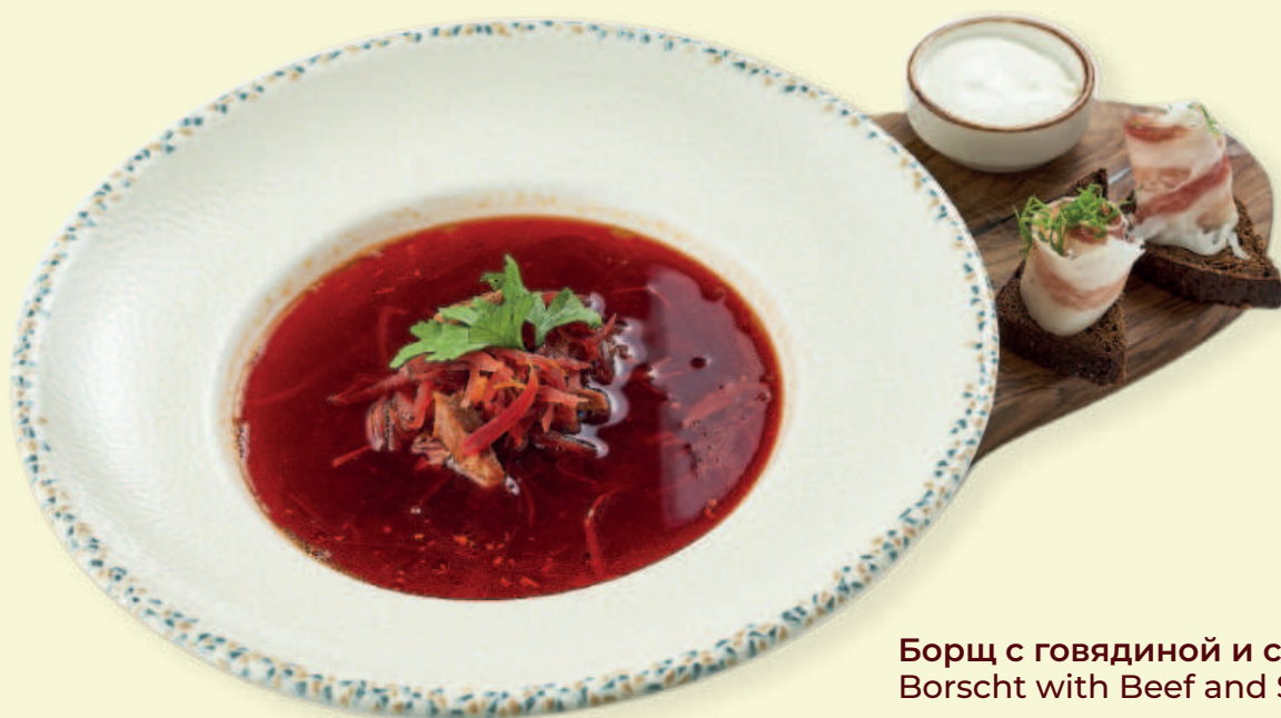
Борщ с говядиной и сметаной Borscht with Beef and Sour Cream