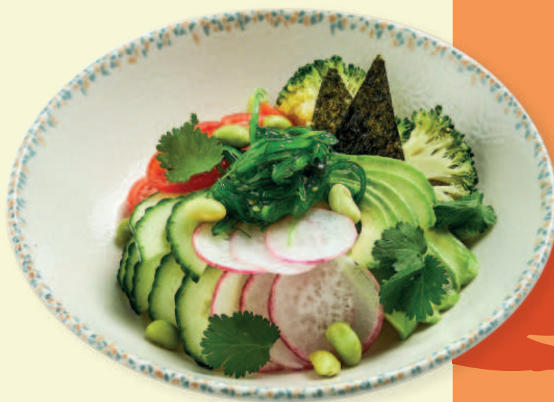
Поке с тунцом Tuna Poke