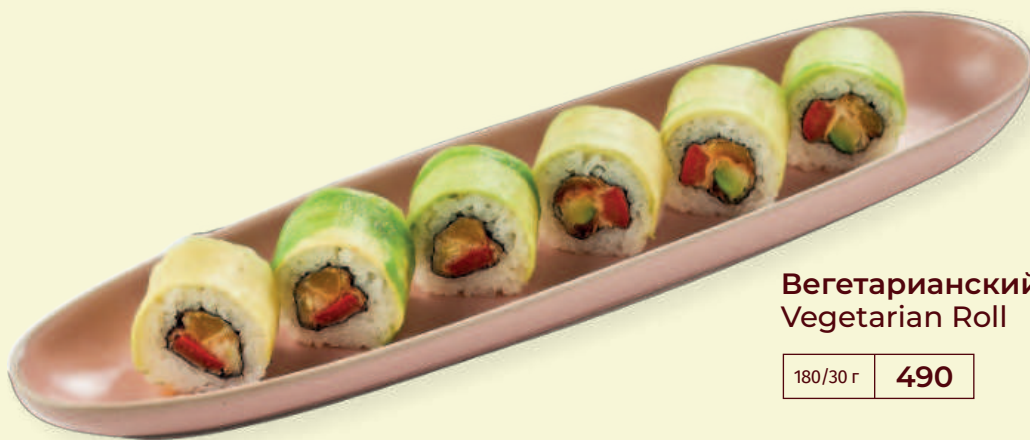
Вегетарианский ролл Vegetarian Roll