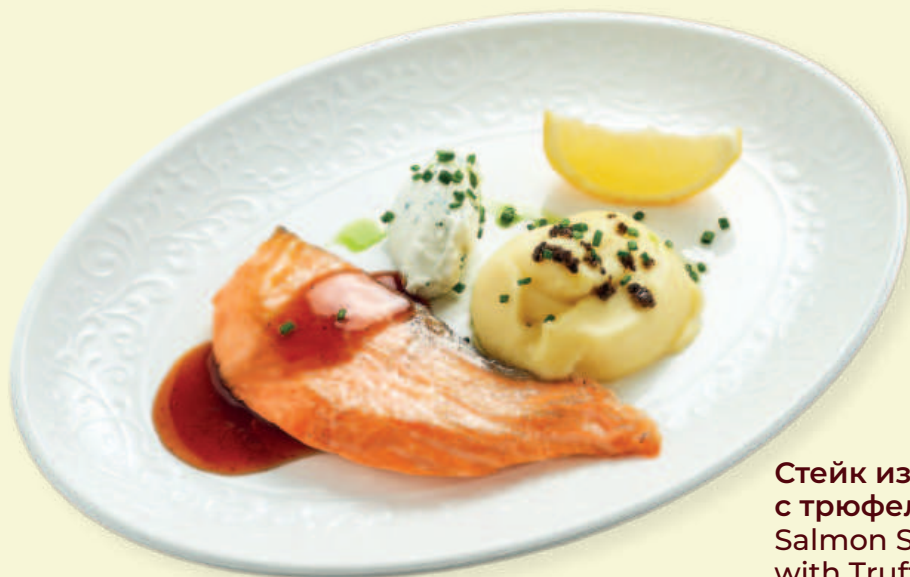
Стейк из лосося с трюфельным пюре Salmon Steak with Truffle Purée