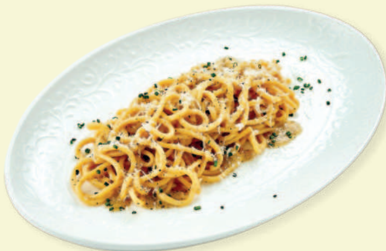
Спагетти качо-э-пепе классико Classic Cacio e Pepe Spaghetti