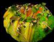
Суши-Пончик с лососем

Рис, нори, творожный сыр, огурец, лосось