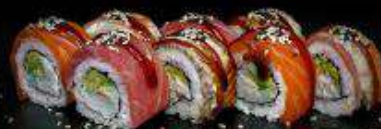
Микс ролл | 280 г |

Рис, нори, авокадо, снежный краб, лосось, тунец, угорь, креветка, унаги-соус, кунжут