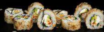
Ролл Дракон | 200 г |

Рис, нори, творожный сыр, авокадо, угорь, масаго, бонито