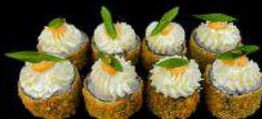
Крабстер | 240 г |

Рис, нори, творожный сыр, снежный краб, лук зелёный, темпура, спайси-соус