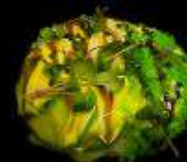
Суши-Пончик с угрем