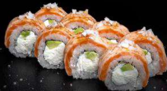
Опалённая филадельфия с камчатским крабом | 290 г |

Рис, нори, творожный сыр, авокадо, лосось, камчатский краб, тростниковый сахар