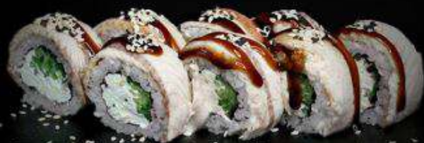
Филадельфия с угрем | 280 г |

Рис, нори, творожный сыр, огурец, угорь, унаги-соус, кунжут