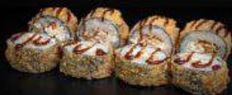
Ролл в темпуре с угрём | 290 г |

Рис, нори, творожный сыр, тамаго, угорь, темпура, унаги-соус