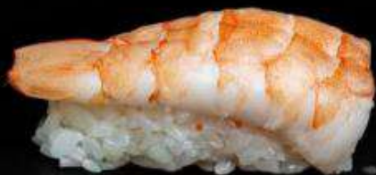
Суши с креветкой | 40 г |