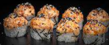
Спайси лосось | 270 г |

Рис, нори, творожный сыр, огурец, лосось, спайси-соус