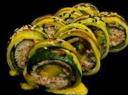
Фреш Ролл с угрём

Состав: огурец, нори, угорь, снежный краб, листовой салат, авокадо, творожный сыр, соус манго-майо, унаги соус, кунжут.