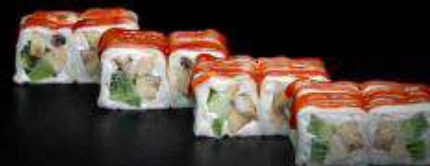
Сладкий ролл | 190 г |

Спринг тесто, творожный сыр, киви, банан, сахарная пудра, топпинг на выбор