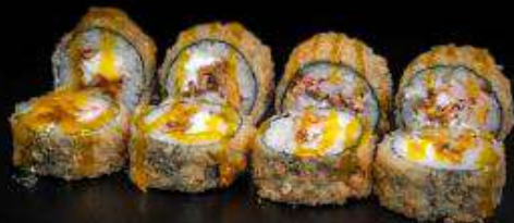
Ролл в темпуре с креветкой | 270 г |

Рис, нори, творожный сыр, креветка, лосось-терияки, темпура, манговый соус