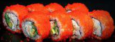
Калифорния с камчатским крабом | 210 г |

Рис, нори, огурец, авокадо, камчатский краб, масаго