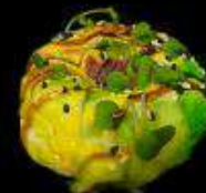
Суши-Пончик с тунцом

Рис, нори, креветка, авокадо, соус манговый