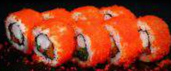
Калифорния с креветкой и лососем | 230 г |

Рис, нори, огурец, креветка, лосось, масаго