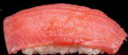
Суши с тунцом | 50 г |