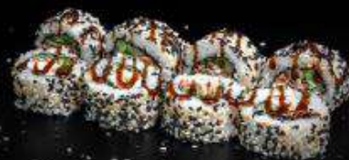
Сливочный лосось-терияки | 220 г |

Рис, нори, творожный сыр, огурец, лосось-терияки, унаги-соус, кунжут