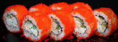
Калифорния со снежным крабом | 230 г |

Рис, нори, творожный сыр, огурец, снежный краб, масаго