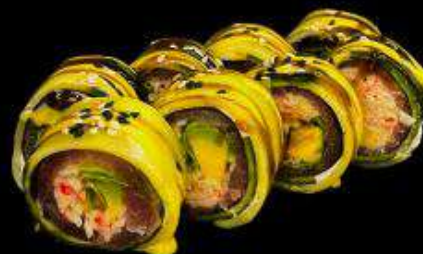
Фреш Ролл с тунцом

Состав: огурец, нори, начинка, снежный краб, листовой салат, авокадо, творожный сыр, соус манго-майо, унаги соус, кунжут.