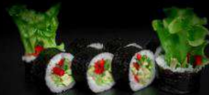
Вегетарианский ролл | 220 г |

Рис, нори, огурец, болгарский перец, авокадо, помидор, салат айсберг, ореховый соус