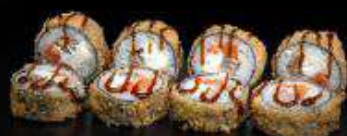
Ролл в темпуре с лососем | 290 г |

Рис, нори, творожный сыр, лосось, тамаго, темпура, унаги-соус