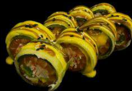
Фреш Ролл с лососем

Состав: рис, киноа, соус мирин, огурец, томаты черри, бобы эдамаме, авокадо, чука, креветка, соус унаги, соус манго-майо, кунжут.