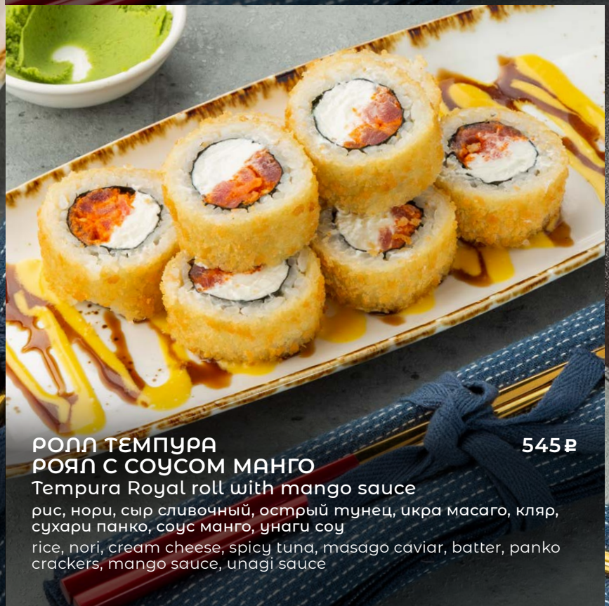
РОЛЛ ТЕМПУРА РОЯЛ С СОУСОМ МАНГО Tempura Royal roll with mango sauce рис, нори, сыр сливочный, острый тунец, икра масаго, кляр, сухари панко, соус манго, унагу соус rice, nori, cream cheese, spicy tuna, masago caviar, batter, panko crackers, mango sauce, unagi sauce