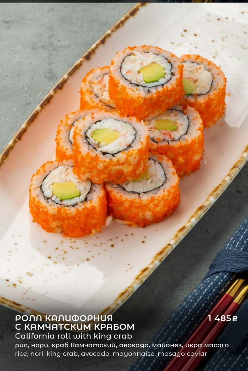
РОЛЛ КАЛИФОРНИЯ С КАМЧАТСКИМ КРАБОМ California roll with king crab рис, нори, краб Камчатский, авокадо, майонез, икра масаго rice, nori, king crab, avocado, mayonnaise, masago caviar