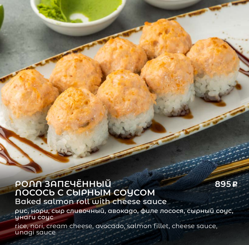
РОЛЛ ЗАПЕЧЁННЫЙ ЛОСОСЬ С СЫРНЫМ СОУСОМ 895 ₺ Baked salmon roll with cheese sauce рис, нори, сыр сливочный, авокадо, филе лосося, сырный соус, унаги соус rice, nori, cream cheese, avocado, salmon fillet, cheese sauce, unagi sauce