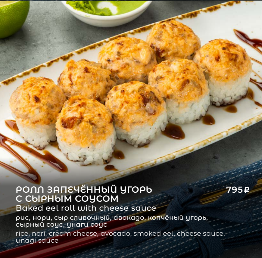
РОЛЛ ЗАПЕЧЁННЫЙ УГОРЬ С СЫРНЫМ СОУСОМ 795 ₺ Baked eel roll with cheese sauce рис, нори, сыр сливочный, авокадо, копчёный угорь, сырный соус, унаги соус rice, nori, cream cheese, avocado, smoked eel, cheese sauce, unagi sauce