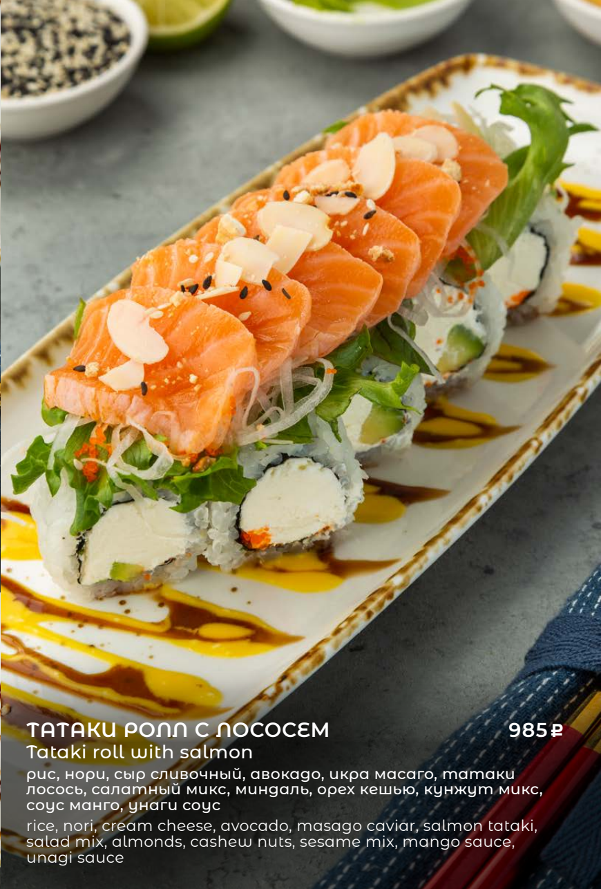
ТАТАКИ РОЛЛ С ЛОСОСЕМ 985 ₺ Tataki roll with salmon рис, нори, сыр сливочный, авокадо, икра масаго, татаки лосося, салатный микс, миндаль, орех кешью, кунжут микс, соус манго, унаги соус rice, nori, cream cheese, avocado, masago caviar, salmon tataki, salad mix, almonds, cashew nuts, sesame mix, mango sauce, unagi sauce