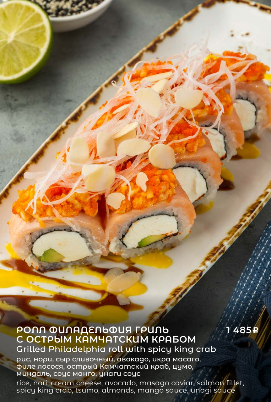
РОЛЛ ФИЛАДЕЛЬФИЯ ГРИЛЬ С ОСТРЫМ КАМЧАТСКИМ КРАБОМ Grilled Philadelphia roll with spicy king crab рис, нори, сыр сливочный, авокадо, икра масаго, филе лосося, острый Камчатский краб, цумо, миндаль, соус манго, унагу соус rice, nori, cream cheese, avocado, masago caviar, salmon fillet, spicy king crab, tsumo, almonds, mango sauce, unagi sauce