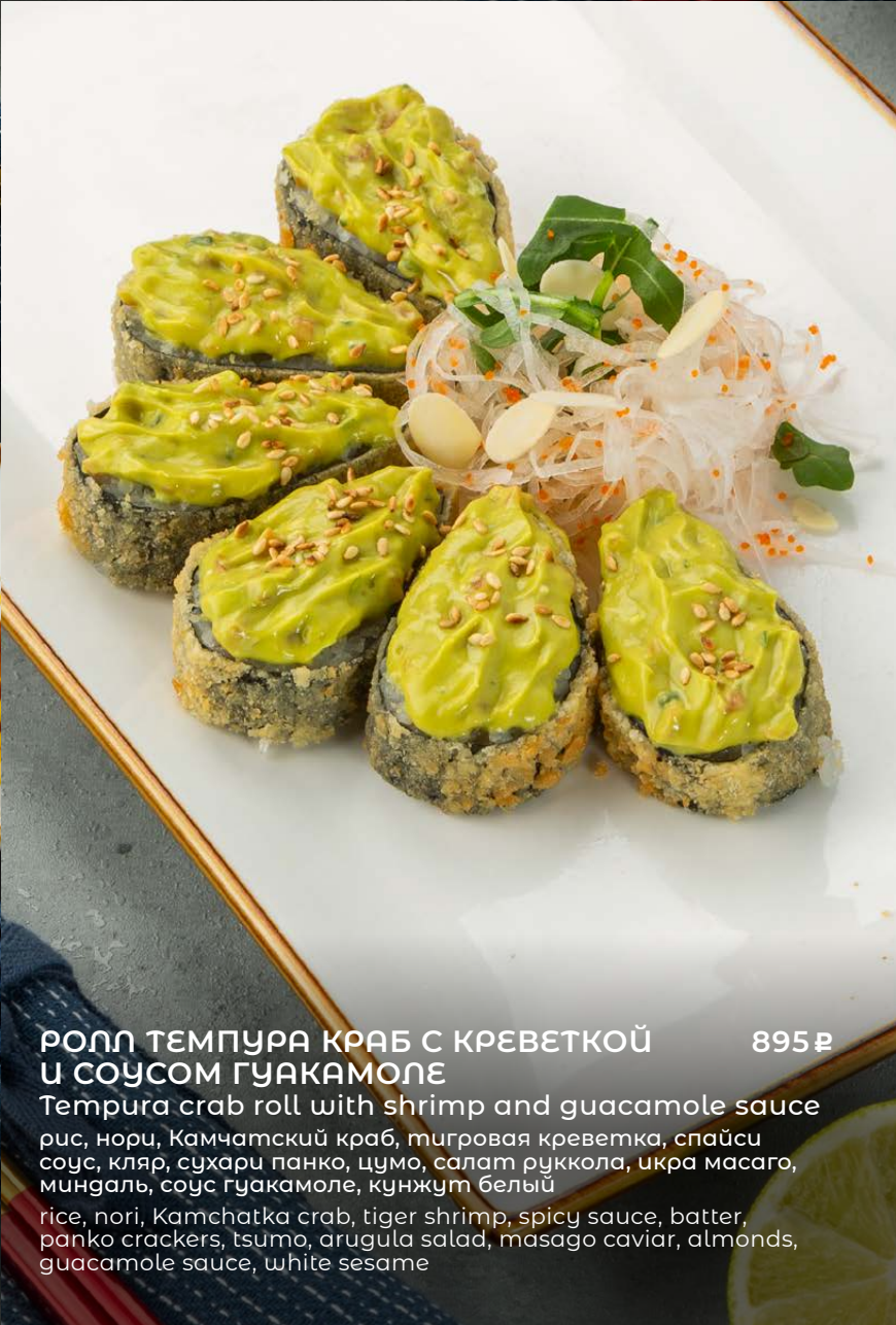
РОЛЛ ТЕМПУРА КРАБ С КРЕВЕТКОЙ И СОУСОМ ГУАКАМОЛЕ 895 ₺ Tempura crab roll with shrimp and guacamole sauce рис, нори, Камчатский краб, тигровая креветка, спайси соус, кляр, сухари панко, цумо, салат руккола, икра масаго, миндаль, соус гуакамолле, кунжут белый rice, nori, Kamchatka crab, tiger shrimp, spicy sauce, batter, panko crackers, tsumo, arugula salad, masago caviar, almonds, guacamole sauce, white sesame