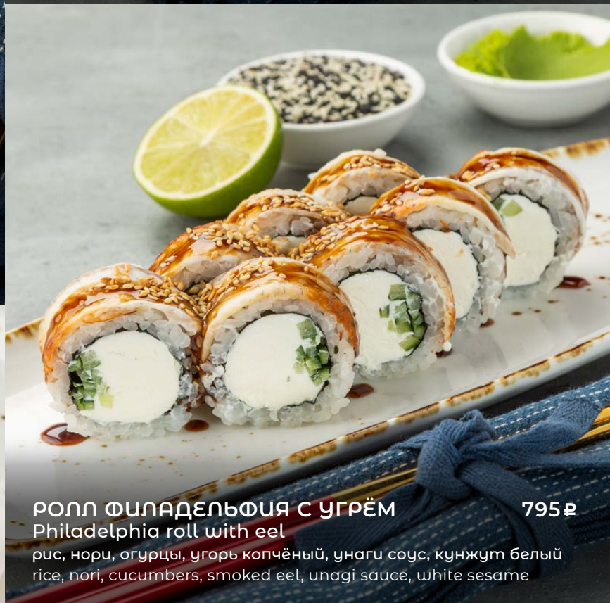
РОЛЛ ФИЛАДЕЛЬФИЯ С УГРЁМ Philadelphia roll with eel рис, нори, огурцы, угорь копчёный, унагу соус, кунжут белый rice, nori, cucumbers, smoked eel, unagi sauce, white sesame