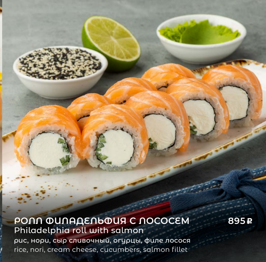
РОЛЛ ФИЛАДЕЛЬФИЯ С ЛОСОСЕМ Philadelphia roll with salmon рис, нори, сыр сливочный, огурцы, филе лосося rice, nori, cream cheese, cucumbers, salmon fillet