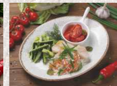
Соленья домашние ▲ капуста маринованная с яблоками, помидоры в пряном маринаде, огурцы битые 519 р. 300 г