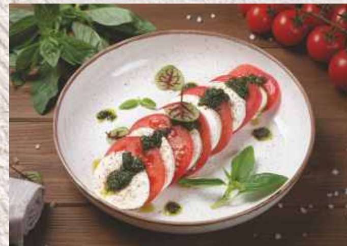
КАПРЕЗЕ ▲ 599 р. 270 г молодой итальянский сыр Моцарелла со спелыми томатами и соусом Песто