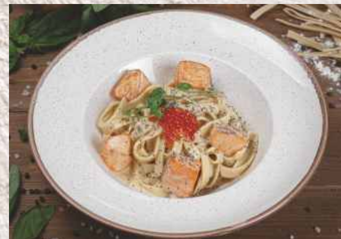
Фетучини с лососем ▲ «Санта Донна» в сливочном соусе 739 р. 250 г