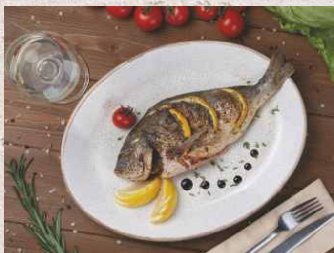
Стейк лосося на гриле 1119 р. 200 г