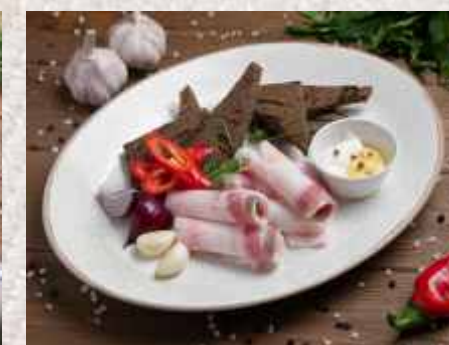
Сало по-домашнему ▲ тонкие ломтики солёного сала с гренками чёрного хлеба и сливочным хреном 369 р. 200 г