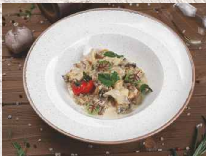
Рапаны черноморские ▲ в бело-винном соусе с грибами и чесноком 890 р. 280 г