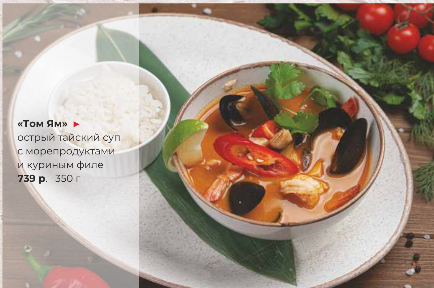
«Том Ям» ▶ острый тайский суп с морепродуктами и куриным филе 739 р. 350 г