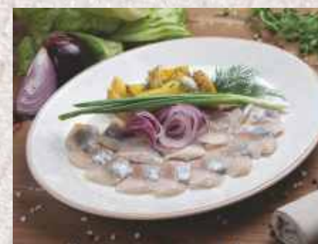
Филе сельди малой соли ▲ с отварным картофелем и красным луком 399 р. 220 г