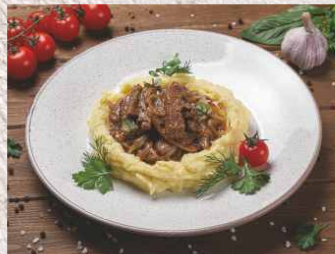
▲ Бефстроганов из копчёного языка ломтики копчёного языка с обжаренным луком в сливочно- мясном соусе с картофельным пюре 829 р. 350 г