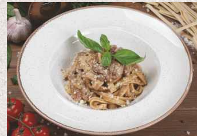
Фетучини с курицей и шампиньонами 479 р. 300 г