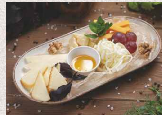
АССОРТИ СЫРОВ ▲ 699 р. 240 г Чеддер, Пармезан, Сулугуни, Сулугуни копчёный, Чечел нити, виноград, мёд, орехи

Овощи свежие 389 р. 250 г огурцы, томаты, болгарский перец, редис, зелень