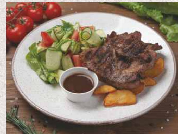
▲ Свинина по-Тоскански стейк из свинины с картофелем по-деревенски, овощным салатом и соусом «Демиглас» 715 р. 350 г