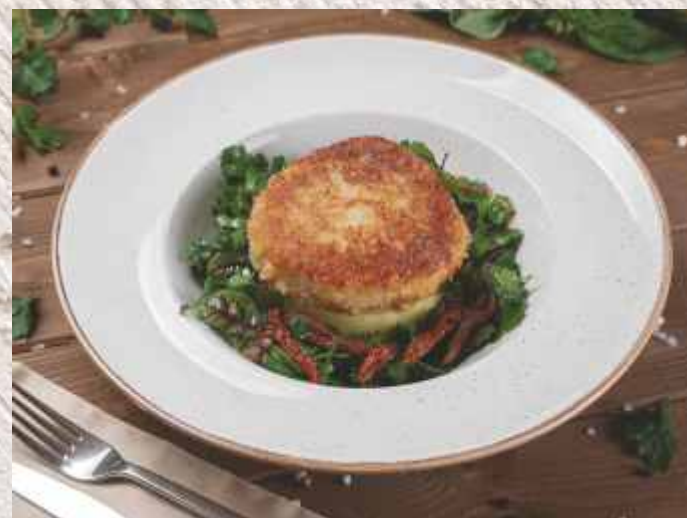
Котлета из щуки ▲ сочная котлета из щучьего филе в хрустящей корочке. Подаётся с толчёным картофелем и салатом из вяленых томатов 559 р. 300 г