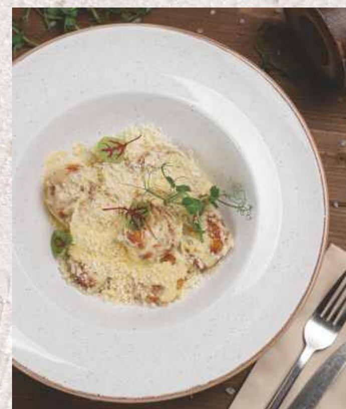
Ньокки с креветками в сливках 669 р. 300 г