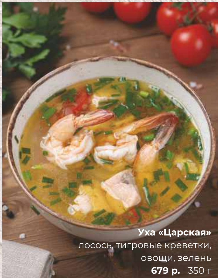
Уха «Царская» лосось, тигровые креветки, овощи, зелень 679 р. 350 г