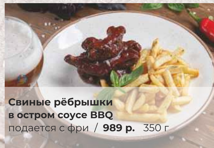
Свинные рёбрышки в остром соусе BBQ подаётся с фри / 989 р. 350 г