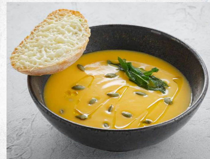
КРЕМ-СУП ИЗ ТЫКВЫ