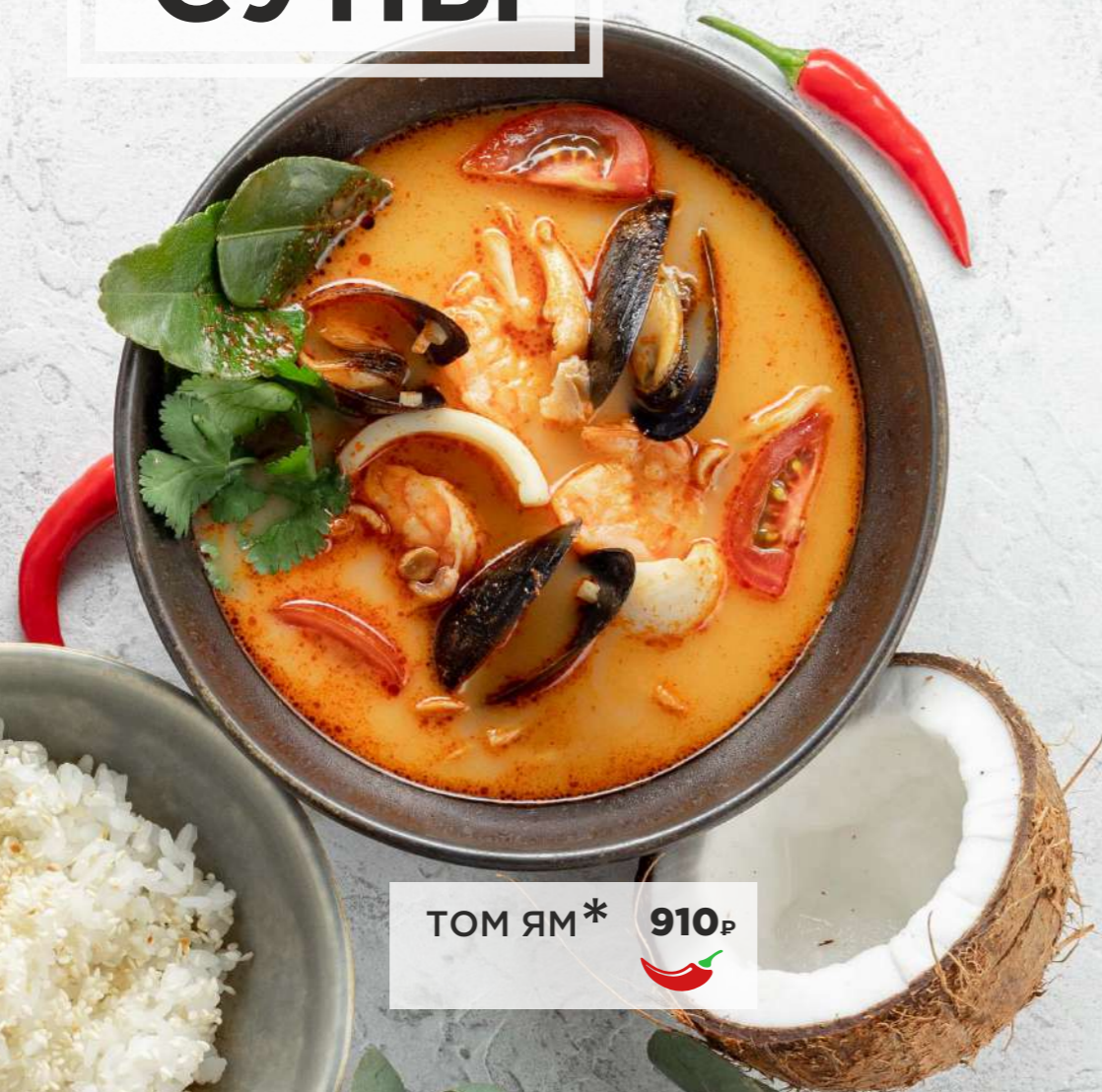
ТОМ ЯМ* 910₹