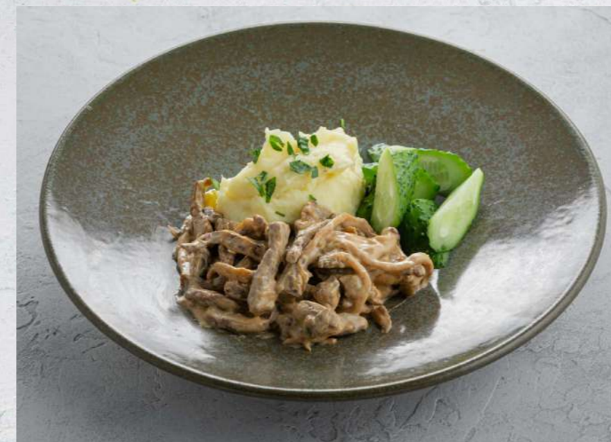
БЕФСТРОГАНОВ С ПЮРЕ