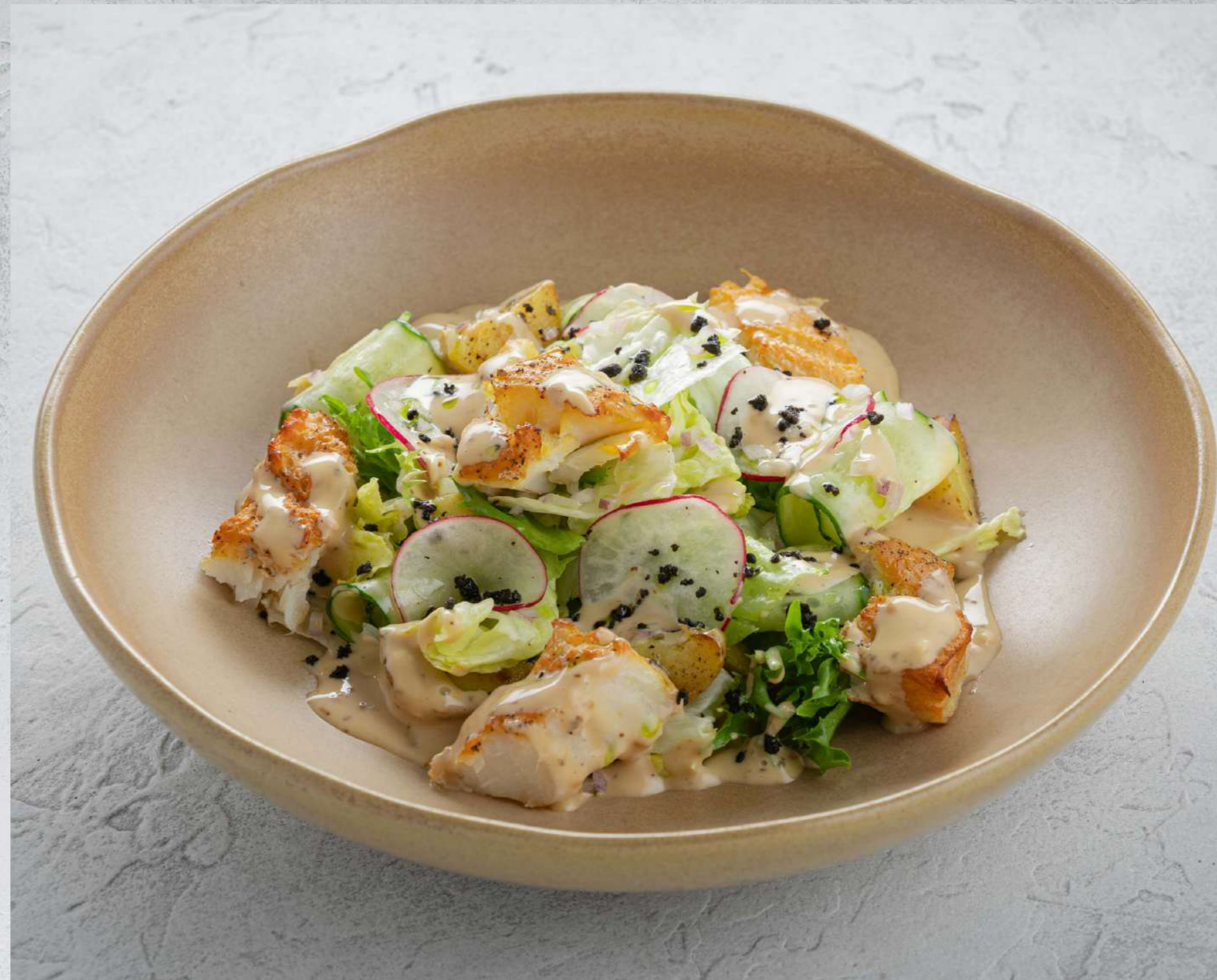
САЛАТ С ТРЕСКОЙ