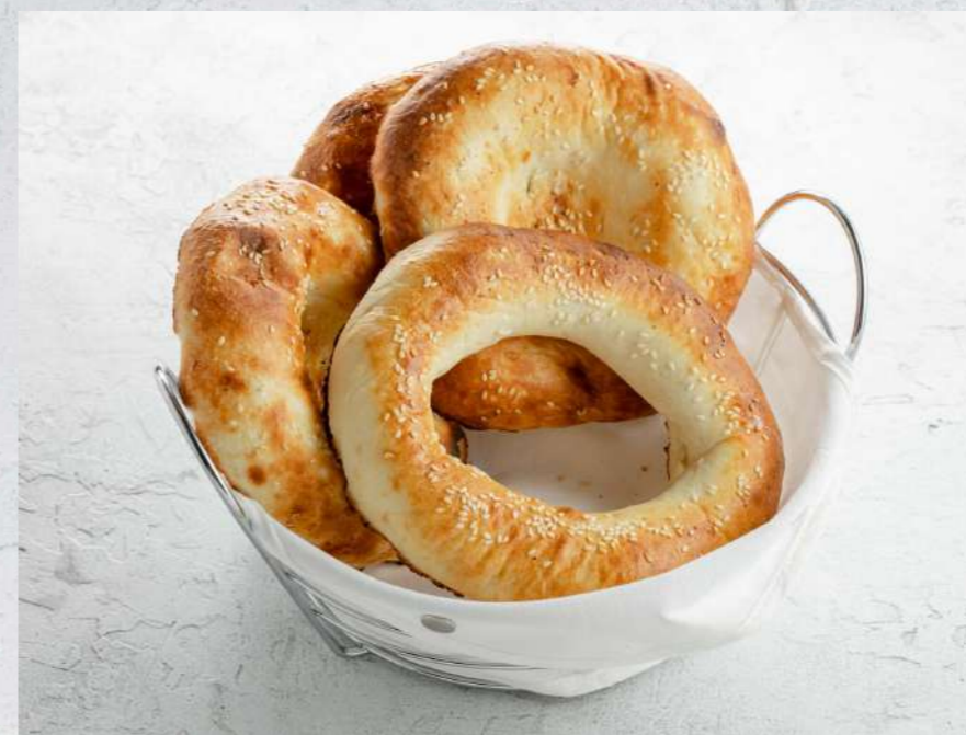
ЛЕПЕШКА ИЗ ТАНДЫРА С СЫРОМ ЛЕПЕШКА ИЗ ТАНДЫРА