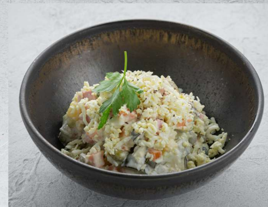
ОЛИВЬЕ С КОЛБАСОЙ 450₹