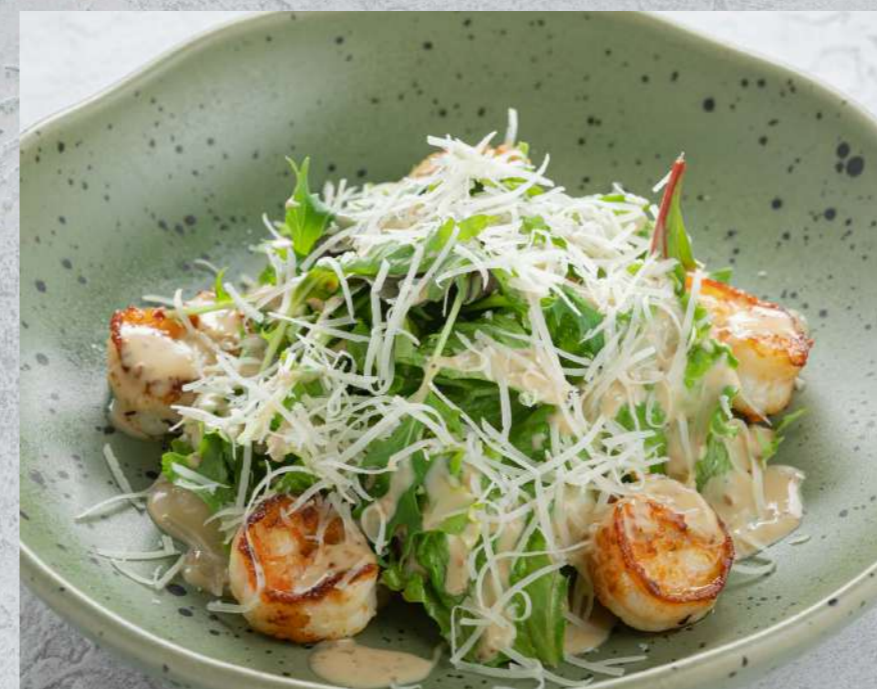
САЛАТ С КРЕВЕТКАМИ* И АВОКАДО 1150₹