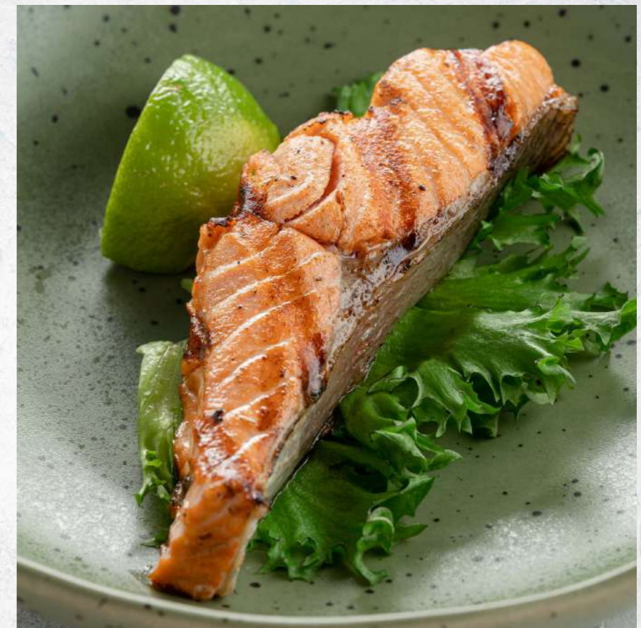
СТЕЙК ФОРЕЛИ НА ГРИЛЕ*