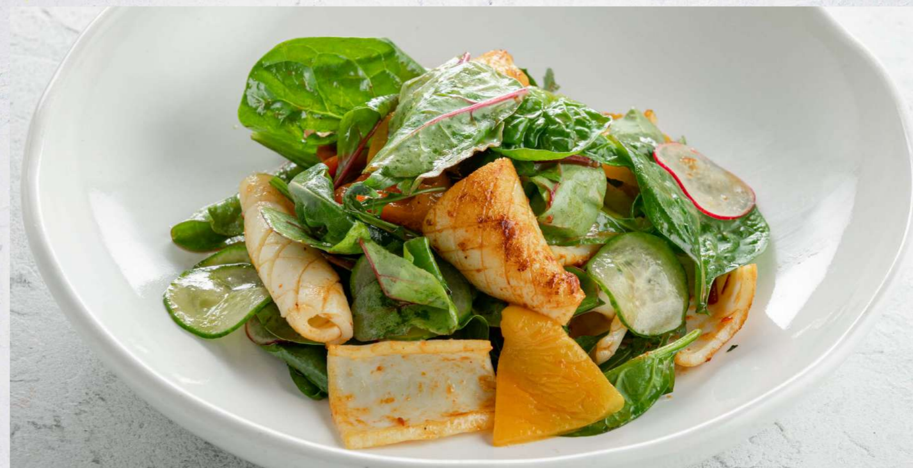
САЛАТ С КАЛЬМАРОМ И ЦИТРУСОВЫМ СОУСОМ* 890₹

ЕСЛИ У ВАС ИМЕЕТСЯ АЛЛЕРГИЯ НА КАКИЕ-ЛИБО ПРОДУКТЫ, ПОЖАЛУЙСТА, СООБЩИТЕ ОБ ЭТОМ ОФИЦИАНТУ