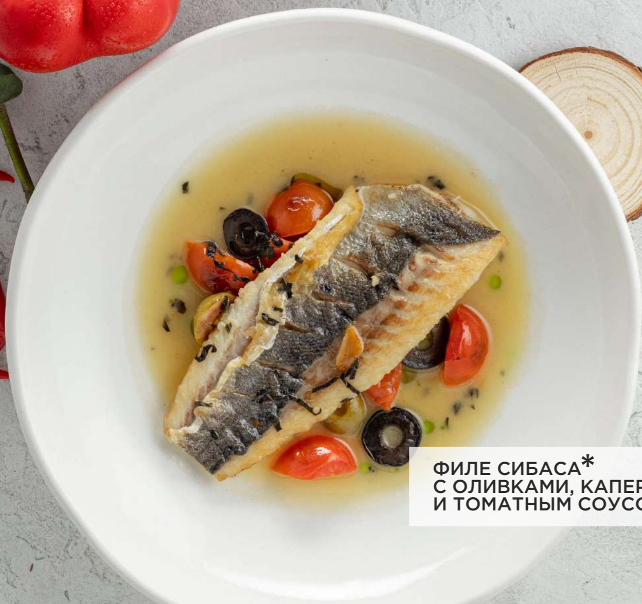
ФИЛЕ СИБАСА* 1290₽ С ОЛИВКАМИ, КАПЕРСАМИ И ТОМАТНЫМ СОУСОМ