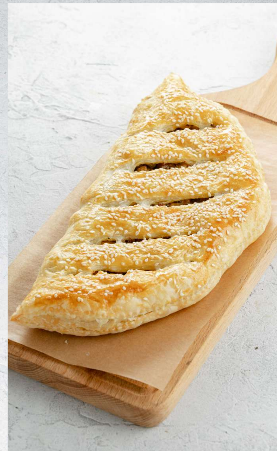
ДОМАШНИЙ ПИРОГ С КУРИЦЕЙ И ГРИБАМИ