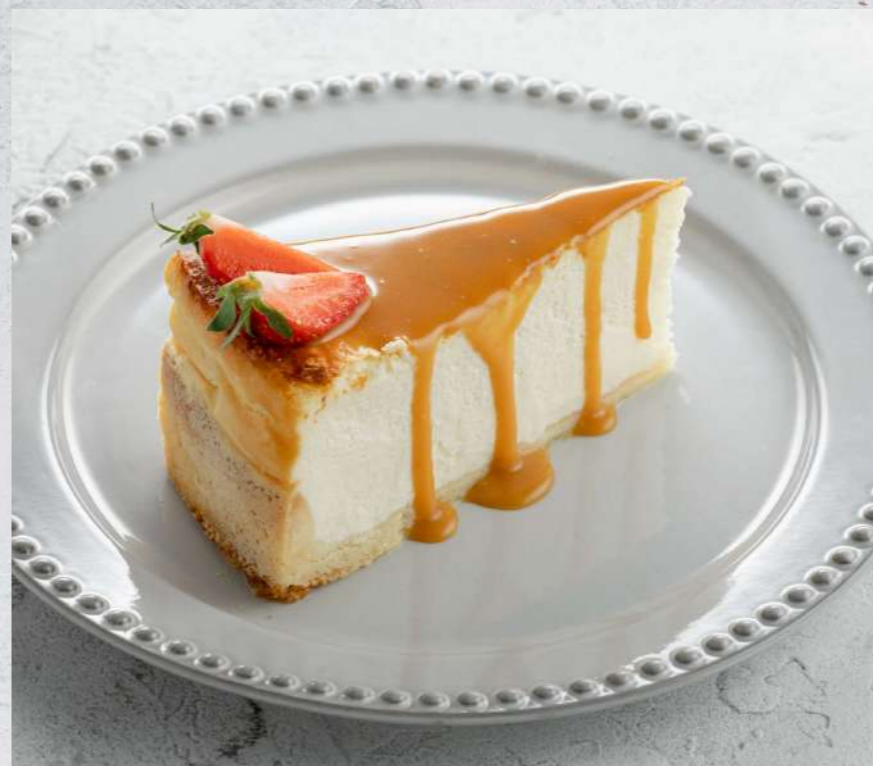
ЧИЗКЕЙК С СОЛЕНОЙ КАРАМЕЛЬЮ