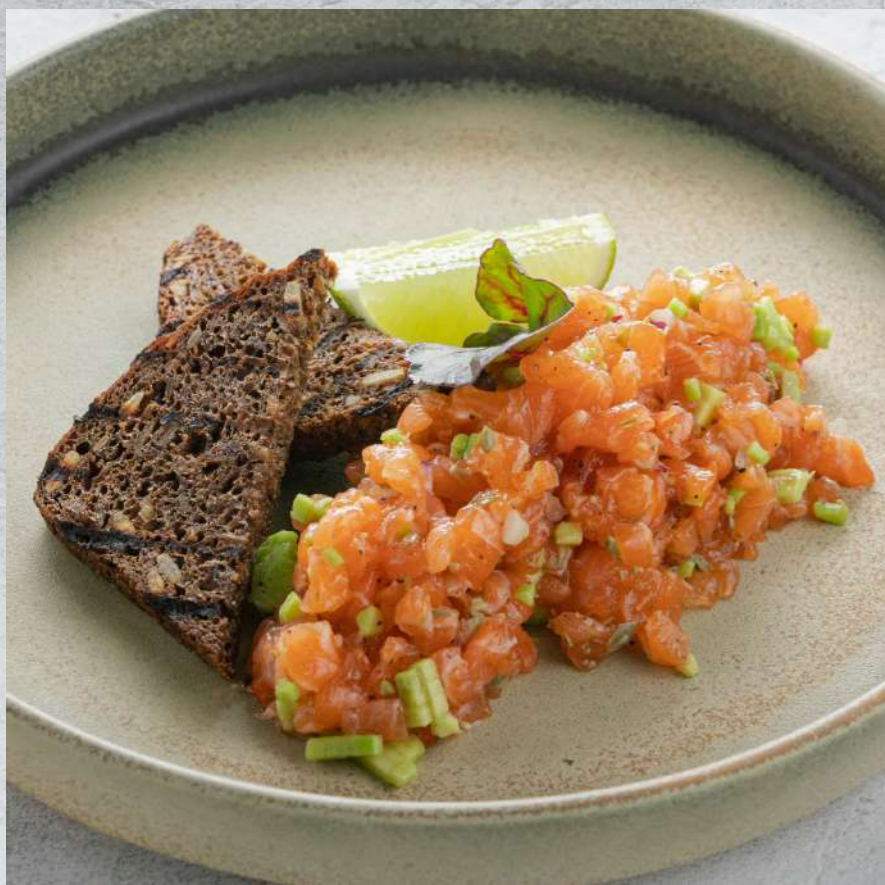
ТАРТАР ИЗ ЛОСОСЯ*