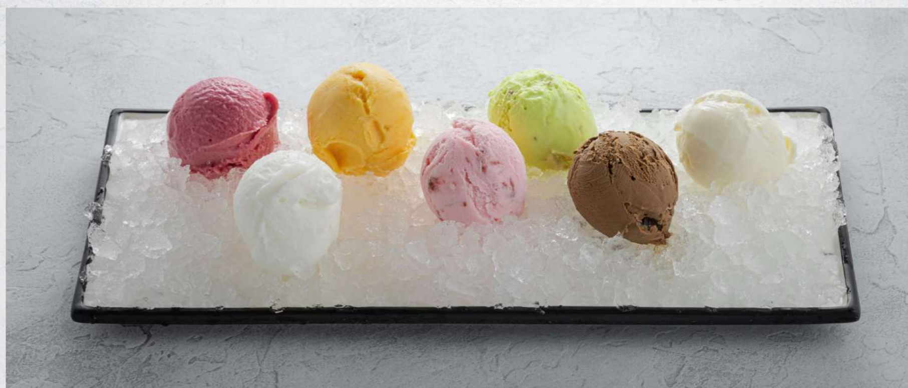
МОРОЖЕНОЕ / СОРБЕТ