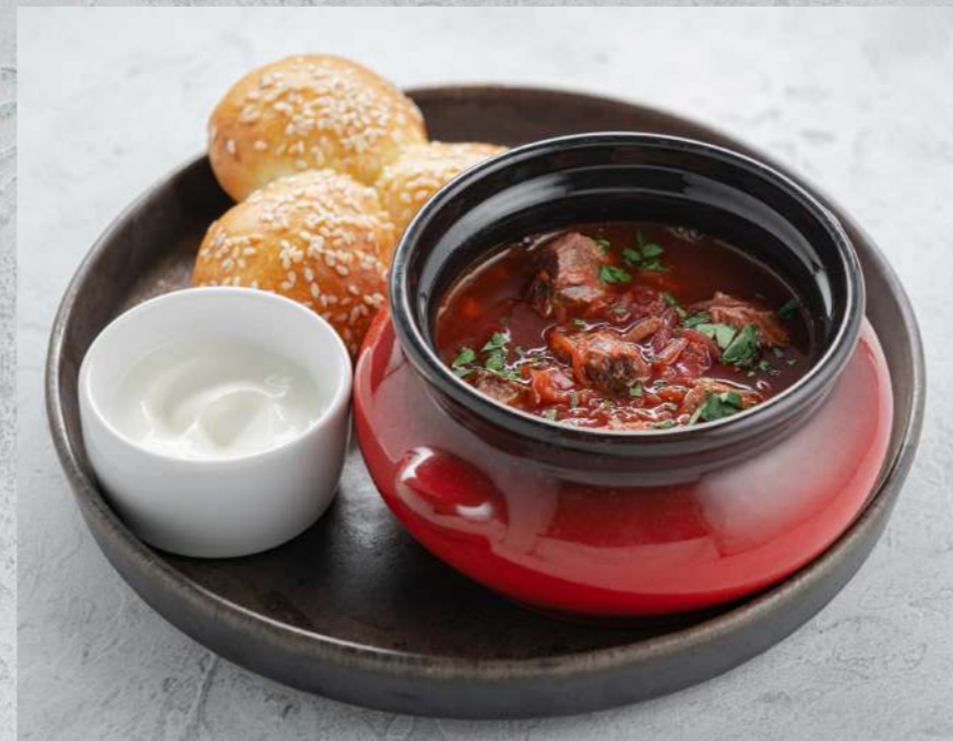
БОРЩ С ПАМПУШКАМИ