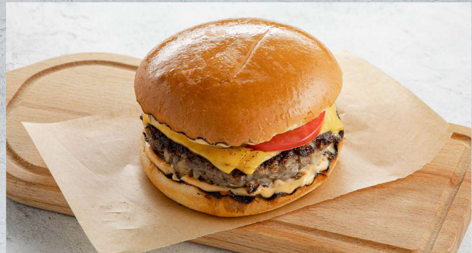
БУРГЕР С БИФШТЕКСОМ ИЗ МРАМОРНОЙ ГОВЯДИНЫ