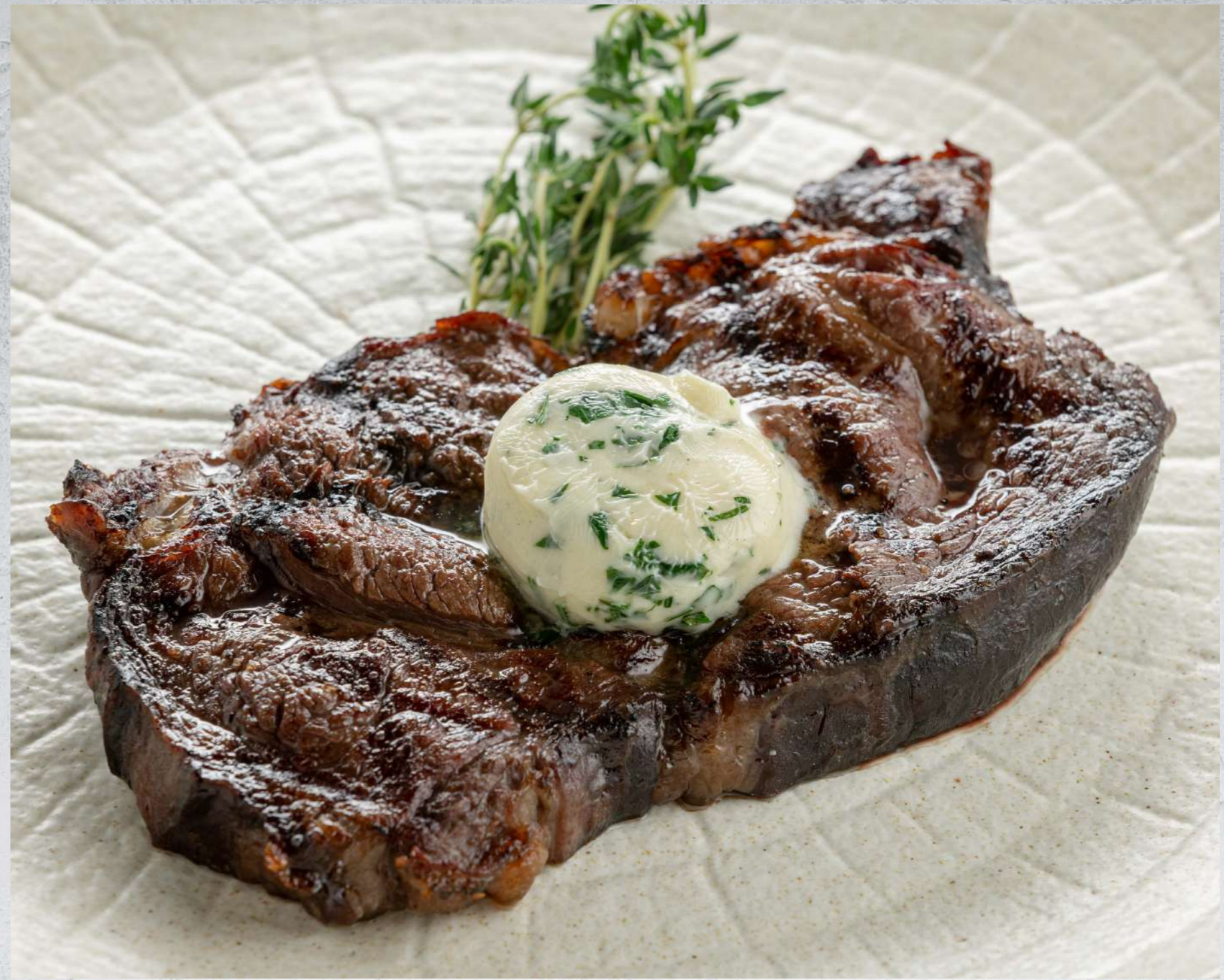
СТЕЙК РИБАЙ (мин. заказ от 200 гр)*