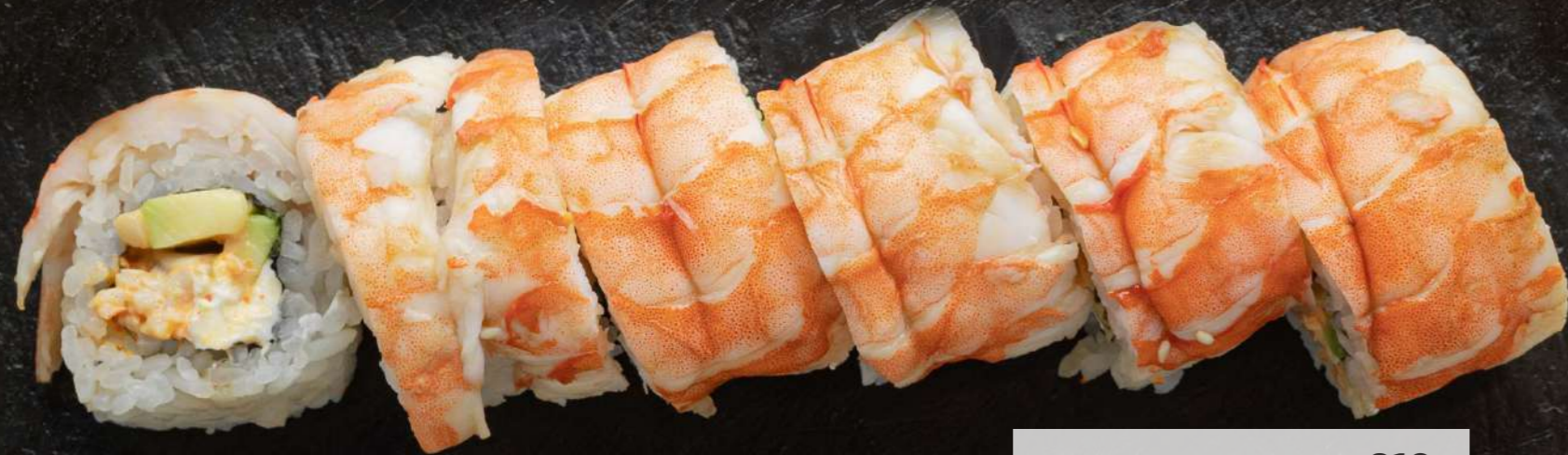
ФИЛАДЕЛЬФИЯ 810₹ С КРЕВЕТКОЙ