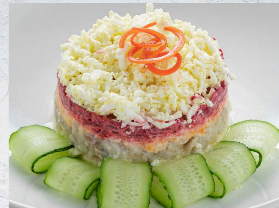
СЕЛЕДКА ПОД ШУБОЙ 460₹