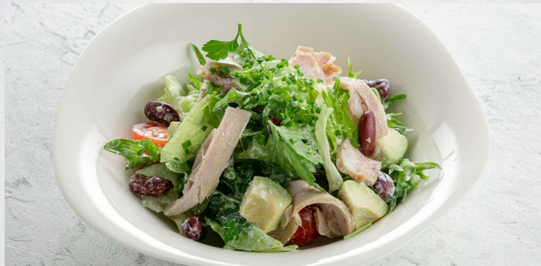
САЛАТ С ИНДЕЙКОЙ, АВОКАДО И ФАСОЛЬЮ