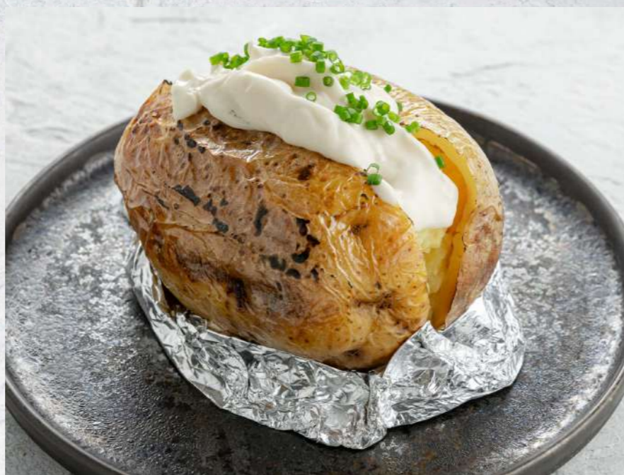
ЗАПЕЧЕННЫЙ КАРТОФЕЛЬ СО СЛИВОЧНЫМ СЫРОМ