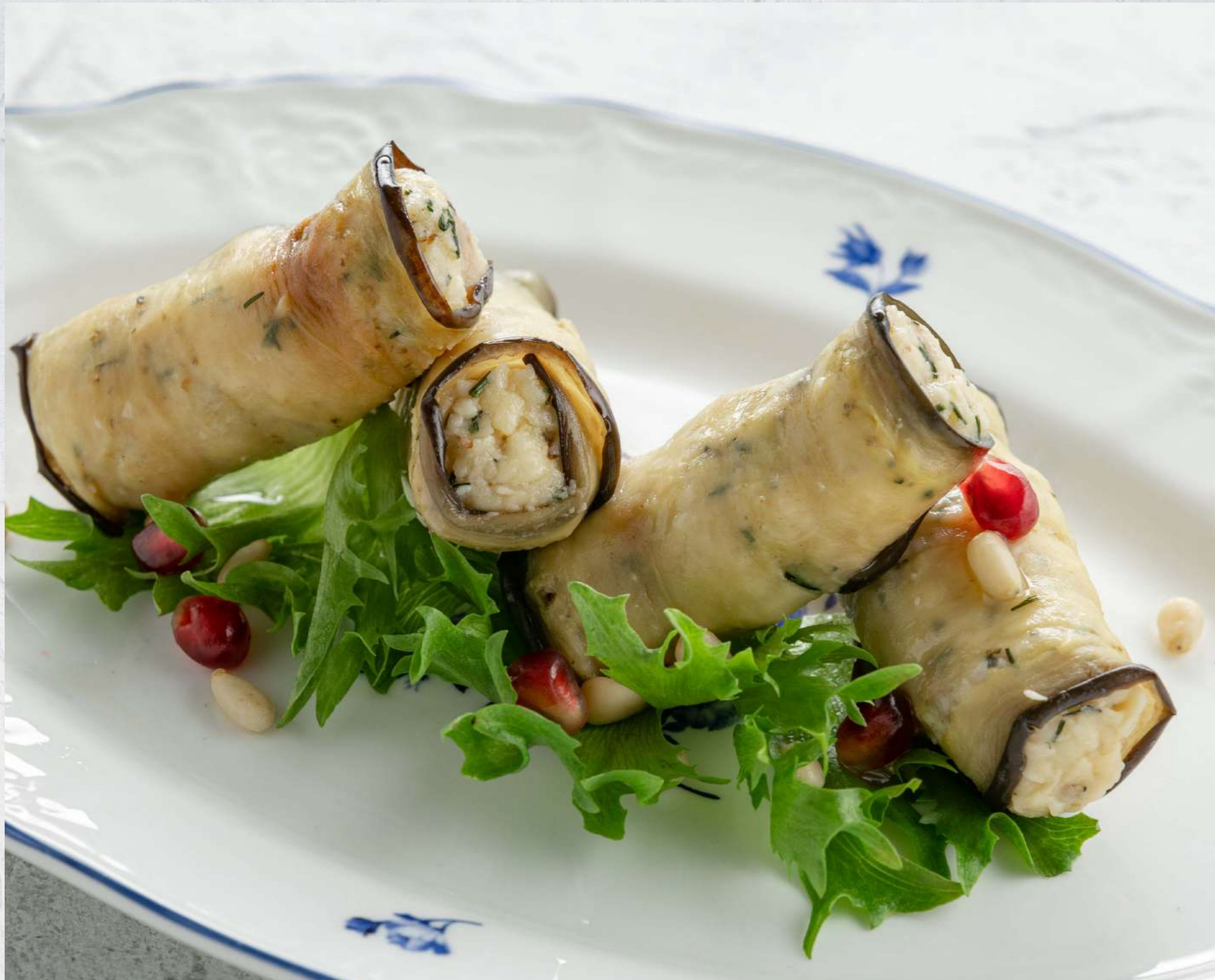
РУЛЕТКИ ИЗ БАКЛАЖАНОВ