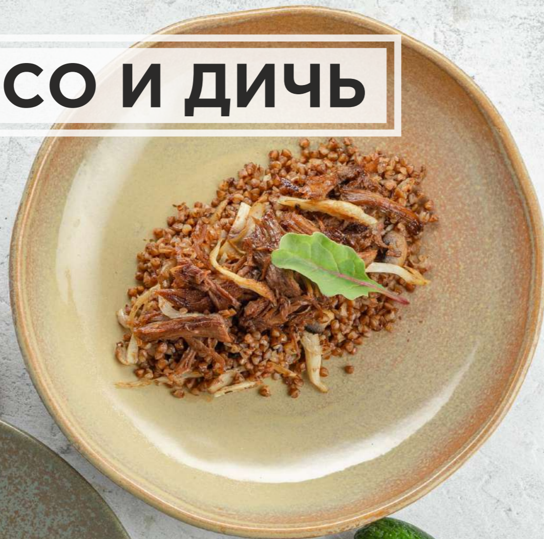
УТКА С ГРЕЧЕЙ* 940₽