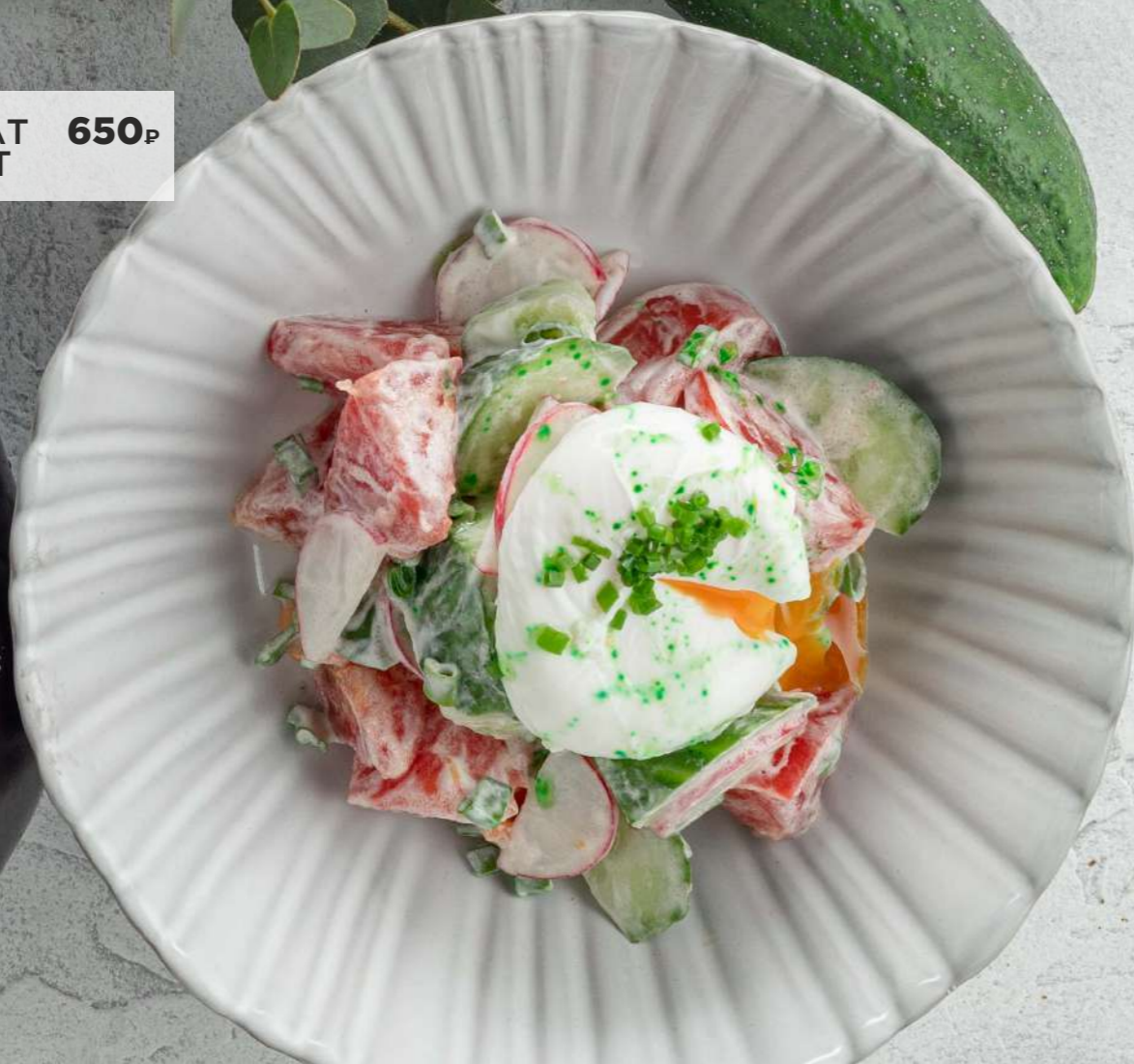
ОВОЩНОЙ САЛАТ С ЯЙЦОМ ПАШОТ 650₹