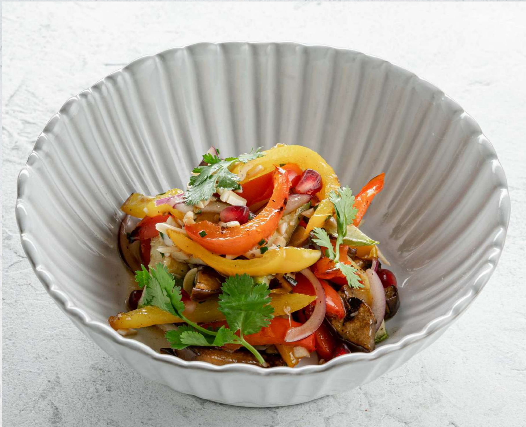
САЛАТ С ПЕЧЕНЫМИ ОВОЩАМИ