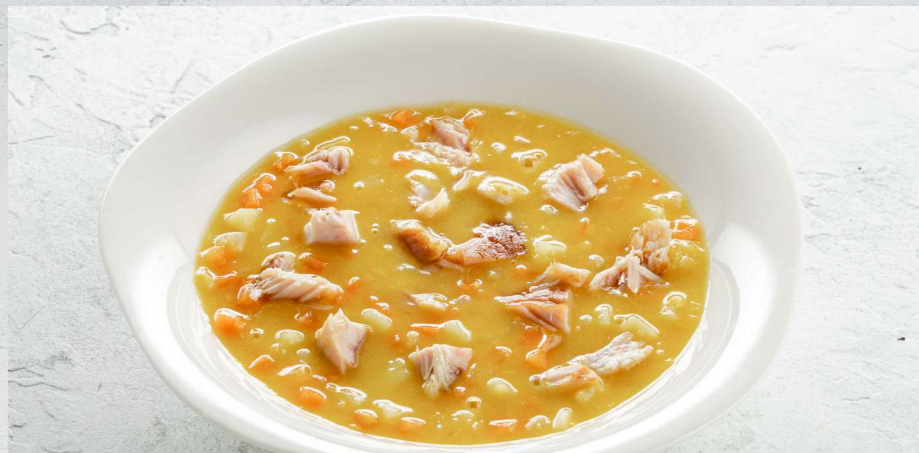
ГОРОХОВЫЙ СУП С КОПЧЕНОСТЯМИ