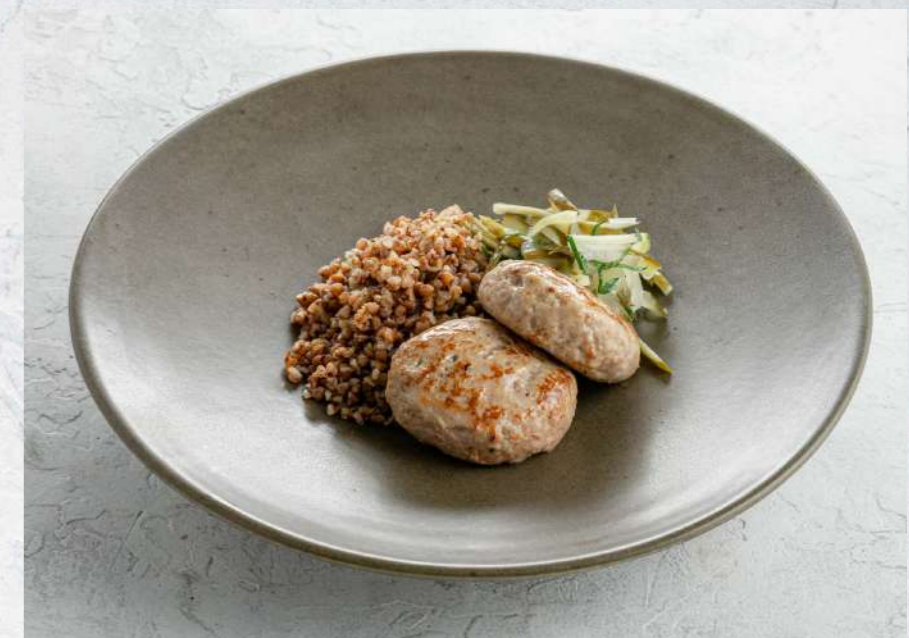
ДОМАШНИЕ КОТЛЕТЫ С ГРЕЧЕЙ