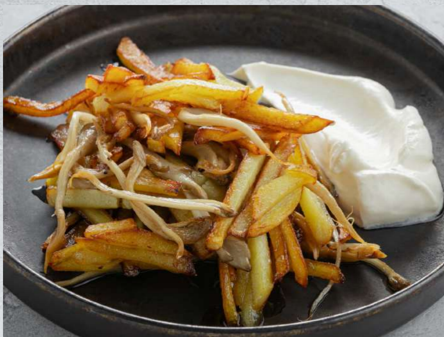
КАРТОФЕЛЬ ЖАРЕНый С ГРИБАМИ