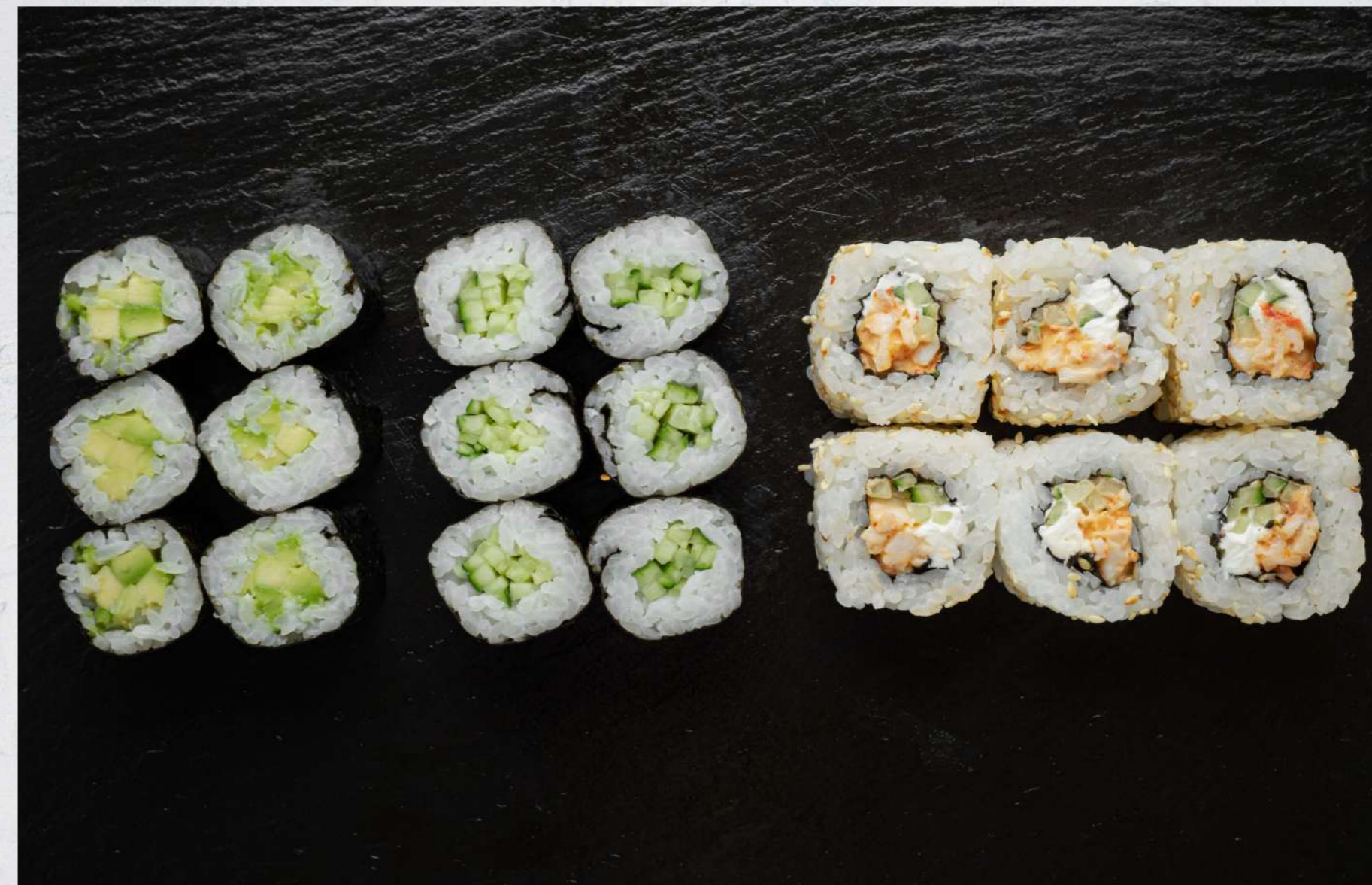
РОЛЛ С АВОКАДО 390₹