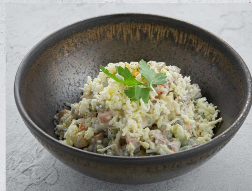
ОЛИВЬЕ С ГОВЯДИНОЙ 490₹