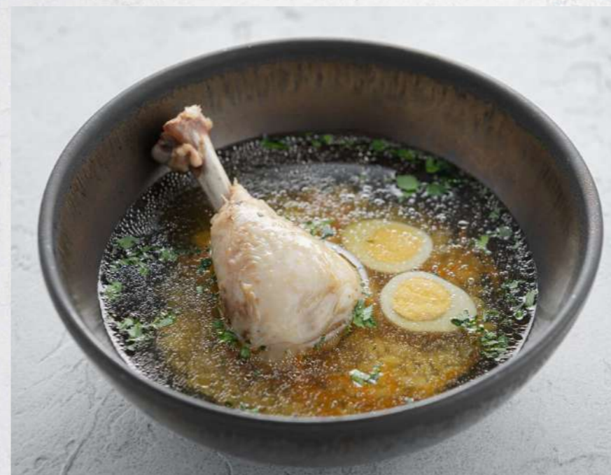
КУРИНЫЙ СУП С ОРЗО