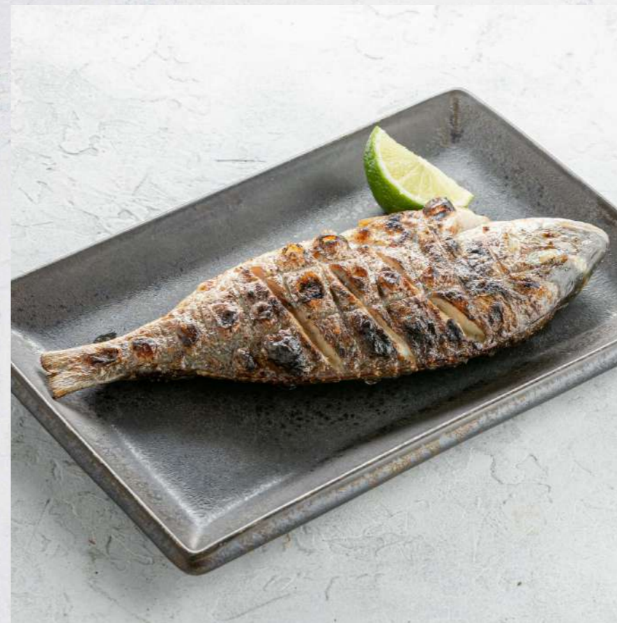
ДОРАДА НА ГРИЛЕ*