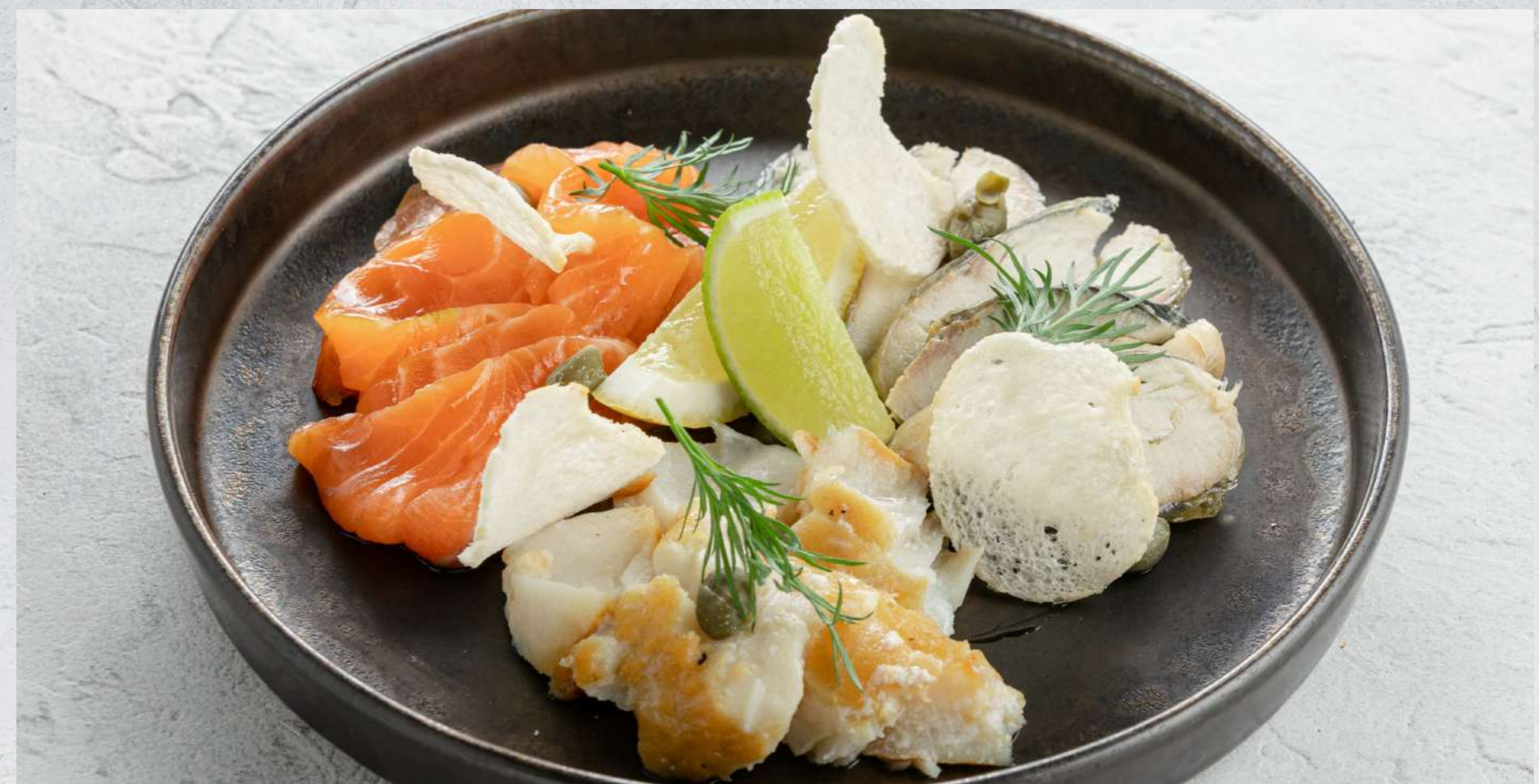
РЫБНОЕ АССОРТИ (форель с/с, треска г/к, рулет из скумбрии г/к)*