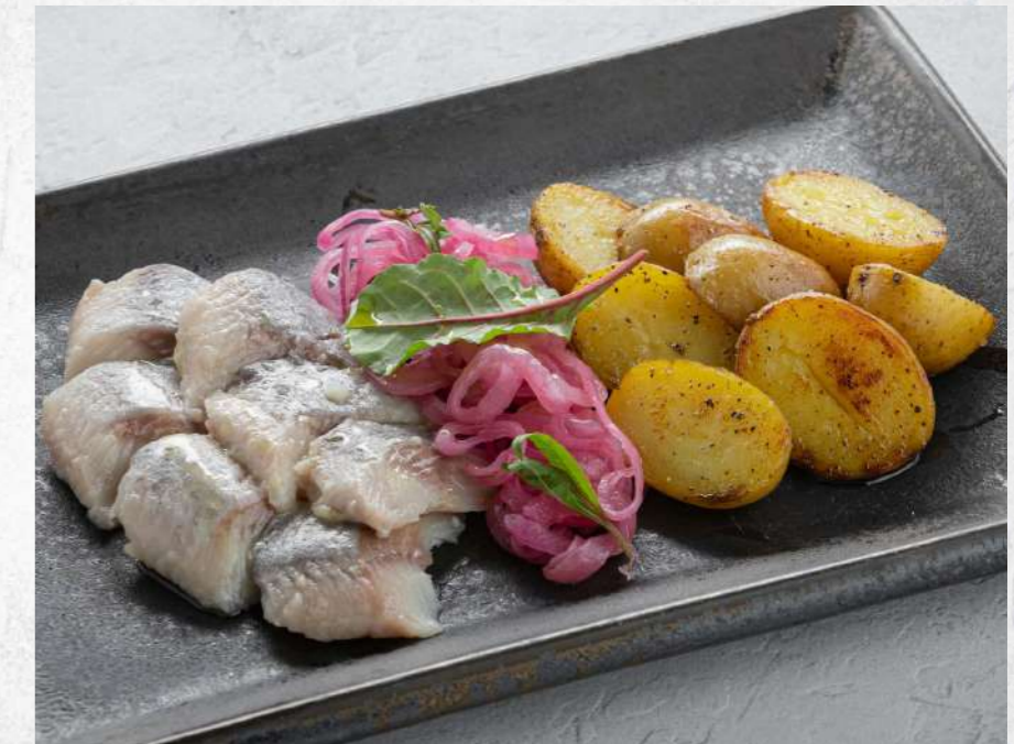
СЕЛЬДЬ С МОЛОДЫМ КАРТОФЕЛЕМ