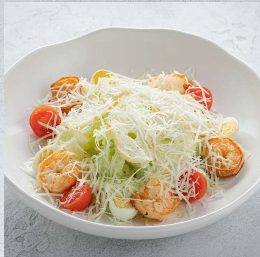
ЦЕЗАРЬ С КРЕВЕТКАМИ ЦЕЗАРЬ С ЦЫПЛЕНКОМ