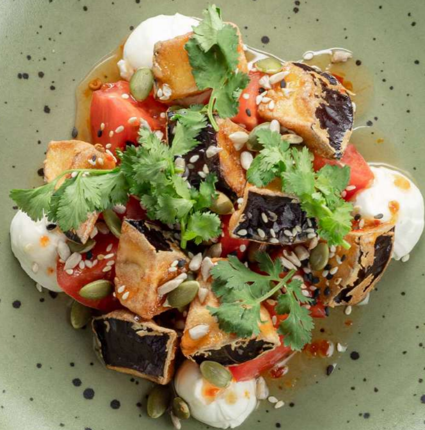
САЛАТ С ХРУСТЯЩИМИ БАКЛАЖАНАМИ И СЛИВОЧНЫМ СЫРОМ 690₹