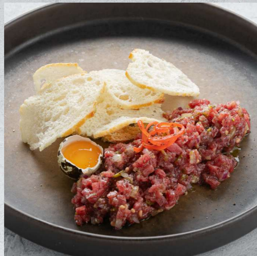
ТАРТАР ИЗ ГОВЯДИНЫ