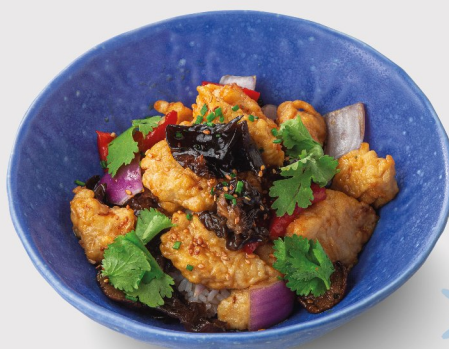
Цыплёнок с грибами шиитаке на рисе