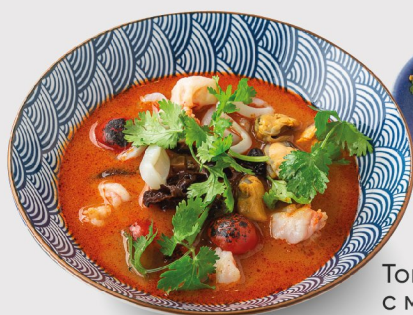
Том Ям с морепродуктами 450 гр. 520.-