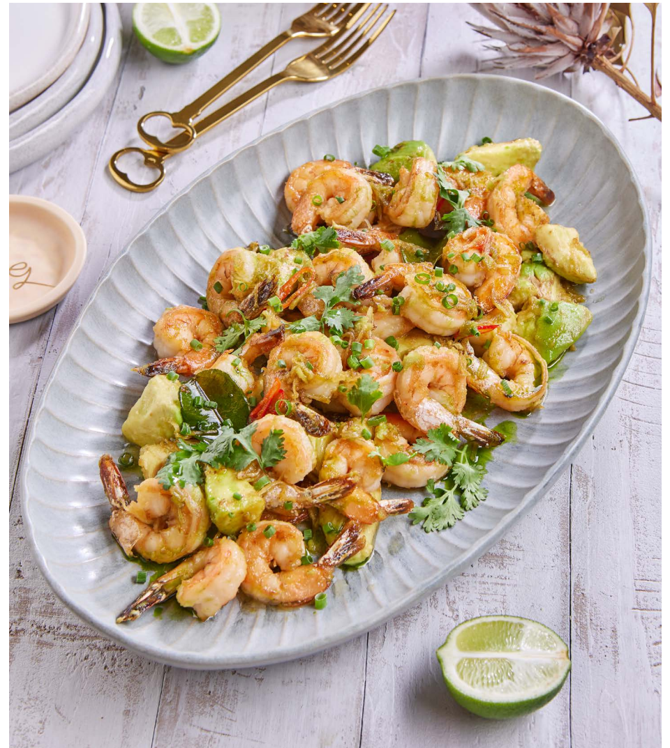
Креветки имбирные с жареным авокадо на 5-7 персон 4500 ₽ (800 г)