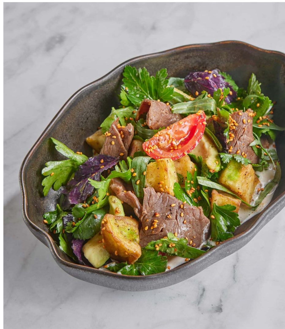
Салат с телятиной и хрустящими баклажанами 1100 ₺ (300 г)