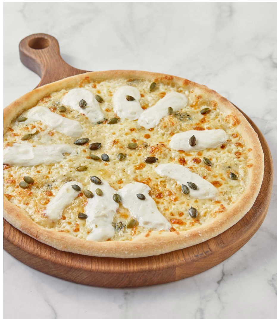
4 сыра 790 ₽ (345 г)