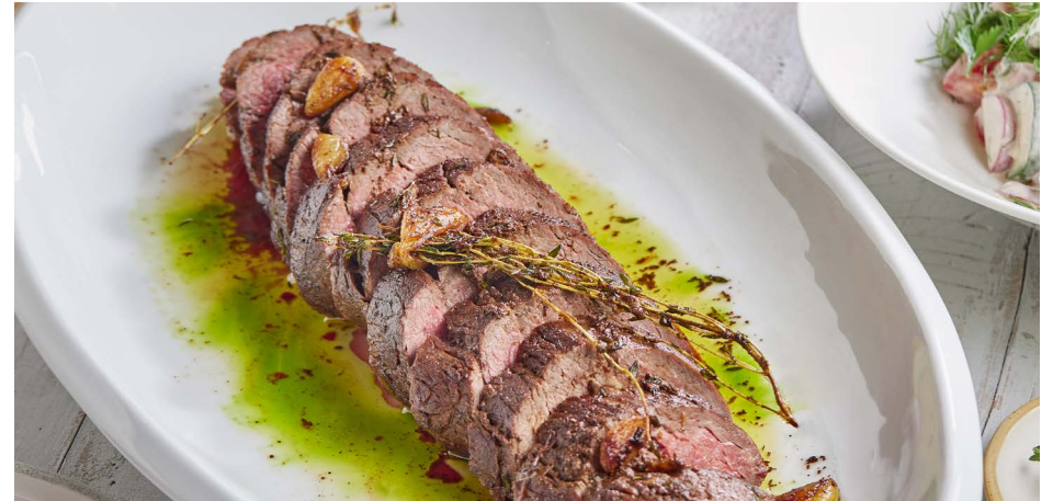
Жареная говяжья вырезка с домашним салатом, на 6-8 персон 14500 ₽ (1850 г)