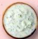
Рис Басмати с добавлением Орзо