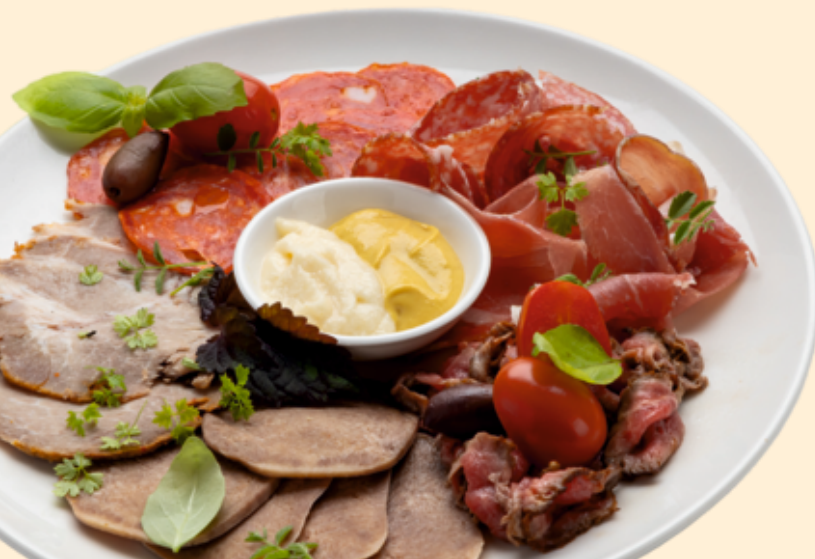
Мясное ассорти Cold cuts