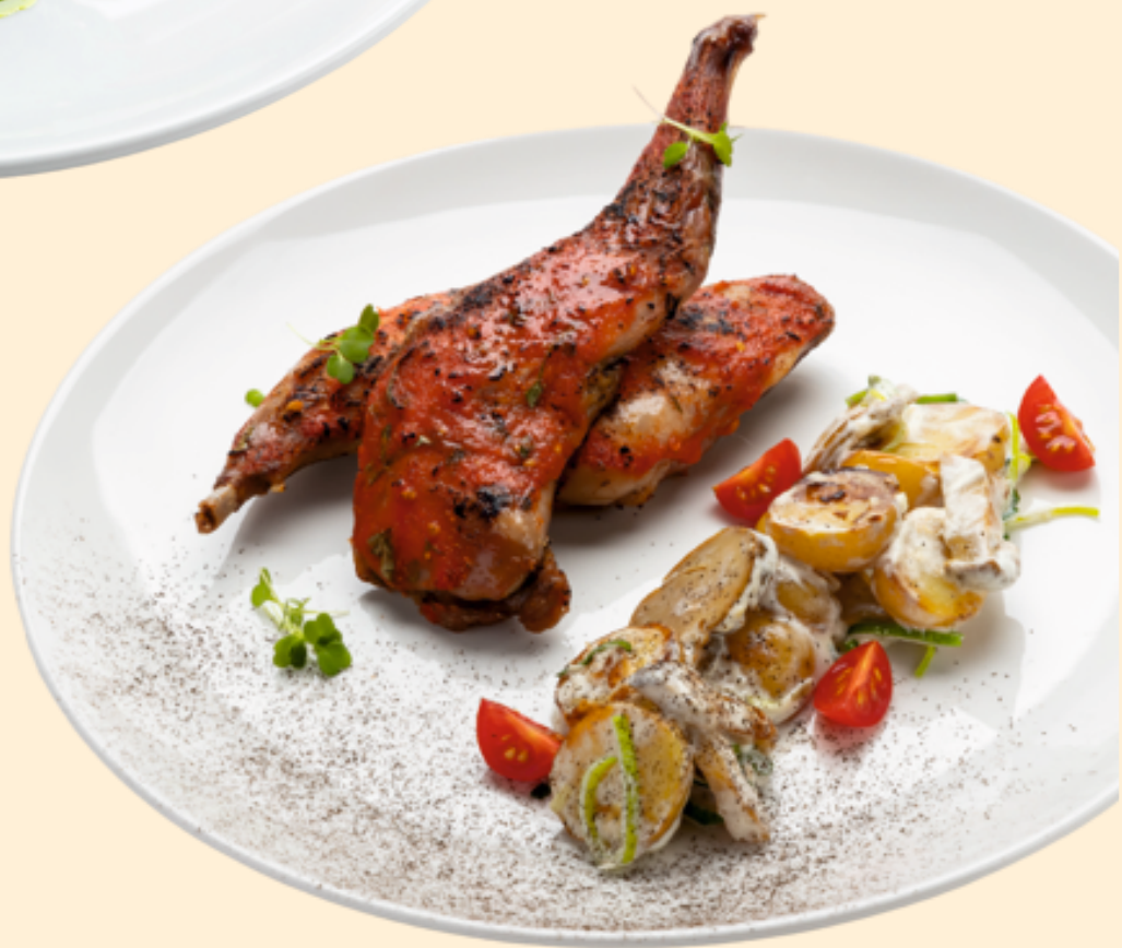
Ножка кролика с картофелем и грибами Rabbit legs with potatoes and mushrooms