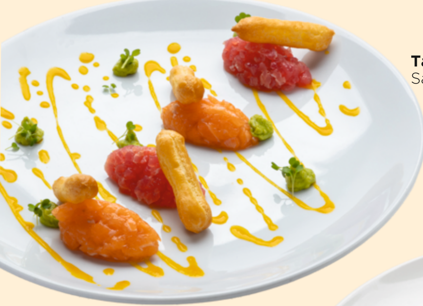
Тар-тар из лосося и тунца Salmon and tuna tartare