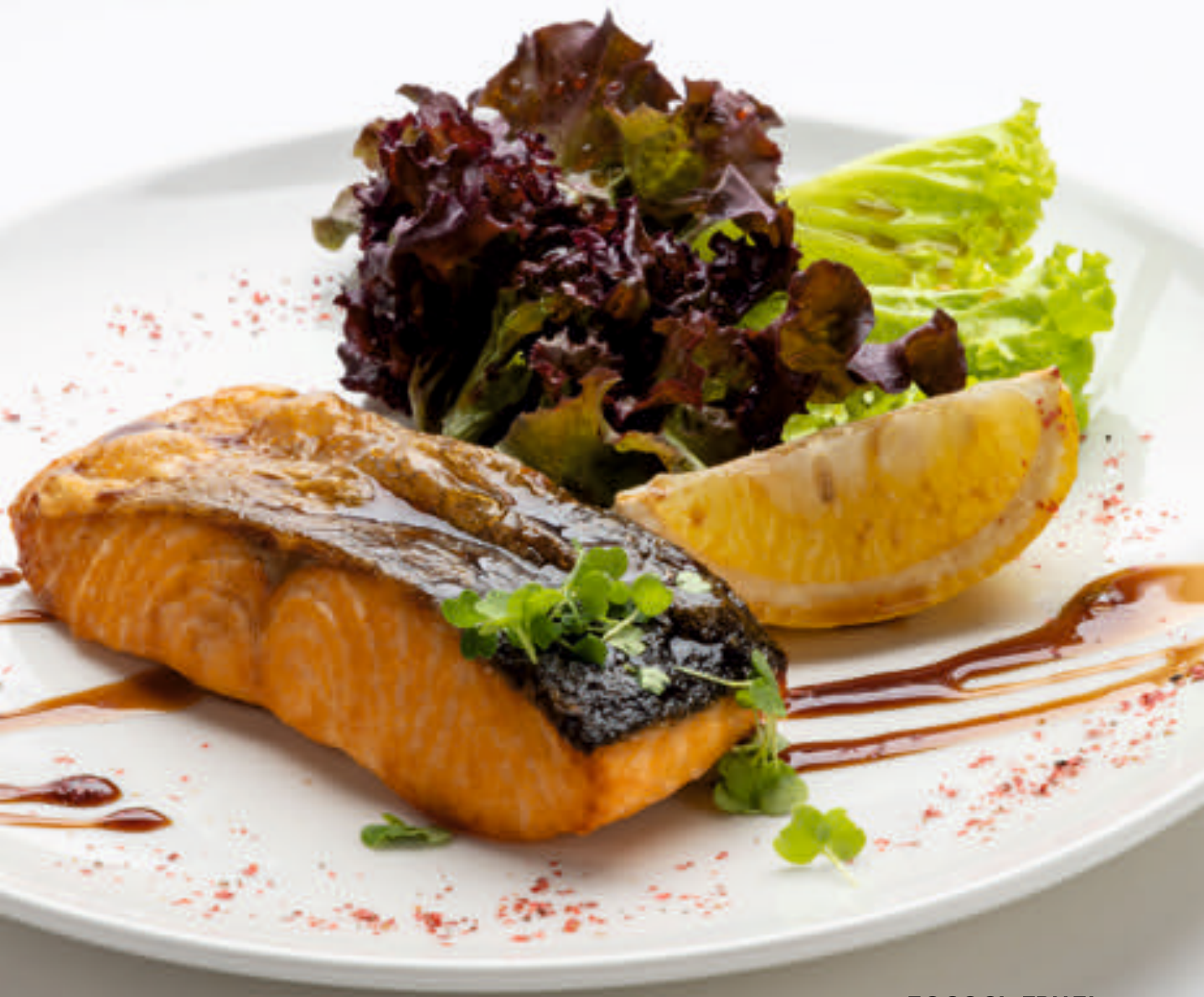
ЛОСОСЬ ГРИЛЬ GRILLED SALMON