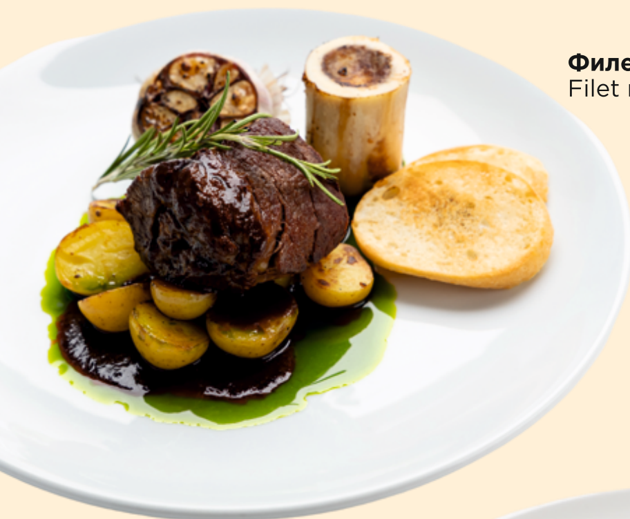
Филе миньон Filet mignon