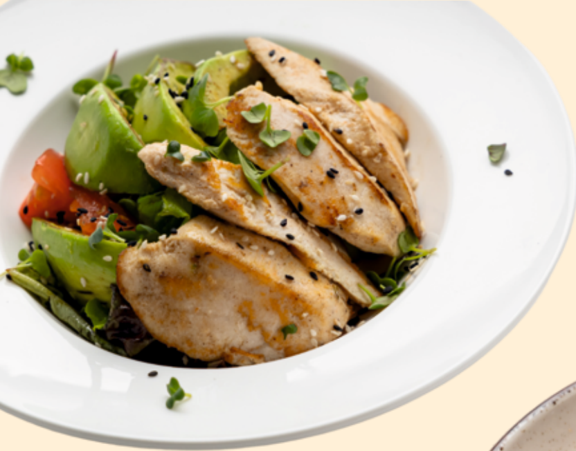
Салат авокадо гриль с жареной куриной грудкой и свежими овощами Grilled avocado salad with fried chicken breast and fresh vegetables