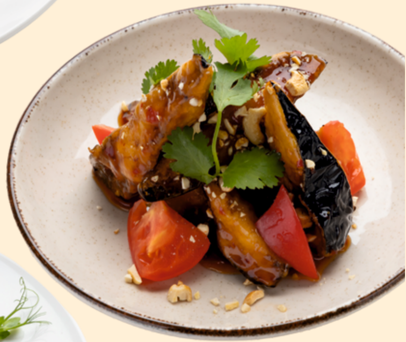
Хрустящие баклажаны Crispy eggplant