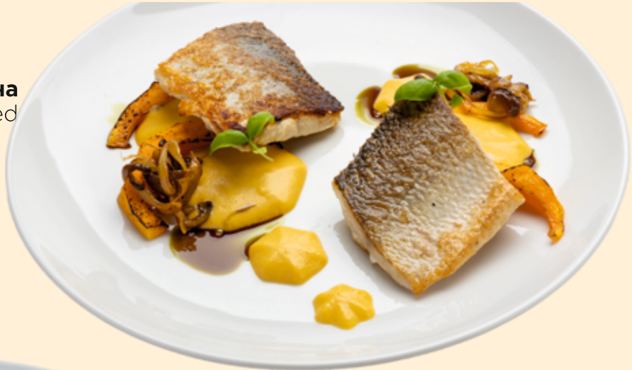
Филе Муксуна Muksun fillet baked