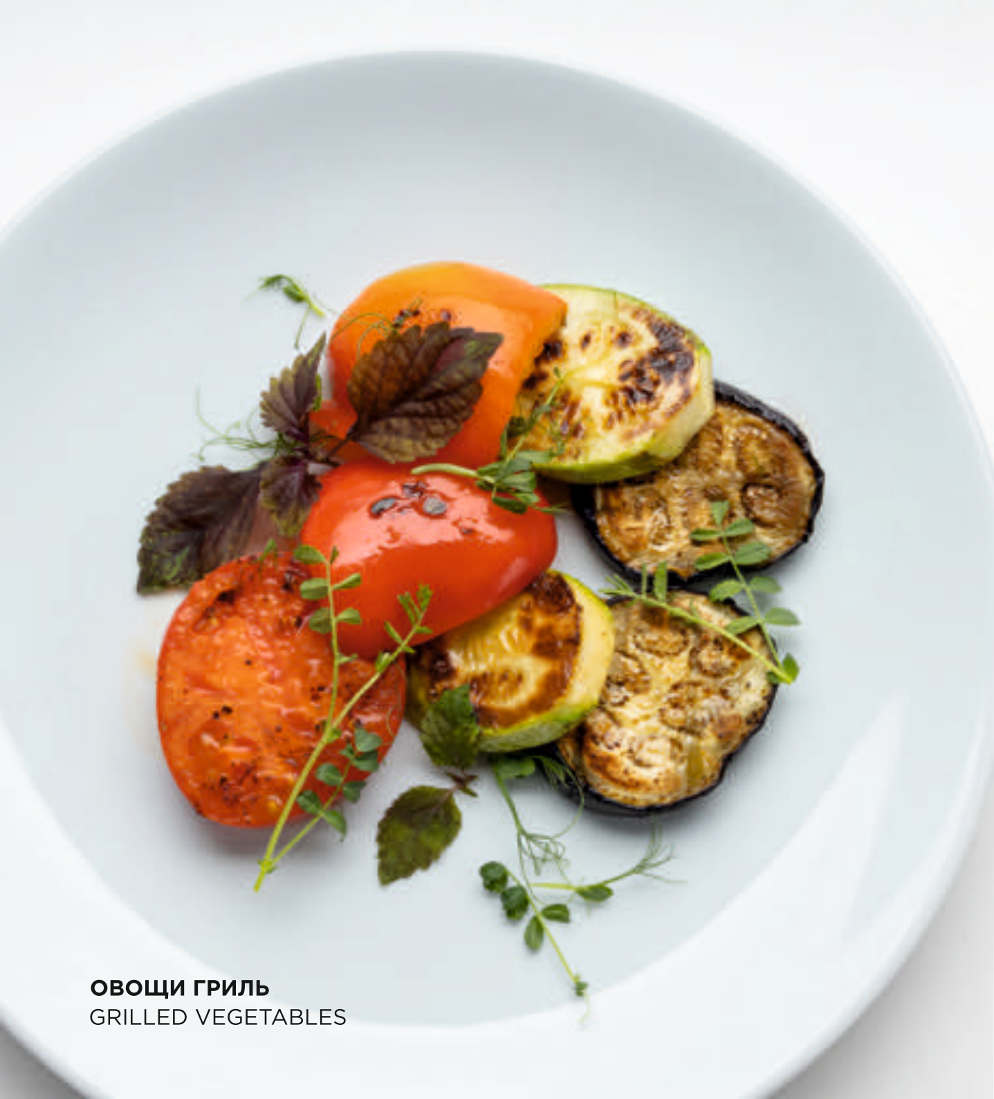
ОВОЦИ ГРИЛЬ GRILLED VEGETABLES