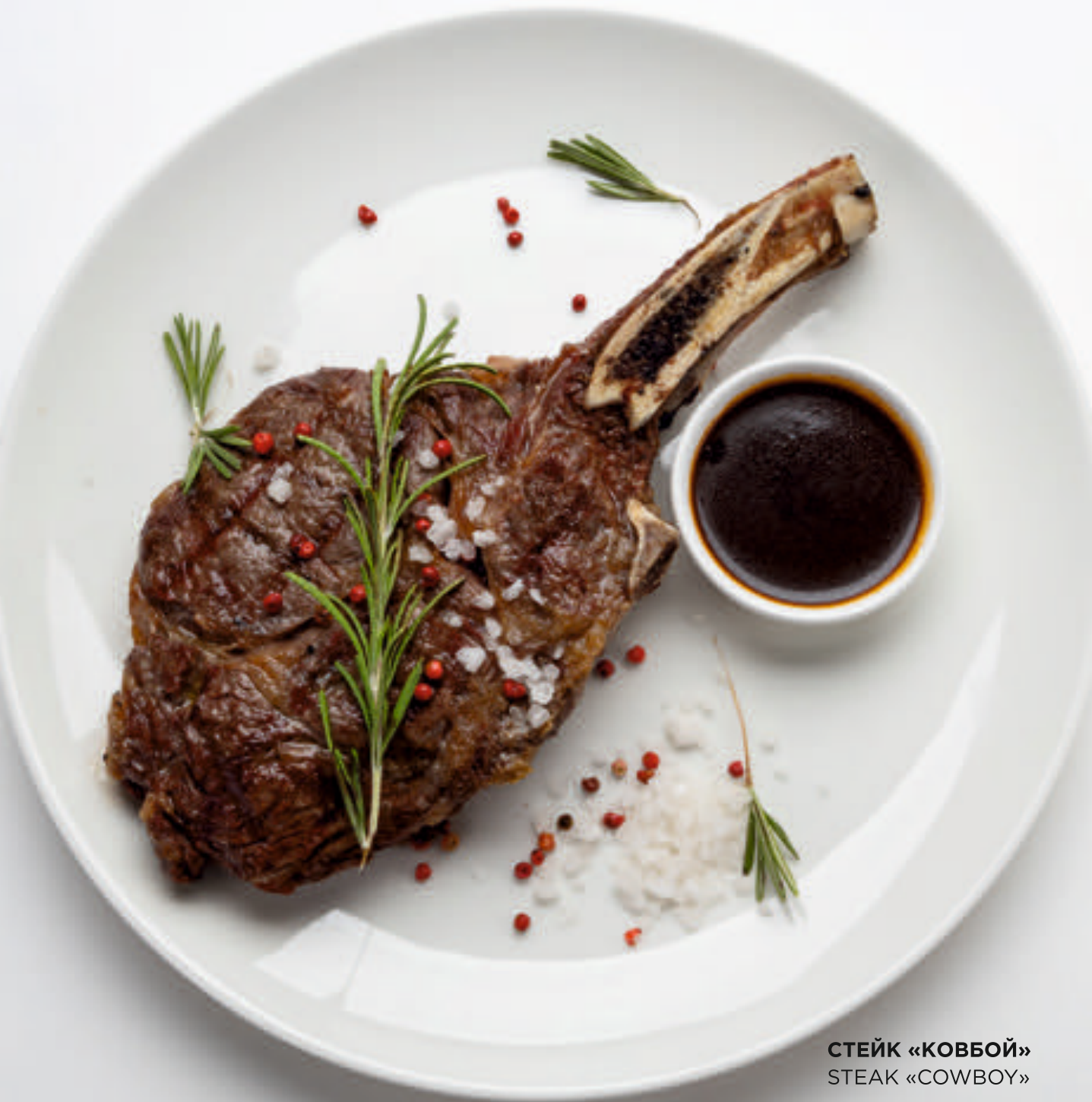
СТЕЙК «КОВБОЙ» STEAK «COWBOY»