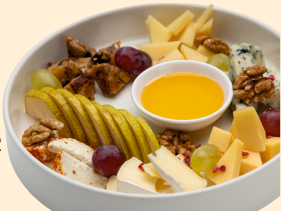
Сырная тарелка Cheese plate