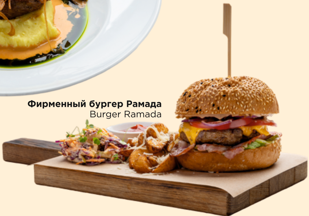
Фирменный бургер Рамада Burger Ramada