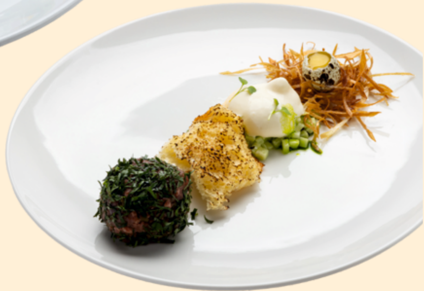
Тар-тар из пиканьи с муссом пармезан Tar tar of pikanya with parmesan mousse