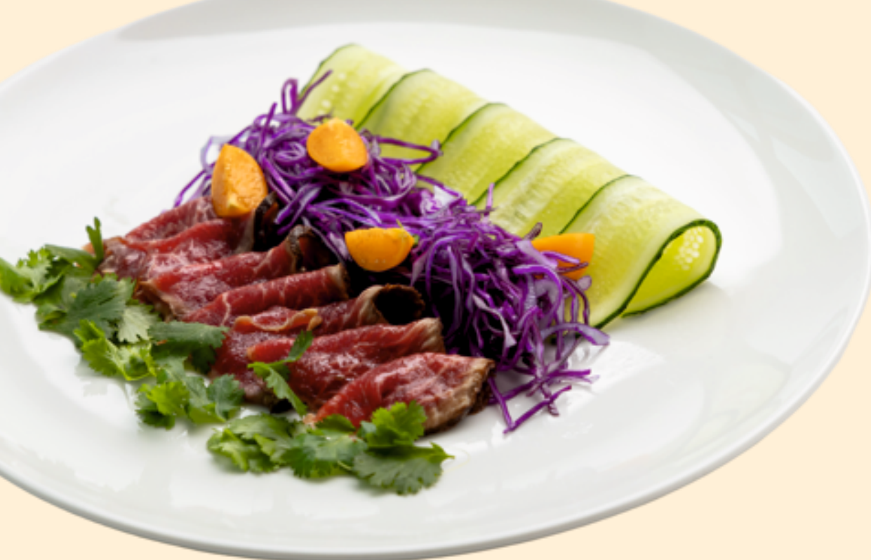
Ростбиф со свежими огурцами Roast beef with fresh cucumbers