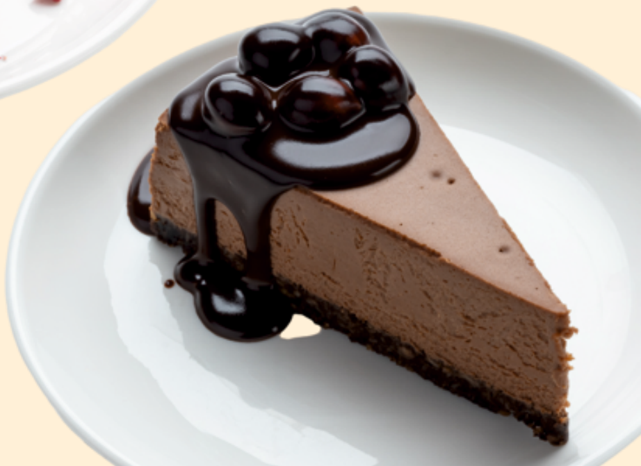
Чизкейк шоколадный Chocolate Cheesecake