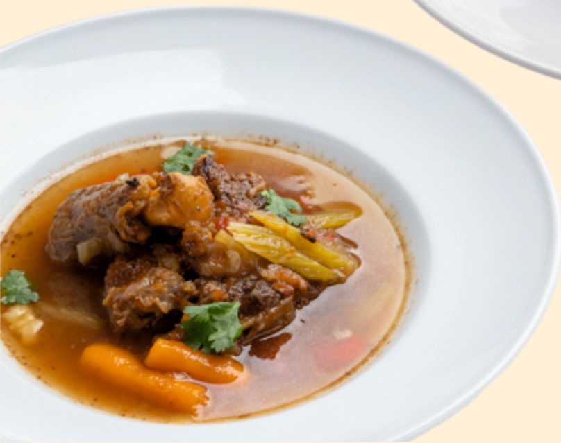
Суп из томленных хвостов молодых телят с овощами Onion soup on white wine with parmesan baked toast