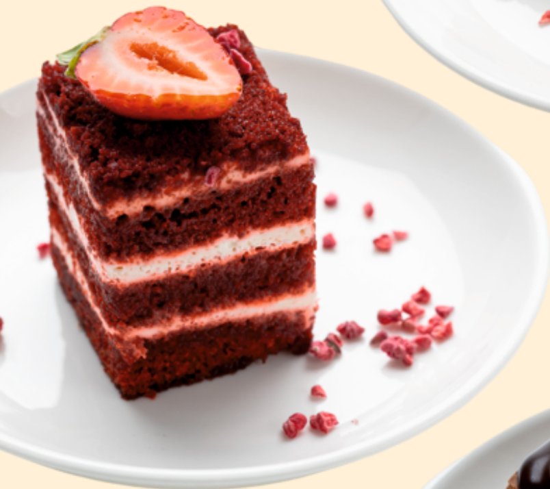
Торт Красный бархат Cake Red velvet