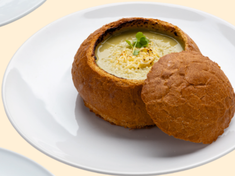
Вишисуаз Vichysoise Крем -суп из лука порея