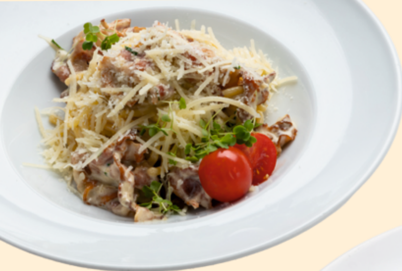
Паста Карбонара Carbonara