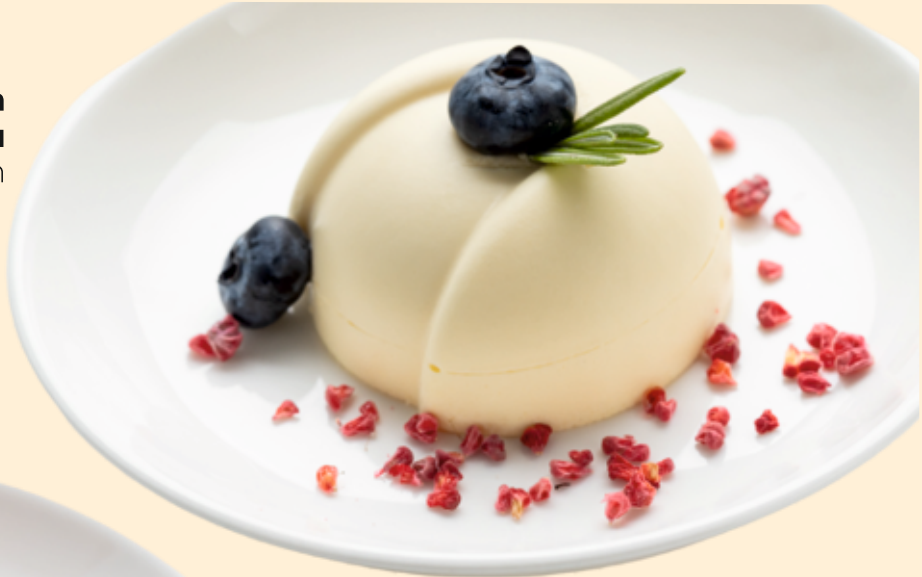
Панна котта мандариновая Panna Cotta mandarin