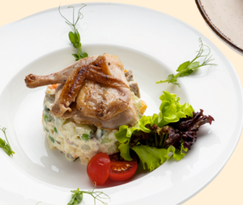
Оливье с языком и перепелкой на гриле Olivier with beef tongue and grilled quail