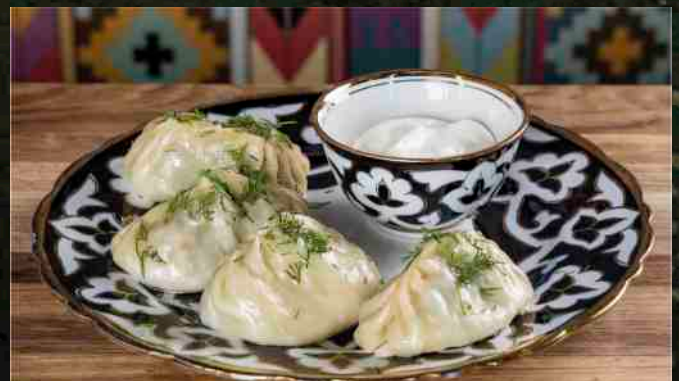
МАНТЫ НА ПАРУ (4 шт) рубленая говядина, сметана