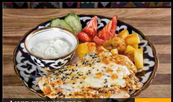
ФИЛЕ КУРИНОЕ ПОД СЫРНОЙ КОРОЧКОЙ