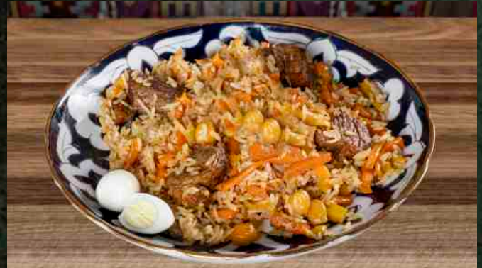
ПЛОВ С ГОВЯДИНОЙ