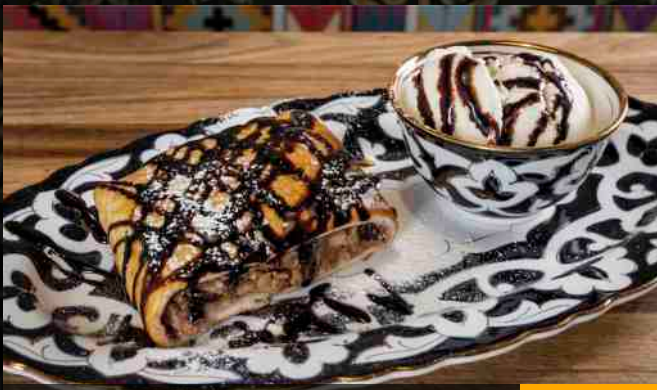
ШТРУДЕЛЬ ЯБЛОЧНЫЙ С МОРОЖЕНЫМ