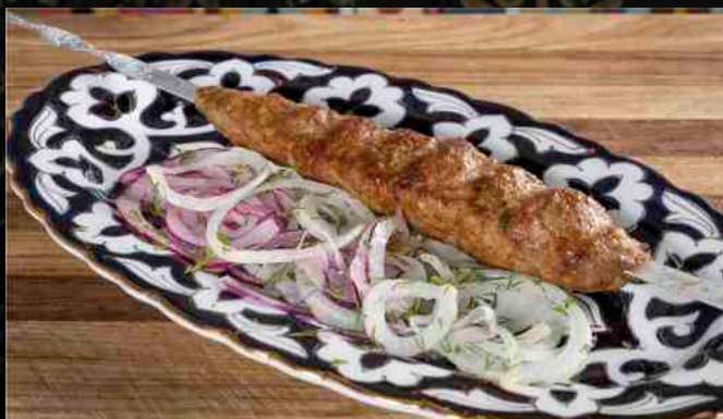
ЛЮЛЯ КЕБАБ завяжна