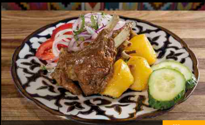
КАЗАН КЕБАБ тушеные бараньи ребрышки с картофелем