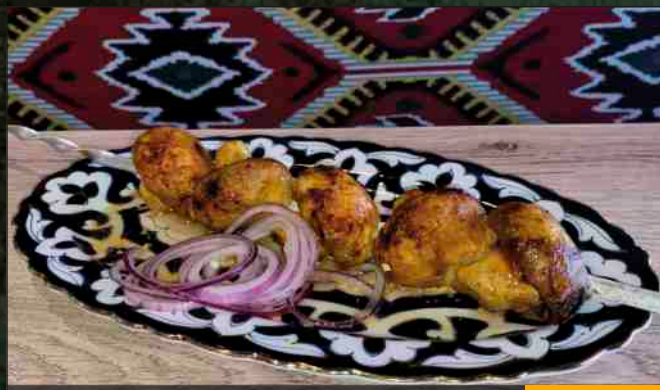
ГРИБЫ НА МАНГАЛЕ