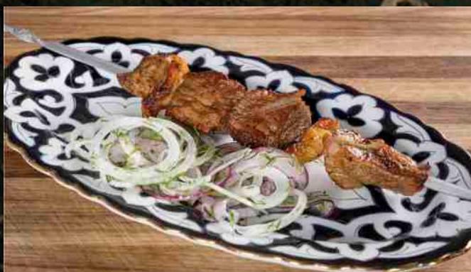
МЯКОТЬ МОЛОДОГО БАРАШКА