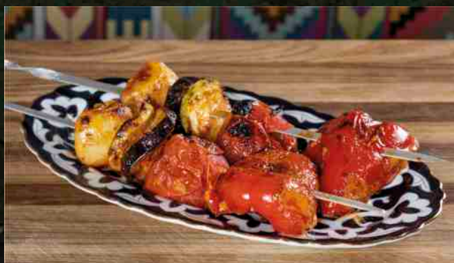
ОВОЩИ НА МАНГАЛЕ