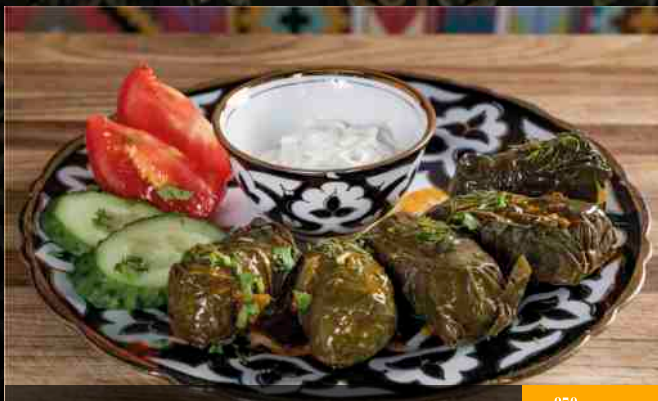
ДОЛМА (3 шт) говядина, белый соус