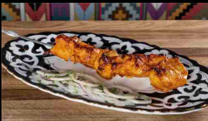
ШАШЛИК ИЗ ДОМАШНЕЙ КУРИЦЫ