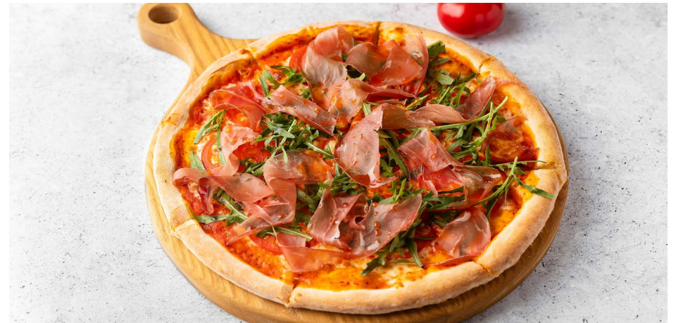
С пармой и руколой 890 ₽ (415 г)