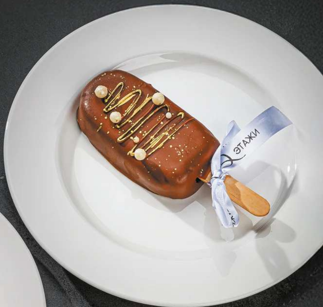
ПИРОЖНОЕ ЭСКИМО 260