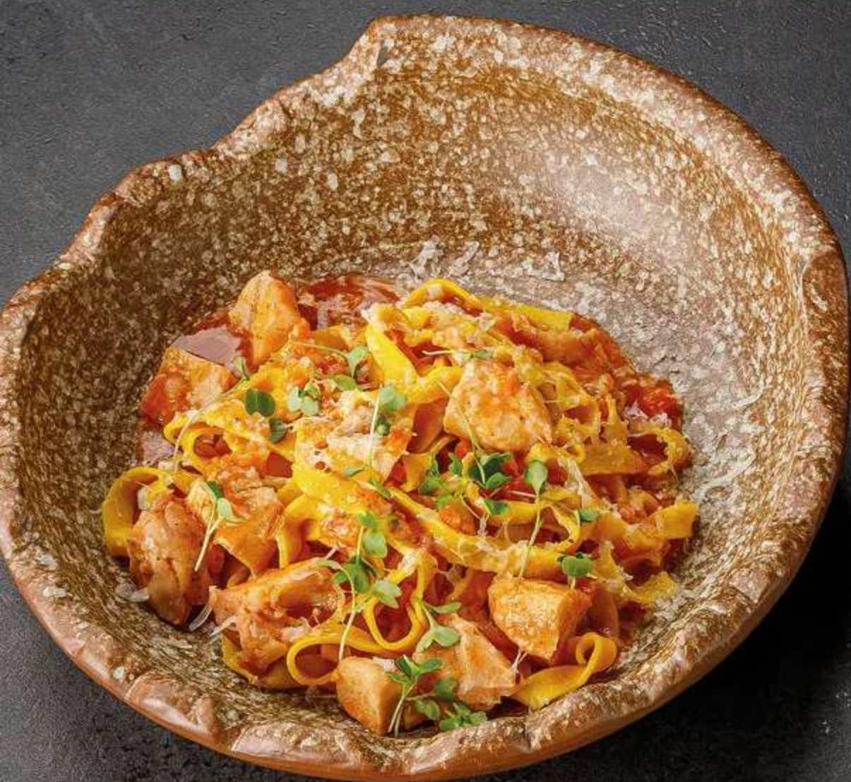
ТАЛЬЯТЕЛЛЕ С РАГУ ИЗ КРОЛИКА