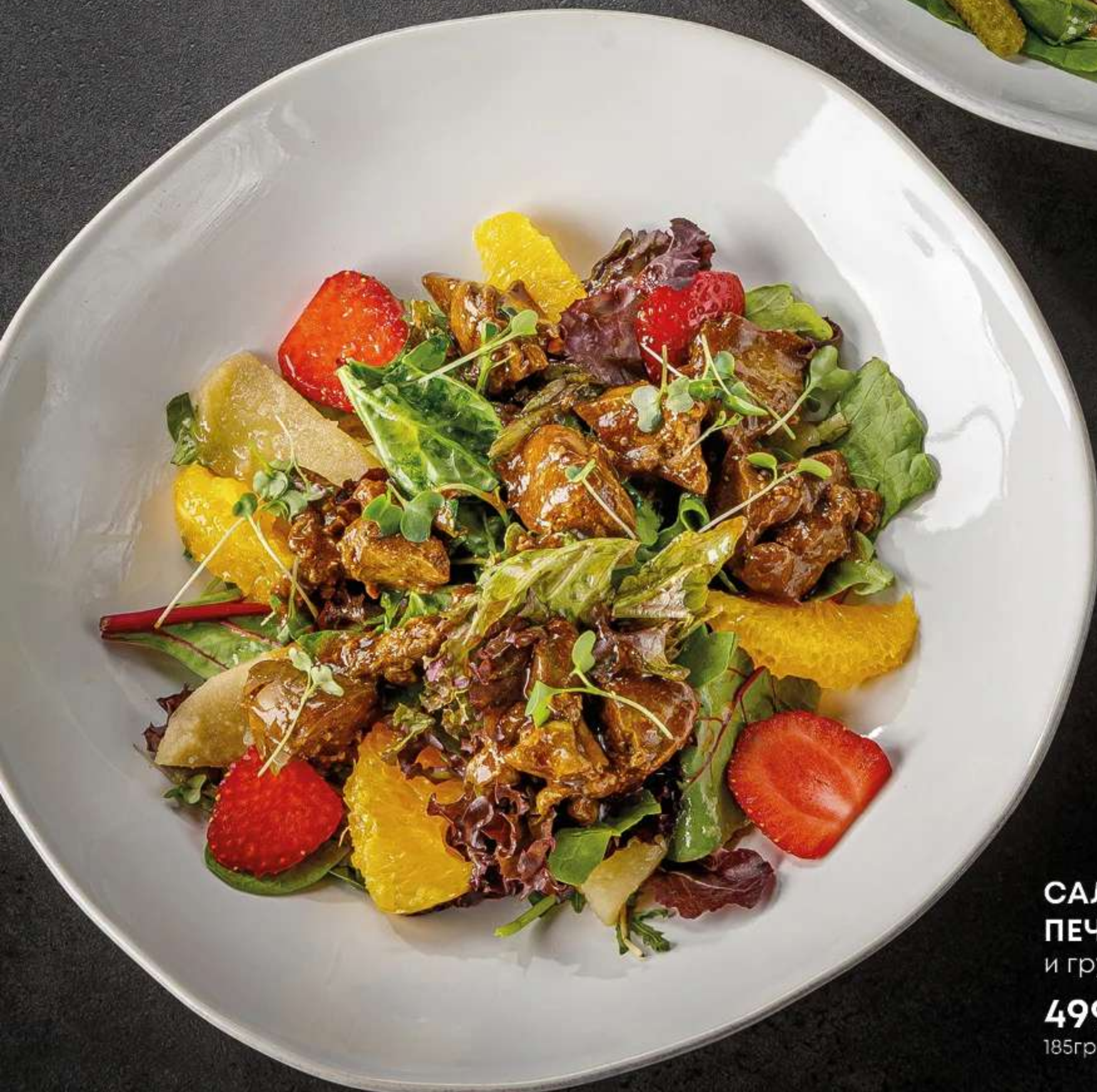
САЛАТ С КУРИНОЙ ПЕЧЕНЬЮ , клубникой и грушей фламбе