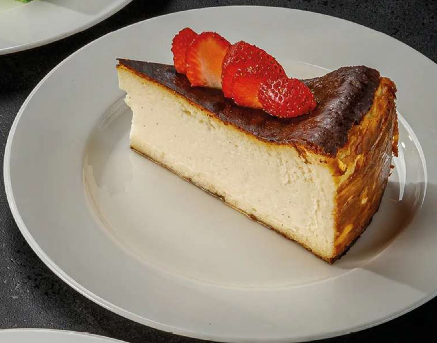
ТРОПИЧЕСКИЙ БУМ 390