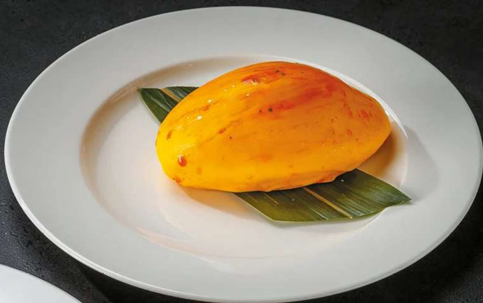
ДЕСЕРТ МАНГО 440