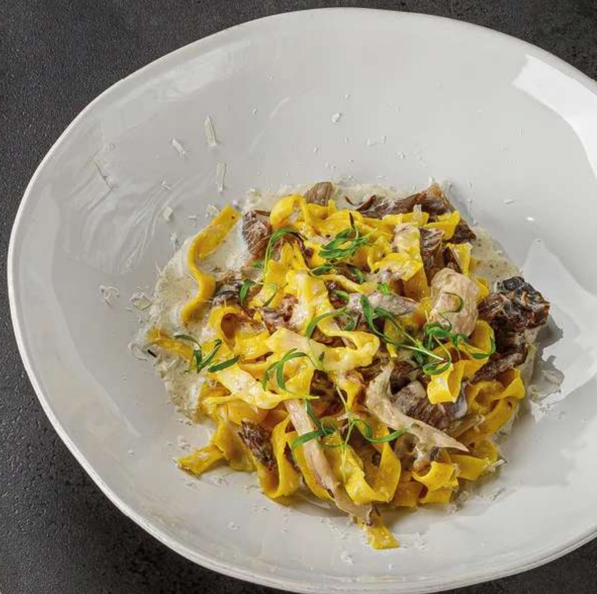
ФЕТУЧИНИ С ТОМЛЕННЫМИ ЩЕЧКАМИ в перечном соусе с грибами