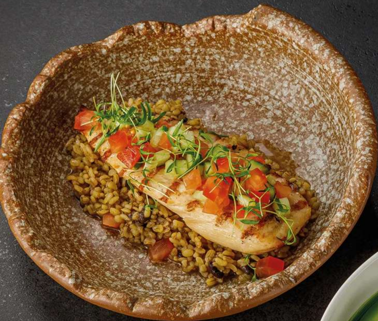
НЕЖНАЯ КУРИНАЯ ГРУДКА с кашей из булгура и белыми грибами