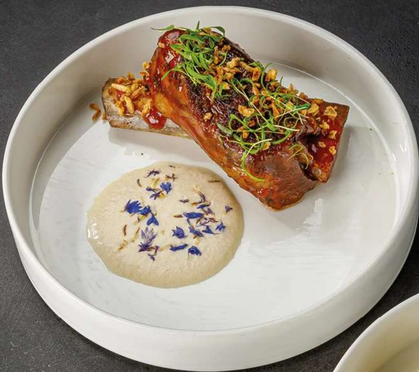
ТОМЛЕННОЕ РЕБРО с луковым соусом