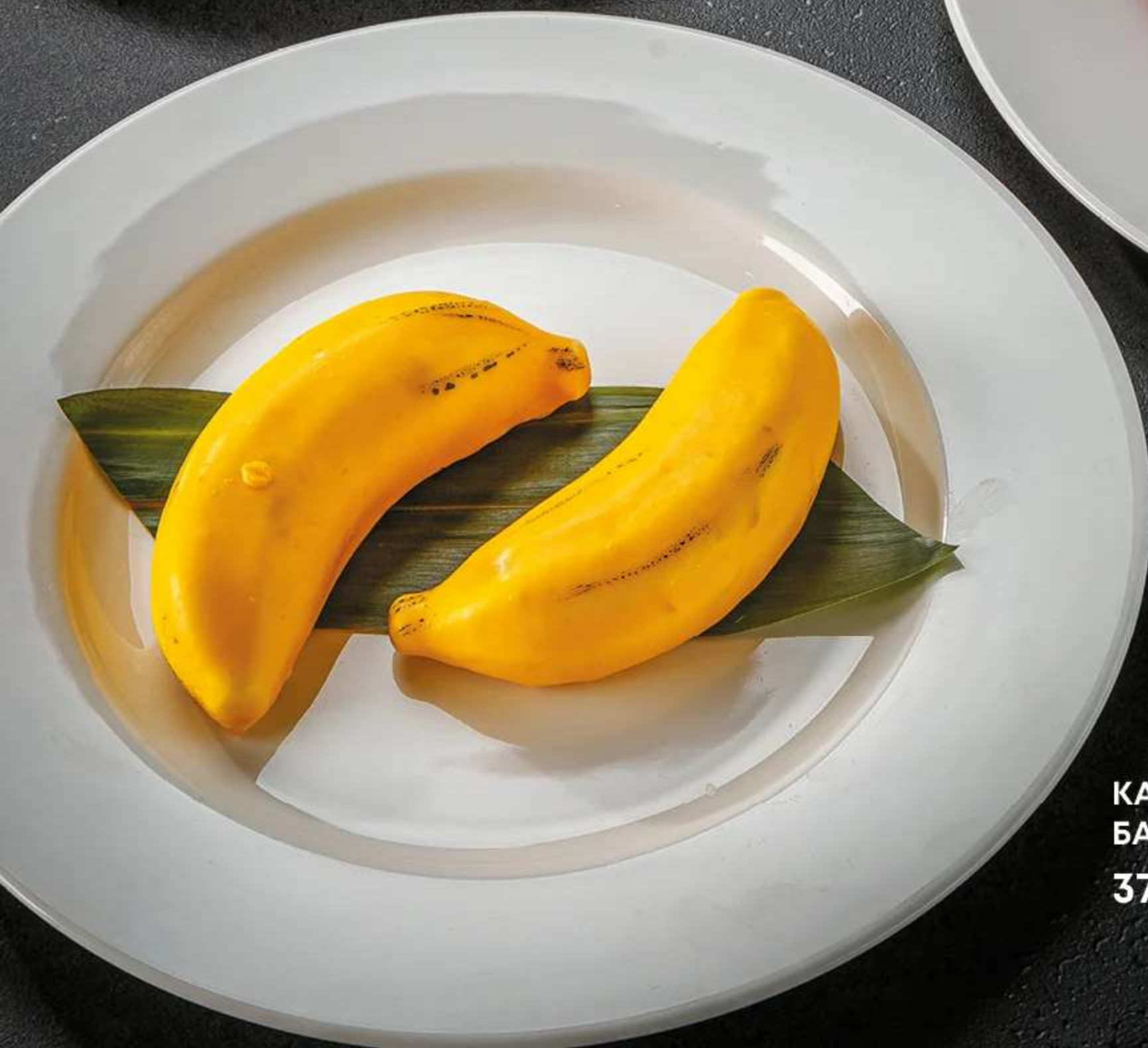
КАРАМЕЛЬНЫЙ БАНАН 370