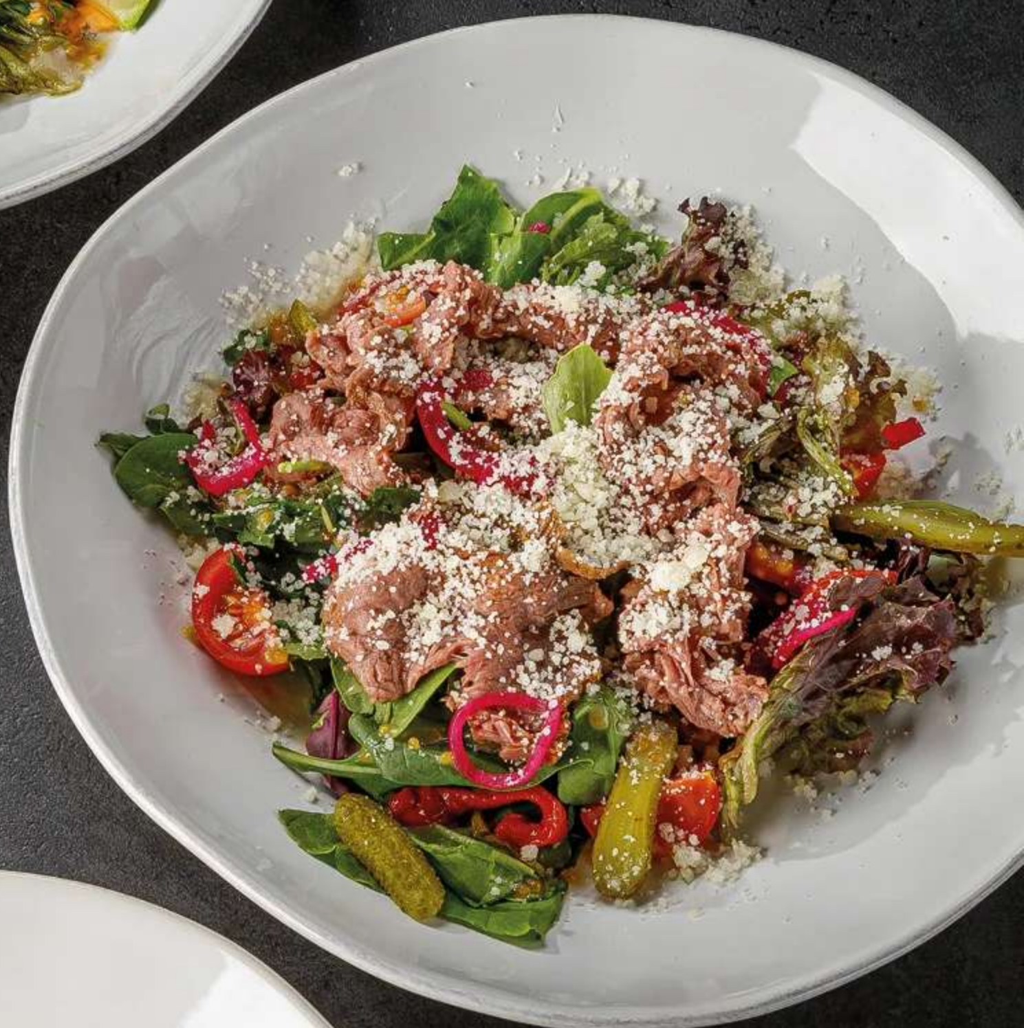
САЛАТ С РОСТБИФОМ