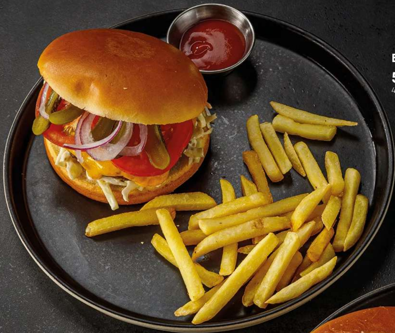
БУРГЕР С ГОВЯДИНОЙ