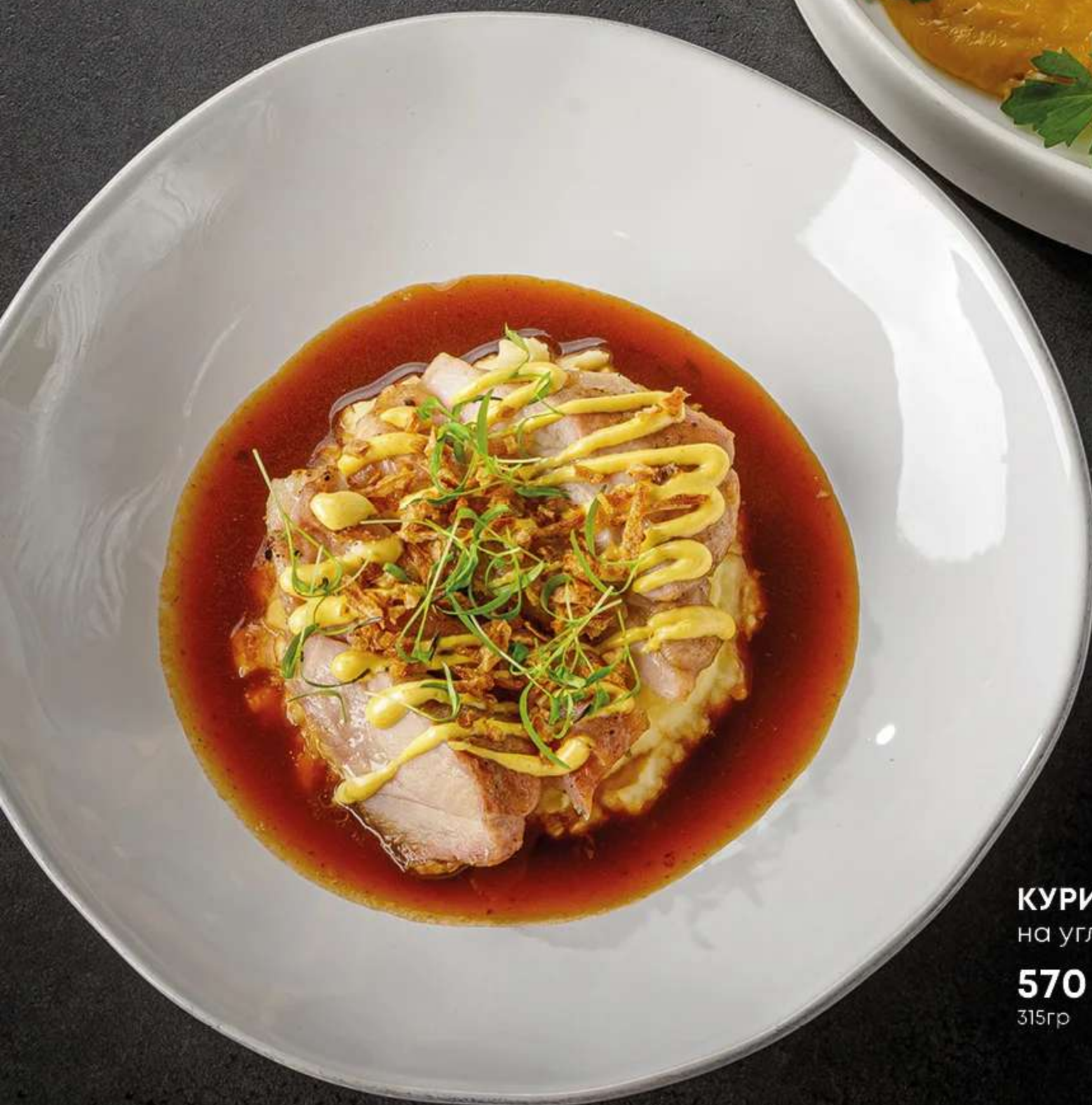
КУРИНОЕ БЕДРО на углях с соусом карри