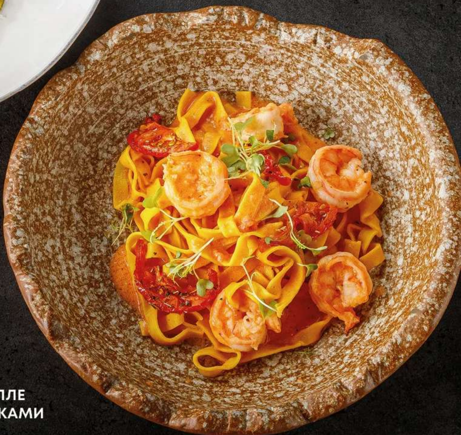
ТАЛЬЯТЕЛЛЕ С КРЕВЕТКАМИ