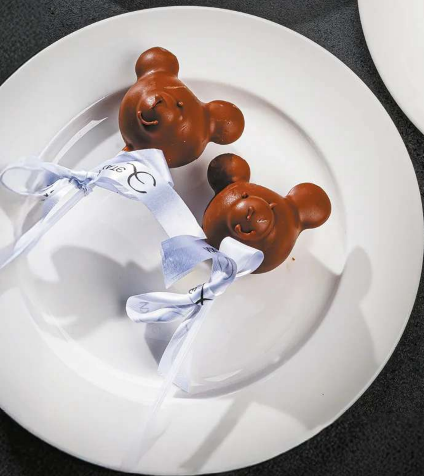
КЕЙК ПОПСЫ 260