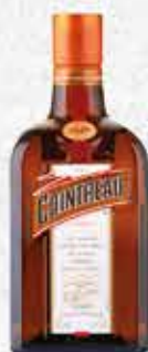
КУАНТРО 0,7л. - 6860р. 50мл. - 490р.