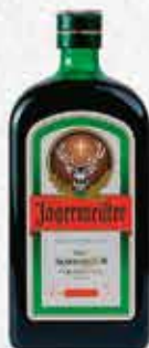
ЯГЕРМАЙСТЕР 1л. - 7800р. 50мл. - 390р.