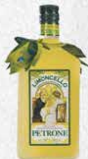
ЛИМОНЧЕЛО 0,7л. - 4900р. 50мл. - 350р.