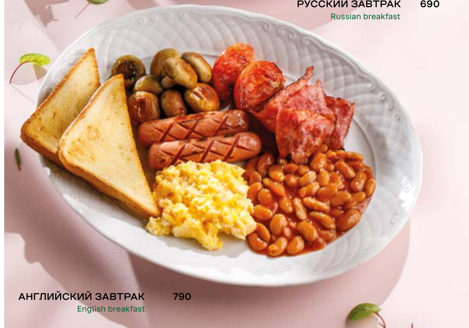
АНГЛИЙСКИЙ ЗАВТРАК 790 English breakfast