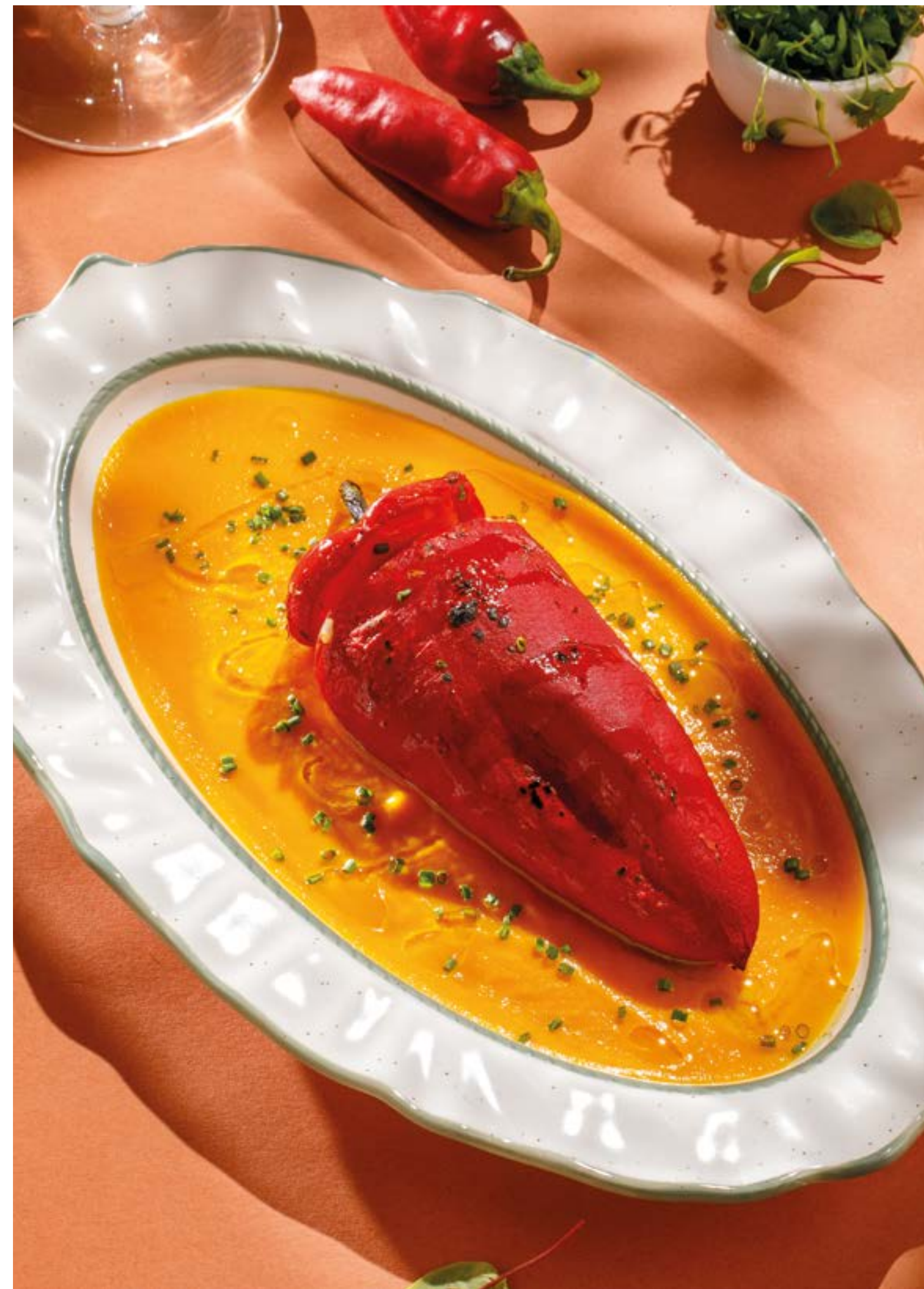
ПЕРЕЦ РАМИРО С ИНДЕЙКОЙ Ramiro pepper with turkey