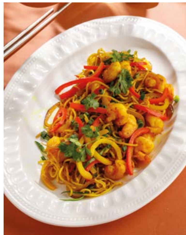
СИНГАПУРСКАЯ ЛАПША Singapore noodles