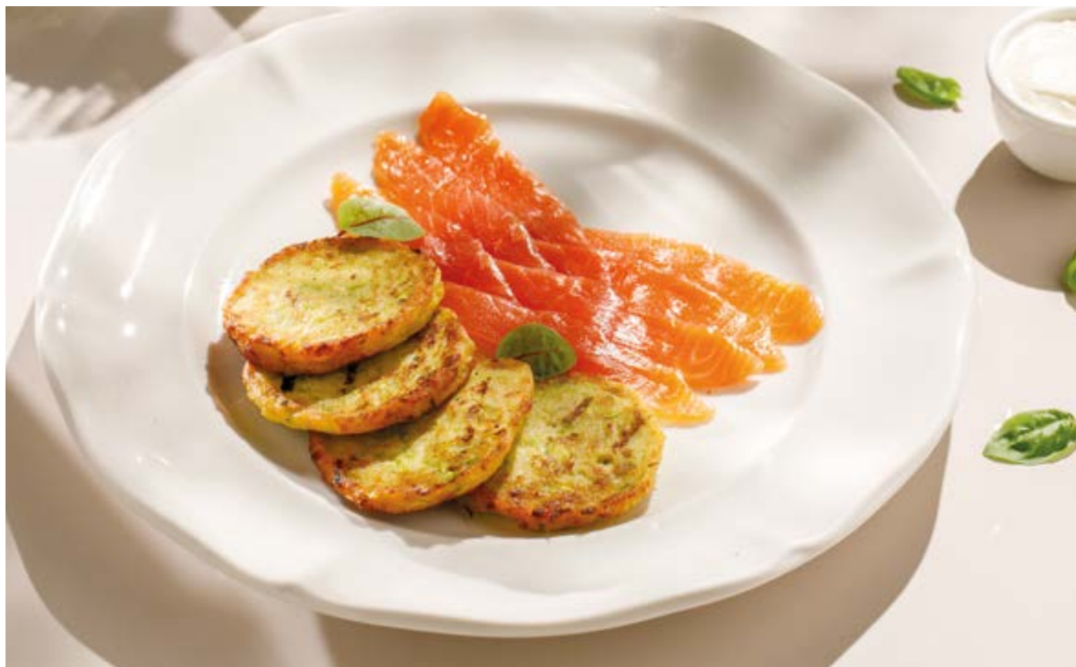
ОЛАДЬИ ИЗ КАБАЧКОВ С ФОРЕЛЬЮ ШЕФ-ПОСОЛА / СО СМЕТАНОЙ Zucchini patties with chef-salted trout / with sour cream