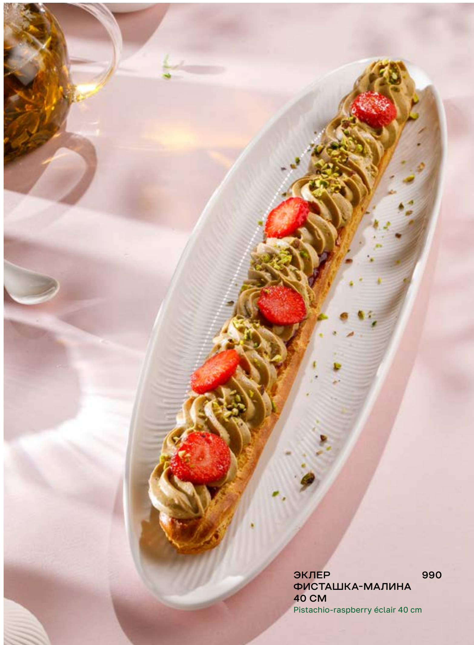
ЭКЛЕР ФИСТАШКА-МАЛИНА 990 40 CM Pistachio-raspberry éclair 40 cm