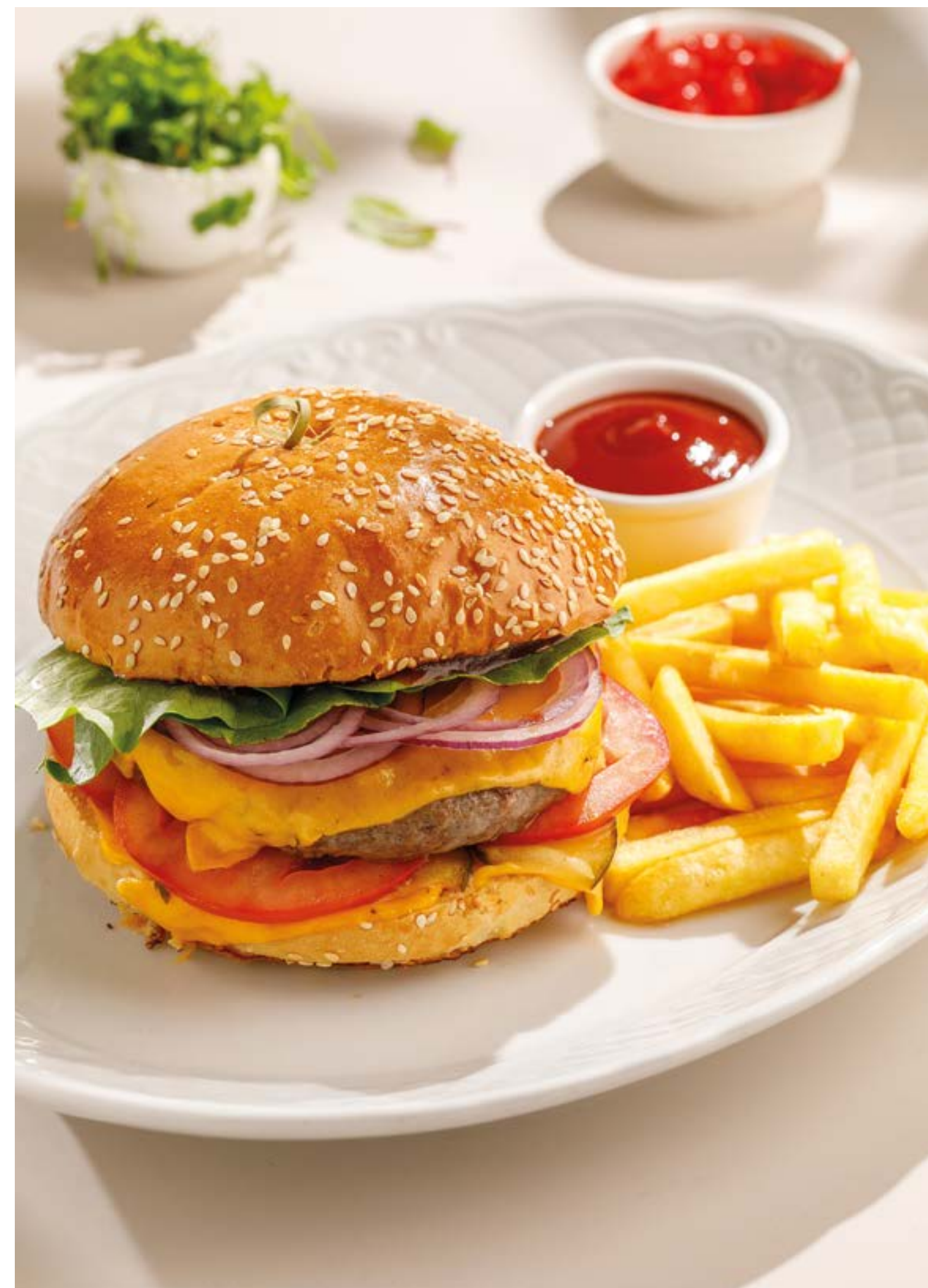
БУРГЕР ИЗ МРАМОРНОЙ ГОВЯДИНЫ С КАРТОФЕЛЕМ ФРИ Marble beef burger with French fries