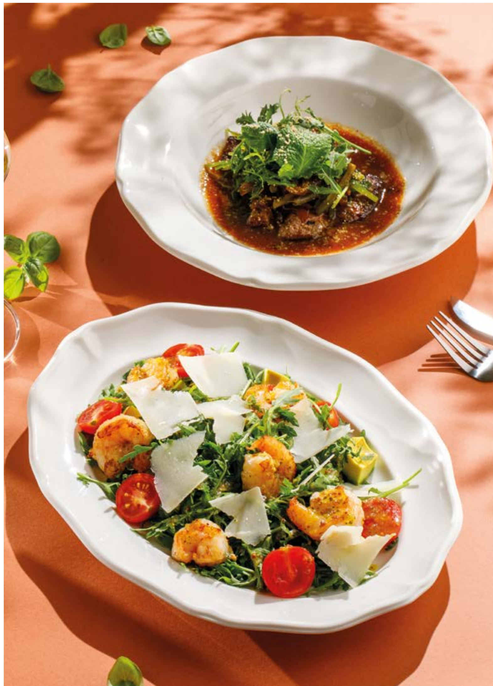
РУКОЛА С КРЕВЕТКАМИ И АВОКАДО Arugula with shrimp and avocado