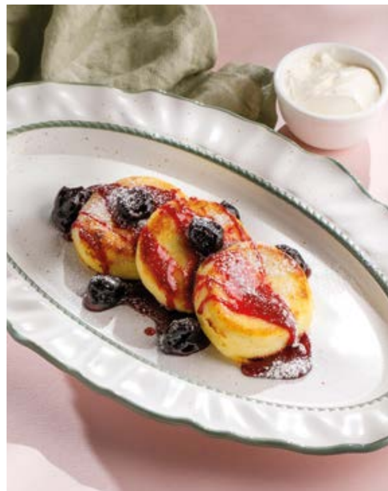
СЫРНИКИ С ВИШНЕВЫМ СОУСОМ 590 Syrniki with cherry sauce