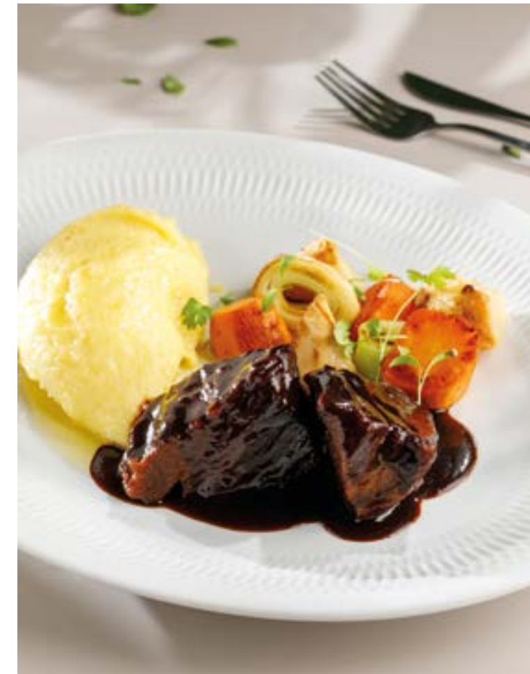
ТЕЛЯЧЬИ ЩЕЧКИ С ПЕЧЕНЫМИ ОВОЩАМИ И КАРТОФЕЛЬНЫМ ПЮРЕ

Veal cheeks with baked vegetables and mashed potatoes