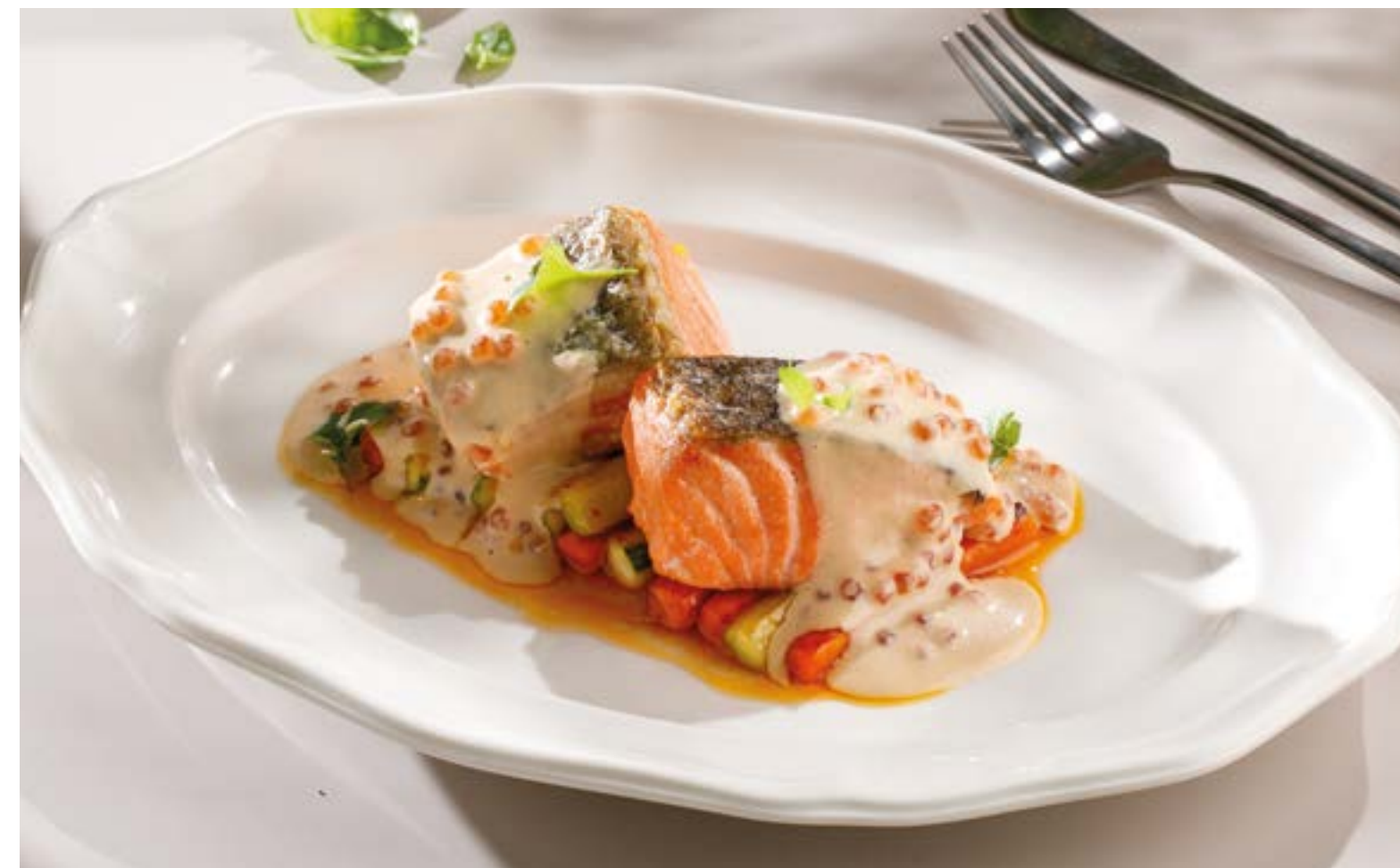
ФИЛЕ ФОРЕЛИ С ОВОЩАМИ И СОУСОМ ИЗ ТОПЛЕНОГО МОЛОКА Trout fillet with vegetables and baked milk sauce