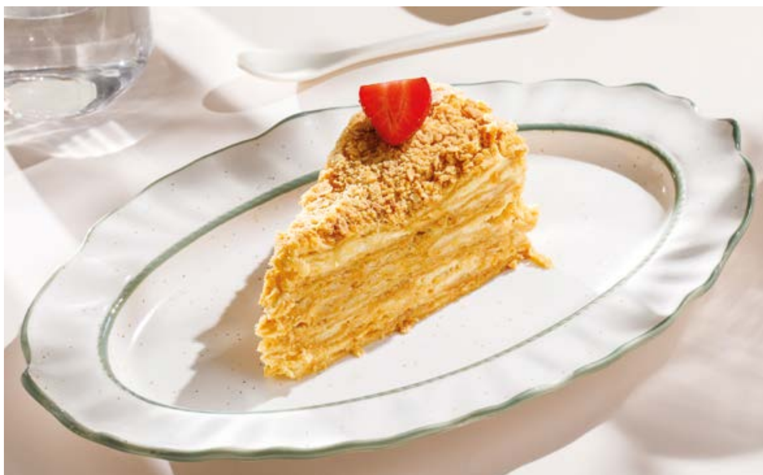
НАПОЛЕОН Napoleon cake