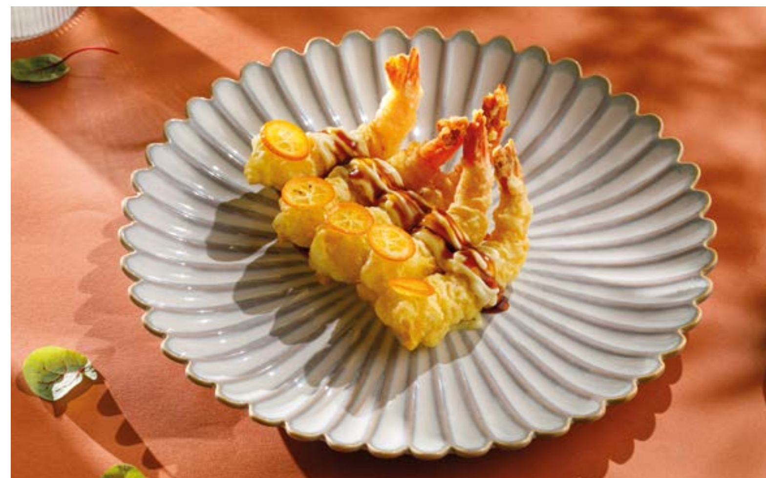
КРЕВЕТКИ ТЕМПУРА С КУМКВАТОМ Tempura shrimps with kumquat