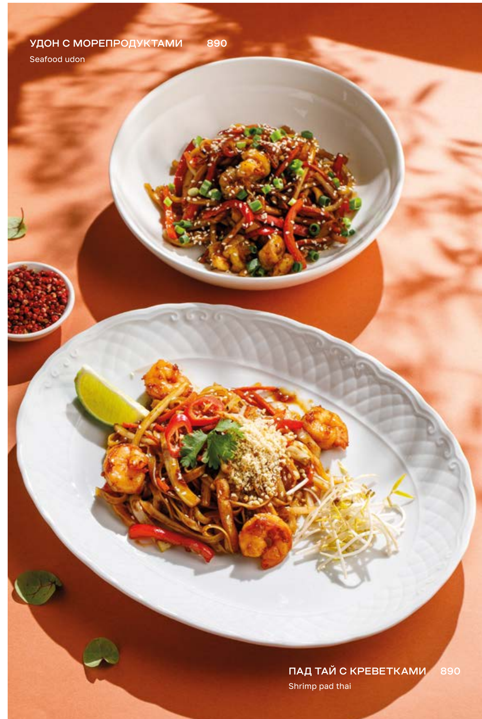
УДОН С МОРЕПРОДУКТАМИ 890 Seafood udon