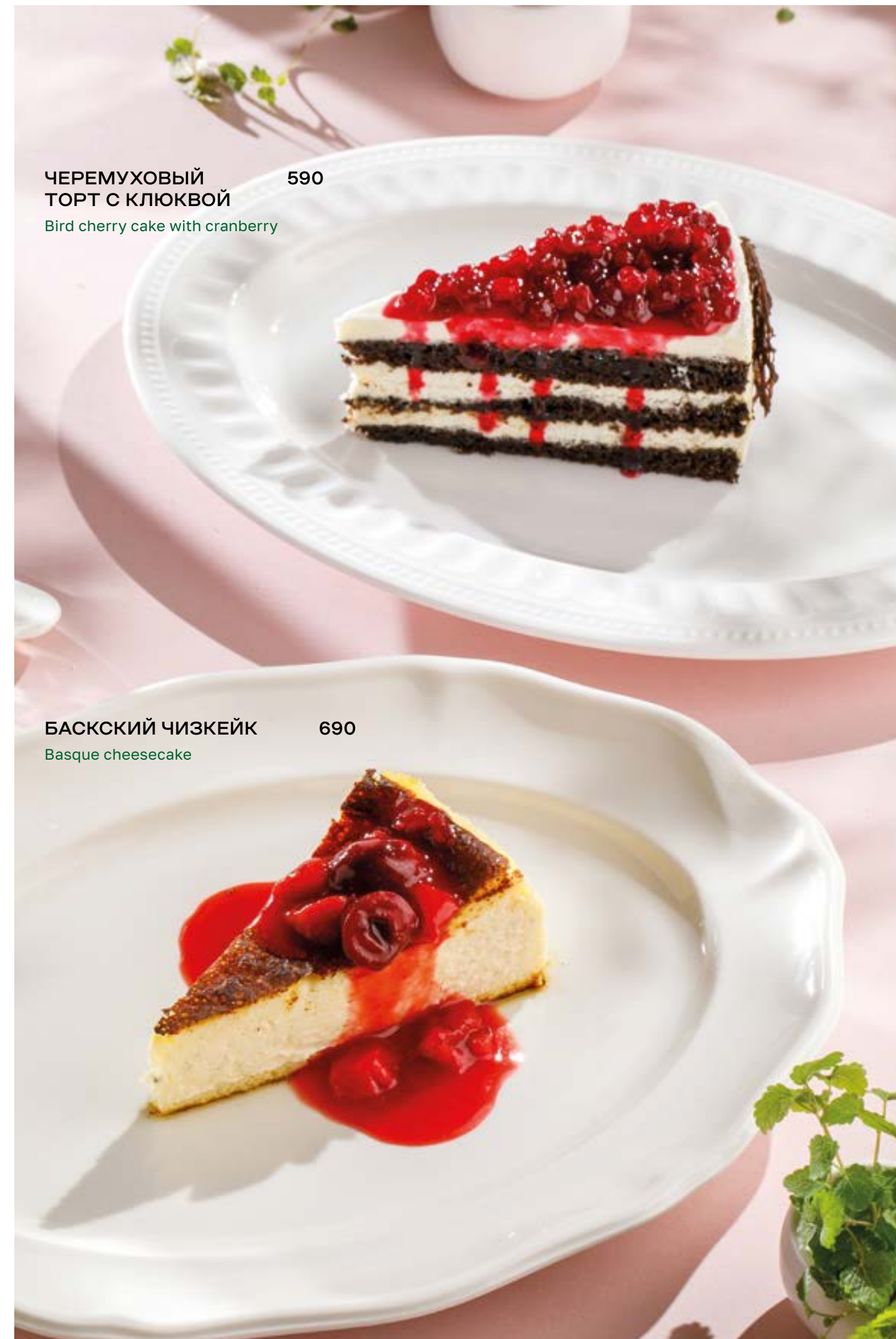
ЧЕРЕМУХОВЫЙ ТОРТ С КЛЮКВОЙ 590 Bird cherry cake with cranberry