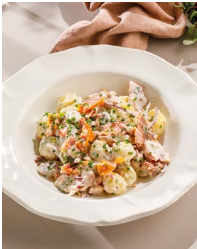
САЛАТ С КОПЧЕНОЙ НЕРКОЙ Smoked sockeye salmon salad