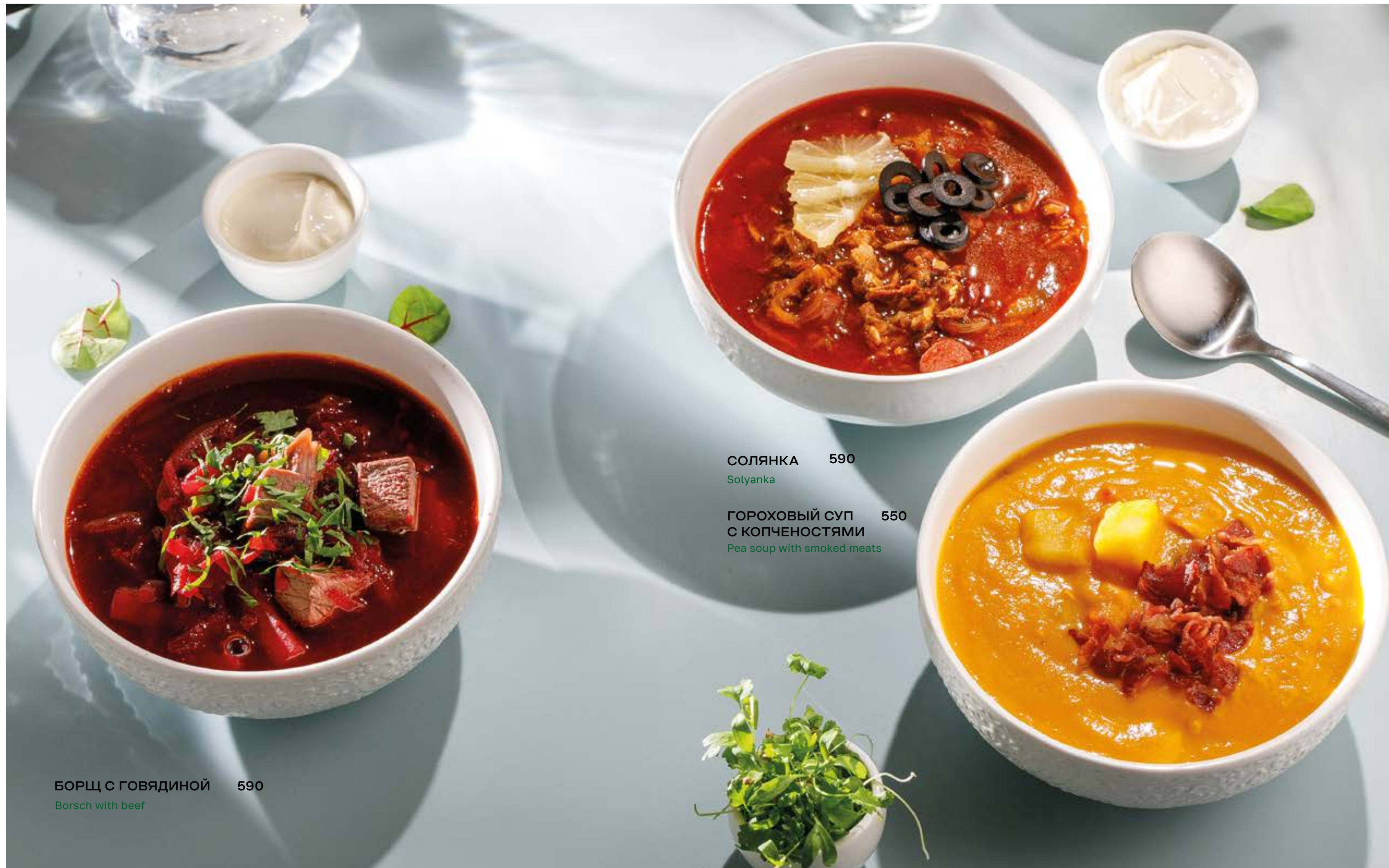
БОРЩ С ГОВЯДИНОЙ 590 Borsch with beef