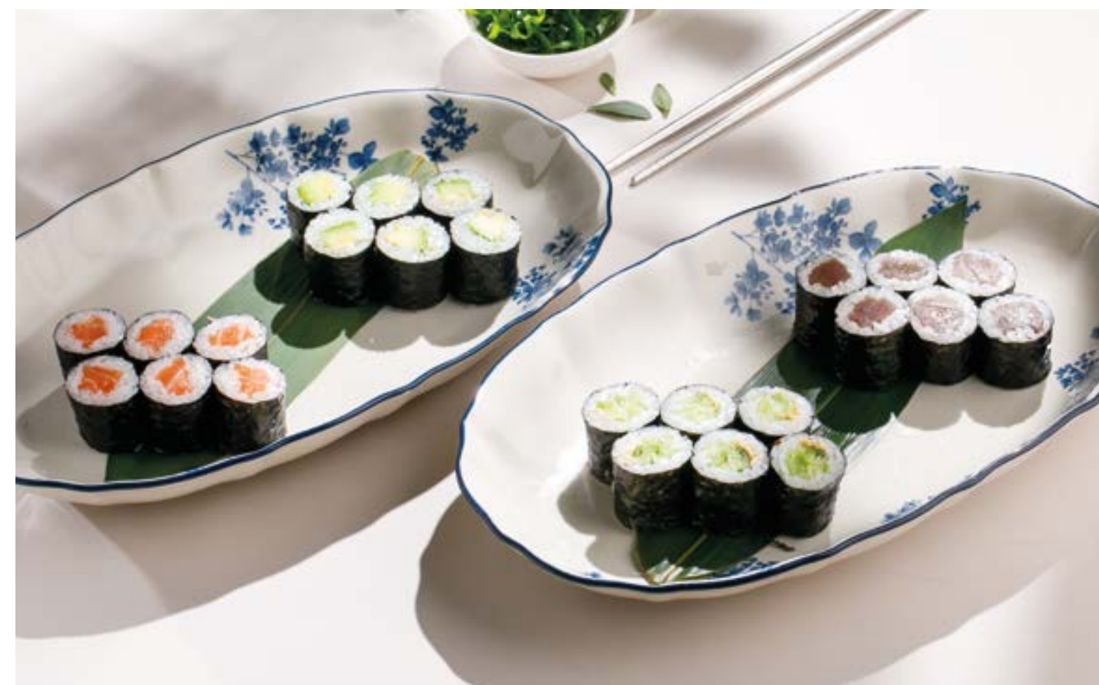
РОЛЛ С ОГУРЦОМ / С АВОКАДО / С ТУНЦОМ / С ЛОСОСЕМ Cucumber / Avocado / Tuna / Salmon roll