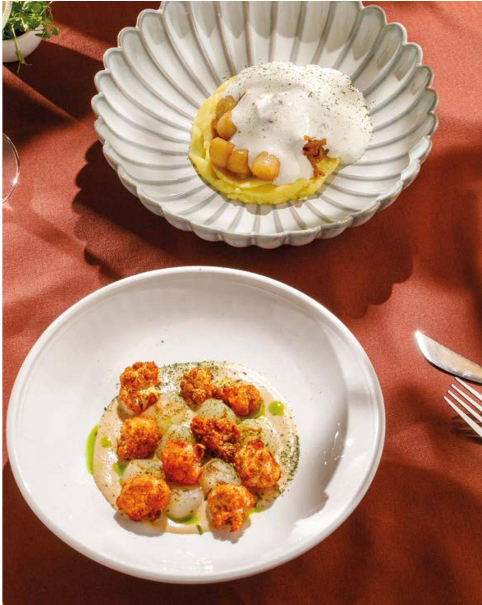
ГРЕБЕШОК С БЕЛЫМИ ГРИБАМИ И ПАРМЕЗАНОМ Scallops with porcini mushrooms and Parmesan