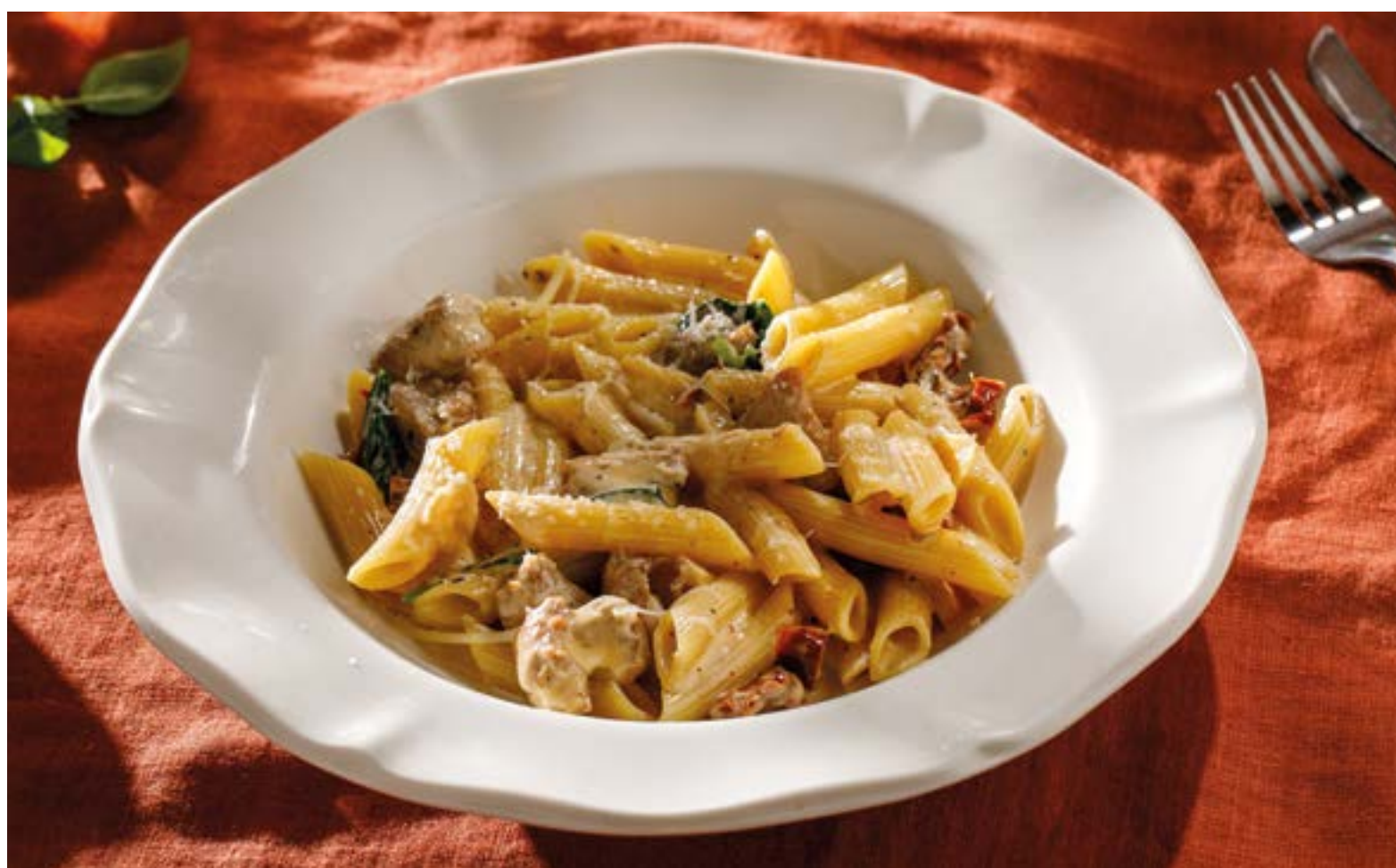
ПАСТА С ЦЫПЛЕНКОМ И ВЯЛЕНЫМИ ТОМАТАМИ Pasta with chicken and sun-dried tomatoes