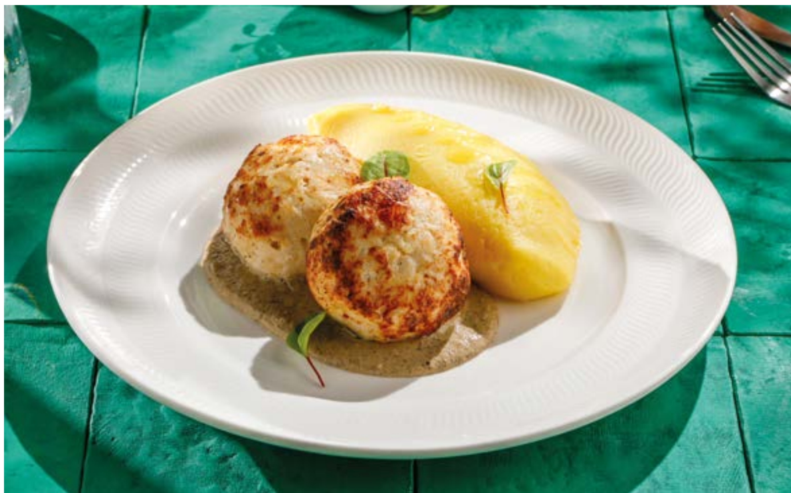
КОТЛЕТЫ ИЗ ИНДЕЙКИ С КАРТОФЕЛЬНЫМ ПЮРЕ И ГРИБНЫМ СОУСОМ

Turkey cutlets with mashed potatoes and mushroom sauce