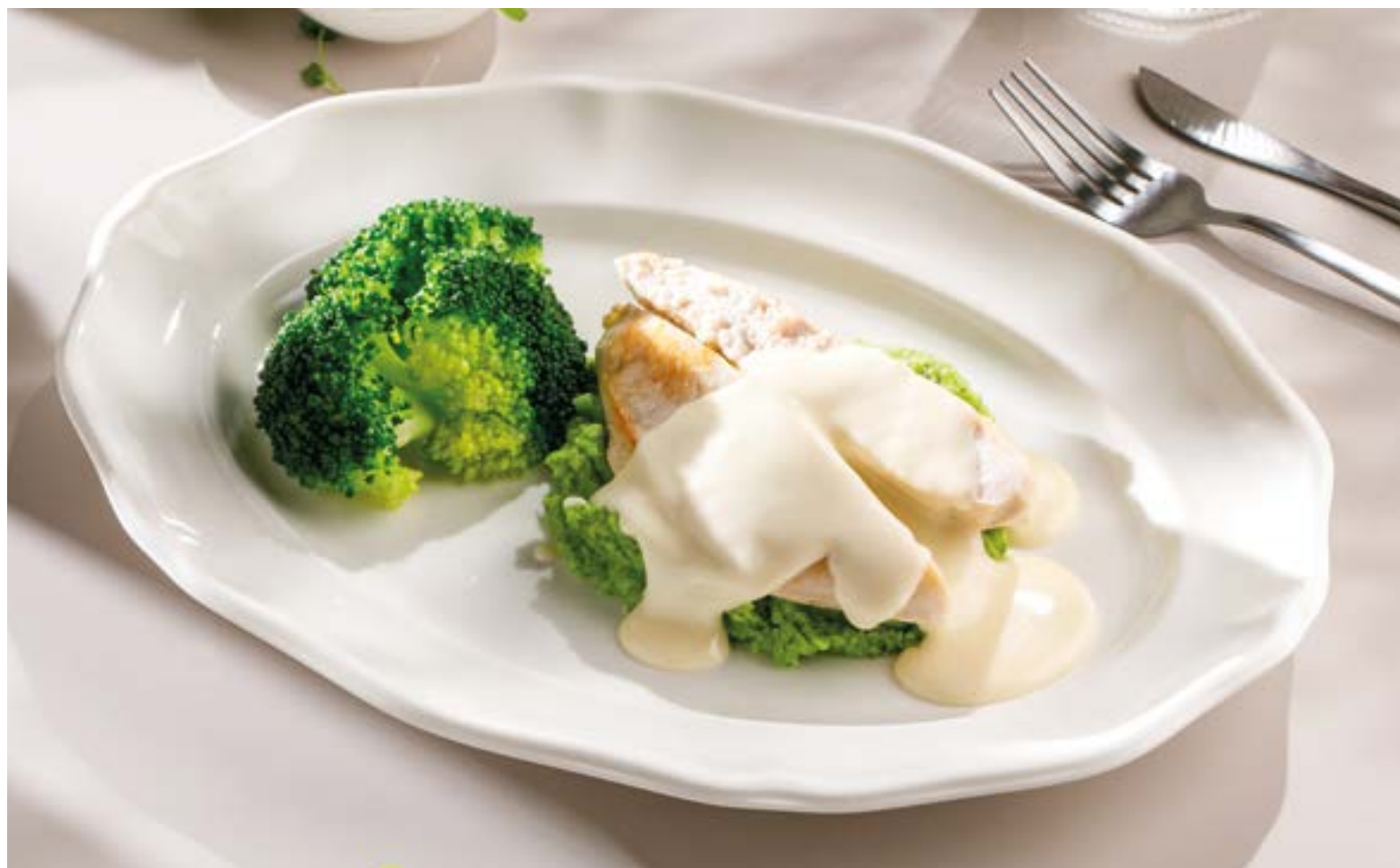
КУРИНАЯ ГРУДКА С БРОККОЛИ И ПАРМЕЗАНОВЫМ МУССОМ

Chicken breast with broccoli and Parmesan mousse