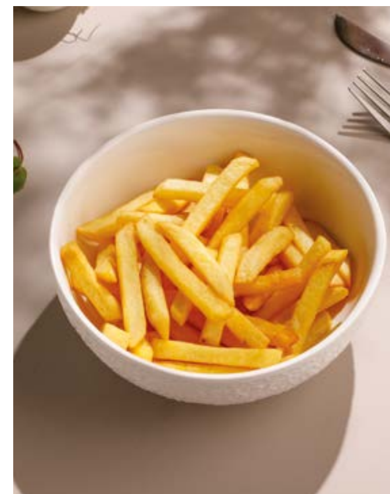
250 КАРТОФЕЛЬ ФРИ French fries