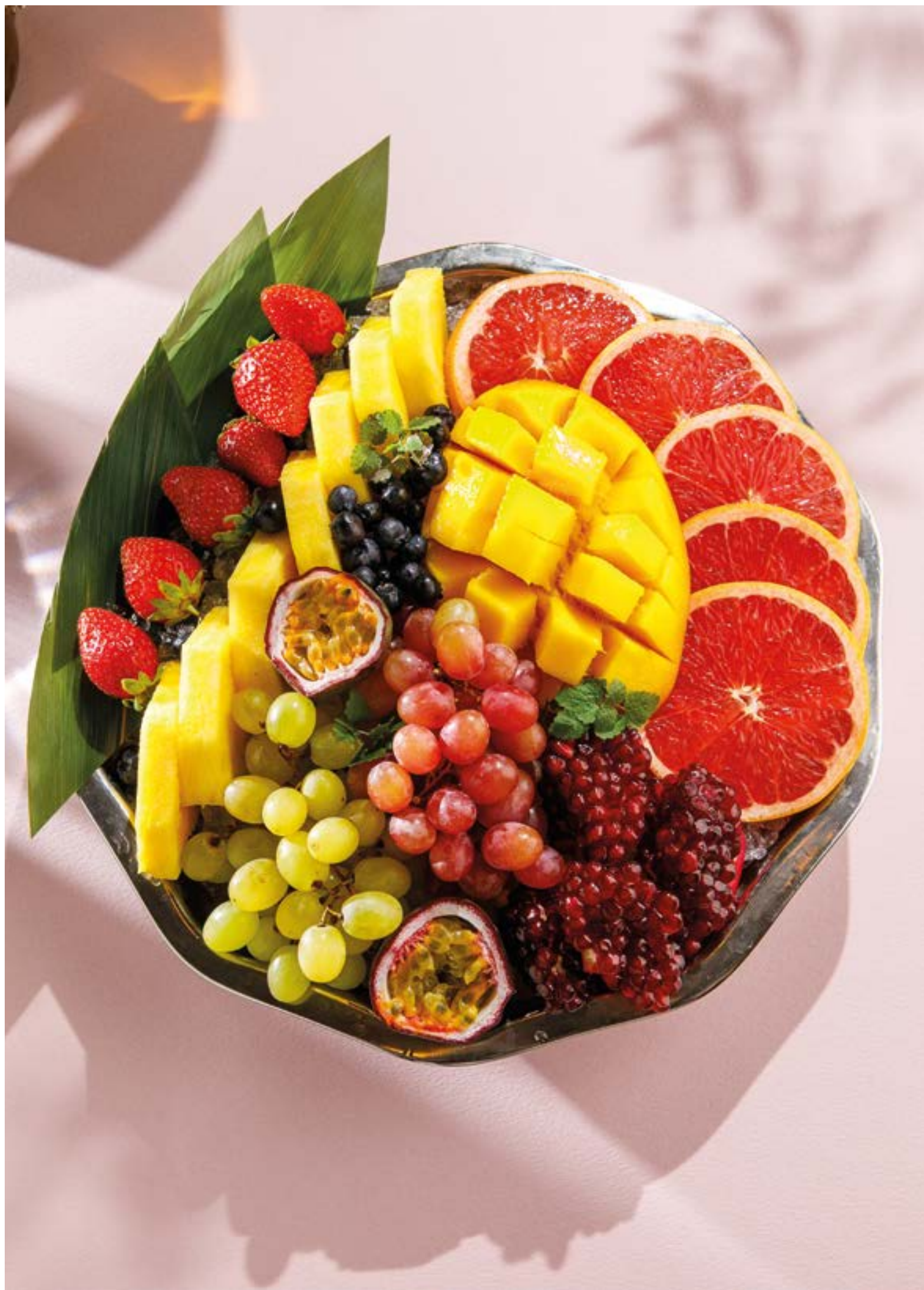
ФРУКТОВАЯ ТАРЕЛКА Fruit platter