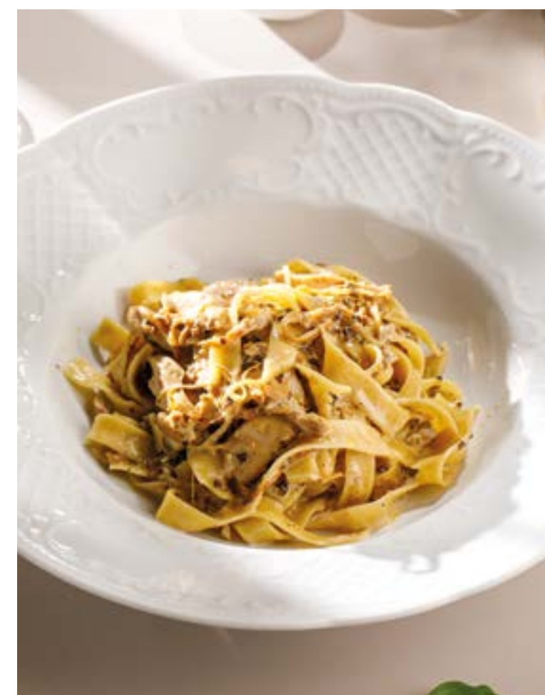
ПАППАРДЕЛЛЕ С ГРИБНОЙ САЛЬСОЙ И ЦЫПЛЕНКОМ Pappardelle with mushroom salsa and chicken