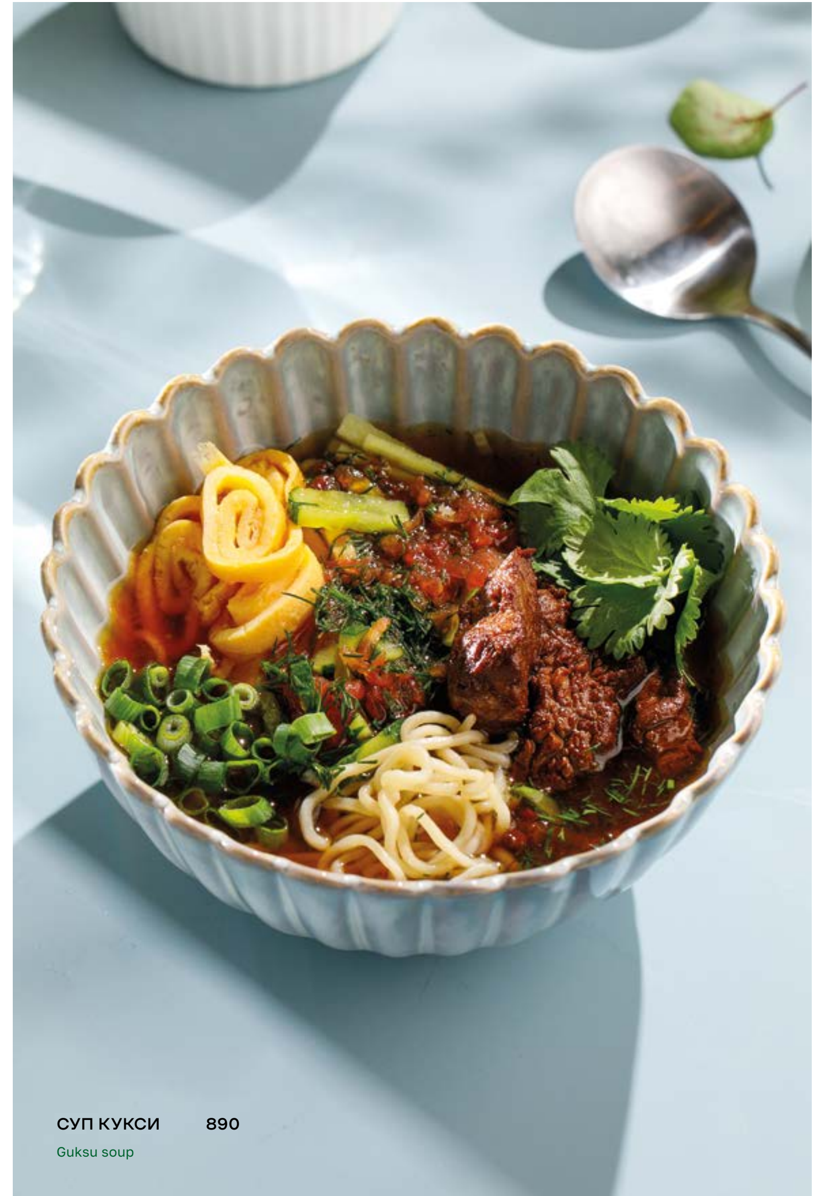
СУП КУКСИ 890 Guksu soup