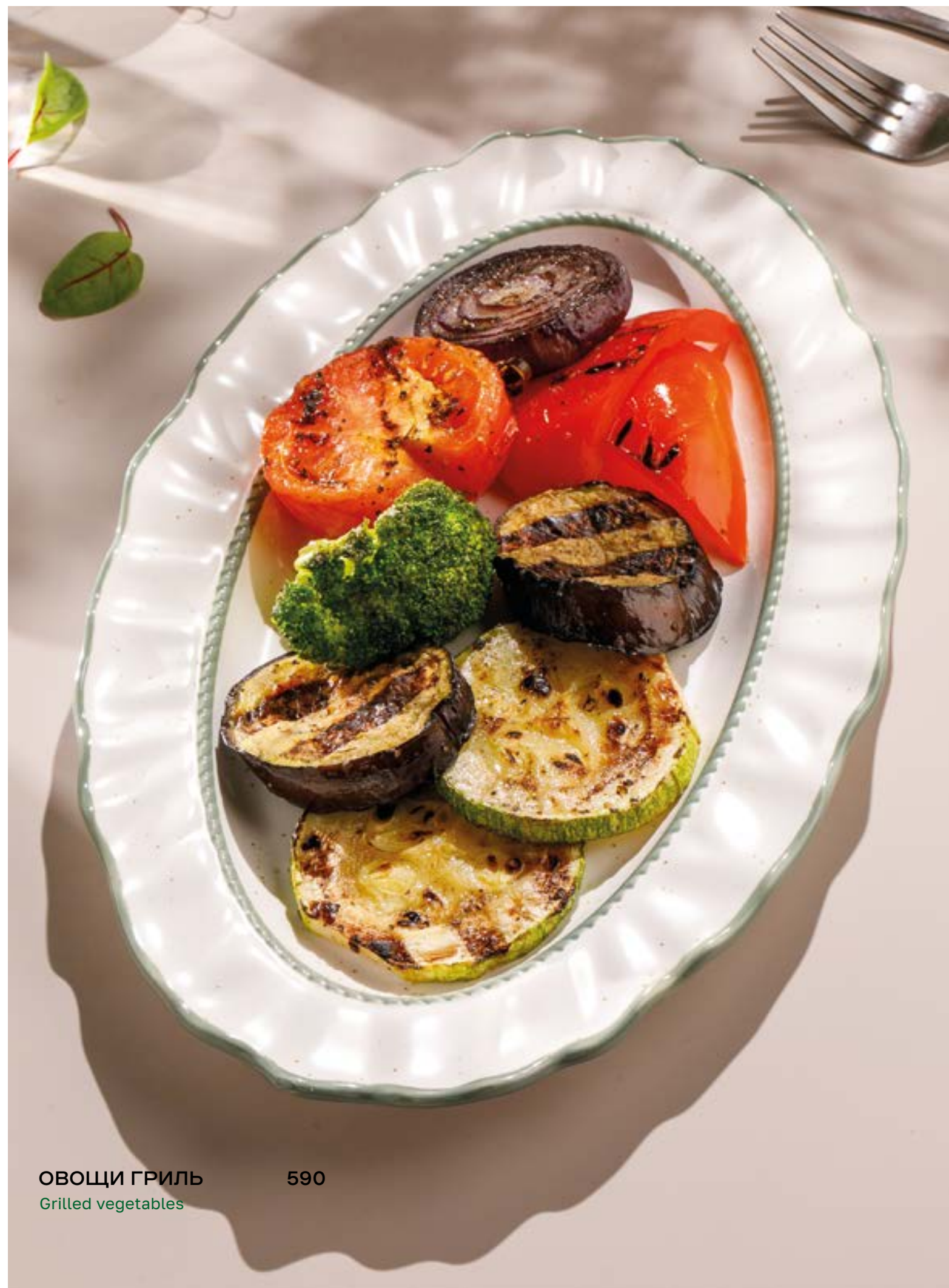
ОВОЦЫ ГРИЛЬ 590 Grilled vegetables