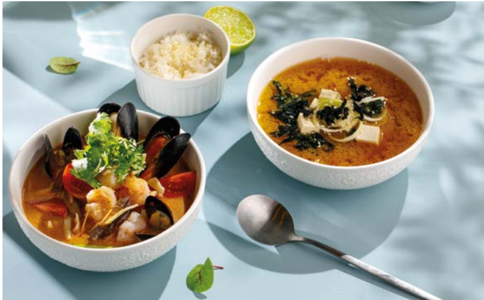
ТОМ ЯМ С МОРЕПРОДУКТАМИ Seafood tom yum