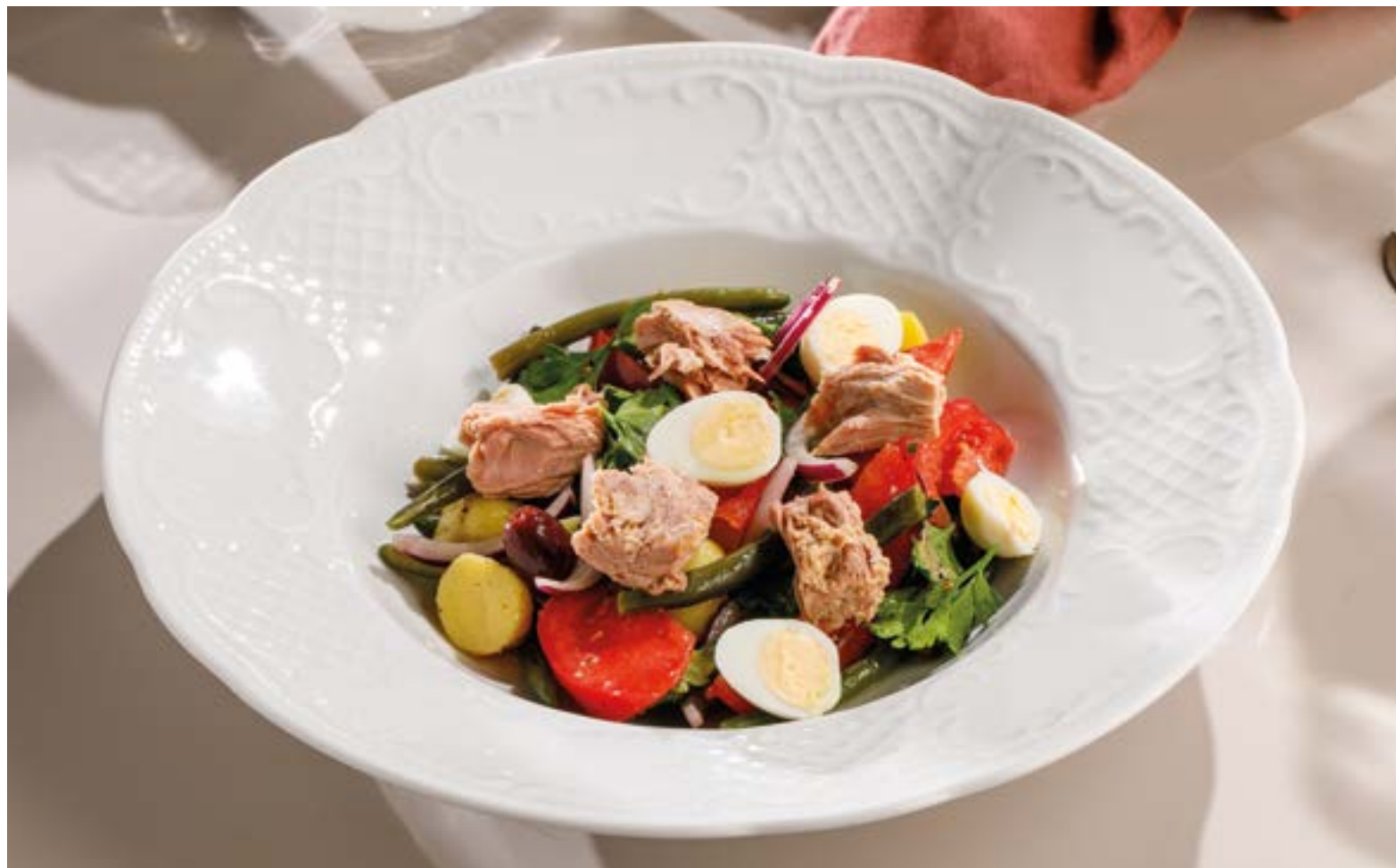
ИТАЛЬЯНСКИЙ САЛАТ С КОНСЕРВИРОВАННЫМ ТУНЦОМ Italian salad with canned tuna