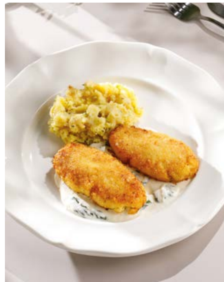
КОТЛЕТЫ ИЗ ТРЕСКИ С КАРТОФЕЛЕМ