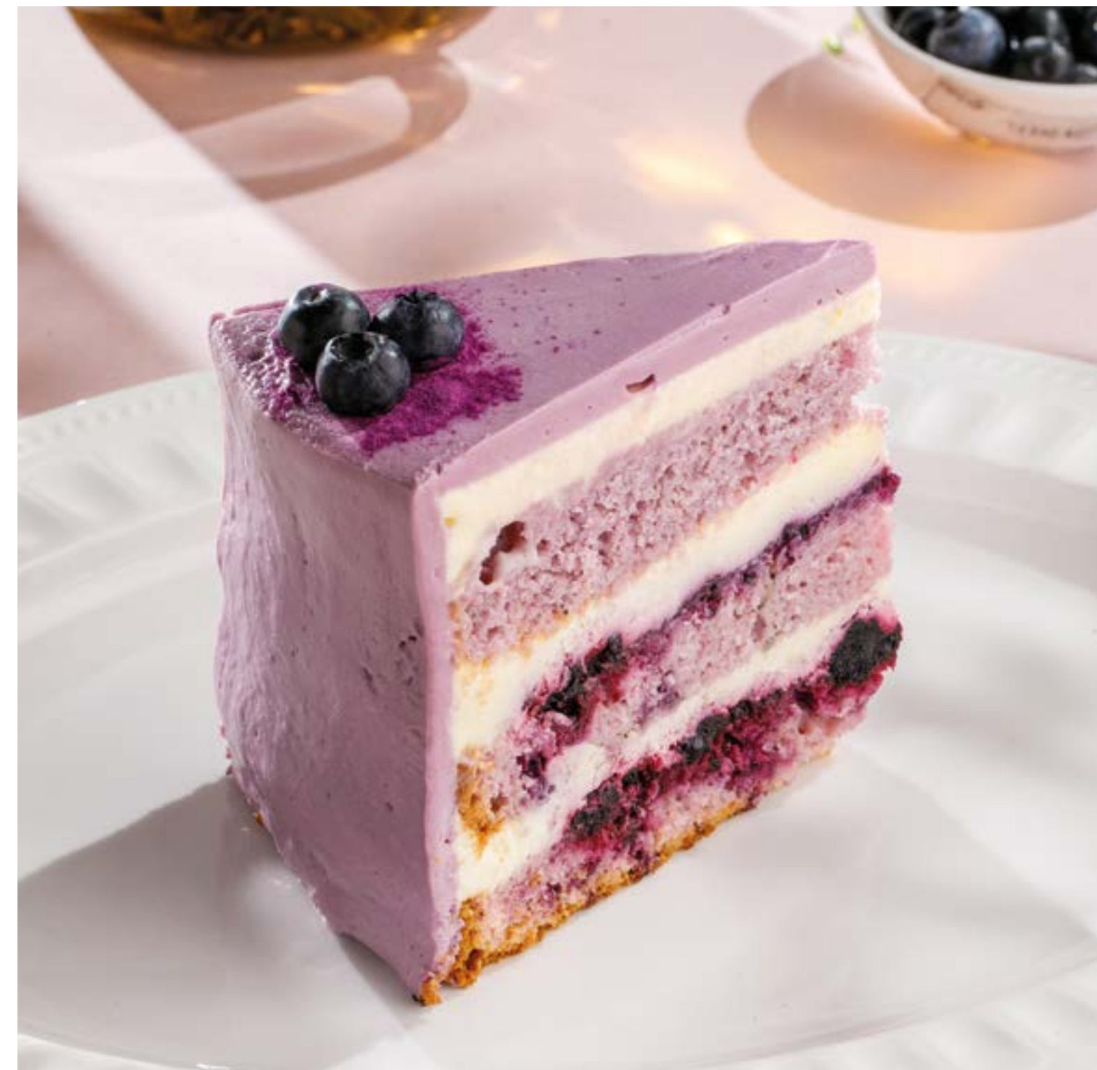
ТОРТ ЛАВАНДА Lavender cake