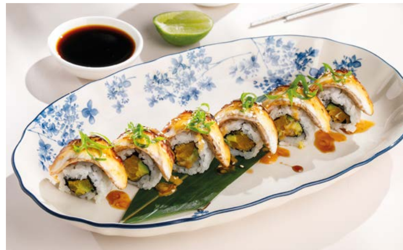
КРАНЧ-РОЛЛ С УГРЕМ Crunch eel roll