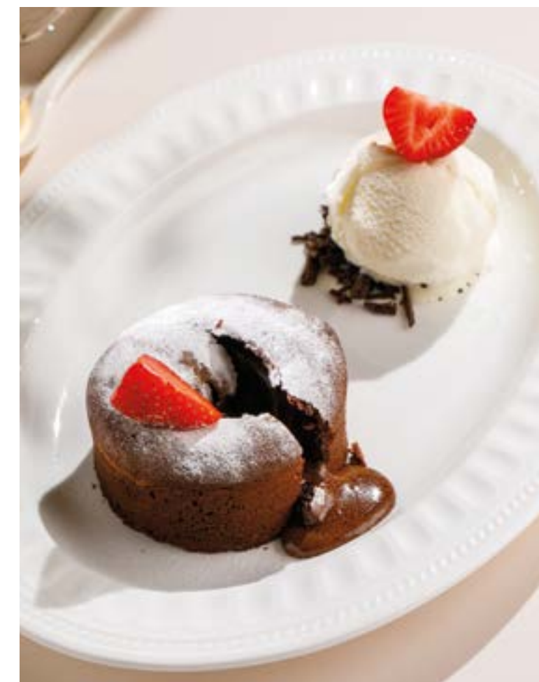
«ШОКОЛАДНАЯ ШКАТУЛКА» С ВАНИЛЬНЫМ МОРОЖЕНЫМ