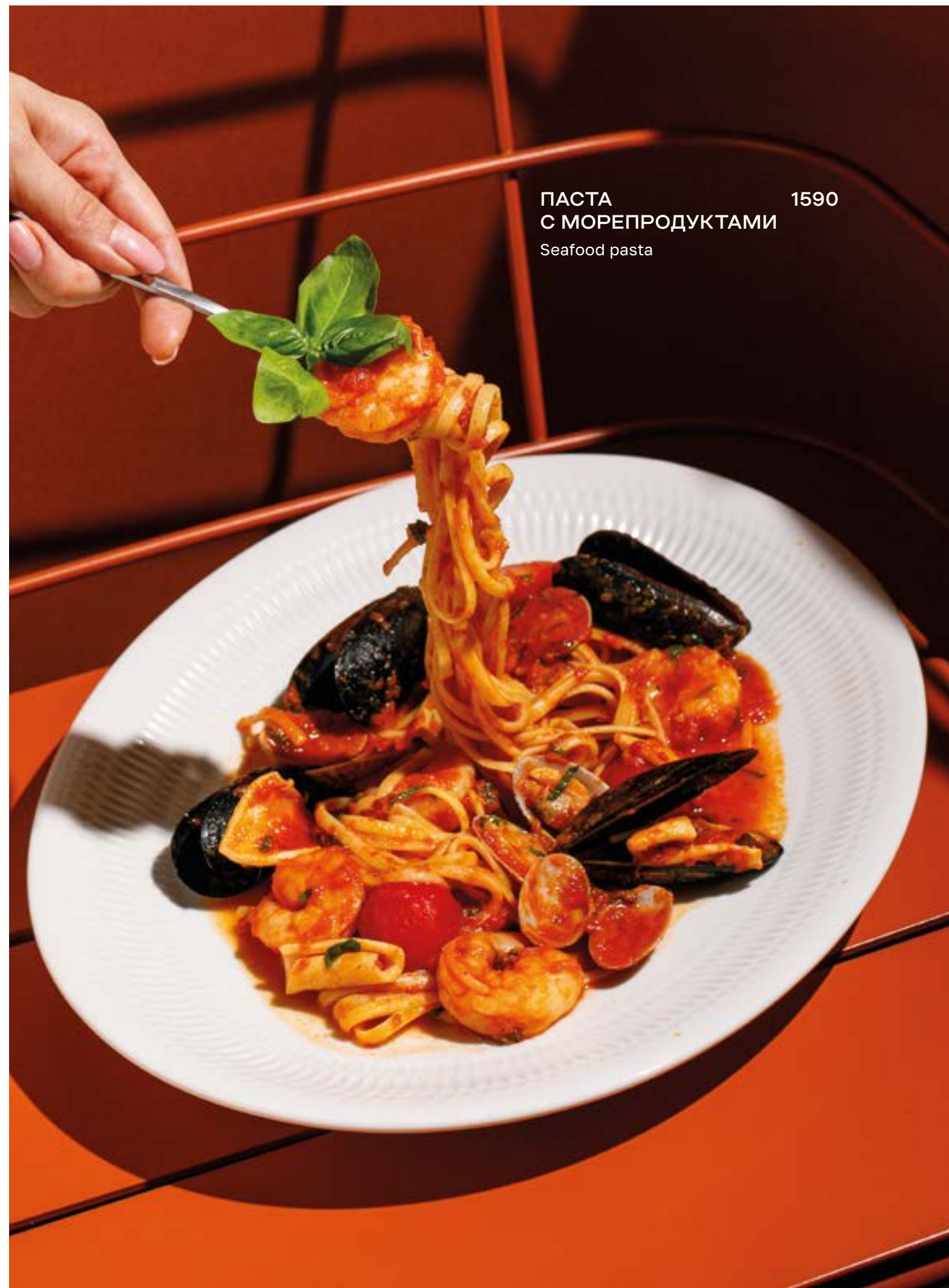
ПАСТА С МОРЕПРОДУКТАМИ 1590 Seafood pasta