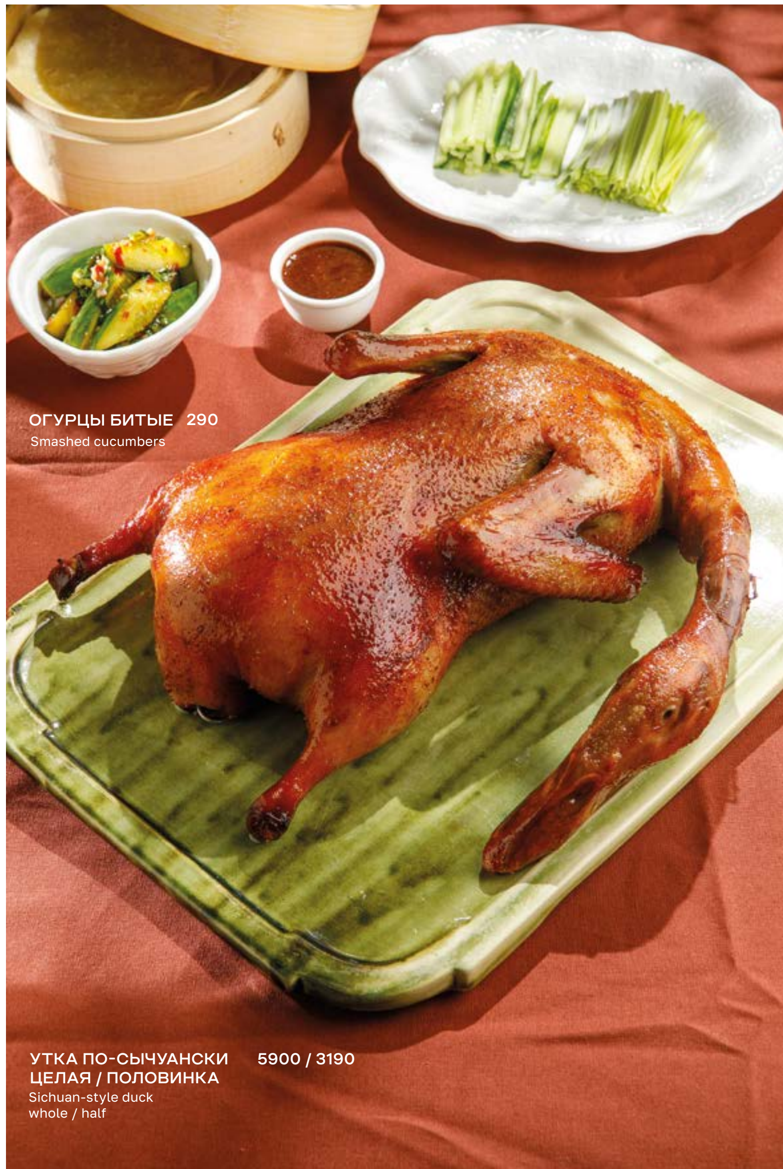
ОГУРЦЫ БИТЫЕ 290 Smashed cucumbers