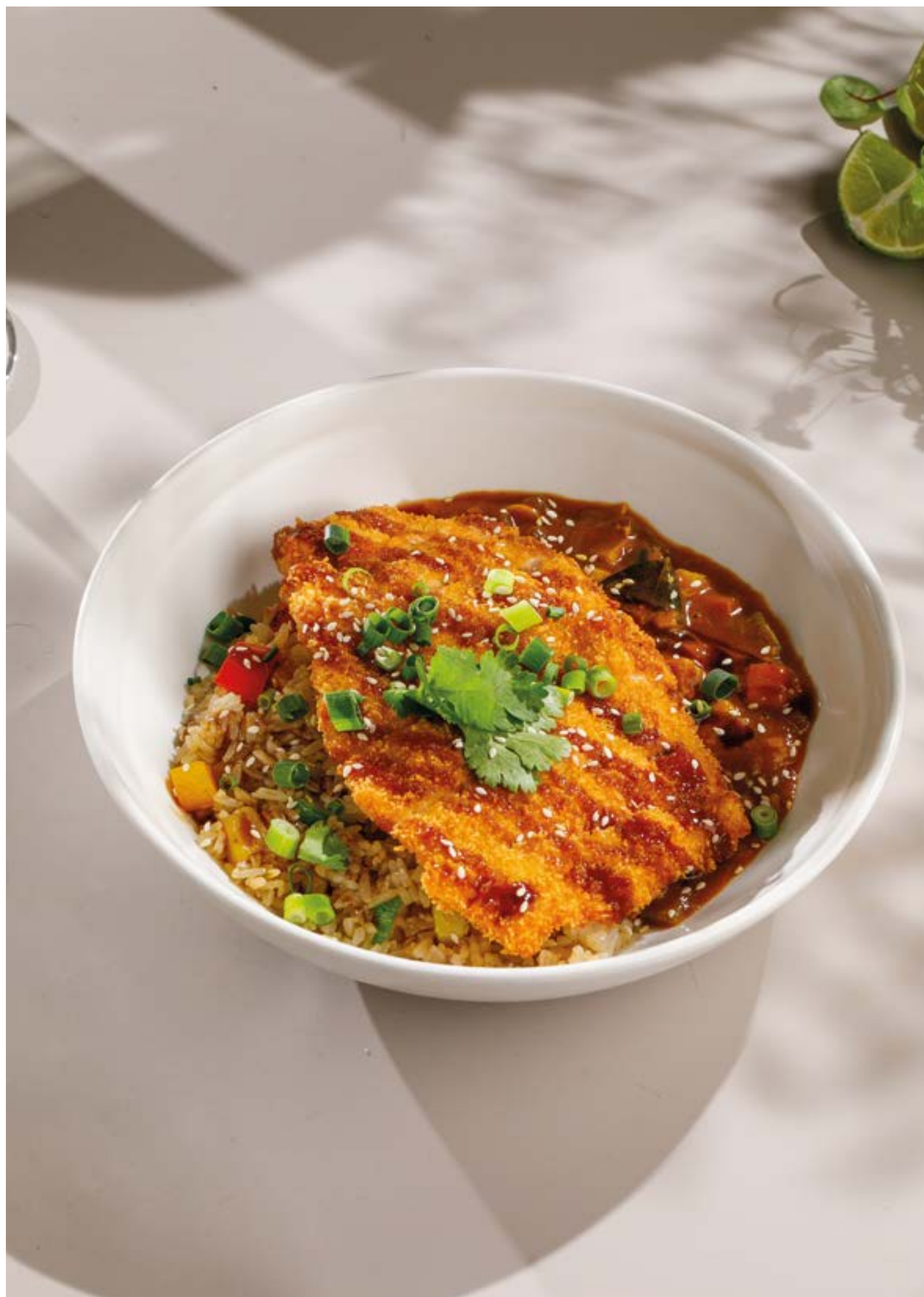
КАЦУ-КАРРИ С ЦЫПЛЕНКОМ Katsu curry with chicken