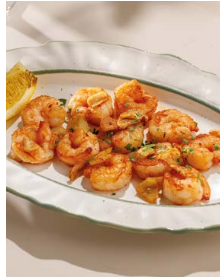
ТИГРОВЫЕ КРЕВЕТКИ, ЖАРЕННЫЕ С ЧЕСНОКОМ И ПЕТРУШКОЙ 1190 Tiger shrimp fried with garlic and parsley