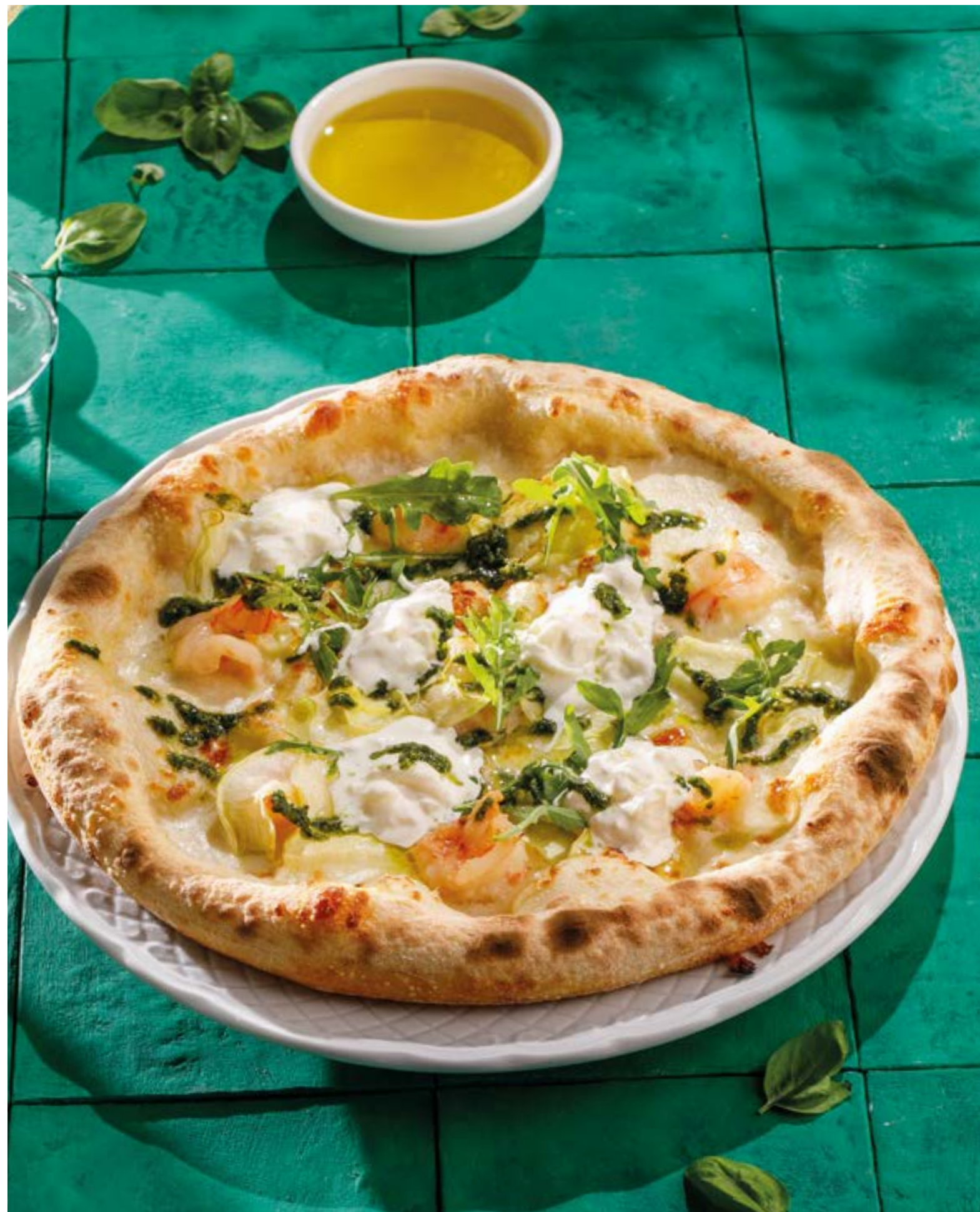
С КРЕВЕТКАМИ И ЦУКИНИ With shrimp and zucchini