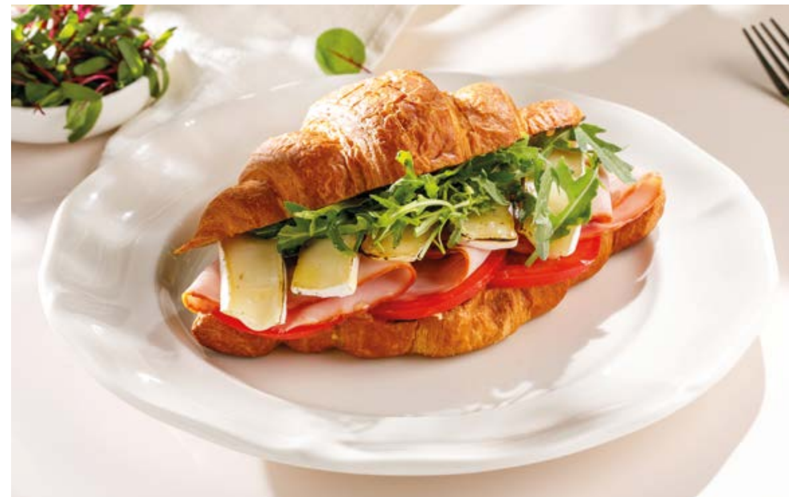
КРУАССАН С ТАМБОВСКИМ ОКОРОКОМ, СЫРОМ БРИ И СКРЭМБЛОМ 790 Croissant with Tambov hind quarter, Brie cheese and scrambled egg