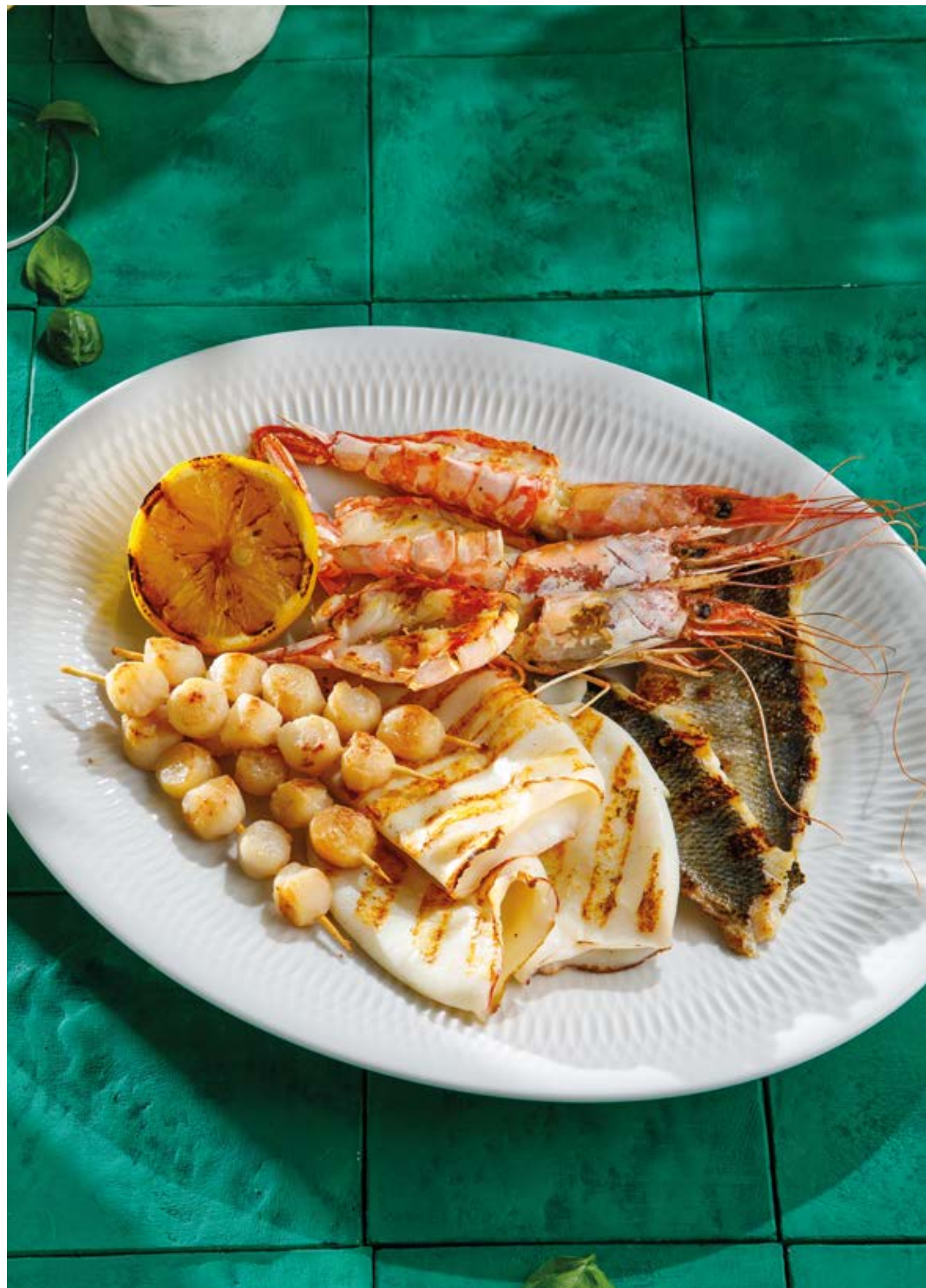
ПЛАТО ИЗ МОРЕПРОДУКТОВ Seafood platter