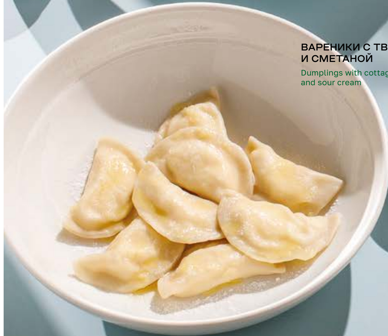
ВАРЕНИКИ С ТВОРОГОМ И СМЕТАНОЙ 450 Dumplings with cottage cheese and sour cream