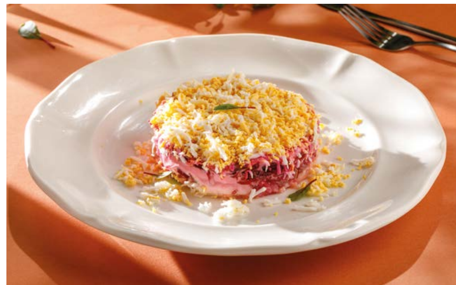
ОЛЮТОРСКАЯ СЕЛЬДЬ ПОД ШУБОЙ С ЯПОНСКИМ МАЙОНЕЗОМ Olyutor dressed herring with Japanese mayonnaise