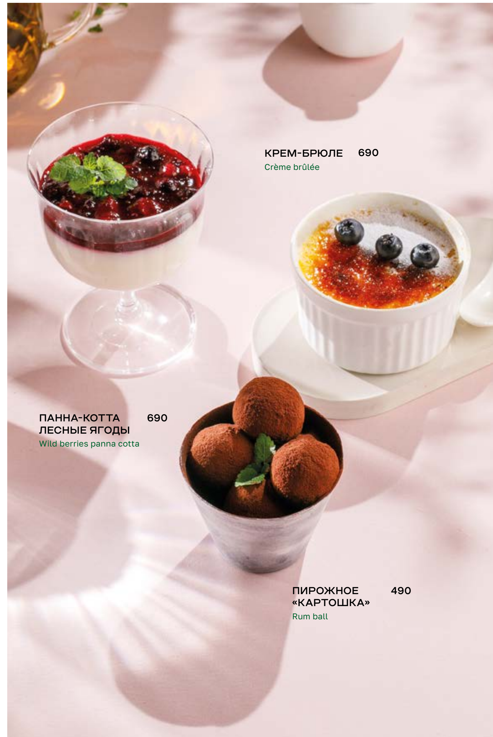
КРЕМ-БРЮЛЕ 690 Crème brûlée