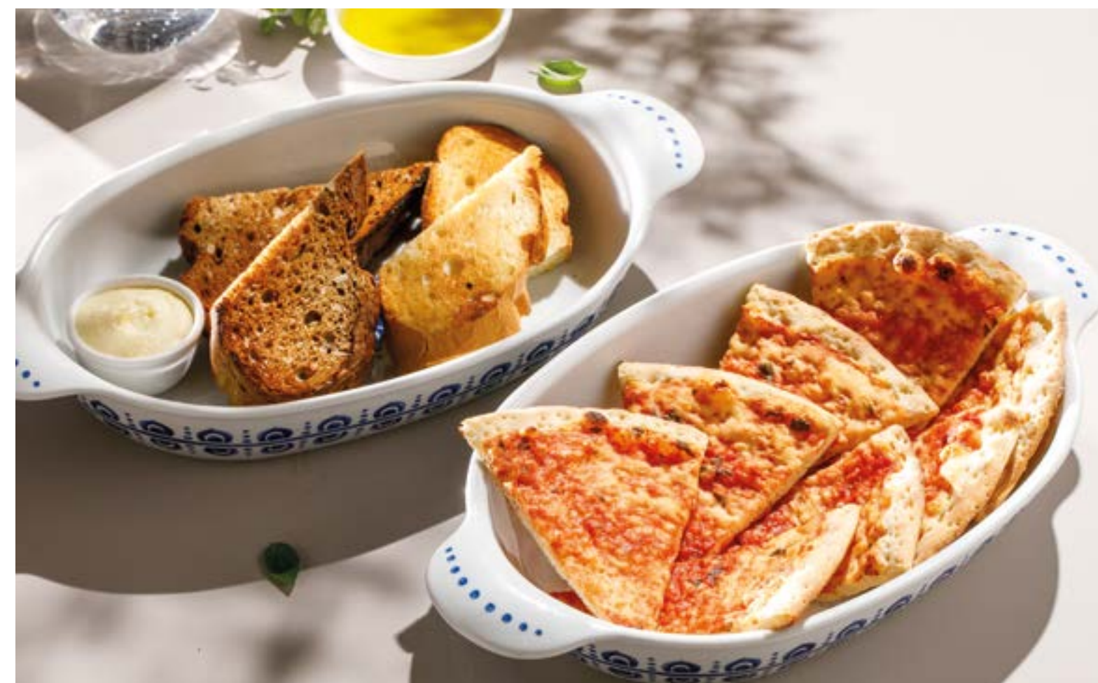
ХЛЕБНАЯ КОРЗИНА Bread basket