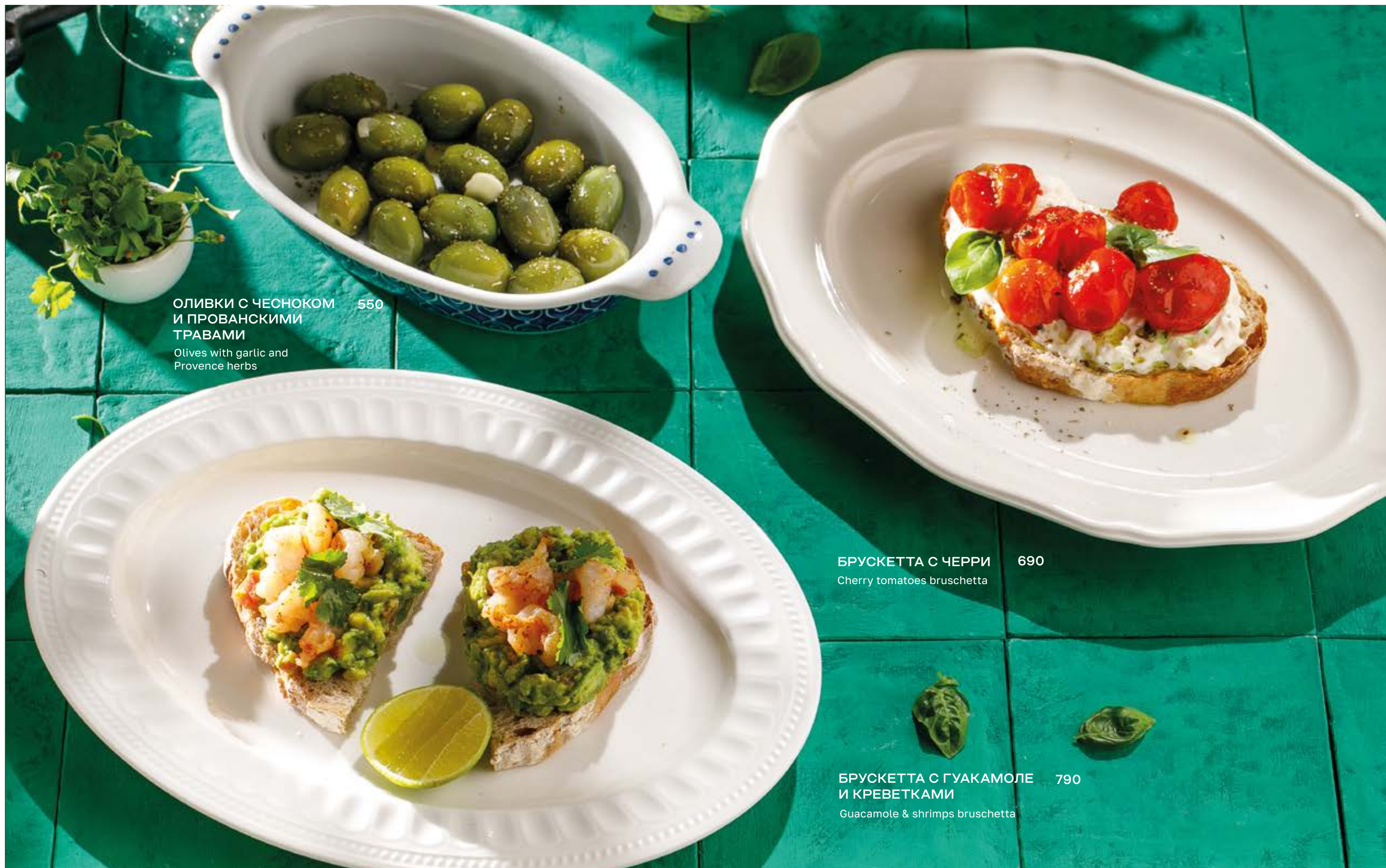
ОЛИВКИ С ЧЕСНОКОМ И ПРОВАНСКИМИ ТРАВАМИ 550 Olives with garlic and Provence herbs