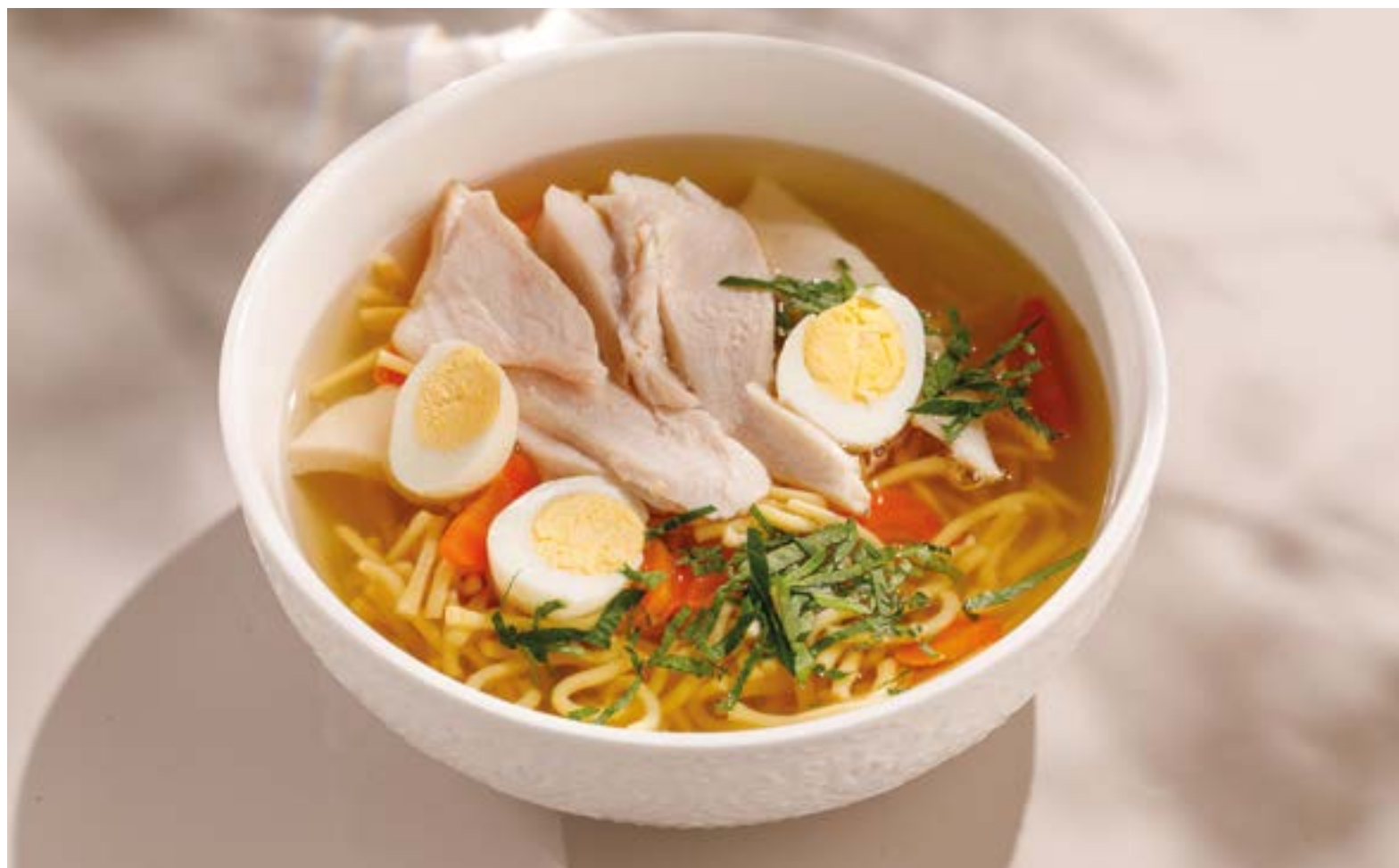
КУРИНЫЙ СУП С ДОМАШНЕЙ ЛАПШОЙ И ФЕРМЕРСКИМ ЦЫПЛЕНКОМ

Homemade chicken noodle soup with farm poussin