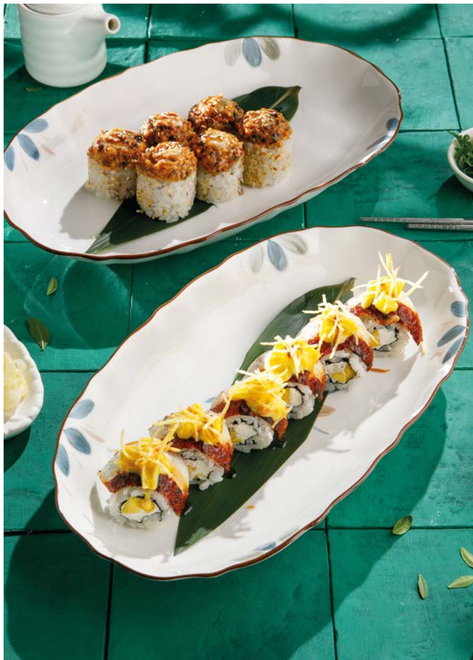
ЗАПЕЧЕННЫЙ РОЛЛ С УГРЕМ Baked eel roll