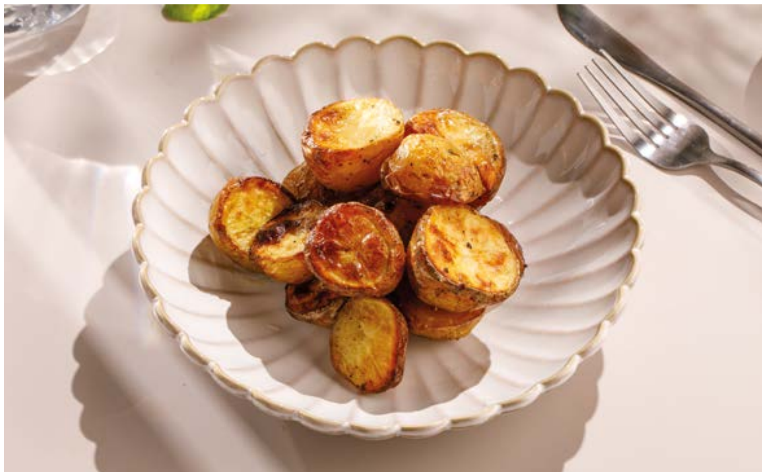
ЗАПЕЧЕННЫЙ БЕЙБИ-КАРТОФЕЛЬ Baked baby potatoes