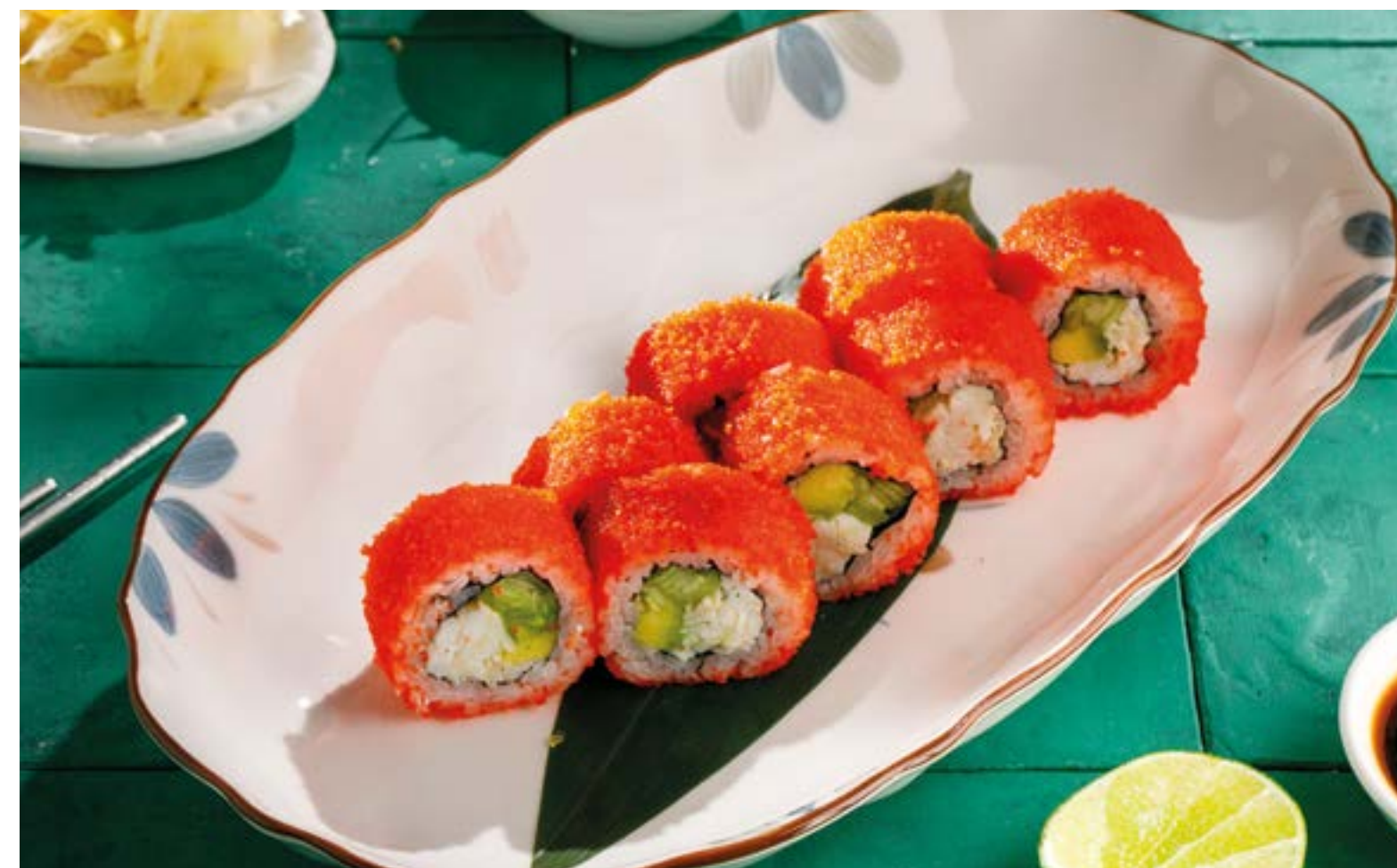
КАЛИФОРНИЯ С УГРЕМ / С КРАБОМ / С ЛОСОСЕМ California roll with eel / with crab / with salmon