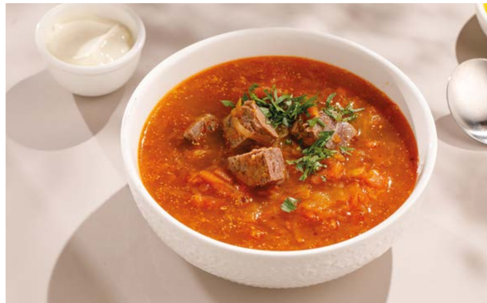
КИСЛЫЕ ЩИ С ГОВЯДИНОЙ