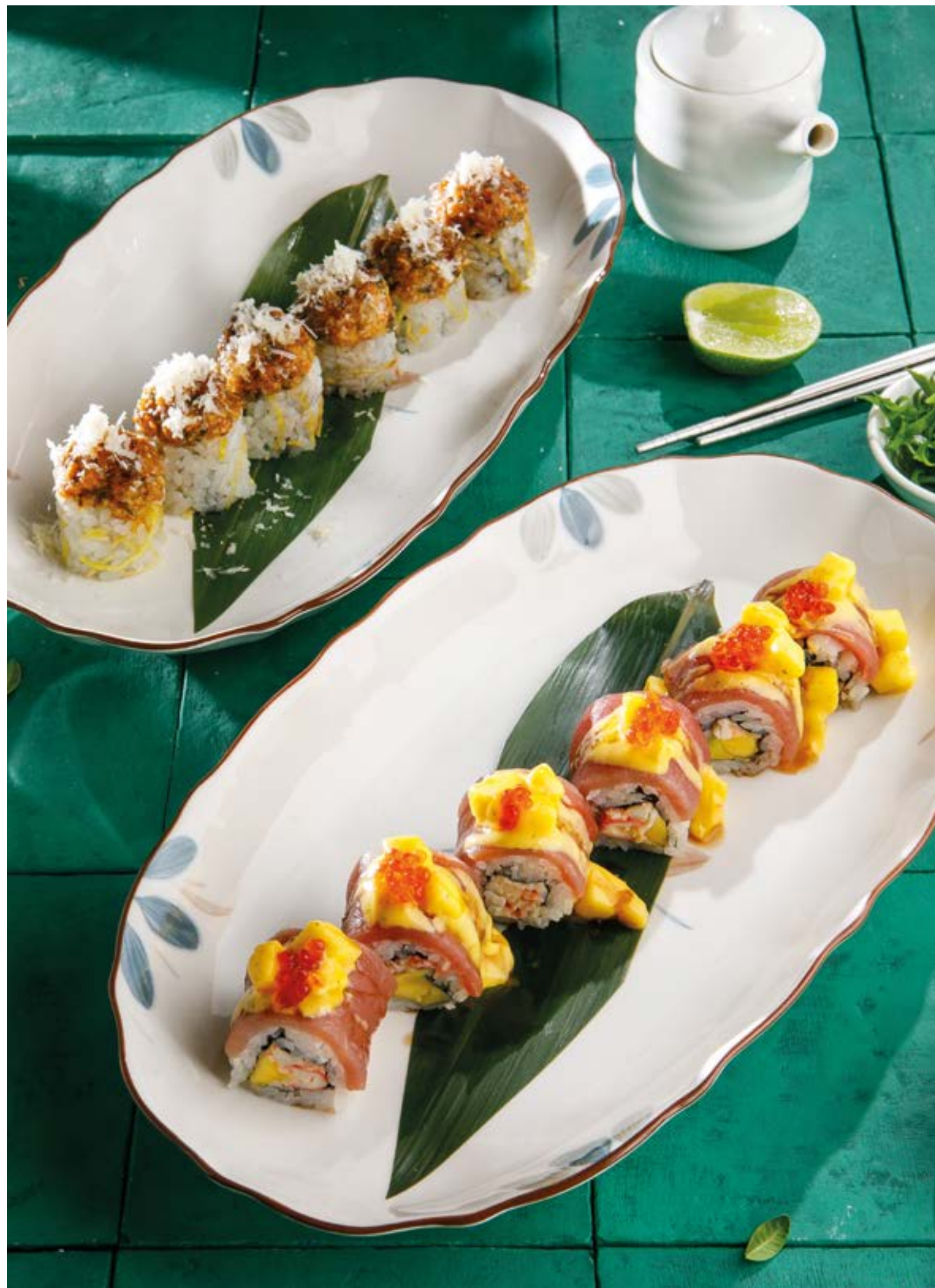
ЗАПЕЧЕННЫЙ РОЛЛ С УГРЕМ, КАРТОФЕЛЬНЫМ КРАНЧЕМ И ПАРМЕЗАНОМ

Baked eel roll with potato crunch and parmesan