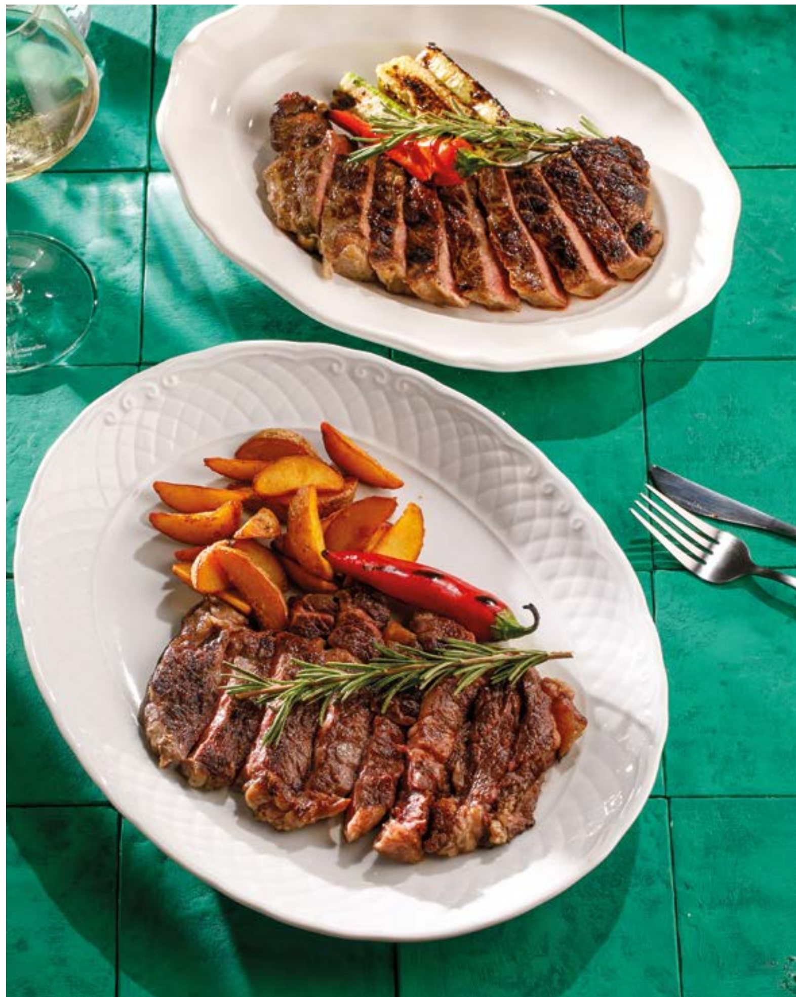
СТЕЙК РИБАЙ С КАРТОФЕЛЕМ АЙДАХО Ribeye steak with Idaho potatoes