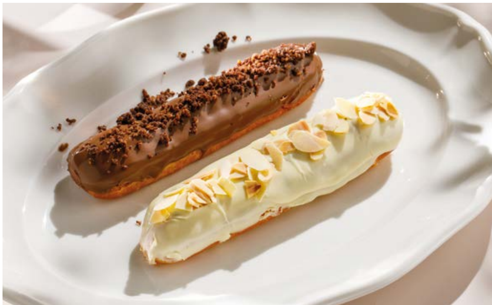
ЭКЛЕР ВАНИЛЬНЫЙ / ШОКОЛАДНЫЙ