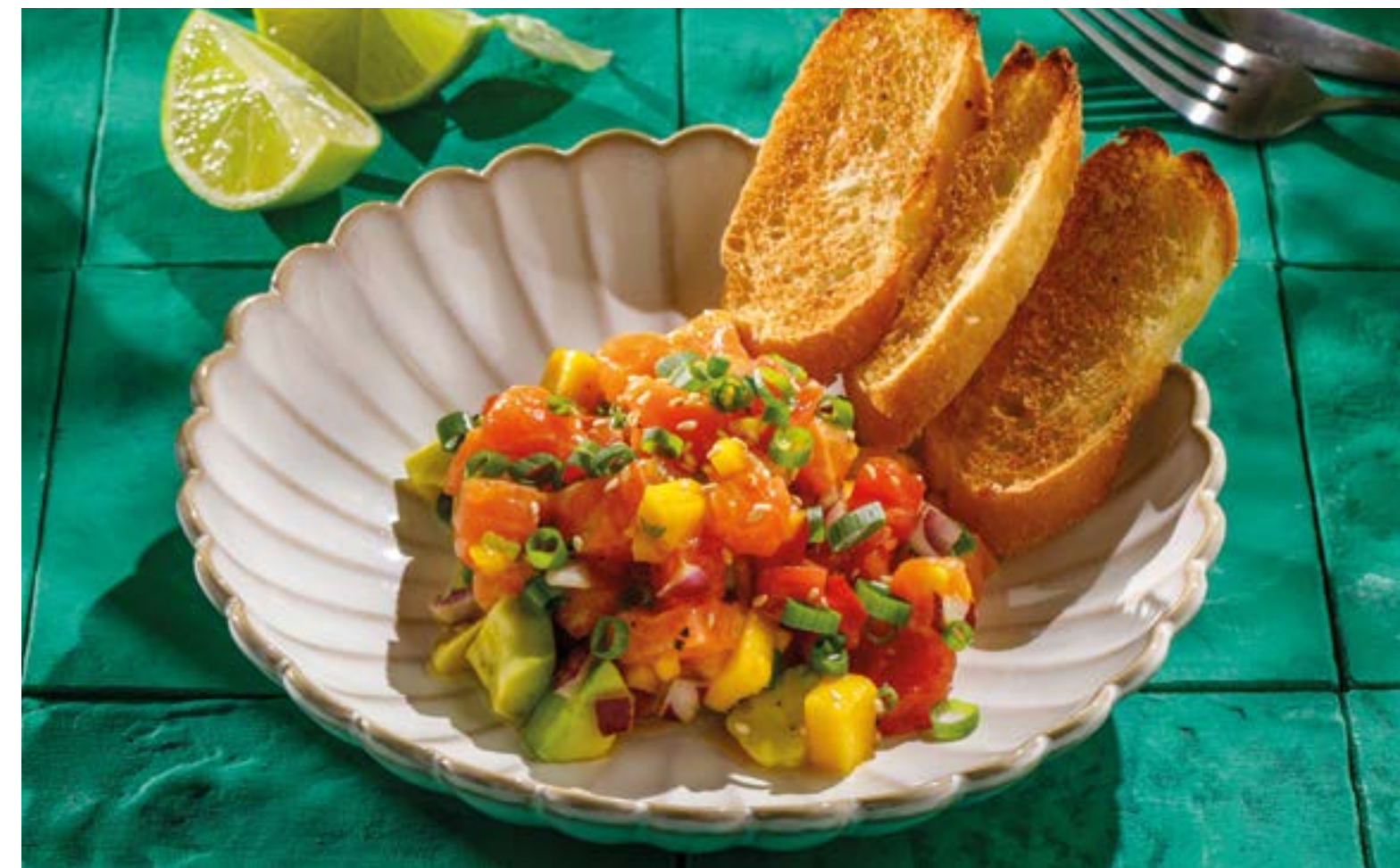
ЛОСОСЬ С МАНГО И АВОКАДО Salmon with mango and avocado