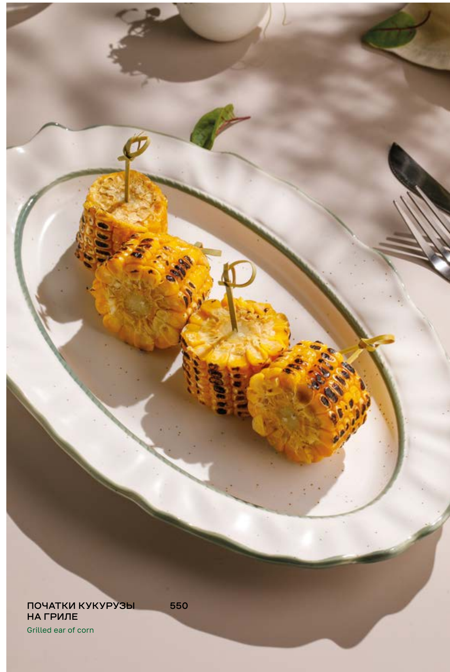
ПОЧАТКИ КУКУРУЗЫ НА ГРИЛЕ Grilled ear of corn