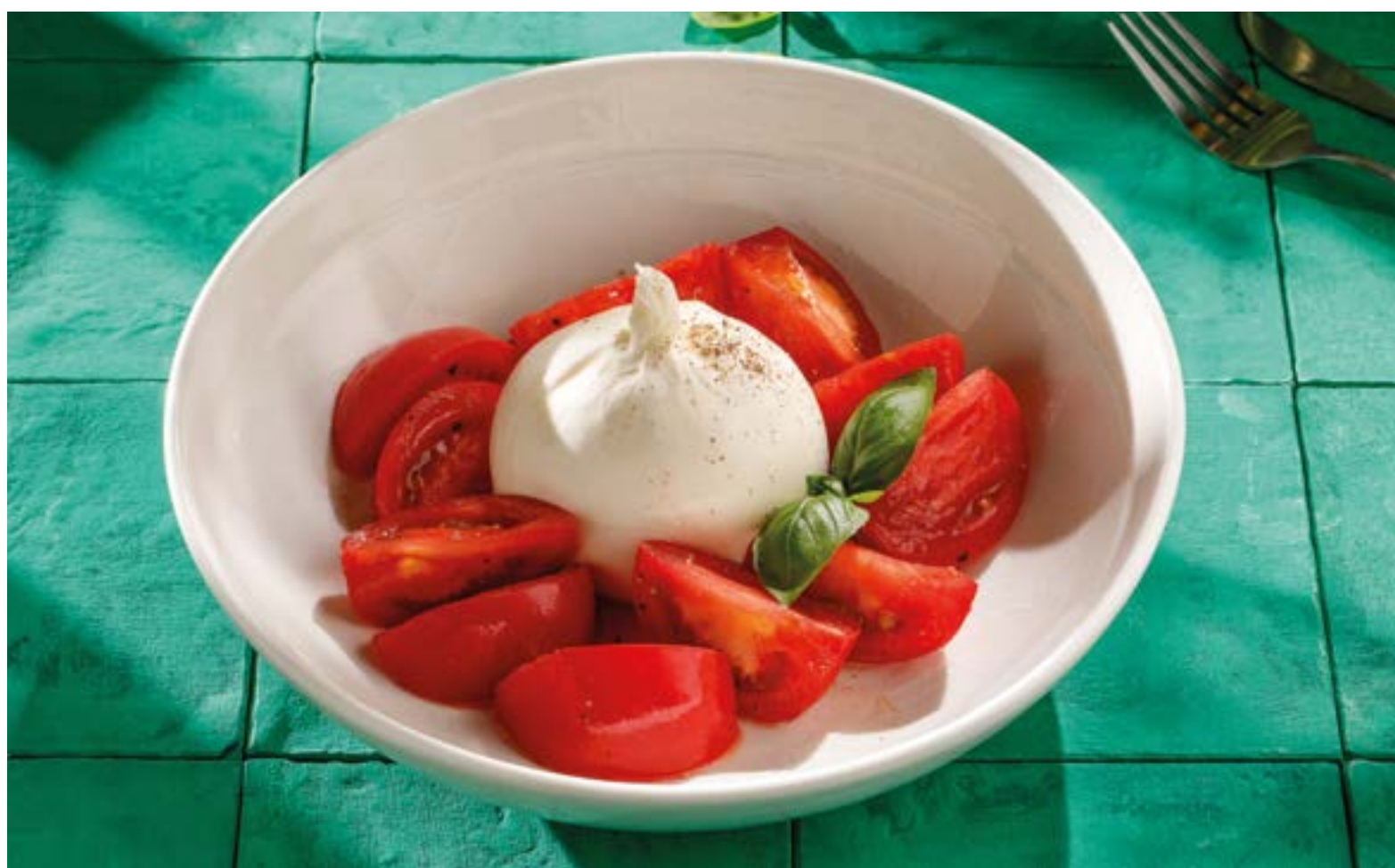
ФЕРМЕРСКАЯ БУРРАТА С ТОМАТАМИ Homemade Burrata with tomatoes