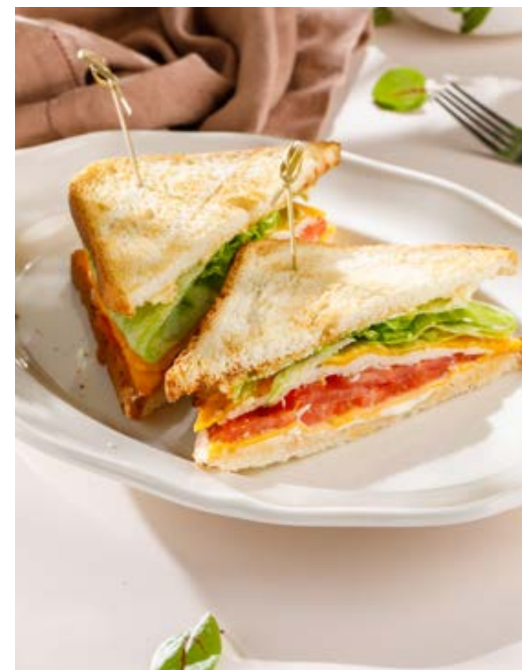
СЕНДВИЧ С ФЕРМЕРСКИМ ЦЫПЛЕНКОМ 690 Farm chicken sandwich