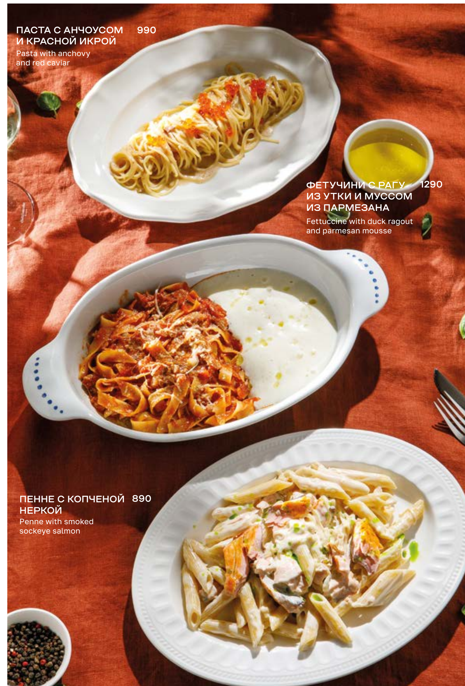
ПАСТА С АНЧОУСОМ И КРАСНОЙ ИКРОЙ 990 Pasta with anchovy and red caviar