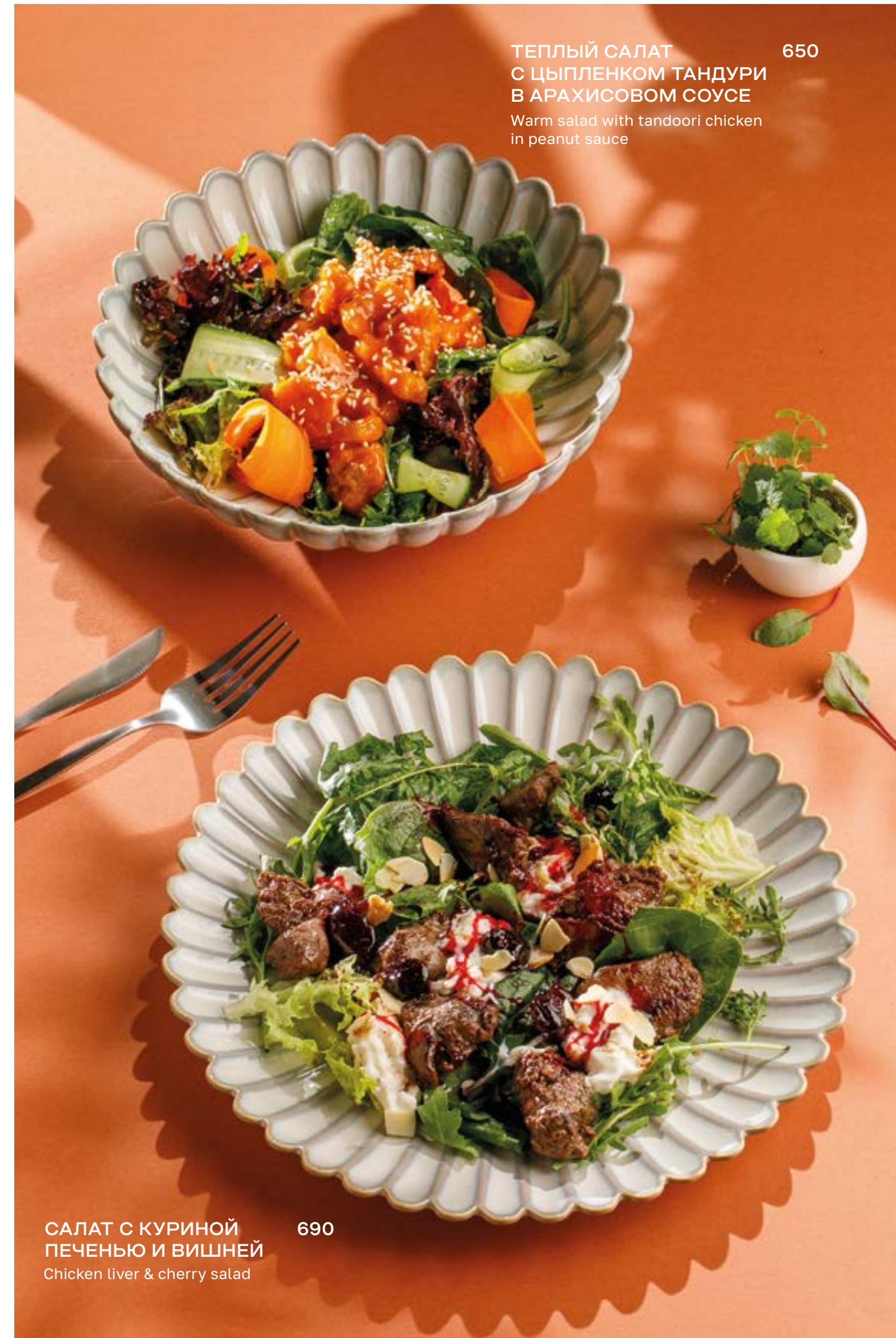
ТЕПЛЫЙ САЛАТ С ЦЫПЛЕНКОМ ТАНДУРИ В АРАХИСОВОМ СОУСЕ Warm salad with tandoori chicken in peanut sauce