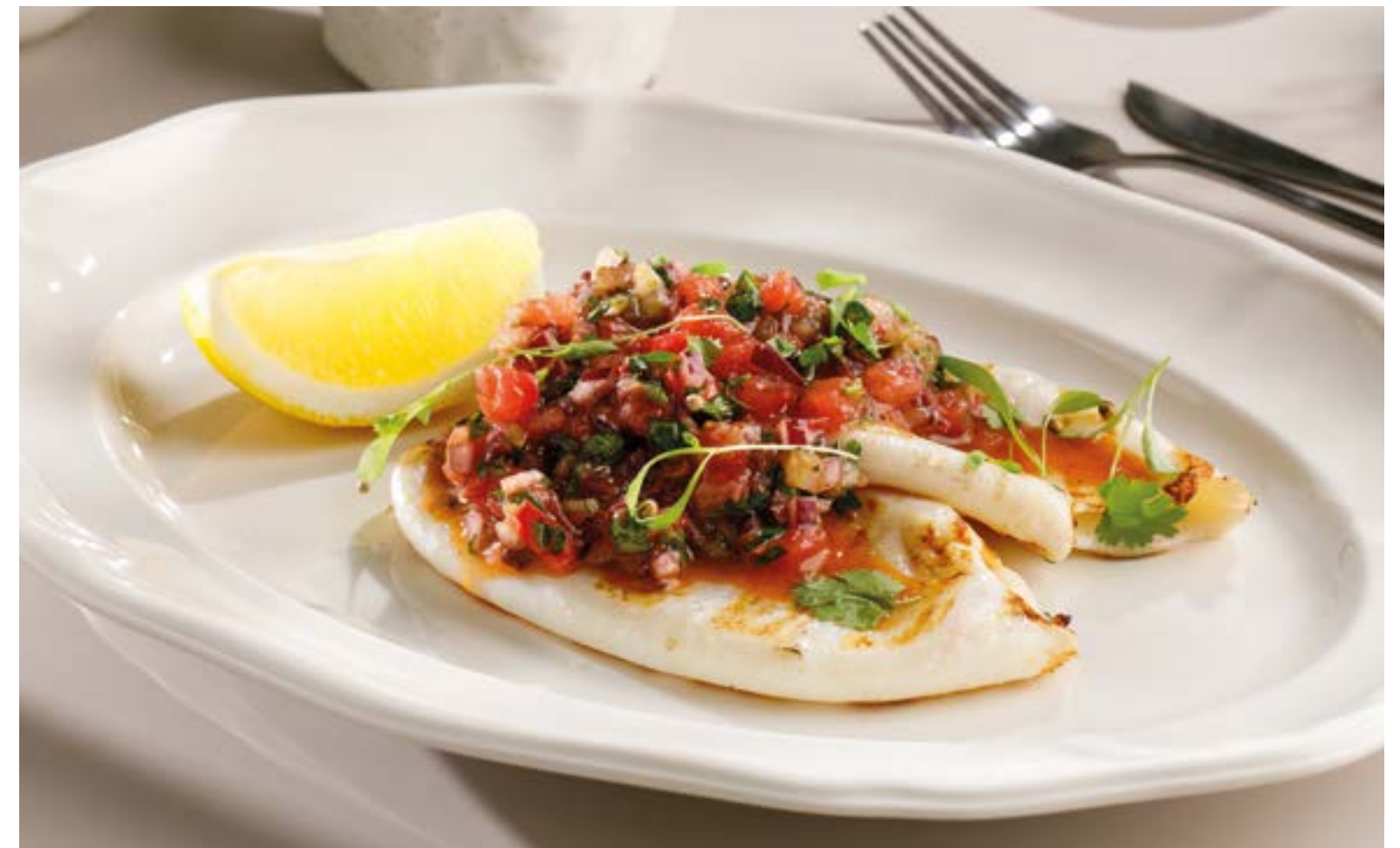
КАЛЬМАР С ТОМАТНОЙ САЛЬСОЙ 1090 Calamari with tomato salsa