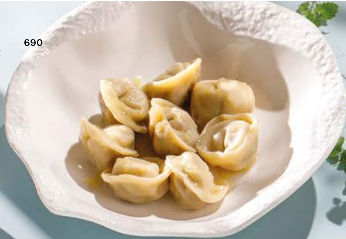
ПЕЛЬМЕНИ СИБИРСКИЕ 690 Siberian pelmeni