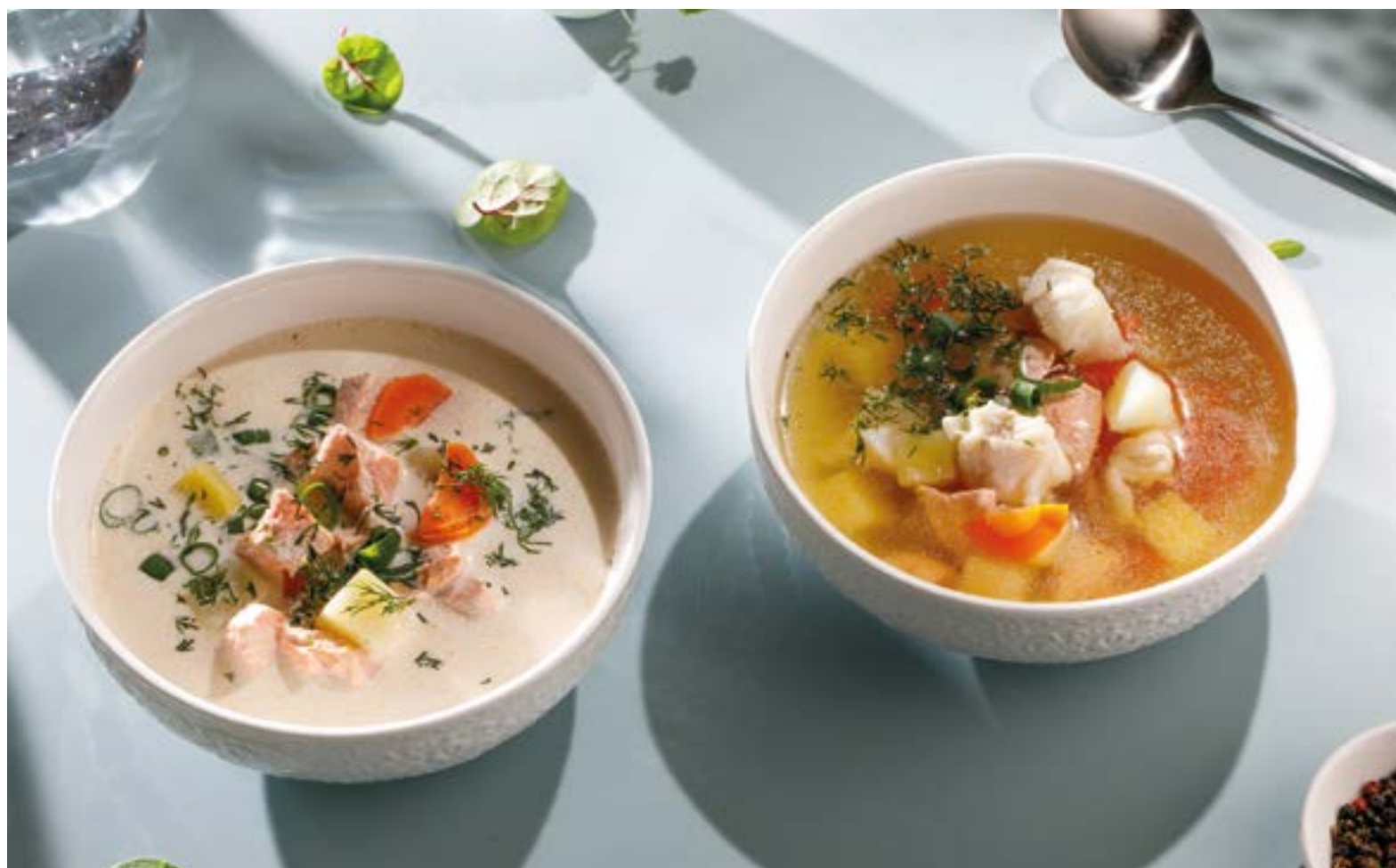
КАРЕЛЬСКАЯ УХА С ФОРЕЛЬЮ И СЛИВКАМИ