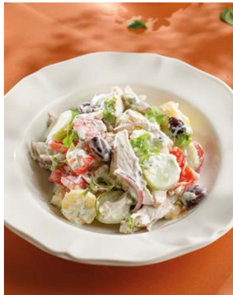
САЛАТ С ЦЫПЛЕНКОМ И ДЗАДЗИКИ Chicken & tzatziki salad