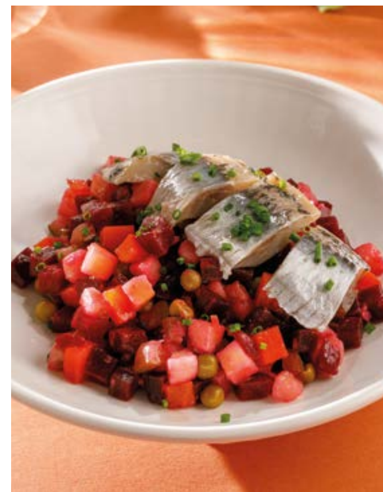
ВИНЕГРЕТ / ВИНЕГРЕТ С СЕЛЬДЬЮ 390 / 590 Vinegret / vinegret with herring