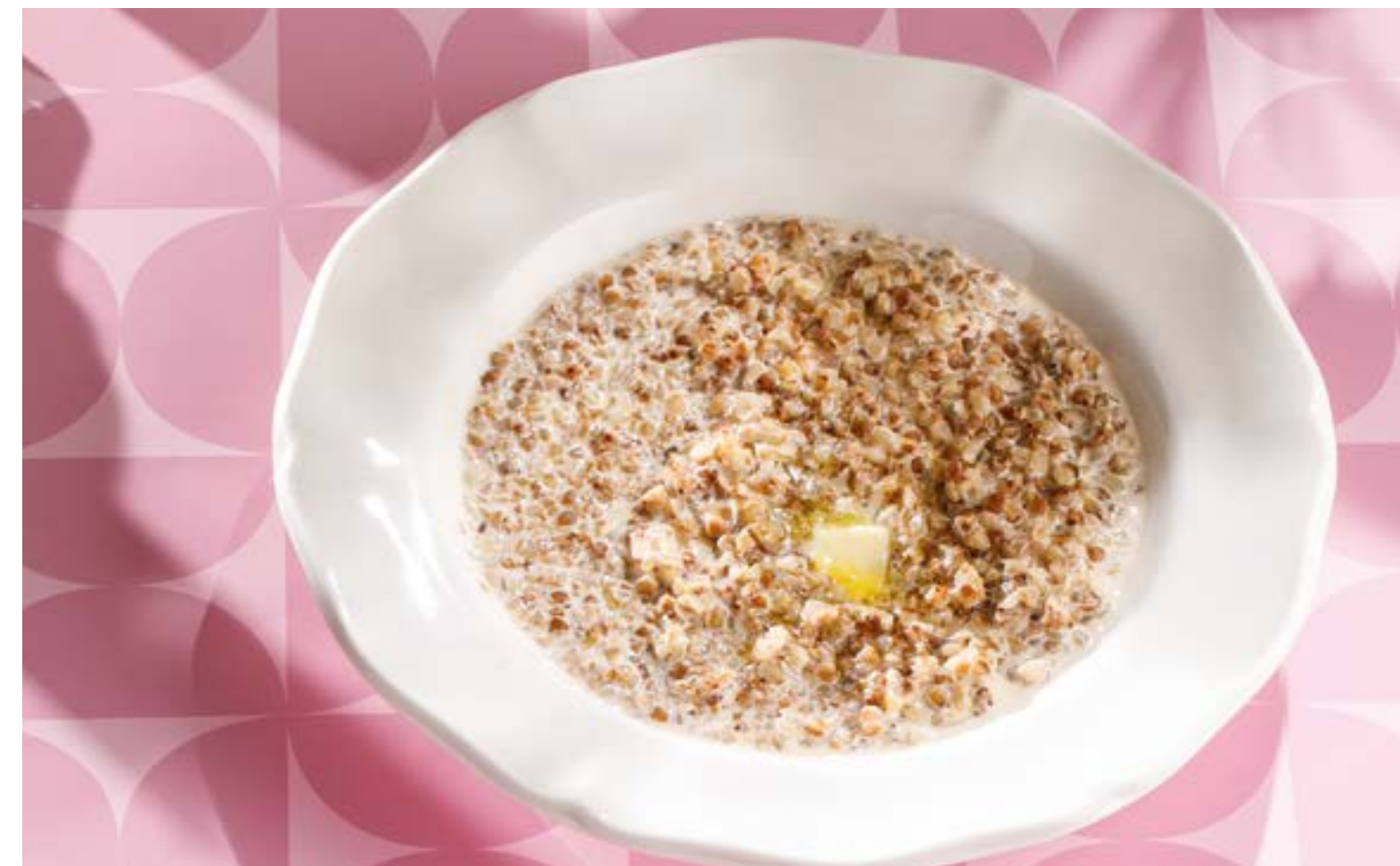
КАША С МАСЛОМ ОВСЯНАЯ Oatmeal porridge with butter