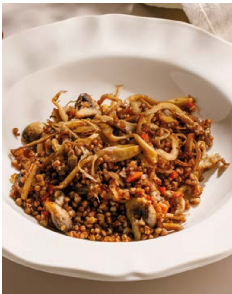
ГРЕЧКА С ГРИБАМИ Buckwheat with mushrooms