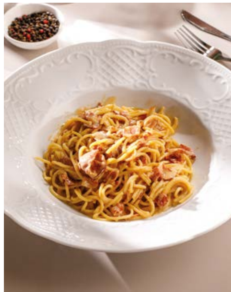
СПАГЕТТИ КАРБОНАРА Spaghetti Carbonara