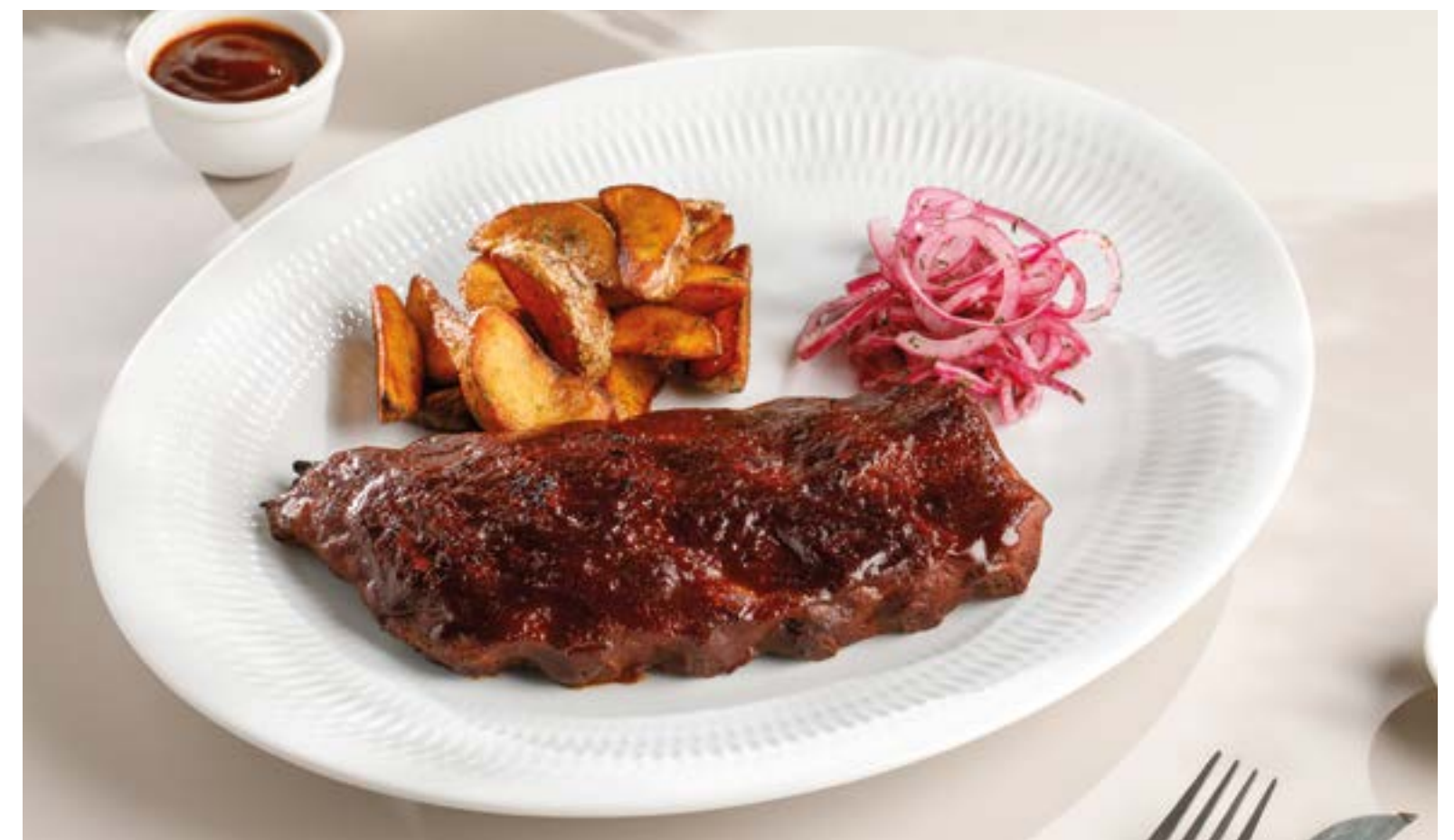
РЕБРА СВИНЫЕ В СОУСЕ БАРБЕКЮ