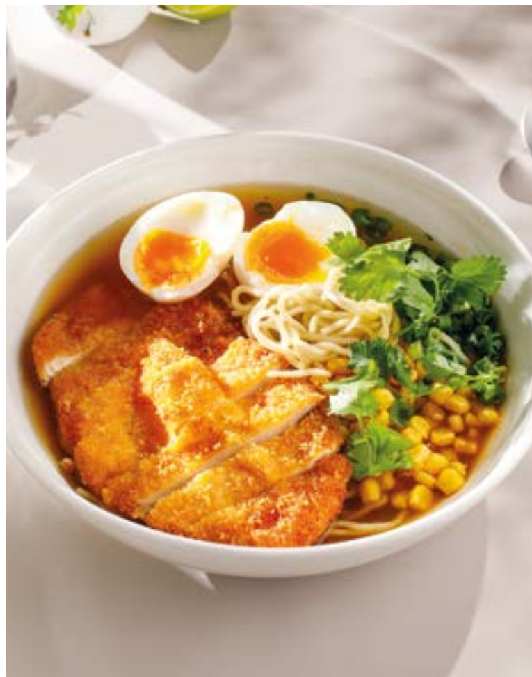
РАМЭН С ХРУСТЯЩИМ ЦЫПЛЕНКОМ Ramen with crispy chicken