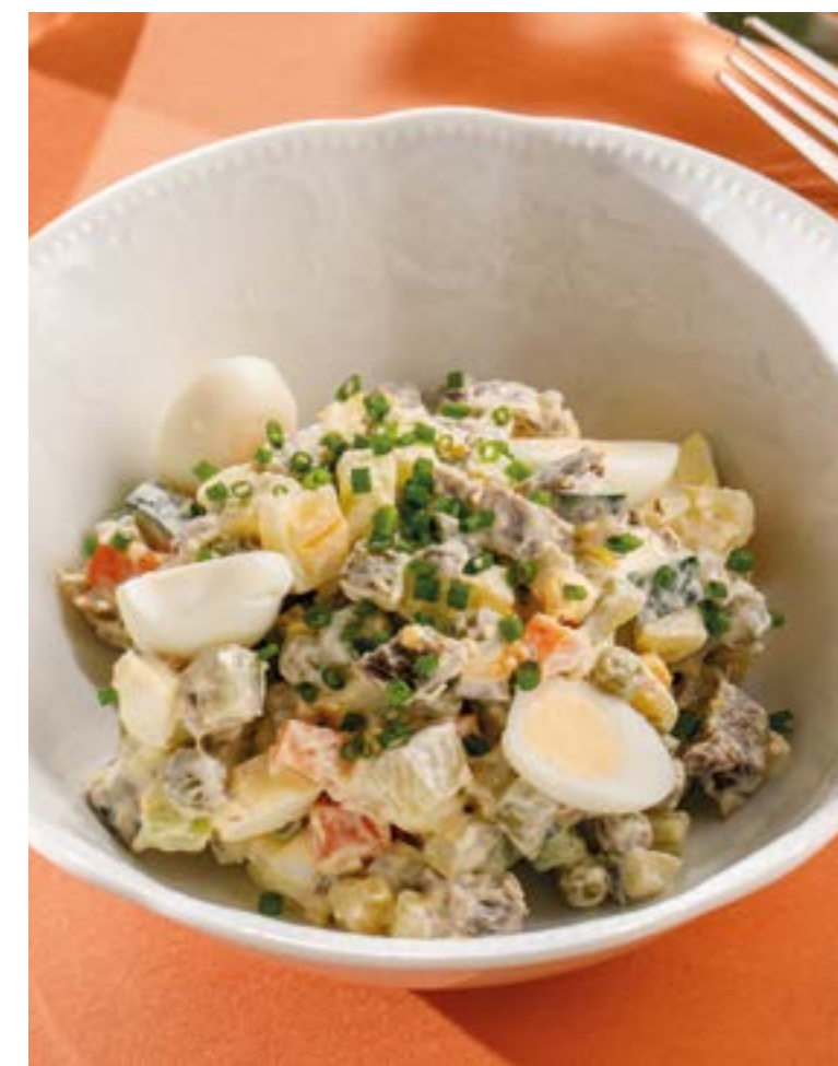
ОЛИВЬЕ С КОЛБАСОЙ / С ЦЫПЛЕНКОМ / С ГОВЯДИНОЙ 590 / 590 / 690 Russian salad with sausage / with chicken / with beef