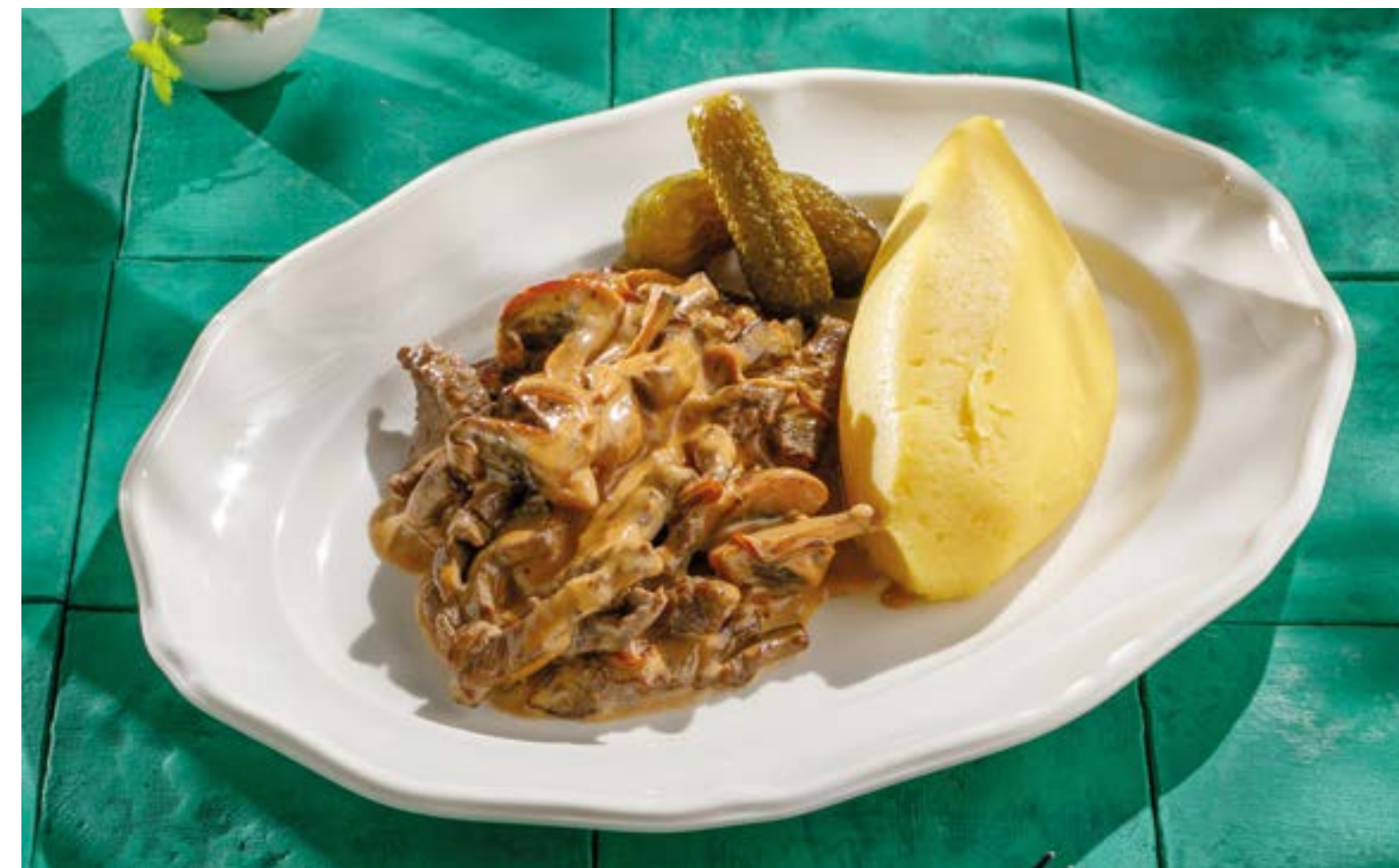
БЕФСТРОГАНОВ С ГРИБАМИ И КАРТОФЕЛЬНЫМ ПЮРЕ

Beef Stroganoff with mushrooms and mashed potatoes