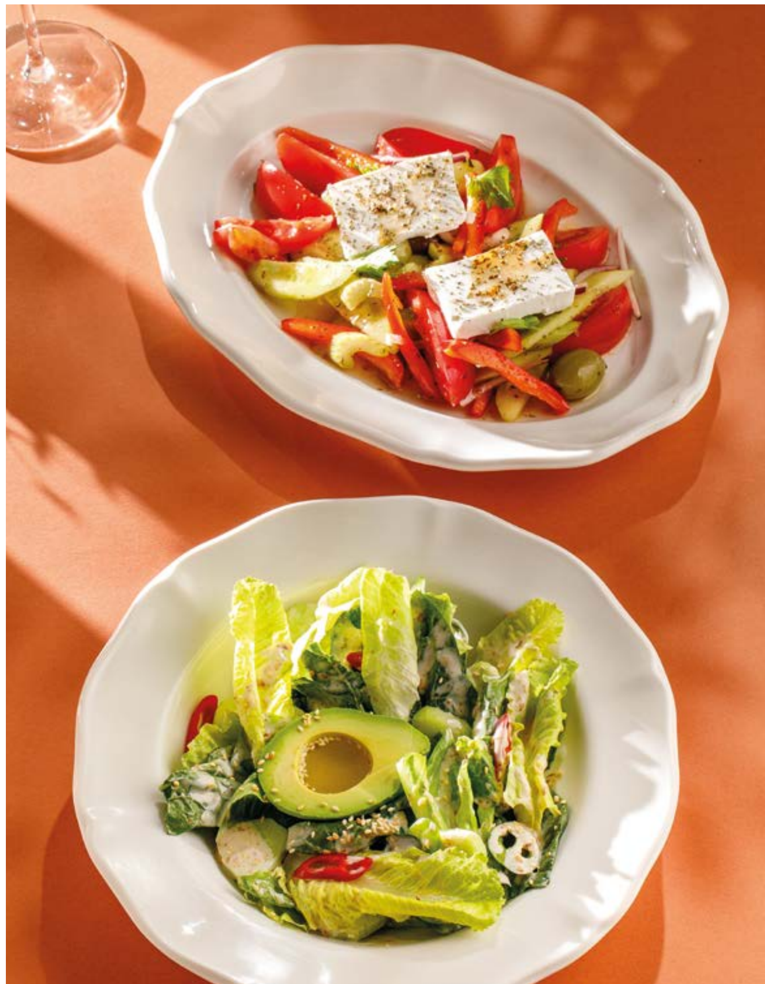
ГРЕЧЕСКИЙ САЛАТ С СЫРОМ ФЕТА Greek salad with feta cheese