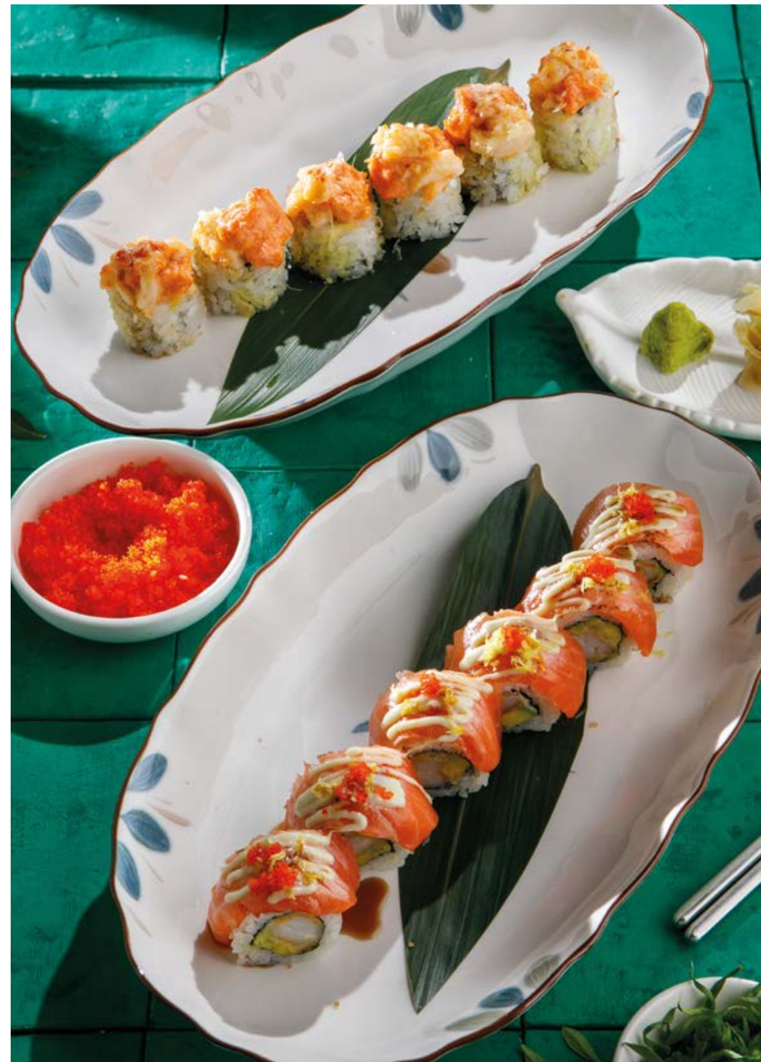
РОЛЛ С ЛОСОСЕМ, КРЕВЕТКОЙ 1890 ТЕМПУРА И СОУСОМ ВАСАБИ Salmon roll with tempura shrimps and wasabi sauce