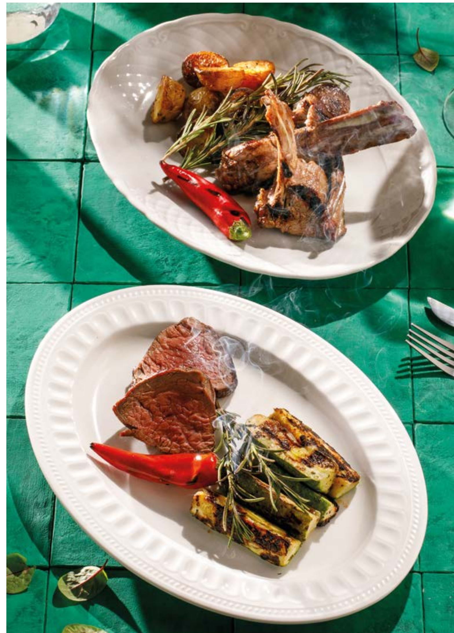
КАРЕ ЯГНЕНКА С ПЕЧЕНЫМ КАРТОФЕЛЕМ Rack of lamb with potatoes