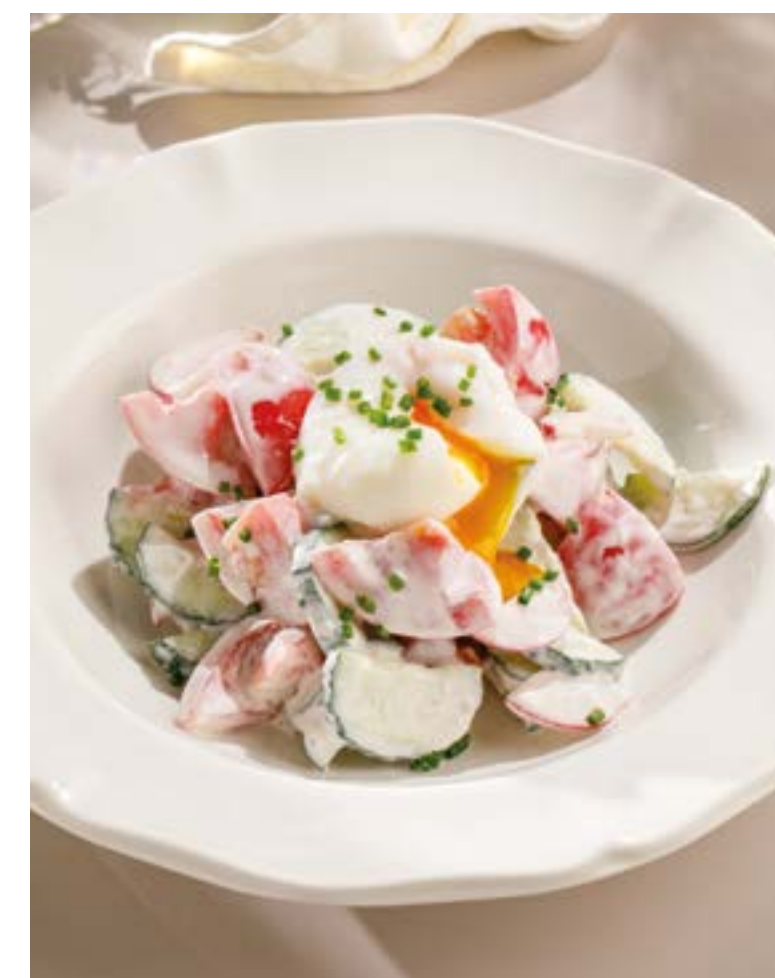
ОВОЩНОЙ САЛАТ С ЯЙЦОМ ПАШОТ И СМЕТАНОЙ Vegetable salad with poached egg and sour cream