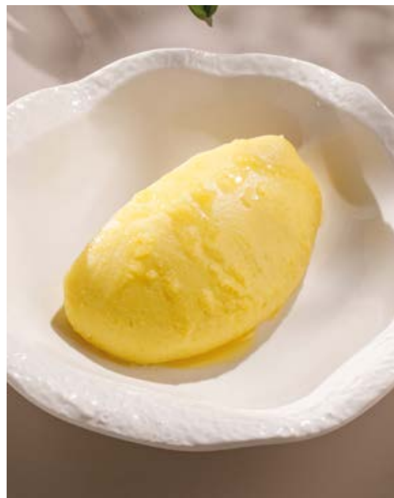
КАРТОФЕЛЬНОЕ ПЮРЕ Mashed potatoes