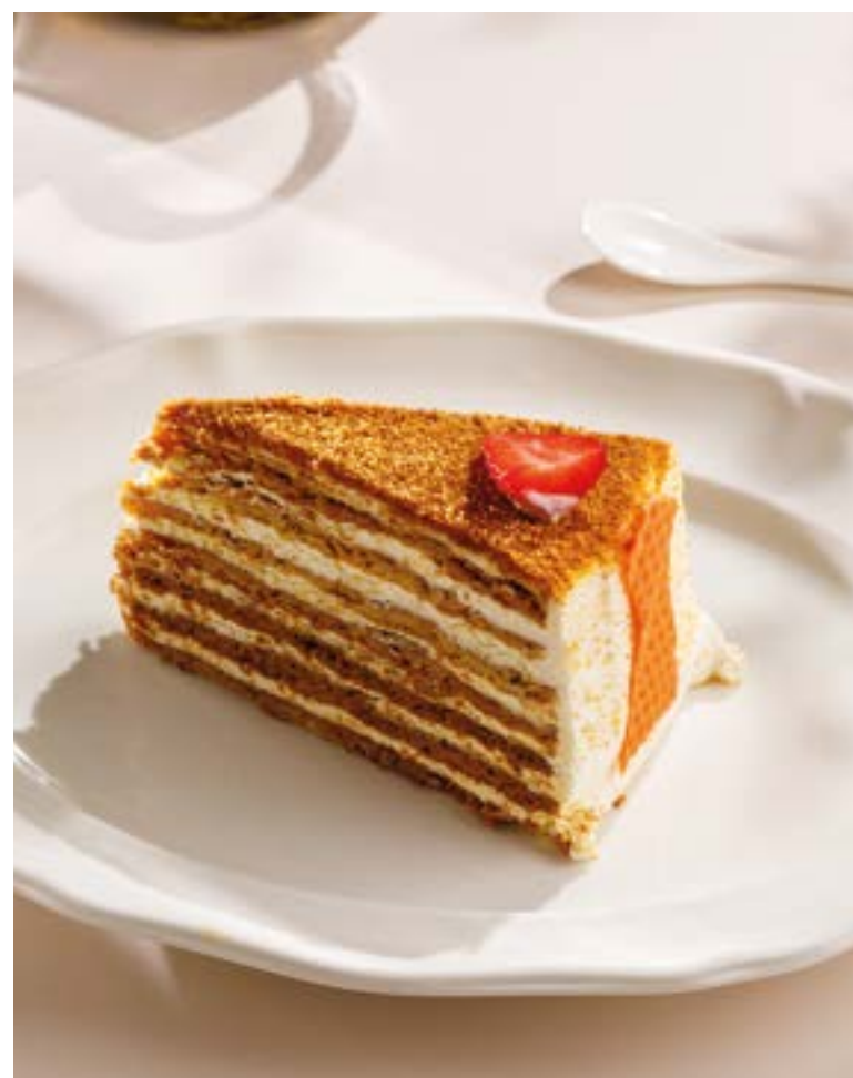
МЕДОВИК Medovik (honey cake)