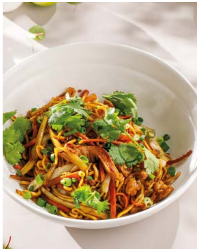
ЛАПША ЧОУ МЕЙН С ГОВЯДИНОЙ / С ЦЫПЛЕНКОМ Chow mein noodles with beef / chicken