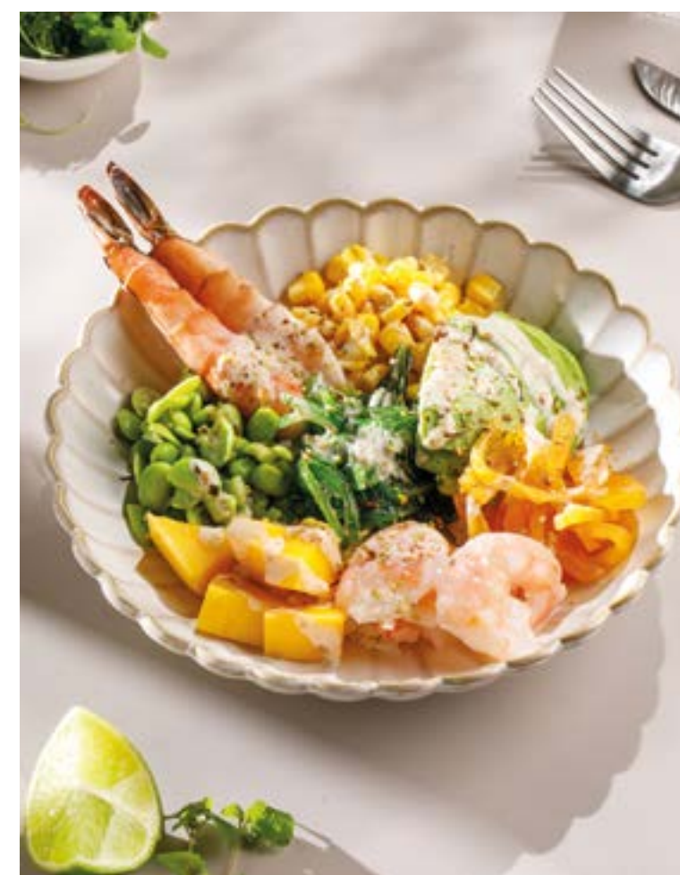
ПОКЕ С КРЕВЕТКАМИ Poke with shrimp