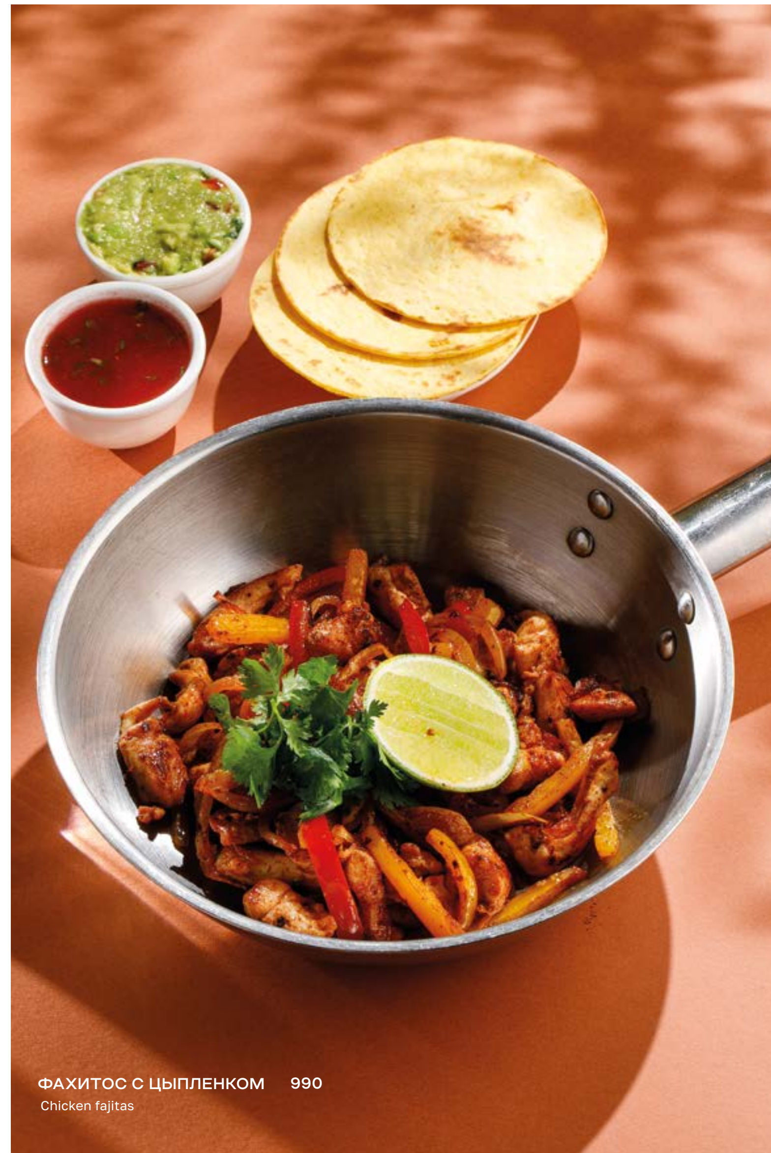
ФАХИТОС С ЦЫПЛЕНКОМ 990