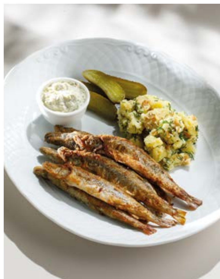
ЖАРЕННАЯ ПО-ДОМАШНЕМУ БАЛТИЙСКАЯ КОРЮШКА