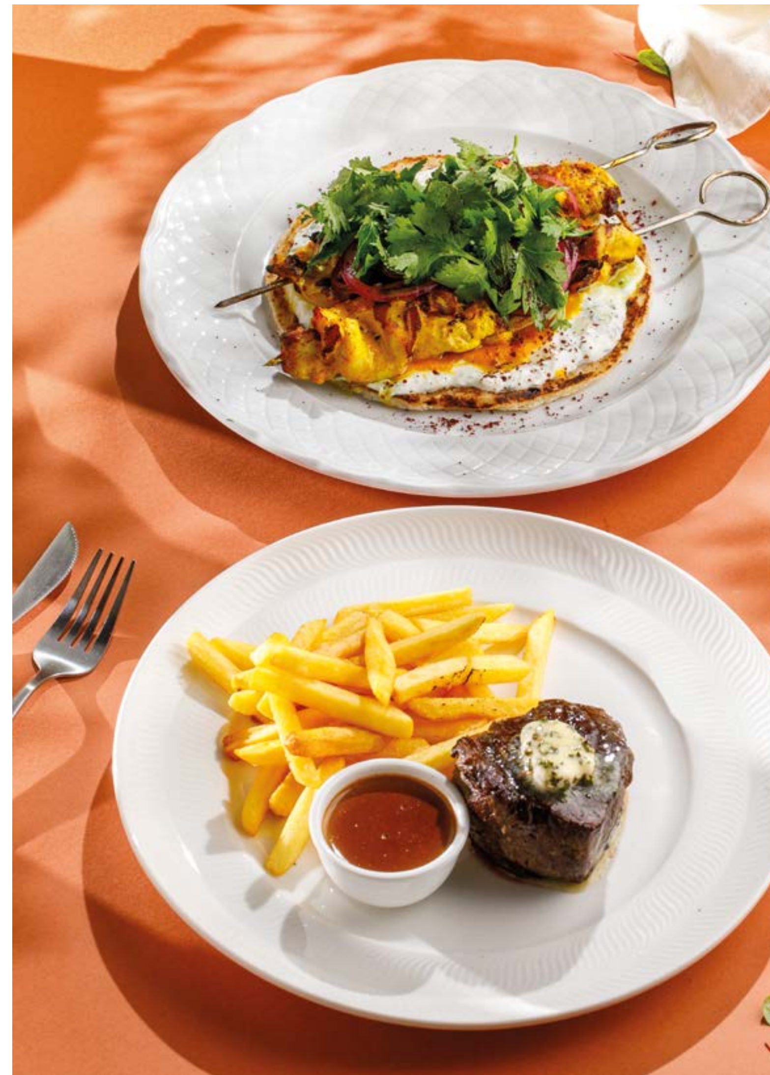
ГРЕЧЕСКИЕ ШАШЛЫЧКИ «СУВЛАКИ» С ЛЕПЕШКОЙ РОТИ, ДЗАДЗИКИ И КРЕМОМ ИЗ ПЕЧЕНЫХ ОВОЩЕЙ Greek "Souvlaki" skewers with roti flatbread, tzatziki and baked vegetables cream