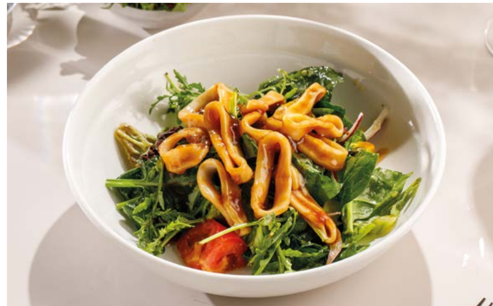
САЛАТ С КАЛЬМАРОМ В СОУСЕ ТЕРИЯКИ Salad with calamari in teriyaki sauce