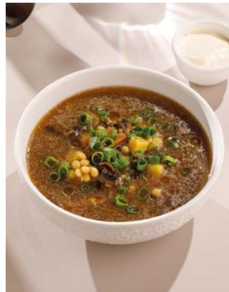
ГРИБНОЙ СУП С ПТИТИМОМ