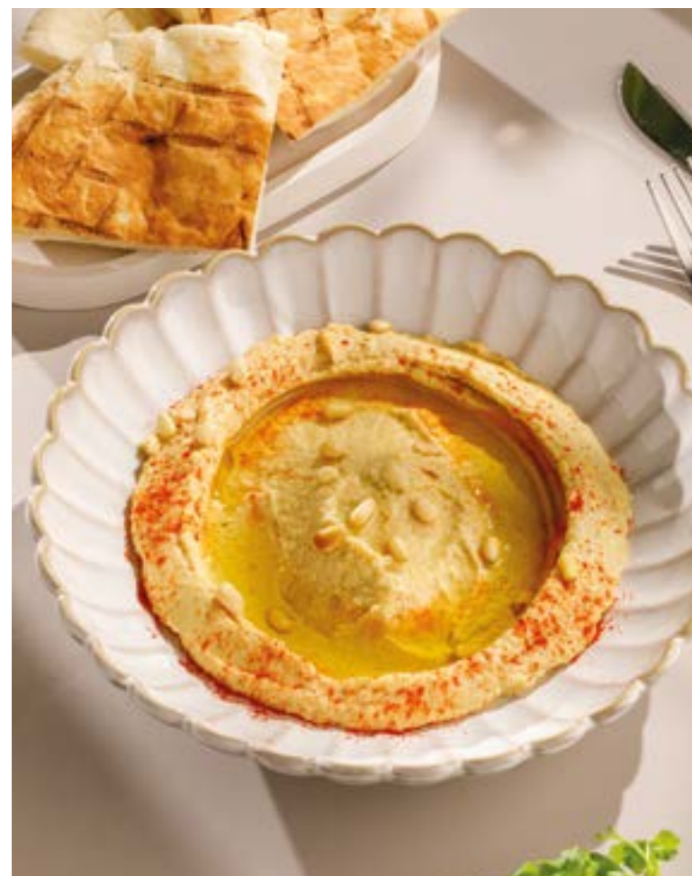
990 ХУМУС С ПИТОЙ Hummus with pita