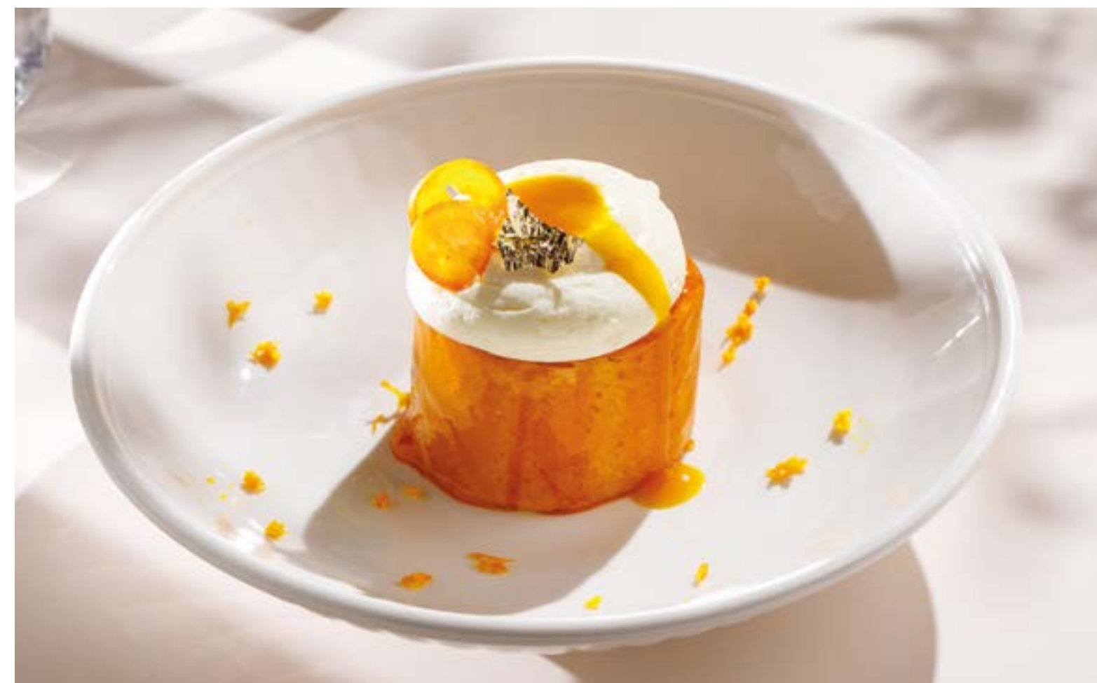
ЯПОНСКИЙ ЗАВАРНОЙ РУЛЕТ С АПЕЛЬСИНОМ И МАРАКУЙЕЙ Japanese custard roll with orange and passion fruit