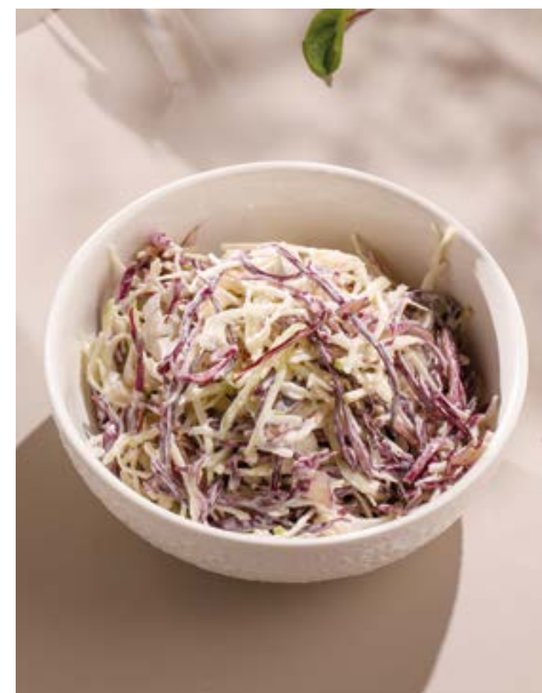
КАПУСТА КОУЛ-СЛОУ Cole Slaw