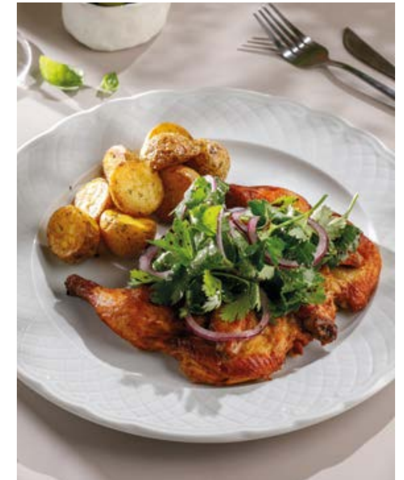
ЦЫПЛЕНОК С ПЕЧЕНЫМ КАРТОФЕЛЕМ