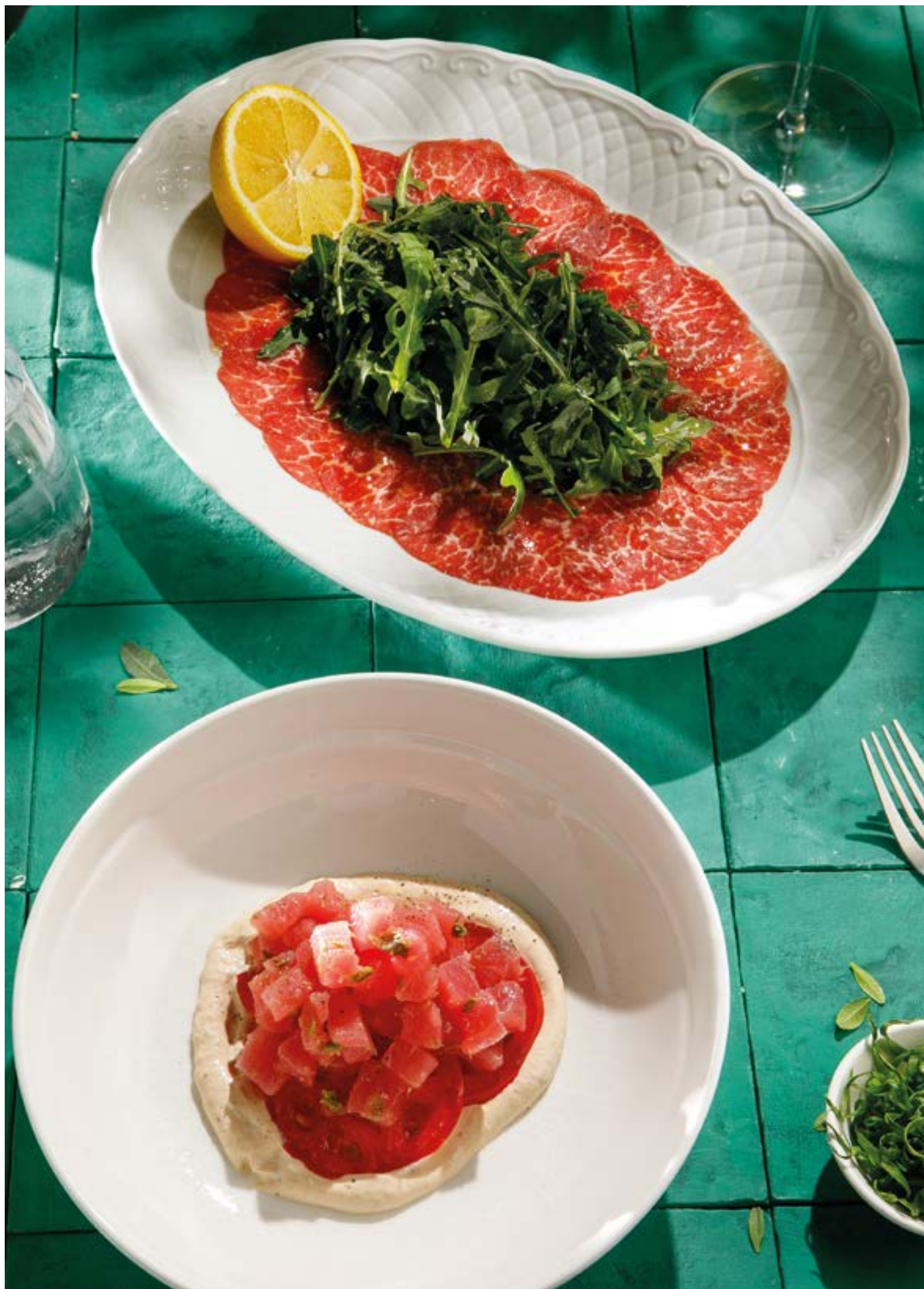
КАРПАЧО ИЗ ГОВЯДИНЫ Beef carpaccio