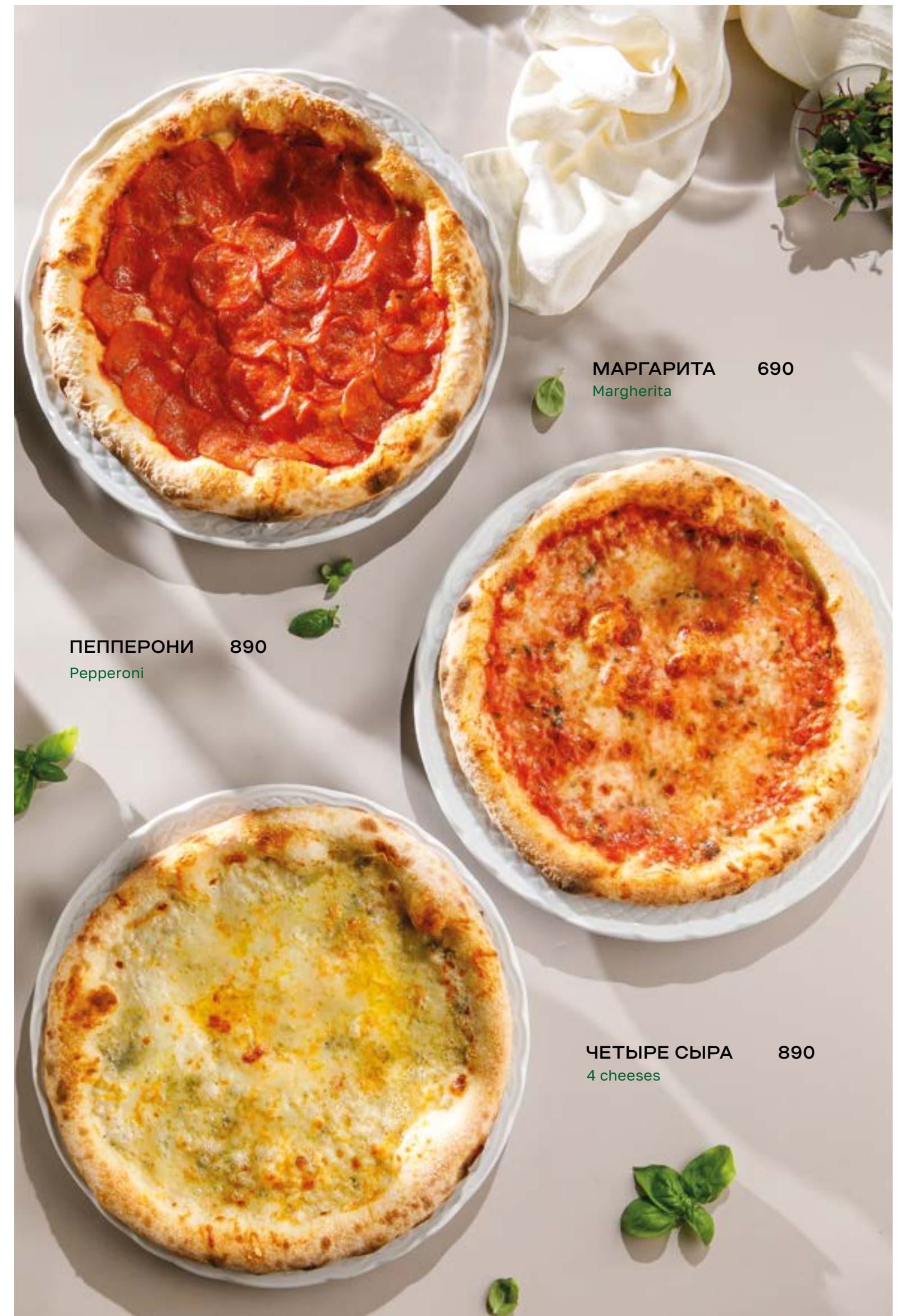
МАРГАРИТА 690 Margherita