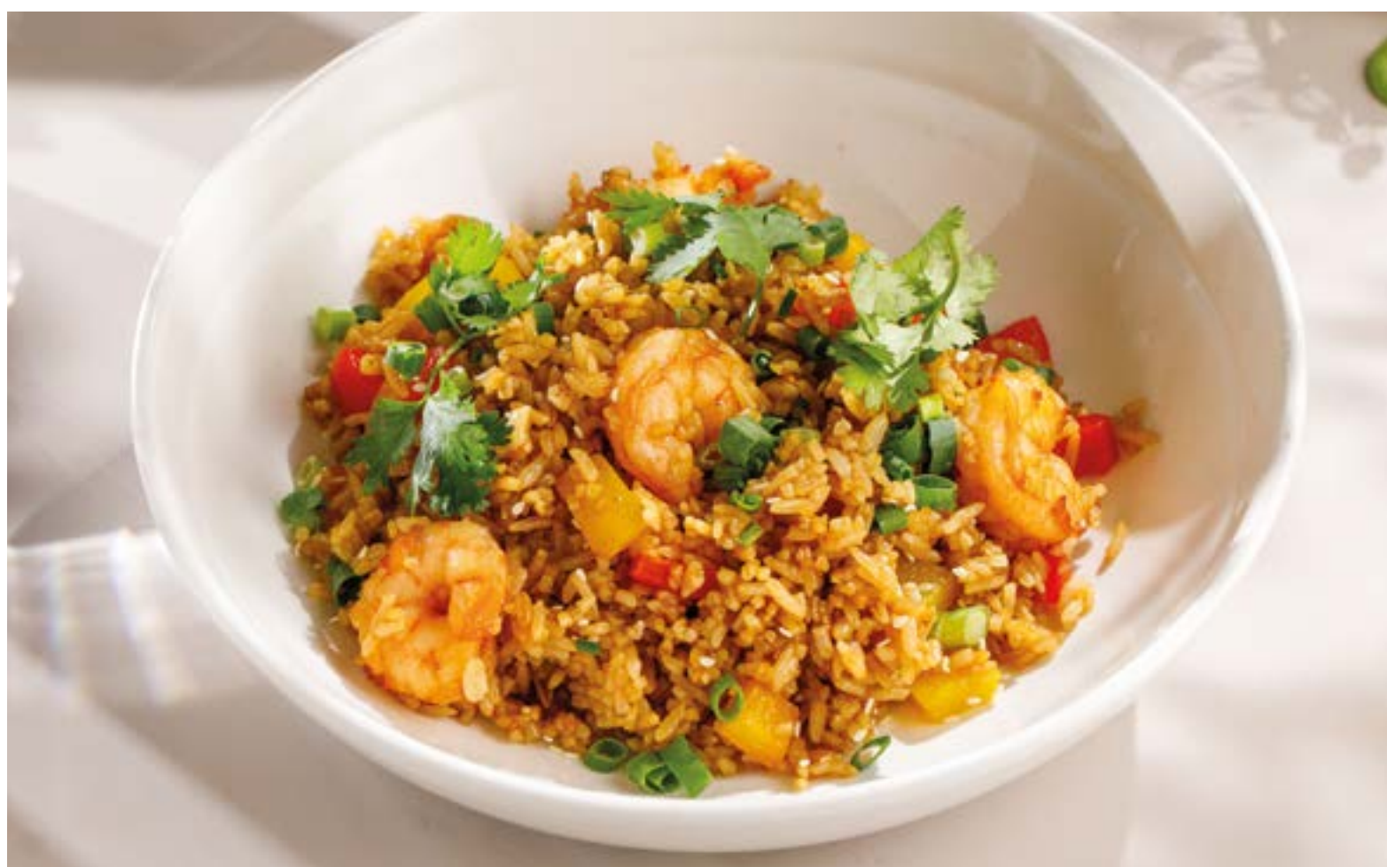
ЖАРЕННЫЙ РИС С КРЕВЕТКАМИ / С ГОВЯДИНОЙ Fried rice with shrimps / beef