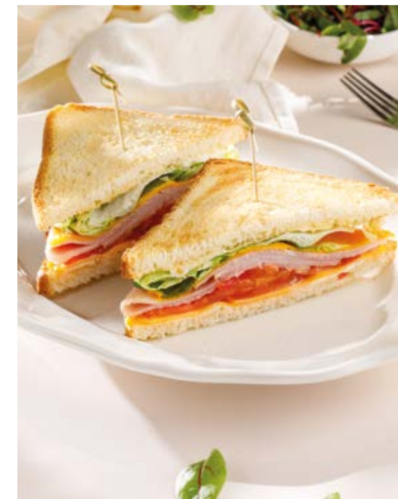
СЕНДВИЧ С ВЕТЧИНОЙ И СЫРОМ 590 Ham & cheese sandwich