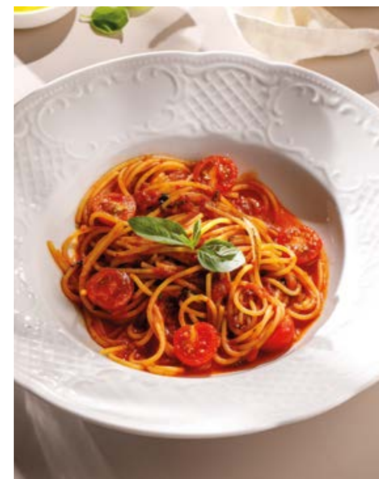
СПАГЕТТИ ПОМИДОРНИ Spaghetti pomodorini