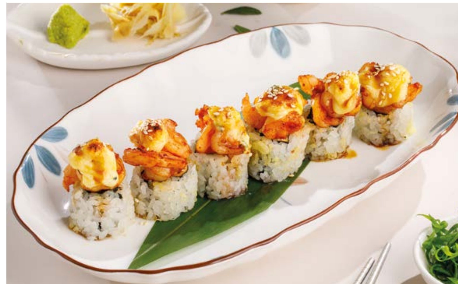
РОЛЛ С КРЕВЕТКОЙ, ГОРГОНЗОЛОЙ И ТРЮФЕЛЬНЫМ УНАГИ Shrimp roll with gorgonzola and truffle unagi