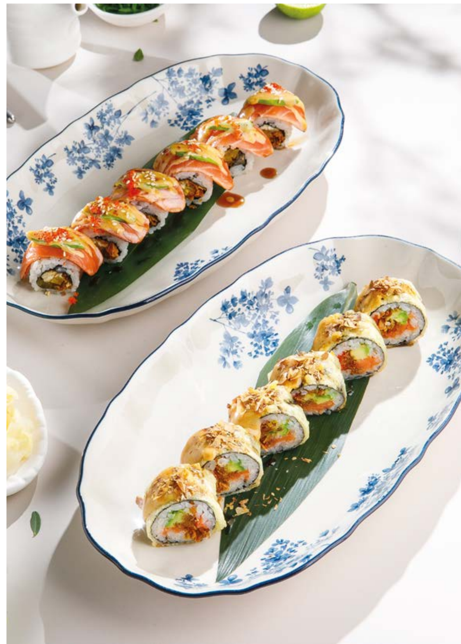
РОЛЛ С ОПАЛЕННЫМ ЛОСОСЕМ И ТРЮФЕЛЬНЫМ СОУСОМ Burnt salmon roll with truffle sauce