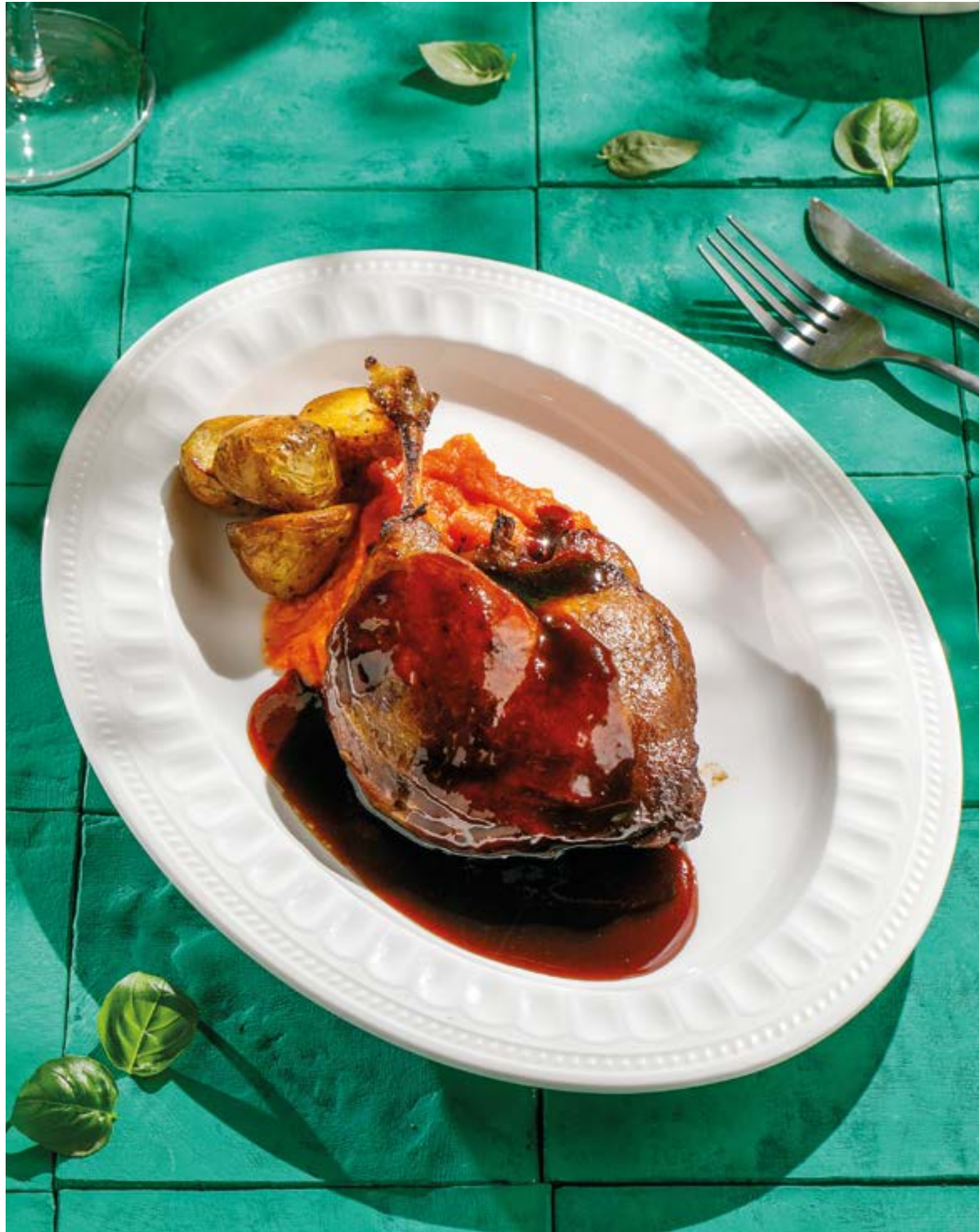
УТИНАЯ НОЖКА КОНФИ С КРЕМОМ ИЗ БАТАТА И ПЕЧЕНЫМ КАРТОФЕЛЕМ

Confit duck leg with sweet potato cream and baked potatoes