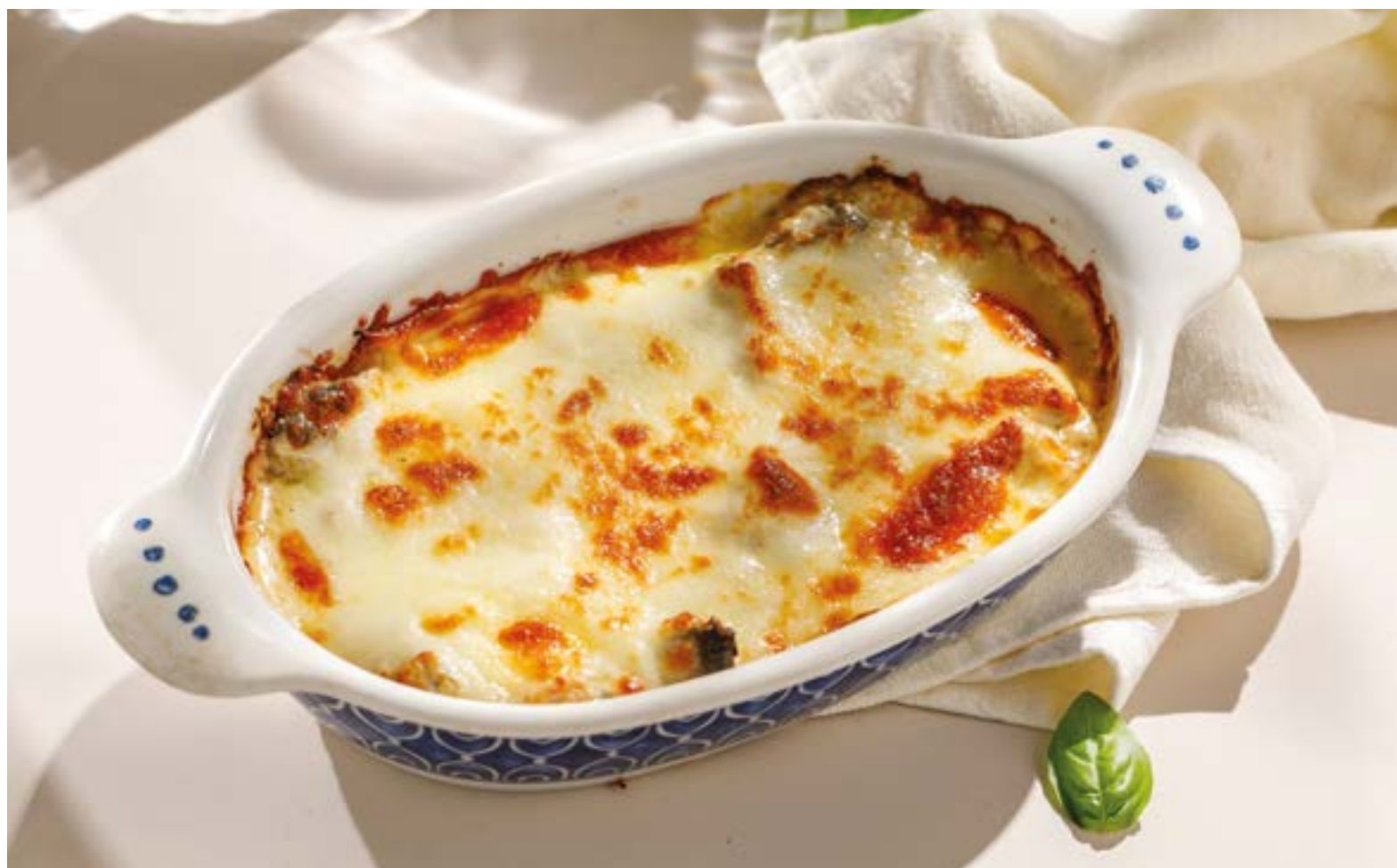
ЖЮЛЬЕН С КУРИЦЕЙ Chicken julienne