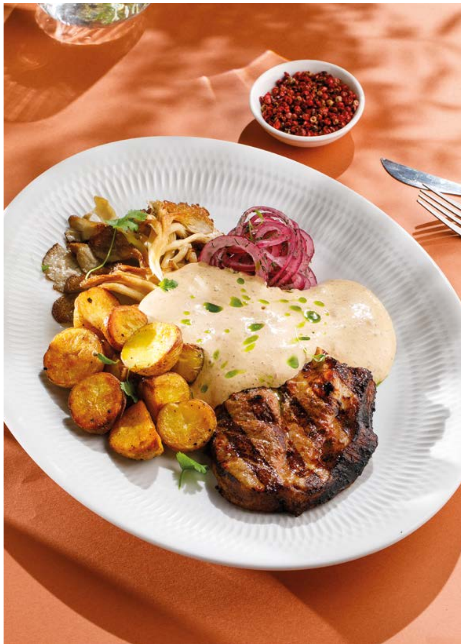
СТЕЙК ИЗ СВИНОЙ ШЕИ С КАРТОФЕЛЕМ И МУССОМ ИЗ БЕЛЫХ ГРИБОВ Pork neck steak with potatoes and porcini mushroom mousse