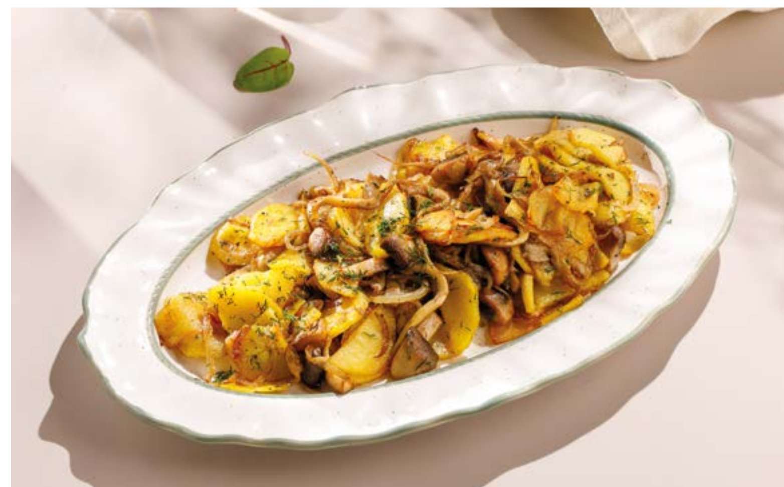
ЖАРЕННЫЙ КАРТОФЕЛЬ С ГРИБАМИ Fried potatoes with mushrooms