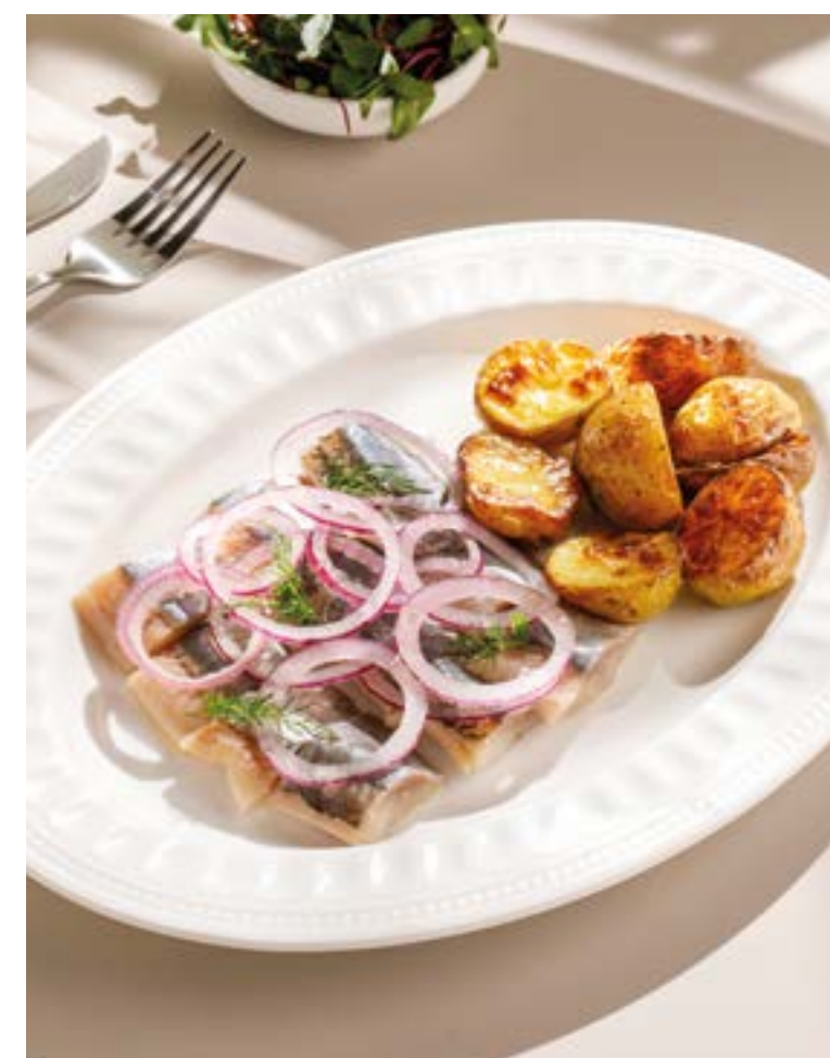
ОЛЮТОРСКАЯ СЕЛЬДЬ С ПЕЧЕНЫМ КАРТОФЕЛЕМ Olyutor herring with baked potatoes