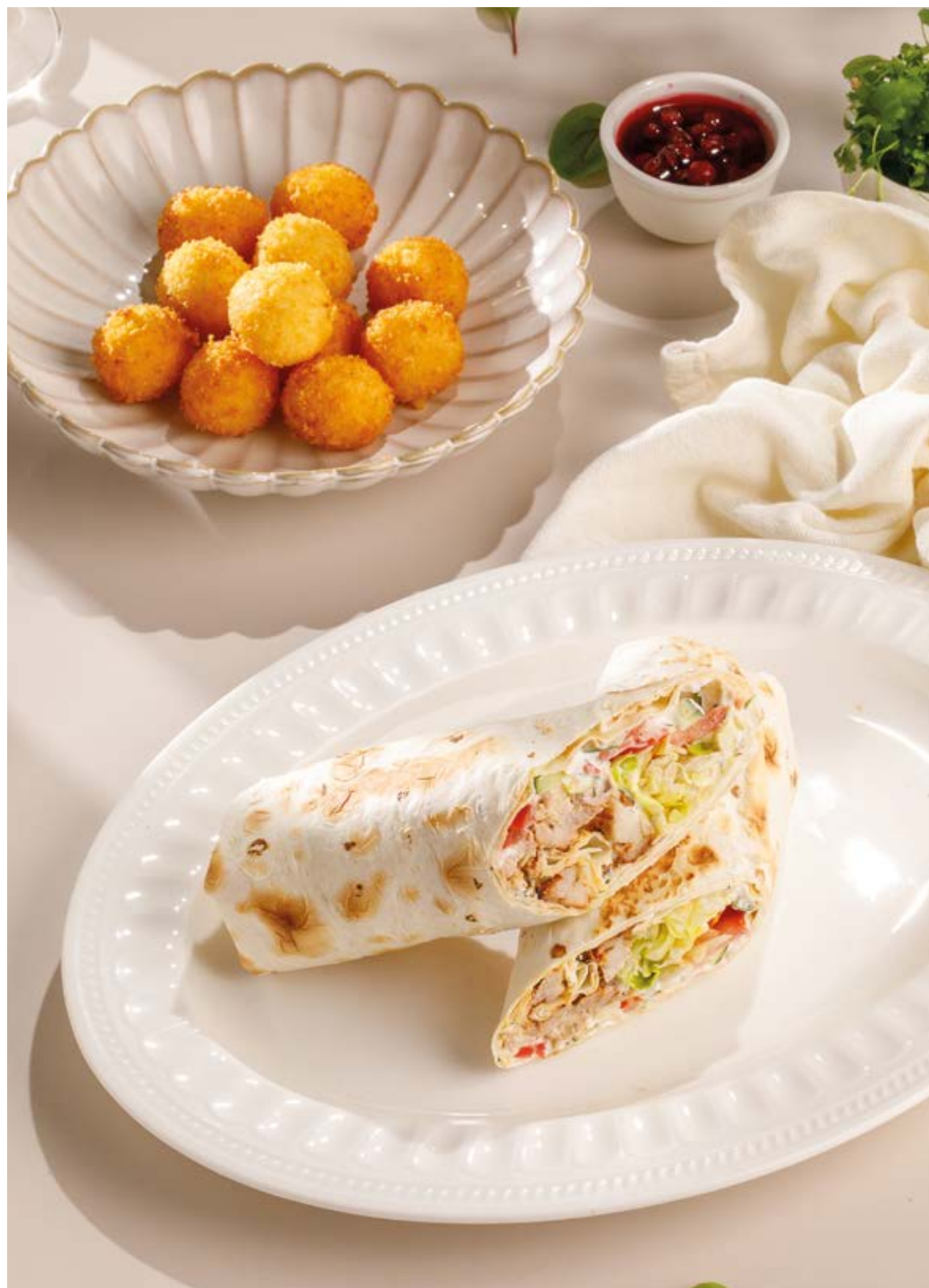
СЫРНЫЕ ШАРИКИ С КЛЮКВЕННЫМ СОУСОМ Cheese balls with cranberry sauce