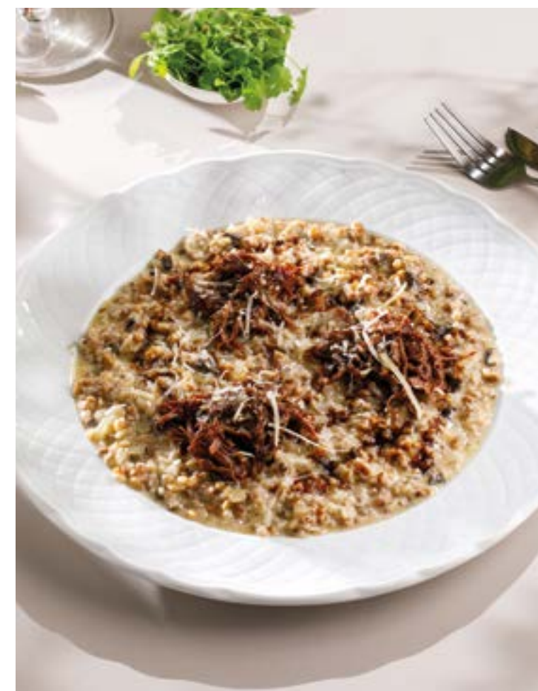
ГРЕЧЕТТО С ТОМЛЕННОЙ ГОВЯДИНОЙ