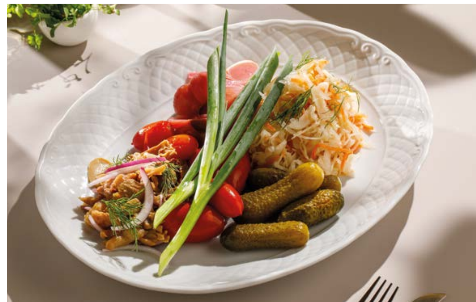
АССОРТИ ИЗ СОЛЕНИЙ Assorted pickles