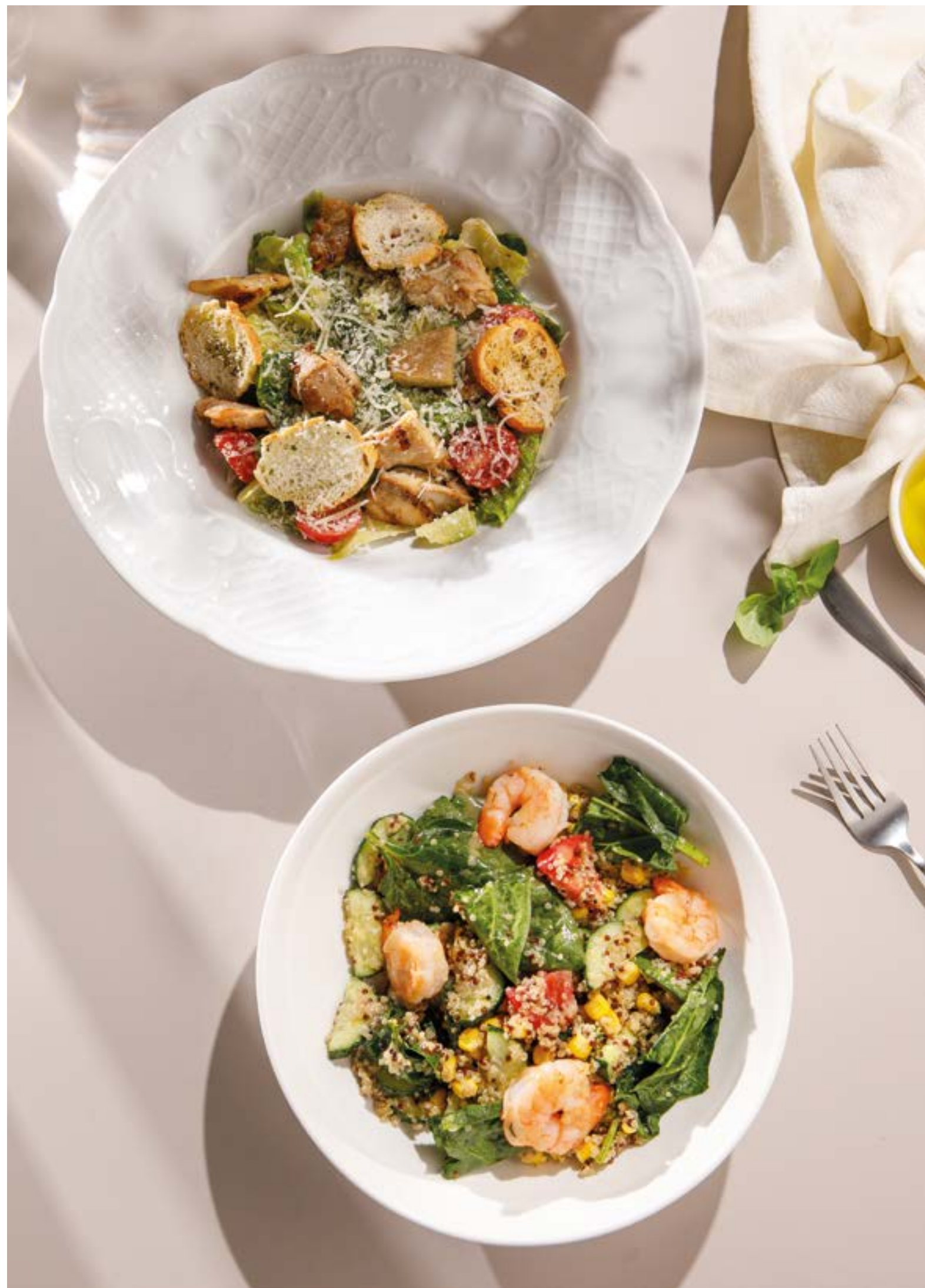
ЦЕЗАРЬ С ЦЫПЛЕНКОМ / С КРЕВЕТКАМИ Caesar salad with chicken / shrimp