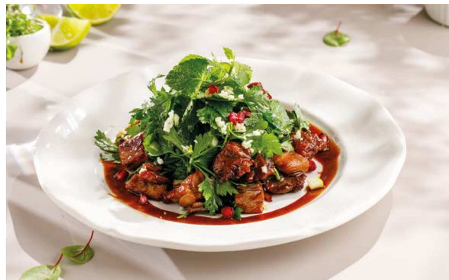
САЛАТ С ХРУСТЯЩЕЙ УТКОЙ, СОУСОМ ХОЙСИН И РАЗНОТРАВЬЕМ Crispy duck salad with hoisin sauce and mixed herbs