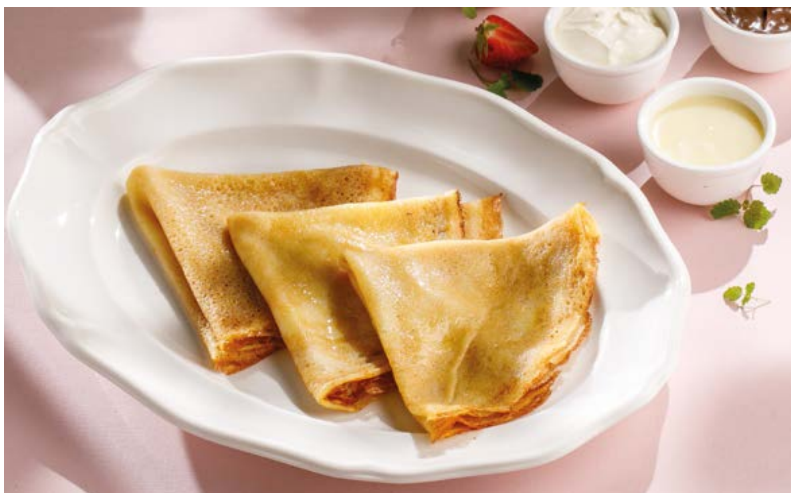
БЛИНЫ СО СМЕТАНОЙ / С КЛУБНИЧНЫМ ВАРЕНЬЕМ / СО СГУЩЕНКОЙ / С НУТЕЛЛОЙ Pancakes with sour cream / strawberry jam / condensed milk / Nutella