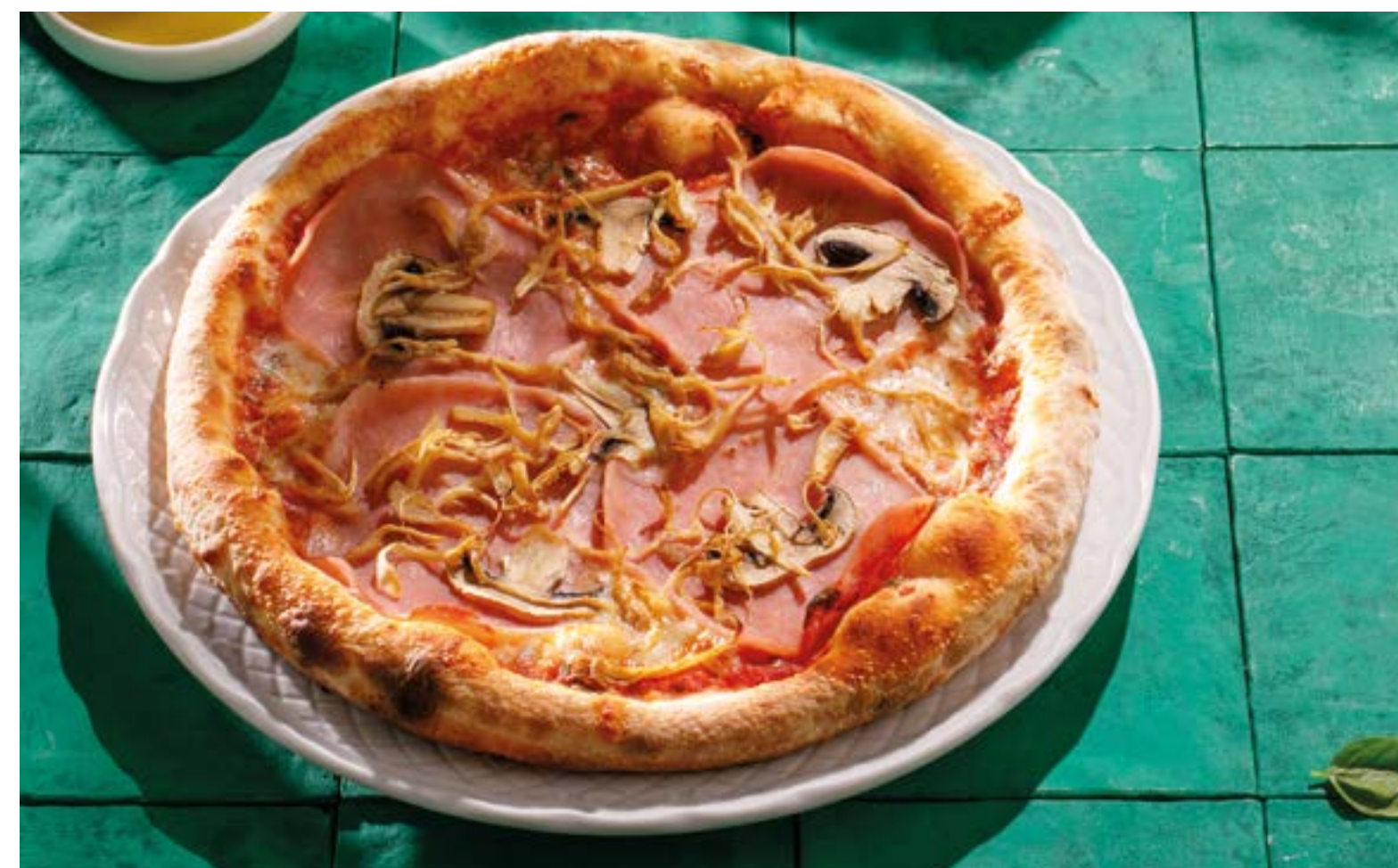
С ВЕТЧИНОЙ И ГРИБАМИ With ham and mushrooms