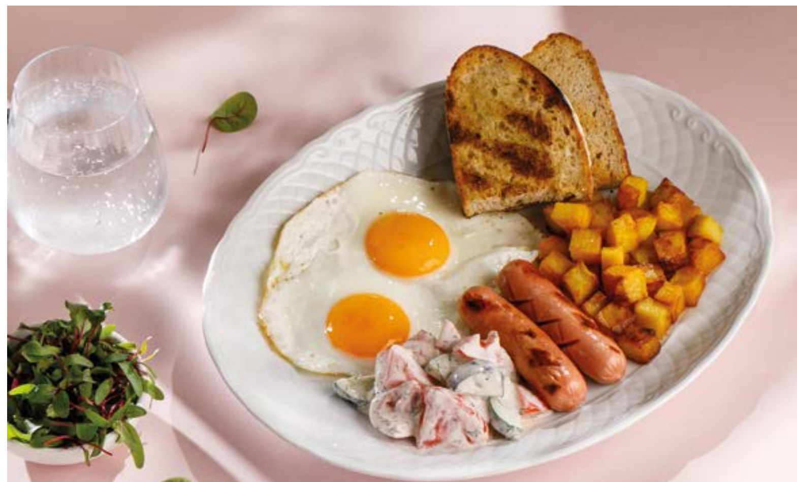
РУССКИЙ ЗАВТРАК 690 Russian breakfast

Ежедневно до 14:00 Breakfast Daily / until 14:00