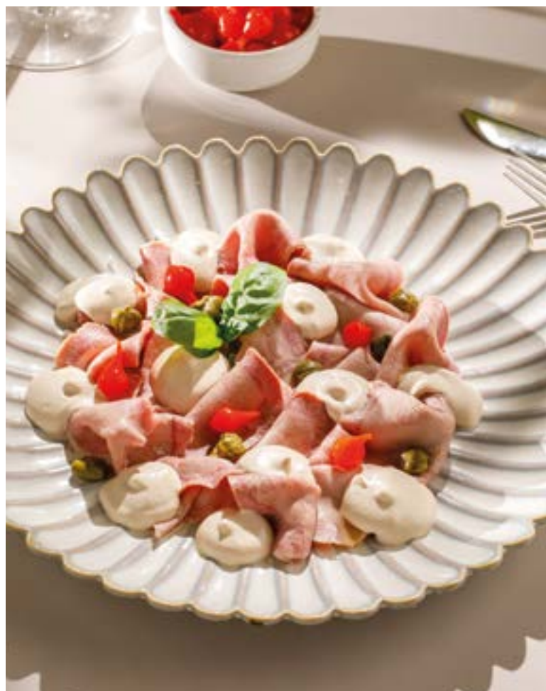
ВИТЕЛЛО ТОННАТО Vitello tonnato