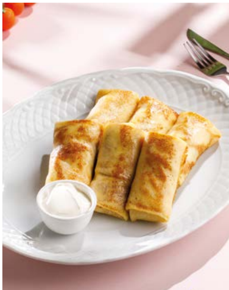
БЛИНЫ С ТВОРОГОМ / С МЯСОМ / С ВЕТЧИНОЙ И СЫРОМ 350 / 450 / 450 Pancakes with cottage cheese / meat / ham and cheese