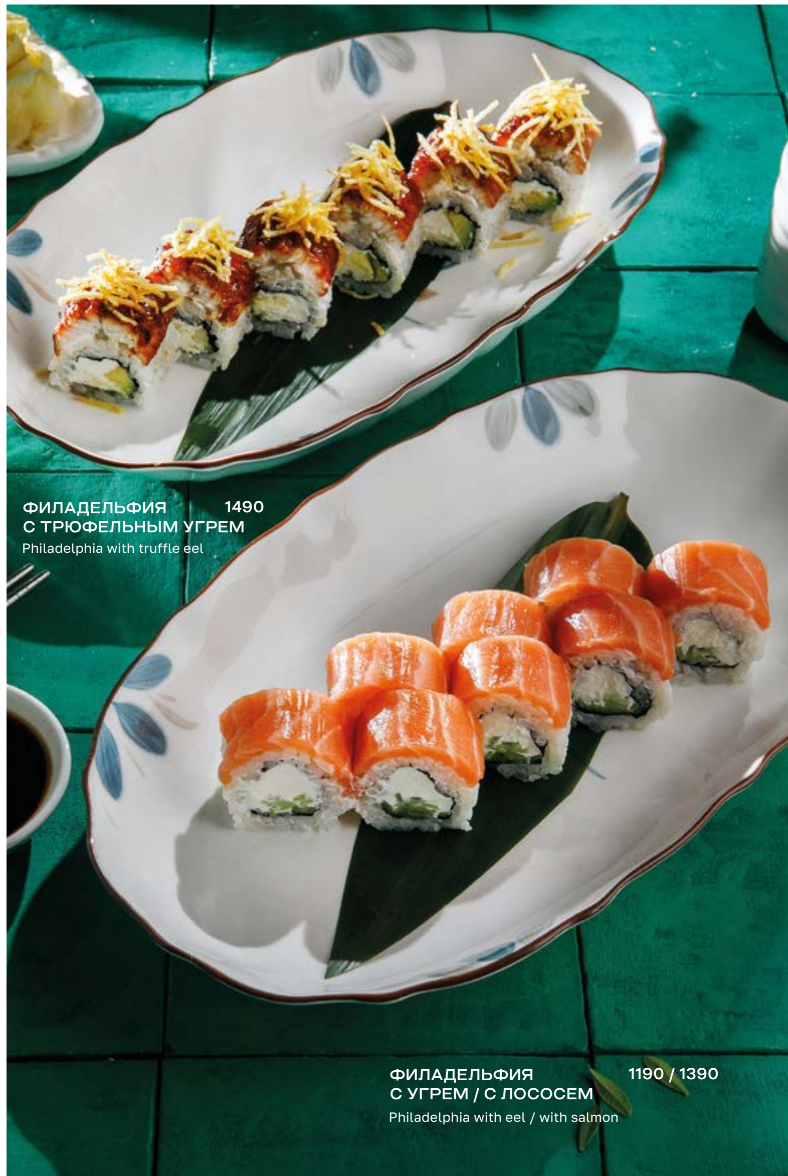
ФИЛАДЕЛЬФИЯ 1490 С ТРЮФЕЛЬНЫМ УГРЕМ Philadelphia with truffle eel