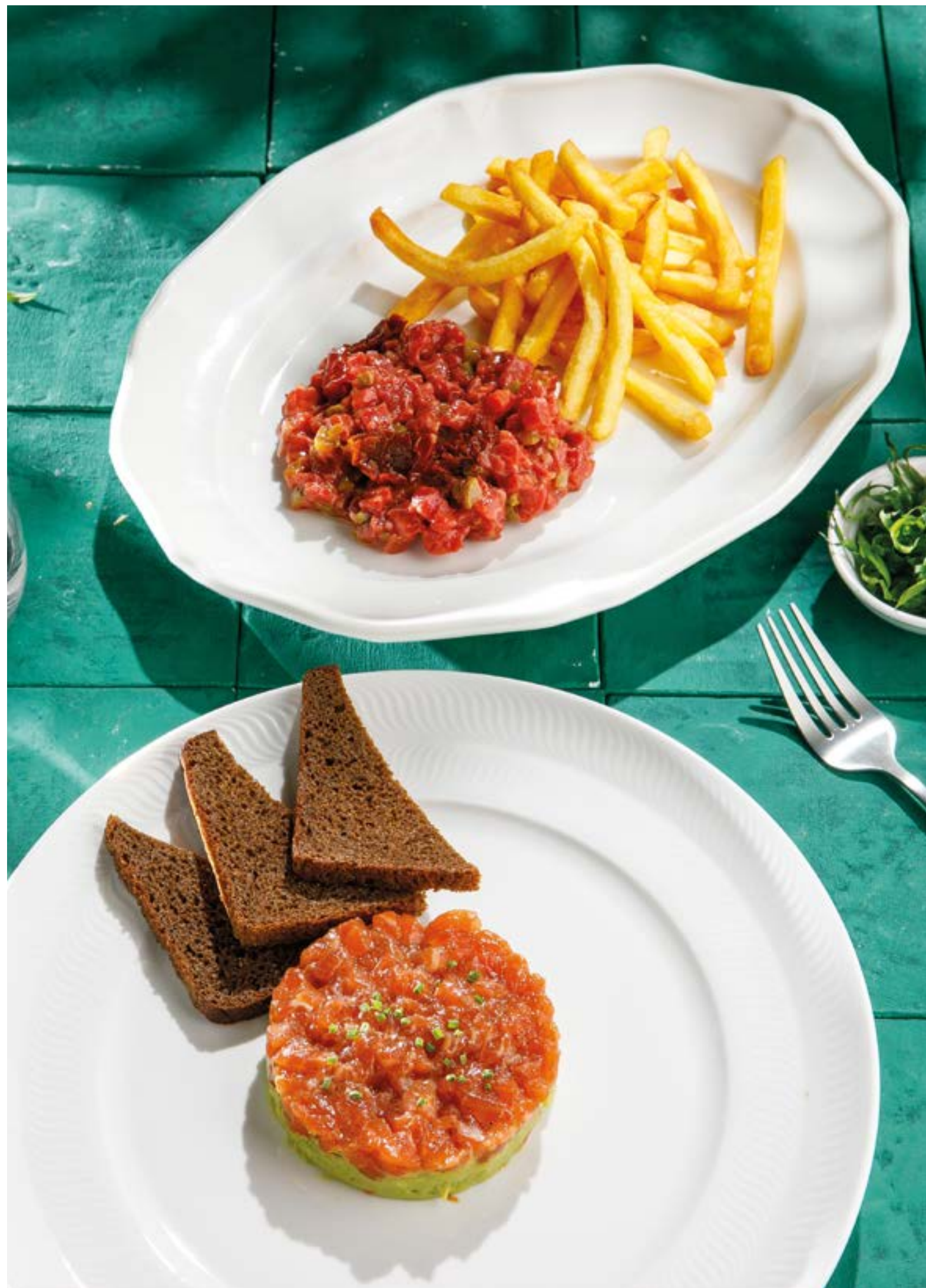
ТАРТАР ИЗ ГОВЯДИНЫ С ВЯЛЕНЫМИ ТОМАТАМИ Beef tartare with sun-dried tomatoes