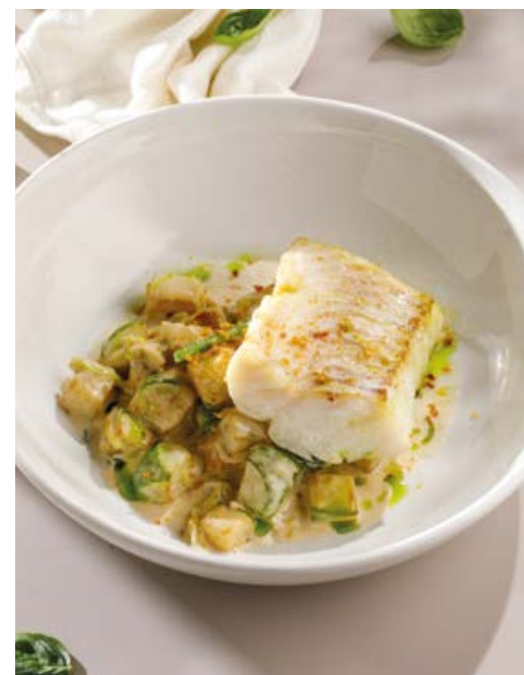
ТРЕСКА С КАБАЧКАМИ, ШПИНАТОМ И ПАРМЕЗАНОМ Cod with zucchini, spinach and parmesan