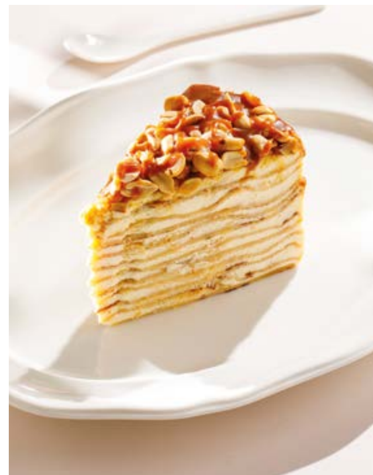
ТОРТ БЛИННЫЙ С ВАРЕНОЙ СГУЩЕНКОЙ Pancake cake with dulce de leche