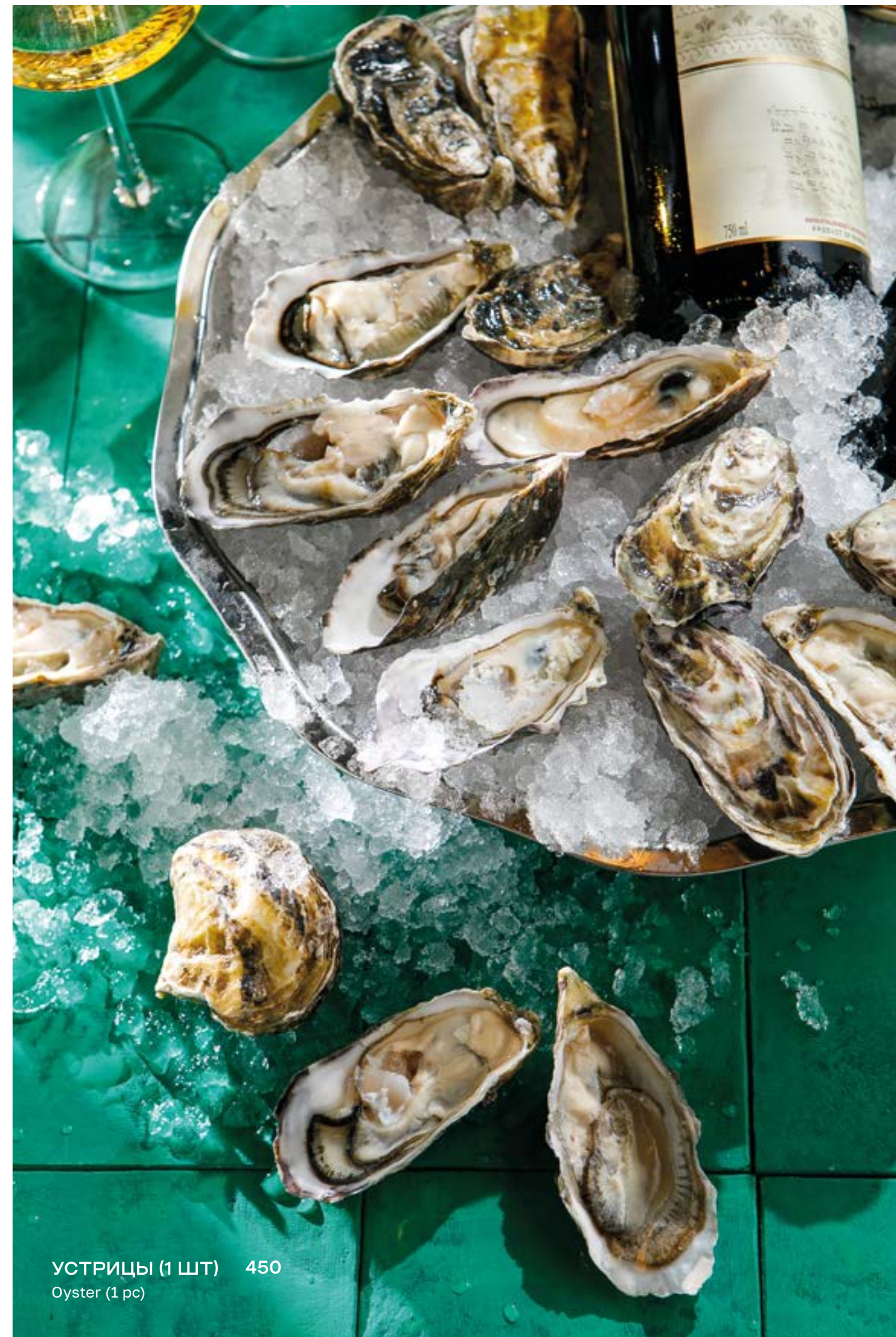
УСТРИЦЫ (1 ШТ) 450 Oyster (1 pc)