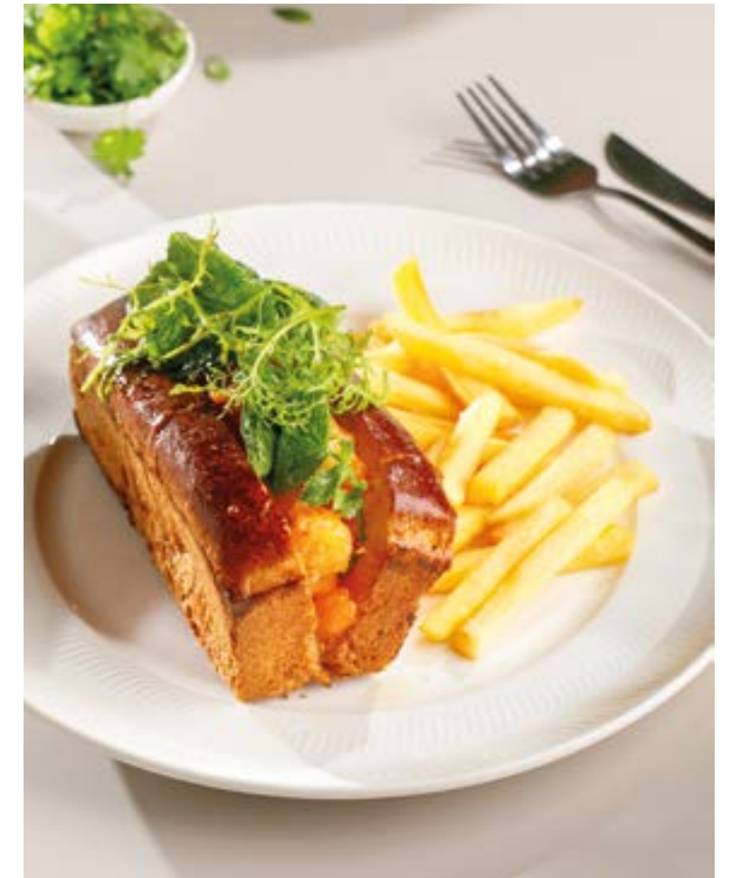
БРИОШЬ С КРЕВЕТКОЙ И ФРИ 890 Brioche with shrimp and and French fries