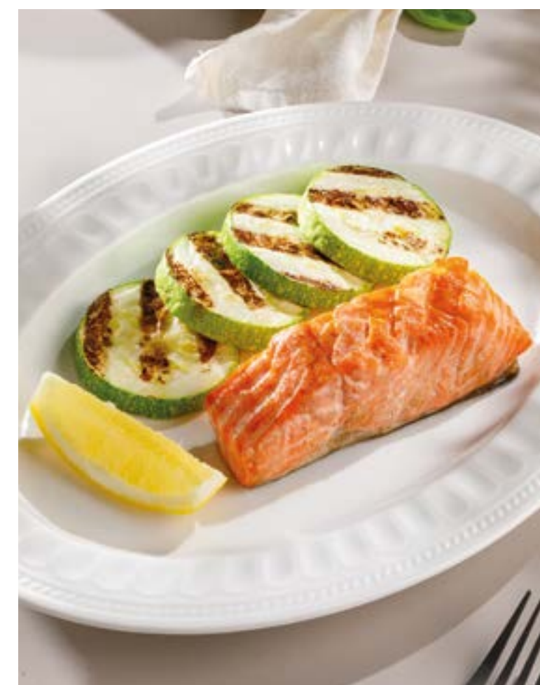
СТЕЙК ИЗ ФОРЕЛИ Trout steak