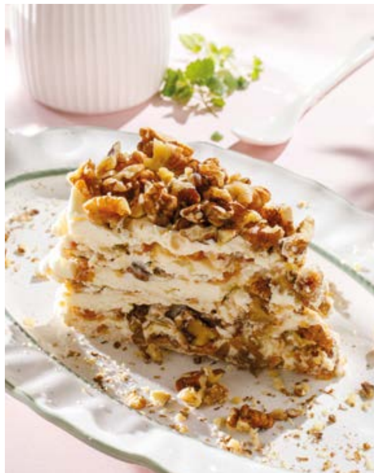
ТОРТ «ГРЕЦКИЙ ОРЕХ» Walnut cake