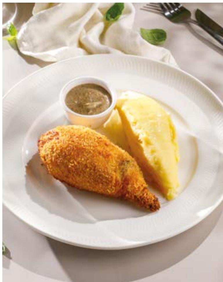
КОТЛЕТА ПО-КИЕВСКИ С КАРТОФЕЛЬНЫМ ПЮРЕ И ГРИБНЫМ СОУСОМ

Chicken Kyiv with mashed potatoes and mushroom sauce