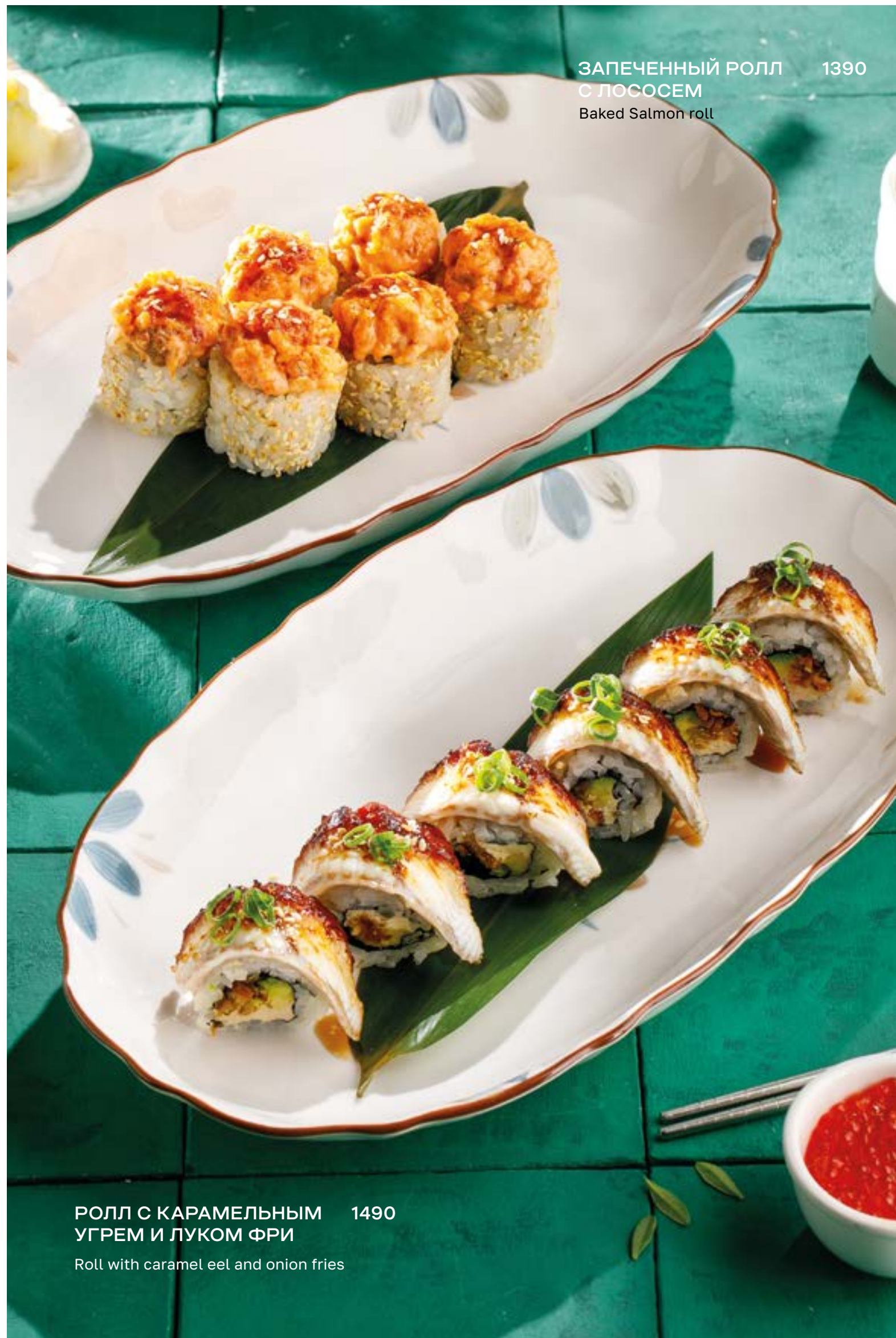
РОЛЛ С КАРАМЕЛЬНЫМ УГРЕМ И ЛУКОМ ФРИ Roll with caramel eel and onion fries 1490