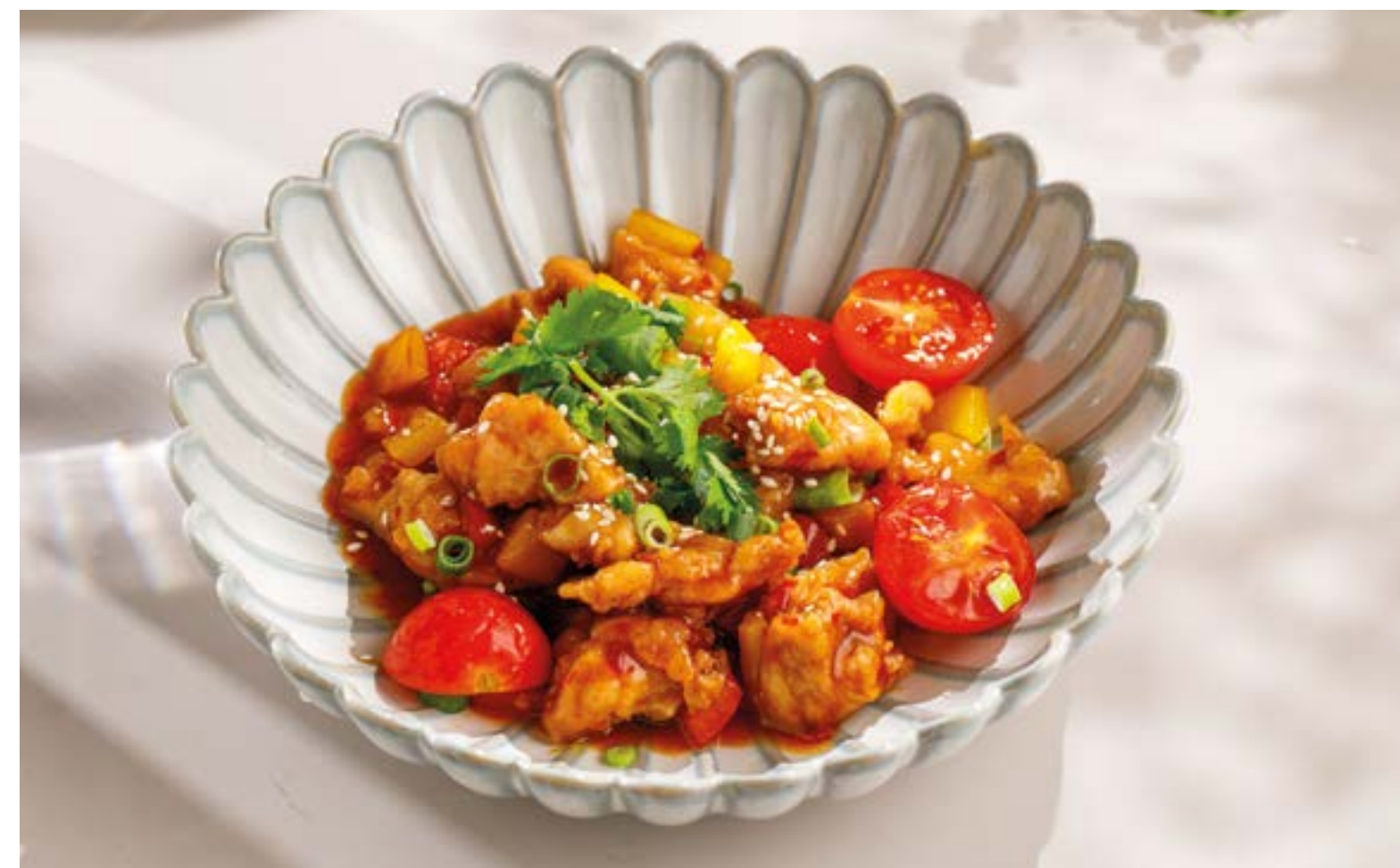
КУРИЦА С АНАНАСАМИ Chicken with pineapple