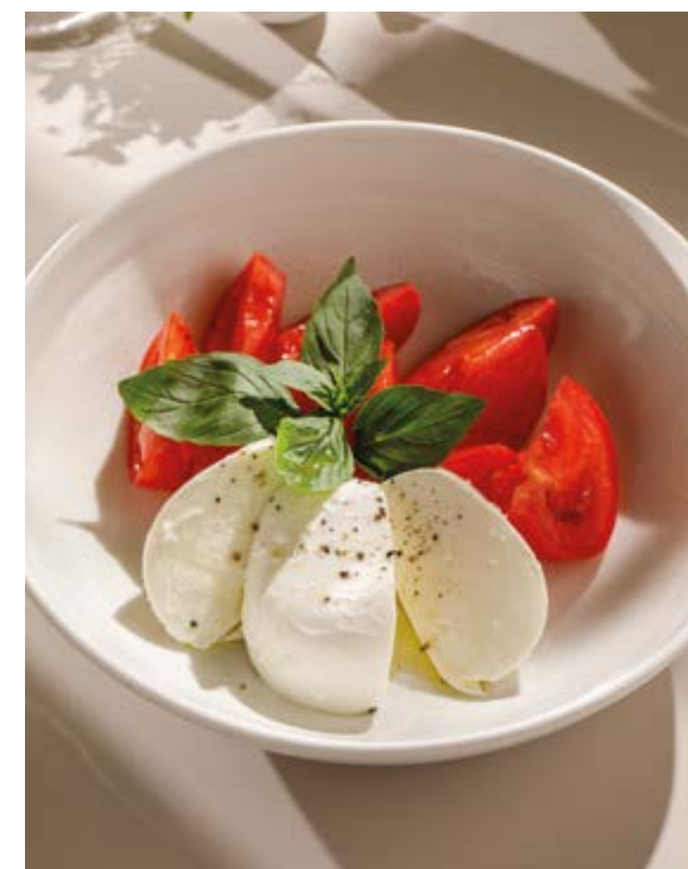
МОЦАРЕЛЛА СО СПЕЛЫМИ ТОМАТАМИ Mozzarella with ripe tomatoes