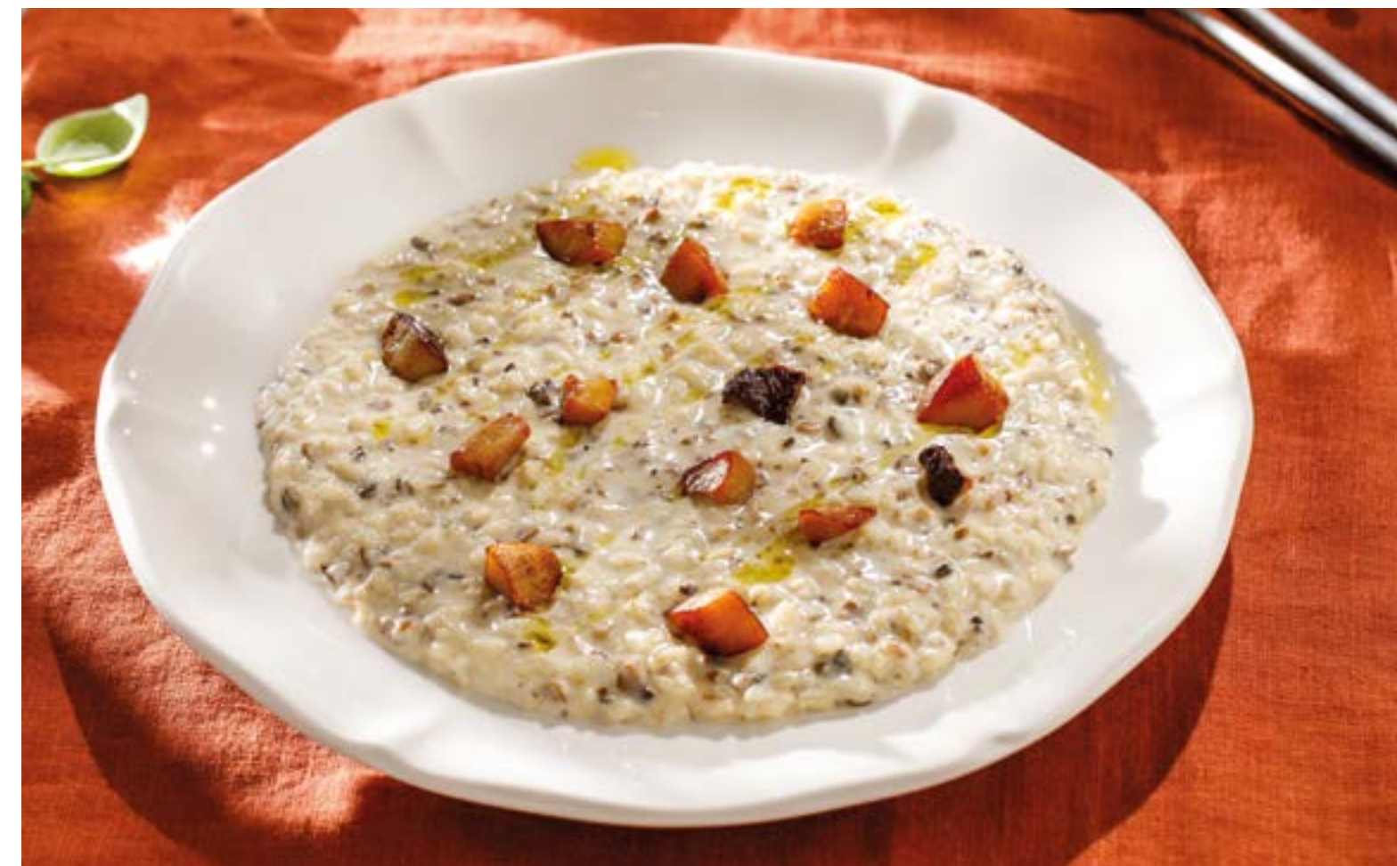
ГРИБНОЕ РИЗОТТО Porcini mushroom risotto