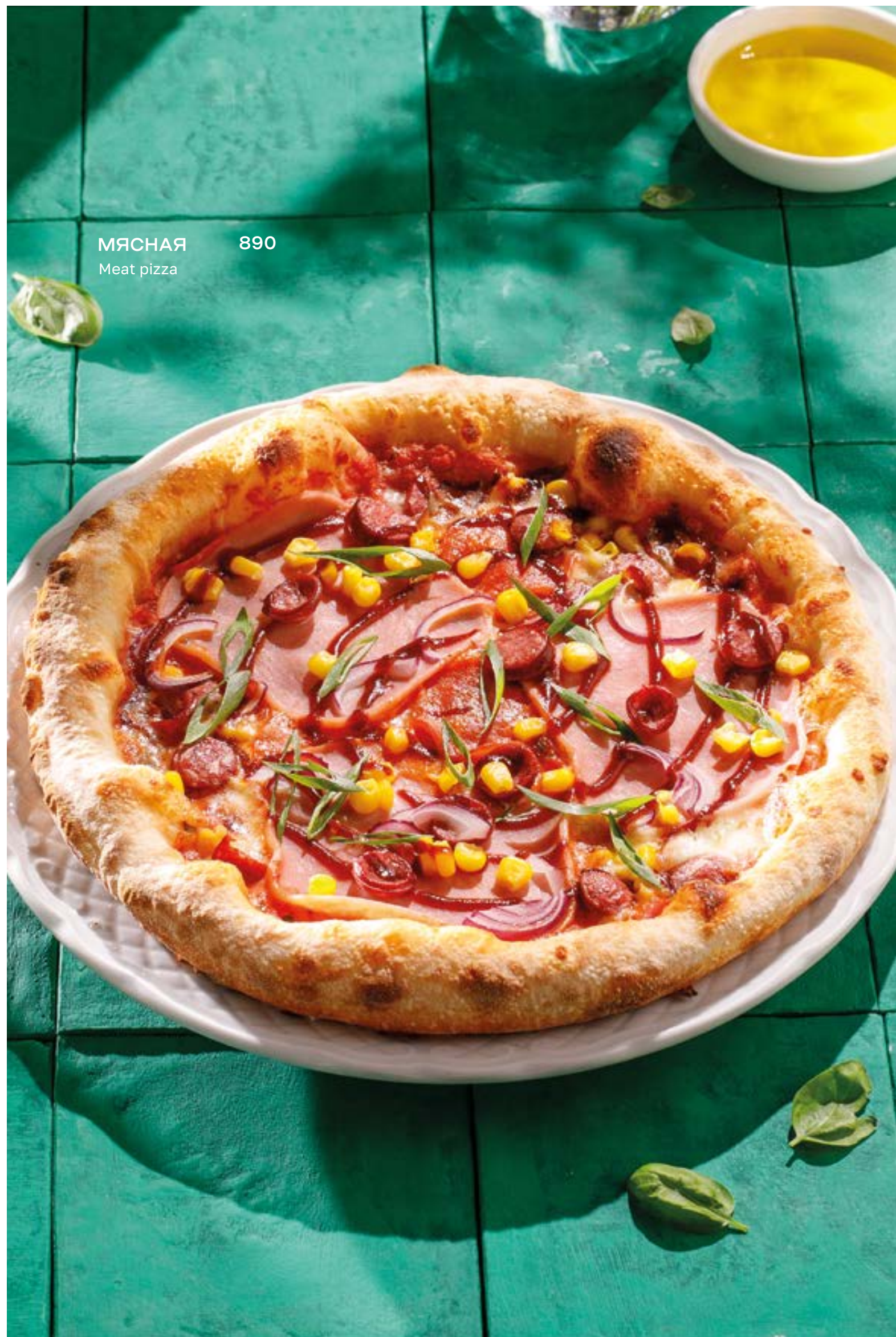
МЯСНАЯ 890 Meat pizza