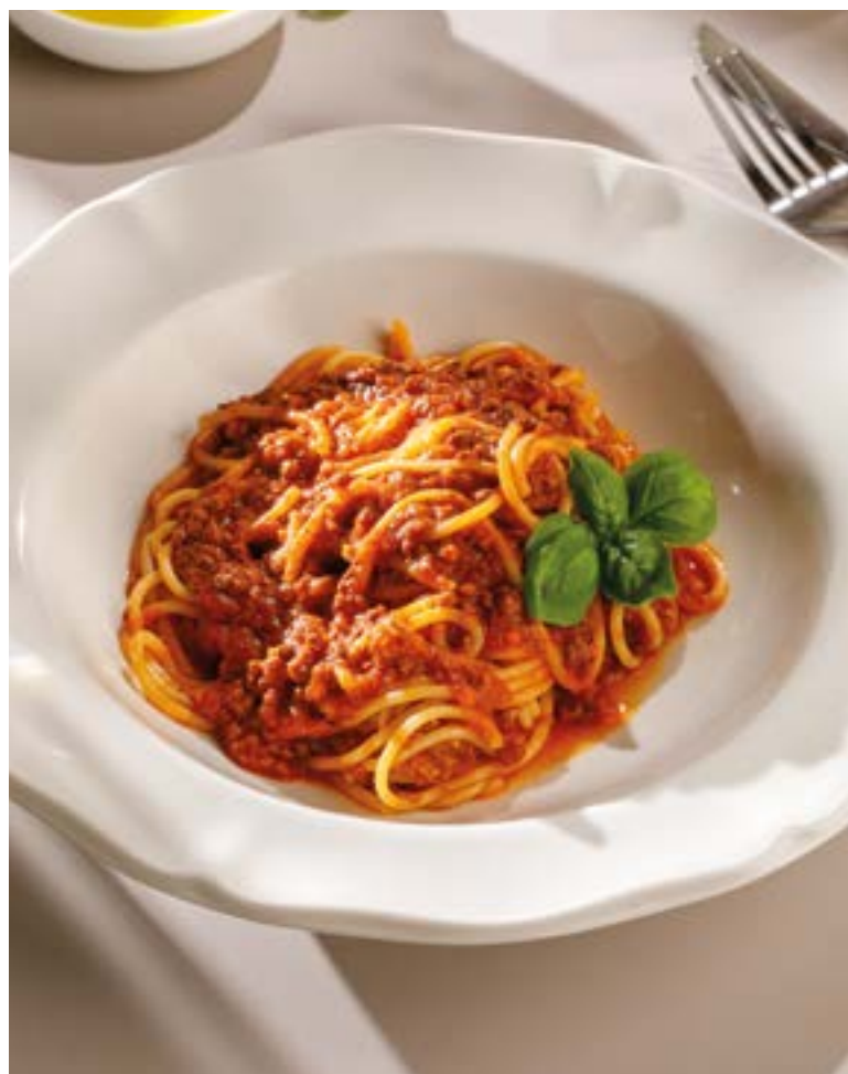
СПАГЕТТИ БОЛОНЬЕЗЕ Spaghetti Bolognese