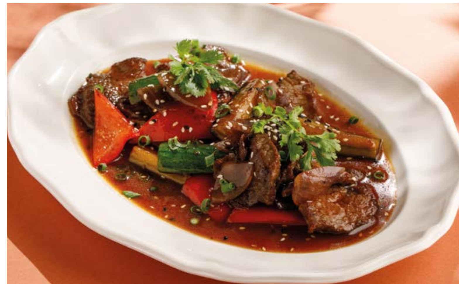
ГОВЯДИНА ПО-КАНТОНСКИ Cantonese-style beef