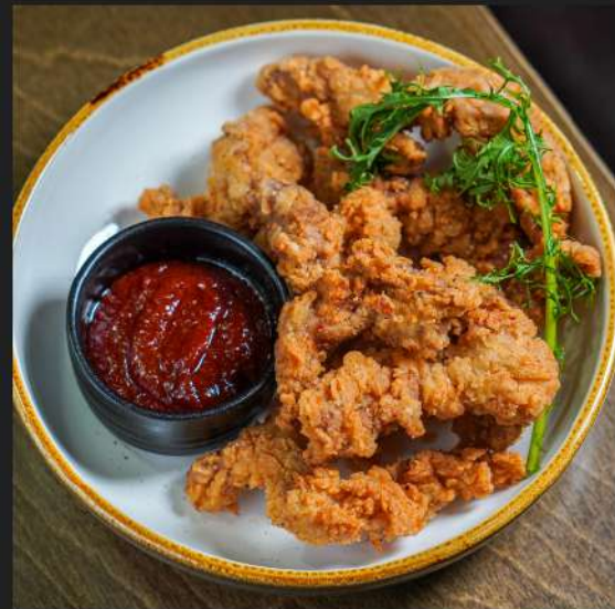
Свиная обрезь в панировке