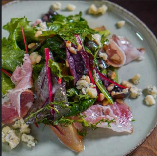
Салат, который не понравился Можаву

Печеная груша с миксом салата, сыром Бри и А'ля Парма