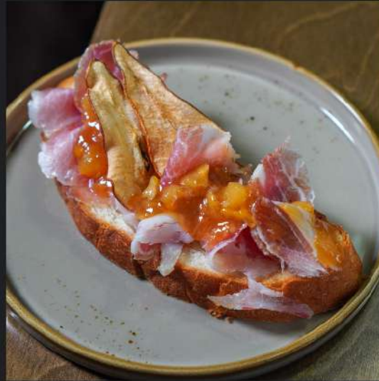
Бутик с кумпячком и грушевым чатни