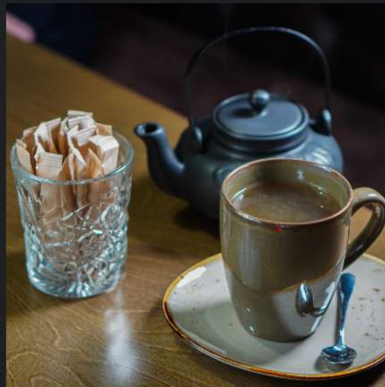
Черный чай с чабрецом и облепихой и Иван-чай ассорти

Черный чай с чабрецом и облепихой / Иван-чай с ревенем / Зеленый Иван-чай с клюквой и лимоном / Иван-чай с листом смородины / Чёрный Иван-чай / Зелёный