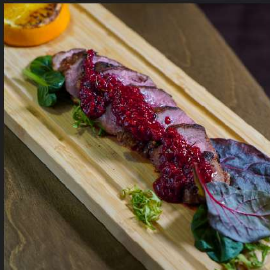
Утиная грудка на мангале

С малиновым вареньем и жареным апельсином