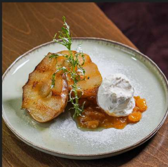
Жареная груша на мангале с мороженкой