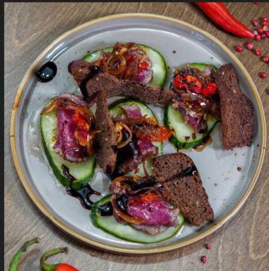
Ростбиф с вялеными томатами