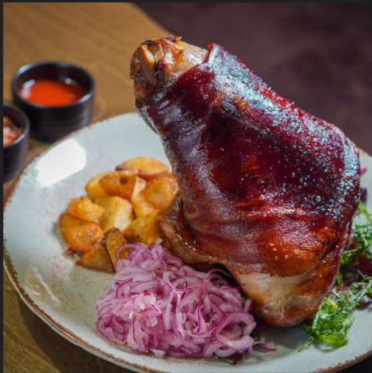
КОПЧЕНАЯ НОГА ВЕПРЯ