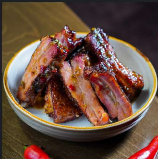
Рёбра гриль в соусе свит-чили