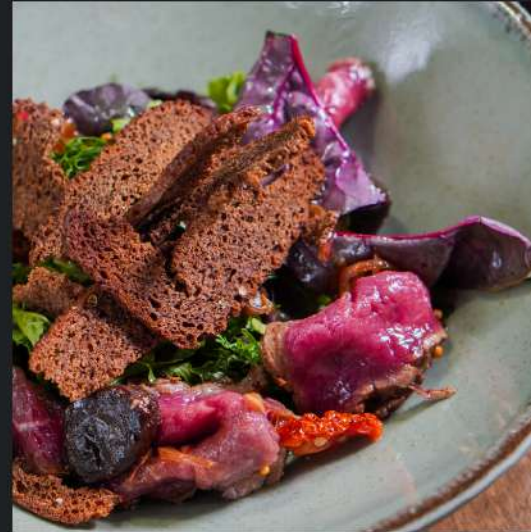
Салат с ростбифом и ферментированным чесноком

Микс салата, вяленые томаты, бородинские гренки, соевая заправка