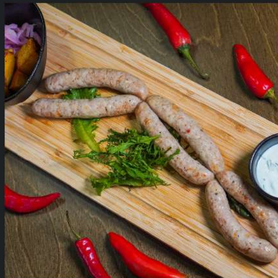
Колбаса Куриная Дерзкая