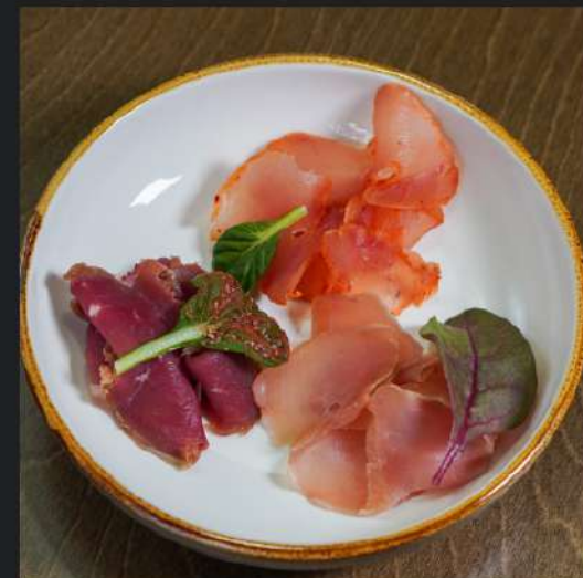
Сыровял собственного производства