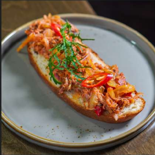
Бутик с острой рваной свининой