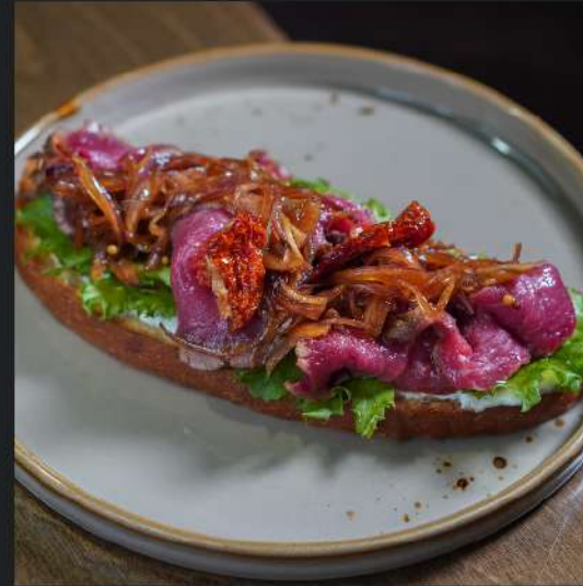
Бутик с ростбифом