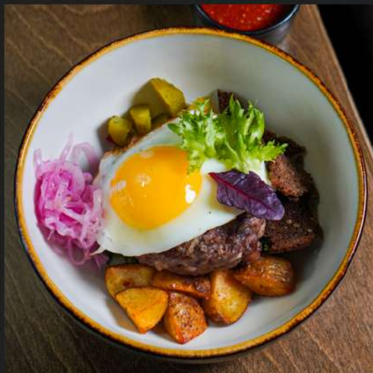
Бифштекс А'ля Русс