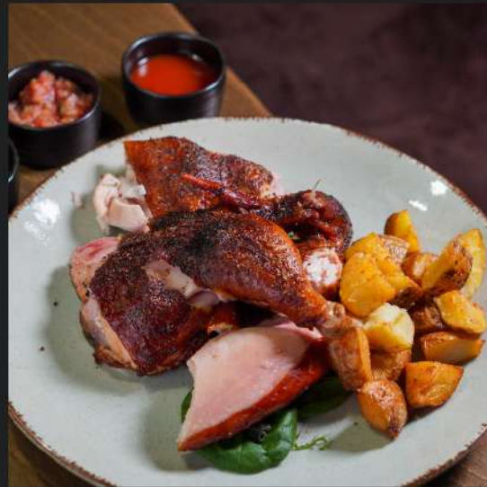
Рванный цыпленок BBQ