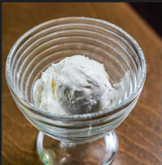
Домашнее мороженое ШАРИК