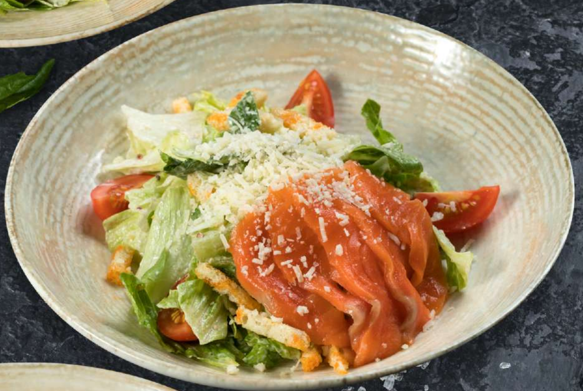
Цезарь с малосоленой форелью 200 г 675.-