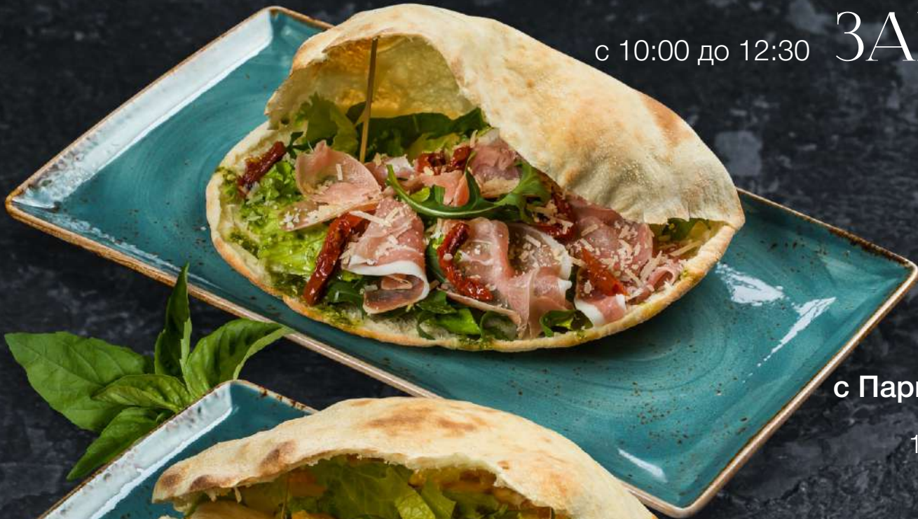
Панини с Пармской ветчиной