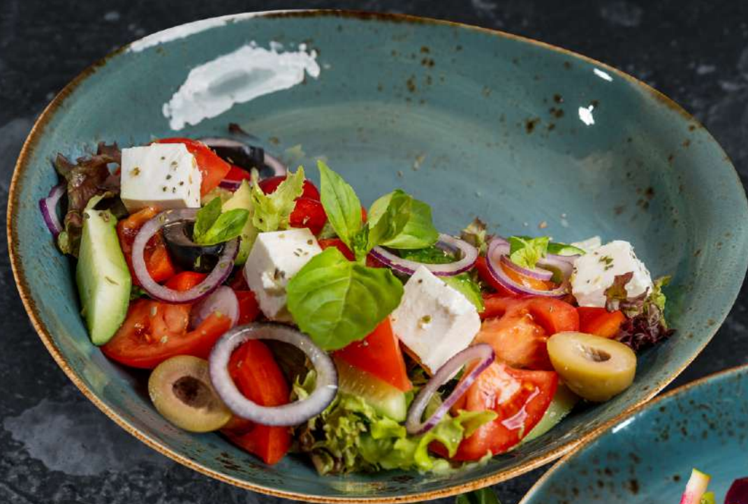
Греческий 300 г 495.-