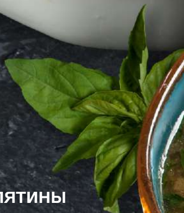
Из телятины с фасолью и каштанами