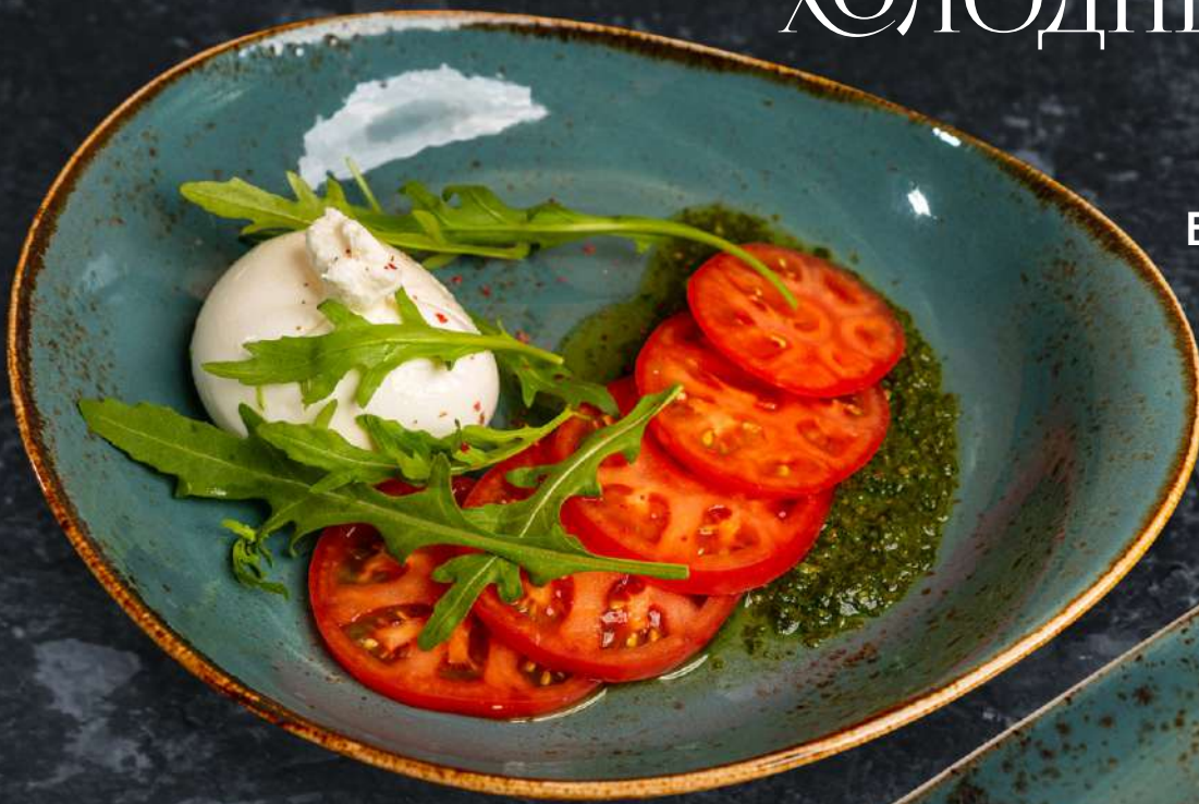
Буррата с томатами и рукколой