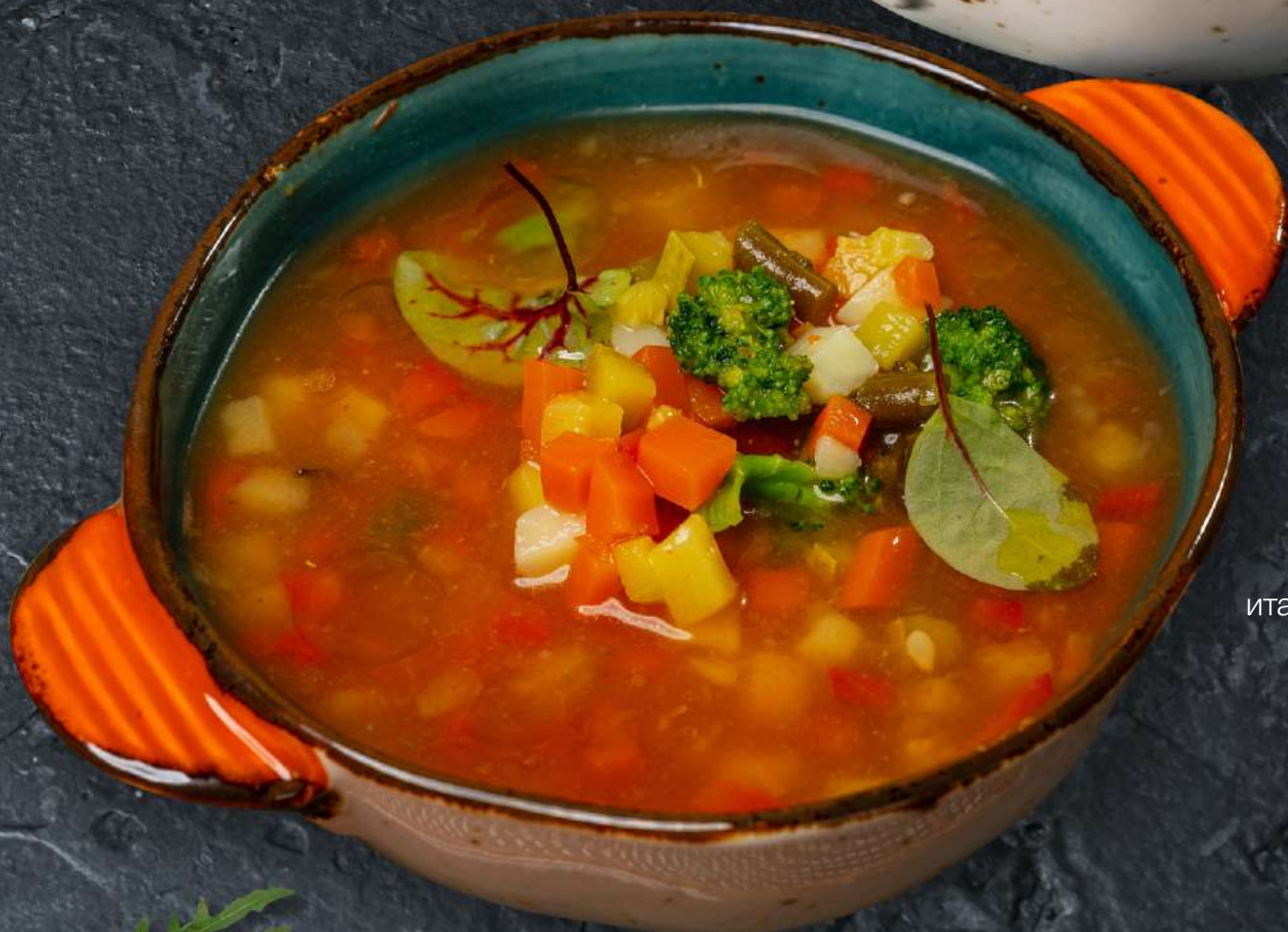
Минестроне итальянский овощной суп