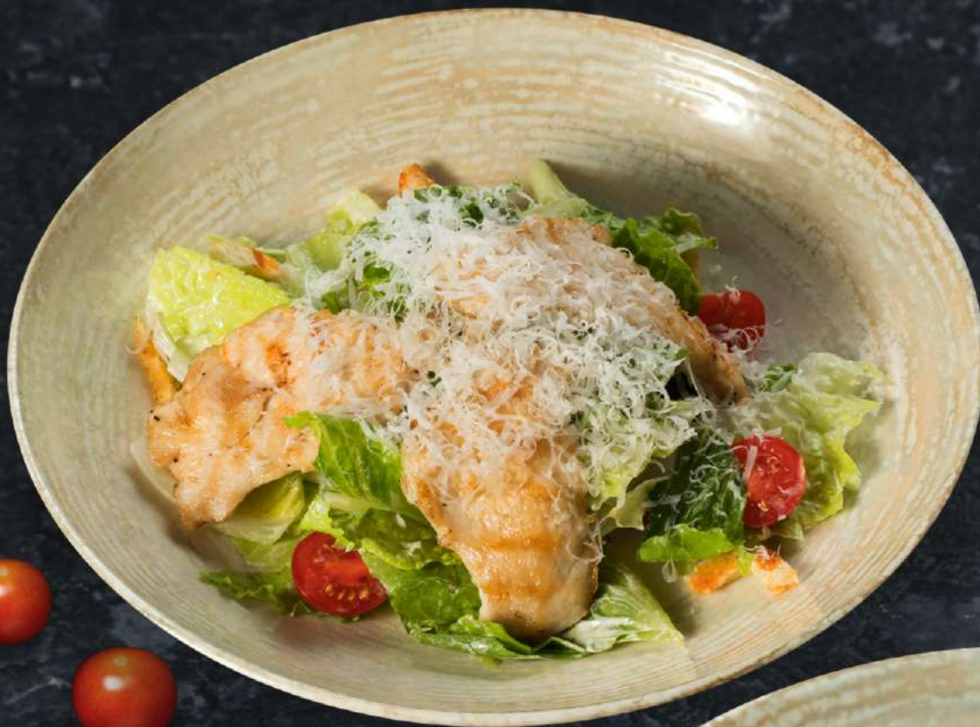
Цезарь с курицей 200 г 495.-