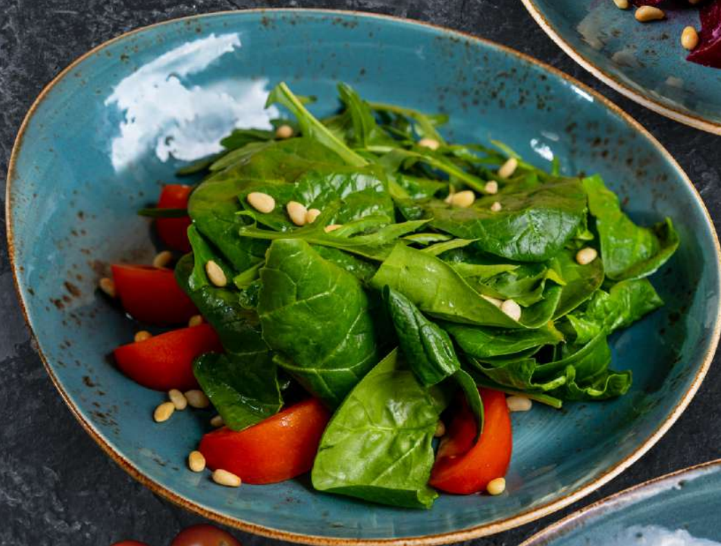
Форли молодые листья шпината, рукколы и свежие томаты в сочетании с кедровыми орешками и бальзамическим соусом 190 г 395.-