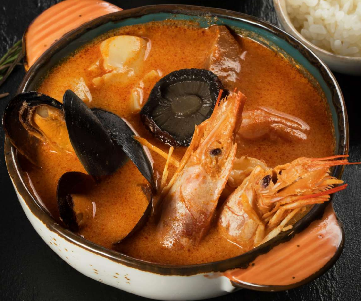
Том-Ям 400 г 695.-