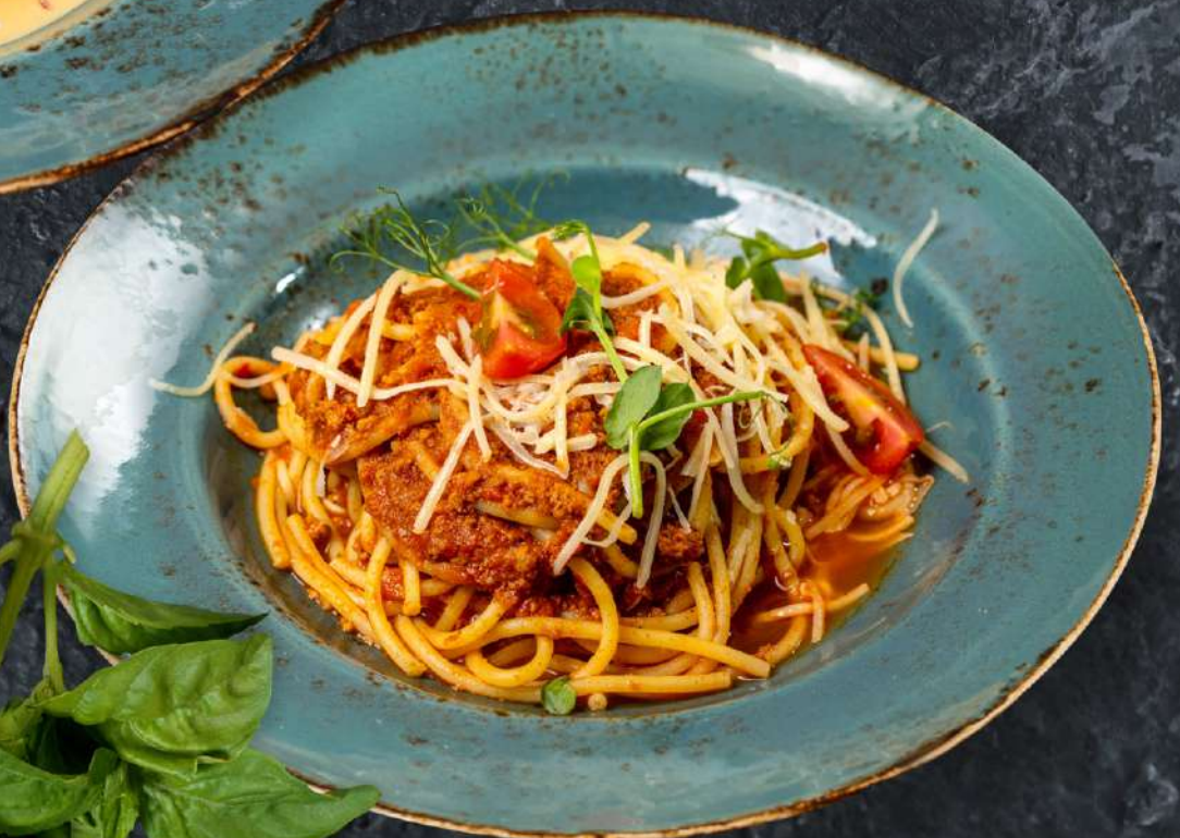
Болоньезе спагетти с мясным соусом Болоньезе