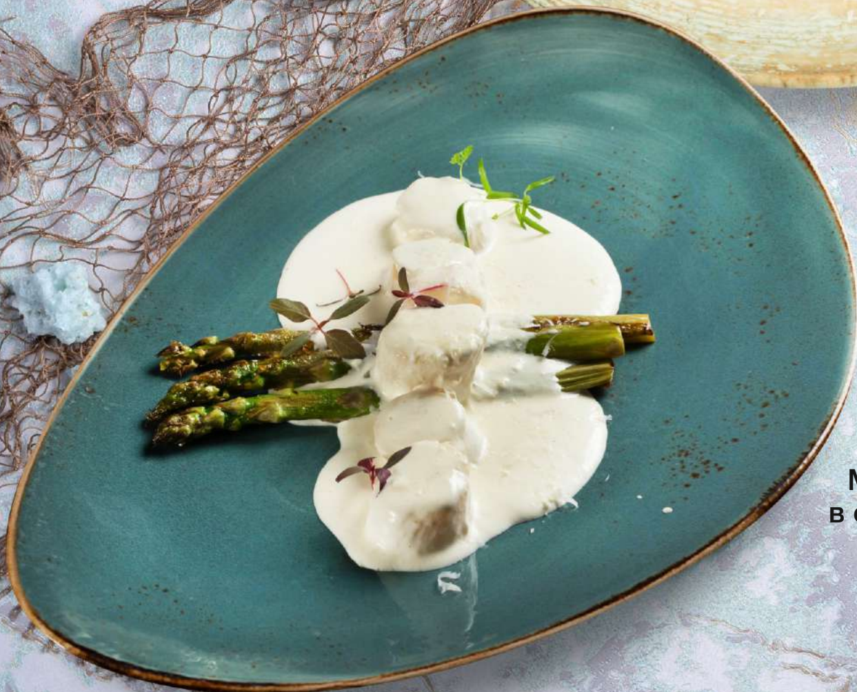
Морские гребешки в сливочном соусе со спаржей на гриле