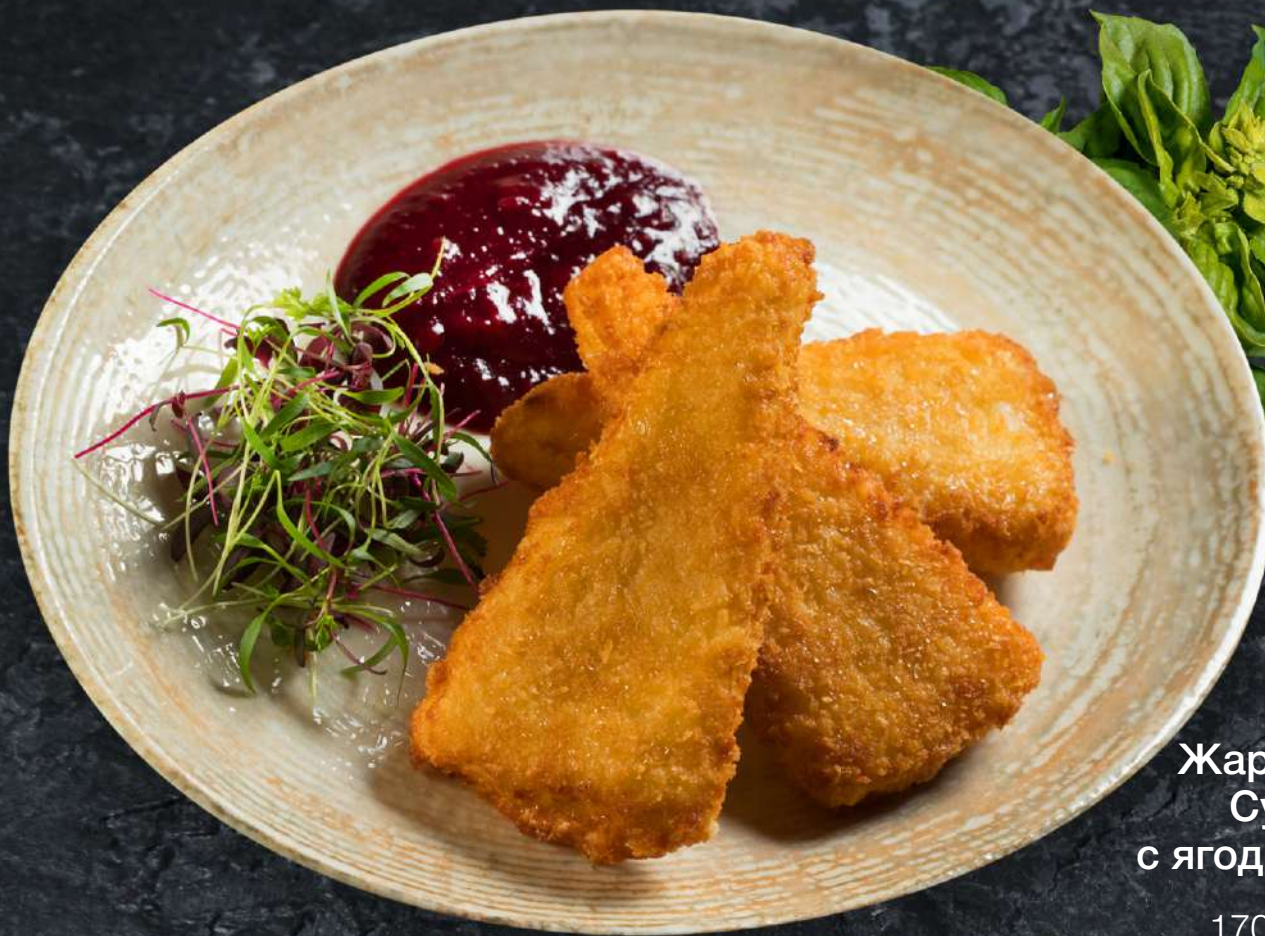
Жареный сыр Сулгуни с ягодным соусом