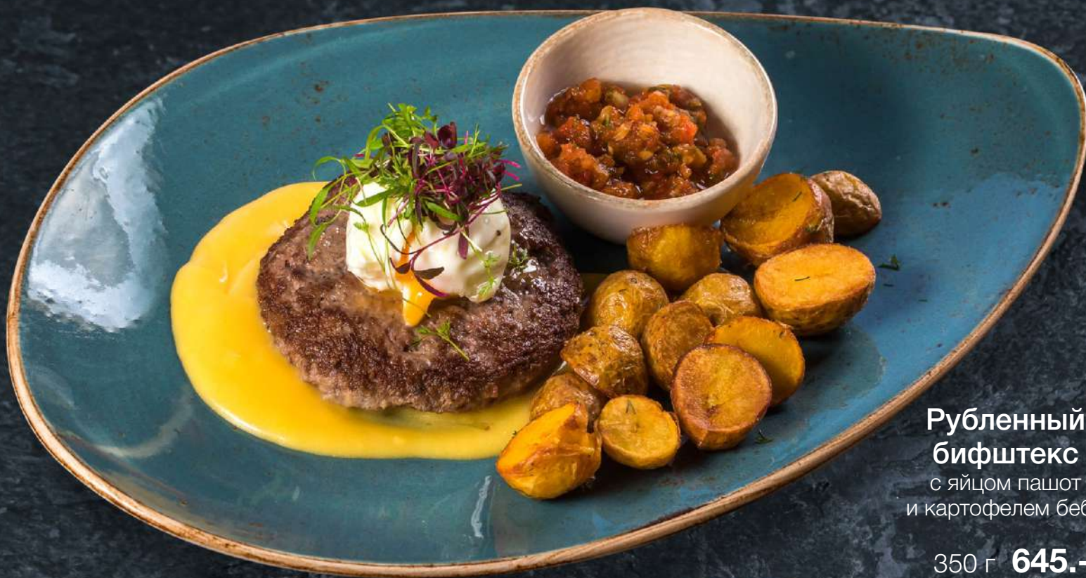
Рубленный бифштекс с яйцом пашот и картофелем беби