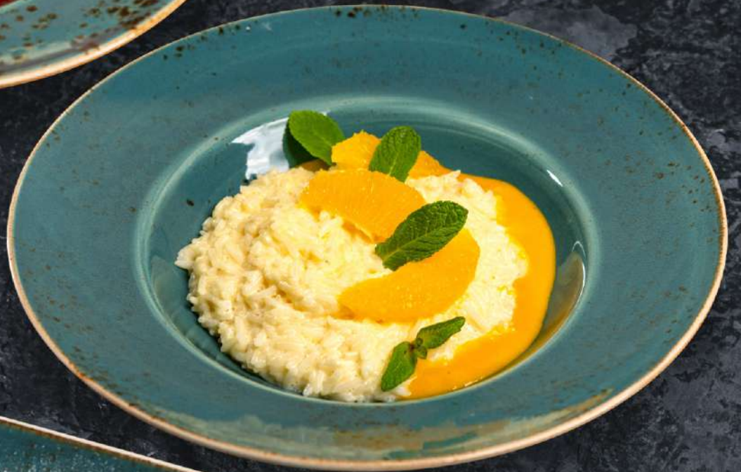
Рисовая каша на сливках с манго и сегментами апельсина