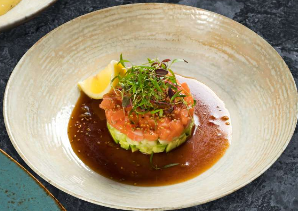
Тартар из форели с авокадо и соусом Юдзу