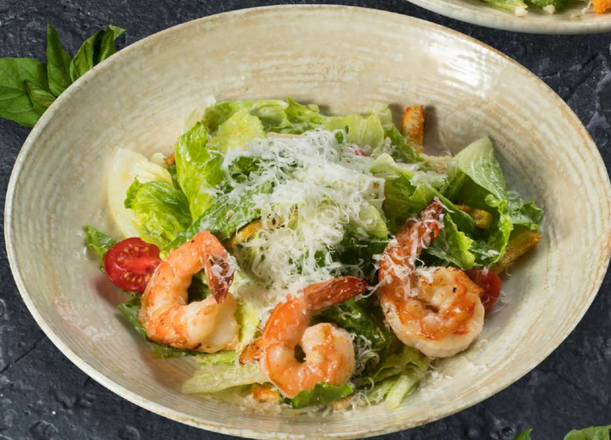
Цезарь с тигровыми креветками 200 г 625.-