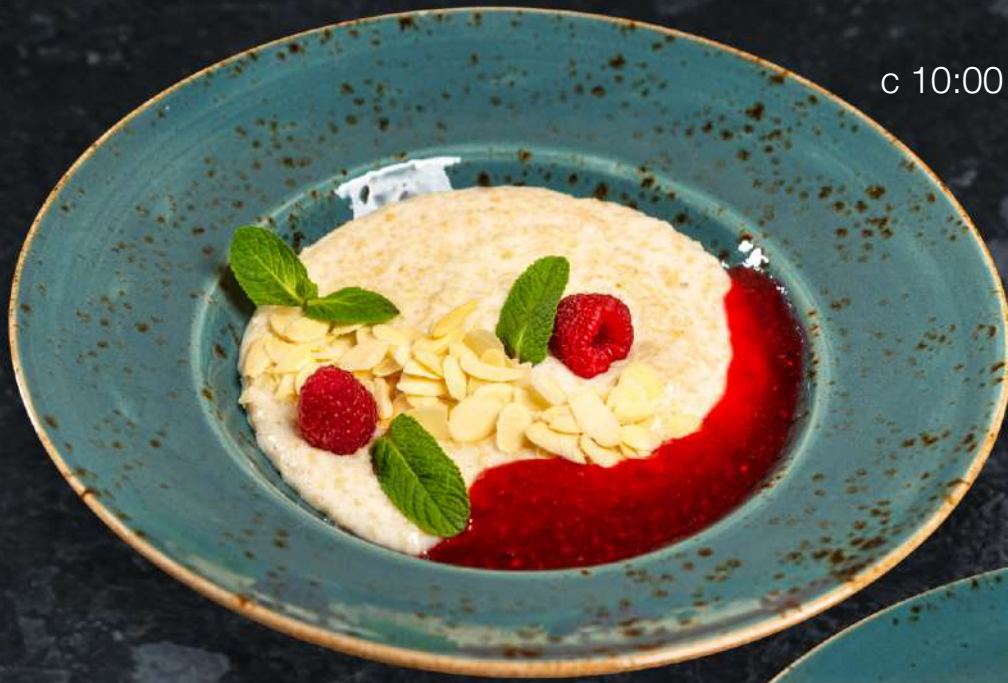
Овсяная каша на сливках с ягодами и лепестками миндаля