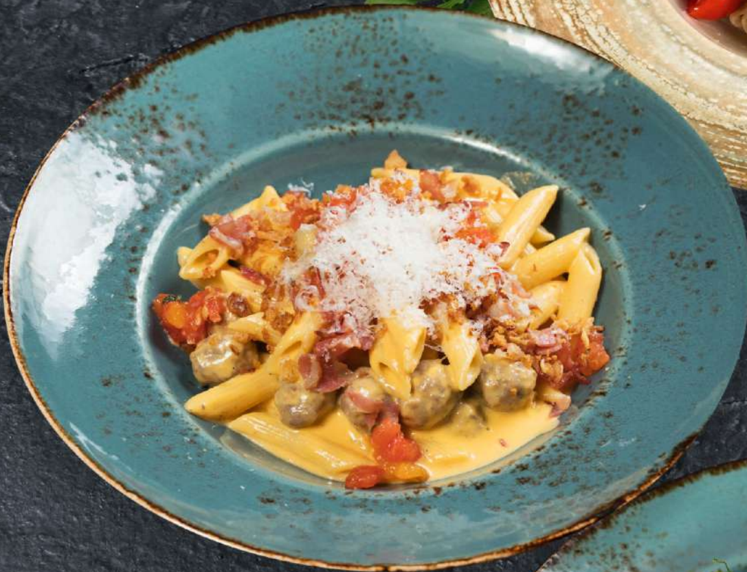
Пенне с фрикадельками в соусе Чеддер