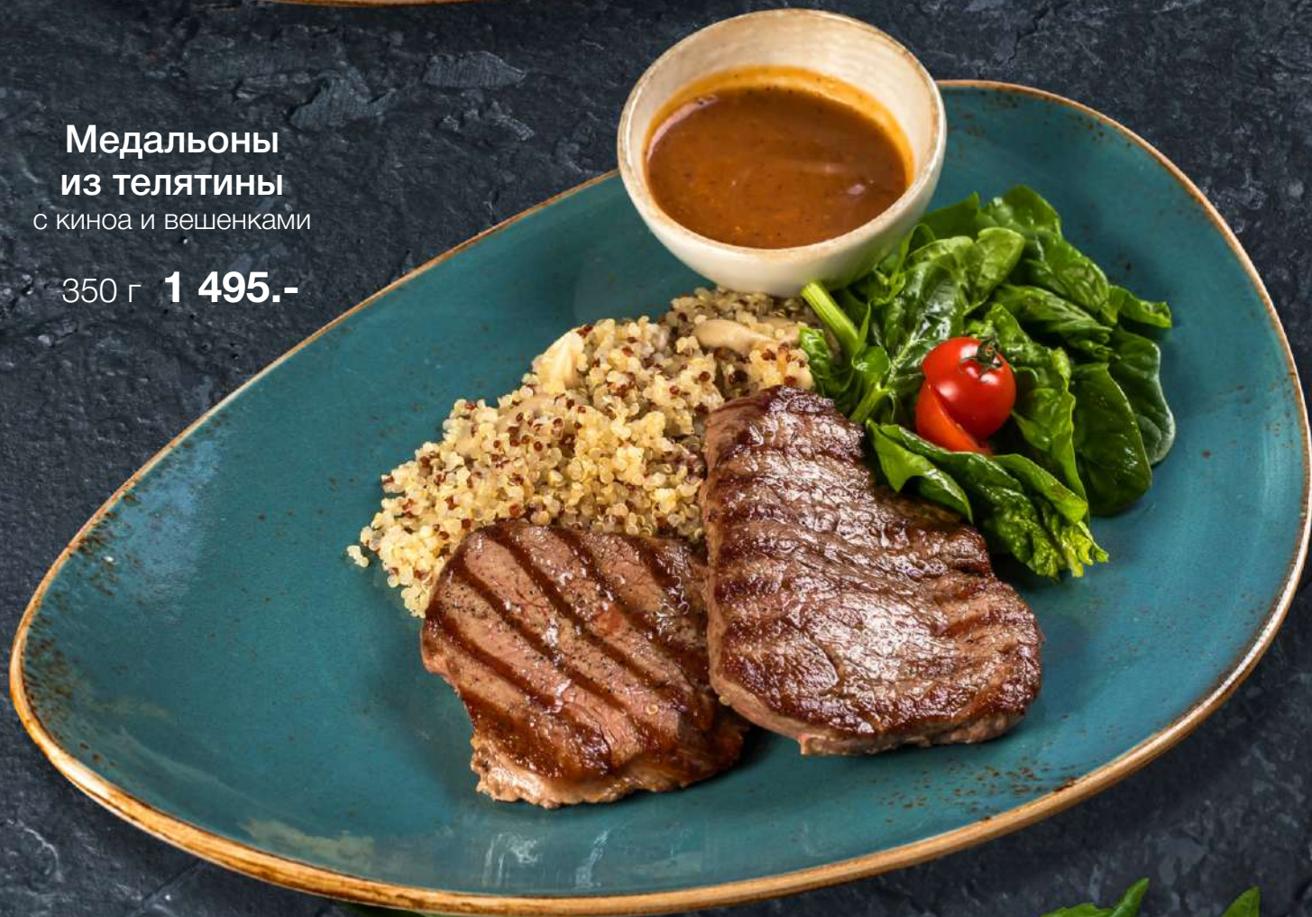
Медальоны из телятины с киноа и вешенками