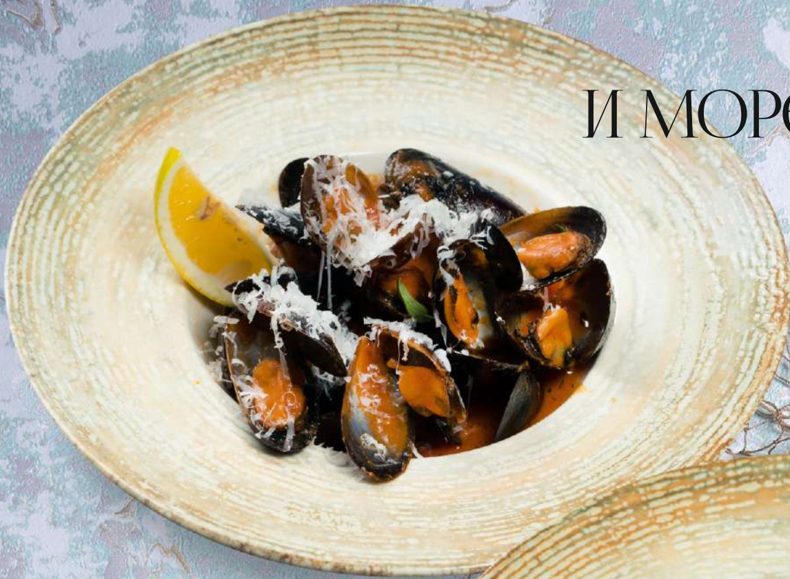
Чилийские мидии в соусе Том Ям