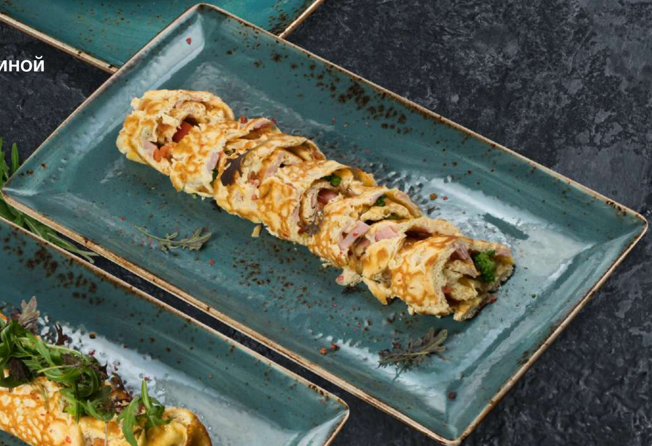
Фриттата с тигровыми креветками и брокколи