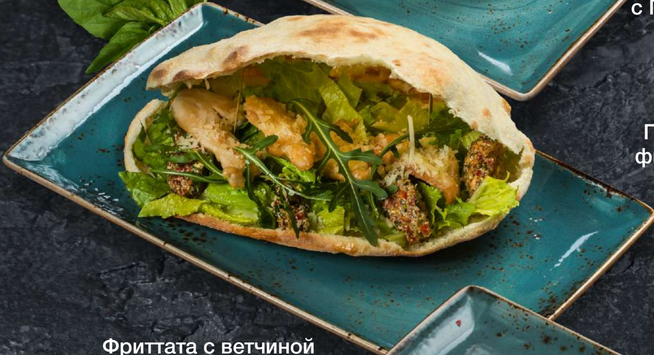
Панини с куриным филе и итальянской сальсой