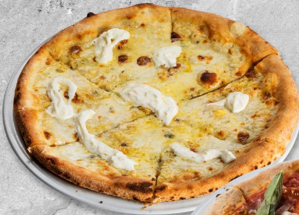
Кватро Формаджи сыр Моцарелла, сливочный соус, сыр Грана Падано, сыр Ля Блю, сыр Страчателла