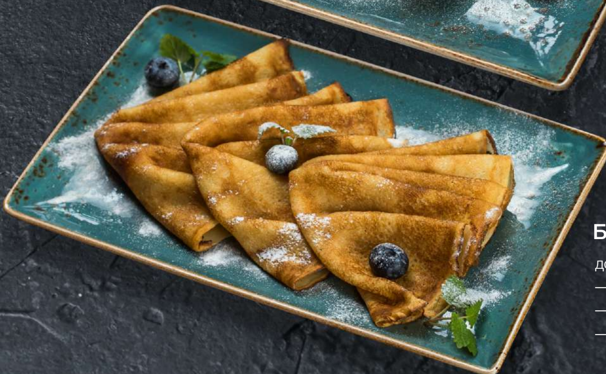
Блинчики 3 шт. 255.-