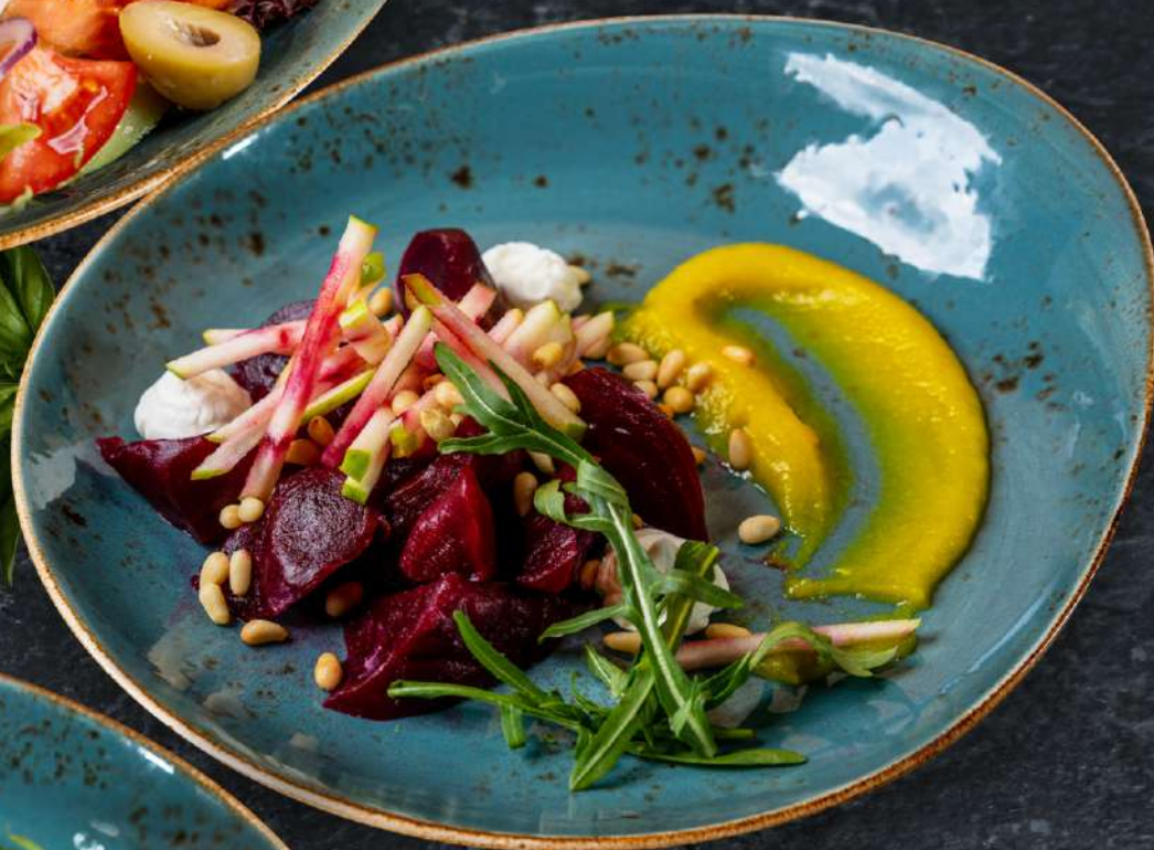
Из свеклы с кедровыми орехами, листьями рукколы и сливочным сыром 240 г 275.-