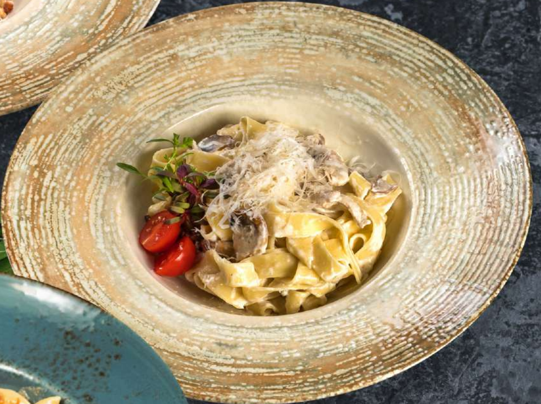
Монтанара тальятелле с куриным филе, шампиньонами и белыми грибами в сливочном соусе