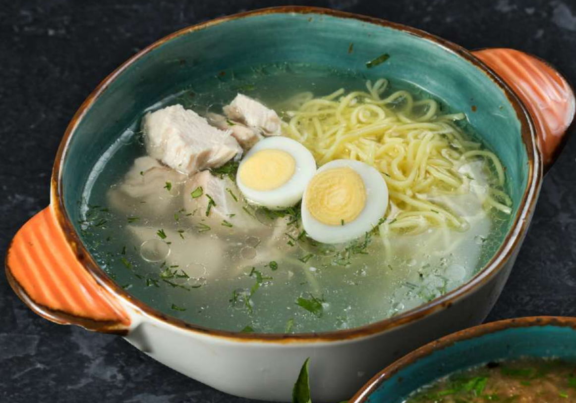
Суп-лапша с перепелкой 300 г 295.-