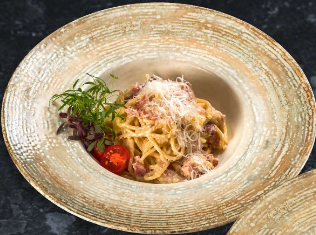
Карбонара спагетти с беконом в сливочно-яичном соусе