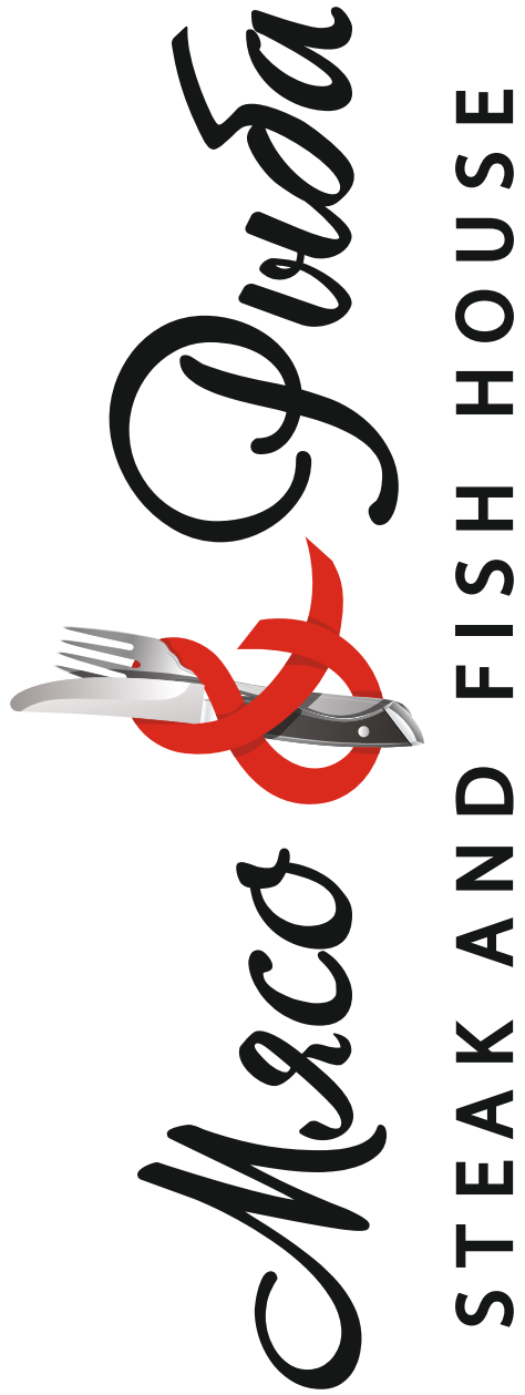
* Данная брошюра является информационной. Меню, а также информация о составе, пищевой ценности блюд и напитков, об объемах порций, а также о ценах в рублях и условиях оплаты услуг находится на доске информации для потребителей. Цены указаны в рублях. Выход блюд указан в граммах, выход напитков – в миллилитрах. При наличии у вас аллергии уточняйте информацию о подробном составе блюд и напитков у вашего официанта.