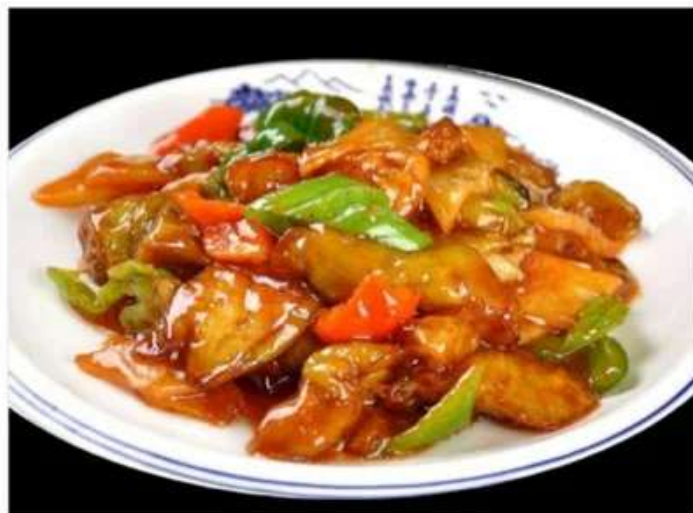
G2 地三鲜 450 RUB «Три земных свежести» (баклажан перец, картофель) (350гр.)