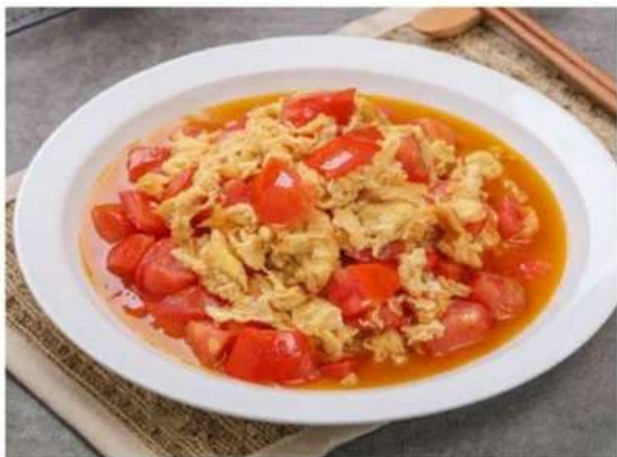
G1 西红柿炒鸡蛋 450 RUB Жареные яйца с помидорами (350гр.)