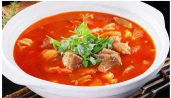
D7 番茄烩牛腩 880 RUB Тушёная говядина с помидорами (350гр.)