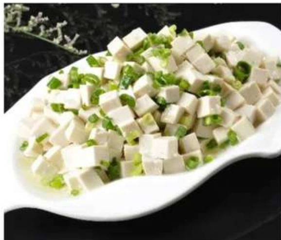
B19 香葱小豆腐 520 RUB