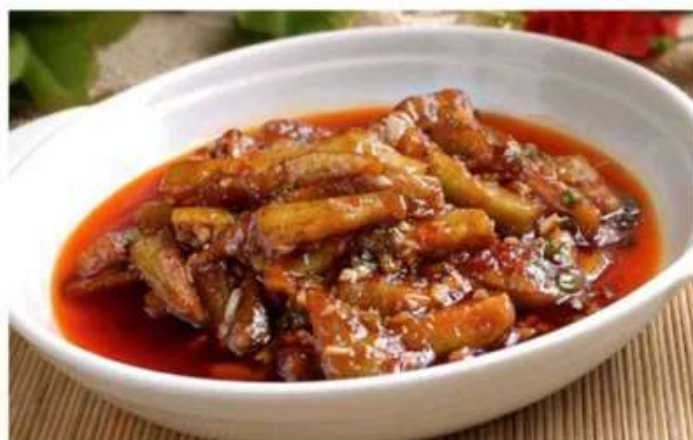
G7 鱼香茄子! 520 RUB Баклажаны в соусе из чеснока и острого перца (300гр.)