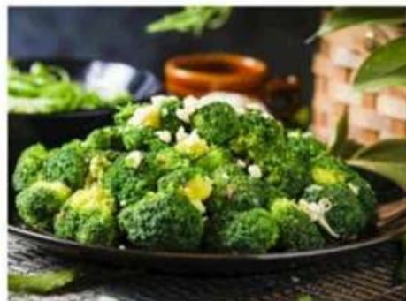
G5 蒜蓉西兰花 520 RUB Жареная брокколи с чесноком (350гр.)