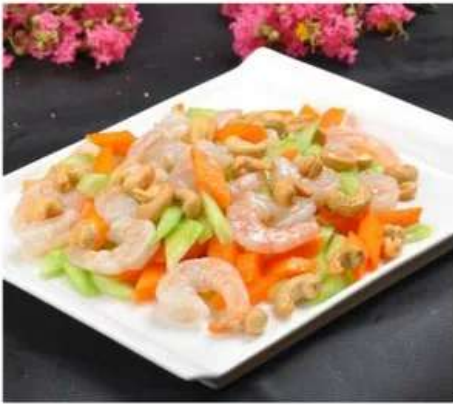
C1 西芹腰果虾仁 980 RUB

Жареные креветки и сельдерей с орешками кешью (350 гр.)