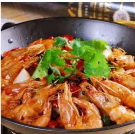
C3 油焖大虾 980 RUB

Жареные креветки с пекинской капустой (350 гр.)