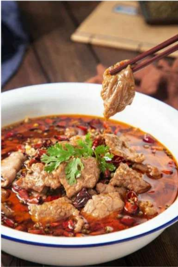
D5 水煮牛肉 1280 RUB /// Варёная говядина в остром бульоне (350гр.)