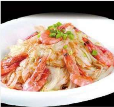
C2 白菜炒大虾 880 RUB

Жареные креветки и сельдерей с орешками кешью (350 гр.)