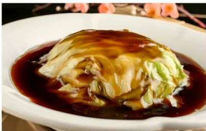
G6 蚝油生菜 520 RUB Жареный салат «Айсберг» в устричном соусе (300гр.)