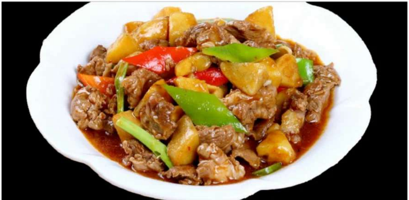
D8 土豆烧牛肉 880 RUB Говядина с картофелем в соусе карри (350гр.)