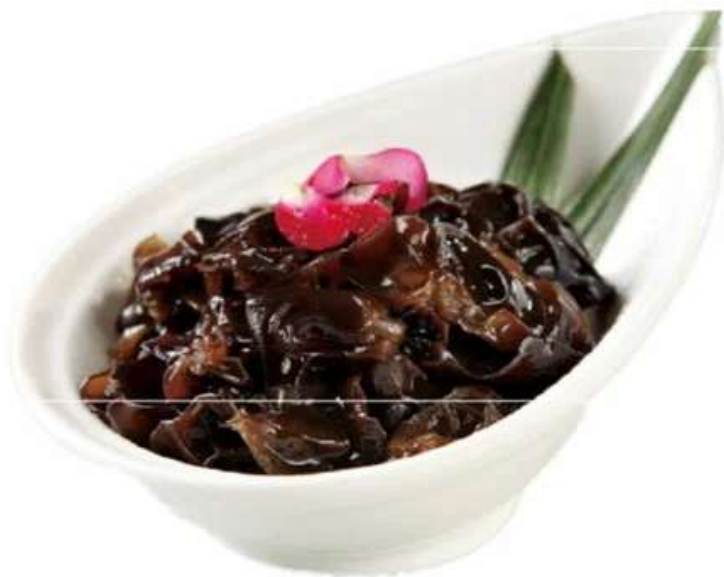
B15 养生木耳 520 RUB

Черные двересные грибы в ароматном соусе (300 гр.)