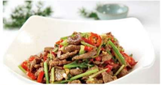
D6 小炒牛肉 880 RUB // Жареная говядина с острым перцем (350гр.)