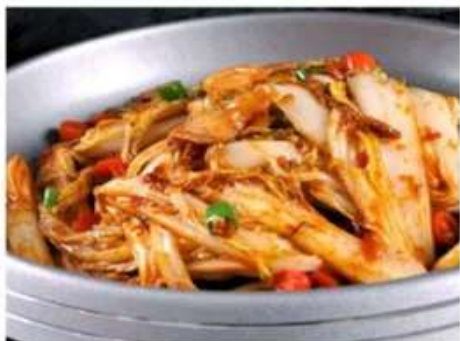
G3 干锅娃娃菜 450 RUB! Жареная капуста со свининой (350гр.)