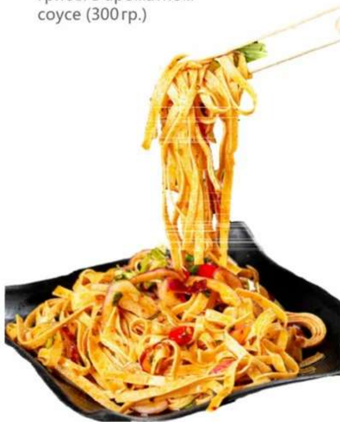
B16 红油豆腐丝 520 RUB

Полоски сухого тофу в остром соусе (300 гр.)