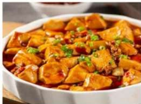
G4 麻辣豆腐!!! 520 RUB «Мапо-тофу» (Соевый творог в остром бульоне) (350гр.)