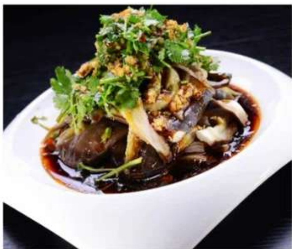
B18 蒜泥蒸茄子 520 RUB

Полоски сухого тофу в остром соусе (300 гр.)