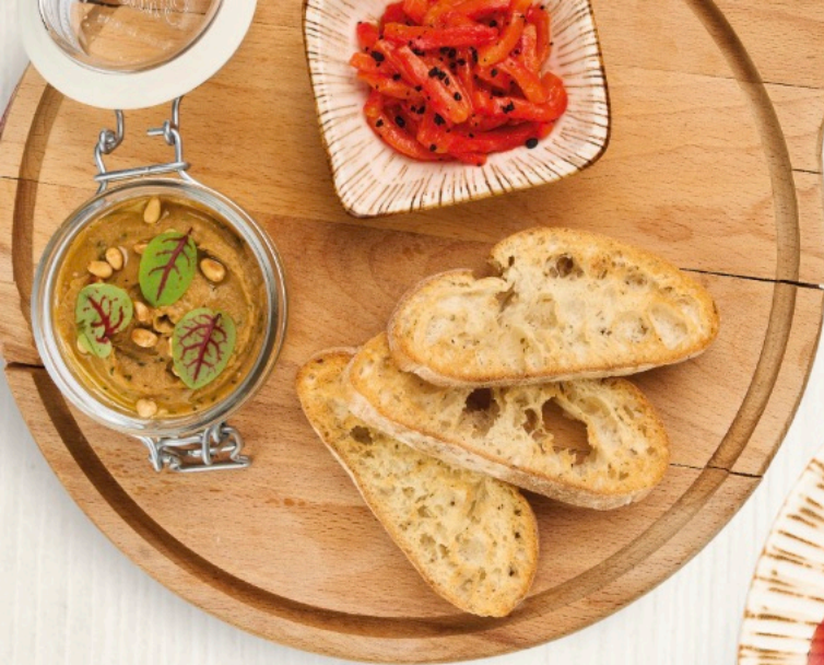
Мелидзано из баклажанов Melitzanosalata (Greek eggplant dip)