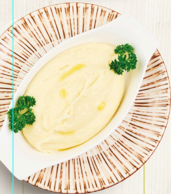
Картофельное пюре с трюфельным маслом и пармезаном Mashed potatoes with truffle oil & parmesan