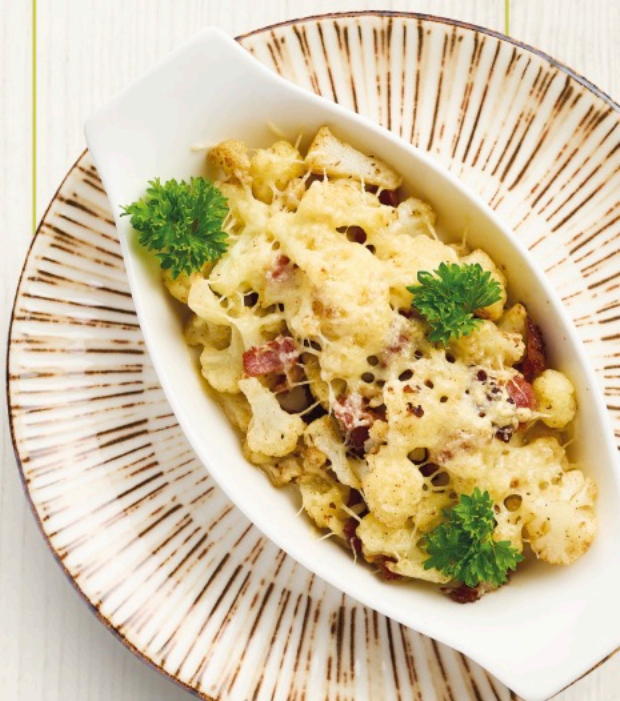
Цветная капуста с беконом и сыром Пармезан Cauliflower with bacon & Parmesan cheese