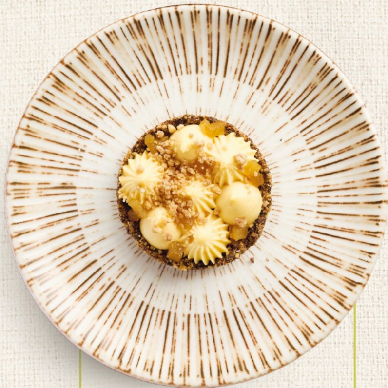
Тарталетка с грушей, крекером и фундуком Tartlet with pear, cracker and hazelnuts