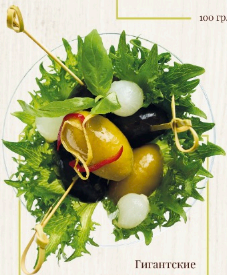
Гигантские оливки и маслины Giant black and green olives