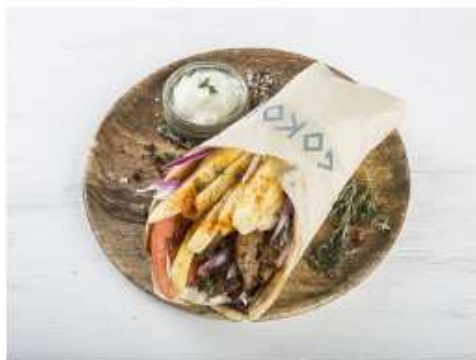
Гирос из свинины