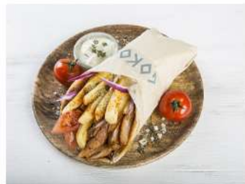
Гирос из курицы