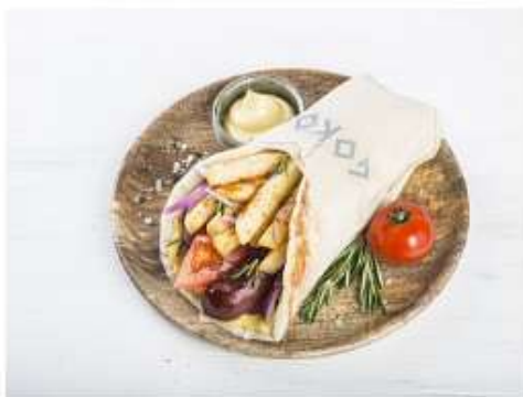
Гирос из Луканико