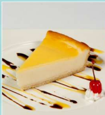
240 р 120/10 г. Чизкейк - классический - три шоколада