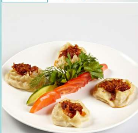
260 р 180/80/60 г. Манты на выбор: - с бараниной - с тыквой