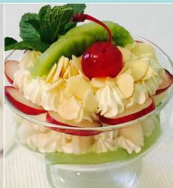
190 р 150 г. «Трайфл» с фруктами, орешками и йогуртовым кремом