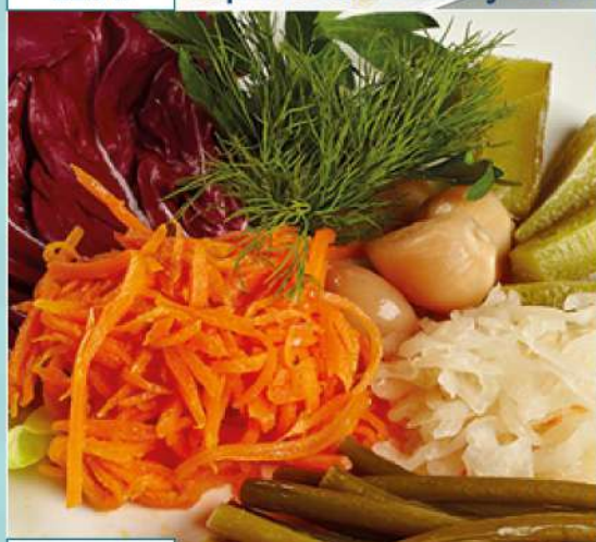
195 р 195 г. Соленья