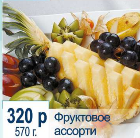
320 р 570 г. Фруктовое ассорти