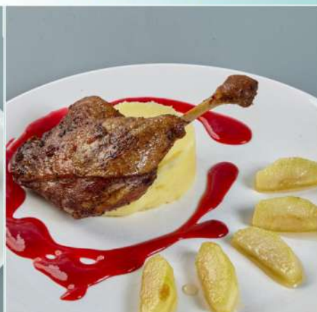
480 р 150/60/50/20 г. Утиная ножка "Конфи"