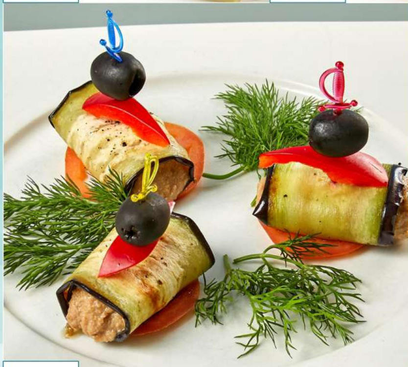
290 р 140 г. Рулетки из баклажанов с грецкими орехами NEW