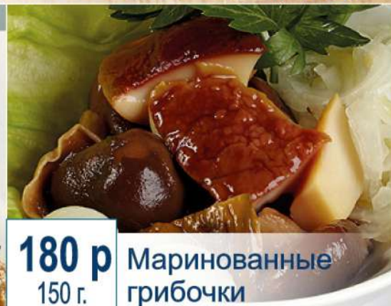
180 р 150 г. Маринованные грибочки