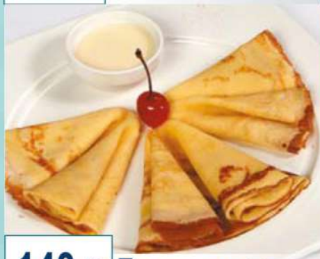
140 р 120/40 г. Блинчики со сгущенкой