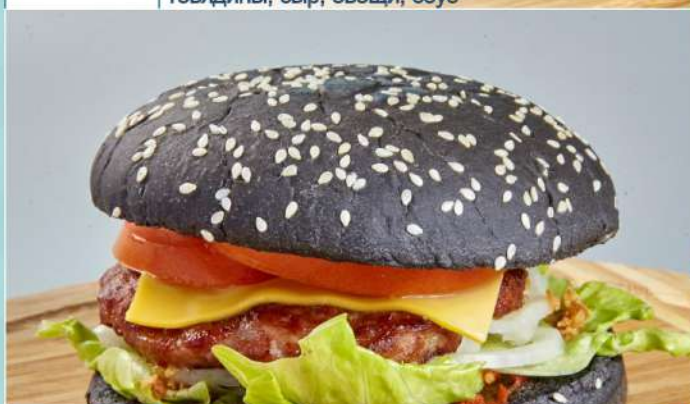
240 р 170 г. «Бризбургер» с бараниной Темная булочка с кунжутом, котлета из баранины, сыр, овощи, соус