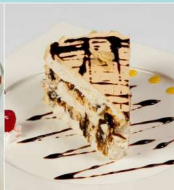
160 р 100/10 г. Графские развалины