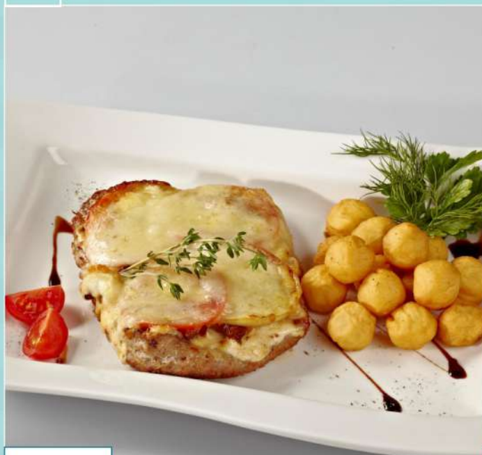
460 р 215/135 г. Свинина с лисичками и томатами запеченная под сыром