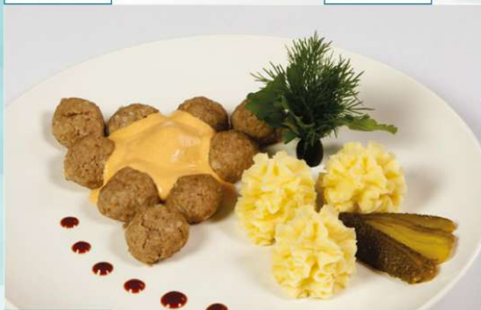
290 р 300 г. Мясные фрикадельки с картофельным пюре и овощным соусом