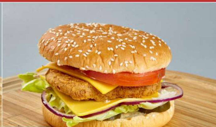
180 р 170 г. «Бризбургер» с курицей Ароматная булочка, котлета из курицы в панировке, сыр, овощи, соус.