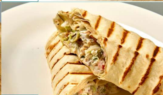
220 р 250 г. Ролл «Цезарь» из лаваша, курицы, сыра, томатов, салата айсберг и соуса цезарь