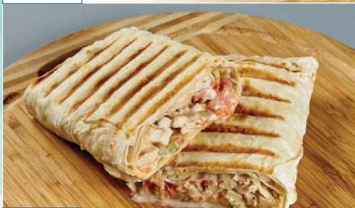
220 р 250 г. Ролл «Шаверма» из лаваша, курицы, овощей, томатного и чесночного соуса