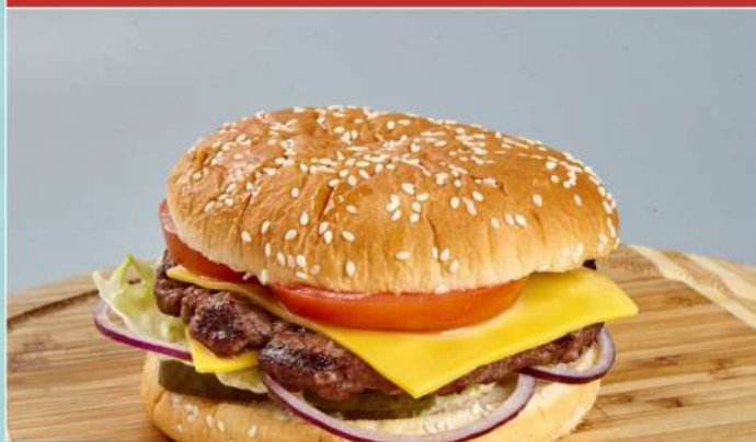
240 р 190 г. «Бризбургер» с мраморной говядиной Ароматная булочка, котлета из мраморной говядины, сыр, овощи, соус

При желании можно заказать бургер с картофелем фри. Стоимость картофеля фри к бургеру – 60 руб.