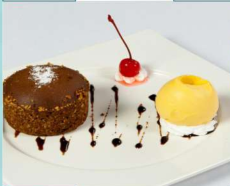
190 р 110/50/10 г. Горячий шоколадный кекс с сорбетом из манго