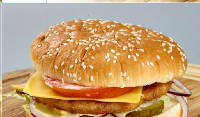
240 р 170 г. «Бризбургер» с индейкой Ароматная булочка, котлета из индейки, лук, сыр, овощи, соус