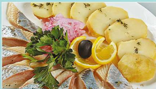
180 р 220 г. Селедочка с картофелем и маринованным лучком