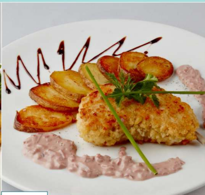
360 р 250/40/30 г. Котлета Пожарского из телятины с грибным соусом