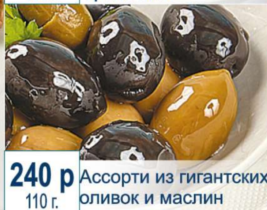
240 р 110 г. Ассорти из гигантских оливок и маслин