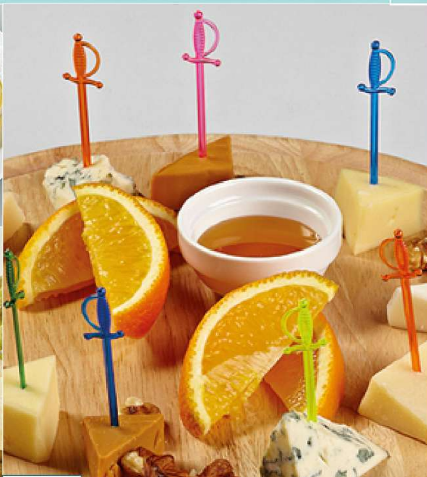
360 р 215 г. Сырная тарелка (пармезан, чеддер, рокфорти, гауда)