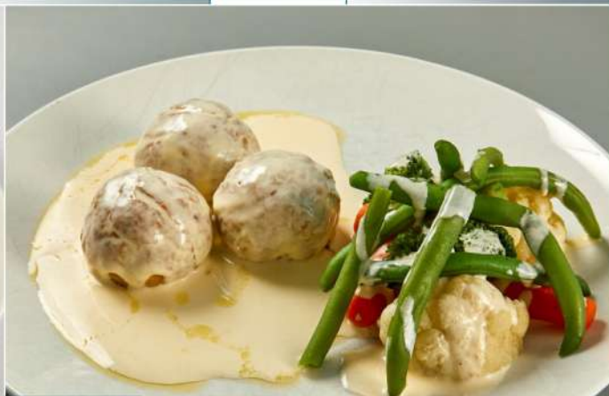
360 р 300 г. Паровые митболлы из индейки с овощами и сырным соусом NEW