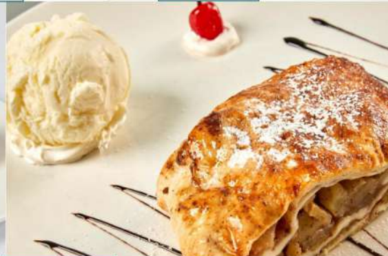
220 р 140//50/10 г. Штрудель яблочный с мороженым