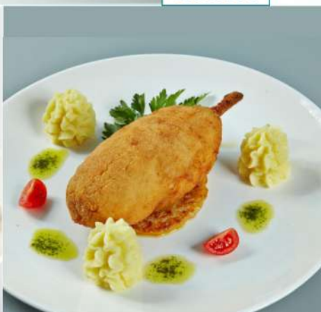
290 р 150/60/60 г. Котлета по-киевски