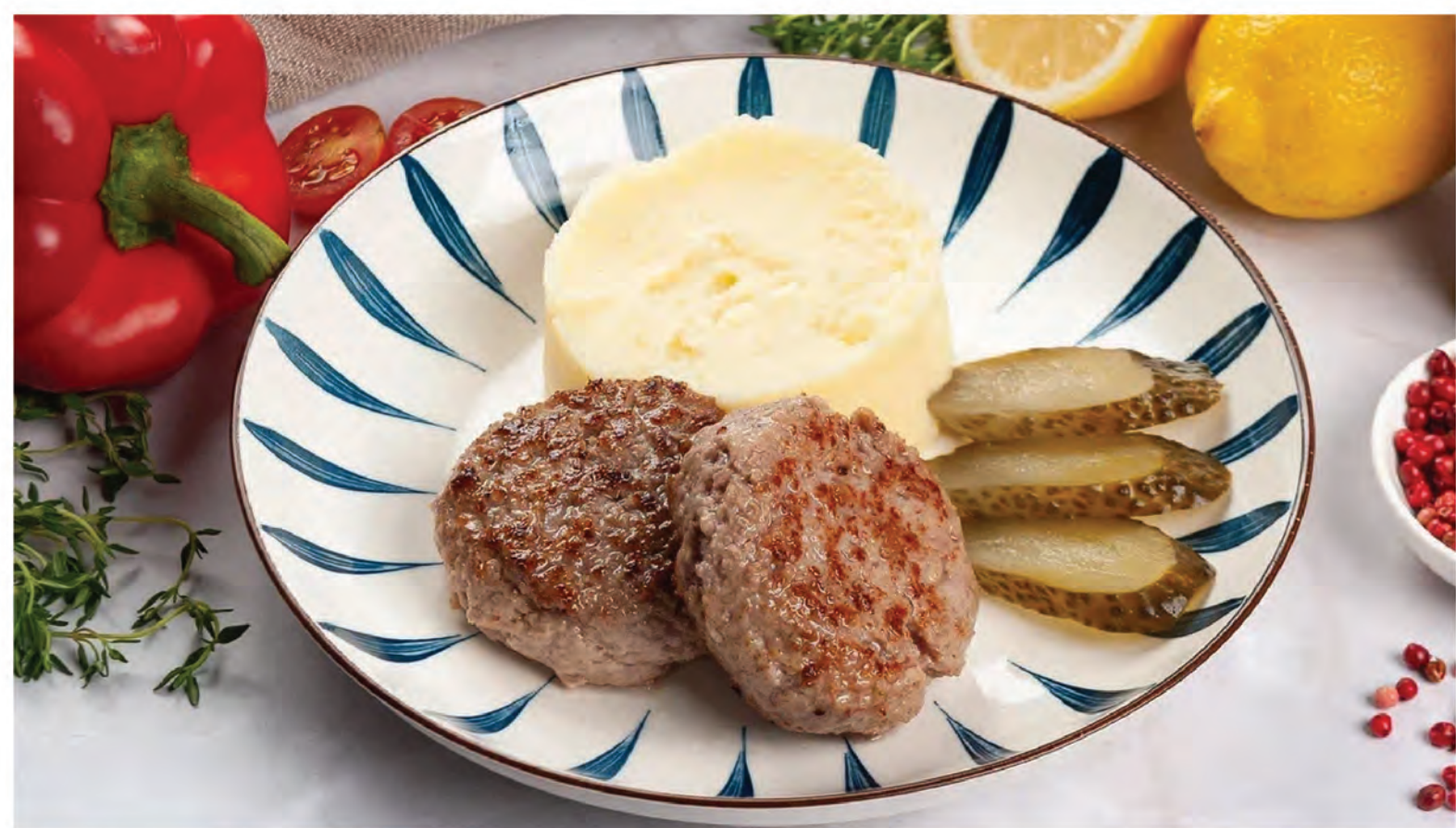
ДОМАШНИЕ КОТЛЕТЫ с картофельным пюре и солеными огурчиками 150/150/40г/ 590₽