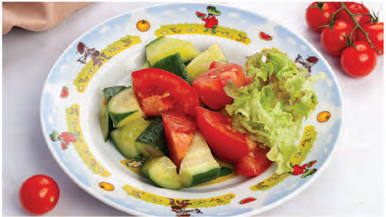
САЛАТИК «У БАБУШКИ НА ГРЯДКЕ» 180г / 250Р