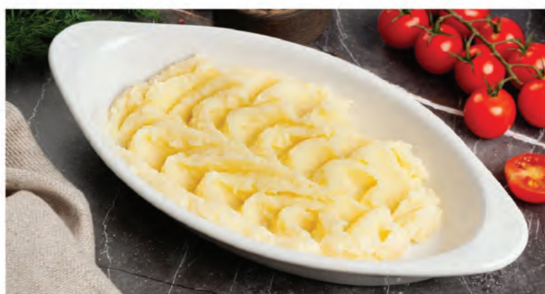
ПЮРЕ КАРТОФЕЛЬНОЕ 200г / 200₽