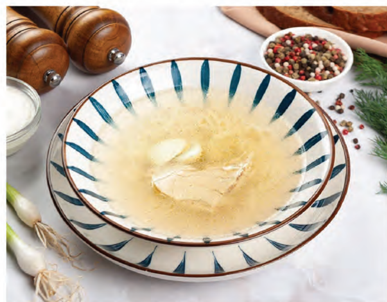
КУРИНЫЙ БУЛЬОН с домашней лапшой