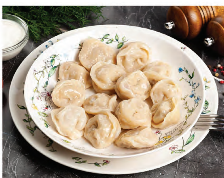
ПЕЛЬМЕНИ ДОМАШНИЕ из двух видов мяса 300г / 450₽ ПЕЛЬМЕНИ из мяса цыпленка 300г / 390₽