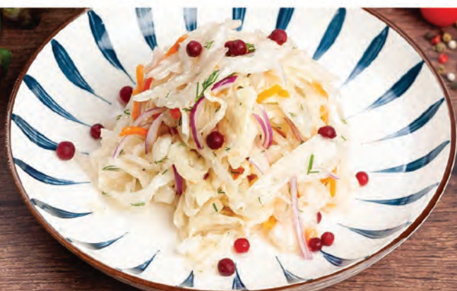
КАПУСТА КВАШЕНАЯ с луком и ароматным маслом 300г / 290₽