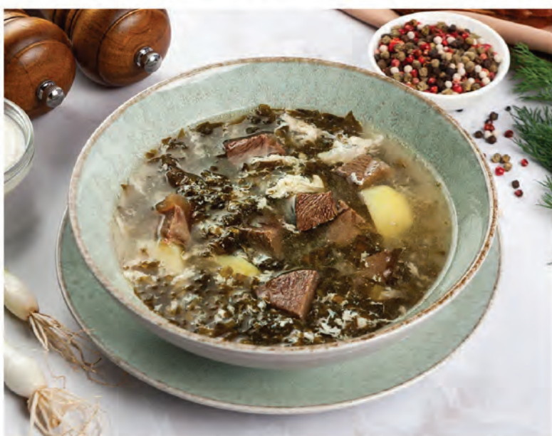
ЩИ ЗЕЛЕНЫЕ из щавеля с телятиной 250г / 350₽