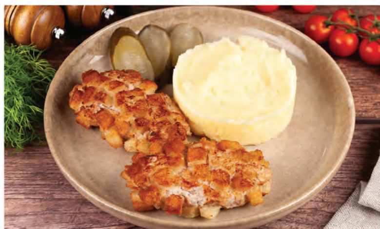
ПОЖАРСКИЕ КОТЛЕТЫ 180/150г/ 590₽