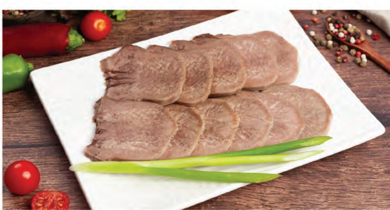
ЯЗЫК ГОВЯЖИЙ С ГОРЧИЦЕЙ И ХРЕНОМ