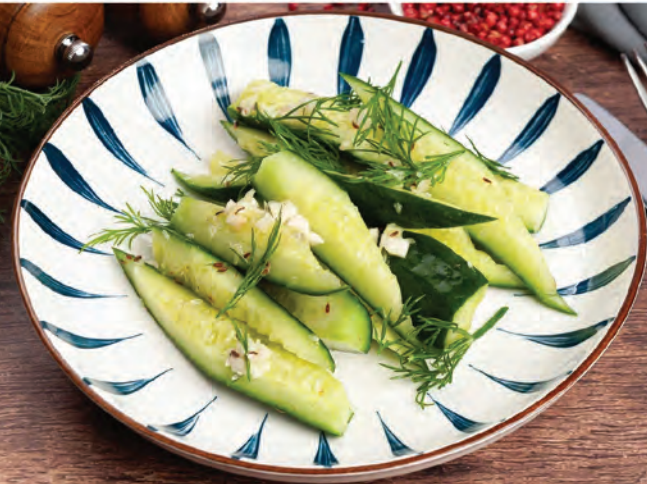
МАЛОСОЛЬНЫЕ ОГУРЦЫ 200г / 390₽