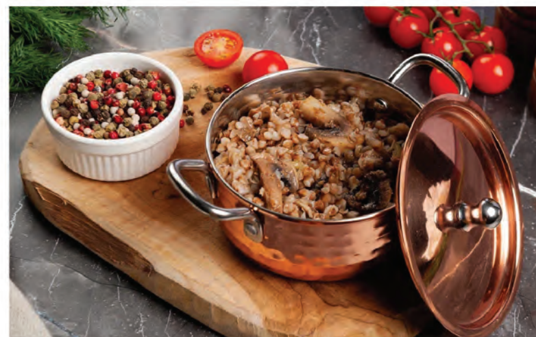
ГРЕЧА С ГРИБАМИ 250г / 290₽