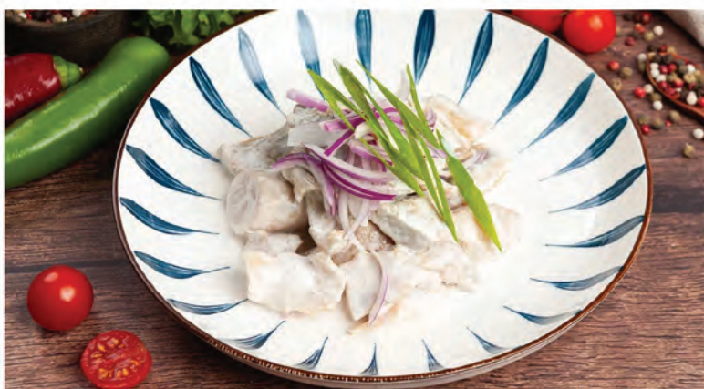
ГРУЗДИ СОЛЕННЫЕ В БОЧКЕ с маслом, луком и деревенский сметаной