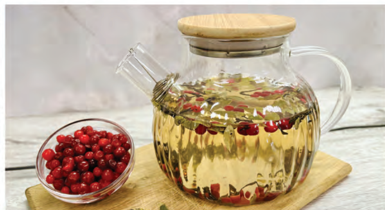
ИВАН-ЧАЙ С БРУСНИКОЙ 1000мл / 590₽