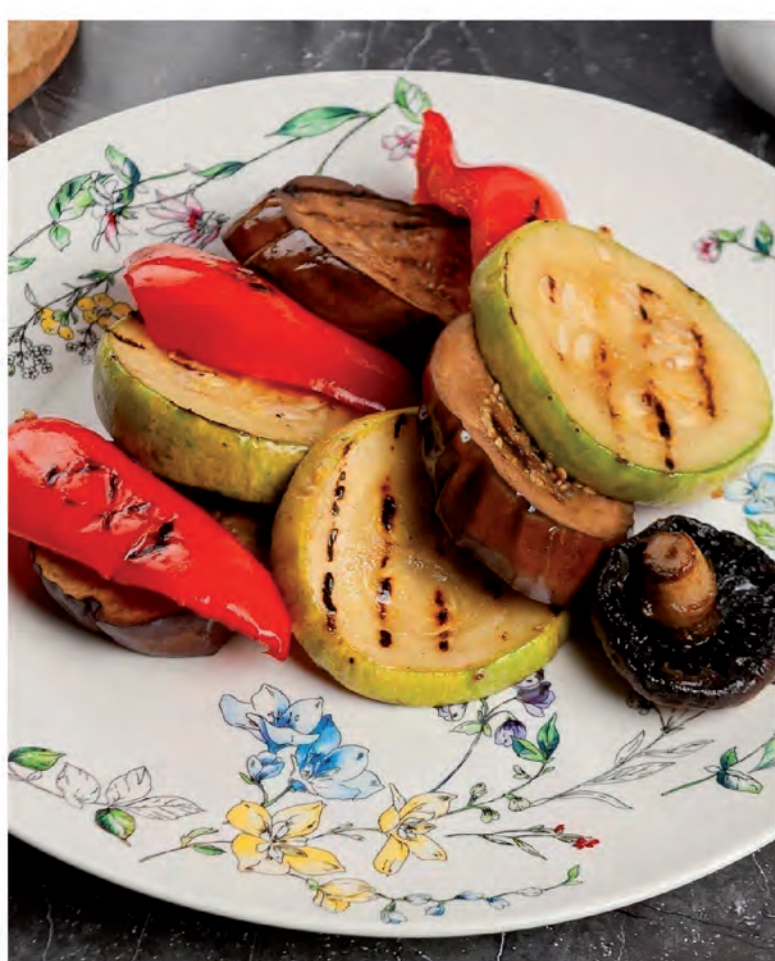
ОВОЩИ-ГРИЛЬ 200г / 450₽