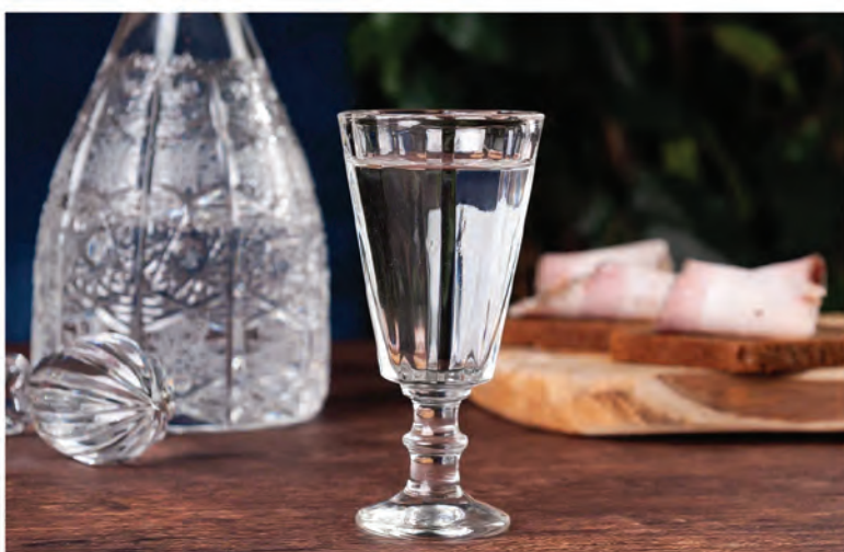
ФИРМЕННЫЙ САМОГОНЬ 40мл / 190₽ пшеница ячмень горох