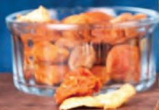
СБИТЕНЬ 200мл / 200₽