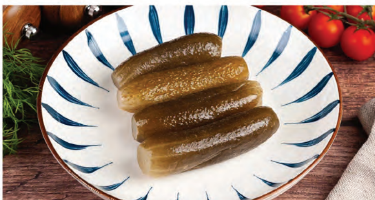
ОГУРЦЫ СОЛЕННЫЕ БОЧКОВЫЕ 200г / 390₽