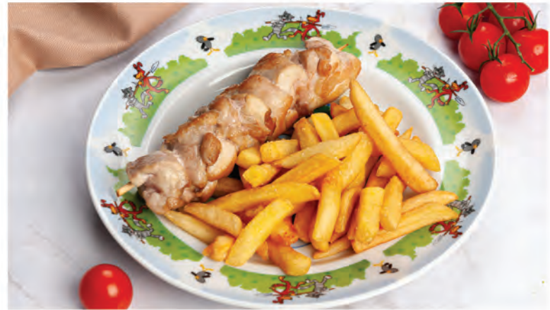
«ПОБЕГ ИЗ КУРЯТНИКА» 250г / 390Р