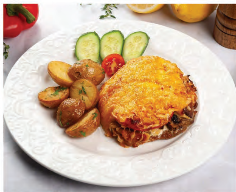
СВИНИНА ПО-ФРАНЦУЗСКИ с золотистым картофелем 200/100г/ 790₽