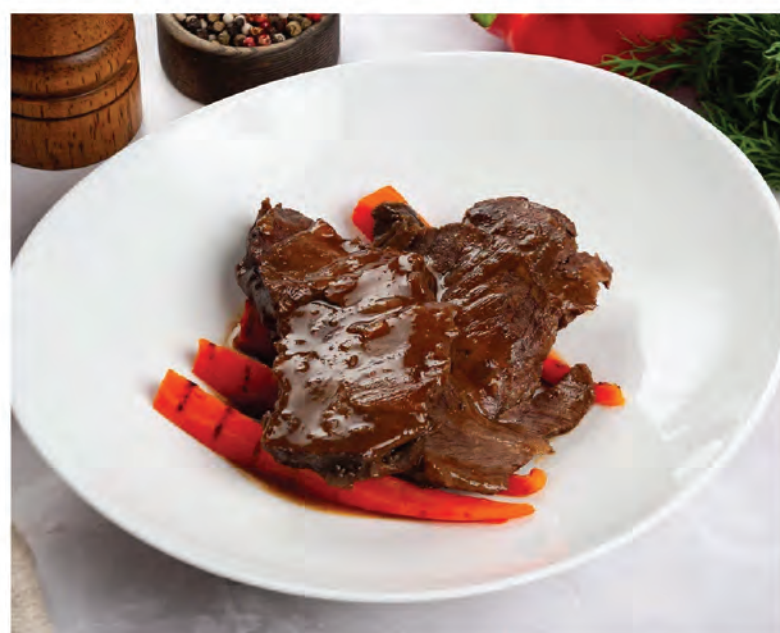
ТОМЛЕННЫЕ ТЕЛЯЧЬИ ЩЕЧКИ 150/50г / 1190₽