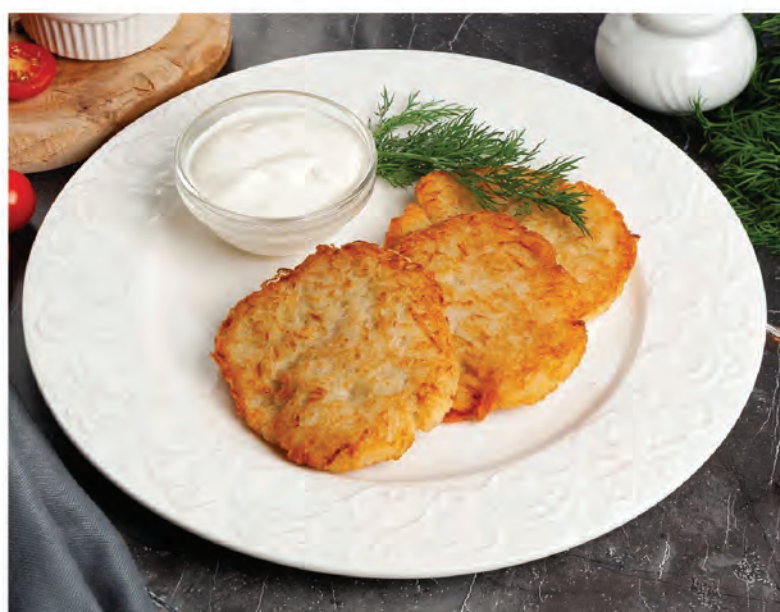
ДРАНИКИ 200/50г / 350₽