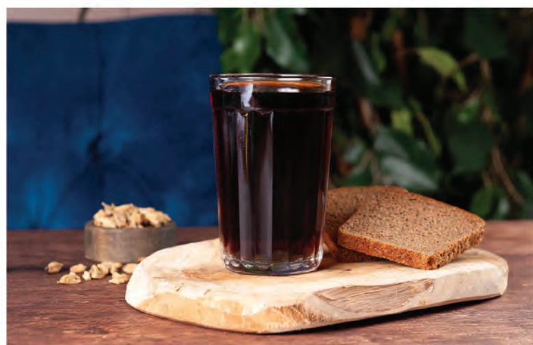
КВАС 250мл / 250₽