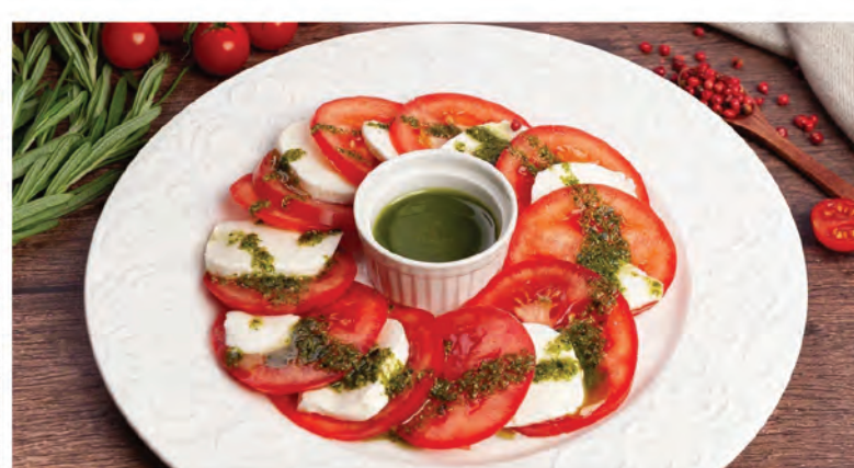
МОЦАРЕЛЛА С ТОМАТАМИ 250г / 490₽