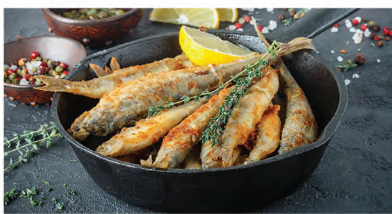
КОРЮШКА ЖАРЕНАЯ 100/390₽