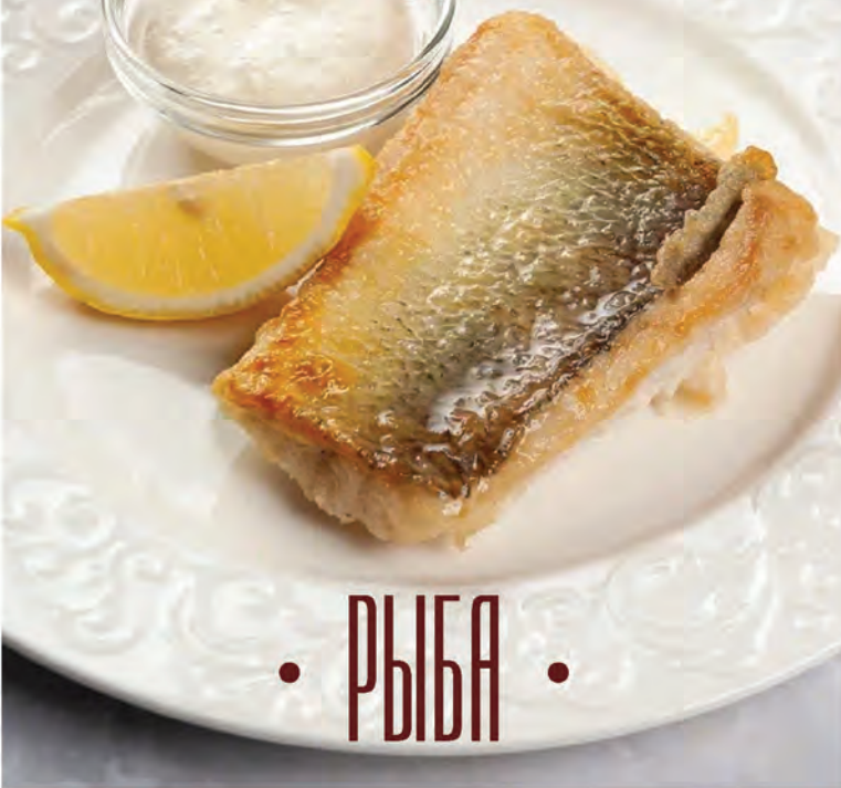
СУДАК ОНЕЖСКИЙ жареный 200/50г / 790₽