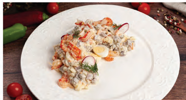
ОЛИВЬЕ С ТЕЛЯЧИМ ЯЗЫКОМ И РАКОВЫМИ ШЕЙКАМИ 240г / 490₽