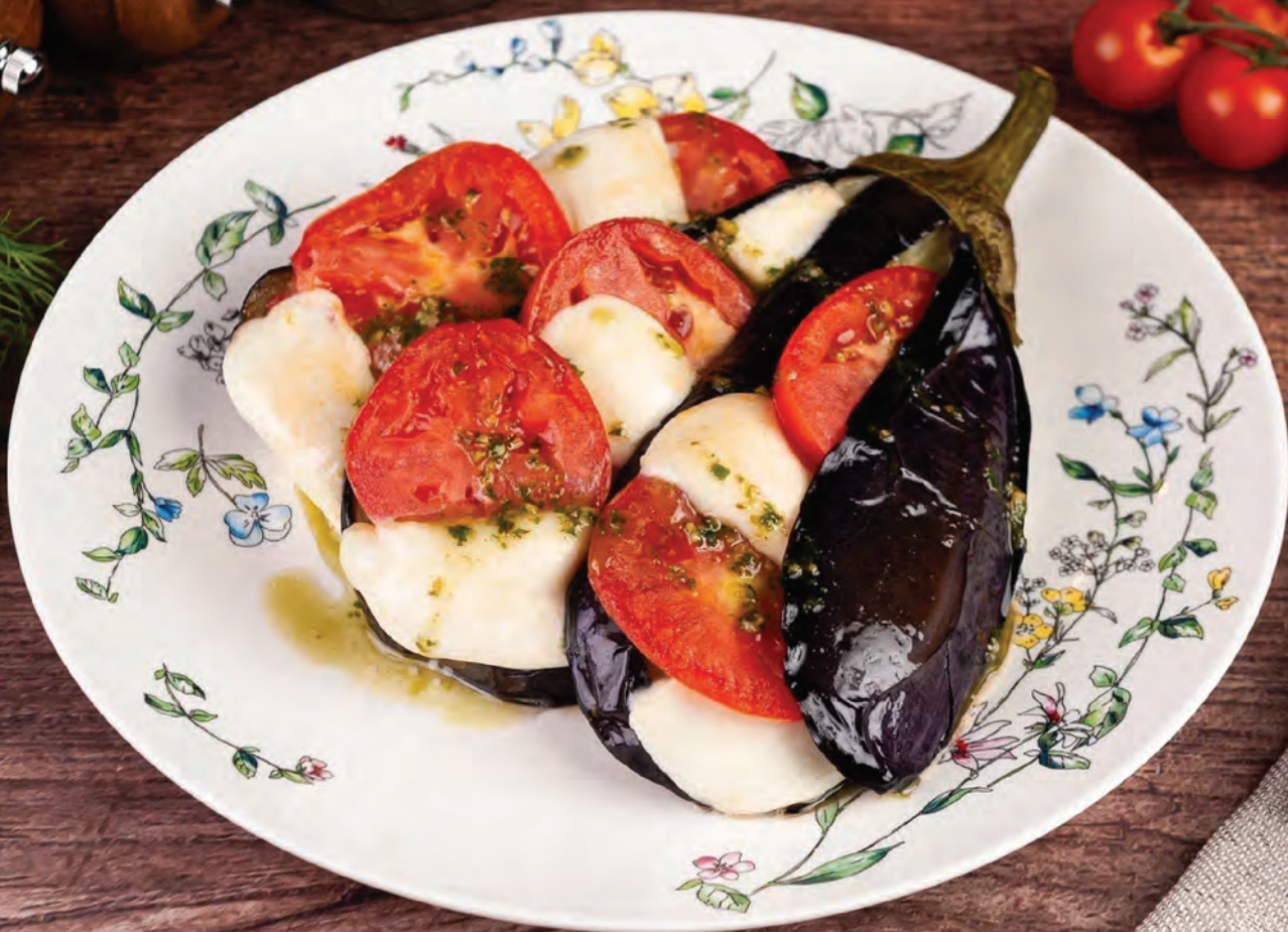
БАКЛАЖАН запеченный с моцареллой 300г / 590₽