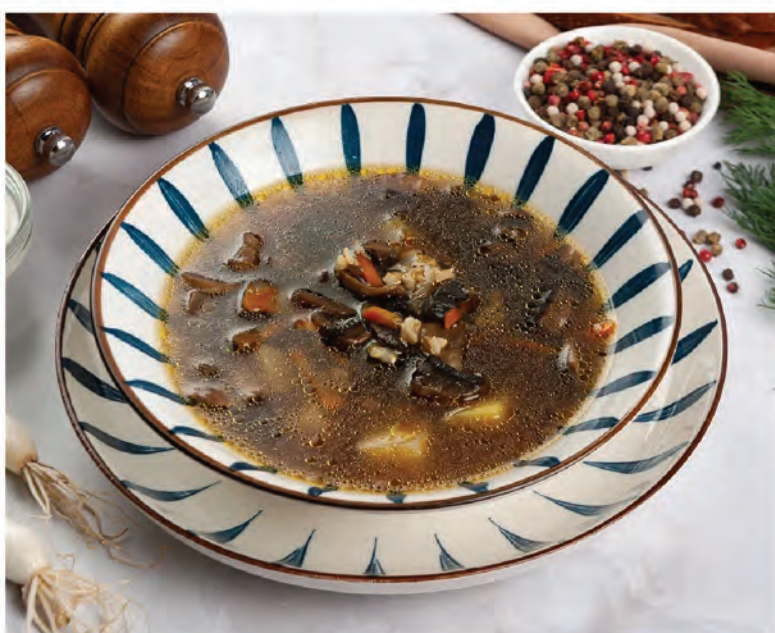
СУП ИЗ БЕЛЫХ ЛЕСНЫХ ГРИБОВ с перловкой 250г / 350₽