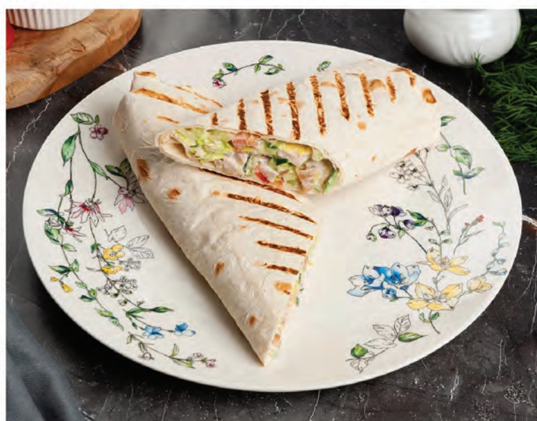
ШАВЕРМА по-Петербуржски с куриным филе 200г / 350₽ ШАВЕРМА по-Петербуржски с тигровыми креветками 200г / 490₽