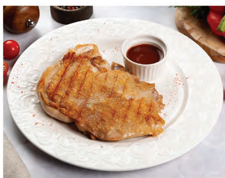
ЖАРЕНый ЦЫПЛЕНОК без кости, с солью да перцем 300/50г/ 750₽