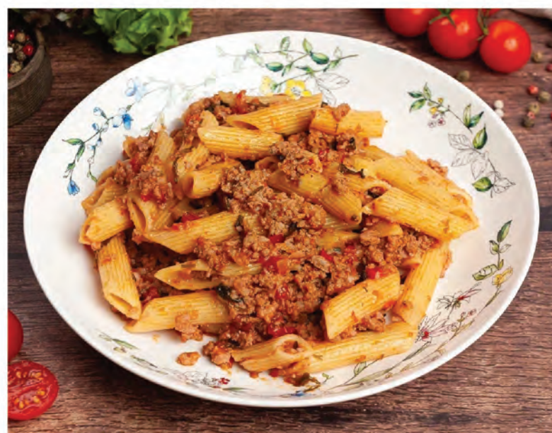
МАКАРОНЫ ПО-ФЛОТСКИ 300г / 450₽