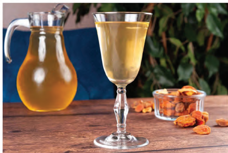
КОМПОТ 250мл / 200₽