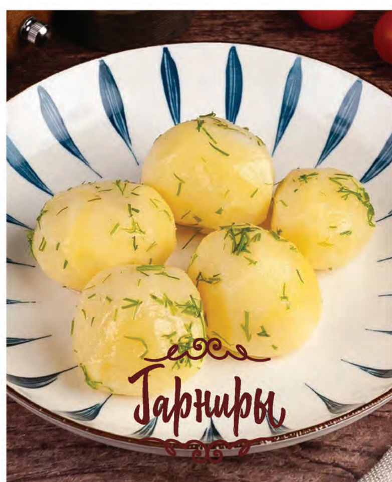
ОТВАРНОЙ КАРТОФЕЛЬ с маслом и укропом 200г / 200₽