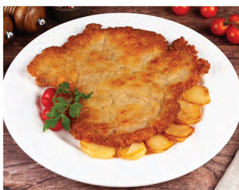
ШНИЦЕЛЬ ПО-ПЕТЕРБУРЖСКИ 230г / 690₽