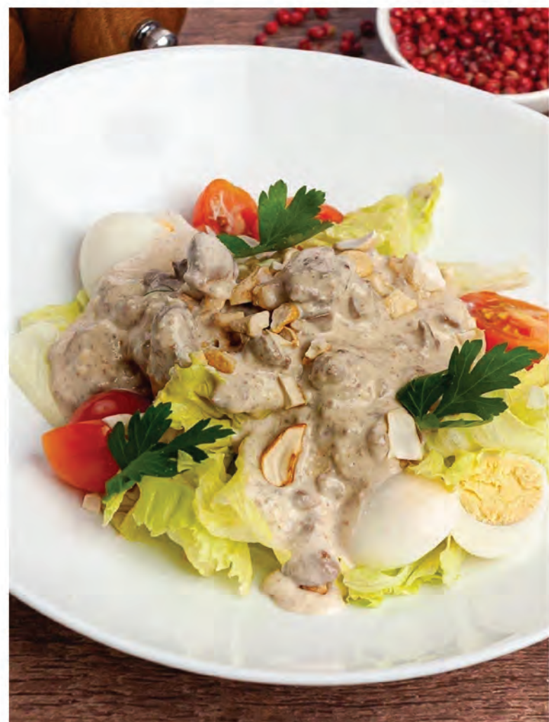
ТЕПЛЫЙ САЛАТ С КУРИНОЙ ПЕЧЕНЬЮ и орешками кешью 230г / 590₽