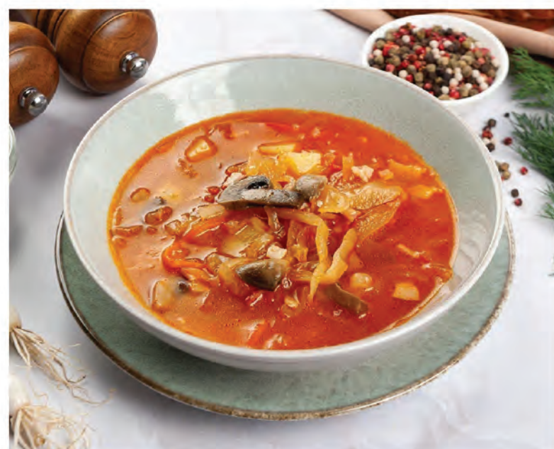
ЩИ СУТОЧНЫЕ с квашеной капустой, копчеными грибами и беконом 250г / 350₽