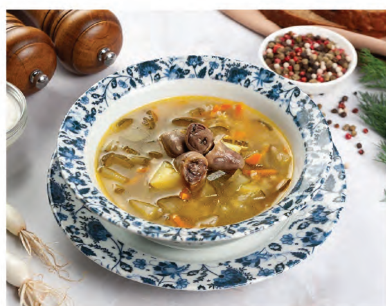
РАССОЛЬНИК ПО-ЛЕНИНГРАДСКИ с куриными сердечками 250г / 350₽