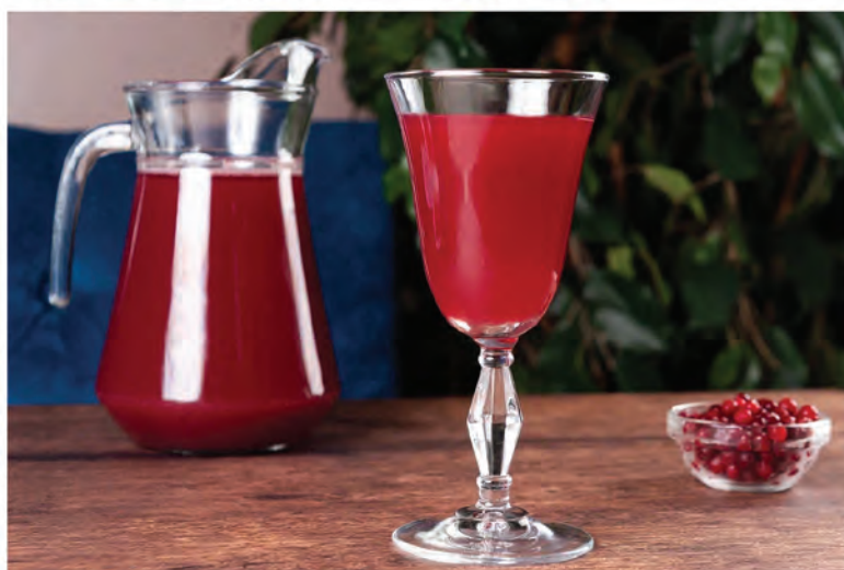
МОРС 250мл / 200₽