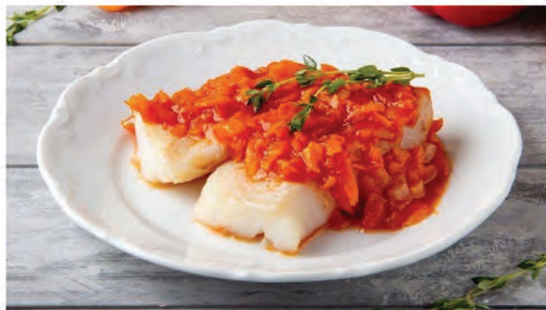
ТРЕСКА ПОД МАРИНАДОМ 200/550₽