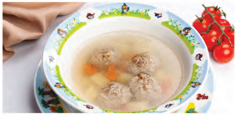
СУПЧИК «КАК У МАМЫ» 250г / 250Р