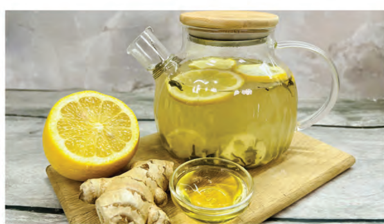
ИМБИРНО-ЛИМОННЫЙ 1000мл / 590₽