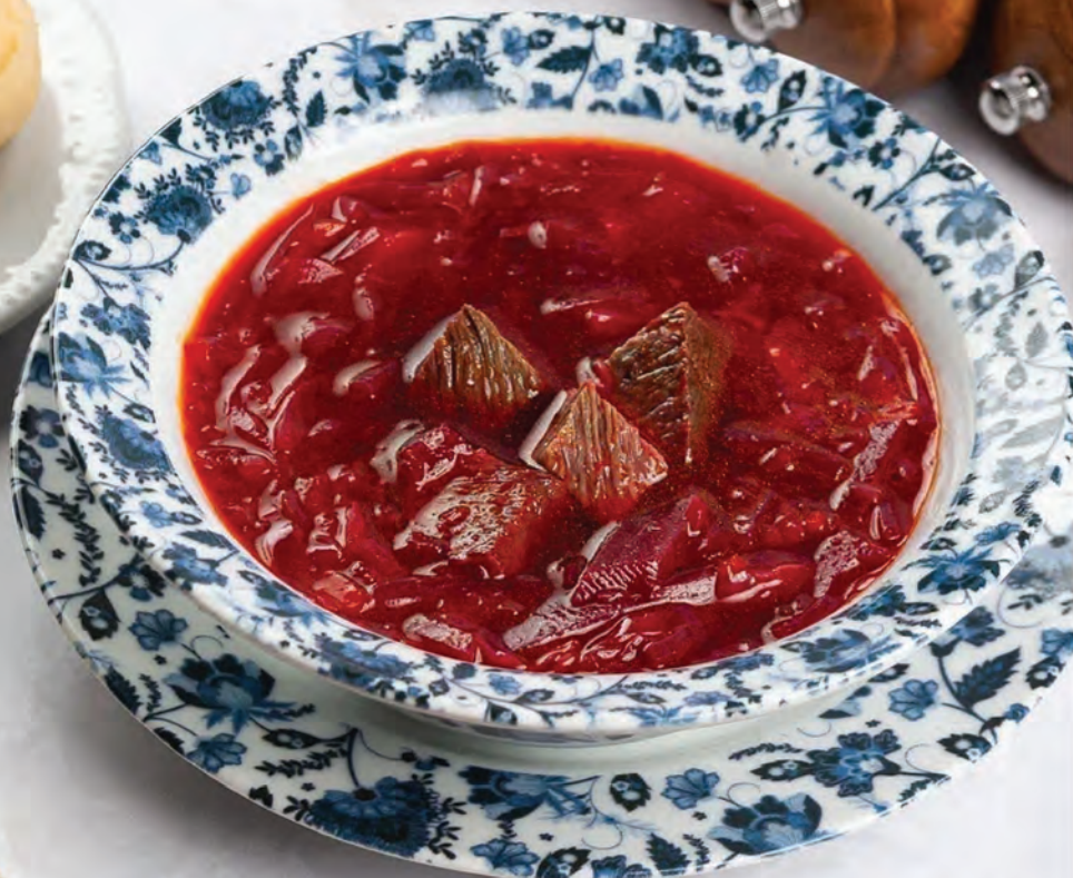
БОРЩ с пампушкой и салом 250г / 490₽