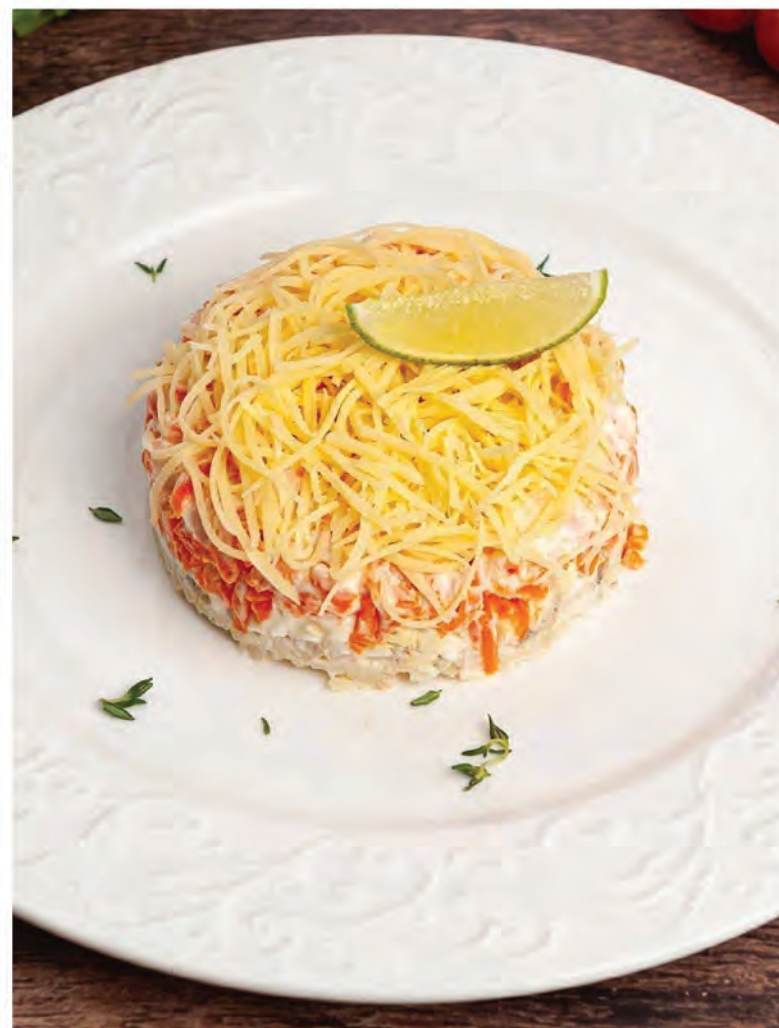
МИМОЗА 200г / 450₽