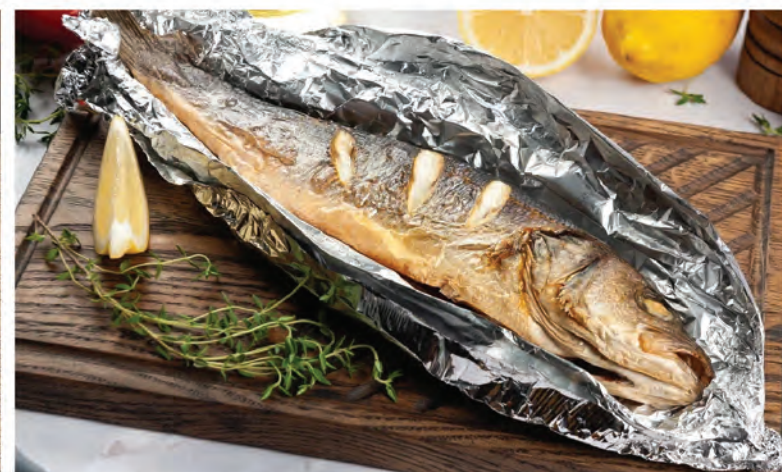
СИБАС запеченный в фольге 350г / 890₽