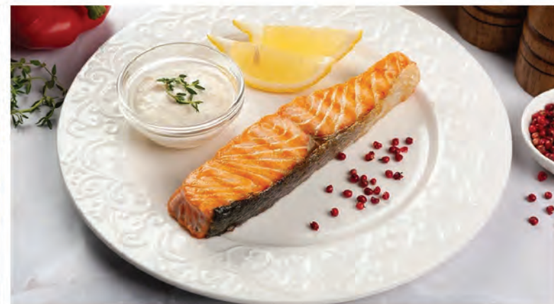
ЛОСОСЬ НА ГРИЛЕ с соусом «Белое вино» 150/50г / 1190₽