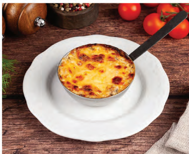
ЖУЛЬЕН ИЗ ЛЕСНЫХ ГРИБОВ 100г / 350₽