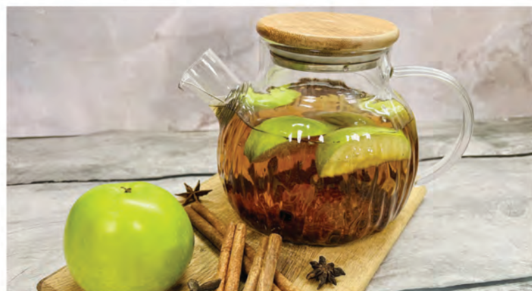
ЯБЛОКО-КОРИЦА 1000мл / 590₽