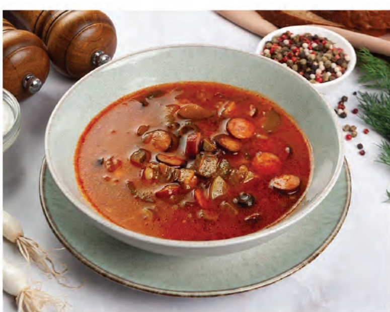
СОЛЯНКА МЯСНАЯ СБОРНАЯ 250г / 450₽