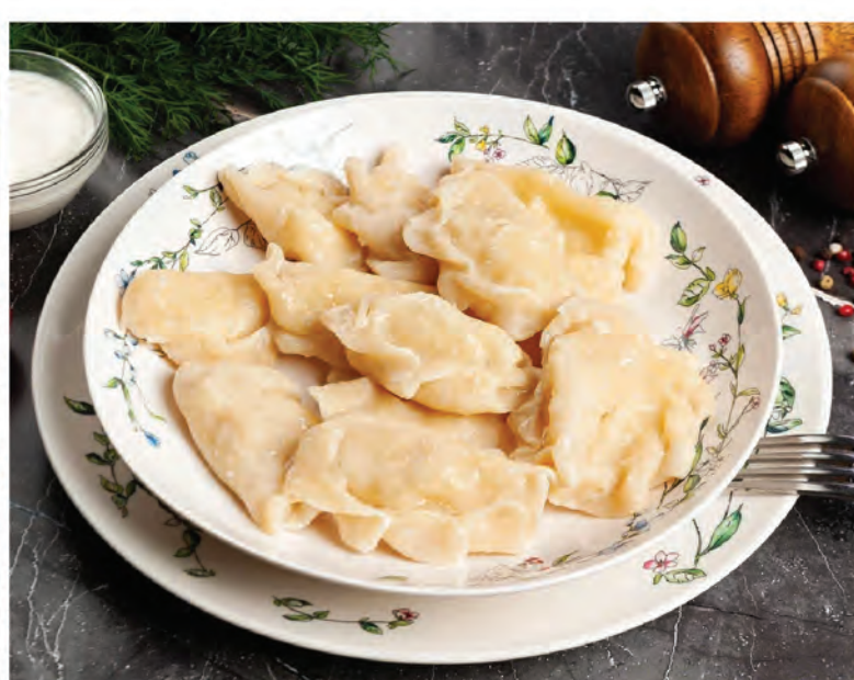
ВАРЕНИКИ с вишней садовой 200г / 290₽ ВАРЕНИКИ с картофелем и луком 200г / 290₽