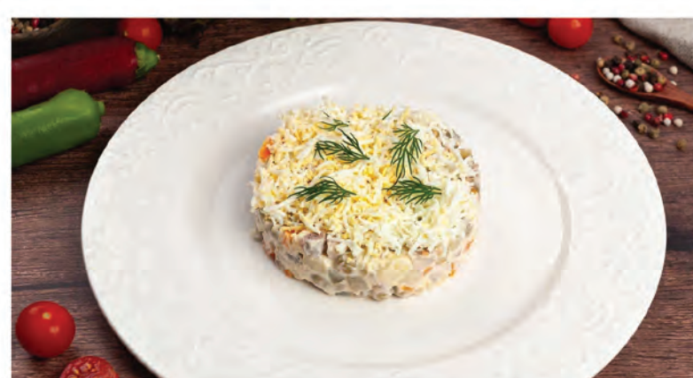
ОЛИВЬЕ С МЯСОМ ЦЫПЛЕНКА 210г / 390₽