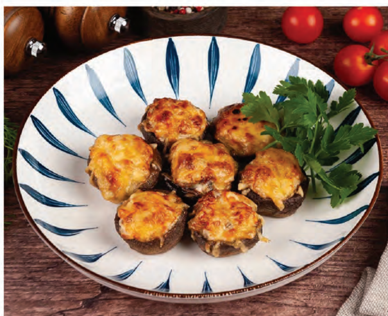
ФАРШИРОВАННЫЕ ШАМПИНЬОНЫ с сыром 180г / 450₽