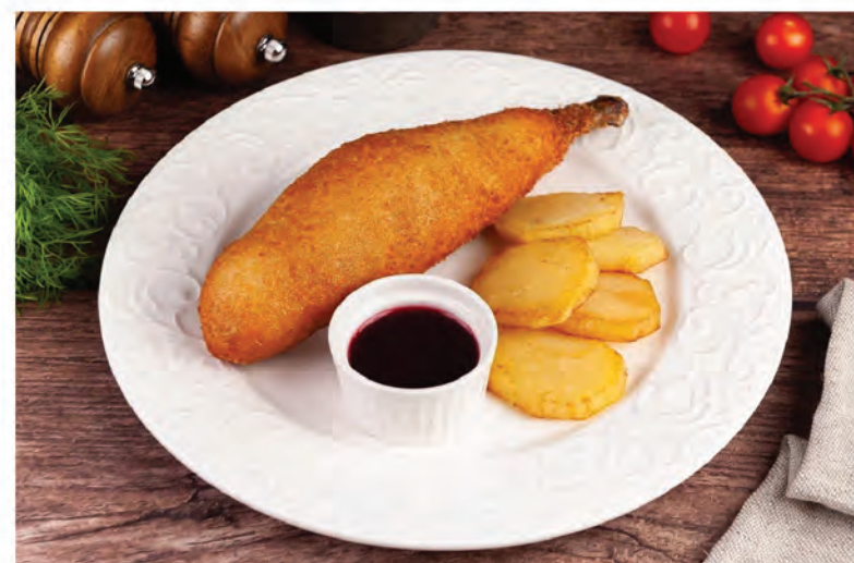
КОТЛЕТА ПО-КИЕВСКИ с картофельными медальонами и ягодным соусом 200/50/20г/ 590₽