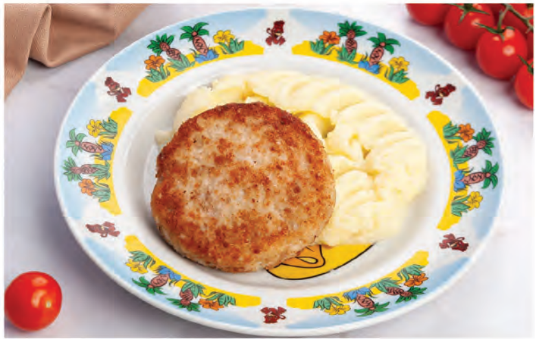
КУРИНАЯ КОТЛЕТКА С ПЮРЕ 250г / 390Р