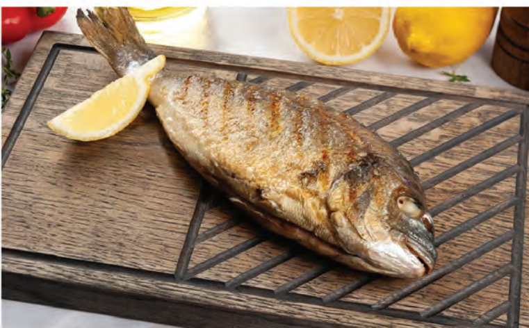
ДОРАДО НА ГРИЛЕ 350г / 890₽