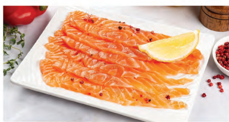
БЛАГОРОДНЫЙ ЛОСОСЬ МАЛОЙ СОЛИ