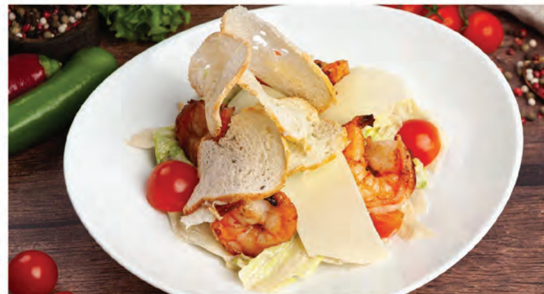
КЛАССИЧЕСКИЙ ЦЕЗАРЬ с курицей 230г / 590₽ КЛАССИЧЕСКИЙ ЦЕЗАРЬ с креветками 200г / 750₽