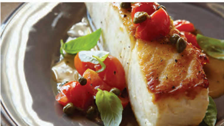
СТЕЙК из мурманского палтуса 220/50г / 1190₽