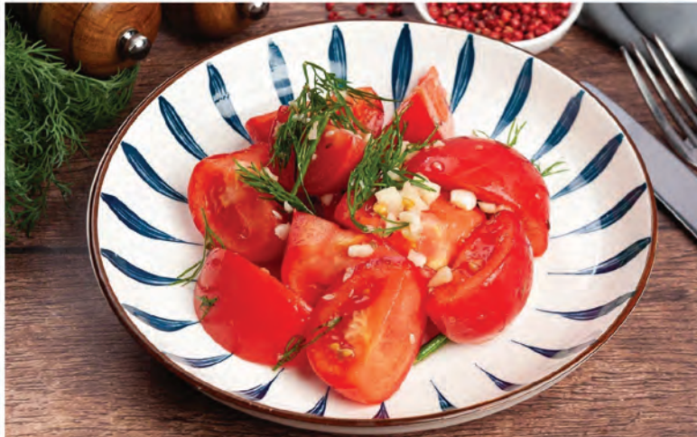
ПОМИДОРЫ КРАСНЫЕ МАЛОСОЛЬНЫЕ С ЧЕСНОКОМ 300г / 450₽