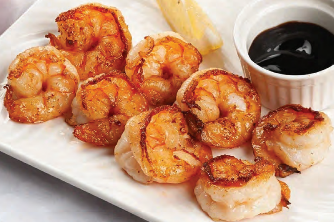
КРЕВЕТКИ жареные с чесноком 150/50г / 990₽