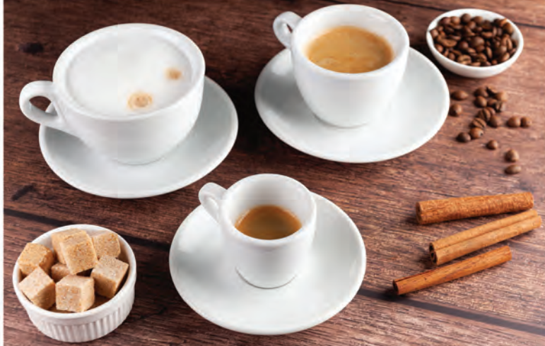
КОФЕ ЭСПРЕССО 30мл / 200₽ КОФЕ АМЕРИКАНО 100мл / 200₽ КОФЕ КАПУЧИНО 200мл / 250₽