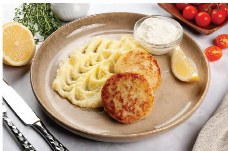
КОТЛЕТЫ ЩУЧЬИ 150/150г/ 690₽