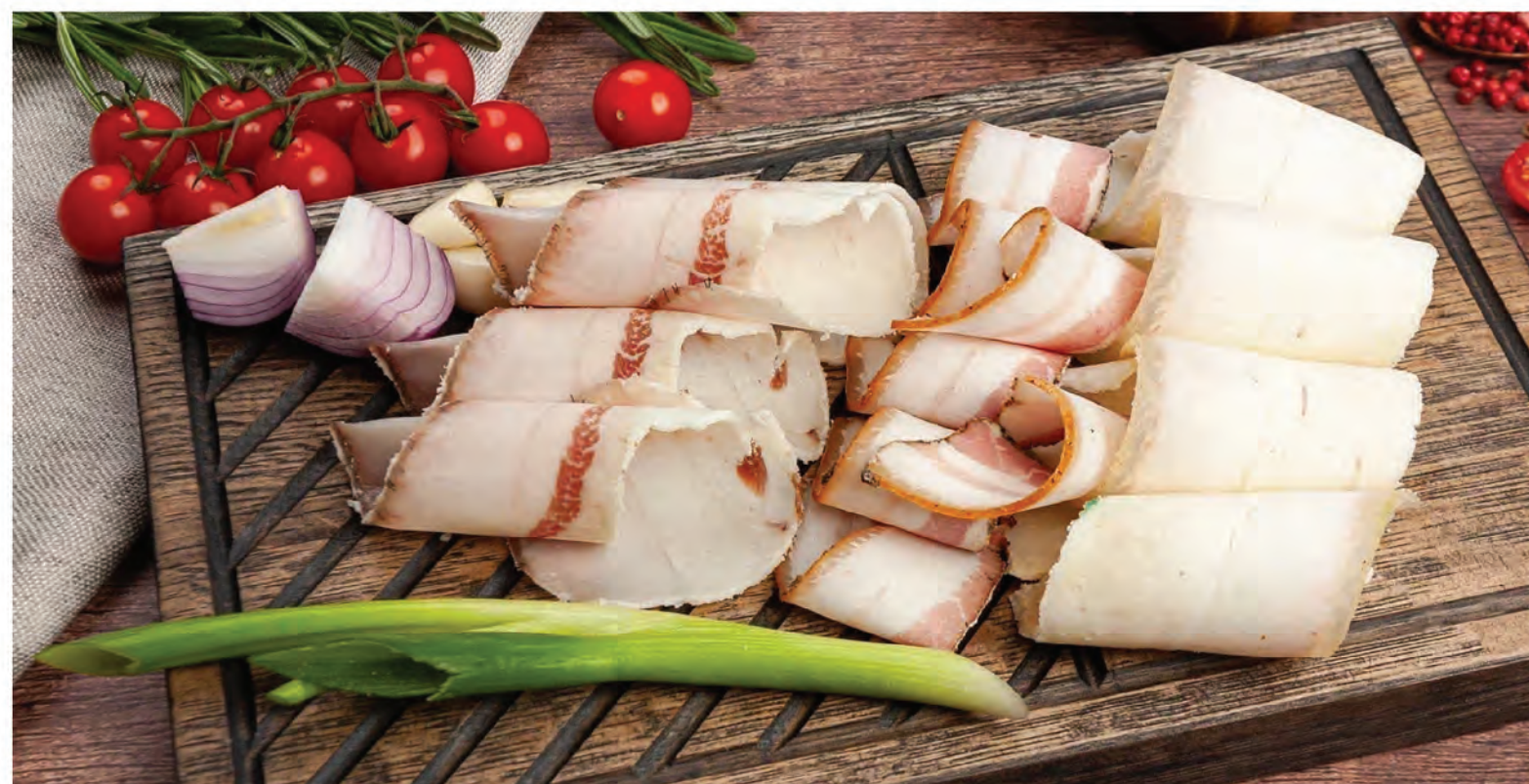
САЛО ДЕРЕВЕНСКОЕ С МОРОЗА ТРЕХ ВИДОВ