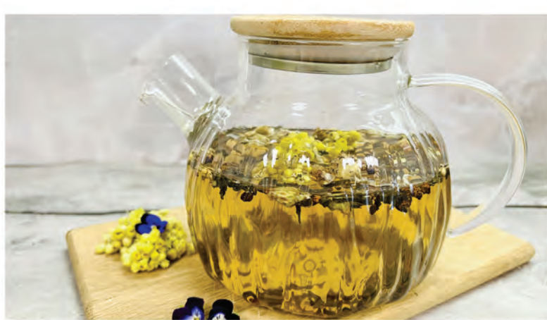
ТРАВЯНОЙ чай с кипреем и васильками 1000мл / 450₽