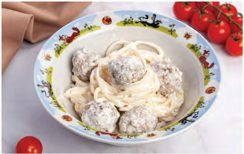
ТЕФТЕЛЬКИ С ЛАПШОЙ и сливочным соусом 250г / 390Р