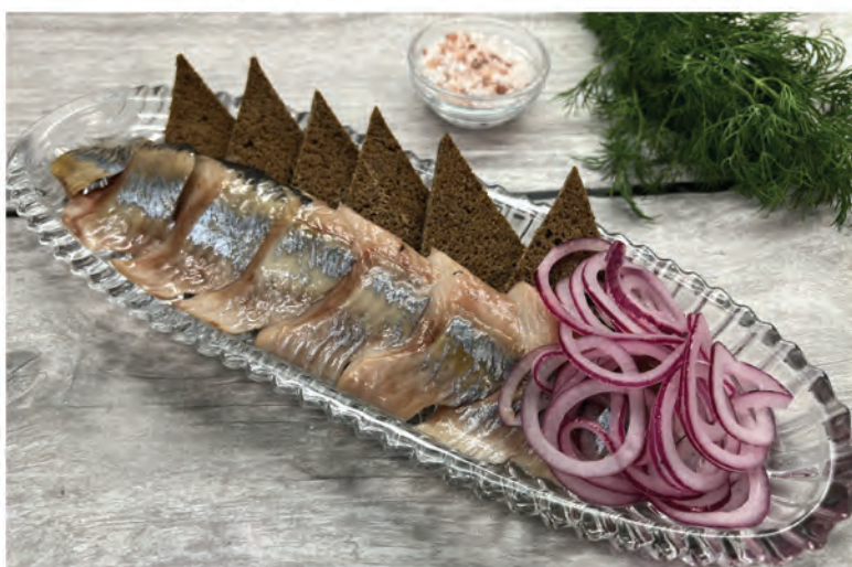
БОЧКОВАЯ СЕЛЬДЬ с красным луком и хрустящим бородинским хлебом