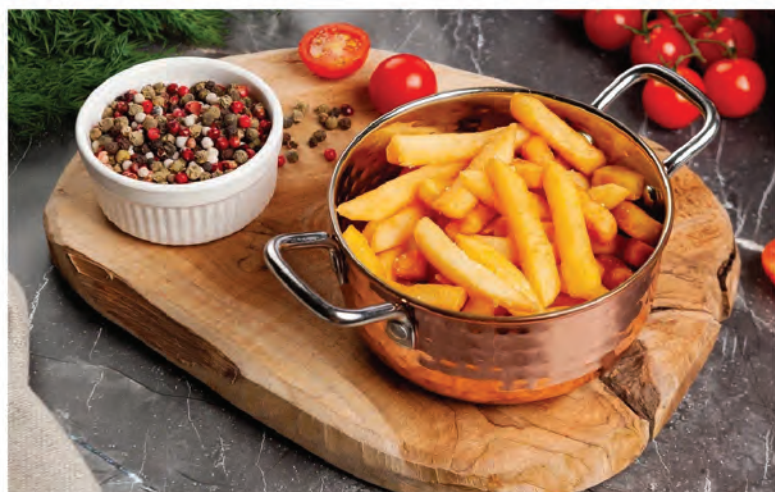
КАРТОФЕЛЬ ФРИ 200г / 200₽