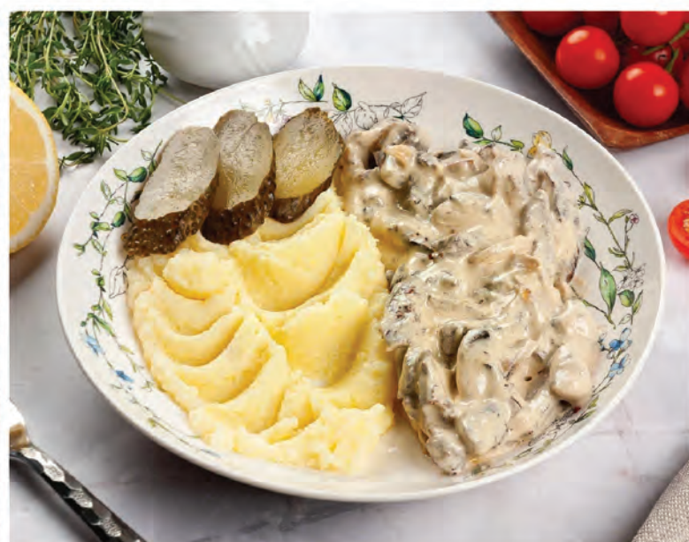
БЕФСТРОГАНОВ с грибами и картофельным пюре 160/150г/40г/ 790₽