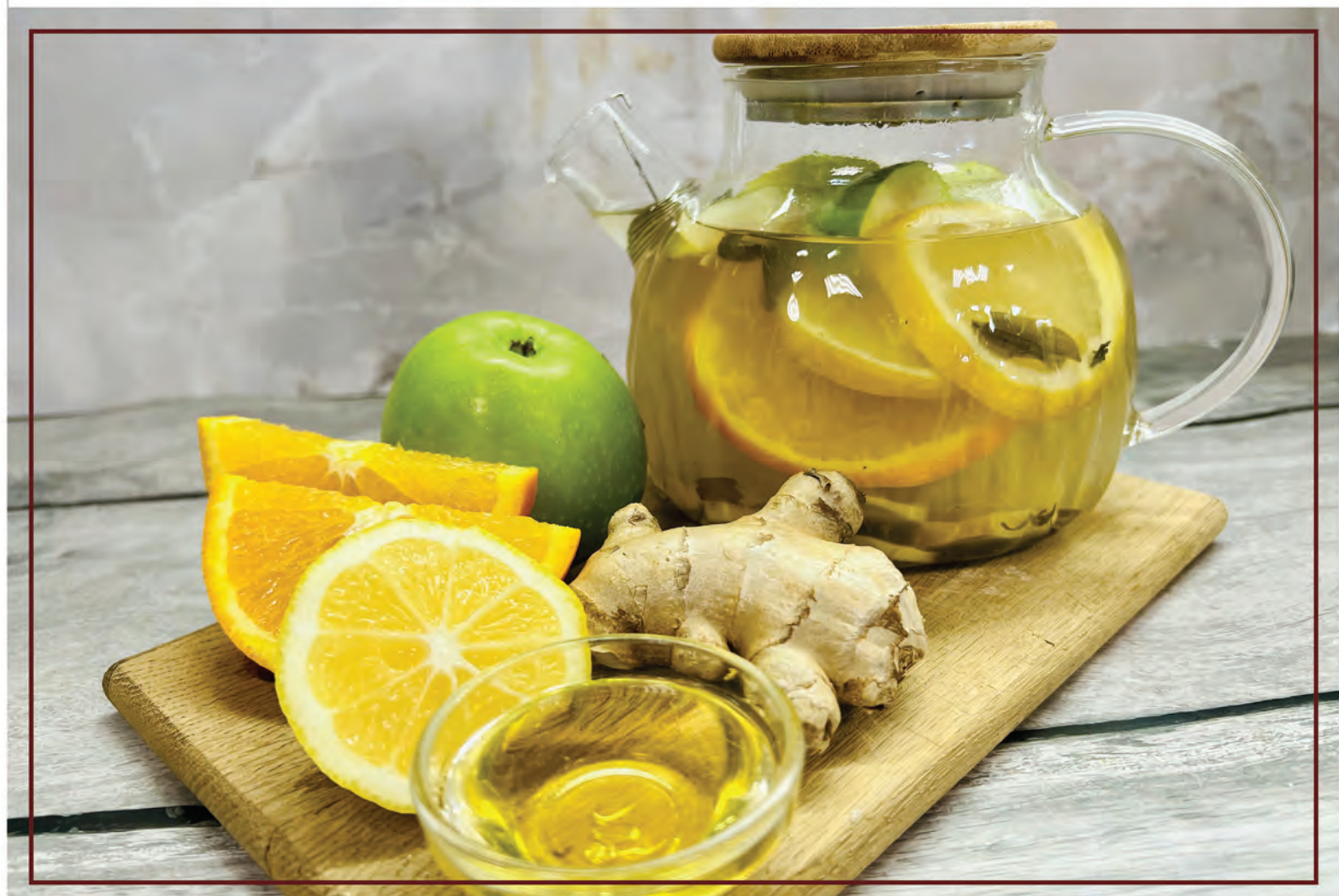
СОГРЕВАЮЩИЙ имбирь, апельсин, яблоко, мед, лимон, зеленый чай 1000мл / 690₽