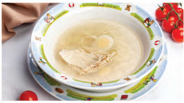
СУПЧИК «КУРОЧКА РЯБА» 250г / 250Р