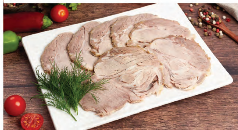
БУЖЕНИНА ЗАПЕЧЕННАЯ В ПРЯНОМ МАРИНАДЕ