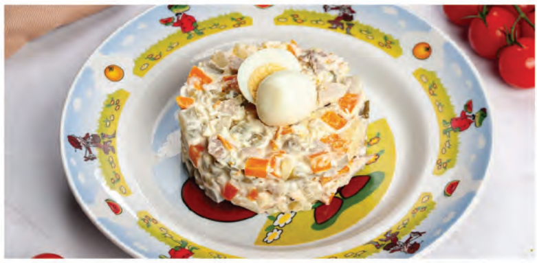
ОЛИВЬЕ С КОЛБАСКОЙ 180г / 290Р