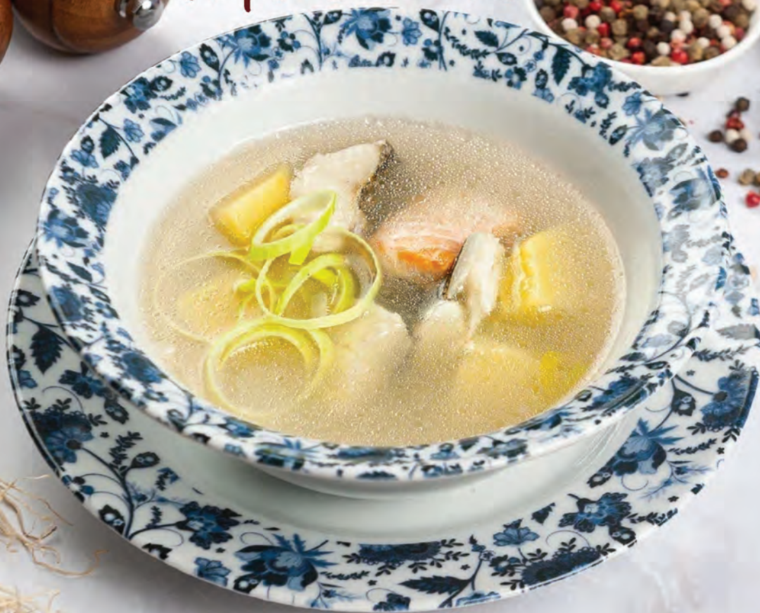
УХА ЦАРСКАЯ 250г / 590₽