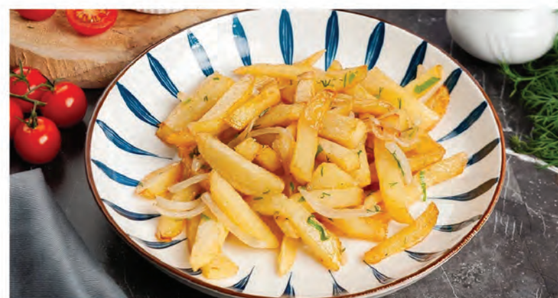
КАРТОФЕЛЬ ПО-ДОМАШНЕМУ 200г / 200₽