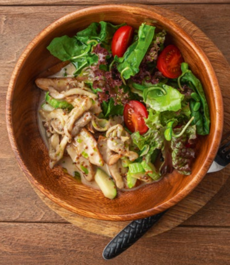
ТЁПЛЫЙ САЛАТ С ИНДЕЙКОЙ