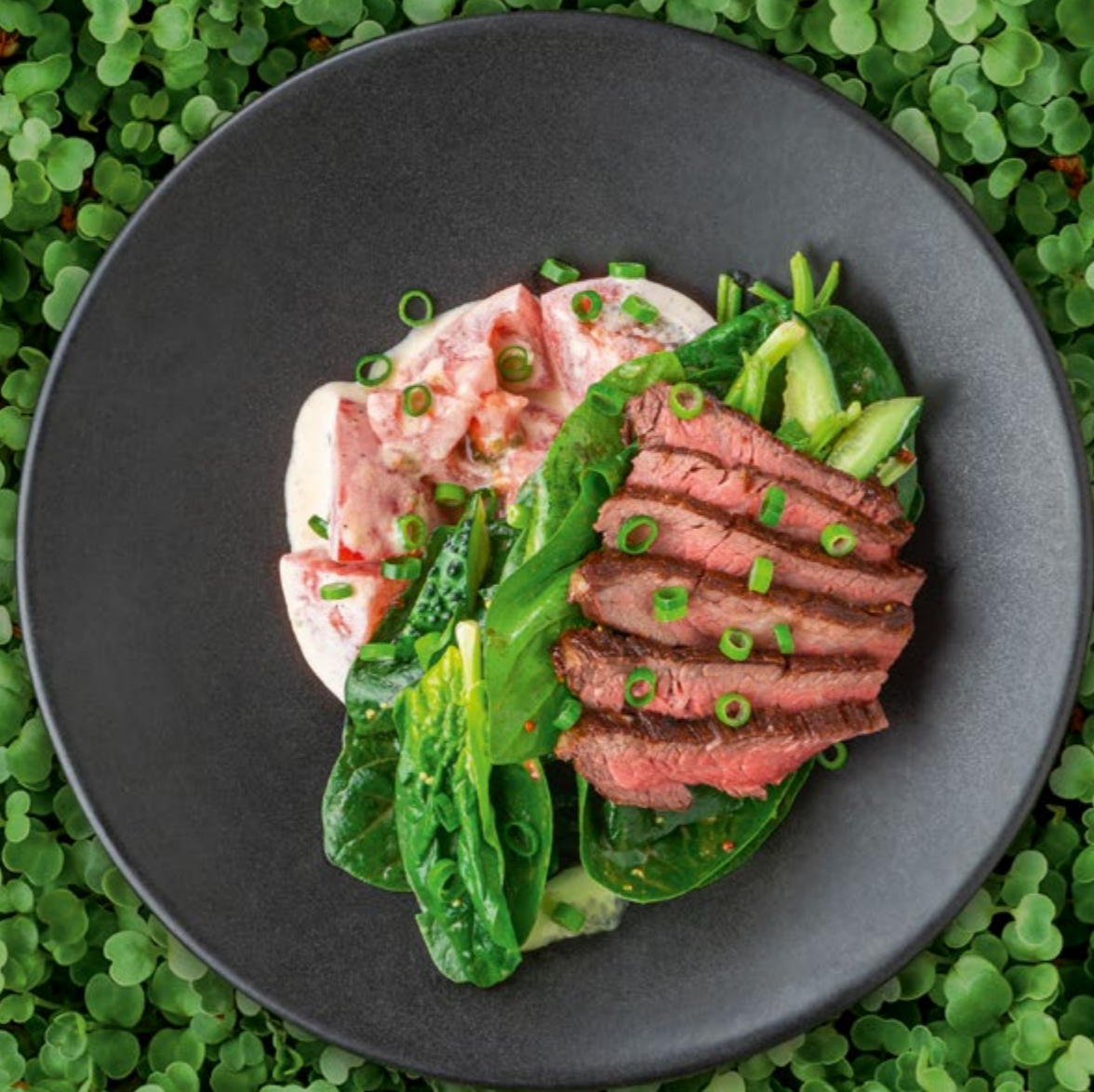
СТЕЙК-САЛАТ С РОСТБИФОМ ИЗ МРАМОРНОЙ ГОВЯДИНЫ 490