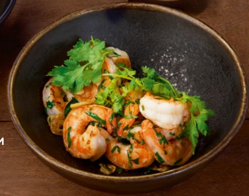
ЖАРЕННЫЕ КРЕВЕТКИ С ЧЕСНОКОМ И ЗЕЛЕНЬЮ