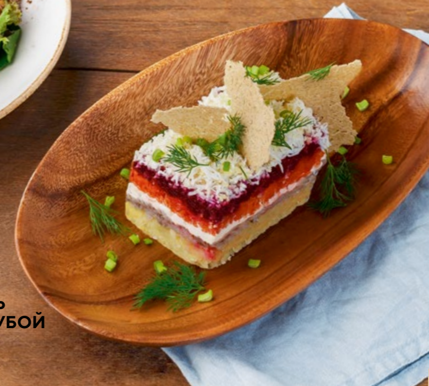
СЕЛЬДЬ ПОД ШУБОЙ 280