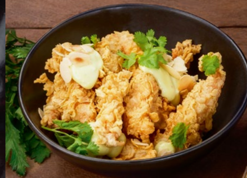
ХРУСТЯЩИЕ ТИГРОВЫЕ КРЕВЕТКИ ВАСАБИ