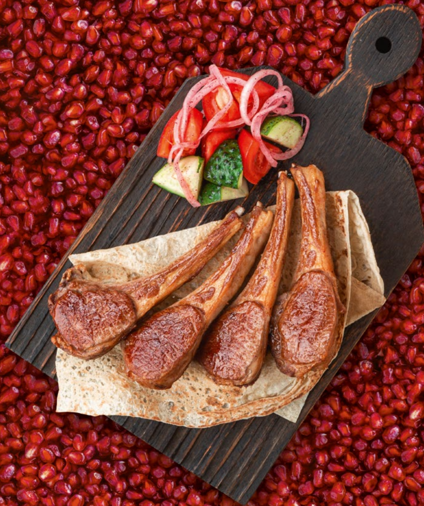
ШАШЛЫК ИЗ КОРЕЙКИ ЯГНЁНКА