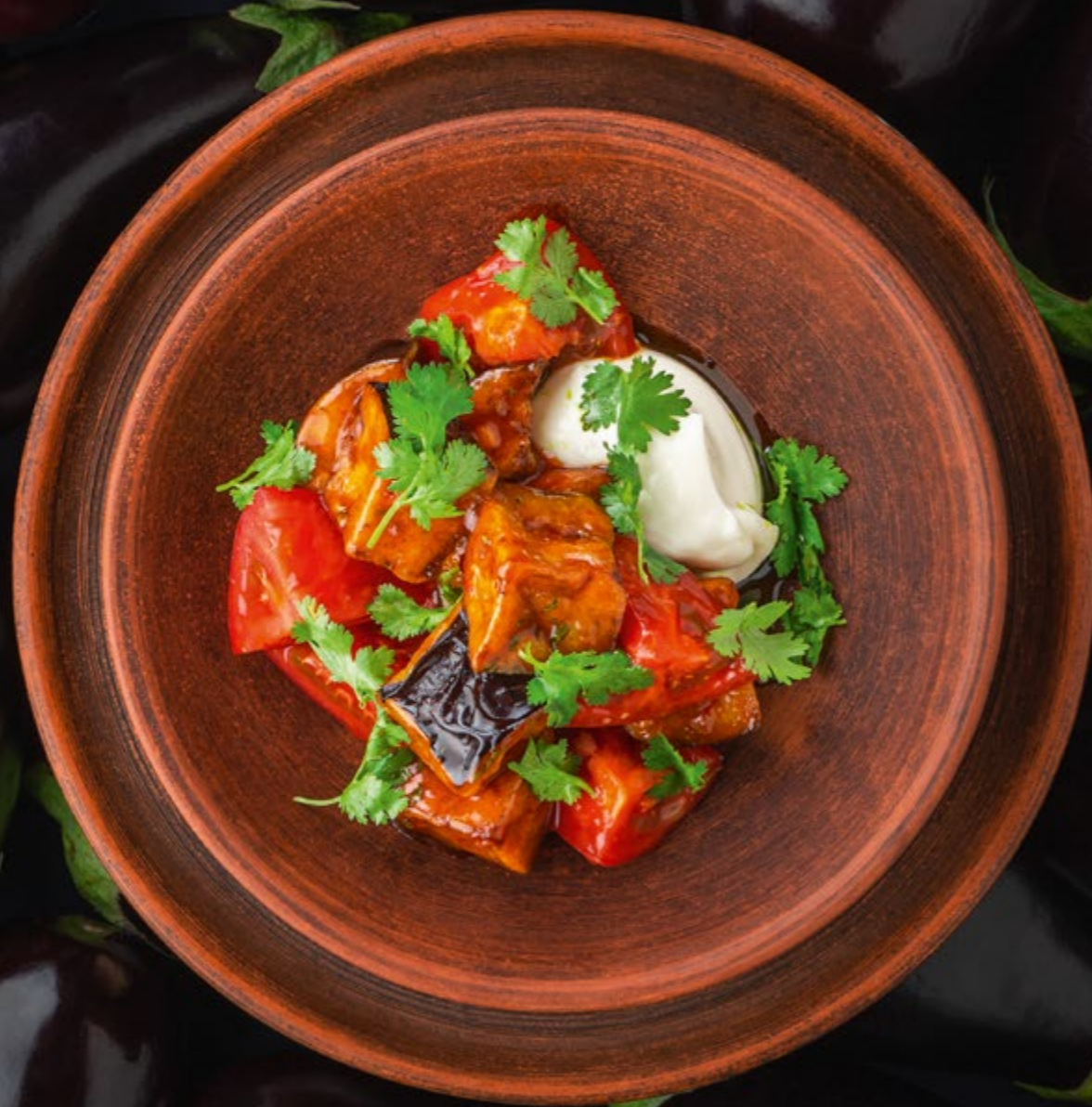
БАКЛАЖАНЫ В УСТРИЧНОМ СОУСЕ С КРЕМОМ ИЗ СЫРА ФЕТА