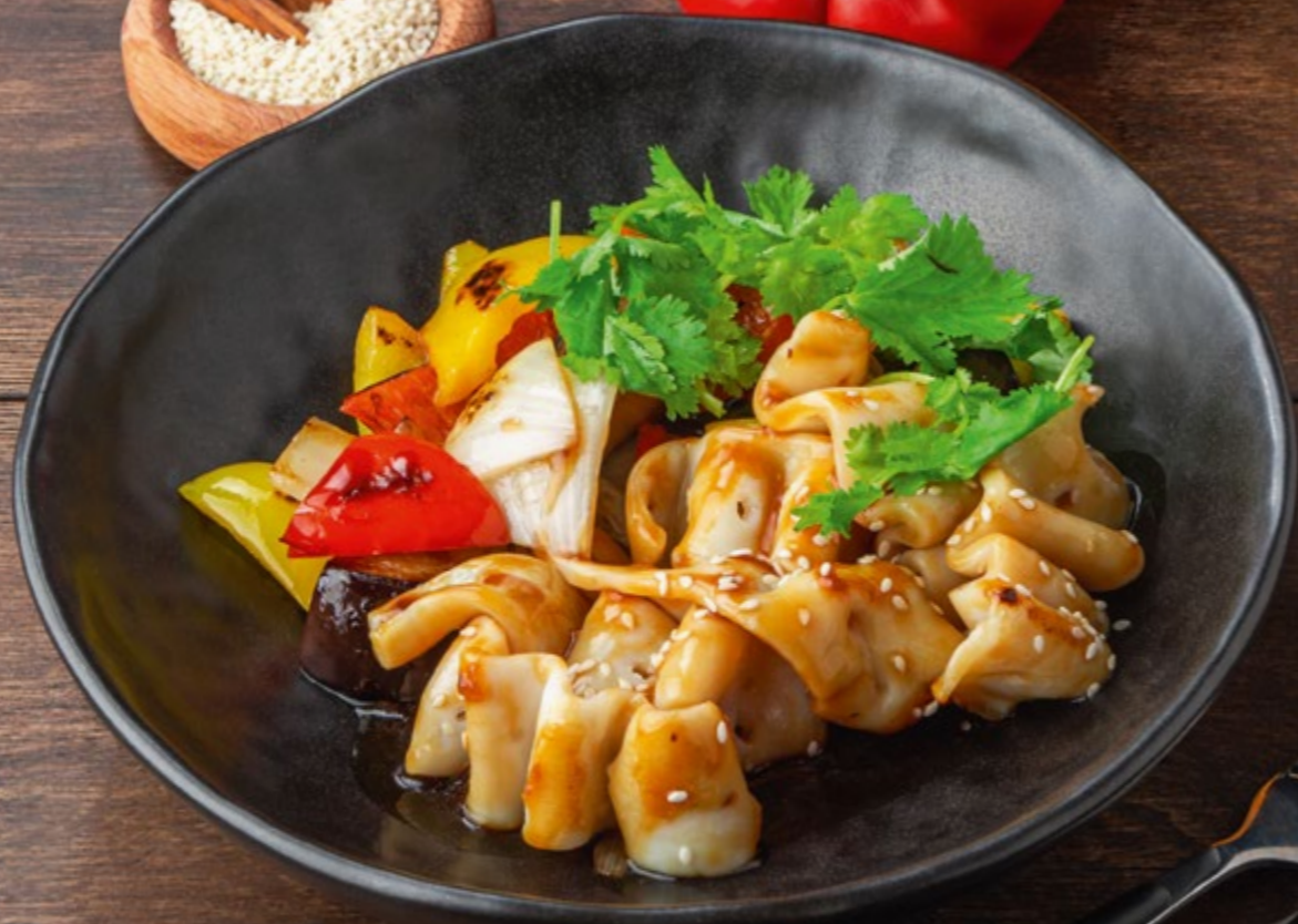
КАЛЬМАРЫ ТЕРИЯКИ С ОВОЩНЫМ РАТАТУЕМ