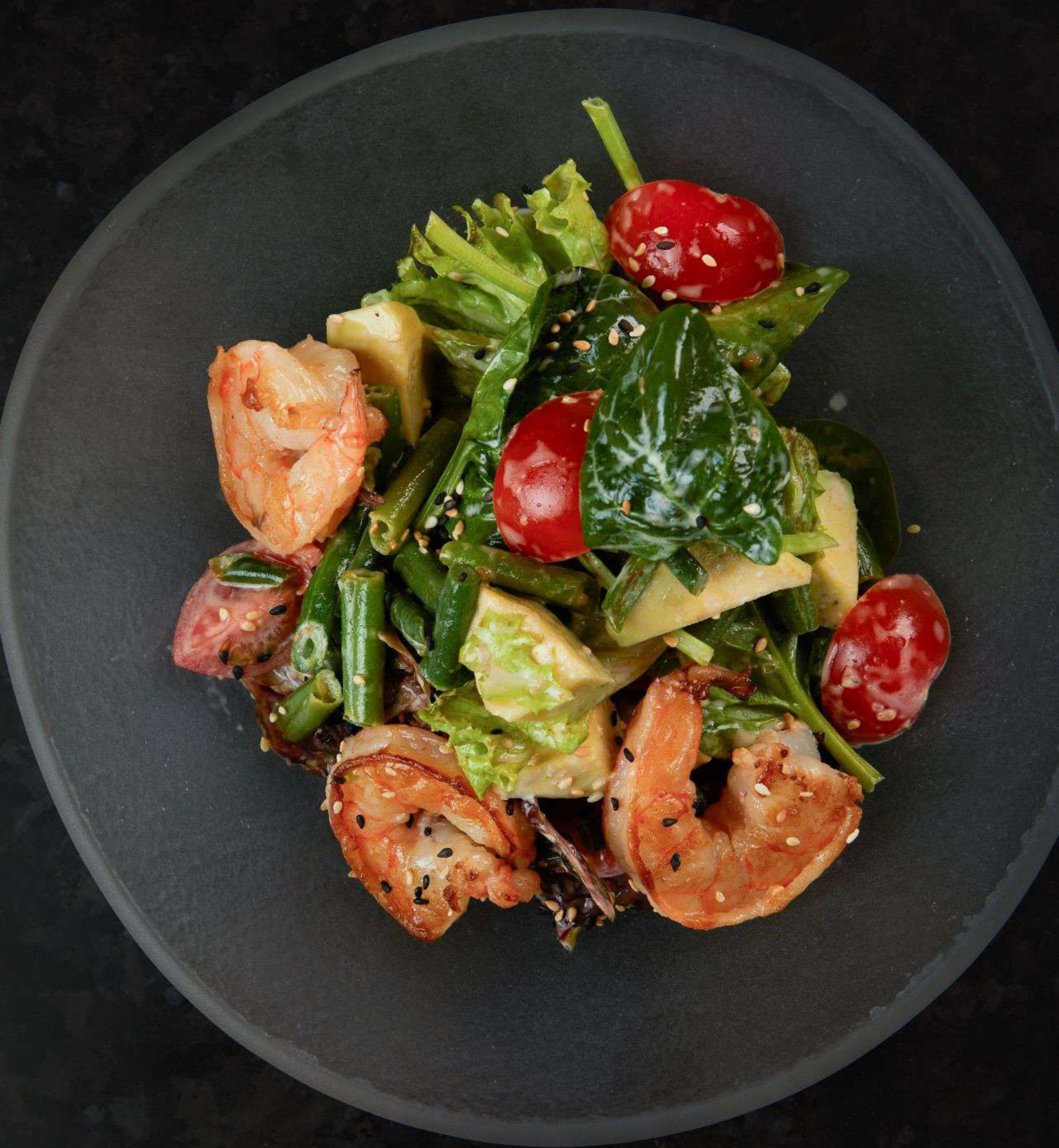
Салат с креветками и ореховым соусом 650р