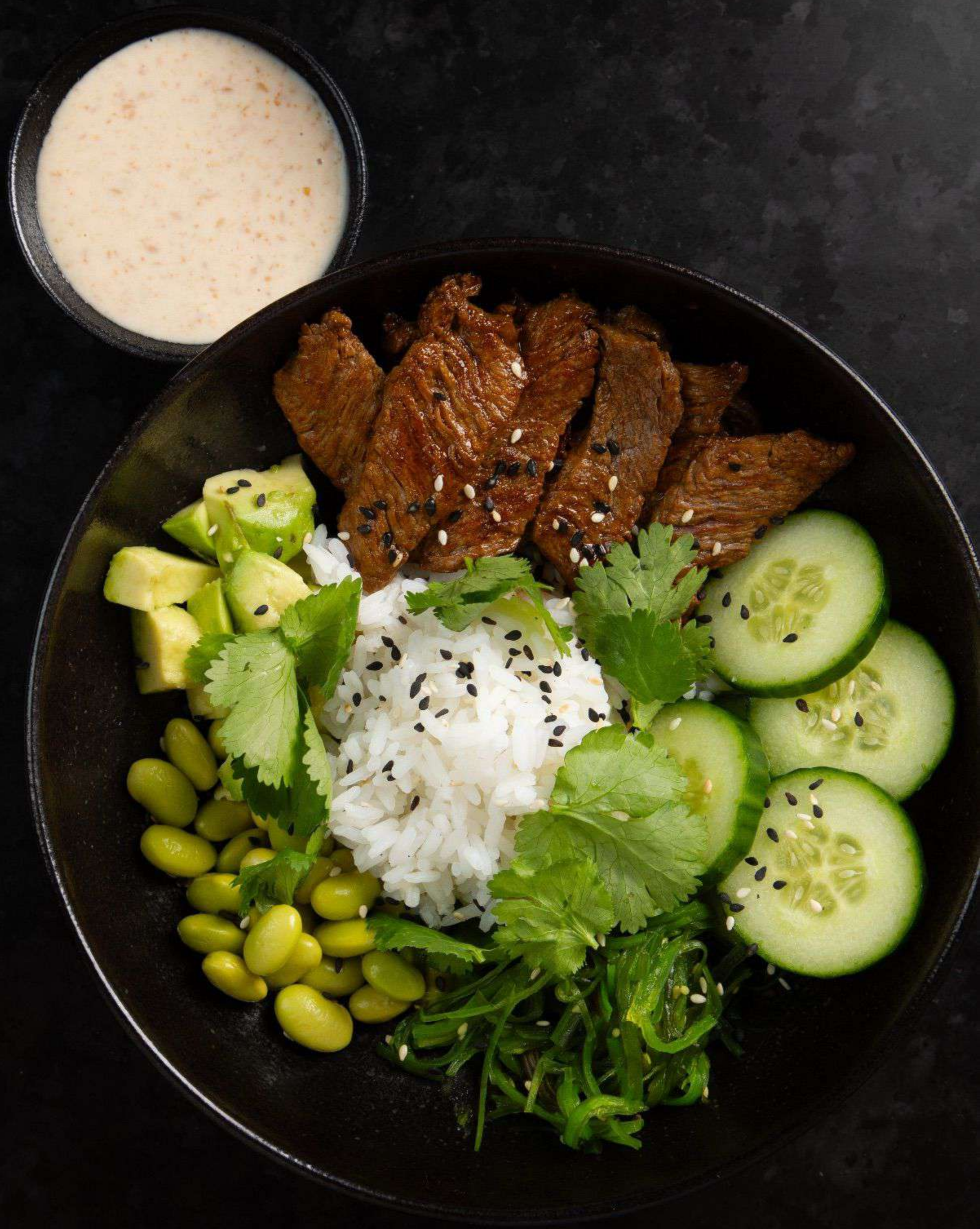
Боул с говядиной 780р