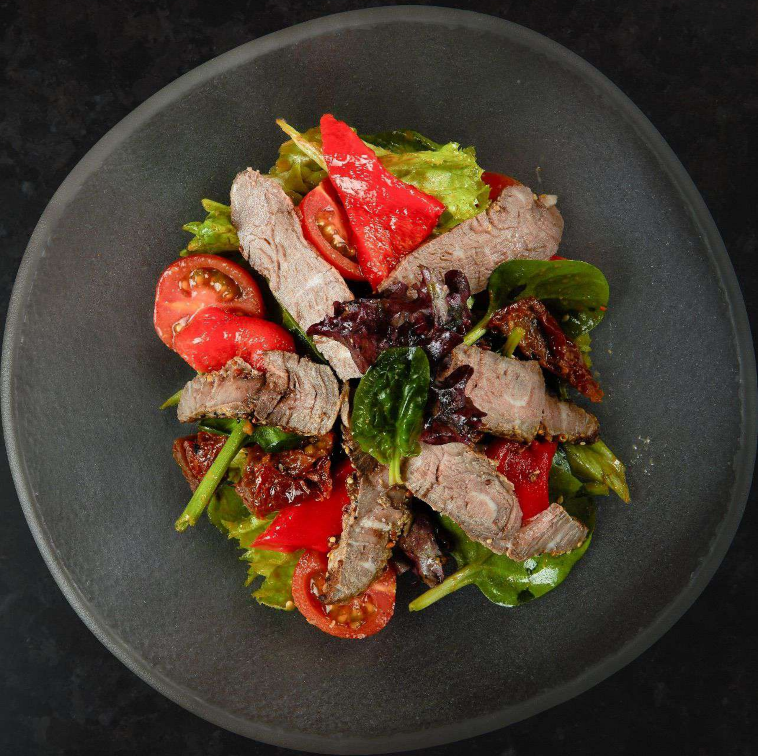
Салат с ростбифом и кунжутной заправкой 590р