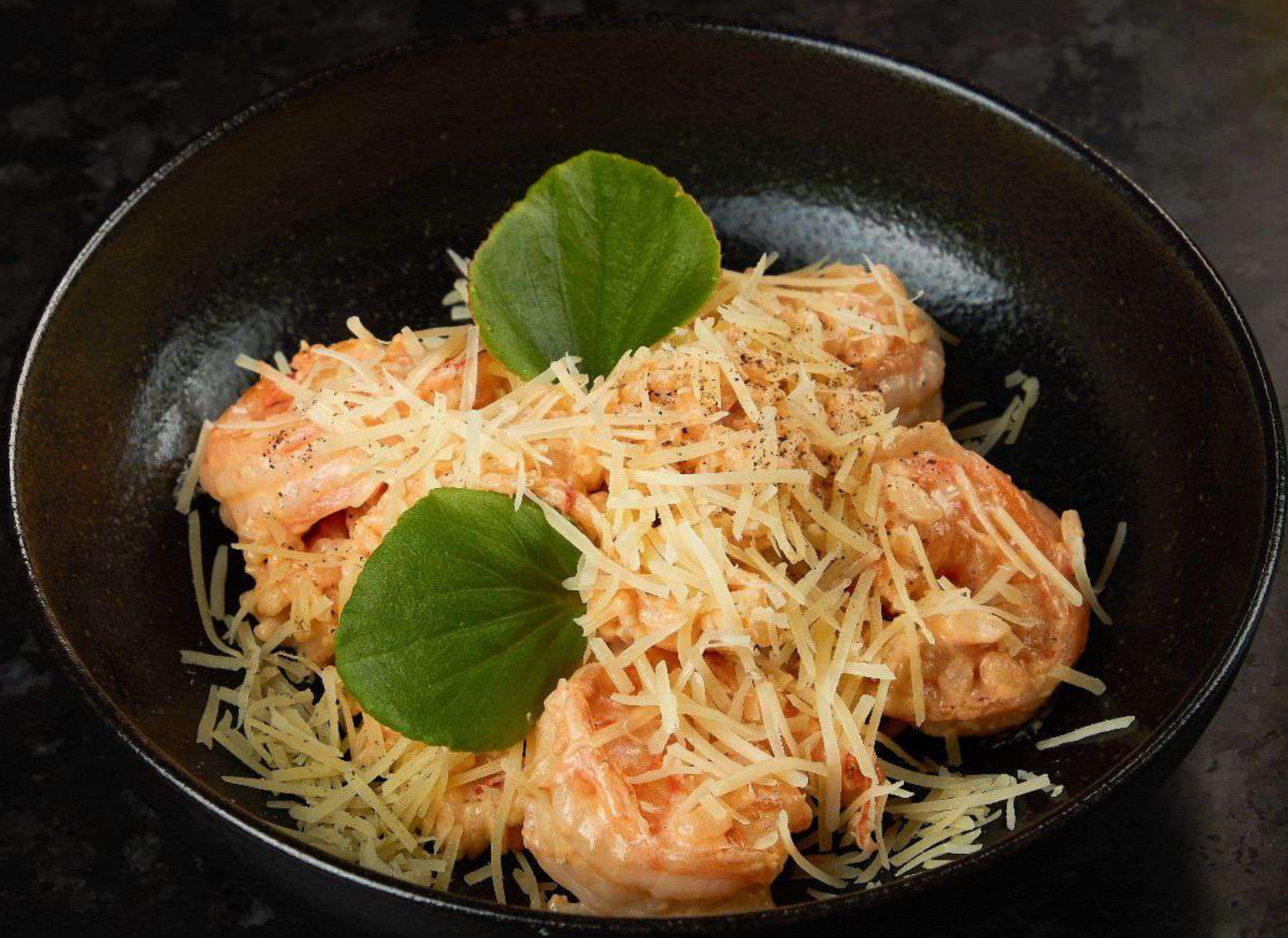
Ризотто с креветками 670р