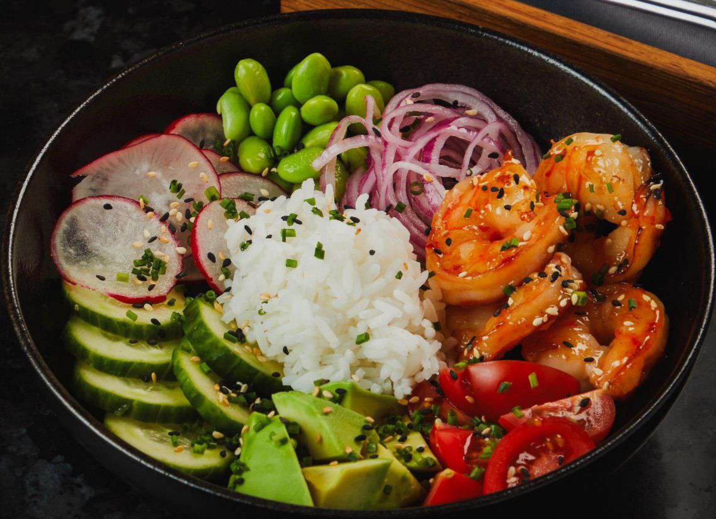
Боул с креветками 680p