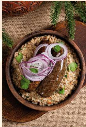
КУПАТЫ ИЗ КУРИНЫХ ПОТРОШКОВ С ГРЕЧНЕВЫМ РИЗОТТО