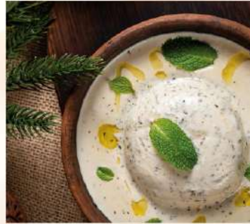
ТЕПЛЫЙ РУЛЕТ ИЗ СУЛУГУНИ В МОЛОЧНОМ СОУСЕ С ГОРНОЙ МЯТОЙ