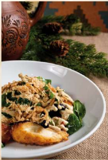
САЛАТ С ЖАРЕННЫМ СУЛУГУНИ, КУРИНОЙ ПЕЧЕНЬЮ И СОУСОМ КАРРИ