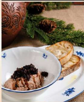
ГУСИНЫЙ ПАШТЕТ С ГРИБНЫМ ДЮКСЕЛЕМ