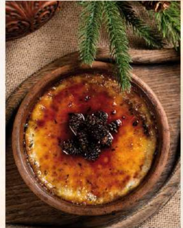
ЗАПЕЧЕННЫЙ СУЛУГУНИ С ВАРЕНЬЕМ ИЗ ЕЛОВЫХ ШИШЕК