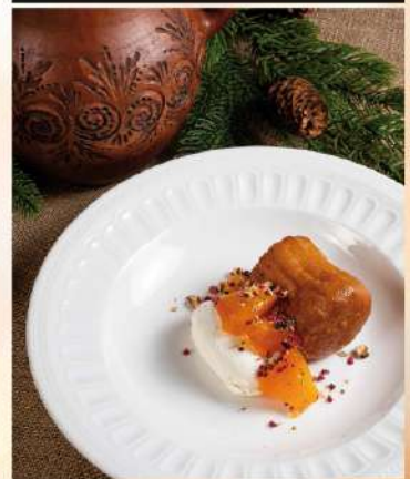
МИНДАЛЬНАЯ БАБА СО СЛИВОЧНЫМ КРЕМОМ