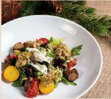
САЛАТ С ЯЗЫЧКАМИ ЯГНЁНКА С ДЖОНДЖОЛИ И СОУСОМ ИЗ ПЕЧЕНИ ТРЕСКИ