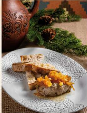
ПАШТЕТ ИЗ ГРИБОВ С КУМКВАТОМ