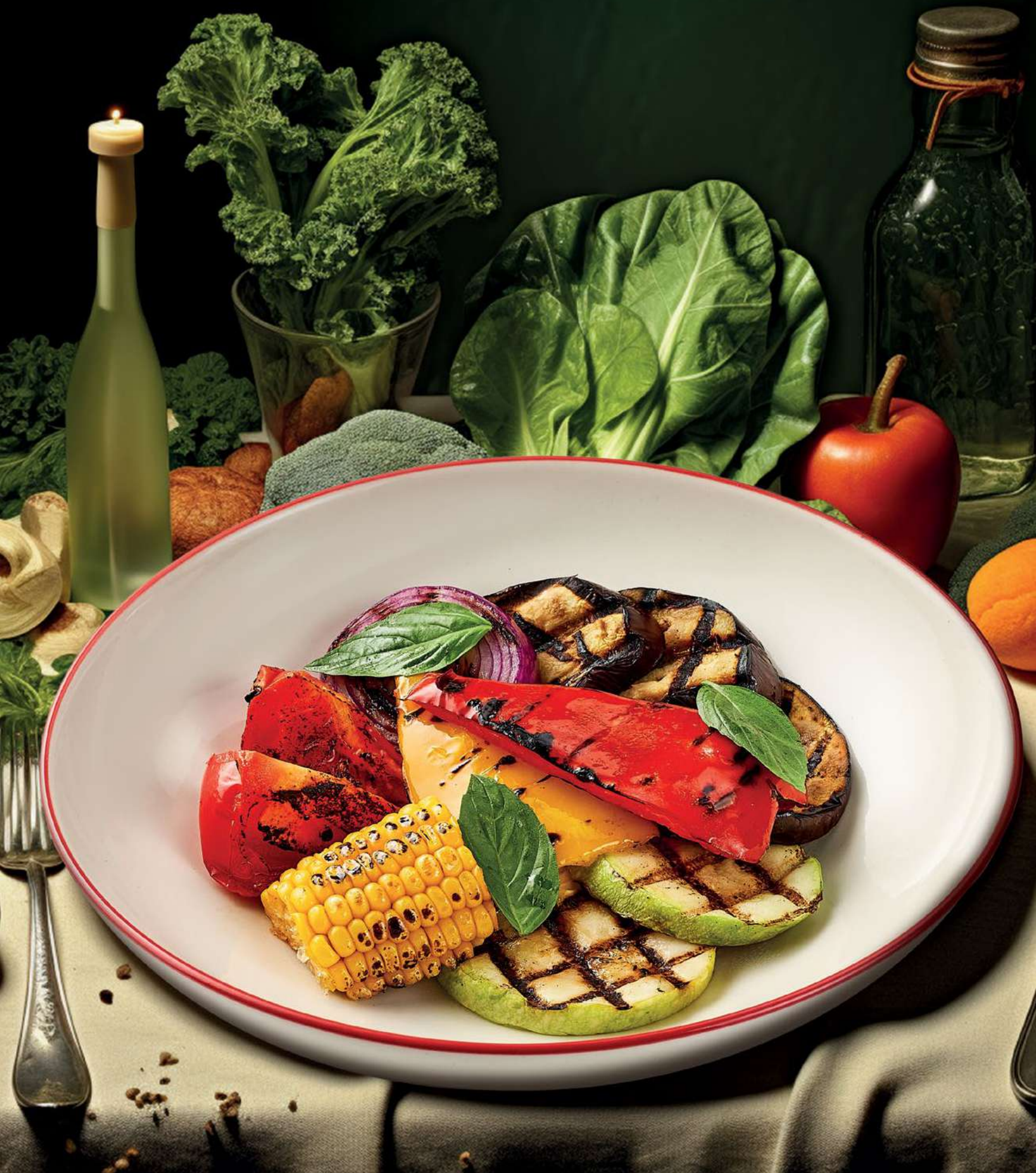
ГАРНИРЫ / SIDE DISHES