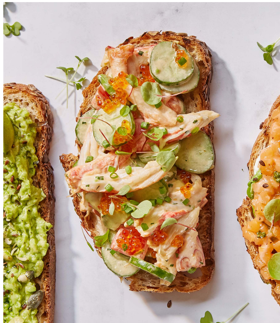
С камчатским крабом, авокадо и спелыми томатами 1200 ₺ (175 г)