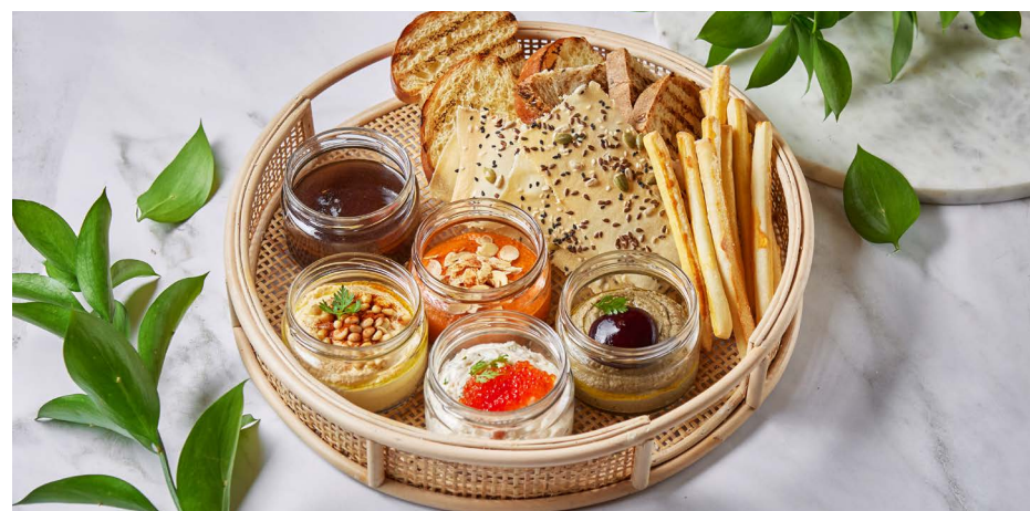
Ассорти мезе (паштет из печени кролика, хумус, крем из печеного перца и миндаля, крем из лосося с красной икрой, паста тапенад из маслин и анчоусов) 1900 ₺ (700 г)