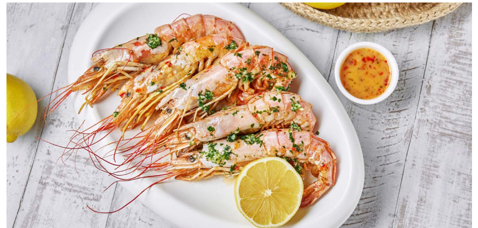
Аргентинские креветки на гриле 6500 ₺ (700 г)