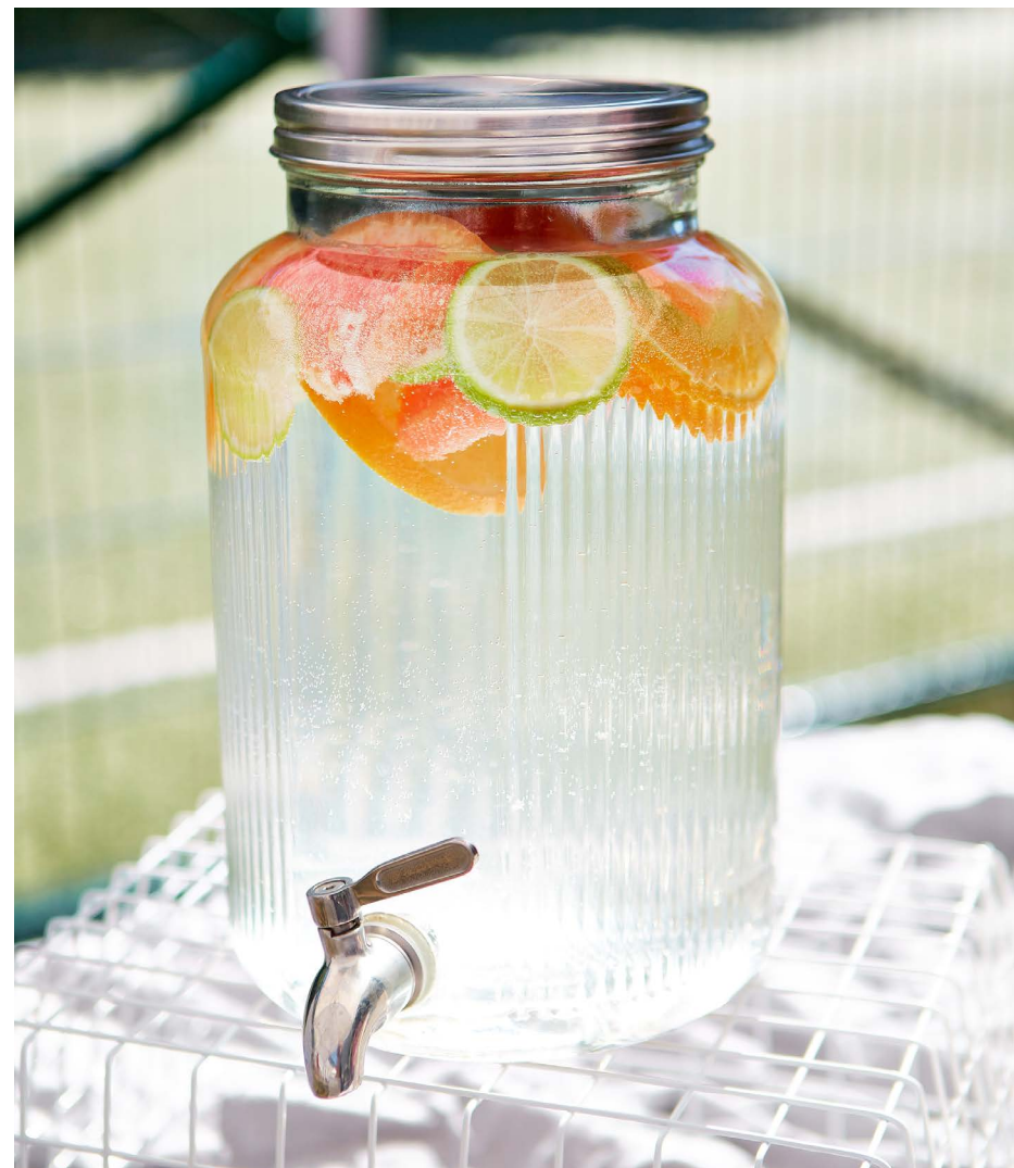
Цитрусовая детокс-вода (грейпфрут, апельсин, лимон, лайм) 550 ₹ (1000 мл)