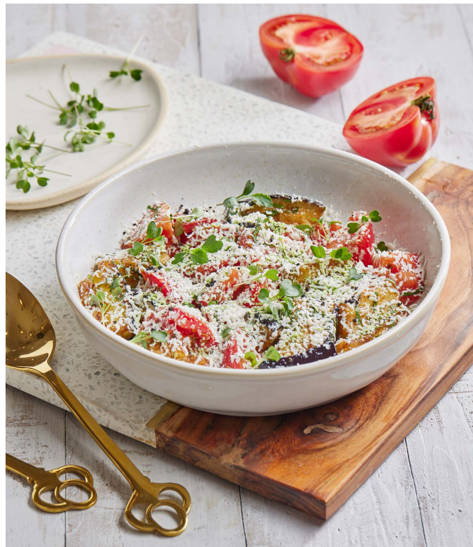
Жареный баклажан с томатами и сыром фета 1150 ₺ (330 г)