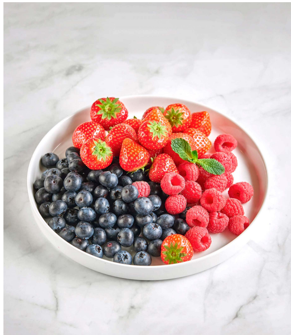
Ягодная ваза (клубника, малина, голубика) 3900 ₺ (500 г)