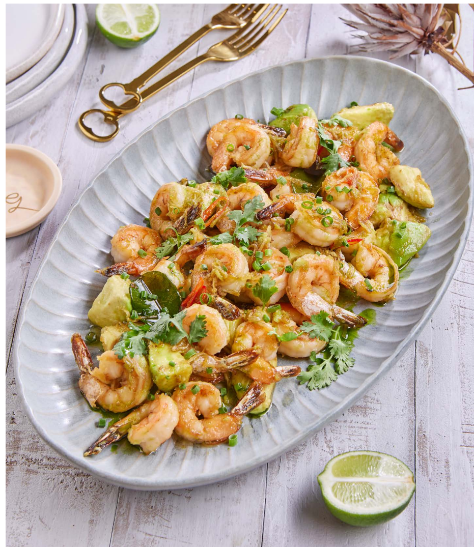
Креветки имбирные с жареным авокадо на 5-7 персон 4500 ₽ (800 г)