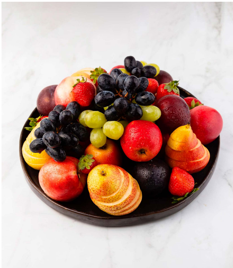
Фруктовая ваза (сезонные фрукты) 2700 ₺ (1900 г)