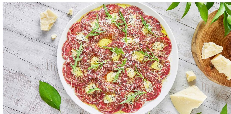
Карпаччо из говядины с горгонзолой 2400 ₺ (240 г)