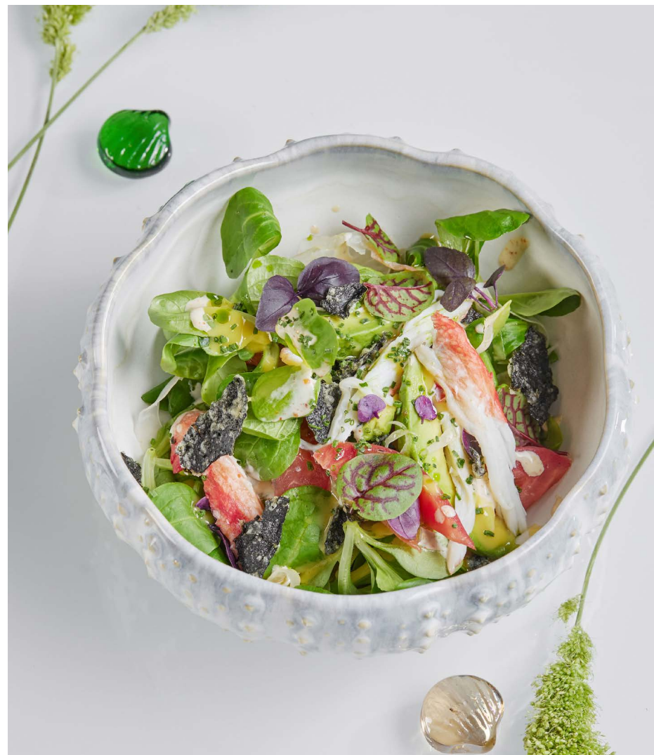
Салат с крабом и соусом манго 1650 ₺ (195 г)