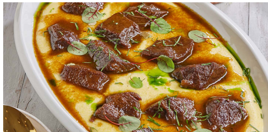
Томленая говядина с кремом полента, на 6-8 персон 11500 ₽ (1900 г)