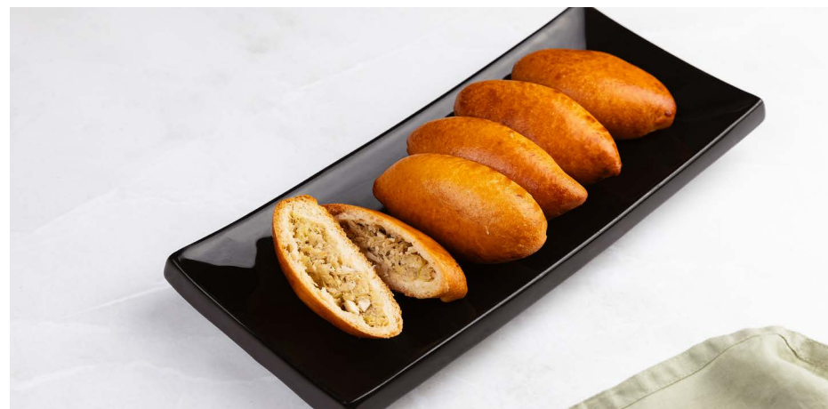
Пирожок с молодой капустой и яйцом 150 ₺ (40 г)