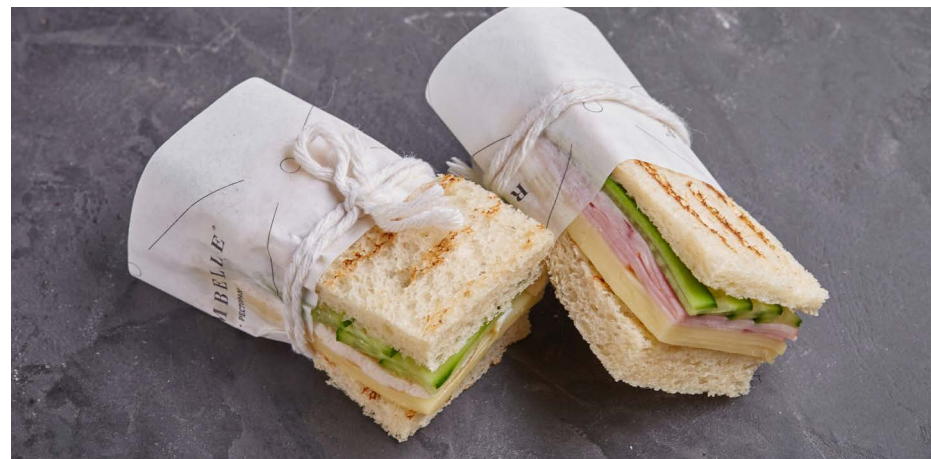
Сэндвич с куриным филе (цена указана за 5 порций) 900 ₽ (325 г)