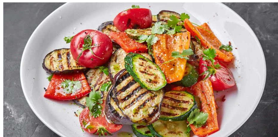
Овощи гриль 550 ₺ (150 г)