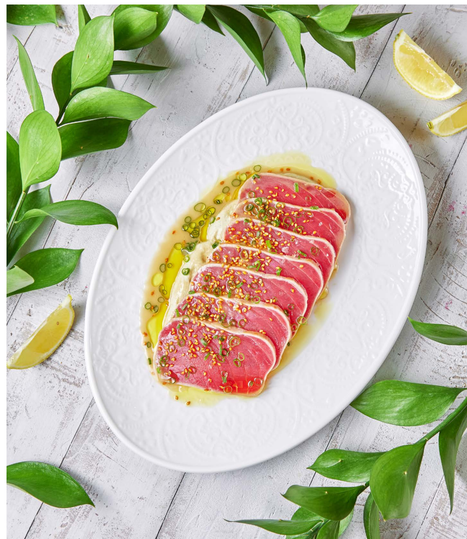
Татаки из тунца с кремом из баклажанов 2200 ₺ (270 г)