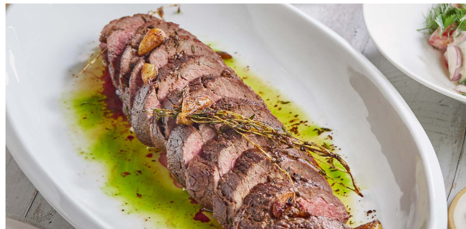
Жареная говяжья вырезка с домашним салатом, на 6-8 персон 14500 ₽ (1850 г)