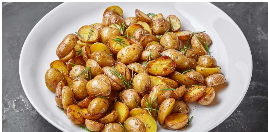
Мини-картофель с розмарином 350 ₺ (150 г)