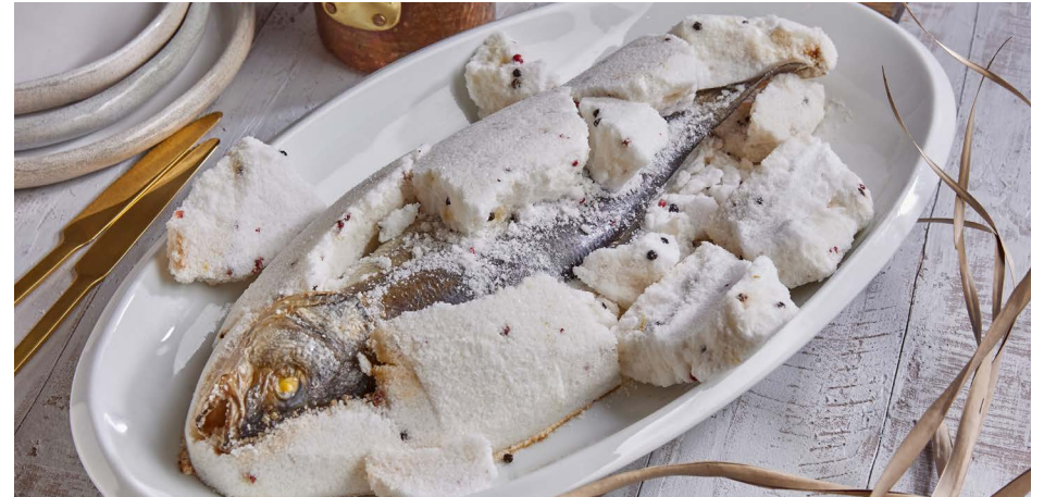
Сибас, запеченный в соляном панцире, на 3-4 персоны 8500 ₺ (1200 г)