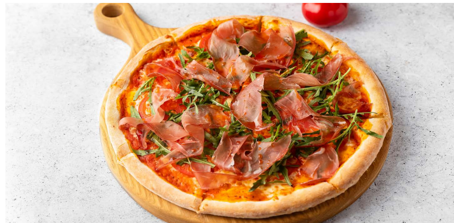
С пармой и руколой 890 ₽ (415 г)