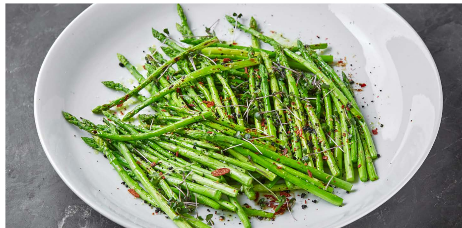
Спаржа на гриле/на пару 950 ₺ (100 г)