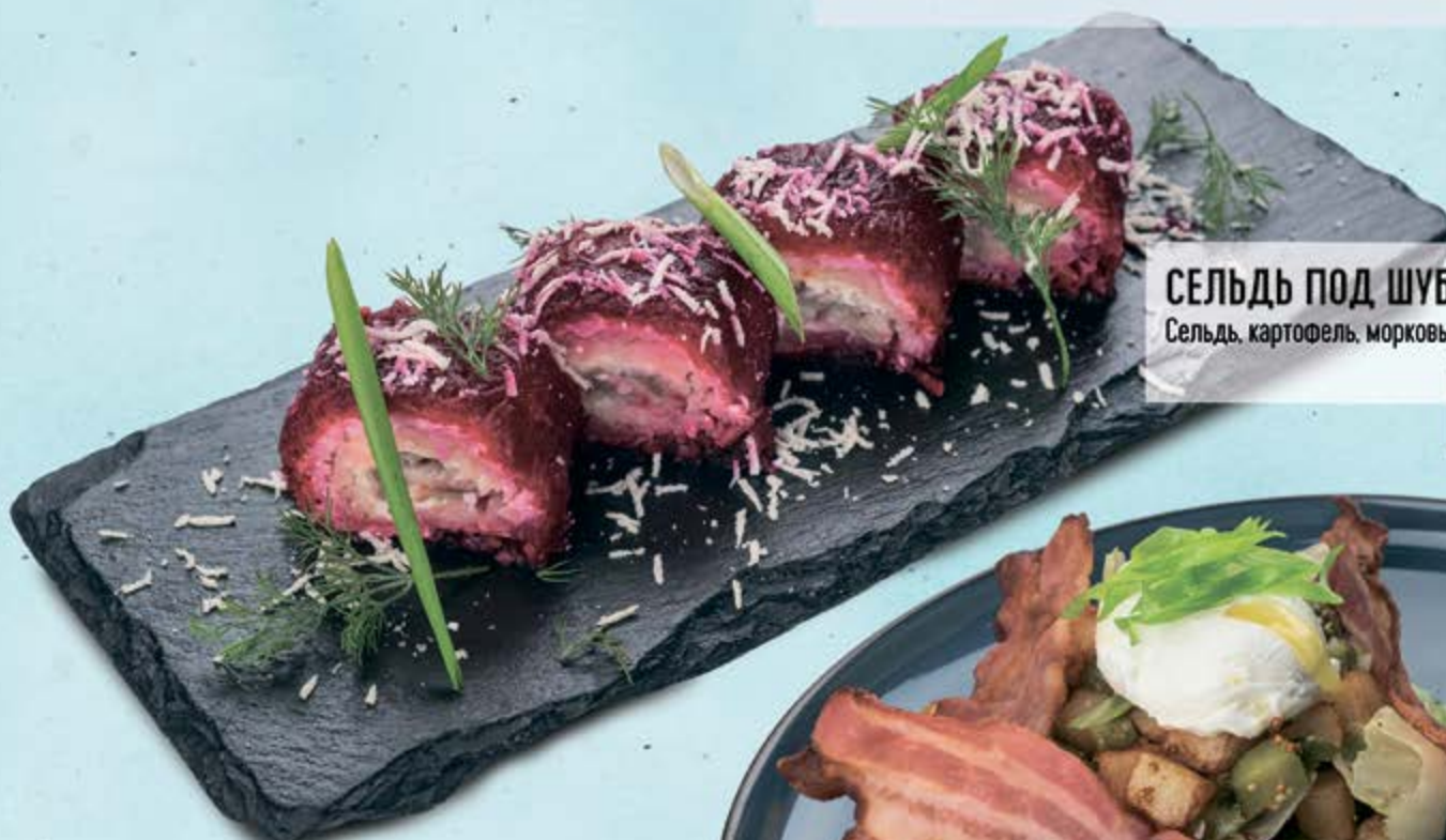
СЕЛЬДЬ ПОД ШУБОЙ В РОЛЛАХ Сельдь, картофель, морковь, свёкла, майонез, яйцо