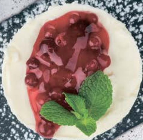
ЧИЗ ОТ ШЕФА С БРУСНИЧНЫМ ДЖЕМОМ