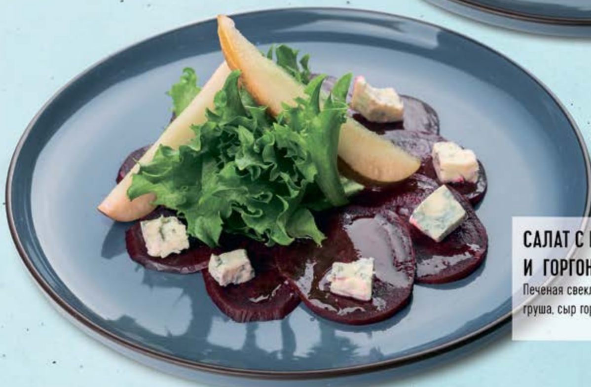
САЛАТ С ПЕЧЁНОЙ СВЁКЛОЙ И ГОРГОНЗОЛОЙ

Печеная свекла, листья салата, маринованная груша, сыр горгонзола