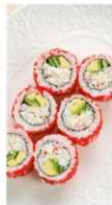
Ролл Калифорния со снежным крабом 620 | 100 г