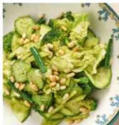
Зелёный салат свежий огурец, стручковая фасоль, яблочко, цукини, брокколи и кедровые орехи 540 | 100 г |