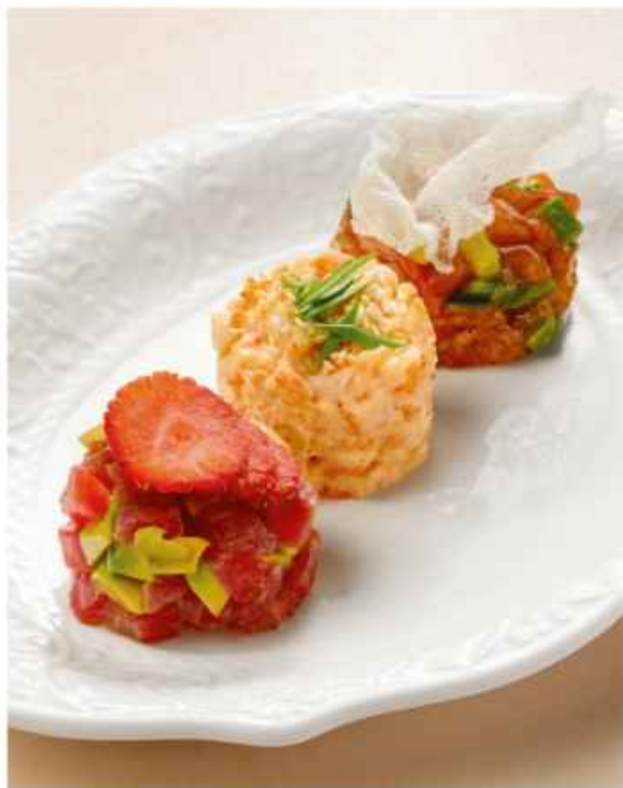
Трио тартаров тунец, креветки, лосось 890 | 100 г