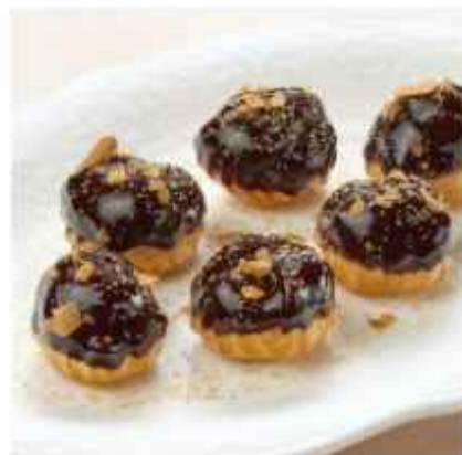
Профитроли с заварным кремом и бельгийским шokolадом 390