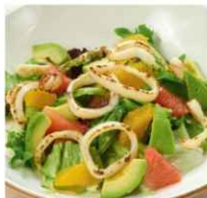
Салат с кальмаром и цитрусами авокадо, апельсин, грейпфрут и жемчужная заправка 690 | 100 г |