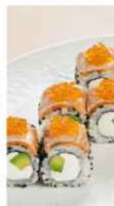
Ролл с лососем и красной икрой 690 | 200 г