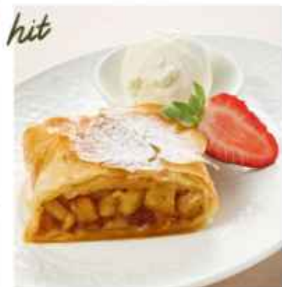
Штрудель грушевый подаётся с шариком мороженого 430