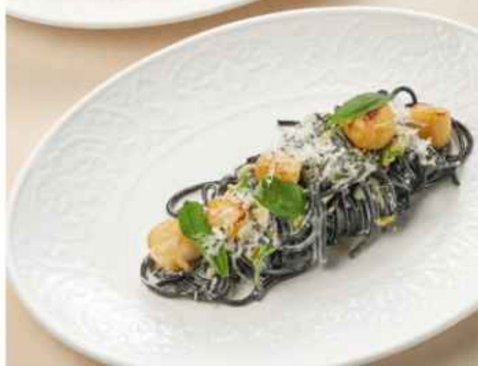
Спагетти Неро с морскими гребешками, трюфельной пастой и сыром пармезан 850 | 300 г