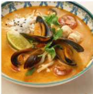
Том Ям с морепродуктами подаётся с рисом 710