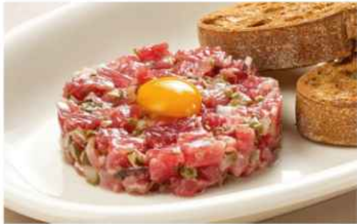
Тартар из говядины 680 | 100г