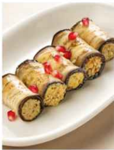
Рулетики из баклажанов 490 | 100г