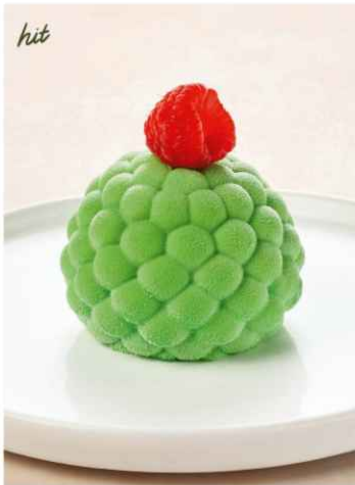
Мохито с клубникой украшается свежей малиной 420