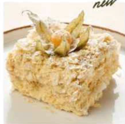
Наполеон 480 | 100г