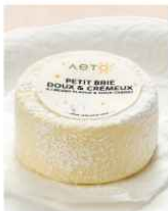
Французский сыр десерт из трёх видов сыра 580 | 100г