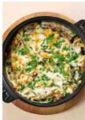
Запечённый язык под сырной корочкой с шампиньонами и луком