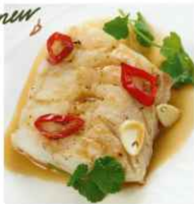
Треска, запечённая в пергаменте с перцем чили, чесноком и соусом унаги 680