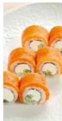
Ролл Филадельфия с нежным лососем 860 | 200 г