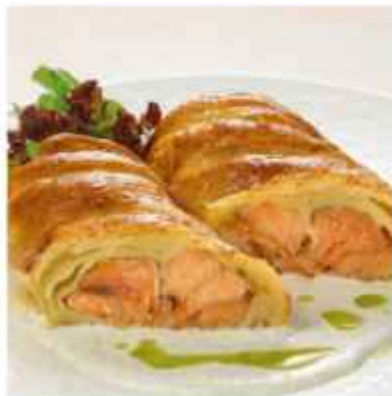
Слойка с лососем и судаком подаётся в сливочно-грифельном соусе