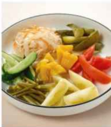
Ассорти домашних солений