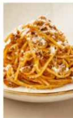
Спагетти Болоньезе с соусом мясным 470 | 300 г