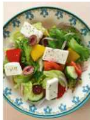
Греческий заправляется оливковым маслом, бальзамическим уксусом и сладкими 540 | 100 г |