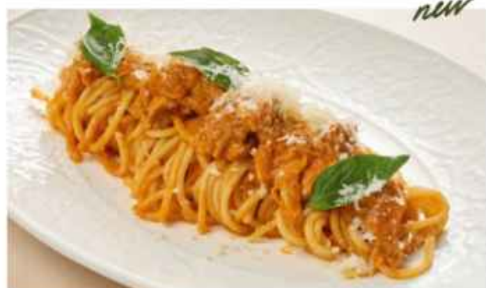
Спагетти с рагу из кролика с томатным соусом и сыром пармезан 590 | 300 г