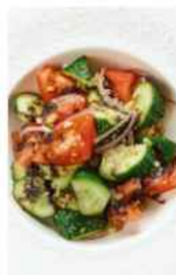
Салат по-грузински папайеус с махи-шати 450 | 100 г |