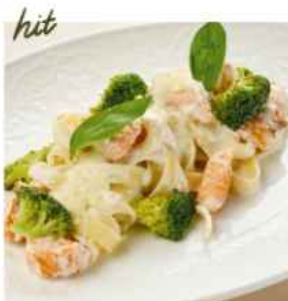
Паста с лососем и брокколи в сливочном соусе 780 | 300 г