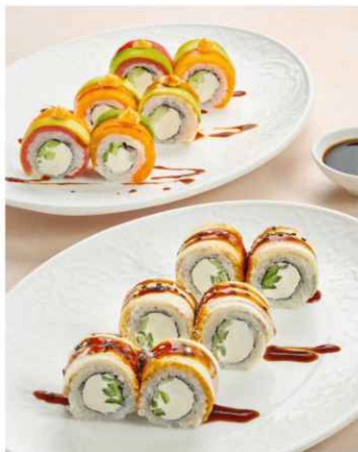
Ролл Трио с лососем, тунцом и креветкой 780 | 200 г