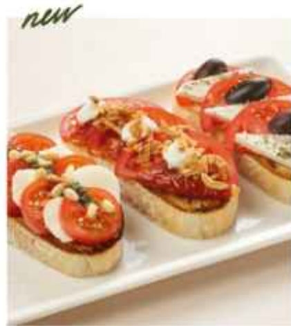
new Ассорти брускетт с томатом, моцареллой, сербской брынзой и фетой 590 | 100г