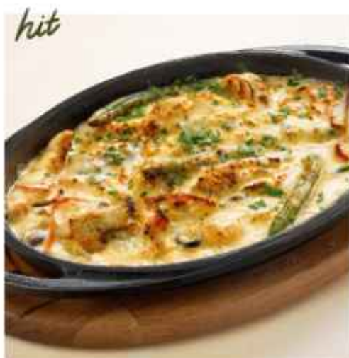
Скоблянка из цыпленка с печеным луком, шпинатом, стручковой фасолью и обжаренной морковью