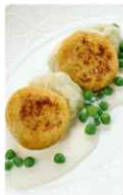
Щучьи котлетки с картошкой пюре и трюфельной заправкой 670