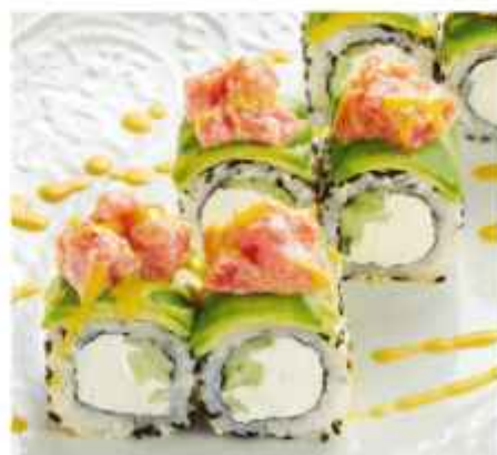
Ролл с тунцом и авокадо 740 | 200 г