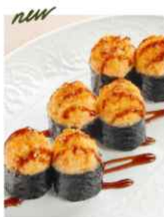
new Запечённые маки со снежным крабом и соусом унаги 410 | 100г