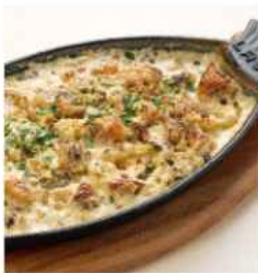
Рыбная скоблянка филе палтуса и судака с картофелем и шампиньонами в сливочном соусе