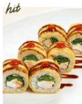
hit Ролл темпура с креветкой с соусом саяч-чили и унаги 640 | 200г