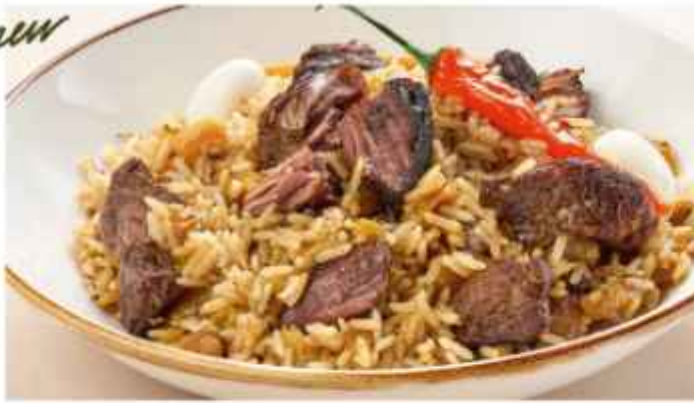
Плов с говядиной с жёлтой морковью, перцем чили и паровыми яйцами 680 | 200 г