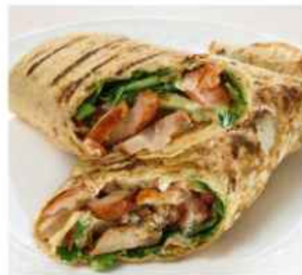
Шаверма с курицей, приготовленная на мангале подаётся с чесночным соусом 580 | 300г