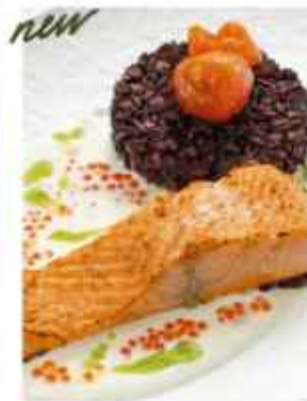
Стейк из лосося с инорным соусом подаётся с чёрным рисом 1490