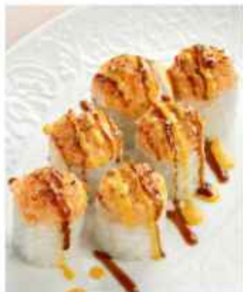
Ролл с острым угрём и снежным крабом 780 | 200г