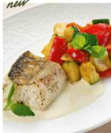
Филе судака с овощами на подушке из сливочно- горчичного соуса 740