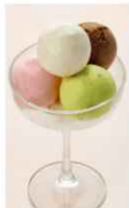
Мороженое / сорбет в ассортименте 150 / 160