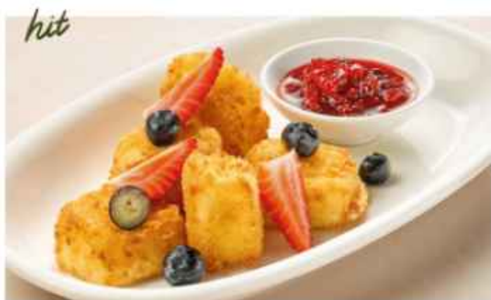
Сулугуни фри с брусничным соусом подаётся с сезонными ягодами