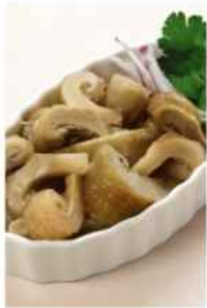
Грузди солёные со сметаной 570 | 100г