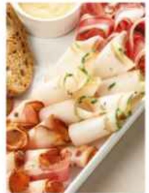
Ассорти из трёх видов сала

выпечённое, с зеленью, с мясной прослойкой