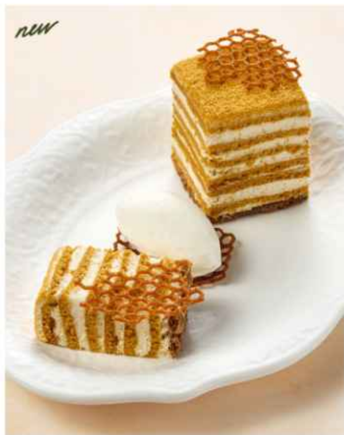
Медовик подаётся с шариком мороженого 390 | 100г