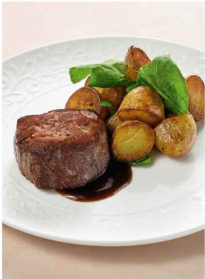
Стейк из говяжьей вырезки с беби-картофелем и соусом демиглас 1300 | 300г