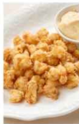
Креветки «Попкорн» тажные креветки в хрустящей паннировке