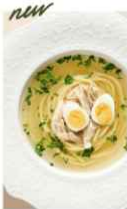
Куриный бульон с домашней лапшой и перепелиным яйцом 350