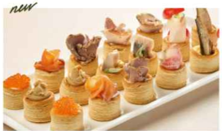
new Ассорти закусок под водку 1280 | 100г