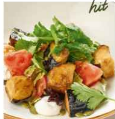
Салат с хрустящими баклажанами овощи, томаты, сыр фета, зелень, тыквенные семена и горчица-устричная заправка 590 | 100 г |