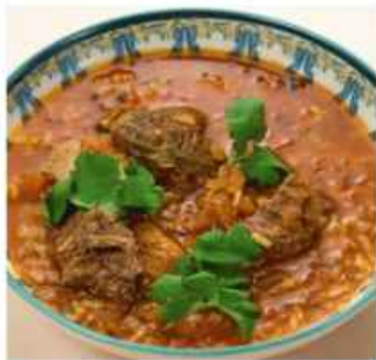
Харчо с говядиной 460