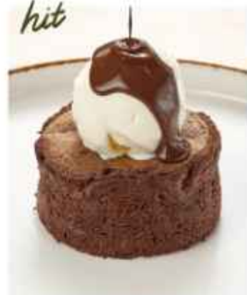
Шоколадный фондан подаётся с шариком мороженого 560 | 100г