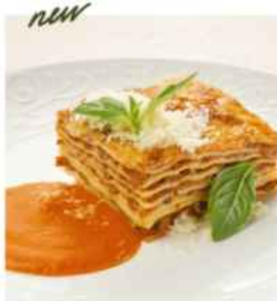
Классическая лазанья с соусом Болоньезе 520 | 300 г