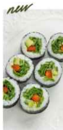
Ролл Ясай вегетарианский 390 | 100 г