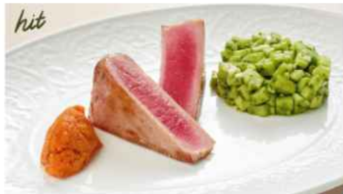
Стейк из тунца на гриле с гарниром из свежего огурца, щучки и яблока 860