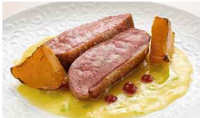
Филе утки с печёной тыквой с апельсиновым соусом 890 | 300г