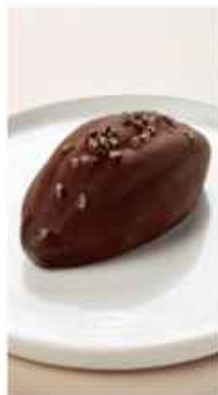
Боб Тонка 490 | 100г