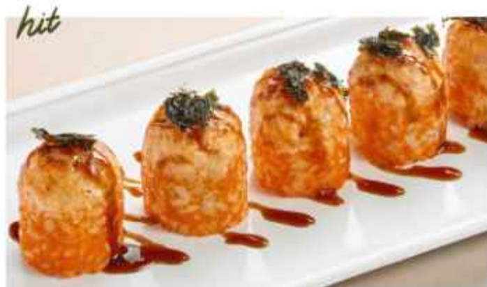
hit Запечённый ролл с лососем с икрой масаго и соусом унаги 790 | 200г