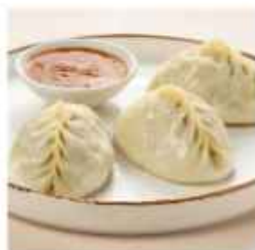
Хинкали жареные или варёные с сыром и зеленью 110 | 80 г со свиной и говядиной 120 | 80 г с говядиной 120 | 80 г с бараниной 150 | 80 г