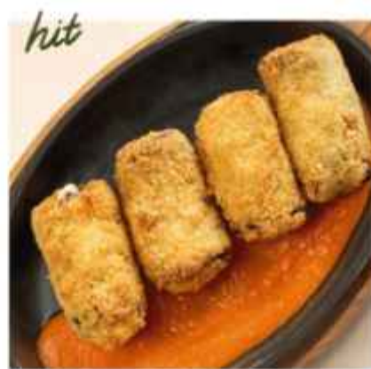
Рулетики из баклажанов в хрустящей корочке с нарезкой пепперони и соусом на основе