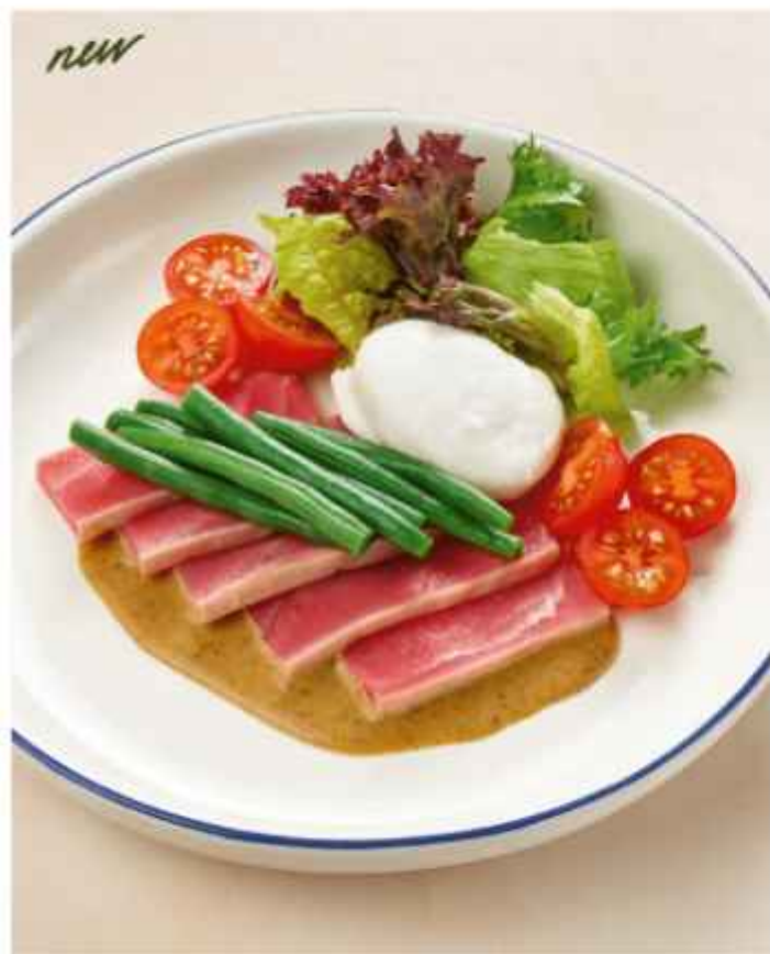
Салат с тунцом, свежей фасолью и яйцом пашот