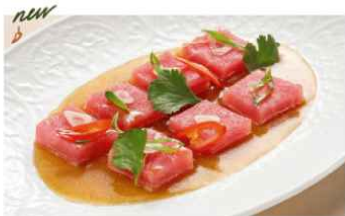
Закуска из тунца с перцем чили и имбирной заправкой 590 | 100 г