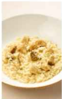
Ризотто с белыми грибами 680 | 300 г