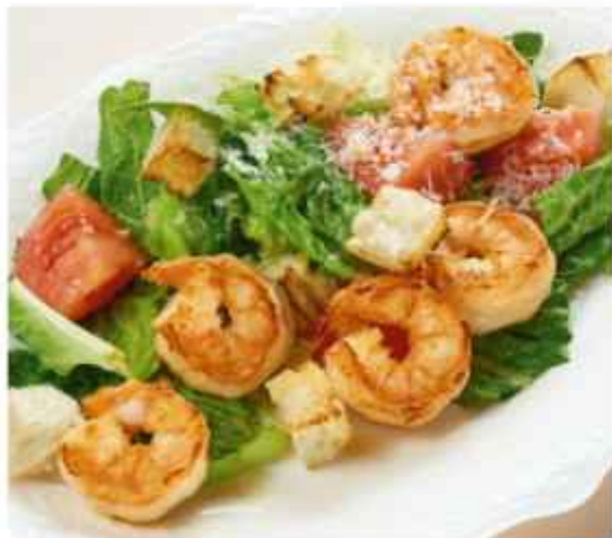
Цезарь с цыпленком 560 | 100 г | с креветками 720 | 100 г |