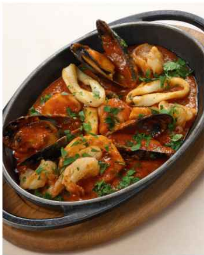
Скоблянка из морепродуктов с тигровыми креветками, кальмарами, индейки в соусе напелли 890 | 300г