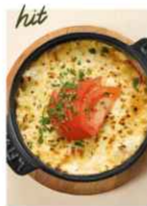
Залеченный судак с томатом под сырной корочкой