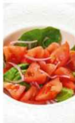
Салат с томатами и красным луком