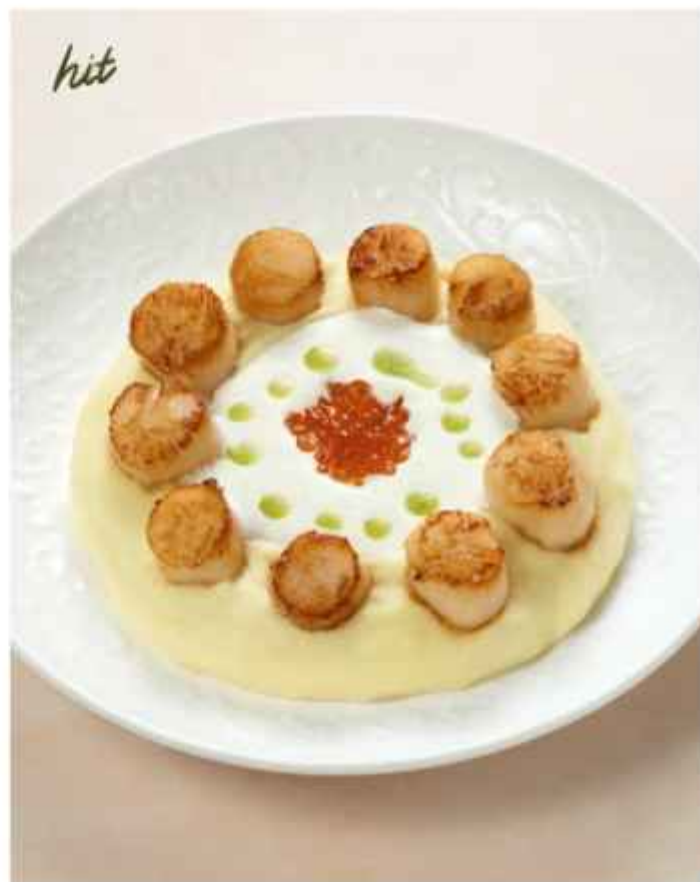
Гребешки с красной икрой с картофельным пюре и трюфельным соусом 980