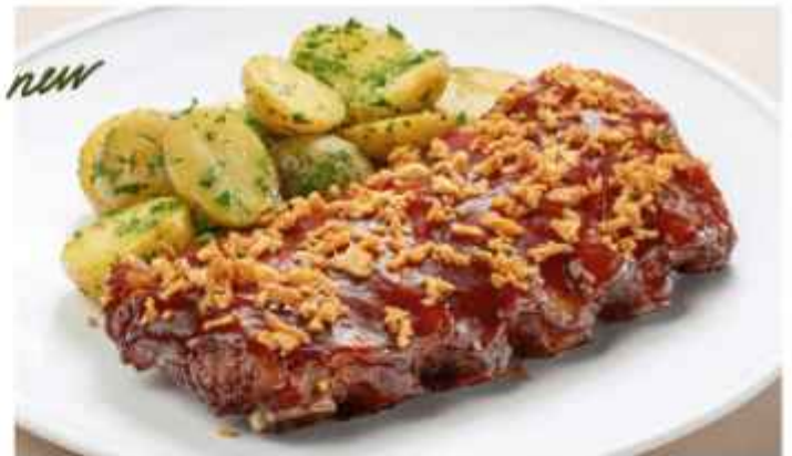
Свинные рёбра с беби-картофелем и соусом барбекю 570 | 200 г