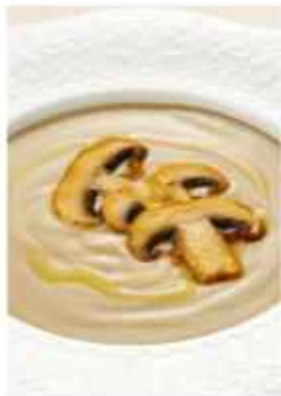
Грибной крем-суп из шампиньонов с гренками и трюфельным маслом 390