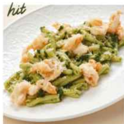
Паста с тигровыми креветками и цукини с соусом песто и сыром пармезан 620 | 300 г