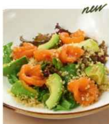
Салат с лососем, авокадо и киноа с горчичной заправкой