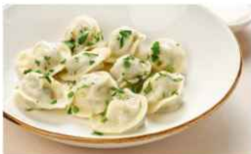
Манты new со свиной и говядиной 570 | 300 г с бараниной 590 | 350 г