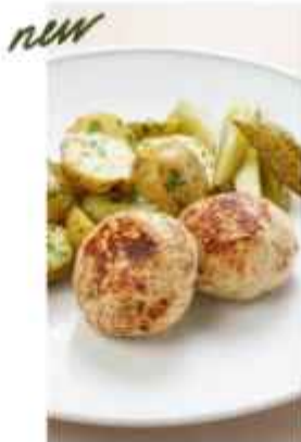
Котлеты из сцплёнка с беби-картофелем 540 | 300г