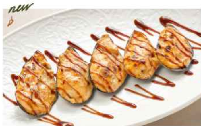
Мидии запечённые под сливочным соусом