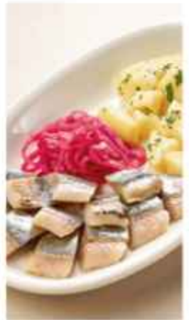
Сельдь с отварным картофелем 470 | 100г