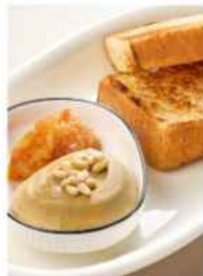
Паштет из куриной печени подается с чатни из груши и обжаренной брешью 420 | 100 г