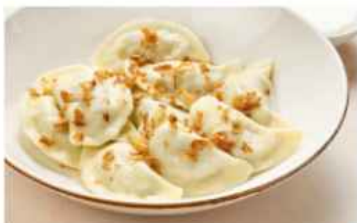
Пельмени со сметаной домашнее подаётся с бульоном 420 | 200 г с щукой и щукой икрой 480 | 200 г Вареники с картофелем и сметаной 370 | 200 г с творогом, подаётся со сметаной и вишневым соусом 390 | 200 г