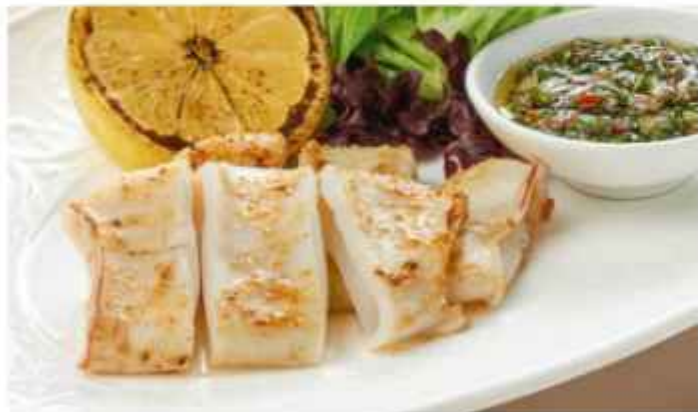
Кальмар на гриле с соусом минимурри 650