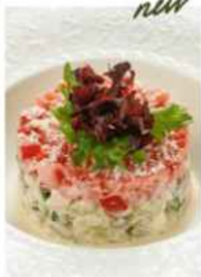
Салат из трёх видов мяса буффало, отварной язык, цыпленок су-вид, томаты 570 | 100 г |