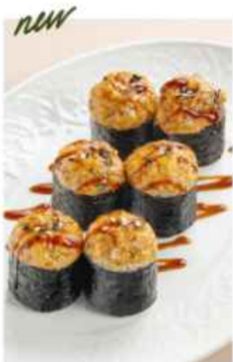
Запечённые маки с угрём и соусом унаги 590 | 200г