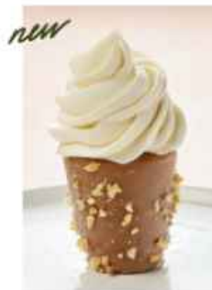
Стаканчик мороженого со скарданной и фундуком 390