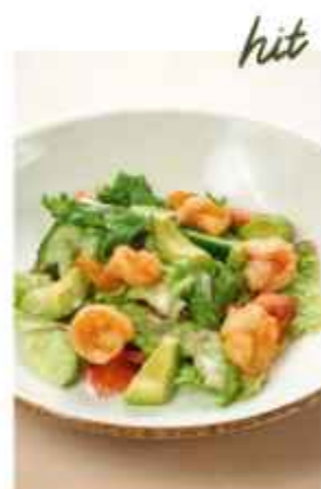
Салат с авокадо и креветками