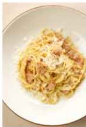
Спагетти Карбонара с сырокопчённым беконом 540 | 300 г