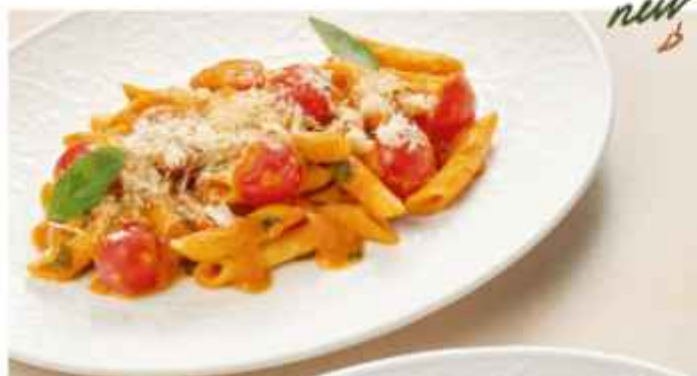
Паста Арабыята с томатами черри, базиликом и сыром пармезан 450 | 300 г