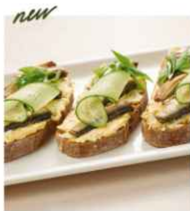
Балтийские шпроты со свежими огурцами на домашнем хлебе 390 | 100 г