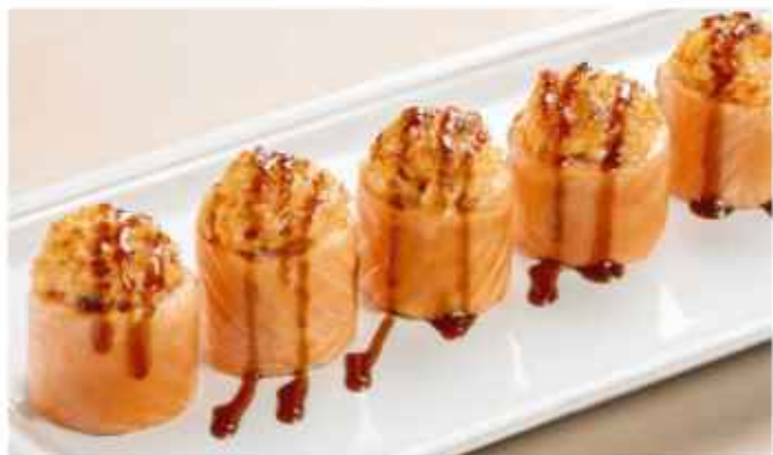
Ролл с лососем и снежным крабом 890 | 200г