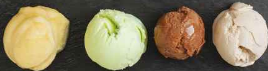
Мороженое/Сорбет 50г в ассортименте 100Р/60Р