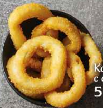
Кольца кальмара с соусом охра 200г 550Р/330Р