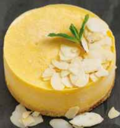
Манго-Маракуйя 135г 360Р/216Р + Американо в подарок