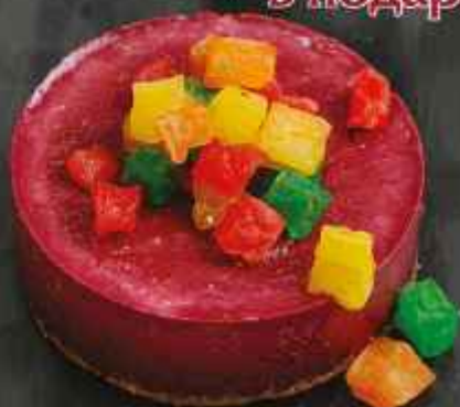
Чёрная смородина 135г 360Р/216Р + Американо в подарок