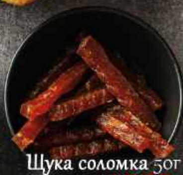
Щука соломка 50г 255Р/153Р