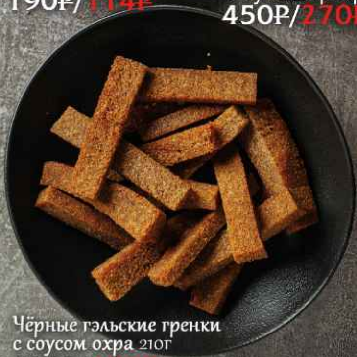
Чёрные гэльские гренки с соусом охра 210г 300Р/180Р