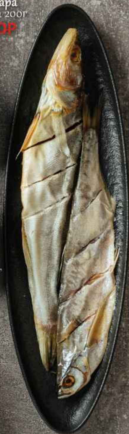
Ладожский судак 150г 400Р/280Р