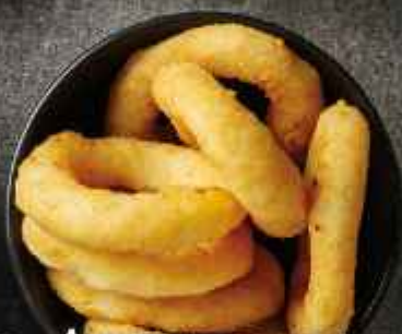
Луковые кольца с соусом шарпарт 200г 450Р/270Р