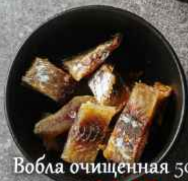
Вобла очищенная 50г 190Р/114Р