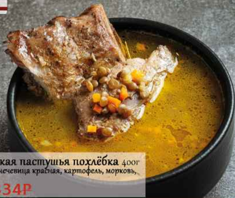
Шотландская пастушья похлёбка 400г Свинные рёбра, чечевица красная, картофель, морковь, лук репчатый. 620Р/434Р