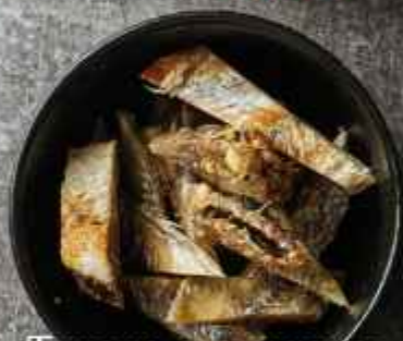
Тарань очищенная 50г 190Р/114Р