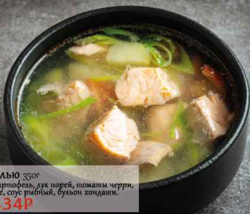
Суп с форелью 350г Филе форели, картофель, лук порей, поматы черри, масло сливочное, соус рыбный, бульон хондаши. 620Р/434Р