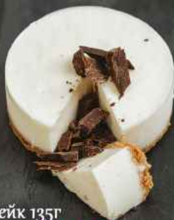
Чизкейк 135г 350Р/210Р + Американо в подарок