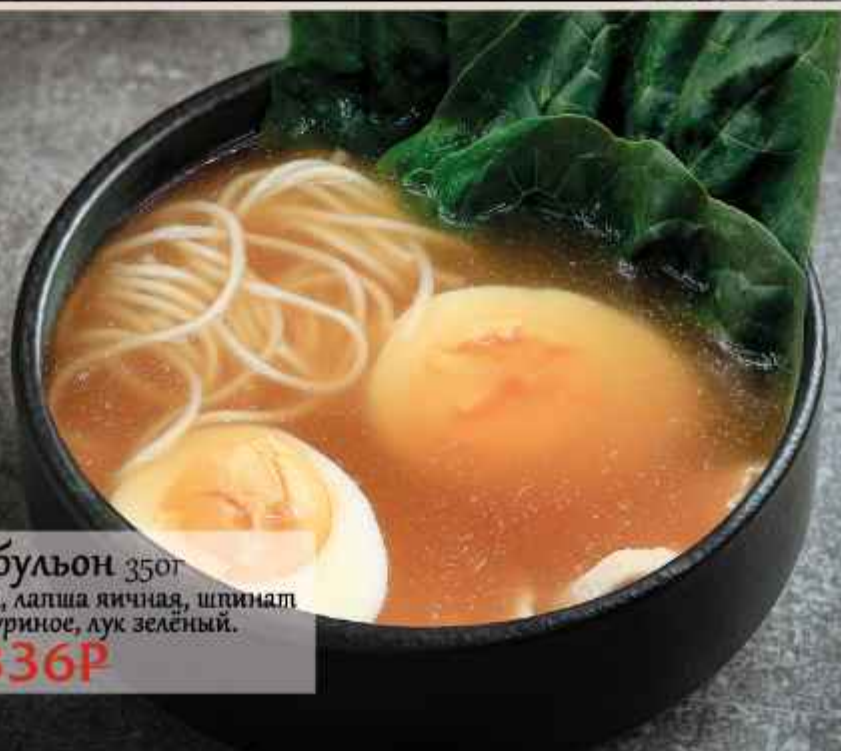
Куриный бульон 350г Куриная грудка, лапша яичная, шпинат свежий, яйцо куриное, лук зелёный. 480Р/336Р