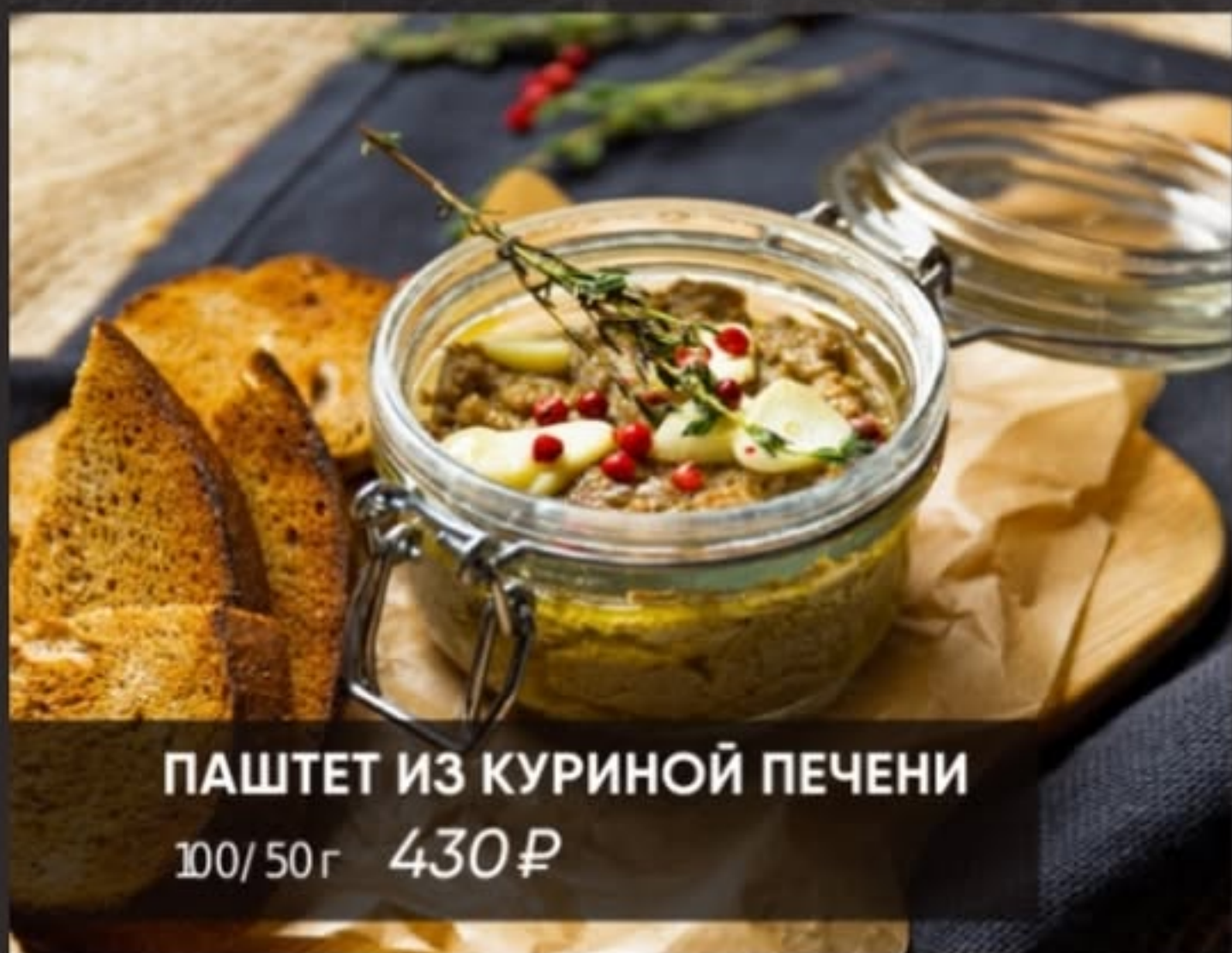
ПАШТЕТ ИЗ КУРИНОЙ ПЕЧЕНИ 100/50 г 430 ₺

ТАРТАР ИЗ ГОВЯЖЬЕЙ ВЫРЕЗКИ 120 г 560 ₺ маринованные опята, халапеньо, заправка на основе горчицы