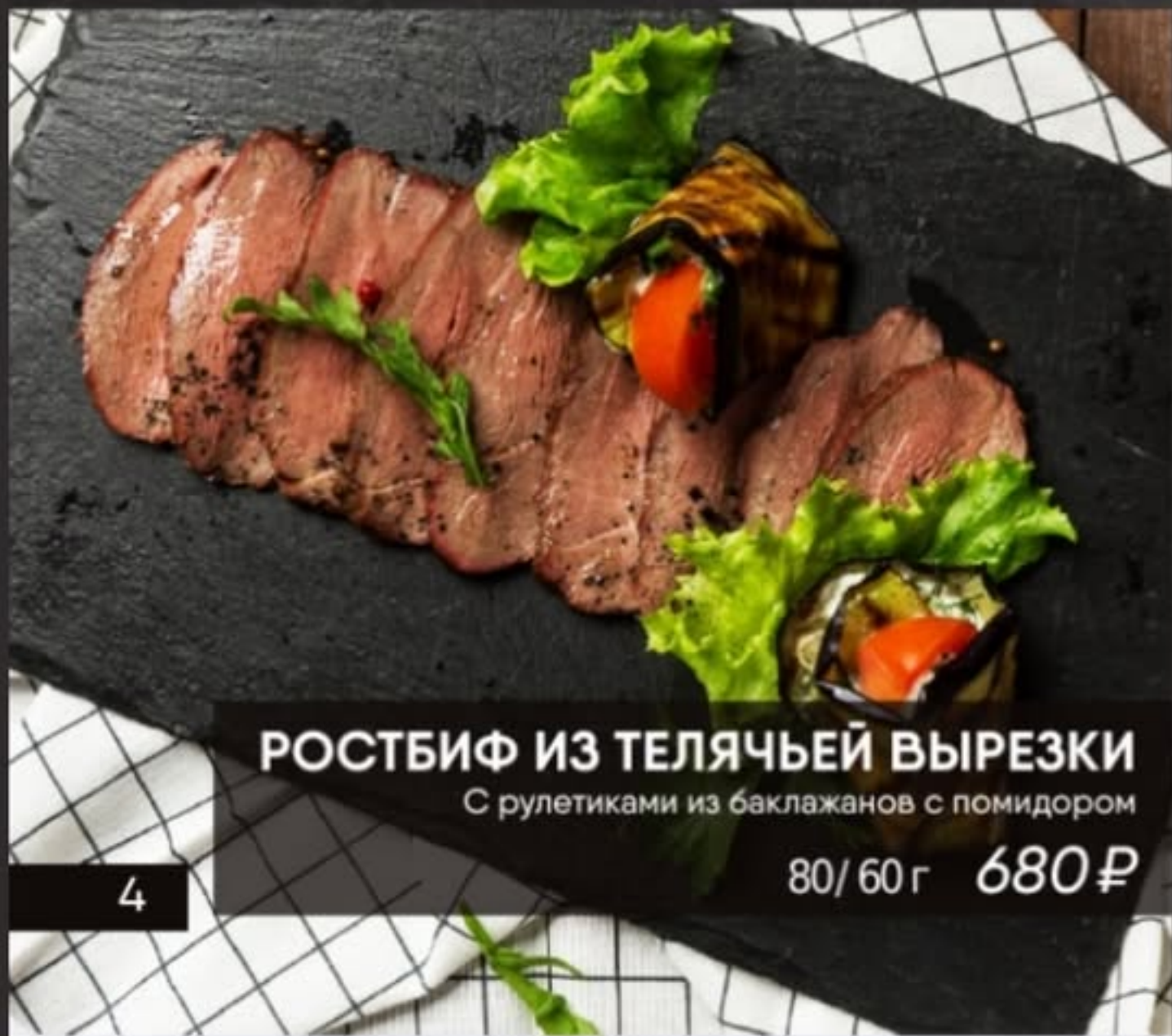
РОСТБИФ ИЗ ТЕЛЯЧЬЕЙ ВЫРЕЗКИ С рулетиками из баклажанов с помидором

ОТВАРНОЙ ТЕЛЯЧИЙ ЯЗЫК 100/40 г 590 ₺ со сливочным хреном