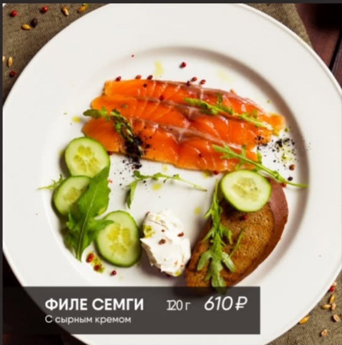
ФИЛЕ СЕМГИ 120 г 610 ₺ С сырным кремом