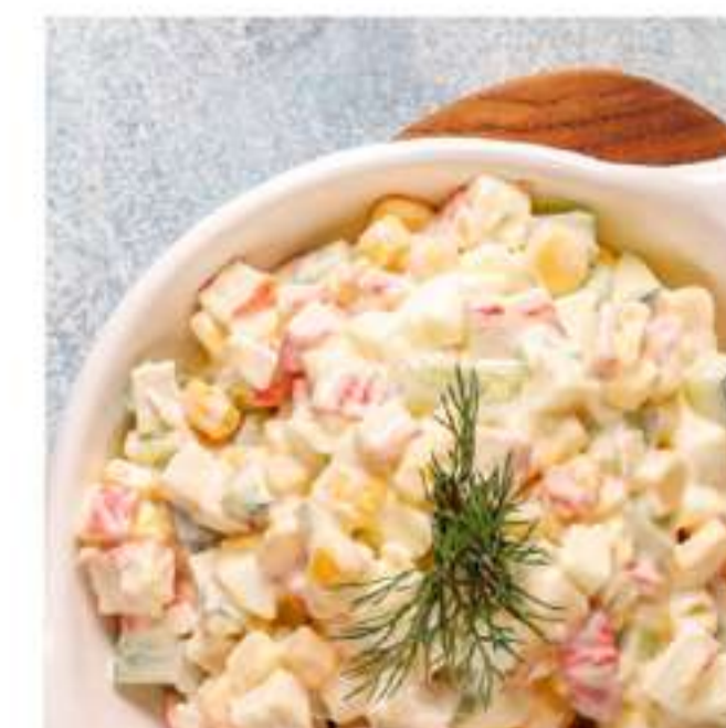
салат оливье домашний