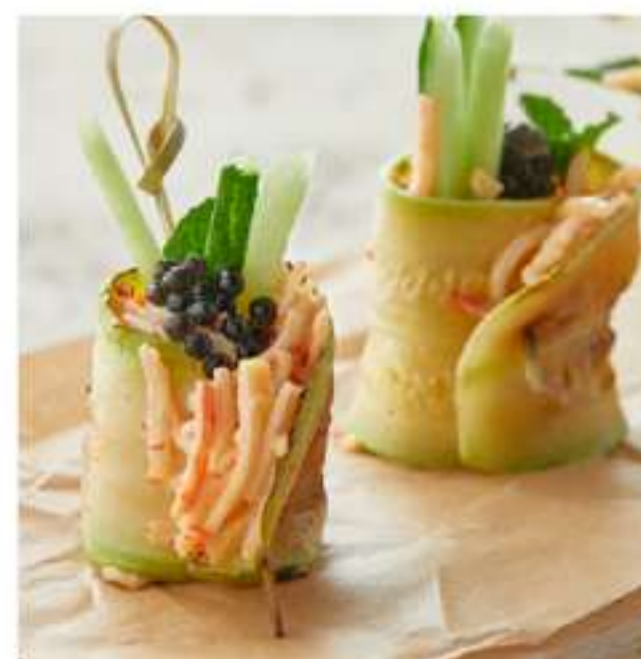
канапе со снежным крабом и крем чизом