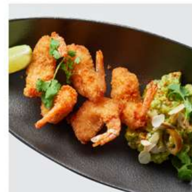
хрустящие креветки с гуакамоле