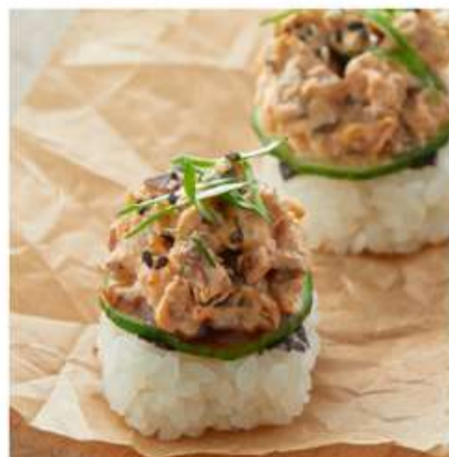
суши с тартаром из угря

рис, нори, огурец, куриное филе, спайси соус, соус свит чили, кинза, лук кранч, кунжурозелень 35 г.