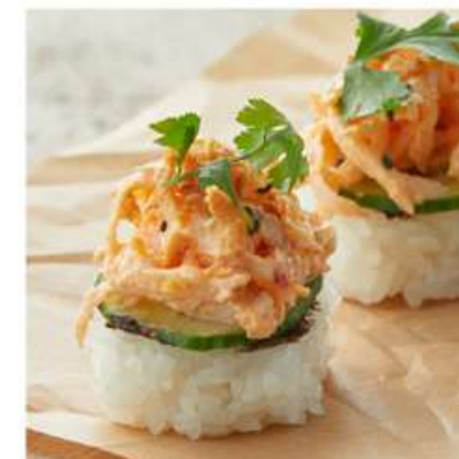
суши чикен чили