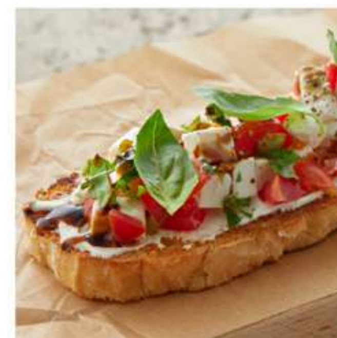
брускетта с томатами и сыром фета