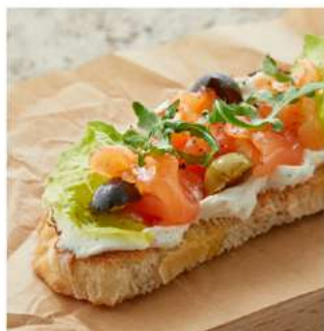
брускетта с лососем