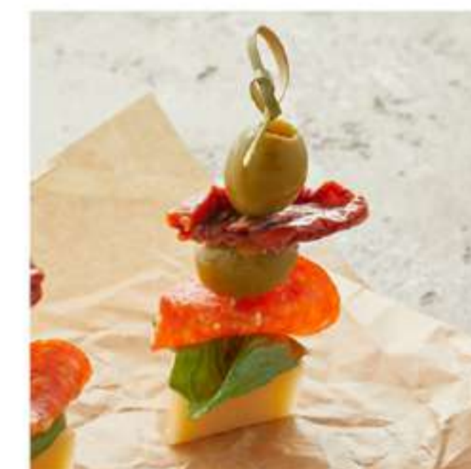
канапе с сыром эмменталь и вялеными томатами