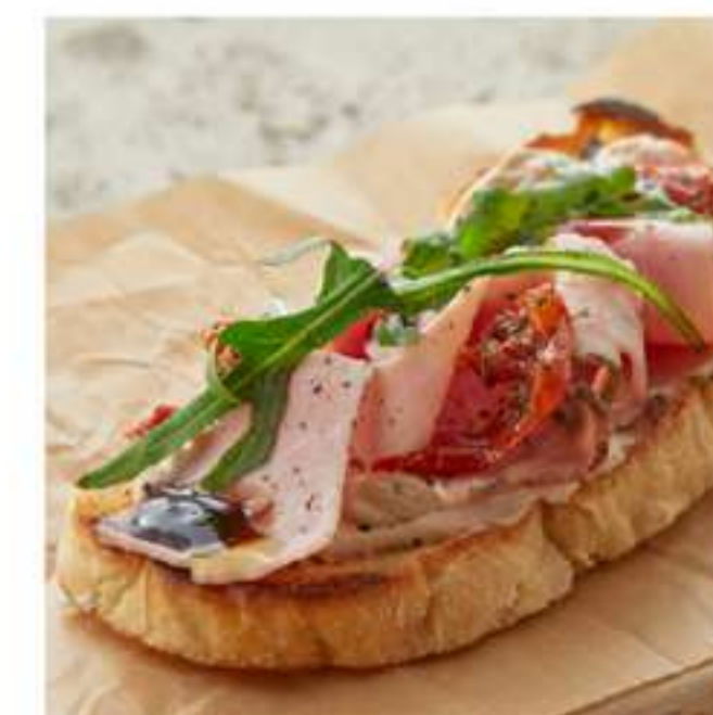
брускетта с тамбовским окороком