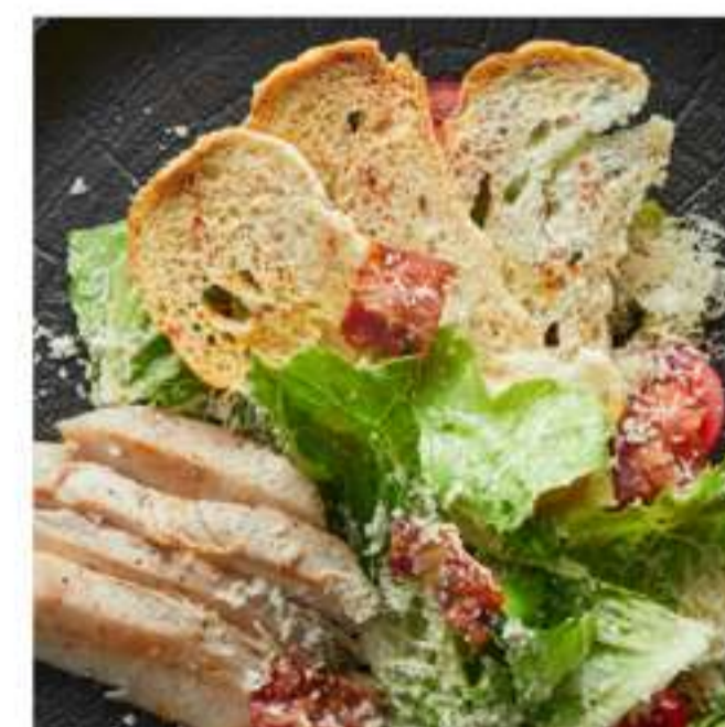
салат цезарь с цыплёнком