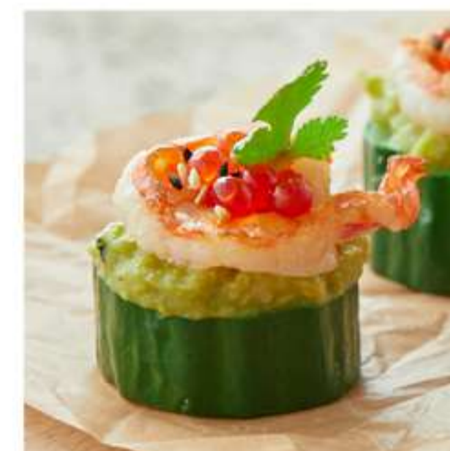
канапе с креветкой и гуакамоле