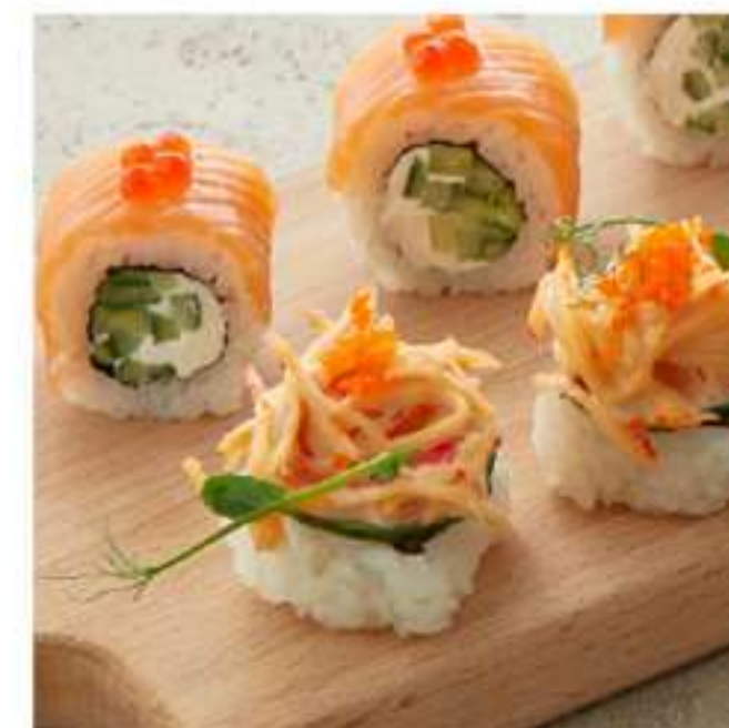
филадельфия и суши со сливочным крабом