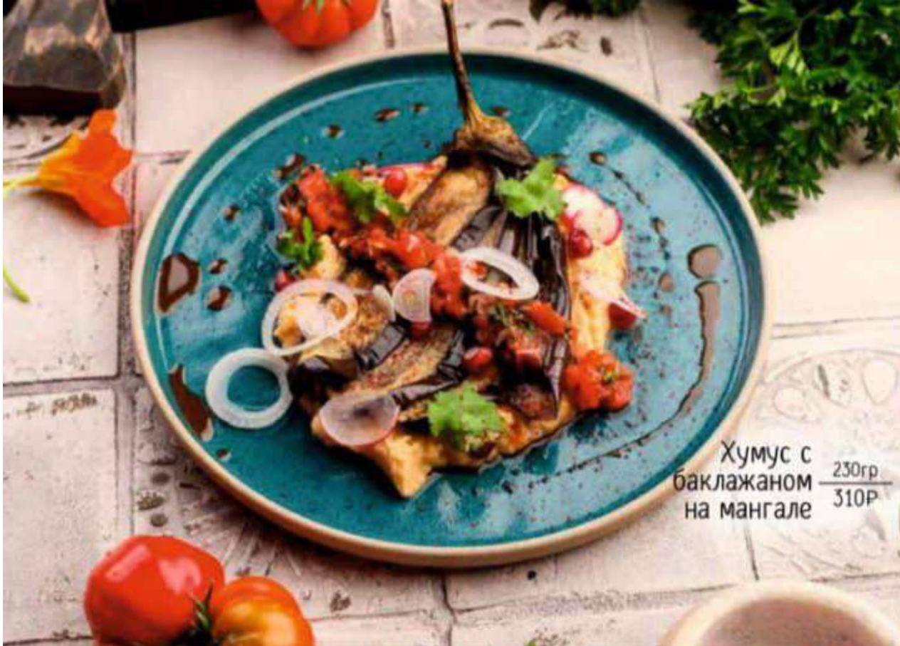
Хумус с баклажаном \frac{230\text{гр}}{310\text{Р}} на мангале