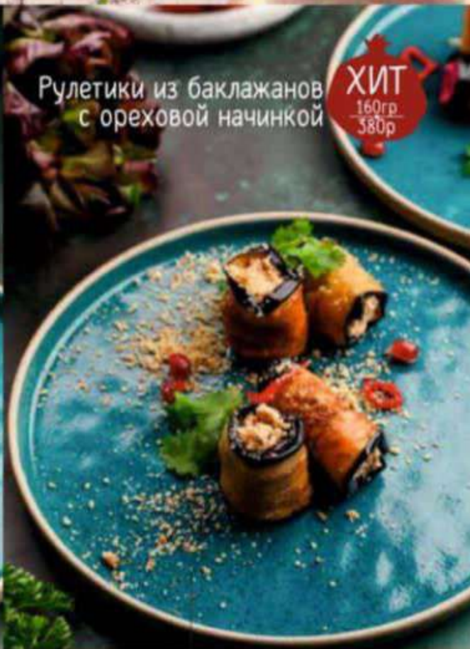
Рулетики из баклажанов с ореховой начинкой