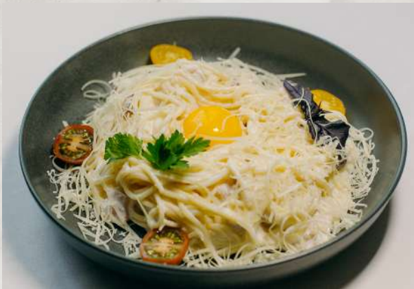
Классическая «Карбонара» спагетти, бекон, сливки, яйцо, пармезан