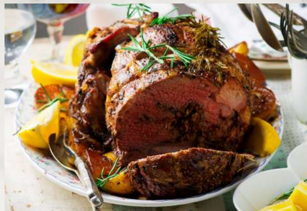
Рулет из телятины, фаршированный овощами