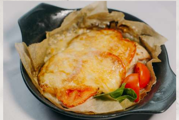
Свинина, запеченная с томатами и сыром вырезка свиная, помидоры, сыр, лук