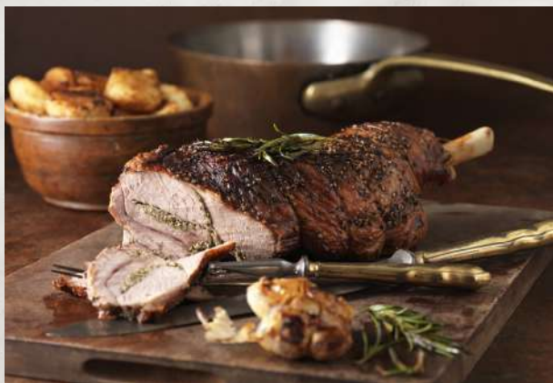
Бараний окорок, фаршированный киви