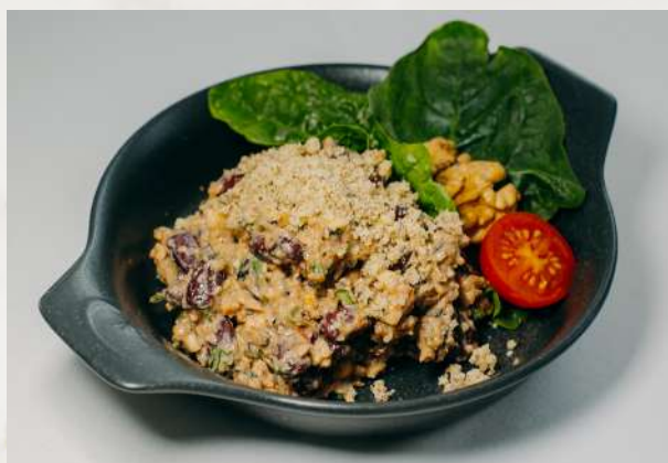
Лобио по-грузински фасоль, грецкий орех, лук, кинза, гранат