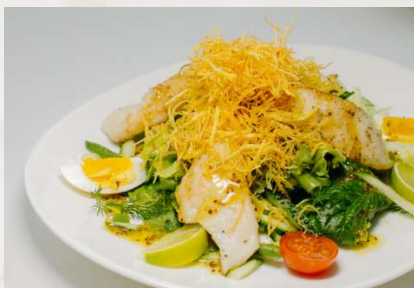
Салат из судака судак, огурец свежий, стручковая фасоль, яйцо, картофель пай