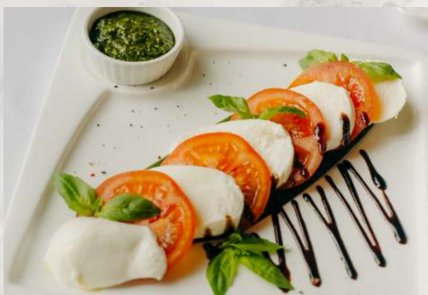
«Капрезе» помидор, сыр Моцарелла, соус песто