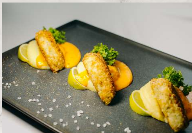
Биточки из судака с соусом из печеного перца филе судака, лук, сливки, картофельное пюре, перец