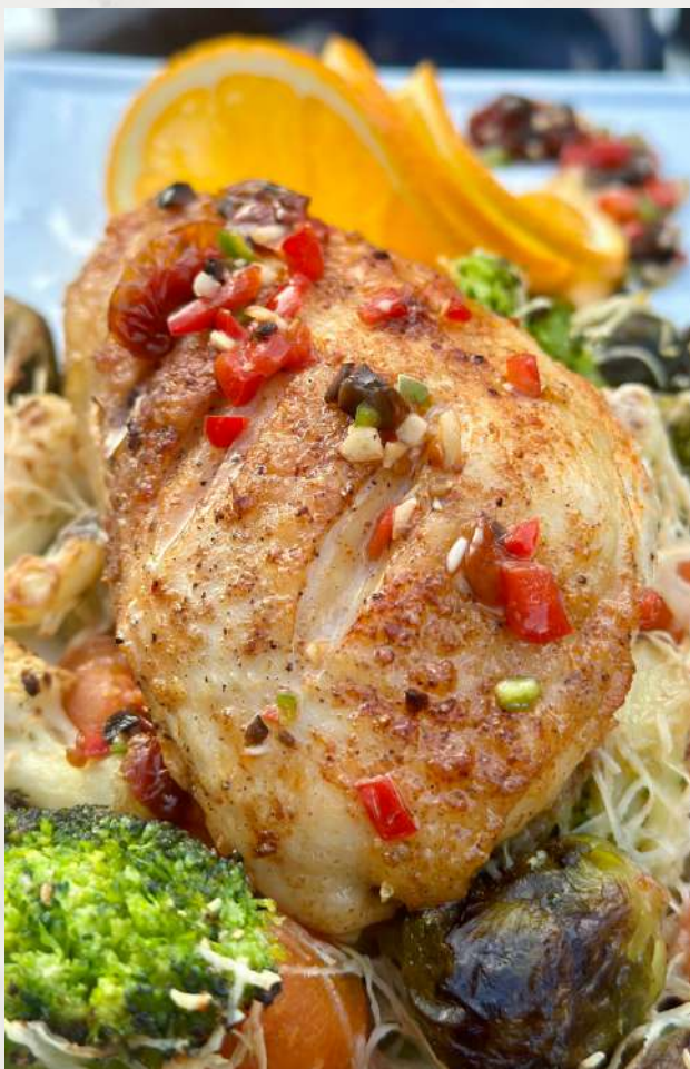
Печеный цыпленок с овощами бейби