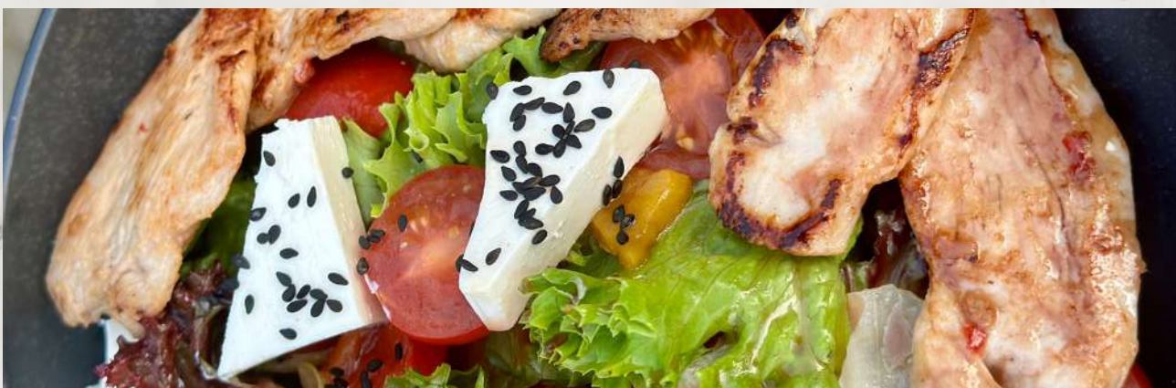
Теплый салат с цыпленком и печеным перцем