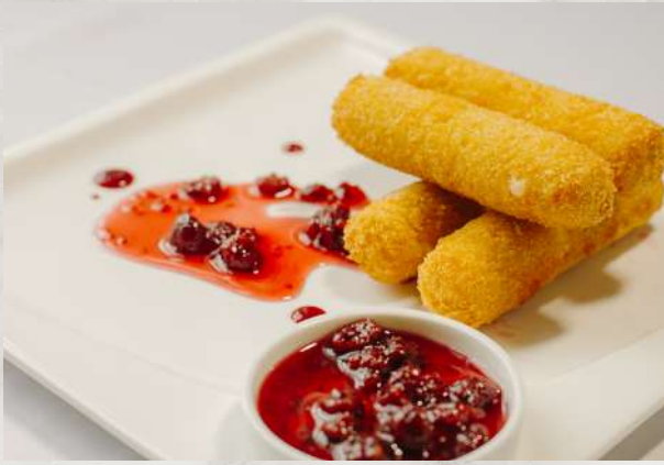
Фромаж из твердого сыра с малиновым соусом сыр, панировочные сухари