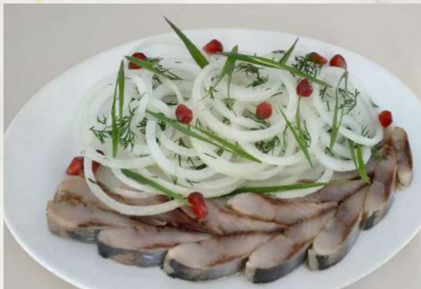
Сельдь с лучком филе слабосоленой сельди, маринованный лук, душистое масло