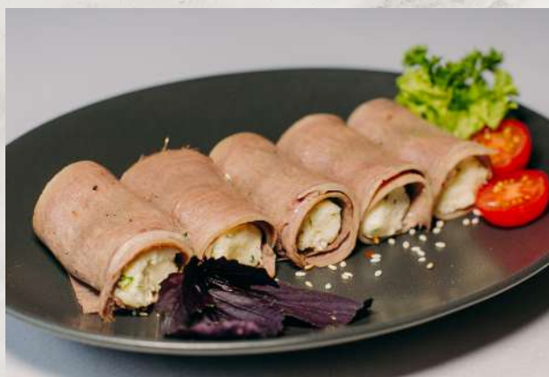
Рулеты из языка теленка с мягким сыром язык отварной, творожный сыр с зеленью