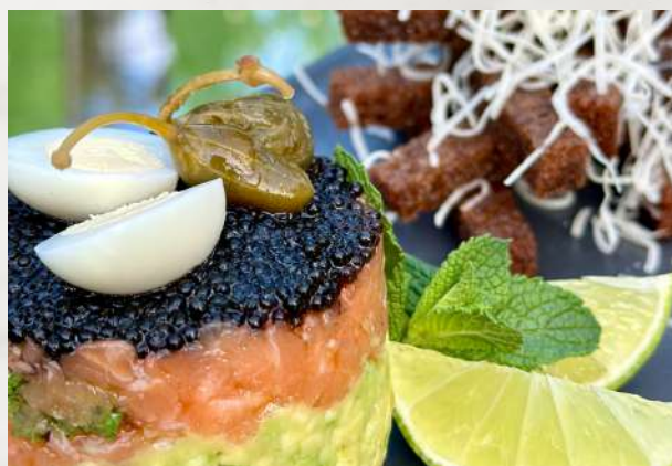
Тар-тар из лосося и авокадо