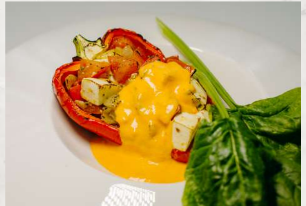
Сладкий перец, фаршированный томатом и мягким сыром