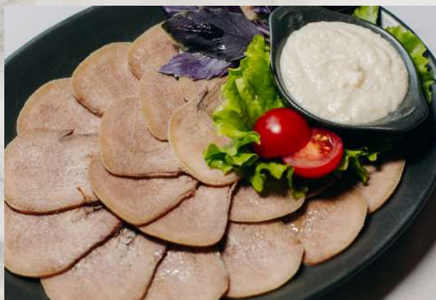
Язык отварной с хреном говяжий язык, хрен, зелень