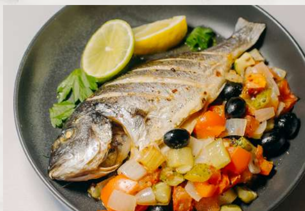
Дорадо с овощами дорадо, томаты, лук, цуккини, болгарский перец