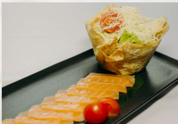
«Цезарь» со слабосоленой семгой семга слабосоленая, микс салата, поми- дор, сыр Пармезан, соус цезарь, сухарики