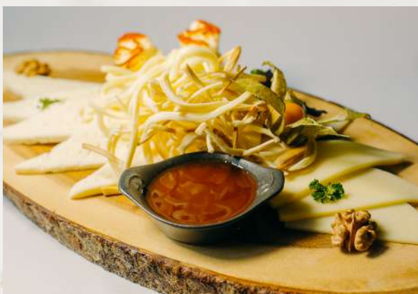
Ассорти домашних сыров сулугуни, брынза, сыр «Хинкали», чечил, ткемали