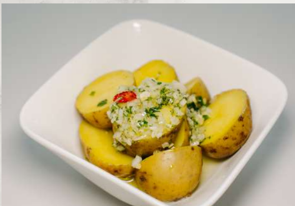
Картофель молодой отварной с пряным маслом картофель отварной, масло растительное, зелень