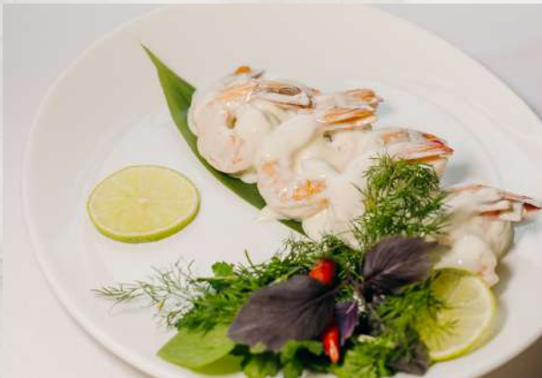
Тигровые креветки в сливочном соусе