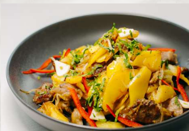
Картофель с пузаниной картофель, пузанина, специи