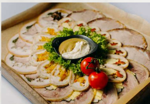
Коллекция мясных деликатесов по-домашнему буженина, рулет куриный, рулет из утиного мяса, рулет из индейки, пузанина, хрен, горчица