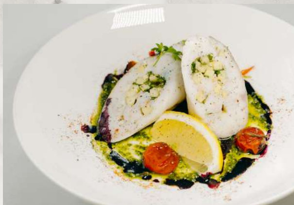
Судак, фаршированный тигровыми креветками и зеленым яблоком филе судака, тигровые креветки, яблоко зеленое