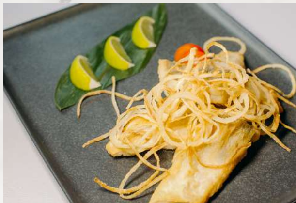
Судак жареный филе судака, лук