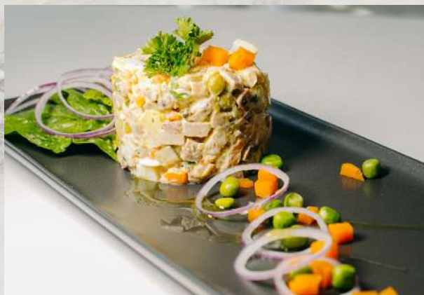
«Оливье» из отварной телятины