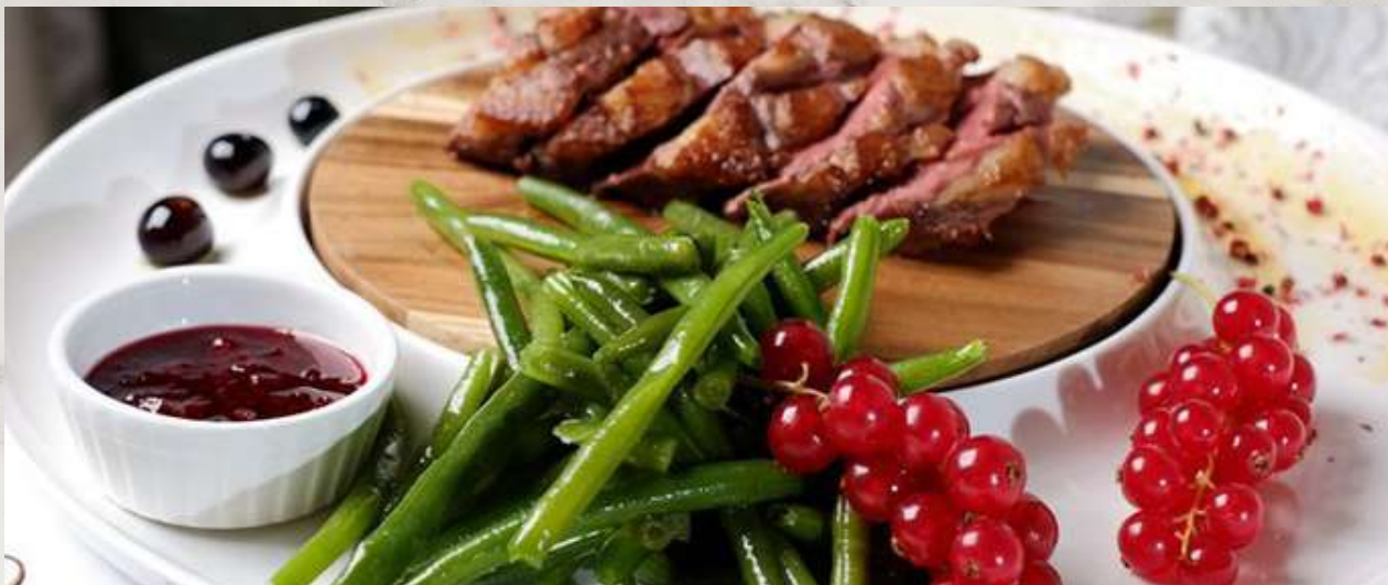
Грудка утиная с малиновым соусом

утиная грудка, фасоль стручковая, чеснок, перец болгарский