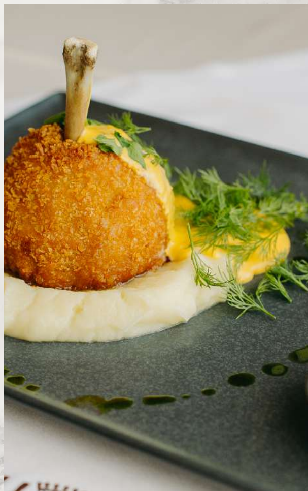
Котлета де-воляй с креветкой и сыром