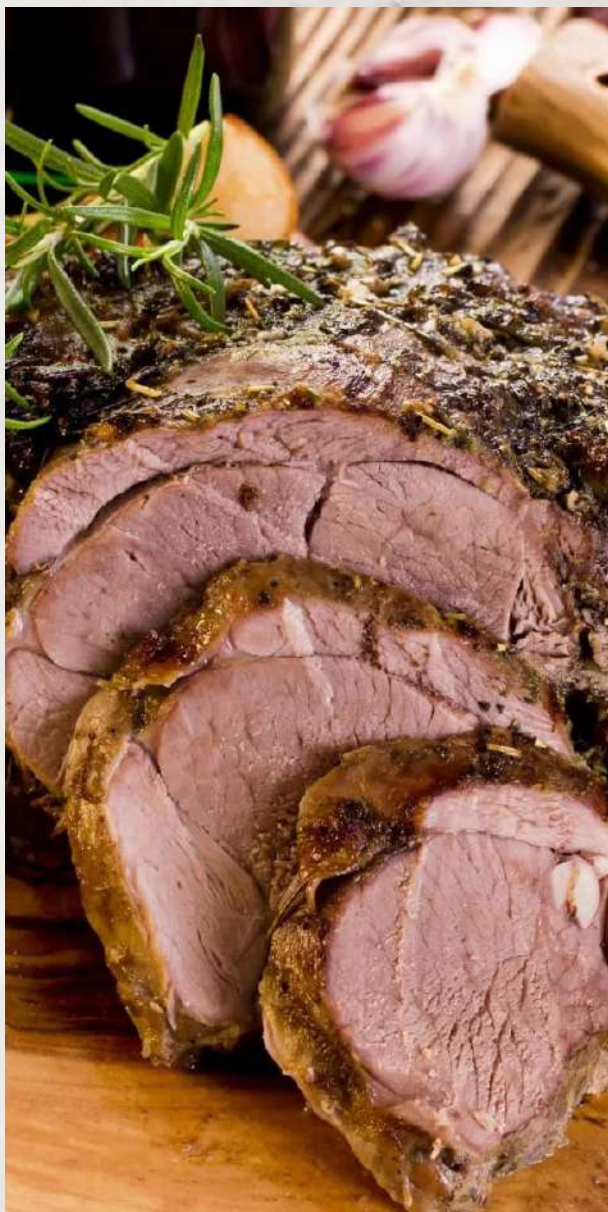
Телятина под сачи