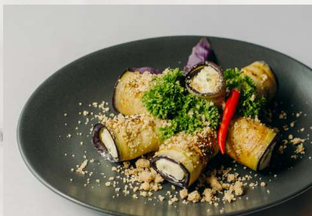
Баклажаны с творожным муссом жареные баклажаны на гриле в пряном масле, творожная масса, чеснок, специи