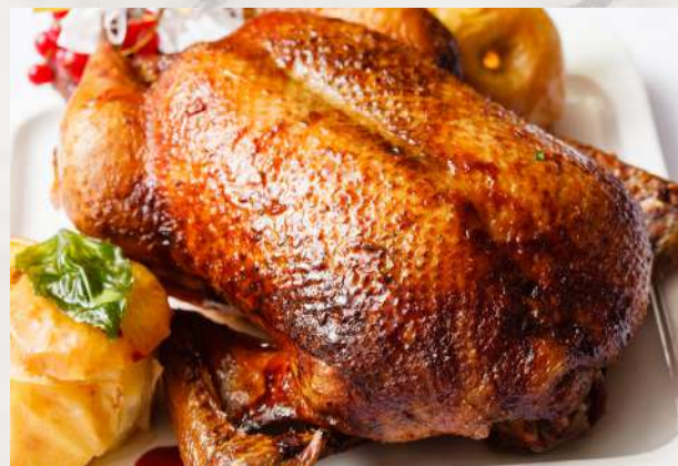
Утка медовая с яблоками