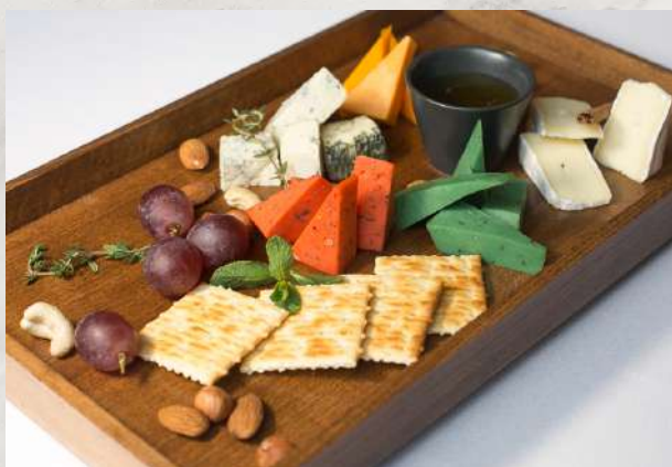
Собрание европейских сыров базирон песто, базирон красный, дор-блю, пармезан, чедер, бри, мед, мята, орехи