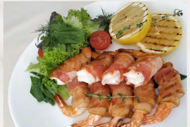
Тигровые креветки в беконе