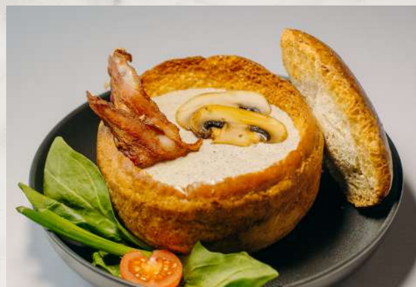
Грибной крем-суп (подается в горячей булочке) шампиньоны, белые грибы, сливки, лук, бекон