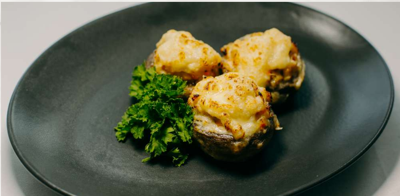
Грибы фаршированные шампиньоны, свинина, говядина, лук, болгарский перец, красное вино