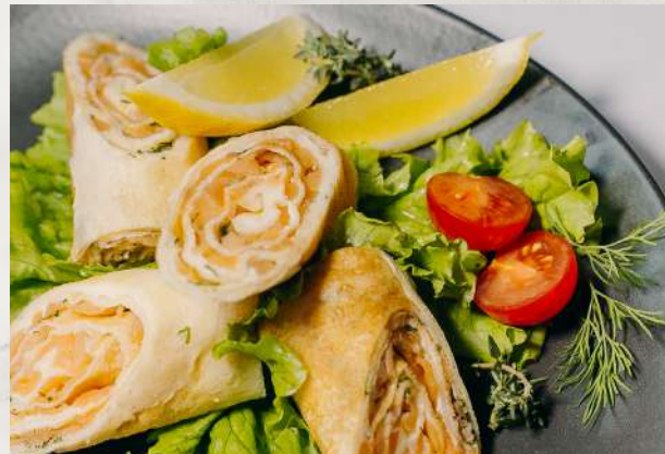
Блинчики с норвежской семгой балык семги, сыр сливочный, приправы