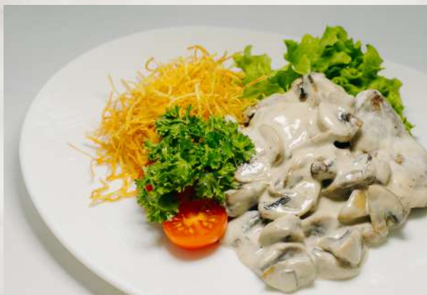
Телятина в сливочно-грибном соусе вырезка молодого теленка, шампиньоны, сливки, лук