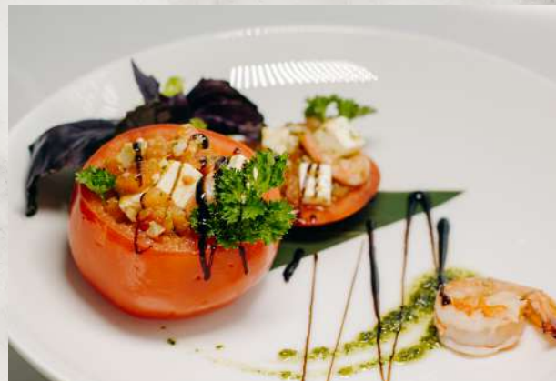
Томаты, фаршированные тигровой креветкой помидор, креветка тигровая, сыр «Фетаки», чеснок