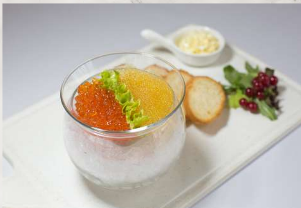
Икра красная/щучья подается со сливочным маслом