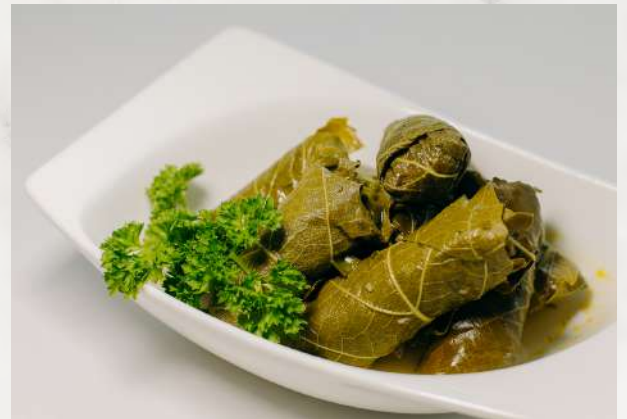
Долма с мацони виноградные листья, баранина, говядина, рис, сливочное масло