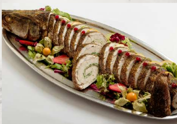
Судак, фаршированный красной рыбой