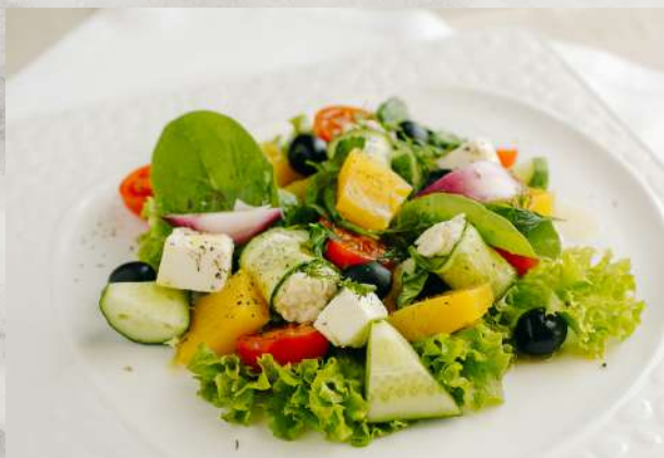
«Греческий» с оригинальной заправкой огурец, помидор, болгарский перец, микс салата, сыр фетаки, лук красный, маслины