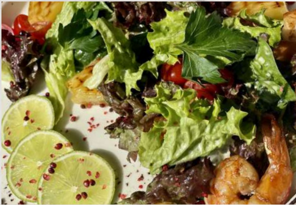
Салат с креветкой и жареными ананасами