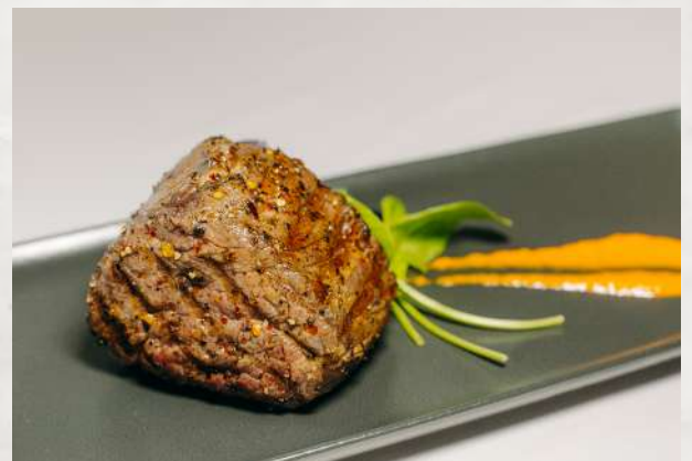
Говядина по-княжески говядина, грибы, сыр, чернослив, майо- нез, специи