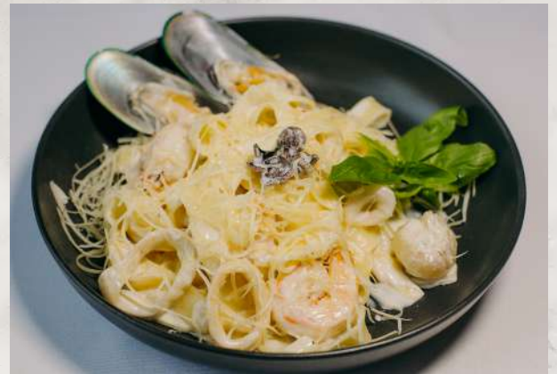
Феттучини с морепродуктами

феттучини, креветки, мидии, гребешок, кальмар, пармезан, сливки, яйцо