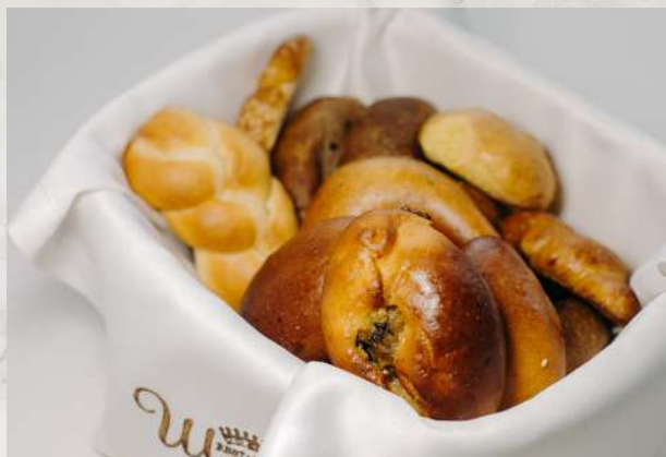
Хлебная домашняя корзина хлеб пшеничный, отрубной, ржаной, морковный, сырный, чесночный, луко- вый, пирожок с капустой, с мясом, с грибами, с картофелем