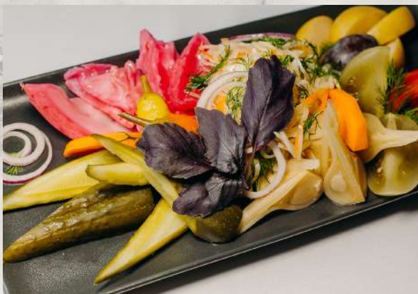
Соленья по-домашнему огурец соленый, помидор маринованный, острый перец, сливы, яблоко моченое, капуста квашеная