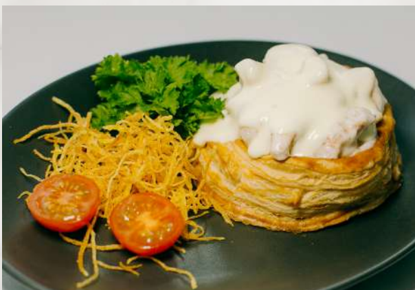
Консоме из морепродуктов креветки, мидии, кальмары, гребешок, сливки, сыр