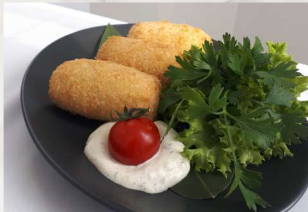
Рулеты из языка на гриле с сыром говяжий язык, помидор, перец болгарский, огурец свежий, огурец маринованный, грибы маринованные