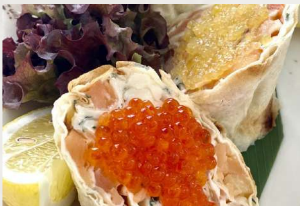
Рулетики из домашнего лаваша, рыбки и щучьей икры