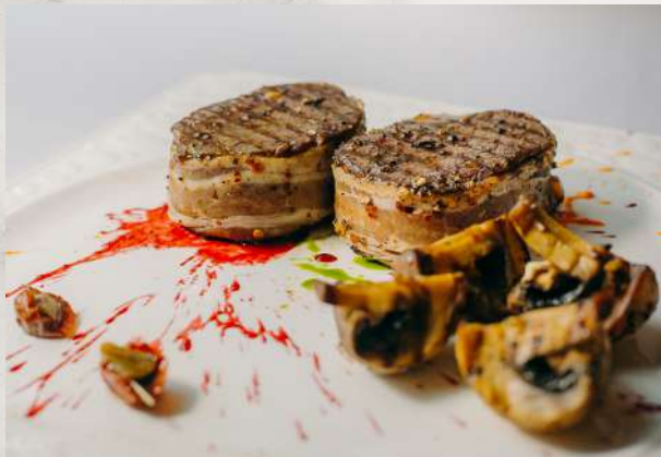
Медальоны в беконе говядина, бекон, грибы, сливки, сыр дор-блю