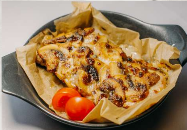
Свинина «Марешаль» сочная мякоть свинины, шампиньоны, лук, сливки, сыр