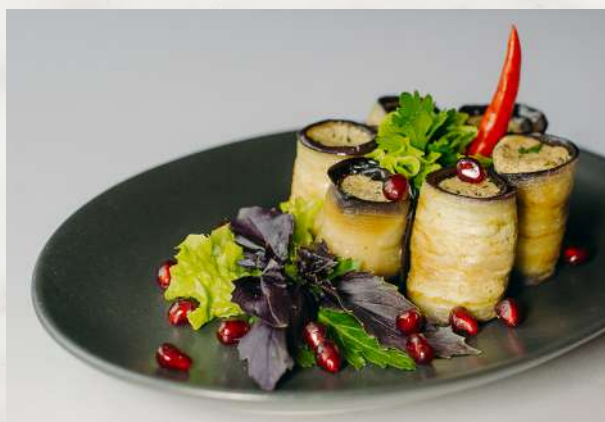
Рулеты из баклажан по-грузински баклажан, грецкий орех, лук, специи, гранат, зелень