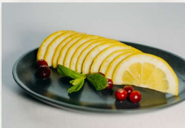
Лимон с клюквой