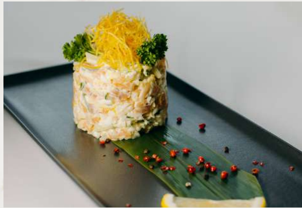
Салат из слабосоленой семги и огурца