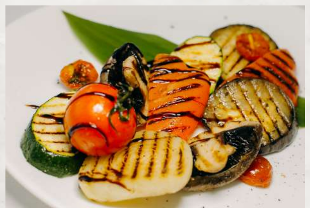
Овощи на гриле бакалажан, цукини, перец болгарский, лук, грибы, помидор