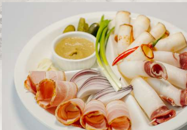
Закусочка под водочку шпик, сало, грудинка, огурец маринованный, лук, чеснок, горчица