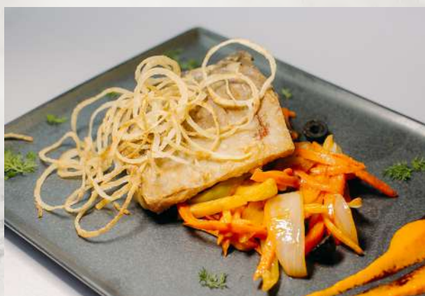
Сазан жареный с томленными кореньями сазан, лук, морковь, белый корень, сельдерей