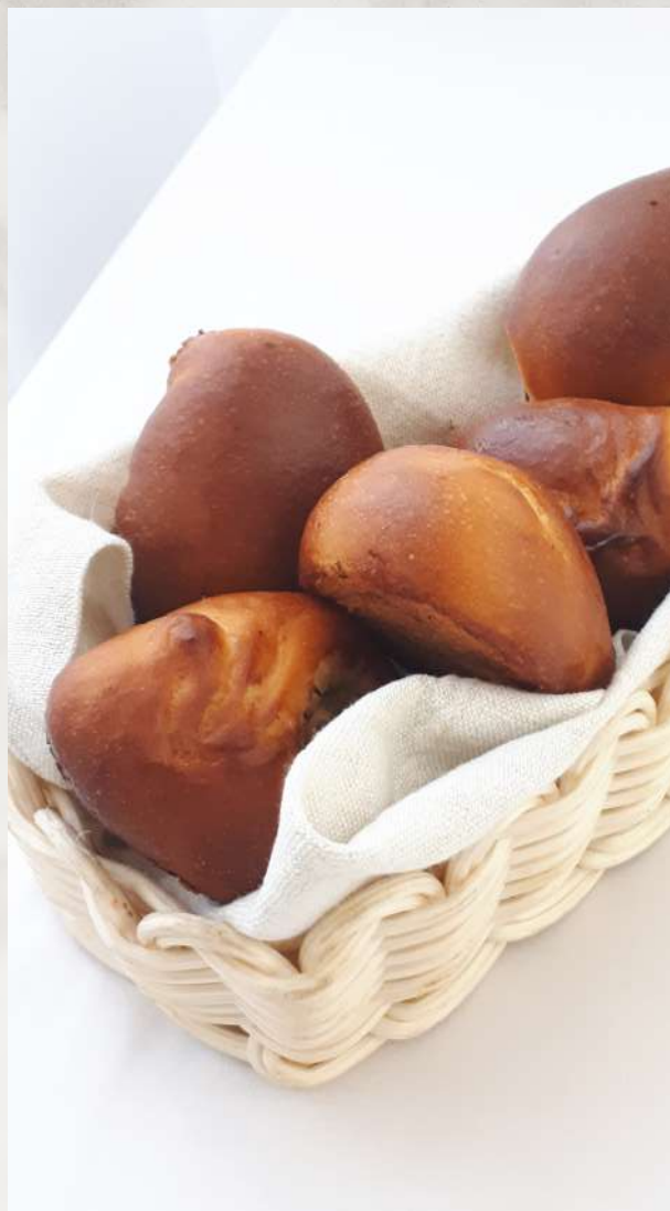
Корзина домашних пирожков пирожок с капустой, с мясом, с грибами, с картофелем