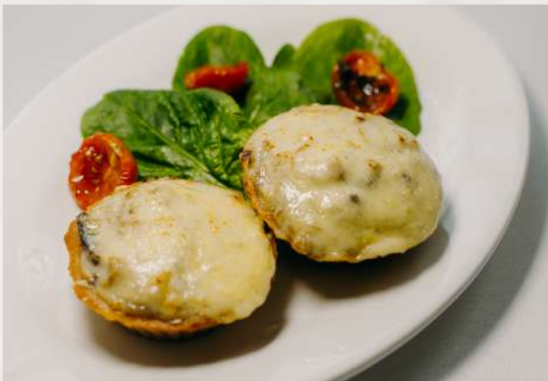
Грибной рататуй в тартини шампиньоны, белый гриб, сливки, сыр, тартини