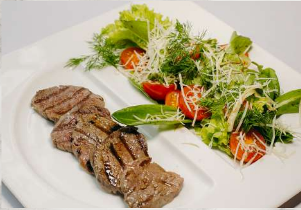
Теплый салат с телятиной телятина, микс салата, томат, соус базльзамик