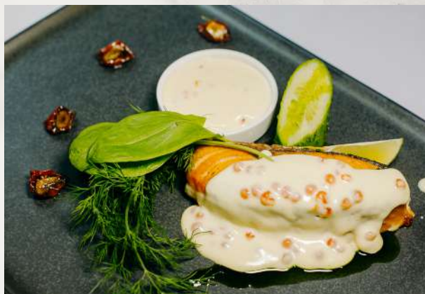
Семга под сливочным соусом семга, сыр, сливки, лимон, икра красная