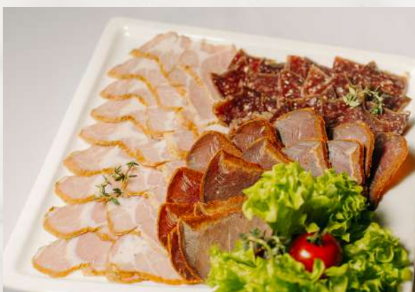
Кавказские деликатесы пастрома, бастурма, суджук