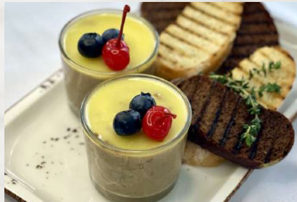
Паштет из куриной печени