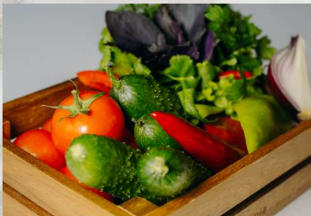
Ассорти из свежих овощей помидор, огурец, болгарский перец, редис, зелень, острый перец