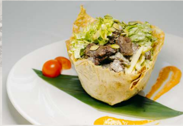
Теплый салат с куриной печенью куриная печень, зеленое яблоко, тыквенные семечки, микс салата, томат