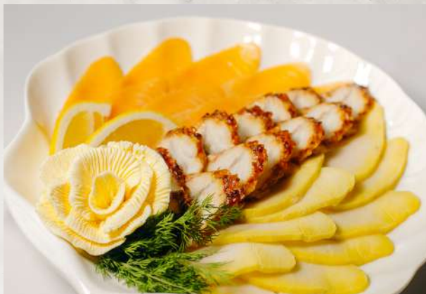
Коллекция рыбных деликатесов семга, угорь речной, балык масляной рыбы, масло сливочное, зелень