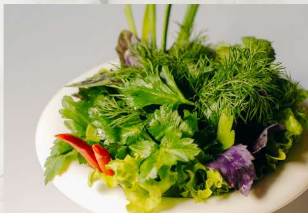
Букет ароматной зелени укроп, петрушка, кинза, лук зеленый, острый перец