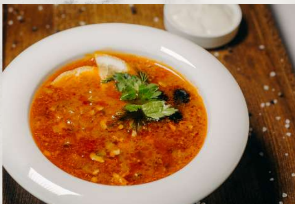
Солянка сборная мясная говядина, карбонат, колбаса с/к, филе ку- риное, лук, корнишоны, маслины, сметана