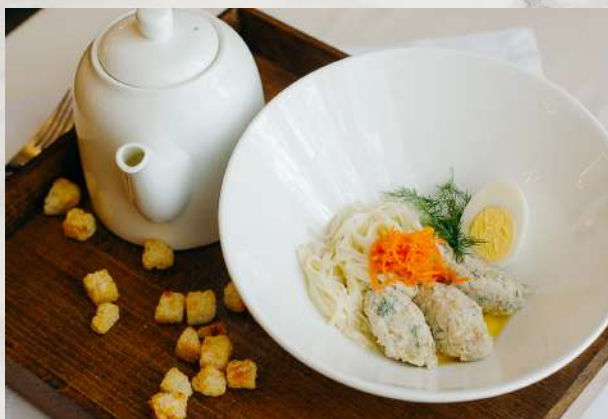
Суп-лапша с куриными кнелями куриный бульон, лапша домашняя, филе куриное, морковь