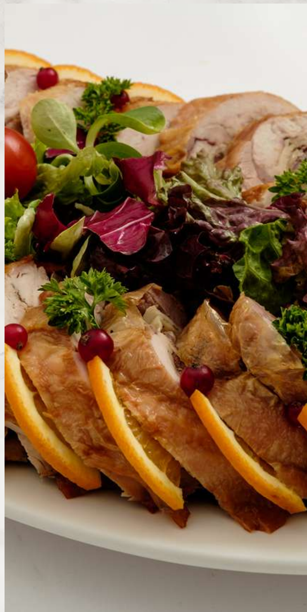
Курица, фаршированная блинами