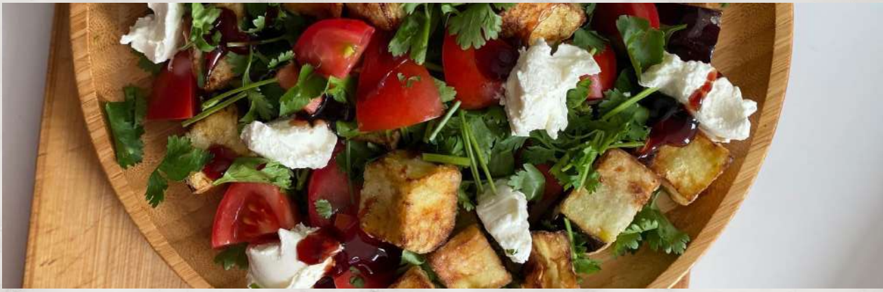
Салат с хрустящими баклажанами и мягким сыром