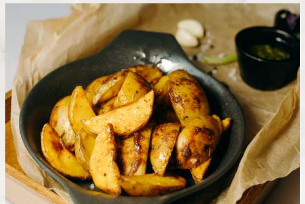
Картофель, запеченный с разнотравьем картофель, масло растительное, смесь трав