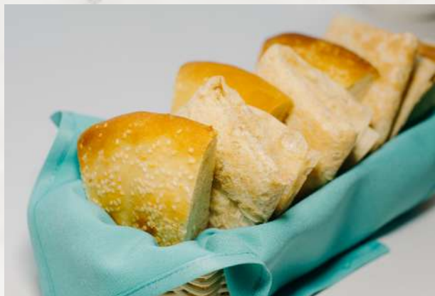
Кавказский хлеб лаваш тонкий, лаваш толстый