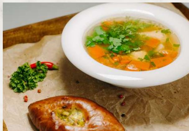
Уха с расстегаем семга, судак, помидор, лук, морковь, бол- гарский перец