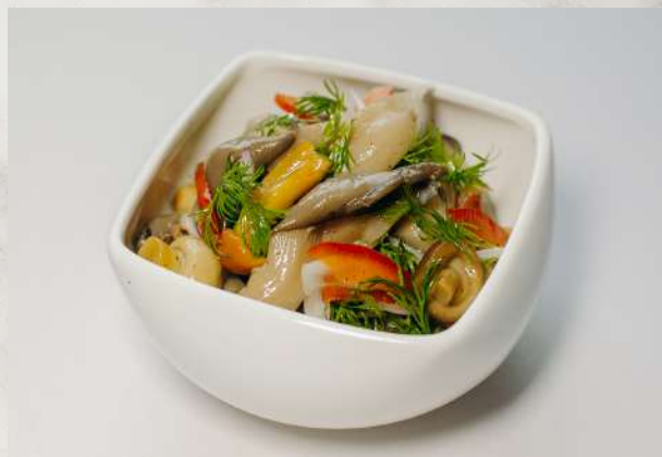
Грибы маринованные опята, маслята, грузди, лук, душистое масло, зелень