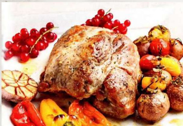
Свиной окорок, фаршированный виноградом и печеным луком