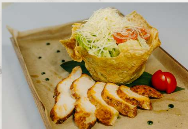
«Цезарь» с курицей куриное филе, микс салата, помидор, сыр Пармезан, соус цезарь, сухарики