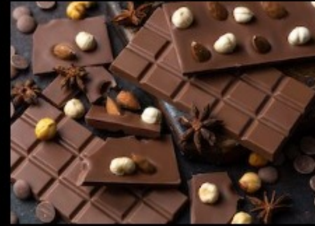
Плитка молочный шоколад 50гр.