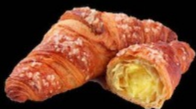
с кремом и лимоном 90гр