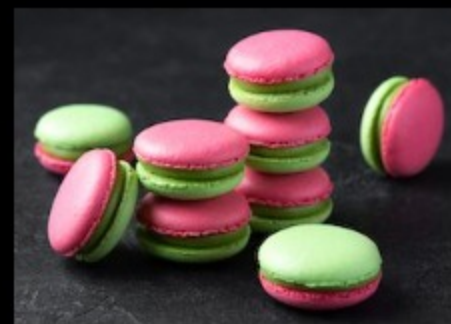
Макарон вишня-фисташка 20гр.