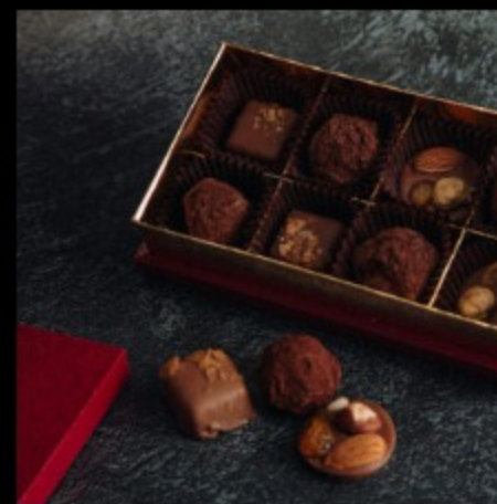
НАБОР ШОКОЛАДНЫХ КОНФЕТ 8 ШТУК БЕЛ LUX