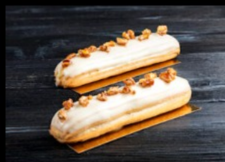
Эклер Ваниль 100гр Р280