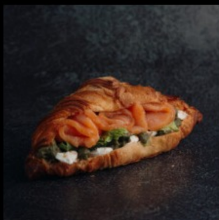
круассан с лососем