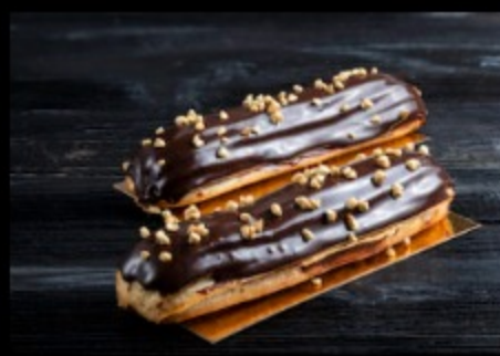
Эклер Шоколад 100гр Р280