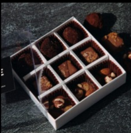
Набор шоколадные конфеты 9 штук