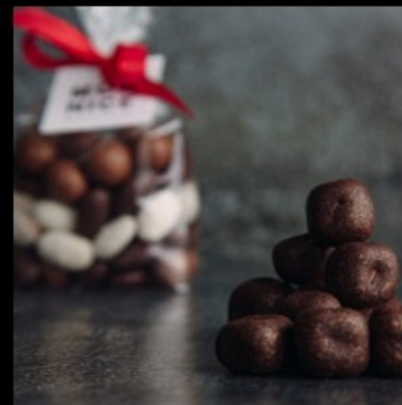
Марципан-шоколад (темный) 100г.