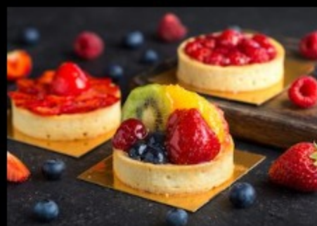
Ягодная тарталетка 150гр Р420