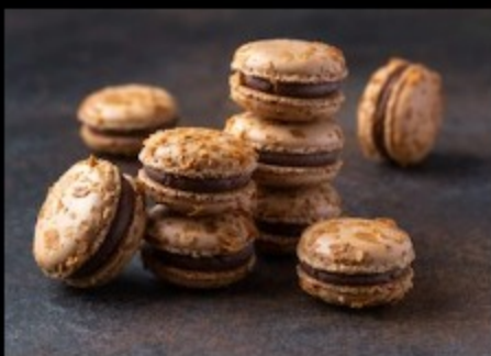
Макарон фисташка 20гр.