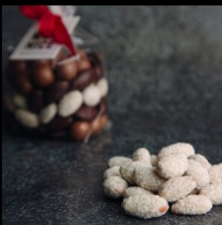
Миндаль-шоколад (бел-кокос) 100г.