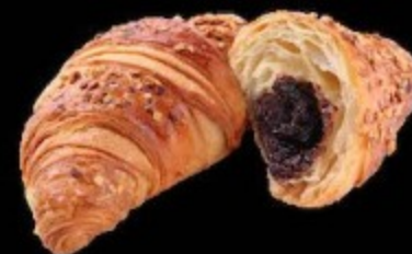
с шоколадом и орехом