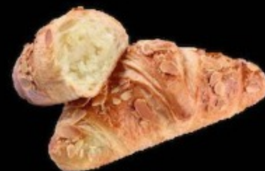
Круассан марципан 90гр