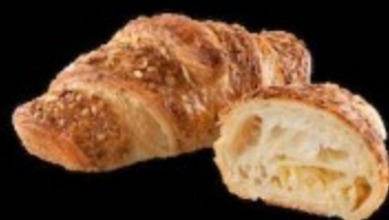
Круассан с сыром 100гр