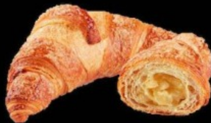
Круассан с яблоком 90гр