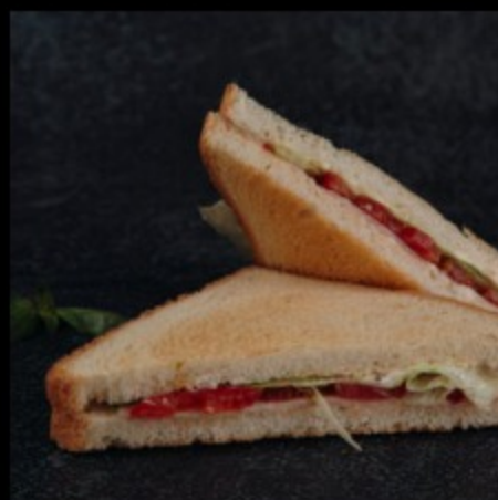
«Сэндвич с ветчиной