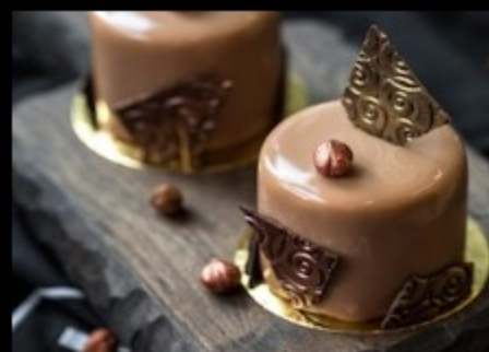
Пралине фундук 120гр Р440