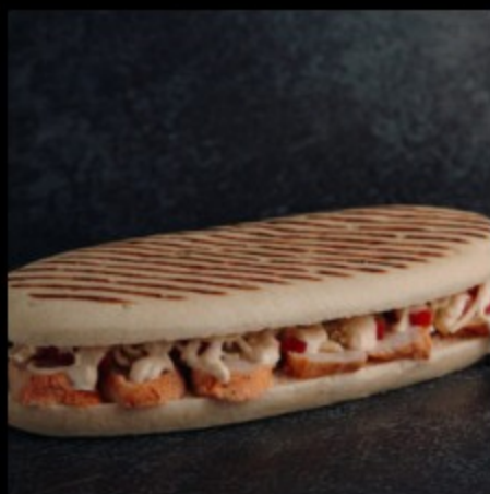
Панини с курицей