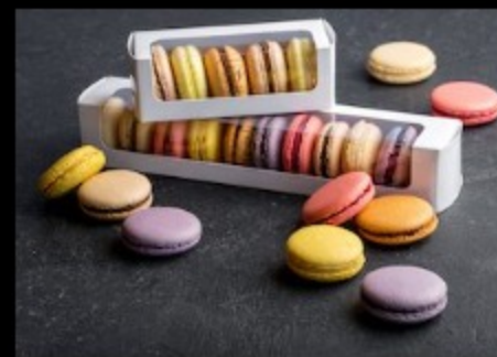
Набор 7 макарон