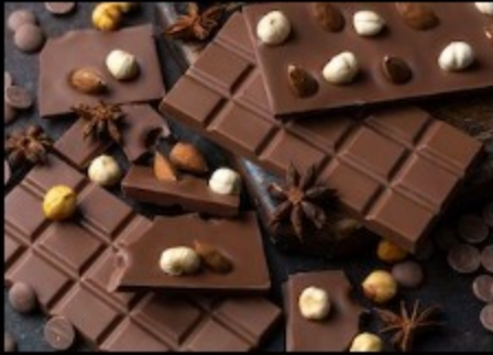
Плитка молочный шоколад и орехи 50гр.