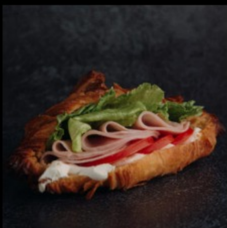
круассан с ветчиной