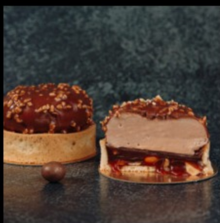
Орехово-Карамельное 130гр Р440