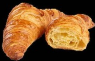
Круассан Эритаж 70гр