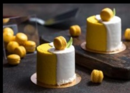
Экзотик 115гр Р440