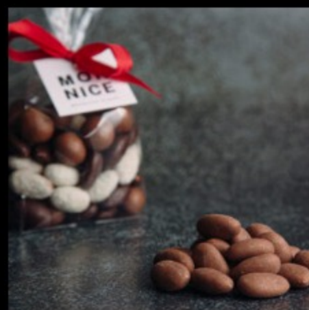
Миндаль-шоколад (мол) 100г.