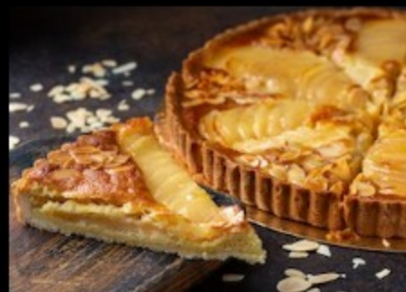
ГРУШЕВЫЙ ТАРТ 960ГР