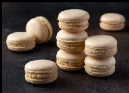
Макарон Кокос — белый шоколад 20гр.