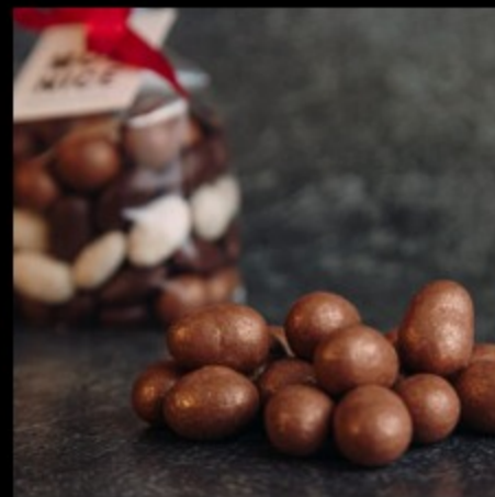
Арахис-шоколад (мол) 100г.