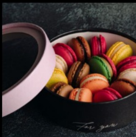
Набор 15 макарон