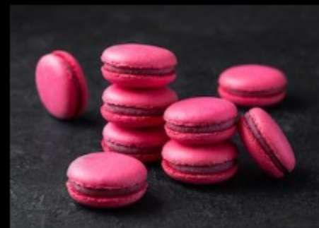
Макарон малина 20гр.