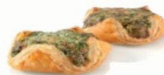
корзиночка со шпинатом и рикоттой 110гр