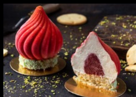
Чизкейк клубника 130гр Р420