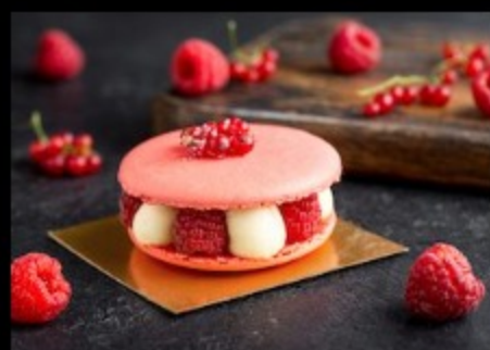
Малина макарон 100гр. Р420