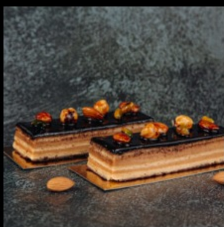
Восточная сказка Р350