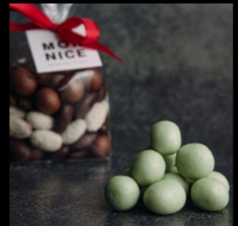
Марципан-шоколад (бел) 100г.