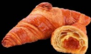
Круассан с абрикосом 90гр