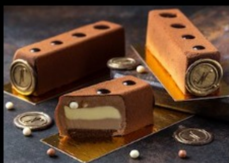
Три шоколада 100гр Р400