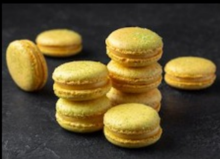
Мак. лайм-маракуйя 20гр.