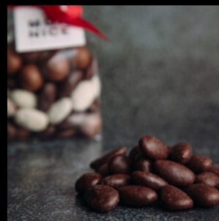
Миндаль-шоколад (темный) 100г.