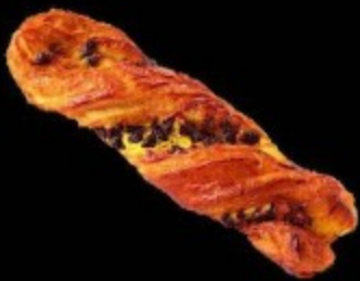
Галстук с шоколадом 100гр