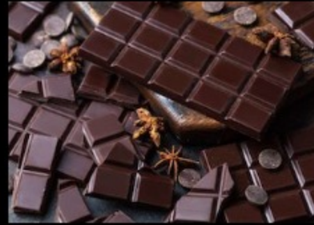
Плитка темный шоколад 50гр.