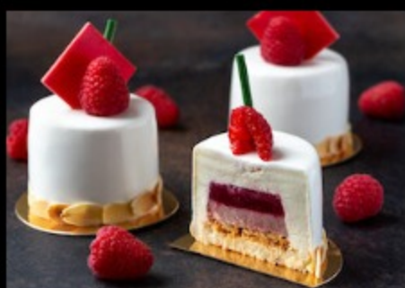
Малиновое сердце 125гр Р440