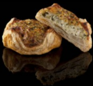
Корзиночка с курицей и луком-пореем 110гр