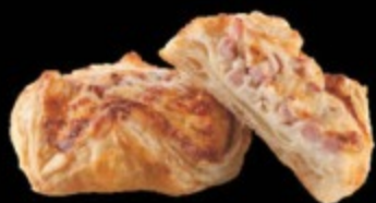
Корзиночка с ветчиной и сыром 110гр