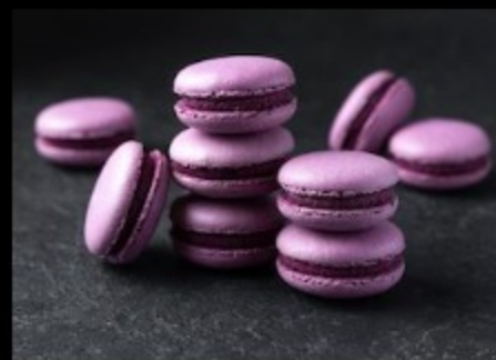
Макарон Черная смородина 20гр.