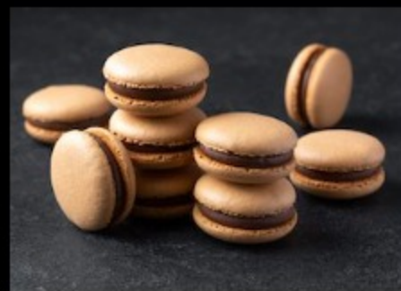
Макарон шоколад 20гр.