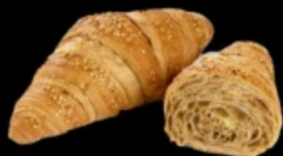
круассан злаковый 80гр