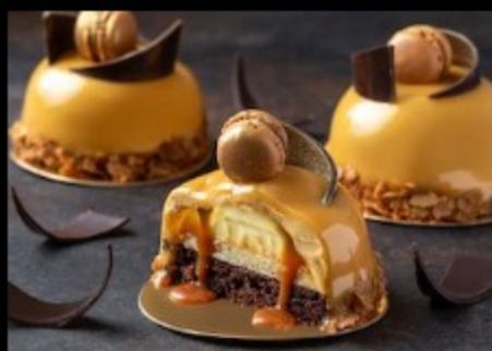
Карамель 110 гр Р420