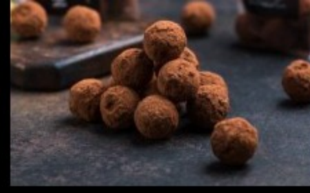
Конфеты трюфель 15гр.