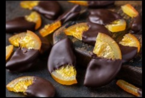
Апельсин в шоколаде 15гр