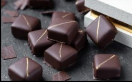
Конфеты ганаш из темного шоколада 10гр