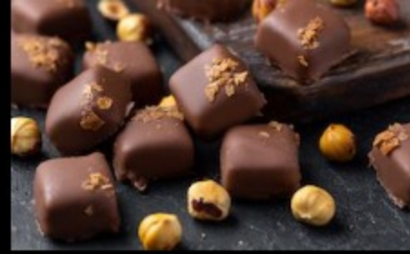
Конфеты ореховое пралине 10гр