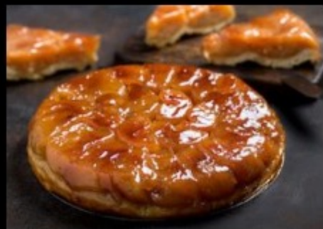
Яблочный Татан 1700гр