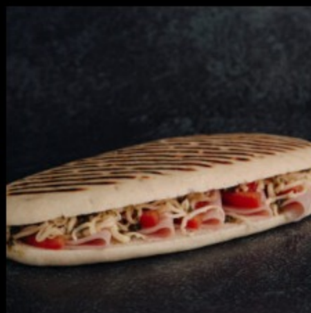
панини с ветчиной