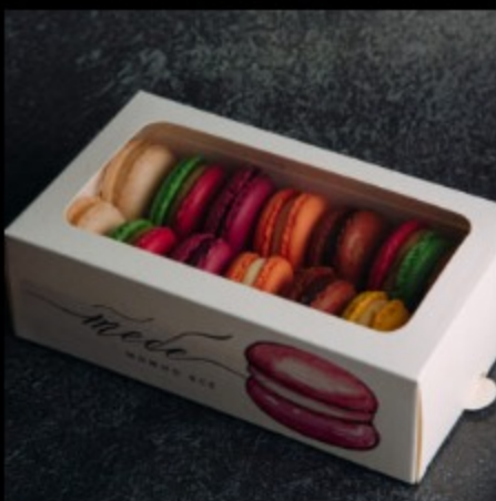
Набор 14 макарон