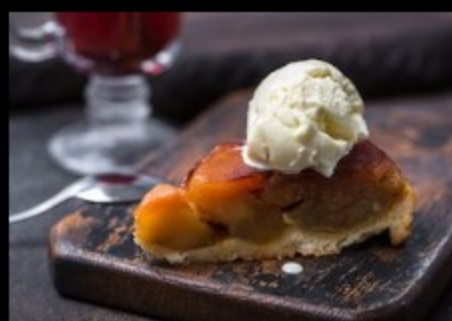
Яблочный Тарт 250гр Р400