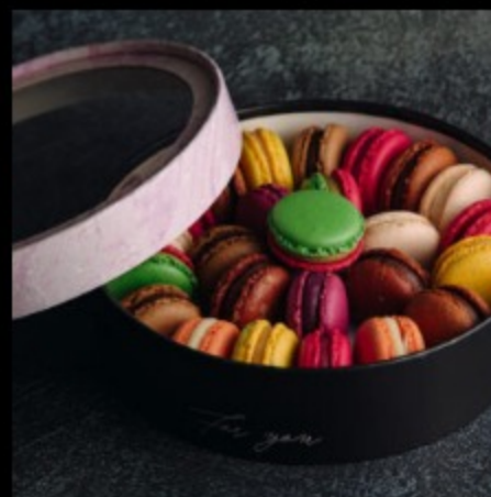
Набор 25 макарон