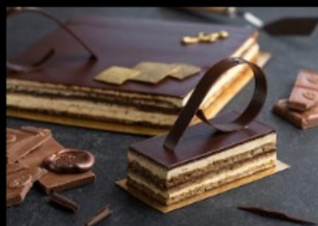
Опера 115гр Р400