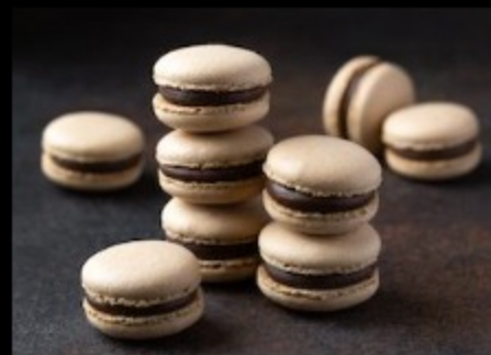
Мак. кофе — шоколад 20гр.