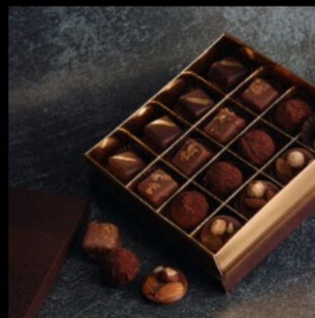
Набор шоколадных конфет 16 штук Бел LUX