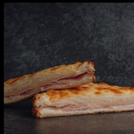
«Сэндвич с ветчиной (Крок-Месье)»