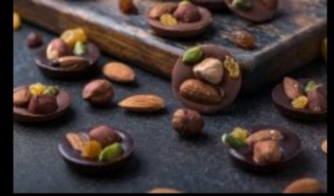
Конфеты Mandiant 10гр.