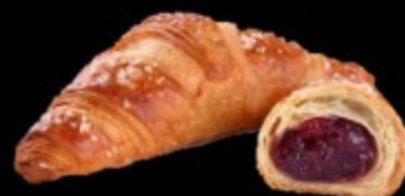
Круассан с малиной 90гр