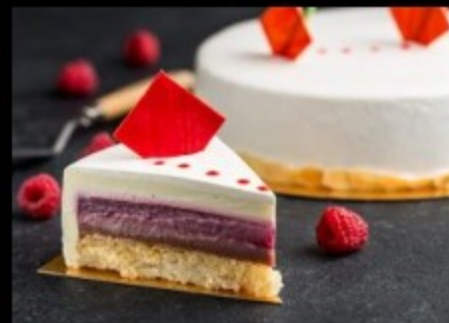
Малиновое сердце 1500гр