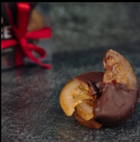
Лимон в шоколаде 15гр.